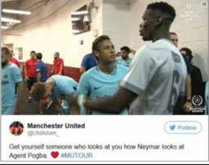
Manchester United @LadAdams_ Follow Get yourself someone who looks at you how Neymar looks at Agent Pogba. #MUTOUR

ပီအက်စ်ဂျီထိပ်တန်းပစ်မှတ် နေမာနဲ့ မန်ယူကွင်းလယ်လူ ပေါ့ဘာ၊ နည်းပြ မော်ရင်ဟိုတို့ မန်ယူ-ဘာစီလိုနာတို့ ပွဲစဉ်မစတင်မီဥပမာအတွင်း နှုတ်ဆက်စကားပြောကြားခဲ့တာ ကြောင့် မန်ယူပရိသတ်တွေကို အတော်လေး စိတ်လှုပ်ရှားသွားခဲ့ရပါတယ်။ အမေရိကန်ပြည်ထောင်စု မေရီလန်ဒ်မှာ ယှဉ်ပြိုင်ခဲ့တဲ့ မန်ယူနဲ့ ဘာစီလိုနာအသင်း တို့ပွဲစဉ်မစတင်မီ နေမာနဲ့ ပေါ့ဘာတို့ဟာ အချိန်အတော်ကြာ စကားလက်ဆုံကြခဲ့ကြတာ ကြောင့် တွစ်တာအသုံးပြုသူတွေက “အေးရင်ပေါ့ဘာ”လို့ အမည်တပ်ခဲ့ကြသလို နေမာရဲ့ ပေါ့ဘာကို ကြည့်တဲ့မျက်လုံးအကြည့်ကိုလည်း အဓိကအဓိပ္ပာယ်ဖော်ရေးသားတဲ့ မှတ်ချက်တွေကိုတွေ့ခဲ့ရတာဖြစ်ပါတယ်။ ပရိသတ်တွေကတော့ ပေါ့ဘာနဲ့ မော်ရင်ဟို တို့ဟာ နေမာကိုမန်ယူနဲ့ ပူးပေါင်းချင်စိတ်ရှိလာအောင် စည်းရုံးနေကြတယ်လို့ လိုရာ တွေးကောက်ချက်ဆွဲနေကြတာ ဖြစ်ပါတယ်။ နေမာက ပေါ့ဘာကိုမော့ကာ ကြည့်နေ တဲ့မျက်လုံးတွေက “စံပြပုဂ္ဂိုလ်” တစ်ဦးကိုကြည့်တဲ့အကြည့်မျိုးလို့ ရေးသားမှုတွေ အများဆုံး မြင်တွေ့ခဲ့ရသလို မော်ရင်ဟိုနဲ့ နေမာတို့ ရင်ချင်းအပ်နှုတ်ဆက်ခဲ့တာကလည်း မန်ယူပရိသတ်တွေကို စိတ်လှုပ်ရှားအောင် ဖမ်းစားနိုင်ခဲ့တာဖြစ်ပါတယ်။ နေမာနဲ့ ပီအက်စ်ဂျီတို့ အပြောင်းအရွှေ့လုပ်ခတ်မှုဟာ ယခုနှစ်နှစ်ကျော်အတွင်း စိတ်ဝင်စားမှု အများဆုံးရရှိတဲ့ ကိစ္စရပ်တစ်ခုဖြစ်ပြီး မန်ယူကလည်း နေမာကို ရရှိဖို့ အကြိမ်ကြိမ်ဆက်သွယ်ကမ်းလှမ်းဖူးတာကြောင့် နေမာများ မန်ယူကိုရောက်လာ ဦးမလားလို့ ယူဆကြတာဖြစ်ပါတယ်။