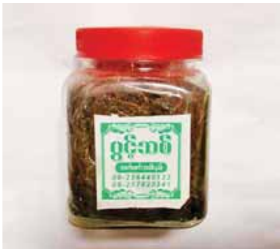
ပွင့်သစ်အမှတ်တံဆိပ် လက်ဖက်အခါးနှပ်