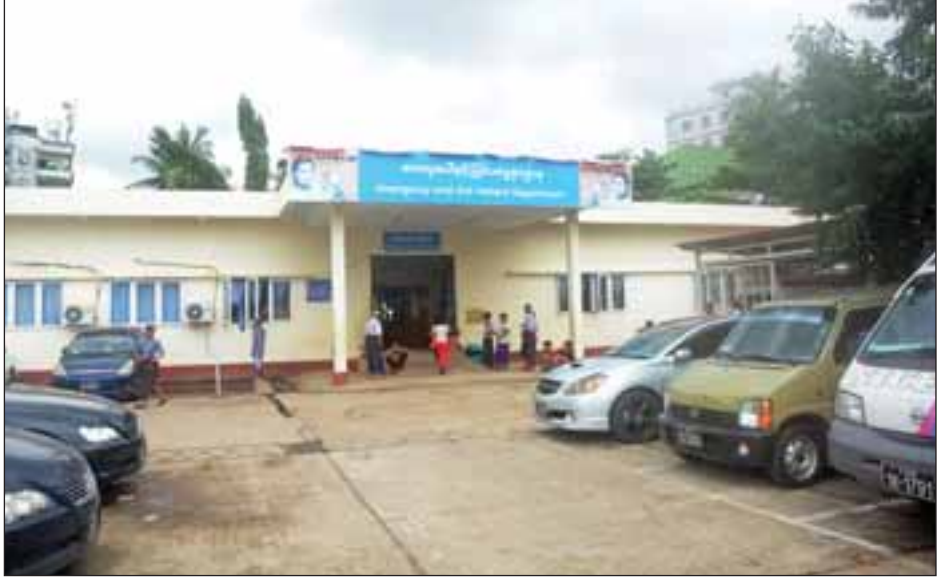
သယ်နန်းကျွန်း စံပြဆေးရုံကြီးရှိ အရေးပေါ်နှင့် ပြင်ပလူနာဌာနကို တွေ့ရစဉ်။