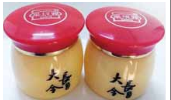
CAINIYA Whitening Day Cream & Night Cream