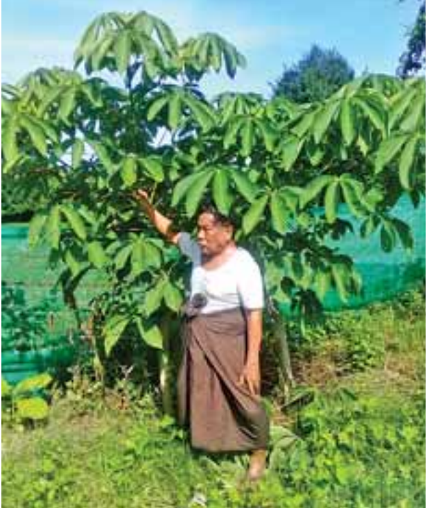
တောင်တွင်းကြီးမြို့နယ် ညောင်ပင်လှကျေးရွာတွင် စာရေးသူစိုက်ပျိုးထားသော တစ်နှစ်ခွဲသားလျော်ဖြူပင် အရွက်သစ်ထွက်လာပုံကို တွေ့ရစဉ်။

ဤလျော်ဖြူပင်မှာ မျိုးတုံးပျောက်ကွယ်လုနီးဖြစ်နေသော အပင်စာရင်းတွင် ပါဝင်နေသဖြင့် မြန်မာပြည်အခြေအနေဖြင့် မျိုးစေ့ရရန်လွယ်ကူသကဲ့သို့ စိုက်ပျိုးပြုစုရန်လည်းလွယ်ကူပြီး၊ တစ်ဖက်တစ်လမ်းက မျိုးတုံးပျောက်ကွယ်လုနီးဖြစ်နေသော ဤလျော်ဖြူပင်ကို တိုးချဲ့စိုက်ပျိုးခြင်းဖြင့် လျော်ဖြူပင်အား ထိန်းသိမ်းနိုင်သောနိုင်ငံအဖြစ် ကမ္ဘာတွင် လက်မထောင်နိုင်မည်ဖြစ်ပါသည်။ ယနေ့အခြေအနေတွင် “ဆေးကုလားမ” ထုတ်ရန် ရည်ရွယ်ချက်ဖြင့် စိုက်ပျိုးနေကြသော လျော်ဖြူပင်အရေအတွက်မှာ တပြည်လုံးအတိုင်းအတာဖြင့် ၅၀၀၀ မျှသာရှိမည်ဟု ခန့်မှန်းရပါသည်။ စာရေးသူအနေနှင့်မူ ယခု ၂၀၁၇