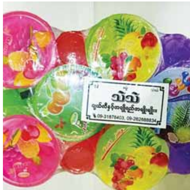
သဲသဲအမှတ်တံဆိပ် ဂျယ်လီ