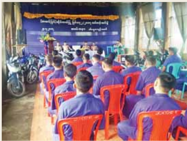
စစ်တွေအကျဉ်းထောင်အတွင်း ပြစ်ဒဏ်ကျခံနေရသူများ ပြစ်ဒဏ်မှကင်းလွတ်ပါက ၎င်းတို့၏ မိသားစုဝင်များနှင့်အတူ သမာအာဇီဝကျကျ လုပ်ကိုင်စားသောက်နိုင်ရန်ရည်ရွယ်၍ သင်တန်းသား ၃၀ သင်ကြား ခဲ့သည့် သက်မွေးဝမ်းကျောင်းအထောက်အကူပြု အဆင့်မြင့်ဆိုင်ကယ်ပြင်သင်တန်း (၂/၂၀၁၇)ဆင်းပွဲတို့ ဇူလိုင် ၂၄ ရက်နံနက်ပိုင်းက ပြုလုပ်စဉ်။ (သုရိန်ထွန်း)