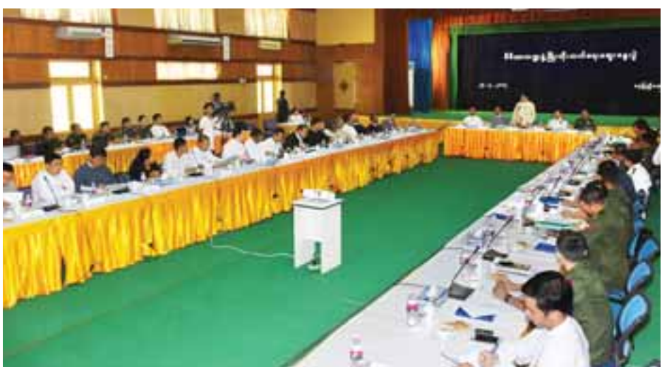
ရုံးပိတ်ကြောင်း။

အတွက် သတင်းမိဒီယာသမားများ ကြုံတွေ့နေရသည့် ပြဿနာများ၊ ဖြစ်စေချင်သည့်ဆန္ဒများ၊ မဖြစ်စေချင်သည့် ဆန္ဒများကို စဉ်းစားဆွေးနွေးရန်၊ လျော့ပေးနိုင်သည့် အတိုင်းအတာ၊ တောင်းဆိုရမည့်အချက်များကို ဆွေးနွေးပြီး အဖြေရှာရန်၊ ယခုဆွေးနွေးမှုမှတစ်ဆင့် ကောင်းကျိုးရလဒ်များ၊ ဆုံးဖြတ်ချက်များ၊ သဘောတူညီချက်များ၊ နားလည်မှုများ ရရှိလိုမည်ဟု မျှော်လင့်ပါကြောင်း စသည်ဖြင့် ပြောကြားသည်။ ကာကွယ်ရေးဝန်ကြီးဌာန ဒုတိယဝန်ကြီး ဗိုလ်ချုပ် မြင့်နွယ်က နိုင်ငံတော်အစိုးရအနေဖြင့် သတင်းမိဒီယာကဏ္ဍကို အလေးထားဆောင်ရွက်လျက်ရှိသည့်နည်းတူ တပ်မတော်အနေဖြင့်လည်း တပ်မတော်ပိုင်မိဒီယာများ မှတစ်ဆင့် တပ်မတော်သတင်းအချက်အလက်များကို ပြည်သူများထံ အချိန်နှင့်တစ်ပြေးညီ ထုတ်လွှင့်ပေးလျက်