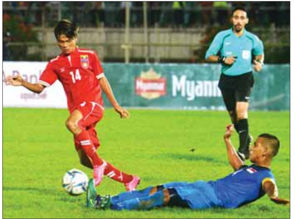
ဆီးဂိမ်းအဖွင့်ပွဲကစားရမည့် မြန်မာနှင့် စင်ကာပူအသင်း အာရှ ယူ-၂၃ ခြေစစ်ပွဲတွင် တွေ့ဆုံခဲ့ပုံ။