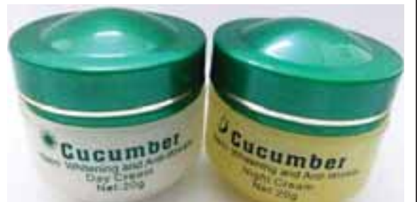
ANGKOR Cucumber Nano Whitening and Anti-Wrinkle Package (Day Cream + Night Cream)