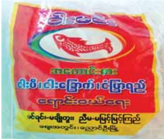
ငါးမင်းအမှတ်တံဆိပ်ငါးပိ