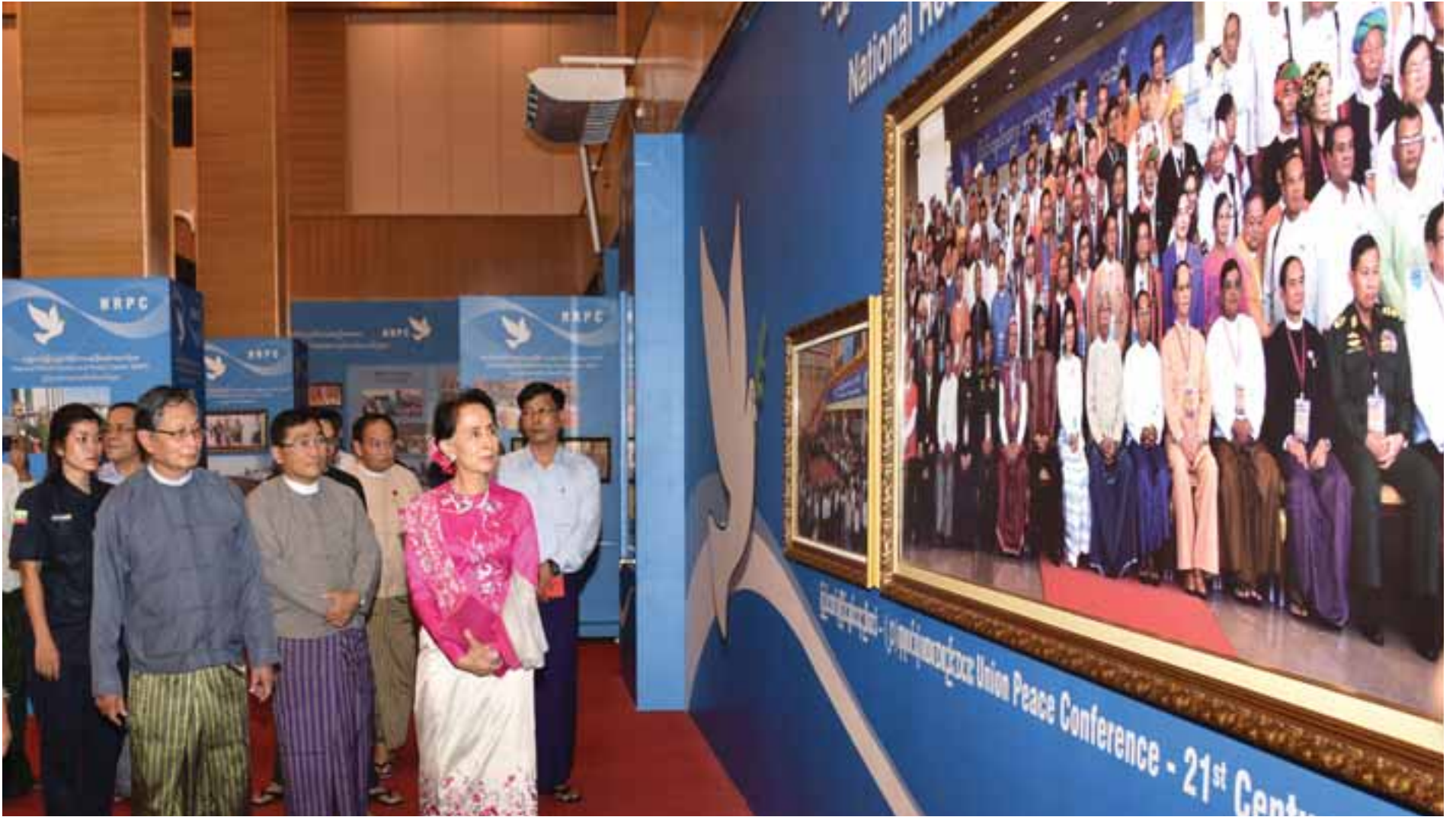
နိုင်ငံတော်အတိုင်ပင်ခံရုံးဝန်ကြီးဌာန နှစ်ပတ်လည်နေ့အထိမ်းအမှတ် ခင်းကျင်းပြသထားသည့် မှတ်တမ်းဓာတ်ပုံများကို နိုင်ငံတော်၏အတိုင်ပင်ခံပုဂ္ဂိုလ် ဒေါ်အောင်ဆန်းစုကြည် ကြည့်ရှုစဉ်။

အဖော်နည်းသော များသောဥစ္စာရှိသော ကုန်သည်ကြီး သည် ဘေးအန္တရာယ်များသော ခရီးကိုရှောင်ကြဉ် သကဲ့သို့လည်းကောင်း၊ အသက်ရှင်လိုသောသူသည် လတ်တလော သေစေတတ်သော အဆိပ်ကိုရှောင်ကြဉ် သကဲ့သို့လည်းကောင်း ပညာရှိသည် မကောင်းမှုကို ရှောင်ကြဉ်ရာ၏။