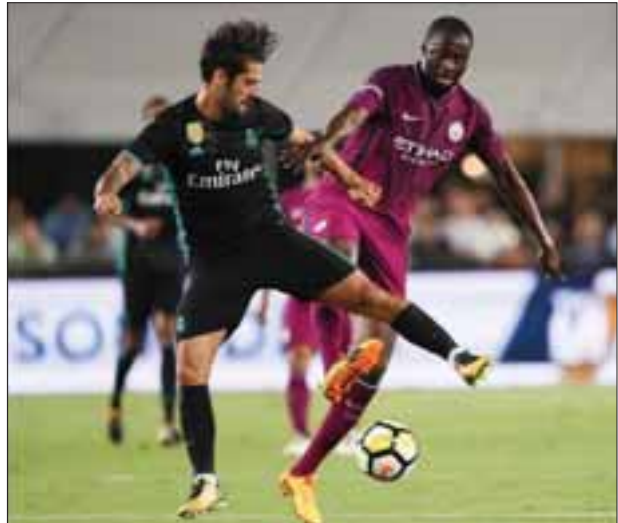
တည်းသော အနိုင်ဂိုးကို တိုက်စစ်မှူး နေမာက ပွဲကစားချိန် ၃၁ မိနစ်မှာ သွင်းယူပေးခဲ့တာဖြစ်ပါတယ်။ မန်ယူအသင်းနိုင်ပွဲဆက်ခဲ့ချိန်မှာ နည်းပြ မော်ရင်ဟိုက ဒါဟာလေ့ကျင့်

မျိုးကိုတော့ ယှဉ်ကစားနိုင်ဖို့ အဆင့် တစ်ရပ် လိုအပ်နေဆဲဖြစ်တာကို တွေ့ ကြရမှာဖြစ်ပါတယ်။ ပီအက်စ်ဂျီနဲ့ ဂျူဗင်တပ်အသင်း တို့ရဲ့ ပွဲစဉ်ကတော့ နှစ်ဖက်အပြန် အလှန်သွင်းဂိုးတွေကြောင့် ပရိသတ် တွေအတွက် ကြည့်ရှုလို့ကောင်းတဲ့ ပွဲတစ်ပွဲဖြစ်ခဲ့ကာ ဂျူဗင်တပ်အတွက် သွင်းဂိုးတွေကို ဟီဂူအင်နဲ့ မာချီစီယို တို့က သွင်းယူပေးခဲ့ပြီး ပီအက်စ်ဂျီ အတွက်တော့ ဂုဒင်ဇ်နဲ့ ပက်ထရော တို့က သွင်းယူပေးခဲ့တာဖြစ်ပါတယ်။ မန်စီးတီးနဲ့ ဂိုးယဲလ်မက်ဒရစ်တို့ရဲ့ ပွဲမှာတော့ မန်စီးတီးက အော့တာ မန်ဒီ၊ စတာလင်း၊ ဂျွန်စတုန်း၊ ဗိုင်ယာဇ် တို့ရဲ့ သွင်းဂိုးတွေနဲ့ ဂိုးယဲလ်ကို လေးဂိုး-တစ်ဂိုးနဲ့ အနိုင်ယူနိုင်ခဲ့တာ ဖြစ်ပါတယ်။ ဂိုးယဲလ်အတွက် တစ်လုံး တည်းသော ချေပဂိုးကိုတော့ ပွဲချိန် မိနစ် ၉၀ မှာ အော်စကာရီဒီဂျွန်ဇ်က သွင်းယူပေးခဲ့တာဖြစ်ပါတယ်။