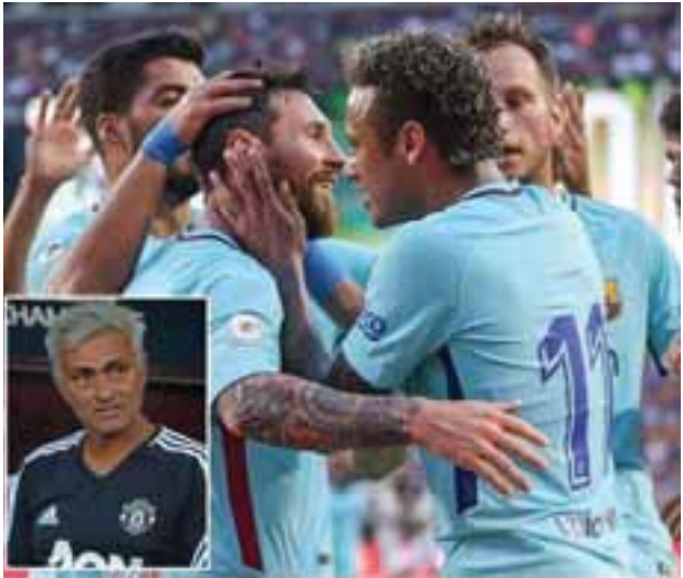
ဘူးဆိုတဲ့ အချက်ကိုလည်း မီးမောင်း ထိုးပြနိုင်ခဲ့ပါတယ်။ မန်ယူက နိုင်ငံ တကာ ချန်ပီယံရှစ် ပွဲစဉ်တွေမတိုင်မီ အယ်လ်အေဂလက်စီ၊ ဂိုးယဲလ်ဆော့ လိတ်ဒ်အသင်းတွေနဲ့ ခြေစမ်းခဲ့ရာမှာ

နိုင်ငံတကာ ချန်ပီယံရှစ်ဖလားအဖြစ် ယှဉ်ပြိုင်တဲ့ ရာသီကြိုချစ်ကြည်ရေး ခြေစမ်းပွဲတွေဟာ အသင်းကြီးတွေ အချင်းချင်း ထိပ်တိုက်တွေ့ဆုံ ယှဉ်ပြိုင် နေတာကြောင့် ပရိသတ်စိတ်ဝင်စားမှု လည်း အတော်မြင့်မားတဲ့ ရာသီကြို ခြေစမ်းပွဲတွေဖြစ်ပါတယ်။ ဘာစီလိုနာနဲ့ မန်ယူ၊ ပီအက်စ်ဂျီနဲ့ ဂျူဗင်တပ်၊ မန်စီးတီးနဲ့ ဂိုးယဲလ်မက်ဒရစ် အသင်းတို့ ထိပ်တိုက်တွေ့ဆုံနေတဲ့ပွဲ မှာ ဘာစီလိုနာက မန်ယူကို နေမာရဲ့ တစ်လုံးတည်းသော သွင်းဂိုး၊ ဂျူဗင်တပ်က မာချီစီယိုရဲ့ ပင်နယ်တီသွင်းဂိုး အပါအဝင် သုံးဂိုး-နှစ်ဂိုး၊ မန်စီးတီးက လေးဂိုး-တစ်ဂိုးနဲ့ အနိုင်ရသွားပါတယ်။ မန်ယူအသင်းအတွက်တော့ ရာသီကြိုခြေစမ်းပွဲ ငါးပွဲကစားပြီးချိန်မှာ ပထမဦးဆုံးအကြိမ် ရှုံးပွဲကြုံခဲ့ရတာ လည်းဖြစ်ပြီး မန်ယူရဲ့ လူစာရင်းဟာ အသင်းကြီးတွေကို အနိုင်ယူနိုင် လောက်အောင် မတောင့်တင်းသေး