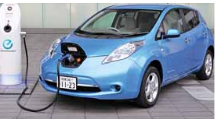
၎င်း၏ မော်တော်ယာဉ်အားလုံးကို လျှပ်စစ်ကားများအဖြစ်ပြောင်းလဲထုတ်လုပ်ရန် စီစဉ်လျက်ရှိကြောင်း ဆိုသည်။ ဗြိတိန်နှင့် ပြင်သစ်နိုင်ငံတို့ကလည်း ၂၀၄၀ ခုနှစ်တွင် လောင်စာဆီအသုံးပြု မော်တော်ယာဉ်များ ထုတ်လုပ်ရောင်းချမှုကို အဆုံးသတ်မည်ဆိုသည့် ဆုံးဖြတ်ချက်ချမှတ်ခဲ့ကြောင်း သိရသည်။ အင်န်အိတ်ချ်ကေ။

ထုတ်လုပ်ခြင်းမရှိတော့ဘဲ လျှပ်စစ်ကားများ ထုတ်လုပ်ရေးကို အာရုံစိုက်လျက်ရှိကြသည်။ ဆွီဒင်နိုင်ငံ၏ Volvo ကုမ္ပဏီက ၎င်းအနေဖြင့် ၂၀၃၀ ခုနှစ်မှစပြီး လျှပ်စစ်ကားသီးသန့် (သို့မဟုတ်) လောင်စာဆီနှင့်လျှပ်စစ်နှစ်မျိုးစပ်ထားသည့် မော်တော်ကားများကိုသာ ထုတ်လုပ်မည်ဖြစ်ကြောင်း တရားဝင်ပြောကြားခဲ့သည်။ ဂျာမနီနိုင်ငံ၏ BMW ကားကုမ္ပဏီက