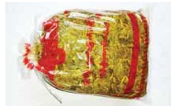
ဒေါ်မြတ်တင်အမှတ်တံဆိပ် လက်ဖက်အညွန့်