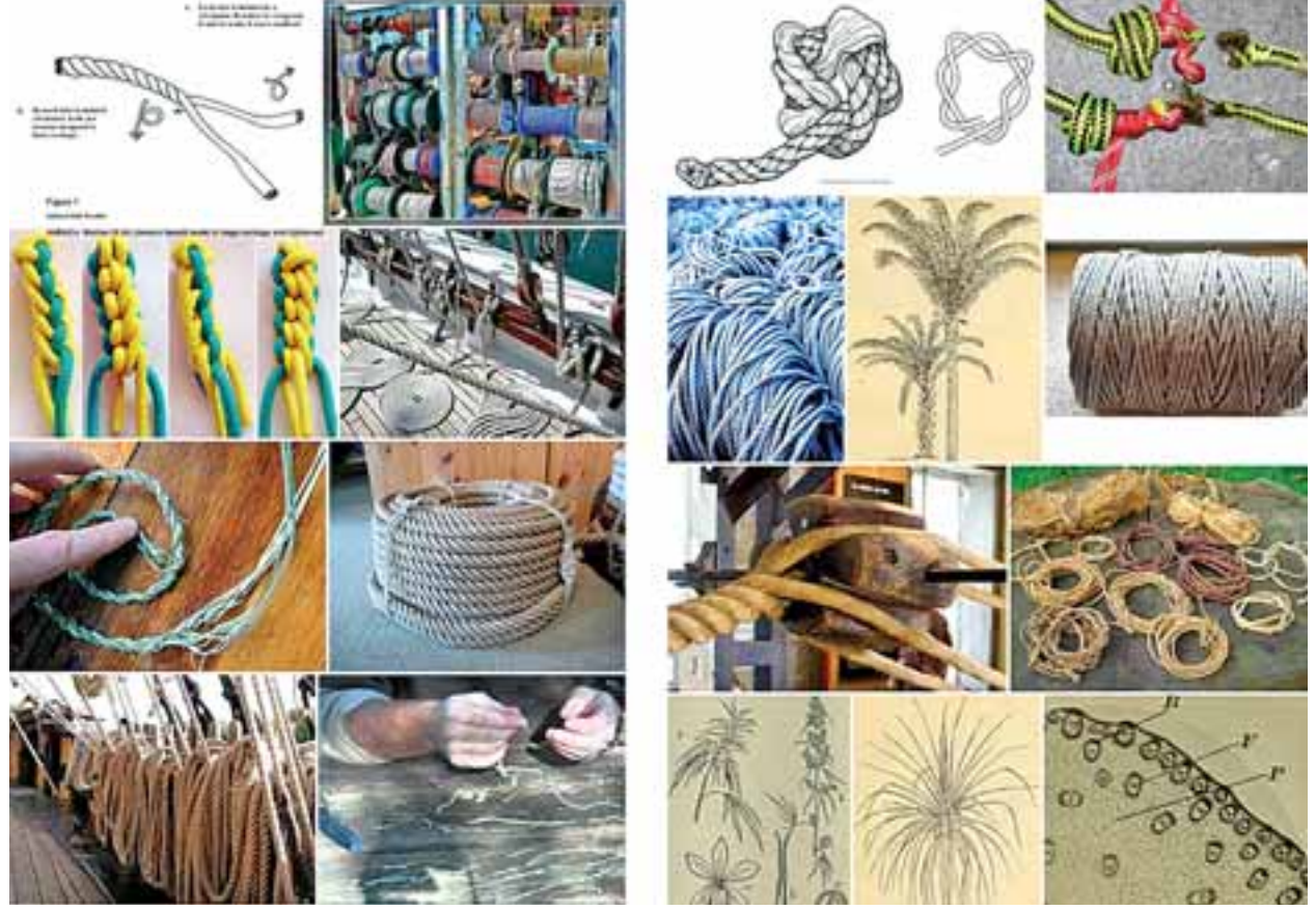
လျော်ဖြူပင်မှရသောလျော်ဖြင့် Cordage (ခေါ်) ကြိုးအမျိုးမျိုးပြုလုပ်ထားပုံ။