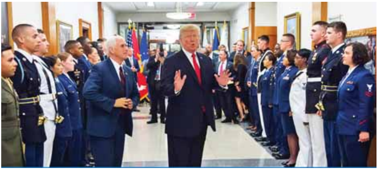
လိင်အင်္ဂါပြောင်းလဲထားသူများအား စစ်မှုထမ်းခွင့်ပေးခြင်းဖြင့် တပ်မတော်၏စစ်ရေးအရ အသင့်အနေအထားရှိမှုအပေါ် ထိခိုက်မှု အလွန်အလွန်နည်းပါးကြောင်း အဆိုပါလေ့လာချက်တွင် အကြံပြုတိုက်တွန်းထားသည်။ လိင်အင်္ဂါပြောင်းလဲထားသူများ စစ်မှုထမ်းခြင်းသည် နိုင်ငံတော်ကာကွယ်ရေးအကျိုးစီးပွားအပေါ် ထိခိုက်မှုမရှိနိုင်ဟူသော အခြေခံမူအရ လိင်အင်္ဂါပြောင်းလဲထားသူများကို တပ်မတော်က လက်ခံသင့်ကြောင်း ဝီပတ်ဘလီကန်အမတ်များက ပြောကြားကြသည်။ ဆင်ယူ။

ပင်တဂွန်စစ်ဌာနချုပ်၏ အစီအစဉ်အရ လေ့လာချက်တစ်ရပ်ပြုလုပ်ခဲ့ရာတွင် အမေရိကန်တပ်မတော်အတွင်း စစ်မှုထမ်းဦးရေ ၁၃၂၀ မှ ၆၆၃၀ အထိသည် လိင်အင်္ဂါပြောင်းလဲထားသူများဖြစ်သည်ဟု သိရသည်။