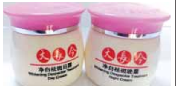
JIAOLI 12 Day's Whitening Despeckle Treatment Set (Day Cream + Night Cream)