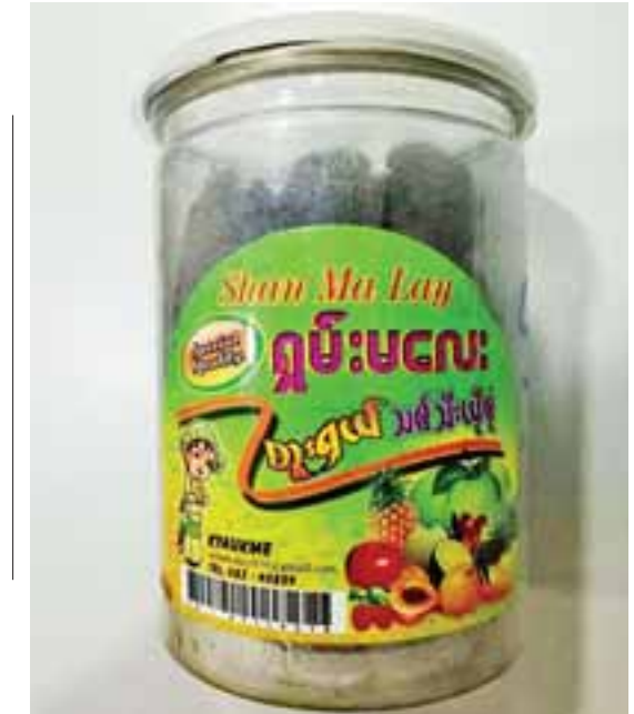
ရှမ်းမလေးအမှတ်တံဆိပ် ထိုင်ဝမ်ဆီးယို