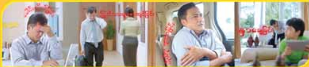
ခေါင်းကိုက်ခြင်း ကြောက်သွားဖျားဖျားနာခြင်း ကိုယ်ပူဖျားနာခြင်း နှာစေးခြင်း