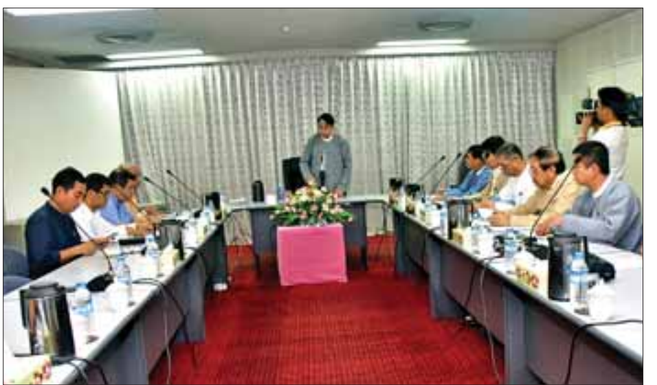
ကရေစီအငြိမ်ပြိုင်ပွဲကျင်းပနိုင်ရေးနှင့် မြန်မာ့ဒီမိုကရေစီ ပေါင်းစပ်ညှိနှိုင်းဆွေးနွေးကာ အစည်းအဝေးကို ရုပ်သိမ်းခဲ့ ရုပ်ရှင်ပွဲတော် စည်ကားသိုက်မြိုက်စွာ ကျင်းပနိုင်ရေး သည် အတွက် ဆွေးနွေးတင်ပြကြရာ ပြည်ထောင်စုဝန်ကြီးက (သတင်းစဉ်)

ယင်းနောက် တက်ရောက်လာသူများက မြန်မာ့ဒီမို