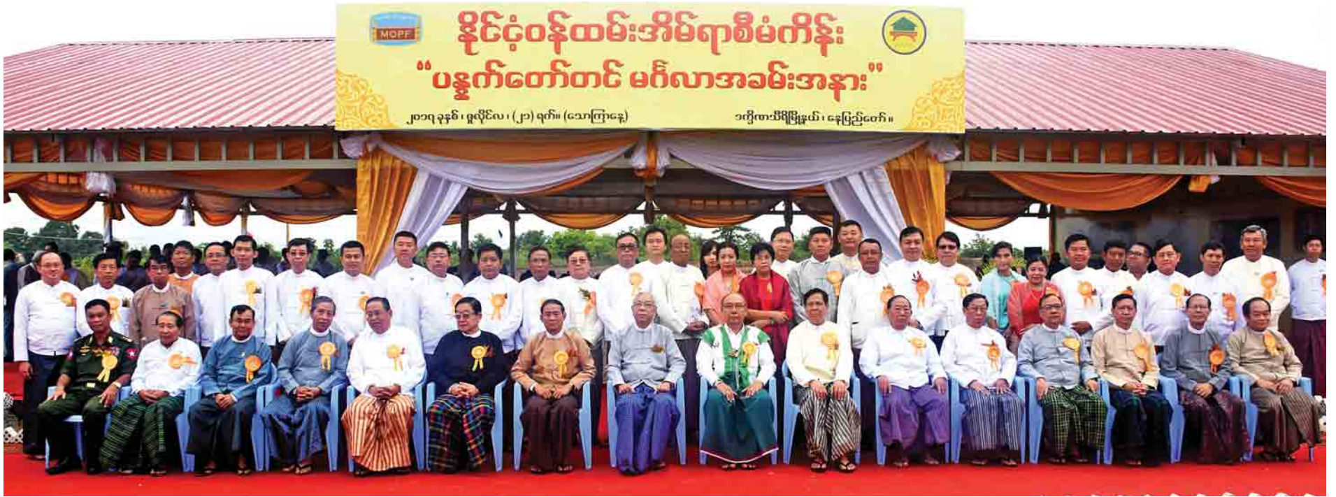
နိုင်ငံ့ဝန်ထမ်းအိမ်ရာ ပန္နက်တော်တင် မင်္ဂလာအခမ်းအနားတွင် နိုင်ငံတော်သမ္မတဦးထင်ကျော်နှင့် တက်ရောက်လာသည့် ဧည့်သည်တော်များ မှတ်တမ်းတင်ဓာတ်ပုံရိုက်ကြစဉ်။