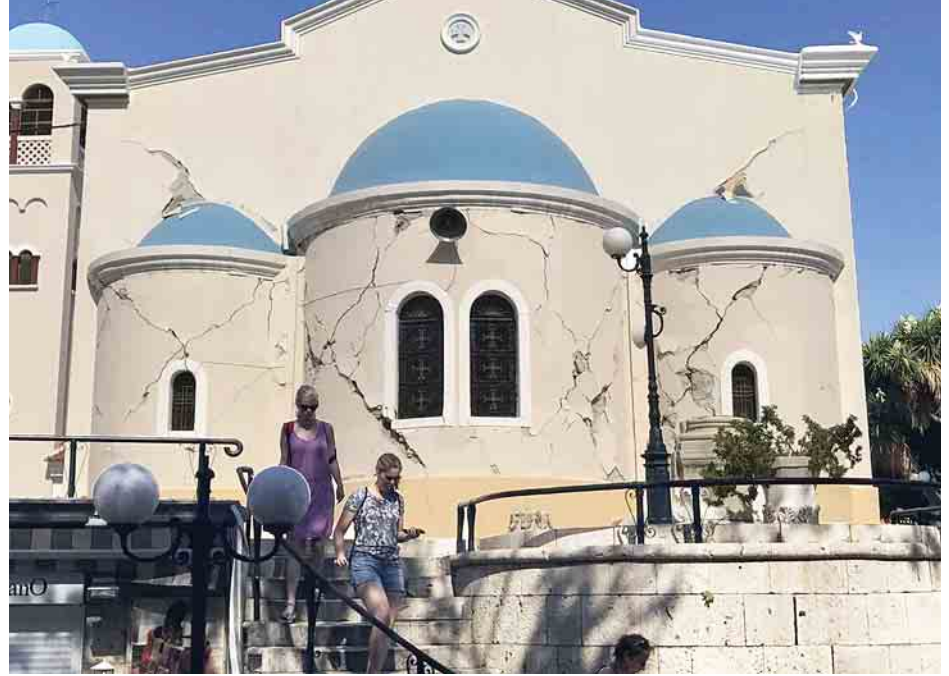
အင်န်အိတ်ချ်ကေ။

တောက်နိုင်ဖွယ်ရှိသည်ဟု ဘိုဒ်ရမ်မြို့တော်ဝန်က မီဒီယာသို့ ပြောခဲ့သည်။