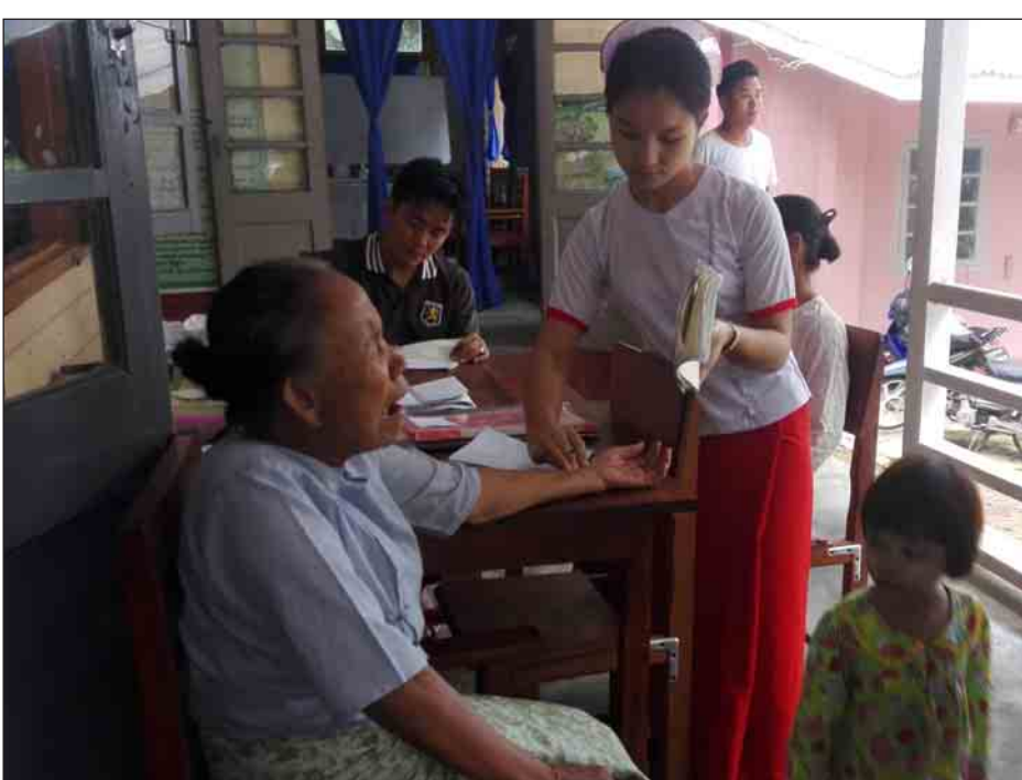
အာဟာရဒါန ကျွေးမွေးခဲ့တဲ့ ဆရာဝန် တွေ၊ ဆရာမတွေကို ကျေးဇူးတင်ပါ တယ်။ မြို့နယ်တွင်းမှာရှိတဲ့ အသက် အရွယ်ရနေတဲ့ အဘိုး အဘွားတွေကို

မယ်စု ဇူလိုင် ၂၁ - ကယားပြည်နယ် မယ်စုမြို့ရှိ သက်ကြီး ဘိုးဘွားများအား အခမဲ့ကုသိုလ်ဖြစ် အာဟာရဒါနပြုခြင်းနှင့် ကျန်းမာရေး စောင့်ရှောက်မှုလုပ်ငန်းများကို အပတ် စဉ် ဆောင်ရွက်လျက်ရှိရာ ဇူလိုင် ၂၁ ရက် နံနက် ၉ နာရီတွင် မြို့နယ်ပြည်သူ့ ဆေးရုံ၌ ဆောင်ရွက်ပေးခဲ့ကြောင်း သိရသည်။