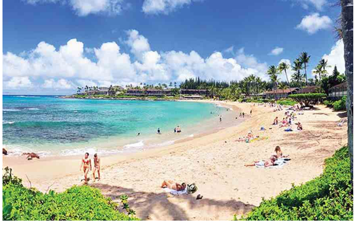
အင်န်အိတ်ချ်ကေ။

အမေရိကန်ပြည်ထောင်စု ဂျွန်ဟော့ကင်းတက္ကသိုလ်မှ သုတေသီများက မြောက်ကိုရီးယားနိုင်ငံ၏ စမ်းသပ်ပစ်လွှတ်အောင်မြင်ခဲ့သည့် တာဝေးပစ်ခွဲကျည်သည် အမေရိကန်ပြည်ထောင်စုရှိ အလာစကာနှင့် ဟာဝိုင်အီပြည်နယ်များသို့ ရောက်ရှိနိုင်သည်ဟု ပြောကြားခဲ့သည်။ ပြုယမ်းအနေဖြင့် နျူကလီးယားထိပ်ဖူးတပ်တာဝေးပစ်ခွဲကျည်ကို အမေရိကန်နိုင်ငံအနောက်ဘက် ကမ်းရိုးတန်းဆီသို့ အောင်မြင်စွာ စမ်းသပ်ပစ်လွှတ်နိုင်ရန် နှစ်နှစ်တိုင်တိုင် အချိန်ယူခဲ့ရသည်ဟု အဆိုပါ သုတေသီများက ဆိုသည်။ အရေးပေါ်အခြေအနေနှင့် ကြုံတွေ့ပါက ပြည်သူများအနေဖြင့် နီးစပ်ရာအဆောက်အအုံများထဲသို့ ဝင်ရောက်ပုန်းအောင်းကြရန် ပြည်သူများအား လမ်းညွှန်ပြသမှုများ ပါဝင်သော လမ်းညွှန်စာအုပ်များကို ဖြန့်ဝေပေးရန် စီစဉ်ထားကြောင်း ယင်းအေဂျင်စီက ပြောကြားခဲ့သည်။