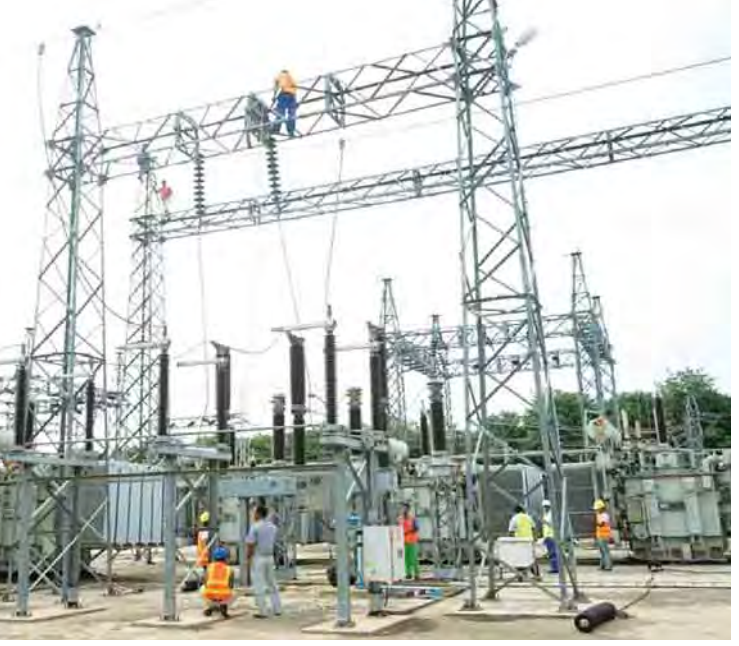
ဝင်းဦး(ဓမ္မဗျာတိုင်း)

စက်ရုံအလုပ်ရုံများနှင့် လျှပ်စစ်မီးသုံးစွဲသူ ပြည်သူများ လျှပ်စစ်ဓာတ်အားအပြည့်အဝသုံးစွဲနိုင်ရေးအတွက် မုံရွာမြို့ အောင်ချမ်းသာပင်မဓာတ်အားခွဲရုံနှင့် ဆားလင်းကြီးမြို့နယ် ညောင်ပင်ကြီးပင်မဓာတ်အားခွဲရုံတို့တွင် အဆင့်မြှင့်တင်ခြင်းလုပ်ငန်းများကို လုပ်ဆောင်ပေးခဲ့ကြောင်း တိုင်းဒေသကြီးလျှပ်စစ်အင်ဂျင်နီယာရုံးမှ သိရသည်။ “လျှပ်စစ်ဓာတ်အားကို အသုံးပြုတဲ့ စက်ရုံ၊ အလုပ်ရုံတွေက များလာတယ်။ နောက်ပြီးသုံးစွဲမှုကလည်း များလာတဲ့အတွက် ပြည့်စုံစွာပေးနိုင်ရန်လိုအပ်တဲ့ ထရန်စဖော်မာတွေကို တိုးချဲ့တပ်ဆင်ပေးတယ်။ ဓာတ်အားလိုင်း အကာအကွယ်စနစ်တွေ တပ်ဆင်ပေးတာပါ။” ဟု တိုင်းဒေသကြီးလျှပ်စစ်အင်ဂျင်နီယာရုံးမှ တာဝန်ရှိသူတစ်ဦးကပြောသည်။ အဆင့်မြှင့်တင်ခြင်းလုပ်ငန်းများအဖြစ် မုံရွာမြို့အောင်ချမ်းသာဓာတ်အားခွဲရုံသို့ ဝန်အားနိုင်နင်းစွာ ပို့လွှတ်နိုင်ရန် အောင်ချမ်းသာဓာတ်အားခွဲရုံတွင် မုံရွာခရိုင်အတွင်းသို့ လျှပ်စစ်ဓာတ်အား ဖြန့်ဖြူးနိုင်ရေးအတွက် ယခုလက်ရှိတပ်ဆင် ထားသော ၁၃၂/၃၃/၁၁ ကေပီ ၄၅ အမ်ပီအေ ထရန်စဖော်မာအား ၁၀၀ အမ်ပီအေ ထရန်စဖော်မာဖြင့် ပြောင်းလဲတပ်ဆင်ခြင်းဆိုင်ရာ အကြံပြုလုပ်ငန်းများကို လုပ်ဆောင်ခဲ့သည်။ ထို့အပြင် မုံရွာမြို့ ကွေ့ကြီး၊ အောင်ချမ်းသာနှင့်မြို့သစ်ရပ်ကွက်များနှင့်ကျေးရွာများသို့ ဓာတ်အားဖြန့်ဖြူးပေးလျက်ရှိသော ၆၆/၁၁ ကေပီ ၁၀ အမ်ပီအေ ထရန်စဖော်မာအား ၂၀ အမ်ပီအေ ထရန်စဖော်မာဖြင့် အစားထိုးလဲလှယ်ခြင်း၊ အောင်ချမ်းသာပင်မဓာတ်အားခွဲရုံမှ ဖြန့်ဖြူးသည့် ဓာတ်အားလိုင်းများအား အကာအကွယ်စနစ် (Protection System) များကောင်းမွန်ရေးတို့ကို လျှပ်စစ်ဓာတ်အား ပို့လွှတ်ရေးနှင့်ကွပ်ကဲမှုဦးစီးဌာနနှင့် တိုင်းဒေသကြီး လျှပ်စစ်အင်ဂျင်နီယာရုံးဝန်ထမ်းများမှ ဇူလိုင်လ ဒုတိယပတ်အတွင်းကလုပ်ဆောင်ပေးခဲ့ကြောင်း သိရသည်။