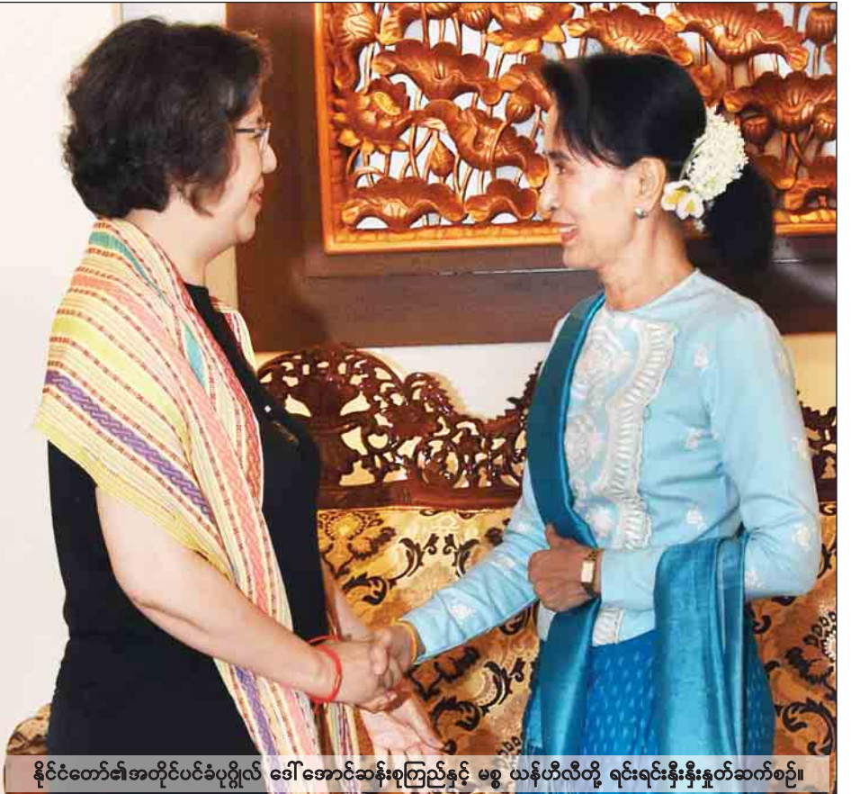
နိုင်ငံတော်၏အတိုင်ပင်ခံပုဂ္ဂိုလ် ဒေါ်အောင်ဆန်းစုကြည်နှင့် မစ္စ ယန်ဟီလီတို့ ရင်းရင်းနှီးနှီးနှုတ်ဆက်စဉ်။

နေပြည်တော် ဇူလိုင် ၂၁ နိုင်ငံတော်၏အတိုင်ပင်ခံပုဂ္ဂိုလ်၊ နိုင်ငံခြားရေးဝန်ကြီးဌာန ပြည်ထောင်စု ဝန်ကြီး ဒေါ်အောင်ဆန်းစုကြည် သည် ကုလသမဂ္ဂ၏ မြန်မာနိုင်ငံ လူ့အခွင့်အရေးအခြေအနေဆိုင်ရာ အထူးအစီရင်ခံစာတင်သွင်းသူ မစ္စ ယန်ဟီလီအား ယနေ့ နံနက် ၁၁ နာရီခွဲတွင် နေပြည်တော်ရှိ နိုင်ငံခြားရေးဝန်ကြီးဌာန၌ လက်ခံ တွေ့ဆုံသည်။ ထိုသို့တွေ့ဆုံစဉ် မြန်မာနိုင်ငံရှိ လူ့အခွင့်အရေး အခြေအနေများအား ကာကွယ်တိုးမြှင့်ရေးကိစ္စများ၊ ရခိုင် ပြည်နယ်ပွံ့ဖြိုးတိုးတက်ရေးအတွက် ဆောင်ရွက်နေသည့် အခြေအနေ၊ ငြိမ်းချမ်းရေးလုပ်ငန်းစဉ် တိုးတက်မှု အခြေအနေများနှင့် စပ်လျဉ်း၍ ဆွေးနွေးခဲ့ကြသည်။ တွေ့ဆုံပွဲသို့ နိုင်ငံတော်အတိုင်ပင်ခံ ရုံးဝန်ကြီးဌာန ပြည်ထောင်စုဝန်ကြီး ဦးကျော်တင်ဆွေနှင့် နိုင်ငံခြားရေး ဝန်ကြီးဌာန ဒုတိယဝန်ကြီး ဦးကျော်တင် တို့လည်း တက်ရောက်ခဲ့ကြသည်။ (သတင်းစဉ်)