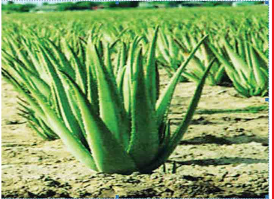
အပူပေးချက်ထားပါ။ နားထဲကို ဖြန့်ဝယ်နဲ့ ခပ်နွေးနွေး လောင်းထည့် ဘေးစောင်းပြန်သွန်ထုတ်။ တစ်နေ့ သုံး ကြိမ်ပြုလုပ်ပါ။ (တစ်နည်း) ပျားရည်ကို မီးနဲ့ နွေး နား ကျပ်ပေးပါ။

ဆရာရှင် နှုတ်ခမ်းထောင့်မှာ ရေလှန်ပေါက်တာ ပျောက် သွားပြီး အမာရွတ်ထင်ကျန်နေခဲ့တယ်။ ပျောက်အောင် ဘာဆေးလိမ်းရပါမလဲ။