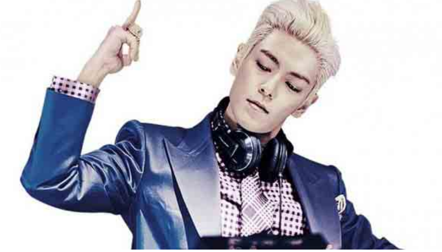
ဟာ ထိရောက်မှုမရှိကြောင်းလည်း စွပ်စွဲပြောကြား အပြစ်တွေကို ဆင်ခြင်မိကြောင်း ပြောကြားခဲ့တဲ့စကား ခဲ့ပါတယ်။ အခြားသော သူတွေကလည်း T. O. P ရဲ့ အပေါ် လှောင်ပြောင်ခဲ့ကြပါတယ်။