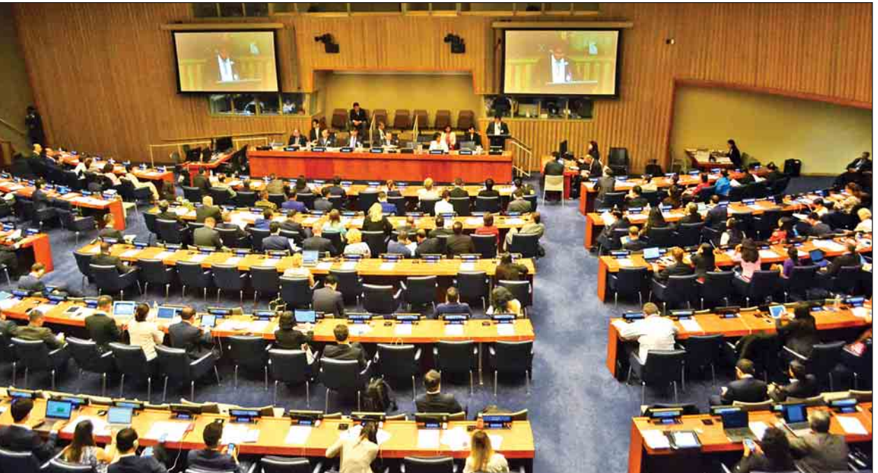
ကုလသမဂ္ဂဌာနချုပ်၌ကျင်းပသည့် ရေသယံဇာတနှင့် ဘေးအန္တရာယ်များဆိုင်ရာ တတိယအကြိမ် ကုလသမဂ္ဂအထူးအစည်းအဝေးတွင် ဒုတိယသမ္မတ ဦးဟင်နရီဗန်ထီးယူ မိန့်ခွန်းပြောကြားစဉ်။

မြန်မာနိုင်ငံသည် ပြည်သူ၊ ကမ္ဘာ၊ သာယာဝပြောမှု၊ ငြိမ်းချမ်းမှုနှင့် မိတ်ဖက်ဆောင်ရွက်မှုတို့အပေါ် အလေးပေးဆောင်ရွက်သွားမည်ဟု အသိပေးပြောကြား