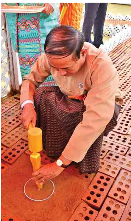
ပြည်သူ့လွှတ်တော်ဥက္ကဋ္ဌ ဦးဝင်းမြင့် ပန္နက်တော်တင်စဉ်။

နိုင်ငံ့ဝန်ထမ်းအိမ်ရာများကို နေပြည်တော်ကောင်စီ ဒက္ခိဏသီရိမြို့နယ် အမြန်လမ်းမကြီးရတပ်ဖွဲ့မှူးရုံးအနီး နေပြည်တော်မြို့ပတ်လမ်းဘေးရှိ ဧရိယာ ၂၁ ဒဿမ ၈၄ ဧက ကျယ်ဝန်းသည့် မြေနေရာတွင် တစ်ခန်းလျှင် စတုရန်းပေ ၁၀၀၀ အကျယ်အဝန်းရှိသည့် လေးခန်းတွဲ ငါးထပ်အိမ်ရာ ၁၀ လုံး၊ တစ်ခန်းလျှင် စတုရန်းပေ ၈၉၇ အကျယ်အဝန်းရှိသည့် လေးခန်းတွဲ ငါးထပ်အိမ်ရာ ၁၀ လုံး၊ တစ်ခန်းလျှင် စတုရန်းပေ ၇၅၆ အကျယ်အဝန်းရှိသည့် ၁၂ ခန်းတွဲ ငါးထပ် အိမ်ရာရှစ်လုံး၊ တစ်ခန်းလျှင် စတုရန်း ပေ ၅၀၂ အကျယ်အဝန်းရှိသည့် ၁၂ ခန်းတွဲငါးထပ် အိမ်ရာငါးလုံးတို့ကို ထည့်သွင်းတည်ဆောက်သွားမည် ဖြစ်ကြောင်း သိရသည်။ (သတင်းစဉ်)