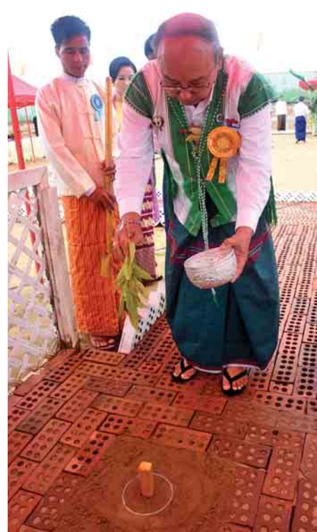
အမျိုးသားလွှတ်တော်ဥက္ကဋ္ဌ မန်းဝင်းခိုင်သန်း ပန္နက်တိုင်အား နံ့သာရည်ပက်ဖျန်းပေးစဉ်။