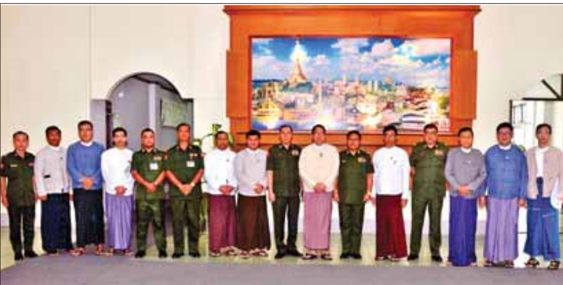
(သတင်းစဉ်)

ထို့ပြင် သတင်းမိဒီယာကဏ္ဍဖွံ့ဖြိုးတိုးတက်ရေးအတွက် တပ်မတော်သတင်းမှန် ပြန်ကြားရေးအဖွဲ့နှင့် ပြန်ကြားရေးဝန်ကြီးဌာန ပြောရေးဆိုခွင့်နှင့် သတင်းထုတ်ပြန်ရေးအဖွဲ့တို့ ပူးပေါင်းပြီး မြန်မာနိုင်ငံသတင်းမိဒီယာကောင်စီ အပါအဝင် သတင်းမိဒီယာအဖွဲ့အစည်းများမှ ကိုယ်စားလှယ်များနှင့် တွေ့ဆုံဆွေးနွေးပွဲကို ဇူလိုင် ၂၇ ရက် မွန်းလွဲပိုင်းတွင် ပြန်ကြားရေးဝန်ကြီးဌာန၌ ကျင်းပနိုင်ရေးအတွက် ဆက်လက်ညှိနှိုင်းဆောင်ရွက်သွားမည်ဖြစ်ကြောင်း သတင်းရရှိသည်။