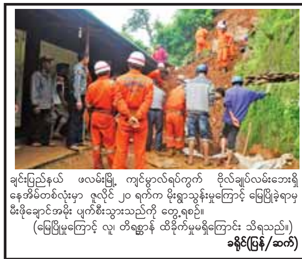
ချင်းပြည်နယ် ဖလမ်းမြို့ ကျင်မ္ဘာရပ်ကွက် ဗိုလ်ချုပ်လမ်းဘေးရှိ နေအိမ်တစ်လုံးမှာ ဇူလိုင် ၂၀ ရက်က မိုးရွာသွန်းမှုကြောင့် မြေပြိုခဲ့ရာမှ မီးဖိုချောင်အမိုး ပျက်စီးသွားသည်ကို တွေ့ရစဉ်။ (မြေပြိုမှုကြောင့် လူ တိရစ္ဆာန် ထိခိုက်မှုမရှိကြောင်း သိရသည်။) ခရိုင်(ပြန်/ဆက်)