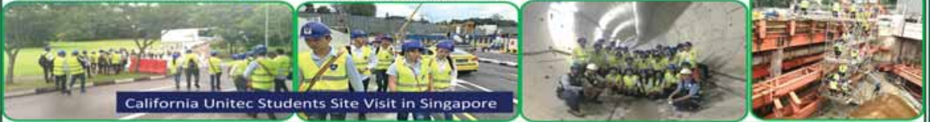
California Unitec Students Site Visit in Singapore

ပုလဲကွန်ပွို Block C နှင့် D ကြား ၊ 3F (တတိယထပ်)၊ ကမ္ဘာ့အေးဘုရားလမ်းနှင့် ဆရာစံလမ်းအတော်၊ ဗဟန်းမြို့နယ်၊ ရန်ကင်းမြို့။ 09 250 555 558, 09 250 555 559, 09 255 71 72 30, 09 255 71 72 40, 09 421 00 55 44 www.californiaunitec.com www.facebook.com/californiaunitec