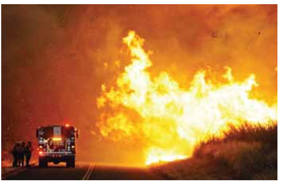
၂၀၁၇ ခုနှစ်က တောမီးလောင်ကျွမ်းမှုသည် ခရီးသွားပြည်သူများအား လည်ပတ်ခွင့်နယ်မြေ ထိန်းချုပ် Yosemite National Park အနီးသို့ ရောက်ရှိခဲ့ရာ ကန့်သတ်ခဲ့ရကြောင်း သိရသည်။ အင်န်အိတ်ချီကော။

ရေပေးဝေမှုလမ်းကြောင်းများ ပျက်စီးဆုံးရှုံးခဲ့သည့်အတွက် မြို့နေပြည်သူ ၂၀၀၀ ကျော်အား ဘေးလွတ်ရာသို့ ရွှေ့ပြောင်းကြရန် တာဝန်ရှိသူများက တိုက်တွန်းပြောကြားထားသည်။ ကယ်လီဖိုးနီးယားပြည်နယ် အုပ်ချုပ်ရေးမှူး ဂျယ်ရီ ဘရောင်းက မာရီပိုဆာစီရင်စုကို အရေးပေါ်အခြေအနေအဖြစ် ကြေညာထားသည်။ အဆိုပါတောမီးလောင်ကျွမ်းမှုကြောင့် Yosemite National Park ကို မီးကူးစက်လောင်ကျွမ်းမှုမရှိသေးသော်လည်း မီးခိုးမြူများ ကူးလူးလွင့်ပါးလျက်ရှိသည်ကို မြင်တွေ့ရကြောင်း မီးသတ်တပ်ဖွဲ့ဝင်များက ဆိုသည်။ ထို့ပြင် ပန်းခြံ၏ လျှပ်စစ်ဓာတ်အားလိုင်းများ ပြတ်တောက်နိုင်ခြေရှိကြောင်း တာဝန်ရှိသူများက ပြောကြားခဲ့သည်။