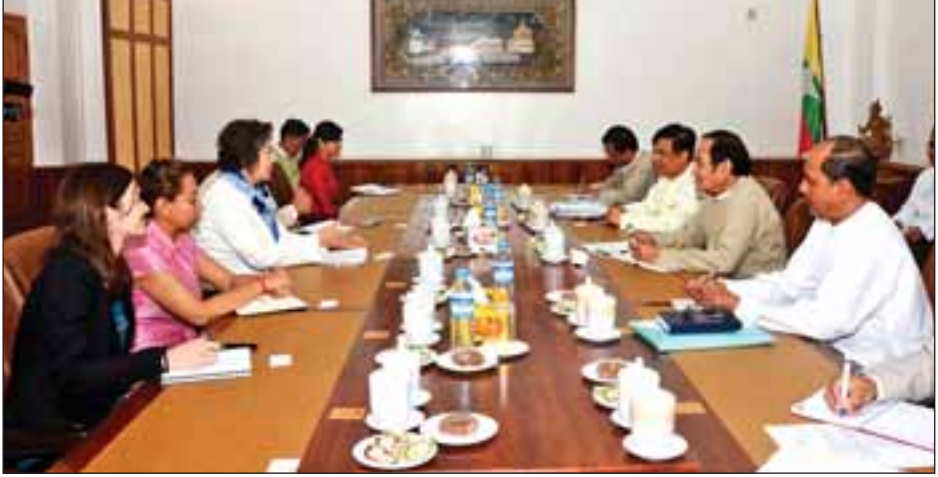
(သတင်းစဉ်)

၍လည်းကောင်း၊ ပြည်ထောင်စုဝန်ကြီး ဒေါက်တာ မြင့်ထွေးနှင့် တွေ့ဆုံစဉ် မြန်မာ့ကျန်းမာရေးကဏ္ဍအတွက် အမျိုးသားကျန်းမာရေး စီမံကိန်းရေးဆွဲ အကောင်အထည်ဖော်မှုနှင့် အလေအလွင့်နည်းသော ကျန်းမာရေးစောင့်ရှောက်မှုပေးနိုင်ရေးအတွက် အပြည်ပြည်ဆိုင်ရာ မိတ်ဖက်အဖွဲ့အစည်းများနှင့် ပူးပေါင်းဆောင်ရွက်နေမှုများနှင့် စပ်လျဉ်း၍လည်းကောင်း ဆွေးနွေးခဲ့ကြကြောင်း သိရသည်။