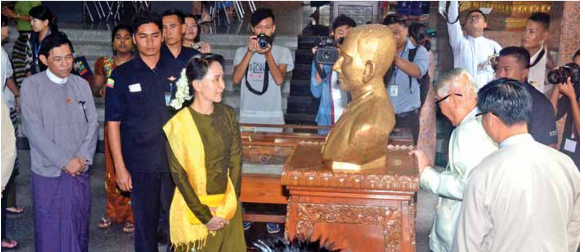
တက္ကသိုလ်များပဟိုစာကြည့်တိုက်အတွင်း ထားရှိသည့် ဆရာဇော်ဂျီရုပ်တုအား နိုင်ငံတော်၏အတိုင်ပင်ခံပုဂ္ဂိုလ် ဒေါ်အောင်ဆန်းစုကြည် ကြည့်ရှုစစ်ဆေးနေခြင်း။