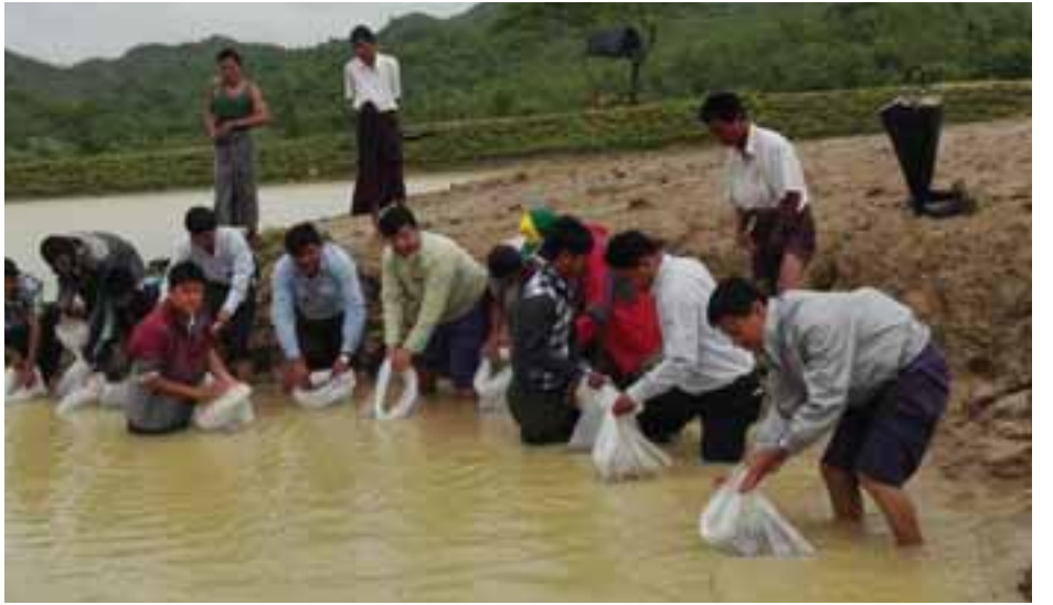
အပေါ်မူတည်၍ တိုင်းရင်းသားကျေးရွာများ၌ ငါးကန်များ ပြောကြားသည်။ သတင်း- မြင့်မောင်စိုး၊ အောင်ကျော်ဦး၊ နှစ်စဉ်တူးဖော်ပေးသွားမည်ဖြစ်ကြောင်း ၎င်းက

မောင်တောဒေသသည် ရေချိုငါးမွေးမြူရေးလုပ်ကိုင် ရန် အကောင်းဆုံးဒေသဖြစ်ကြောင်း၊ ရာသီဥတုမှာလည်း ကောင်းမွန်ကြောင်း၊ ဈေးကွက်အနေအထားမှာလည်း တစ်ဖက်ဘက်လားဒေသရှိနိုင်သည့် တင်ပို့နိုင်မည်ဖြစ်၍ ကြီးမားသော ဈေးကွက်ကြီးတည်ရှိနေကြောင်း၊ ပုဂ္ဂလိက အနေဖြင့် ရေချိုငါးမွေးမြူရေးကို လုပ်ကိုင်နိုင်ပါက စီးပွားဖြစ် အောင်မြင်မည်ဖြစ်ကြောင်း၊ ပြည်နယ် အစိုးရအနေဖြင့်လည်း လာမည့်နှစ်များတွင် ဘတ်ဂျက်