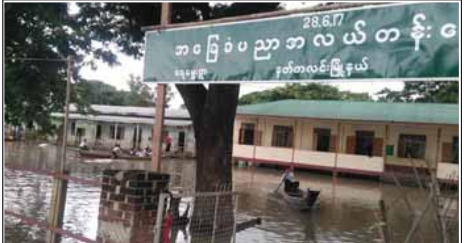
ပဲခူးတိုင်းဒေသကြီး နတ်တလင်းမြို့နယ်၌ ဇူလိုင် ၂၀ ရက်မှစ၍ ရေမွှေးရွာအလယ်တန်းကျောင်း(အလယ်တန်း အဆင့်)၊ တောင်ယာတောရွာ အလယ်တန်းကျောင်းခွဲ(အလယ်တန်းအဆင့်)၊ ကြို့ပင်အင်းရွာ မူလတန်းကျောင်းခွဲ (မူလတန်းအဆင့်)နှင့် ပုဇွန်ချောင်းရွာ မူလတန်းကျောင်း(မူလတန်းအဆင့်)တို့အတွင်း မိုးရွာသွန်းမှုနှင့်အတူ ဧရာဝတီမြစ်ရေ ဝင်ရောက်မှုကြောင့် စာသင်ကျောင်းများပိတ်ထားရကြောင်း သိရသည်။ (၀၇၀)