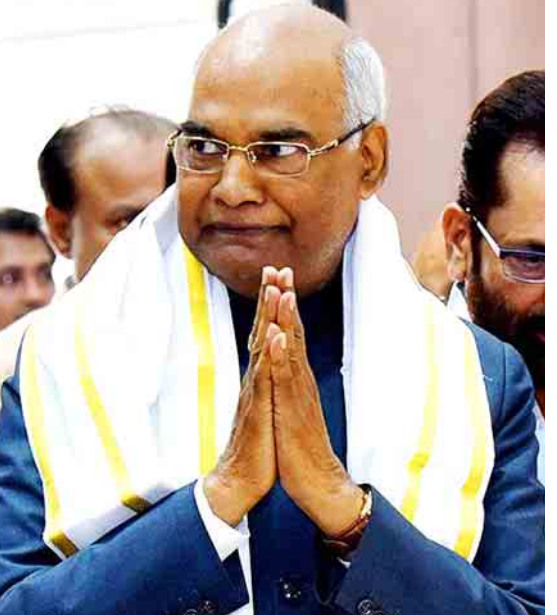
ဘီဂျေပီမှ သမ္မတလောင်း ရမ်နတ်ကိုပင်။