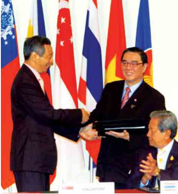
2007 ခုနှစ် ဇူလိုင်လ ၂၀ ရက်နေ့ မြန်မာနိုင်ငံတော် အစိုးရအဖွဲ့ဝန်ကြီး ဦးကျော်စွာ (ညာဘက်) က အာဆီယံအဖွဲ့အစည်းအသစ်တွေ ပိုမိုခိုင်မာအောင် ဆောင်ရွက်လာခဲ့ပါတယ်။