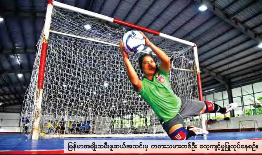
မြန်မာအမျိုးသမီးဖူဆယ်အသင်းမှ ကစားသမားတစ်ဦး လေ့ကျင့်မှုပြုလုပ်နေစဉ်။