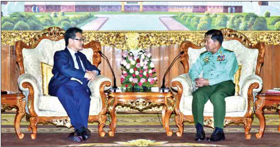
စစ်ဘက်ဆက်ဆံရေး ပိုမိုမြှင့်တင်ရေး တွေ့ဆုံစဉ် ဗိုလ်ချုပ်မှူးကြီးမင်းအောင်လှိုင် (ညာဘက်) နှင့် အမေရိကန်ပြည်ထောင်စု နိုင်ငံခြားရေးဝန်ကြီး သံအမတ်ကြီး မစ္စတာ ဂျိုးဇက်ဝိုင် (ဝါးဘက်) တို့ တွေ့ဆုံနေပုံ။

တပ်မတော်ကာကွယ်ရေးဦးစီးချုပ် ဗိုလ်ချုပ်မှူးကြီးမင်းအောင်လှိုင်သည် အမေရိကန်ပြည်ထောင်စု နိုင်ငံခြားရေးဝန်ကြီးဌာနမှ အရှေ့အာရှနှင့် ပစိဖိတ်ရေးရာ ဗျူရို ကိုရီးယားနှင့် ဂျပန်နိုင်ငံဆိုင်ရာ ဒုတိယ လက်ထောက်နိုင်ငံခြားရေးဝန်ကြီး သံအမတ်ကြီး မစ္စတာ ဂျိုးဇက်ဝိုင်၊ ယွန်းအား ယနေ့မနက် ၉ နာရီတွင် ဘုရင့်နောင်ရိပ်သာဧည့်ခန်းမဆောင်၌ လက်ခံတွေ့ဆုံသည်။ (ယာပုံ) တွေ့ဆုံစဉ် ဧည့်သည်တော်ဝန်ကြီးနှင့် အဖွဲ့ဝင်များက ကိုရီးယား ကျွန်းဆွယ်အရေး၊ အာရှပစိဖိတ်ဒေသ တည်ငြိမ်အေးချမ်းရေးနှင့် ကြွယ်ဝချမ်းသာရေး၊ အမေရိကန်-မြန်မာ