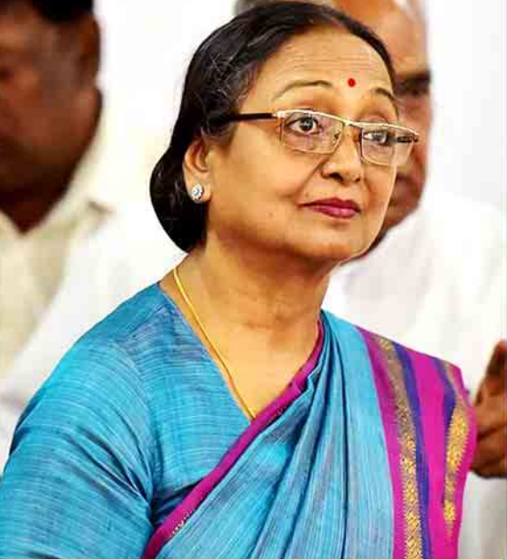
ကွန်ဂရက်ပါတီမှ သမ္မတလောင်း မေရာကူးမား။

ကယ်ဆယ်ရေးသမားများသည် ပျောက်ဆုံးနေသူနှစ်ဦးကို ဆက်လက်ရှာဖွေလျက်ရှိသော်လည်း အသက်ရှင်လျက် ရှာဖွေတွေ့ရှိရန်မျှော်လင့်ချက်နည်းနေကြောင်း ကယ်ဆယ်ရေးအဖွဲ့ဝင်များက ပြောကြားသည်။ ဆင်ဟွာ။