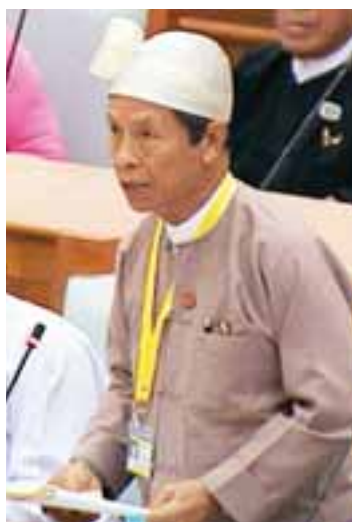
ပြည်ထောင်စုဝန်ကြီး ဦးကျော်ဝင်း

ယင်းဥပဒေကြမ်းအား လွှတ်တော်သို့ တင်သွင်းစဉ် ပြည်ထောင်စုဝန်ကြီးဦးကျော်ဝင်း က အစိုးရအောင်ဘာလေထိကို ၁၉၉၈ ခုနှစ် ကတည်းက ထုတ်ဝေရောင်းချခဲ့ပါကြောင်း၊ အောင်ဘာလေ သိန်းဆွဲခွန်ကောက်ခံခြင်း ဆိုင်ရာ ထိလက်မှတ်ထုတ်ဝေခြင်း၊ ဖြန့်ဖြူး ရောင်းချခြင်း၊ ထိဆွဲငွေထုတ်ပေးခြင်းတို့ကို အမိန့်ညွှန်ကြားချက်များဖြင့်သာ ထုတ်ပြန် ဆောင်ရွက်ခဲ့ပါကြောင်း၊ အစိုးရအောင်ဘာ လေထိဥပဒေပြဋ္ဌာန်းခြင်း၏ ရည်ရွယ်ချက်မှာ အခွန်ကောက်ခံခြင်းအား ဥပဒေနှင့်အညီ ကောက်ခံနိုင်ရန်၊ လက်ရှိအကောင်အထည် ဖော်နေသည့် ထိလက်မှတ်(Paper Lottery) စနစ်အပြင် အီလက်ထရွန်နစ်ထိ e-Lottery စနစ်ကိုလည်း ဥပဒေနှင့်အညီ အကောင် အထည်ဖော်နိုင်ရန်အတွက်ဖြစ်ပါကြောင်း၊ e-Lottery စနစ်ကို အကောင်အထည်ဖော် နိုင်ခြင်းဖြင့် ထိစနစ်သစ်များအနေဖြင့် မိမိတို့