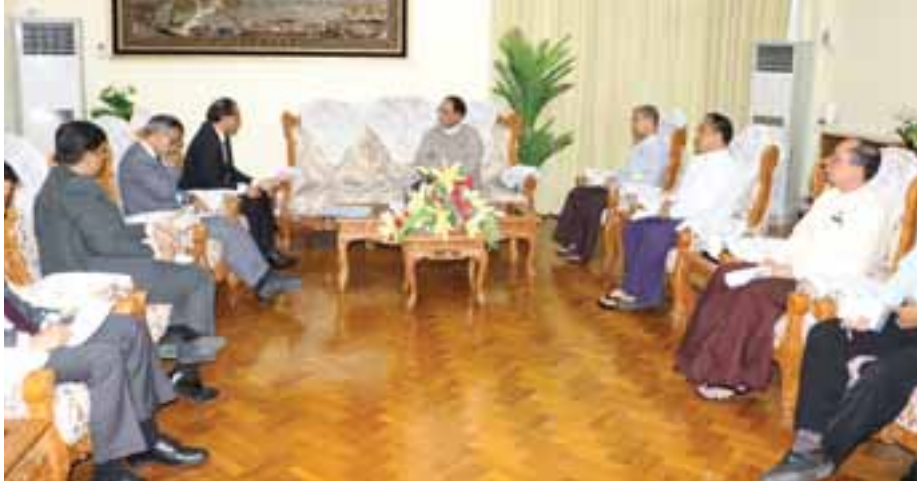
ပစ္စည်းများကို တစ်ဆင့်ခံရောင်းချ နေမည့်အစား တိုက်ရိုက်ဆက်သွယ် ဆောင်ရွက်နိုင်ရေးအတွက် ပုဂ္ဂလိက အဖွဲ့အစည်းများအား အားပေးသွား များနှင့် ဘင်္ဂလားဒေ့ရှ် ဆိပ်ကမ်းများ

နေပြည်တော် ဇွန် ၁၄ စီးပွားရေးနှင့် ကူးသန်းရောင်းဝယ်ရေးဝန်ကြီးဌာန ပြည်ထောင်စုဝန်ကြီး ဒေါက်တာ သန်းမြင့်သည် ဘင်္ဂလားဒေ့ရှ်နိုင်ငံ သံအမတ်ကြီး H.E. Mr. Mohammad Sufiur Rahman အား ဇူလိုင် ၁၃ ရက် မွန်းလွဲ ၂ နာရီခွဲတွင် စီးပွားရေးနှင့် ကူးသန်းရောင်းဝယ်ရေးဝန်ကြီးဌာန ဧည့်ခန်းမ၌ တွေ့ဆုံသည်။