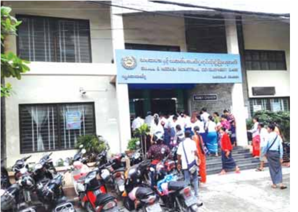
သီဟကိုကို(မန္တလေး)

အသေးစားနှင့် အလတ်စားစက်မှုလုပ်ငန်းဖွံ့ဖြိုးရေးဘဏ်မှ နိုင်ငံ့ဝန်ထမ်းများအား မူရင်းလစာ၏သုံးဆကိုဇူလိုင် ၃ ရက်မှ စ၍ ထုတ်ချေးပေးလျက်ရှိသည်။ ချေးငွေရယူလိုသော မန္တလေး မြို့ရှိနိုင်ငံ့ဝန်ထမ်းများသည် ချမ်းအေးသာစံမြို့နယ် (၈၃) လမ်း (၂၇) လမ်းနှင့် (၂၈) လမ်းကြားရှိ အသေးစားနှင့်အလတ်စားစက်မှု လုပ်ငန်းဖွံ့ဖြိုးရေးဘဏ် (မန္တလေးဘဏ်ခွဲ) တွင် ချေးငွေပုံစံရယူ ပြီးမှန်ကန်စွာဖြည့်စွက်၍ ဌာနအကြီးအကဲနှစ်ဦး၏ ထောက်ခံ ချက်၊ ငွေချေးသူဌာနမှဝန်ထမ်းနှစ်ဦး၏ အမတ်လက်မှတ်၊ ဝန်ထမ်းကတ်နှင့် မှတ်ပုံတင်မိတ္တူ၊ အိမ်ထောင်စုလူဦးရေစာရင်း မိတ္တူ၊ ချေးငွေလျှောက်ထားသူနေထိုင်ရာ ရပ်ကွက်မှနေထိုင် ကြောင်း ထောက်ခံချက်များပူးတွဲတင်ပြ၍ လျှောက်လွှာများအား (မ)ရက်များတွင်လက်ခံပြီး (စုံ) ရက်များတွင် ငွေထုတ်ပေးသည်။