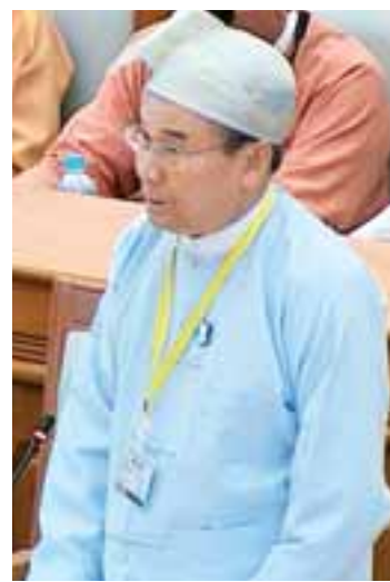
ပြည်ထောင်စုဝန်ကြီး ဦးအုန်းဝင်း

ယင်းနောက် သယံဇာတနှင့် သဘာဝ ပတ်ဝန်းကျင်ထိန်းသိမ်းရေး ဝန်ကြီးဌာန ပြည်ထောင်စုဝန်ကြီး ဦးအုန်းဝင်းက ဒိုဟာ ပြင်ဆင်ချက်သည် မြန်မာနိုင်ငံအပါအဝင် ဖွံ့ဖြိုးမှုအနည်းဆုံးနိုင်ငံများ၊ ဖွံ့ဖြိုးဆဲနိုင်ငံများ အနေဖြင့် ကတိကဝတ်ပြုလျှော့ချရမည့် တာဝန်ဝတ္တရားများမရှိသော်လည်း စက်မှု ဖွံ့ဖြိုးပြီး နိုင်ငံများက ဈေးကွက်စီးပွားရေး