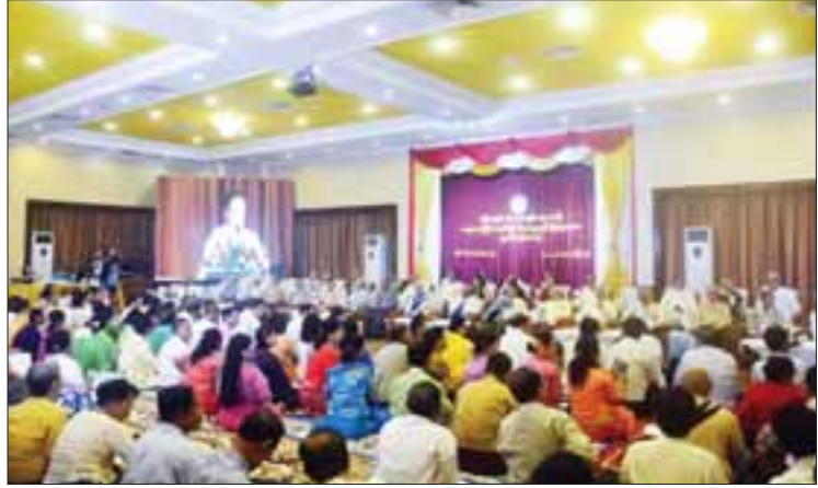
သတင်း- ဇာနည်မောင်

“ဘဝခရီးတစ်ခုထဲမှာ ဘဝများစွာရှိပါတယ်။ အခုကန်တော့ခဲ့ပုံရှိလေတာ နှစ်ပေါင်းများစွာလေ့လာစဉ်းပူးထားသမျှ တိုင်းပြည်အတွက် ဆောင်ရွက်စရာတွေပိုလေ ဖြစ်ပါတယ်။ အခုလိုကျင်းပတာဟာ အင်မတန်မှ နှစ်လို့ဖွယ်ကောင်းတဲ့အပြုအမူနဲ့ မြန်မာ့ဓလေ့စရိုက်ဖြစ်ပါတယ်။ မလှုပ်ရှားနိုင်တဲ့ဘဝရောက်တဲ့အထိ မက်မောစွဲလမ်းလုပ်ကိုင်ချင်နေတာပါ။ ဒါပေမယ့်လည်း ဇရာကွဲမပြုတော့ပါဘူး။ ဒါကြောင့်လူငယ်တွေကို ပြောချင်တာက ဆိုနိုင်၊ တီးနိုင်၊ ရေးနိုင်တဲ့အချိန်မှာ လုပ်ပါ။ ကျွန်တော်တို့လိုအရွယ်ရောက်ရင် ဘာမှလုပ်နိုင်တော့မယ့် စွမ်းအားမရှိတော့ပါဘူးလို့ သတိပေးချင်ပါတယ်”ဟု ကန်တော့ခံ သက်ကြီး ဂီတပညာရှင် ဒေါက်တာ စည်သူဗိုလ်ကလေးတင့်အောင်က ပြောကြားသည်။