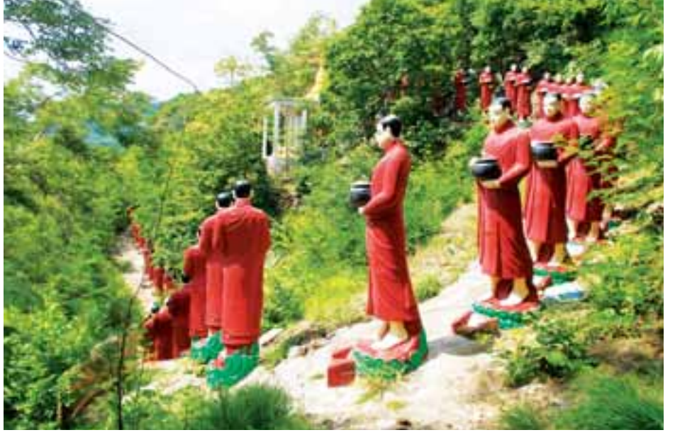
ဖွယ် ဖူးမြင်ရပြီး စိစဉ်တည်ဆောက်ထုလုပ်မှုမှာ စနစ်ကျ လှသည်။ ရေတံခွန်တောင်ပေါ်မှ တောင်ခြေရှိရွှေနတ် တောင်မုန်အောင်မြေကျောင်းအထိ ရဟန္တာရုပ်တုများ ကြွလာဟန်ပုံများမှာ ကြည့်ညှိဖွယ်ဖြစ်သည်။ လက်ရှိကာ

ရေတံခွန်တောင်ခြေရှိ ရေကြည်ရွာရောက်သည်နှင့် အဝေးမှကြည့်ညှိဖွယ် မြင်တွေ့နေရသောအရာတစ်ခု လည်းရှိသည်။ ထိုအရာမှာ ရဟန္တာငါးရာကျော်တာဝတီသာ မှကြွလာဟန် ရုပ်တုများပင်ဖြစ်သည်။ အဝေးမှပင်ကြည့်ညှိ