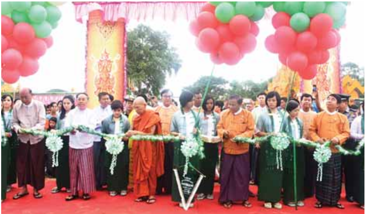
ရဘဲကျေးရွာ အခြေခံပညာအလယ်တန်းကျောင်း ဆိုင်းဘုတ်ကို နိုင်ငံတော်သံယမဟာနာယကအဖွဲ့ ဥက္ကဋ္ဌ ဆရာတော် ဒေါက်တာဘဒ္ဒန္တကုမာရာ ဘိဝံသ၊ ဒုတိယသမ္မတ ဦးမြင့်ဆွေ၊ တိုင်းဒေသကြီးဝန်ကြီးချုပ် ဒေါက်တာဇော်မြင့်မောင်နှင့် တာဝန်ရှိသူများ ဖဲကြီးဖြတ် ဖွင့်လှစ်ပေးစဉ်။

ထို့နောက် ဒုတိယသမ္မတ ဦးမြင့်ဆွေက ယနေ့နိုင်ငံတော်အစိုးရ၏ ဘက်စုံကဏ္ဍစုံ ဖွံ့ဖြိုးတိုးတက်ရေးအတွက် အစွမ်းကုန်ကြိုးစားဆောင်ရွက် လျက်ရှိရာ ပညာရေးကဏ္ဍကို အထူးအလေးပေးဆောင်ရွက်လျက်ရှိကြောင်း၊ လူ့စွမ်းအားအရင်းအမြစ် ဖွံ့ဖြိုးတိုးတက်ရေးသည် အထူးအရေးကြီးပါကြောင်း နှင့် လူ့စွမ်းအားအရင်းအမြစ် ဖွံ့ဖြိုးတိုးတက်လာသည်နှင့်အမျှ နိုင်ငံတော်၏