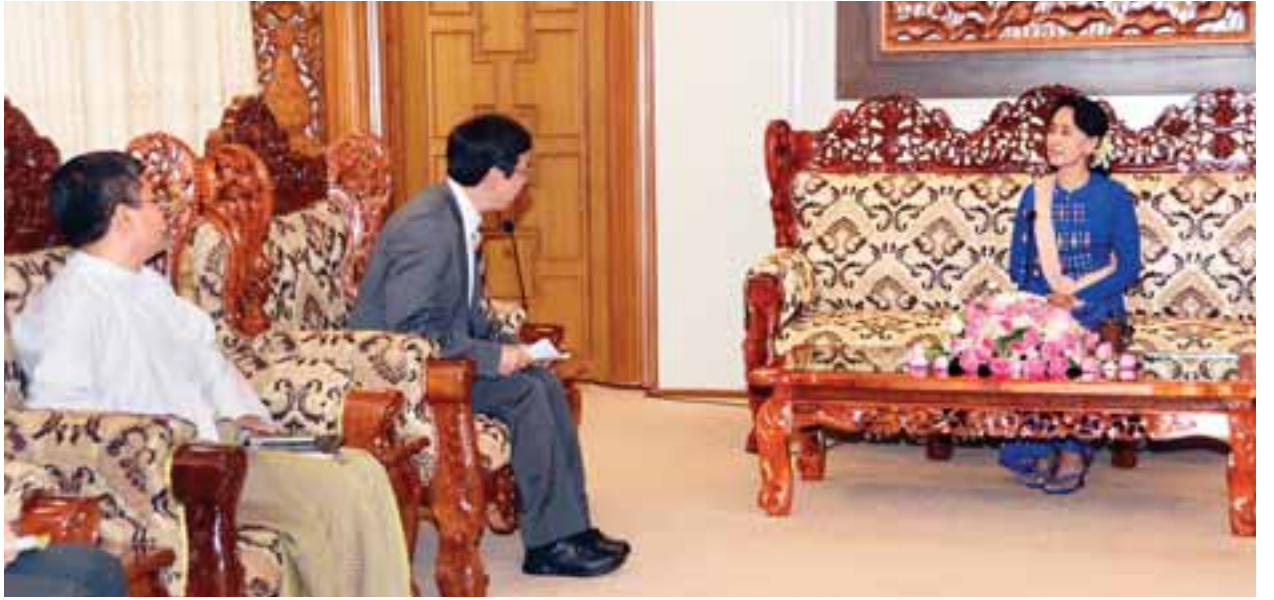
နိုင်ငံတော်၏အတိုင်ပင်ခံပုဂ္ဂိုလ် ဒေါ်အောင်ဆန်းစုကြည်ထံ Mr. Akio Nakayama လာရောက်ဂါရဝပြု တွေ့ဆုံစဉ်။ (သတင်းစဉ်)