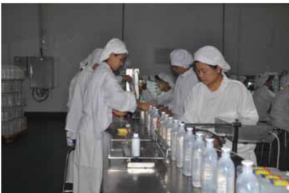
ဆေးဝါးစက်ရုံ(ကျောက်ဆည်) မှဆေးဝါးထုတ်လုပ်မှုတွေရစဉ်။

အဆိုပါ New BPI Project တွင် ပထမအဆင့်အနေဖြင့် ၂၀၁၆ ခုနှစ် မေ ၂၀ ရက် တွင် မြေဆီပ်ဖြေဆေးထုတ်လုပ်မှု အဆောက်အအုံနှင့် ခေတ်မီဆေးဝါးသိုလှောင်ရုံ အဆောက်အအုံကို ဖွင့်လှစ်နိုင်ခဲ့ပြီး မြေဆီပ်ဖြေဆေး အဆောက်အအုံတည်ဆောက်နေစဉ် ကာလအတွင်း တာဝန်ထမ်းဆောင်မည့် ဝန်ထမ်းများကို ဂျာမနီ၊ ဩစတြေးလျ၊ ဘရာဇီး၊ ထိုင်းနှင့် စင်ကာပူနိုင်ငံများသို့