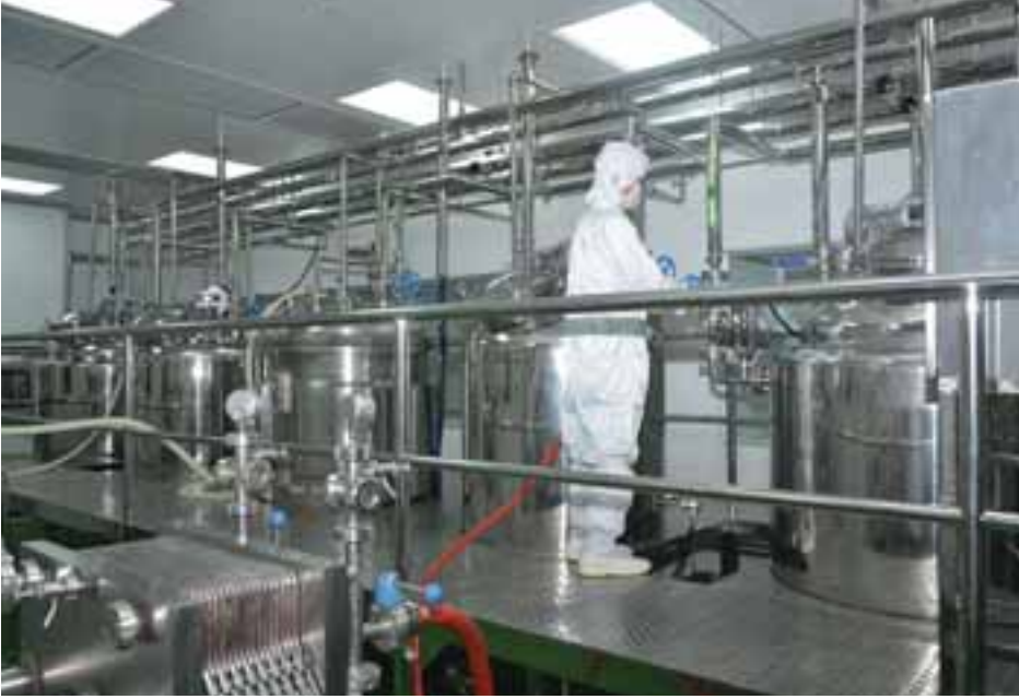
အင်းစိန် BPI ဆေးဝါးစက်ရုံမှ ဆေးဝါးထုတ်လုပ်မှုတွေရစဉ်။

ပညာတော်သင်စေလွှတ်ခဲ့ရာ ၂၀၁၆-၂၀၁၇ ဘဏ္ဍာနှစ်မှစ၍ မြေဆီပ်ဖြေဆေး အလုံးရေ တစ်သိန်း ထုတ်လုပ်နိုင်ခဲ့ပြီး ကျန်းမာရေးနှင့် အားကစားဝန်ကြီးဌာနနှင့် ကာကွယ်ရေးဝန်ကြီးဌာနလက်အောက်ရှိ ဆေးရုံ ဆေးခန်းများမှ မှာယူသည့်အရေအတွက်အတိုင်း ပြည့်မီစွာ ထုတ်လုပ်ဖြန့်ဖြူးပေးနိုင်ပြီ ဖြစ်သည်။