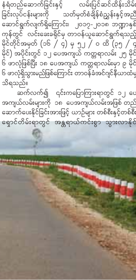
နမ့်စန်လမ်း ၁၈ ပေ အကျယ် မိုင်တိုင်အမှတ် ၇ / ၅ ဆောင်ရွက်ပြီးစီးမှုကို တွေ့ရစဉ်။

နံရံတည်ဆောက်ခြင်းနှင့် လမ်းပြင်ဆင်ထိန်းသိမ်း ခြင်းလုပ်ငန်းများကို သတ်မှတ်စီမံခန့်ခွဲမှုနှင့်အညီ ဆောင်ရွက်လျက်ရှိကြောင်း၊ ၂၀၁၇-၂၀၁၈ ဘဏ္ဍာနှစ် ကုန်တွင် လင်းခေးခရိုင်မှ တာဝန်ယူဆောင်ရွက်ရသည့် မိုင်တိုင်အမှတ် (၁၆ / ၄) မှ ၅၂ / ၀ ထိ (၃၅ / ၄ မိုင်) အပိုင်းတွင် ၁၂ ပေအကျယ် ကတ္တရာလမ်း ၂၅ မိုင် ၆ ဖာလုံဖြစ်ပြီး ၁၈ ပေအကျယ် ကတ္တရာလမ်းမှာ ၉ မိုင် ၆ ဖာလုံရှိသွားမည်ဖြစ်ကြောင်း တာဝန်ခံအင်ဂျင်နီယာထံမှ သိရသည်။ ဆက်လက်၍ ၎င်းကပြောကြားရာတွင် ၁၂ ပေ အကျယ်လမ်းများကို ၁၈ ပေအကျယ်လမ်းအဖြစ် တည် ဆောက်ပေးနိုင်ခြင်းအားဖြင့် ယာဉ်များ တစ်စီးနှင့်တစ်စီး ရှောင်တိမ်းရာတွင် အန္တရာယ်ကင်းစွာ သွားလာနိုင်