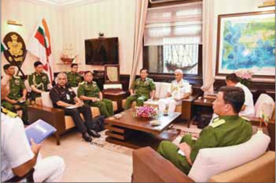
တပ်မတော်ကာကွယ်ရေးဦးစီးချုပ် ဗိုလ်ချုပ်မှူးကြီးမင်းအောင်လှိုင်နှင့် အိန္ဒိယတပ်မတော် (ကြည်း၊ ရေ၊ လေ) စစ်ဦးစီးချုပ်များကော်မတီဥက္ကဋ္ဌ Admiral Sunil Lanba တို့ တွေ့ဆုံဆွေးနွေးစဉ်။

ဆက်လက်၍ တပ်မတော်ကာကွယ်ရေးဦးစီးချုပ် ဗိုလ်ချုပ်မှူးကြီးမင်းအောင်လှိုင်သည် အိန္ဒိယတပ်မတော်ကြည်းတပ်ဦးစီးချုပ် Gen. Bipin Kawat နှင့် ၎င်း၏ ရုံးခန်း၌ တွေ့ဆုံဆွေးနွေးကြပြီး တပ်မတော်ကာကွယ်ရေးဦးစီးချုပ်နှင့်အဖွဲ့အား South Block ရှိ Army Conference Hall တွင် အိန္ဒိယကြည်းတပ်မှ စစ်ရေးချုပ်တာဝန်ထမ်းဆောင်ခဲ့သူ Maj. Gen. Sunil Chan-