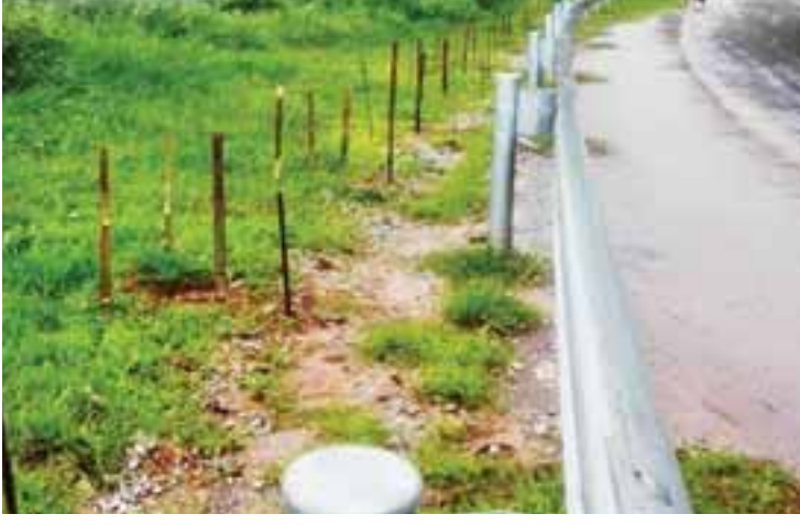
ဓာတ်ပုံ မဖြစ်မနေရိုက်ကူးမှတ်တမ်းတင် လေ့ရှိသည့် နေရာတစ်ခုဖြစ်ရာ အဆိုပါ View Point ဝန်းကျင် သာယာလှပရေးနှင့် ပင်လယ်ဘက် မျက်နှာမူရာ လမ်းဘေး တစ်လျှောက် လေကာပင်လယ်ကဗွီးပင်များ မြို့အင်္ဂါရပ်နှင့်အညီ သာယာလှပရေး ရည်ရွယ်ကာ ယခုနှစ် မိုးရာသီအတွင်း မြို့နယ်စည်ပင်သာယာရေး အဖွဲ့မှ တာဝန် ယူစိုက်ပျိုးကြခြင်းဖြစ်ကြောင်း သိရသည်။

ကျော့သောင်း ဇူလိုင် ၁၄ မြို့နယ်စည်ပင်သာယာရေးအဖွဲ့သန့်ရှင်းရေး ဌာနစိတ်မှ ဇူလိုင် ၁၃ ရက် နံနက်ပိုင်းက သီရိမြိုင်ရပ်ကွက် ကျော့သောင်းမြို့အဝင် ကြိုဆိုပါ၏ ဆိုင်းဘုတ်ရှိရာ View Point ပတ်ဝန်းကျင်တစ်ဝိုက် သာယာလှပရေး လုပ်ငန်းများအဖြစ် လေကာပင်လယ်က ဗွီးပင်များစိုက်ပျိုးခဲ့ကြကြောင်းသိရသည်။