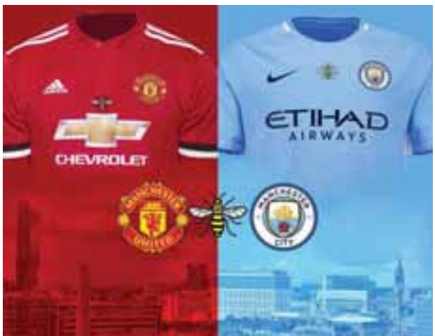
စတာမြို့၏ ဖက်တိုက်ခိုက်မှုအတွင်းက သေဆုံးသူများကို ဂုဏ်ပြုသော အရုပ်များကို ဝတ်ဆင်မည်ဖြစ်ကြောင်း ဇူလိုင် ၁၃ ရက်တွင် အတည် ပြုချက် ထုတ်ခဲ့သည်။

မန်ယူနှင့် မန်စီးတီးအသင်းတို့ သည် မန်ချက်စတာမြို့ အကြမ်း ဖက်တိုက်ခိုက်မှုအတွင်း သေဆုံး သွားသူများကို ဂုဏ်ပြုသော အားဖြင့် ရာသီကြိုခြေစမ်းပွဲ များတွင် ပျားပိတုန်းပုံအရုပ်များ ရေးထိုးထားသည့် ဂျာစီများကို ဝတ်ဆင်ကစားမည်ဖြစ်ကြောင်း ဇူလိုင် ၁၃ ရက်တွင် အတည် ပြုချက် ထုတ်ခဲ့သည်။ မေလ အတွင်းက မန်ချက်စတာကွင်း ၌ ပြုလုပ်သည့် အမေရိကန် အဆိုတော် အရီယာနာဂရန်းစ် ၏ ဖျော်ဖြေပွဲအတွင်း အသေခံ ဗုံးခွဲမှုကြောင့် လူ ၂၂ ဦး သေဆုံး ခဲ့ရသည်။ လုပ်သားပျားသည် မန်ချက်