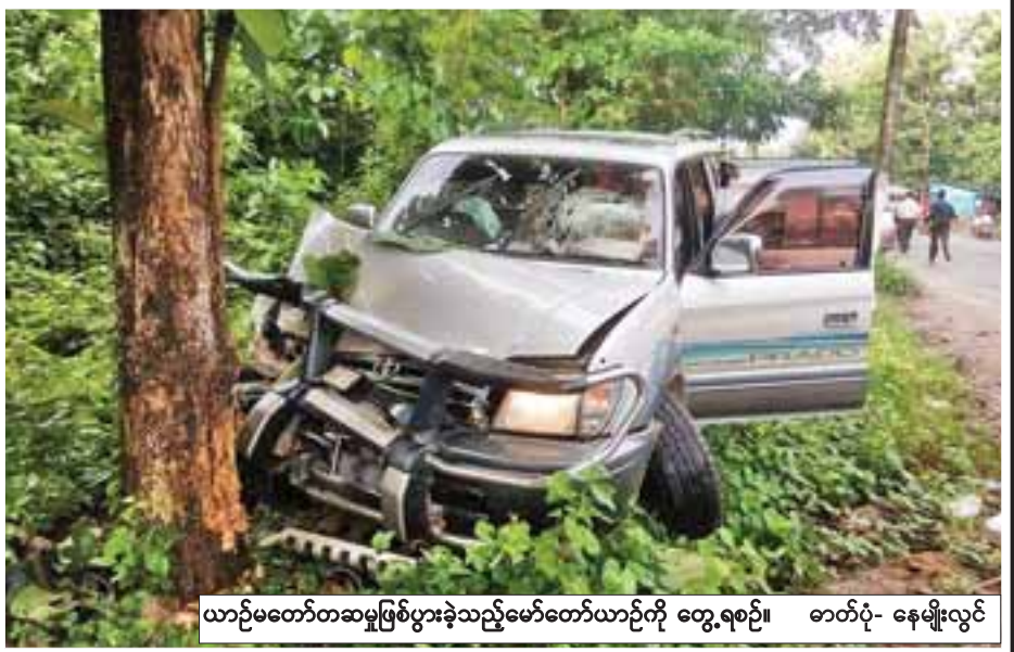
ယာဉ်မတော်တဆမှုဖြစ်ပွားခဲ့သည့်မော်တော်ယာဉ်ကို တွေ့ရစဉ်။