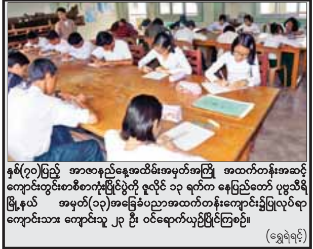
နှစ်(၇၀)ပြည့် အာဇာနည်နေ့အထိမ်းအမှတ်အကြို အထက်တန်းအဆင့် ကျောင်းတွင်းစာစီစာကုံးပြိုင်ပွဲကို ဇူလိုင် ၁၃ ရက်က နေပြည်တော် ပုဗ္ဗသီရိမြို့နယ် အမှတ်(၁၃)အခြေခံပညာအထက်တန်းကျောင်း၌ပြုလုပ်ရာ ကျောင်းသား ကျောင်းသူ ၂၃ ဦး ဝင်ရောက်ယှဉ်ပြိုင်ကြစဉ်။

ထို့အပြင် ဟော်ကီအားကစားဝါသနာရှင်များ သိမ်ဖြူတွင်းတွင် လာရောက်ကစားနိုင်ပြီး ပစ္စည်း၊ နည်းပြနှင့် နည်းစနစ်နှင့်များကို အခမဲ့ကူညီပေးမည်ဖြစ်သည်။ စာသင်ကျောင်းများတွင် ဝါသနာပါသည့် ကျောင်းသား ကျောင်းသူများကိုလည်း အသင်းအဖွဲ့ များရှိပါက အခမဲ့ လိုက်လံ သင်ကြားပေးမည်ဖြစ်ကြောင်း သိရသည်။