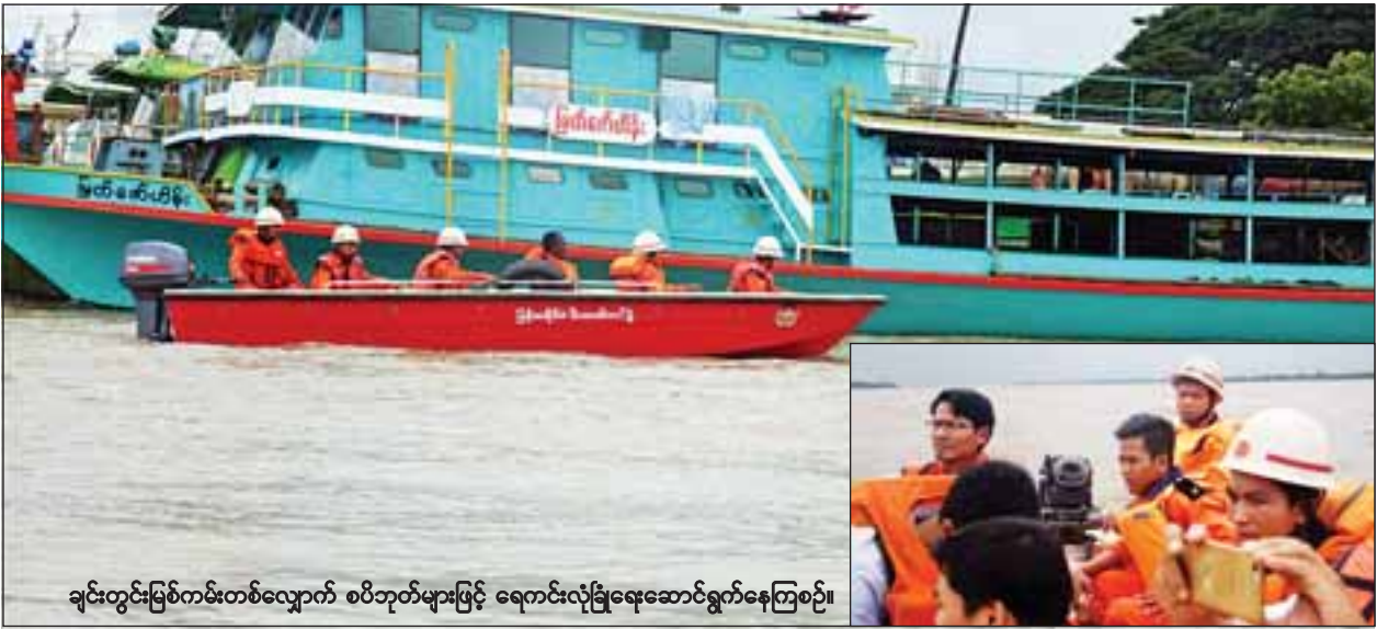
ချင်းတွင်းမြစ်ကမ်းတစ်လျှောက် စပိဘုတ်များဖြင့် ရေကင်းလုံခြုံရေးဆောင်ရွက်နေကြစဉ်။

အလားတူ ချင်းတွင်းမြစ်ရေသည် မော်လိုက်မြို့တွင် ခုနစ်ပေခန့်၊ ကလေးဝမြို့တွင် ငါးပေခွဲခန့်၊ မင်းကင်းမြို့တွင် ငါးပေခန့်၊ ကနီမြို့တွင် နှစ်လက်မခန့်နှင့် ပုံရွာမြို့တွင် နှစ်ပေခန့် ယင်းမြို့များ၏ စိုးရိမ်ရေမှတ် အထက်သို့ ကျော်လွန်နေပြီး နောက်တစ်ရက်အတွင်း မော်လိုက်မြို့ တွင် ပေဝက်ခန့်၊ စာမျက်နှာ ၉ ကော်လံ ၆ သို့ *