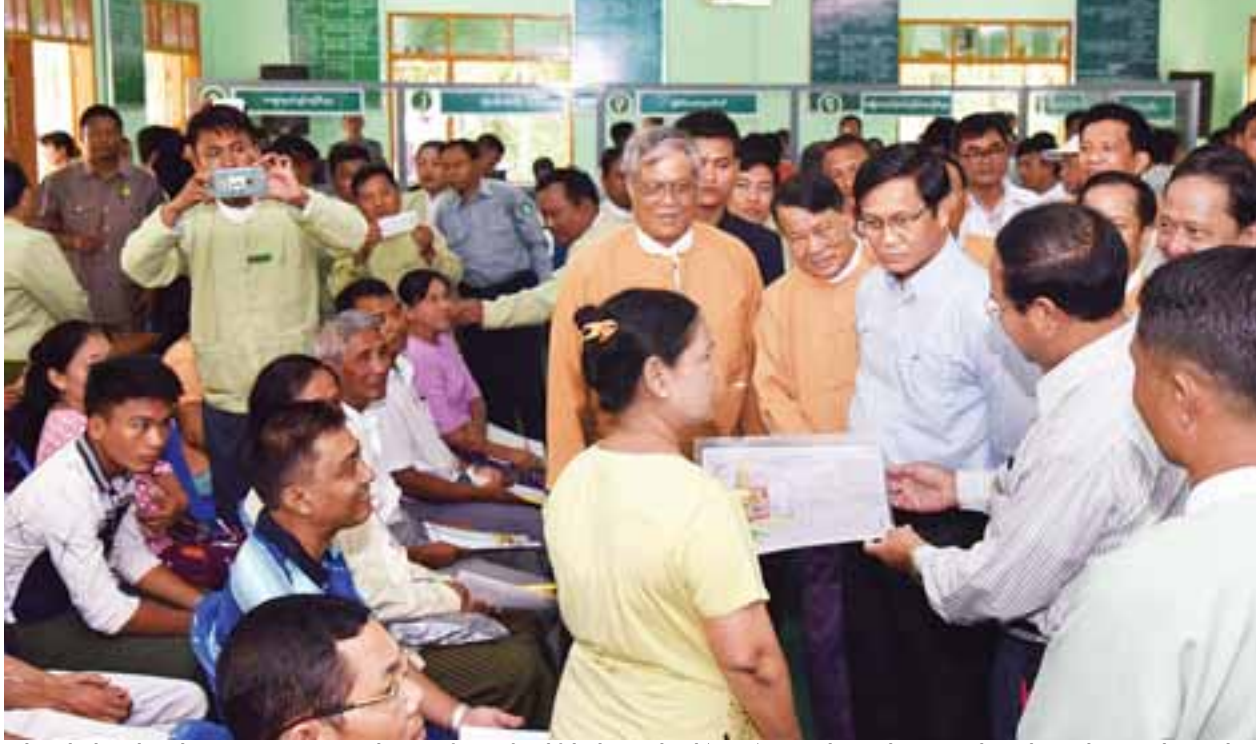
ပြန်လည်စွန့်လွှတ်သည့်မြေများအား မူလတောင်သူများသို့ ယာယီလုပ်ပိုင်ခွင့်ပြုလက်မှတ်(ပုံစံ-၃) ပေးအပ်ပွဲအခမ်းအနားတွင် တက်ရောက်လာသည့် တောင်သူ လယ်သမားများအား ဒုတိယသမ္မတ ဦးဟင်နရီပန်ထီးယူ ရင်းရင်းနှီးနှီးနှုတ်ဆက်စဉ်။

(ပုံ)ထင်ကျော် နိုင်ငံတော်သမ္မတ ပြည်ထောင်စုသမ္မတမြန်မာနိုင်ငံတော်