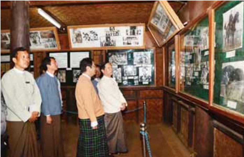
ပစ္စည်းနှင့်ဝတ္ထုငွေများ ဆက်ကပ်လှူဒါန်းခဲ့သည်။ ယင်းနောက် နတ်မောက်မြို့မှ မြို့သစ်မြို့သို့ ရောက်ရှိပြီး ဈေးဝင်းမင်းပရိယတ္တိစာသင်တိုက်၊ သုခသမ္ပဒါလေသာကျောင်းတိုက်၊ လှိုင်နံ့သာဓမ္မရိပ်သာကျောင်းတိုက်များသို့ သွားရောက်ပြီး ဆရာတော်ကြီးများအား ဖူးမြော်ကြည့်ညို၍ သာသနာရေးဆိုင်ရာများ လျှောက်ထားကာ လှူဖွယ်ပစ္စည်းနှင့်ဝတ္ထုငွေများ ဆက်ကပ်လှူဒါန်းခဲ့ကြောင်း သတင်းရရှိသည်။ (သတင်းစဉ်)

နေပြည်တော် ဇူလိုင် ၁၃ သာသနာရေးနှင့် ယဉ်ကျေးမှုဝန်ကြီးဌာန ပြည်ထောင်စုဝန်ကြီး သူရဦးအောင်ကိုယ်တိုင် မကွေးတိုင်းဒေသကြီး နတ်မောက်မြို့ ဗိုလ်ချုပ်အောင်ဆန်း နေအိမ်ပြတိုက်သို့ ဇူလိုင် ၁၂ ရက်တွင် သွားရောက်၍ နှစ်(၇၀)ပြည့် အာဇာနည်နေ့ အထိမ်းအမှတ်အဖြစ် အထူးဖွင့်လှစ်ပြသရန် ခင်းကျင်းပြသမည့်ပစ္စည်းများ ပြင်ဆင်ထားရှိမှုအခြေအနေ၊ အဆောက်အအုံ ကြံ့ခိုင်မှုအခြေအနေ၊ ယာယီခင်းကျင်း ပြသမည့်နေရာနှင့် ခြံစည်းရိုးကာရံထားရှိမှု အခြေအနေ များကို ကြည့်ရှုစစ်ဆေး၍ လိုအပ်သည်များကို ပေါင်းစပ်ညှိနှိုင်း ဆောင်ရွက်ပေးသည်။ ဆက်လက်၍ နတ်မောက်မြို့ရှိ ယဉ်ကျေးမှုပြတိုက်သို့ သွားရောက်ကြည့်ရှုစစ်ဆေးပြီး ဗိုလ်ချုပ်အောင်ဆန်း ငယ်စဉ်က ပညာသင်ကြားခဲ့သည့် ဒီပက်ရာပရိယတ္တိ စာသင်တိုက်သို့ သွားရောက်၍ ဆရာတော်အဂ္ဂမဟာသဒ္ဓမ္မ ဇောတိကဓဇ ဘဒ္ဒန္တစန္ဒဝံသအား ဖူးမြော်ကြည့်ညိုကာ ဩဝါဒခံယူပြီး သာသနာရေးဆိုင်ရာများ လျှောက်ထား၍ လှူဖွယ်ပစ္စည်းနှင့် ဝတ္ထုငွေများ ဆက်ကပ်လှူဒါန်းသည်။ ယင်းနောက် မြို့မဘုန်းတော်ကြီးကျောင်း၊ ဆုတောင်းပြည့် ဘုရားကြီးကျောင်းတို့ကို ရန်အောင်မြင်ကျောင်းတိုက် ဆရာတော်ကြီးများအား သွားရောက်ဖူးမြော်ကြည့်ညို၍ သာသနာရေးဆိုင်ရာများ လျှောက်ထားကာ လှူဖွယ်