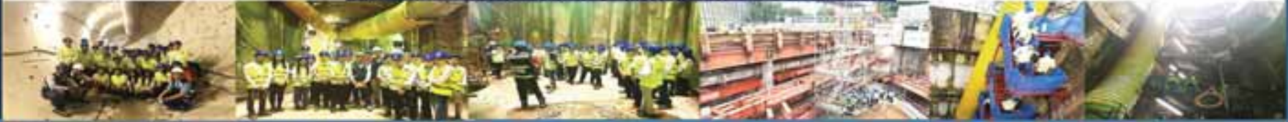
California Unitec Students Site Visit in Singapore