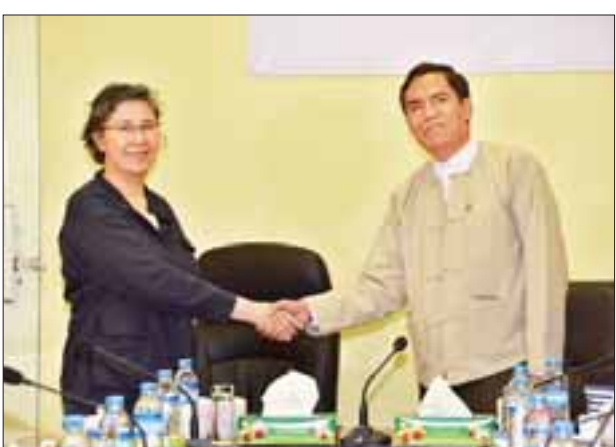
မစ္စယန်ဟီလီနှင့် မြန်မာနိုင်ငံ သတင်းမီဒီယာကောင်စီ ဒုတိယဥက္ကဋ္ဌ(၁) ဦးအောင်လှထွန်းတို့ ရင်းရင်းနှီးနှီး နှုတ်ဆက်စဉ်။

စစ်တွေ ဇူလိုင် ၁၃ ကုလသမဂ္ဂ၏ မြန်မာနိုင်ငံ လူ့အခွင့်အရေးအခြေအနေဆိုင်ရာ အထူးအစီရင်ခံစာတင်သွင်းသူ မစ္စယန်ဟီလီနှင့်အဖွဲ့သည် ယနေ့နံနက်ပိုင်းတွင် ဘူးသီးတောင်မြို့မှ ရေကြောင်းခရီးဖြင့်ထွက်ခွာခဲ့ရာ စစ်တွေမြို့သို့ နံနက် ၁၀ နာရီတွင် ပြန်လည်ရောက်ရှိသည်။ မစ္စယန်ဟီလီနှင့်အဖွဲ့သည် နံနက်ပိုင်းတွင် စစ်တွေမြို့ အောင်မင်္ဂလာရပ်ကွက်ရှိ မဒ္ဒရာဆာအိစ္စလာမီစာသင်ကျောင်း၌ အောင်မင်္ဂလာရပ်ကွက်ရှိ အစ္စလာမီဘာသာဝင်များနှင့် တွေ့ဆုံသည်။ မွန်းလွဲပိုင်းတွင် စစ်တွေမြို့နယ် သက္ကယ်ပြင် ကယ်ဆယ်ရေးစခန်းရှင်းလင်းဆောင်၌ စခန်းအတွင်းရှိ အစ္စလာမီဘာသာဝင်များနှင့် တွေ့ဆုံဆွေးနွေးပြီး သိရှိလိုသည်များကို မေးမြန်းကာ စခန်းအတွင်း လှည့်လည်ကြည့်ရှုသည်။ ထို့နောက် လေကြောင်းခရီးဖြင့် စစ်တွေမြို့မှ ရန်ကုန်မြို့သို့ ပြန်လည်ထွက်ခွာသွားသည်။ ကုလသမဂ္ဂ၏ မြန်မာနိုင်ငံ လူ့အခွင့်အရေး အခြေအနေဆိုင်ရာ