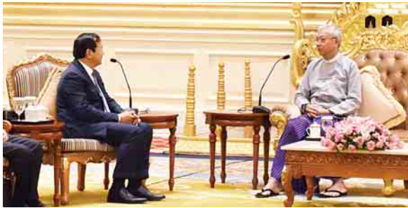
စာမျက်နှာ - ၃

နိုင်ငံတော်သမ္မတ ဦးထင်ကျော် ကမ္ဘောဒီးယား ဝါရင့်ဝန်ကြီး မစ္စတာ ပရတ်ဆုတ်ခွန်းအား လက်ခံတွေ့ဆုံ