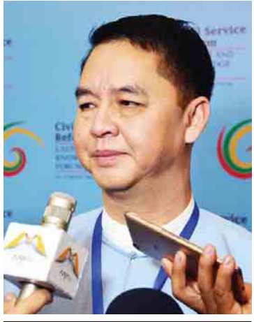
ဦးကျော်စိုး

နိုင်ငံ့ဝန်ထမ်းအုပ်ချုပ်မှုပုံစံသစ်၊ ပြည်သူ့ပုဂ္ဂိုလ်ပြုပြင်နိုင်ငံ့ဝန်ထမ်းများဖြစ်လာစေရန် ခေါင်းဆောင်မှုပေးနိုင်သည့် အရည်အသွေးများနှင့် စွမ်းဆောင်ရည်များကို မြှင့်တင်ခြင်း၊ အရည်အချင်းကိုအခြေခံ၍ စွမ်းဆောင်ရည်ရှိမှုကို ဦးစားပေးသော အလေ့အထနှင့် စနစ်များနှင့် နိုင်ငံ့ဝန်ထမ်းကဏ္ဍ၏ ပွင့်လင်းမြင်သာမှုနှင့် တာဝန်ခံမှု/တာဝန်ယူမှု စသည့်နယ်ပယ်လေးခုကို ဦးတည်ဆောင်ရွက်မည့် နိုင်ငံ့ဝန်ထမ်းပြုပြင်ပြောင်းလဲရေး မဟာဗျူဟာစီမံချက် ထုတ်ပြန်ကြေညာသည့် အခမ်းအနားကို ဇူလိုင် ၁၀ ရက်က နေပြည်တော်ရှိ မြန်မာအပြည်ပြည်ဆိုင်ရာကွန်ဗင်းနင်းဗဟိုဌာန-၂ ၌ ကျင်းပခဲ့သည်။ နိုင်ငံ့ဝန်ထမ်းကဏ္ဍပြုပြင်ပြောင်းလဲရေးအတွက် မျှော်မှန်းချက်အား ၂၀၁၆ ခုနှစ် ဩဂုတ် ၂၅ ရက်နှင့် ၂၆ ရက်တို့တွင် ကျင်းပခဲ့သော နိုင်ငံ့ဝန်ထမ်းပြုပြင်ပြောင်းလဲမှု ပထမအကြိမ် အကြံပြုအလုပ်ရုံဆွေးနွေးပွဲတွင် အတည်ပြုခဲ့ခြင်းဖြစ်ပြီး နိုင်ငံ့ဝန်ထမ်းပြုပြင်ပြောင်းလဲမှုဆိုင်ရာ မဟာဗျူဟာစီမံချက်အား ထုတ်ပြန်ခြင်းအခမ်းအနားကို သုံးရက်ကြာ ကျင်းပမည်ဖြစ်ရာ အဆိုပါအခမ်းအနားသို့ တက်ရောက်လာသူတချို့အား မေးမြန်းဖြစ်ခဲ့သည်-