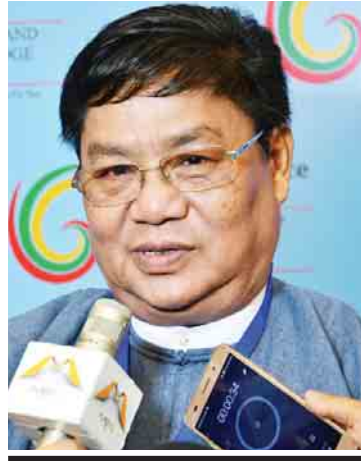
ဦးစောပယ်လင်တိုင်း