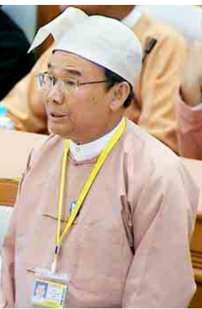
ပြည်ထောင်စုဝန်ကြီး ဦးအုန်းဝင်း

အဆိုပါကိစ္စများနှင့်စပ်လျဉ်း၍ ဆွေးနွေးလိုသည့်