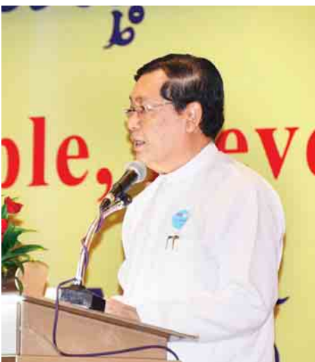
ဦးသိန်းဆွေ(ပြည်ထောင်စုဝန်ကြီး)

ခေတ်မီသားဆက်ခြားနည်းလမ်းများကို ရရှိအသုံးပြုနိုင်ခဲ့မည်ဆိုပါက ကမ္ဘာတစ်ဝန်းမှ သန်း(၆၀)သော အမျိုးသမီးများအနေဖြင့် မလိုချင်ဘဲ ကိုယ်ဝန်ဆောင်ခြင်းကို ကာကွယ်နိုင်မည်ဖြစ်ပါကြောင်း၊ ထို့ပြင် ၂၀၁၆ ခုနှစ်