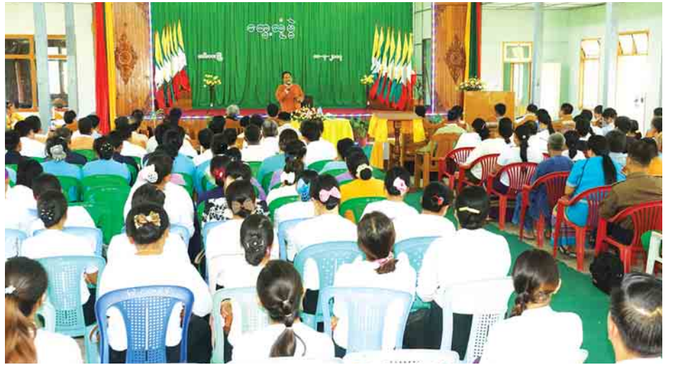
လူမှုရေးအသင်းအဖွဲ့ဝင်များ၊ နိုင်ငံရေးပါတီဝင်များ၊ ပြည်သူ့လူထု စုစုပေါင်းအင်အား ၁၅၀ ခန့်တက်ရောက်ခဲ့ လင်းခေးမြို့မိမြို့ဖများ၊ ကျေးရွာ ရပ်မိရပ်ဖများ၊ မြို့နယ် ရှမ်းစာပေနှင့် ယဉ်ကျေးမှုအဖွဲ့ ဥက္ကဋ္ဌနှင့် အဖွဲ့ဝင်များ၊ မြို့နယ်အတွင်းရှိ ကျောင်းဆရာ ဆရာမများနှင့် ဒေသခံ

တွေ့ဆုံပွဲသို့ ရှမ်းပြည်နယ် စီမံကိန်းနှင့် စီးပွားရေးဝန်ကြီး၊ ပြည်နယ်စီမံကိန်းရေးဆွဲရေးဦးစီးဌာနမှ ပြည်နယ်မှူးနှင့် တာဝန်ရှိသူများ၊ လင်းခေးခရိုင်အုပ်ချုပ်ရေးမှူး၊ မြို့နယ် အုပ်ချုပ်ရေးမှူး၊ ပြည်နယ်လွှတ်တော်ကိုယ်စားလှယ်များ၊ ခရိုင်နှင့်မြို့နယ်အဆင့် ဌာနဆိုင်ရာတာဝန်ရှိသူများ၊