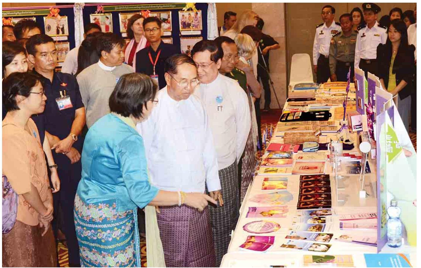
ကမ္ဘာ့လူဦးရေနေ့အထိမ်းအမှတ်အခမ်းအနား၌ ခင်းကျင်းပြသထားမှုများကို ဒုတိယသမ္မတ ဦးမြင့်ဆွေ လှည့်လည်ကြည့်ရှုစဉ်။