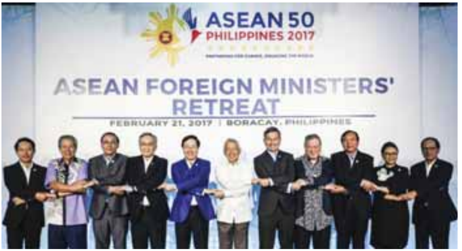
၂၀၁၇ ခုနှစ်၊ ဖေဖော်ဝါရီလအတွင်း ဖိလစ်ပိုင်နိုင်ငံတွင် ကျင်းပပြုလုပ်ခဲ့သည့် အာဆီယံနိုင်ငံခြားရေးဝန်ကြီးများအစည်းအဝေးတွင် နိုင်ငံခြားရေးဝန်ကြီးများ အမှတ်တရဓာတ်ပုံရိုက်ကူးစဉ်