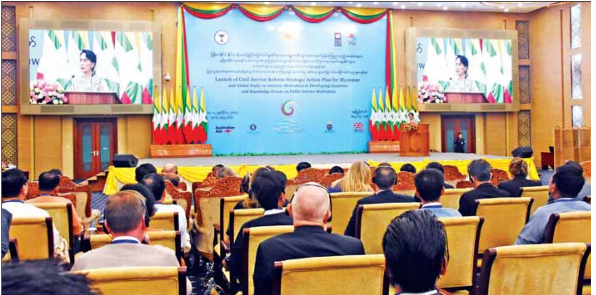
မြန်မာနိုင်ငံ နိုင်ငံ့ဝန်ထမ်းပြုပြင်ပြောင်းလဲမှုဆိုင်ရာ မဟာဗျူဟာစီမံချက်ထုတ်ပြန်ကြေညာသည့် အခမ်းအနားတွင် နိုင်ငံတော်၏အတိုင်ပင်ခံပုဂ္ဂိုလ် ဒေါ်အောင်ဆန်းစုကြည် အမှာစကားပြောကြားစဉ်။