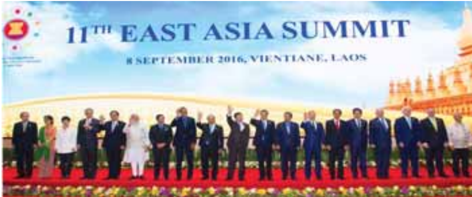
၂၀၁၆ ခုနှစ်၊ စက်တင်ဘာလအတွင်း လာအိုနိုင်ငံတွင် ကျင်းပပြုလုပ်ခဲ့သည့် ၁၁-ကြိမ်မြောက် အရှေ့အာရှထိပ်သီး အစည်းအဝေး

အရှေ့တောင်အာရှဒေသကို ရိုက်ခတ်လာနိုင်တဲ့ အရေးကိစ္စတွေကို အချိန်နဲ့တစ်ပြေးညီ ဆွေးနွေးဖြေရှင်းနိုင်ရေးအတွက် တစ်နှစ်တစ်ကြိမ် တွေ့ဆုံကြဖို့ ဆုံးဖြတ်ခဲ့ပါတယ်။