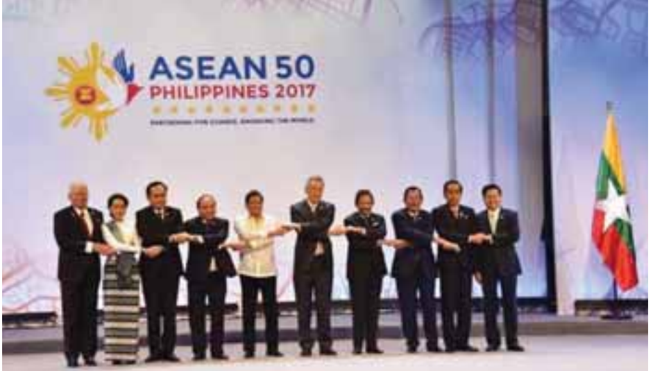
၂၀၁၇ ခုနှစ်၊ ဧပြီလအတွင်း ဖိလစ်ပိုင်နိုင်ငံတွင် ကျင်းပပြုလုပ်ခဲ့သည့် အာဆီယံထိပ်သီးအစည်းအဝေးတွင် ခေါင်းဆောင်များ အမှတ်တရဓာတ်ပုံရိုက်ကူးစဉ်

အာဆီယံဝန်ကြီးအဆင့် အစည်းအဝေးဟာ အာဆီယံအဖွဲ့ကြီးရဲ့ လုပ်ငန်းစဉ်တွေကို ပေါင်းစပ်ညှိနှိုင်းဖို့နဲ့