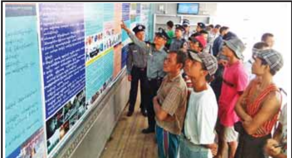
ရန်ကုန်တိုင်းဒေသကြီးရဲတပ်ဖွဲ့က မှုခင်းပညာပေးပြခန်းယာဉ်ဖြင့် တိုင်းဒေသကြီးအတွင်းရှိ မြို့နယ်များသို့ လှည့်လည်၍ မှုခင်းအသိပညာပေးလုပ်ငန်းများ ဆောင်ရွက်လျက်ရှိရာ ဇူလိုင် ၁၀ ရက်က ရန်ကုန်အနောက်ပိုင်းခရိုင်လှိုင်မြို့နယ်တွင် ပြခန်းယာဉ်ဖြင့် မှုခင်းအသိပညာပေးပြသစဉ်။