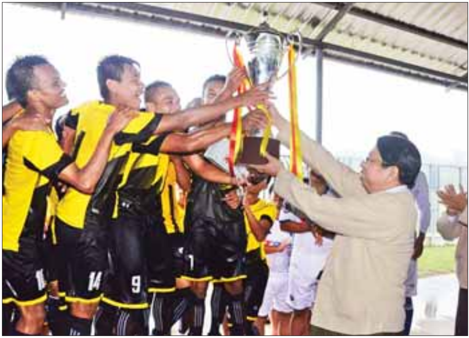
(သတင်းစဉ်)

ပြိုင်ပွဲတွင် သတင်းနှင့်စာနယ်ဇင်းလုပ်ငန်း ဘောလုံး အသင်းက ပြန်ကြားရေးနှင့် ပြည်သူ့ဆက်ဆံရေးဦးစီးဌာန ဘောလုံးအသင်းကို နှစ်ဂိုး-တစ်ဂိုးဖြင့် အနိုင်ရပိုင်ခဲ့သွားပြီး ဆုပေးပွဲကို ဆက်လက်ကျင်းပရာ ပြန်ကြားရေးဝန်ကြီးဌာန ပြည်ထောင်စုဝန်ကြီး ဒေါက်တာဖေမြင့်က ပထမရရှိသော သတင်းနှင့်စာနယ်ဇင်းလုပ်ငန်းအသင်း (ယာပုံ)အား ဆုဖလားကိုလည်းကောင်း၊ အမြဲတမ်းအတွင်းဝန် ဦးမျိုးမြင့် မောင်က ငွေသားဆုကို လည်းကောင်း၊ ဒုတိယရရှိသော ပြန်ကြားရေးနှင့် ပြည်သူ့ဆက်ဆံရေးဦးစီးဌာနအသင်းအား ညွှန်ကြားရေးမှူးချုပ် ဦးမြင့်ထွေးကလည်းကောင်း၊ တတိယ ဆုရရှိသော မြန်မာ့အသံနှင့် ရုပ်မြင်သံကြားအသင်းအား ညွှန်ကြားရေးမှူးချုပ် ဦးမောင်ဖေကလည်းကောင်း ဆုများ ချီးမြှင့်ခဲ့ကြောင်း သိရသည်။