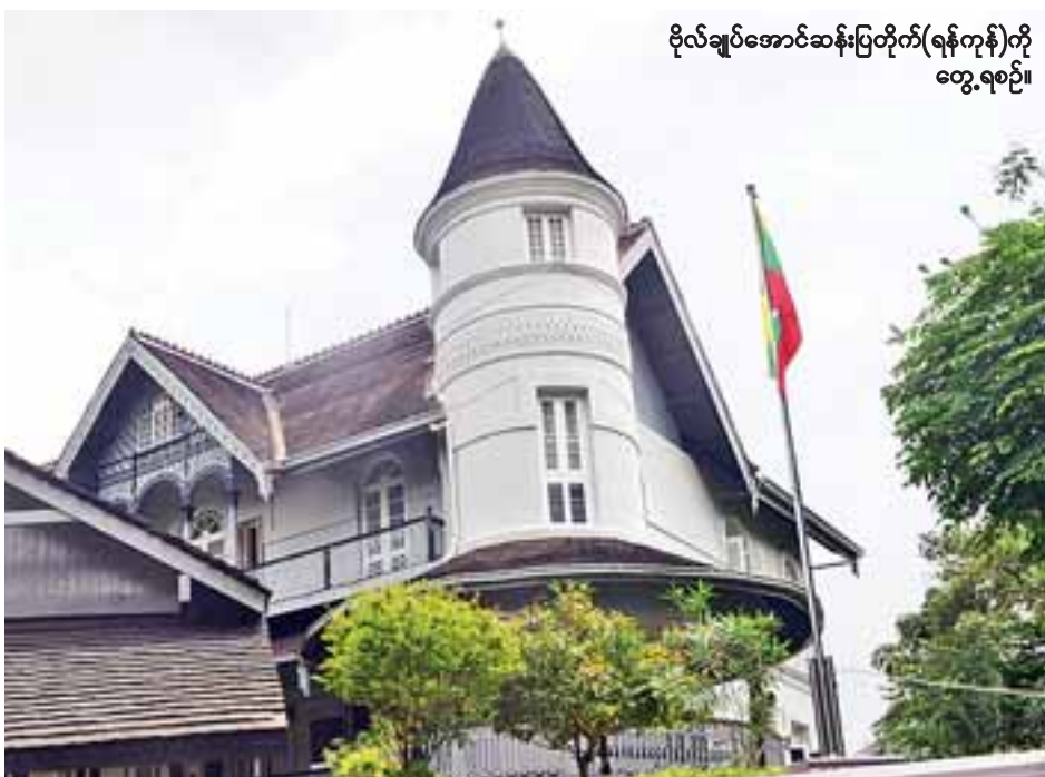
ဗိုလ်ချုပ်အောင်ဆန်းပြတိုက်(ရန်ကုန်)ကို တွေ့ရစဉ်။

မြန်မာအသင်းယှဉ်ပြိုင်မည့် အာရှယူ-၂၃ ခြေစစ်ပွဲအုပ်စု(F)ကို ဇူလိုင် ၁၉ ရက်မှ ၂၃ ရက်အထိ သုဝဏ္ဏကွင်း၌ ကျင်းပမည်ဖြစ်သည်။ သတင်း-ရှိုင်းထက်ဇော်၊ ဓာတ်ပုံ-စိုးညွန့်