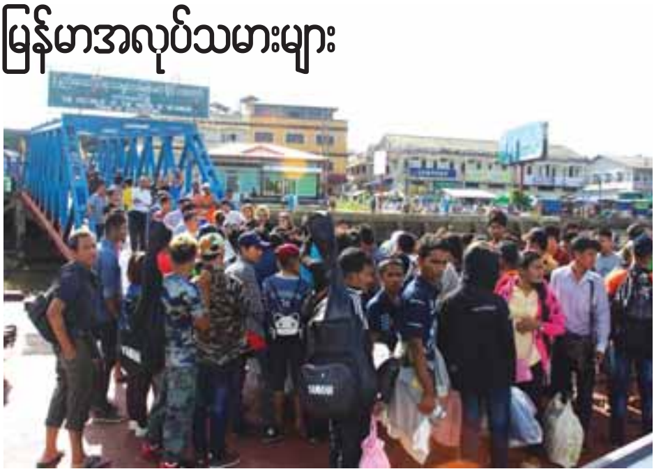
ပွဲစည်းနိုင်ရေး အစီအမံများအား အကြံပြုညှိနှိုင်းရာတွင် ယင်းနောက် ဝန်ကြီးချုပ်သည် ဟိုတယ်နှင့် ခရီးသွား လုပ်ငန်းရှင်များနှင့်အတူ ဆုံကာ တနင်္သာရီတိုင်းဒေသကြီး၏ ပွဲပြားတိုက်လာသည့်ခရီးသွားလုပ်ငန်းနှင့်အတူ နိုင်ငံတော် ဝင်ငွေနှင့် ဒေသပြည်သူများ အလုပ်အကိုင်အခွင့်အလမ်း ပိုမိုရရှိလာရေး နိုင်ငံတကာ ခရီးသွားဧည့်သည်များ စိတ်ဝင်စားနိုင်မည့် ဆက်စပ်သည့် အခြားစီးပွားရေး လုပ်ငန်းများ ဒေသအတွင်း တီထွင်ကြဆောင်ရွက်ခြင်းဖြစ်ကြောင်း သိရသည်။

ဆက်လက်၍ ဝန်ကြီးချုပ်သည် ဧည့်ရိပ်သာခန်းမ၌ ဘာသာပေါင်းစုံအဖွဲ့အစည်းနှင့်အတူ ဆုံပြီး တာဝန်ရှိသူ များသို့ ဒေသတည်ငြိမ်အေးချမ်းရေး၊ ဘာသာအလိုက် ချစ်ကြည်ရင်းနှီးစွာ တိုင်ပင်ညှိနှိုင်းပူးပေါင်း ဆောင်ရွက် ကြရေး၊ တနင်္သာရီတိုင်းဒေသကြီး ဘာသာပေါင်းစုံစည်းလုံး ညီညွတ်ရေးအဖွဲ့တွင် တိုင်းဒေသကြီးအတွင်း ခရိုင် ပေါင်းစုံမှ ဘာသာအလိုက်ကိုယ်စားလှယ်များဖြင့် ပြန်လည်