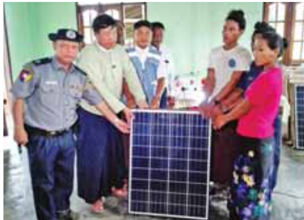
မီးလုံး၊ မီးချောင်းအပါအဝင် တစ်စုံစီထောက်ပံ့ပေးအပ်ခဲ့ခြင်းဖြစ်ပြီး စုစုပေါင်း ၈၇ စုံ ထောက်ပံ့ပေးအပ်ခဲ့ခြင်းဖြစ်ကြောင်း သိရသည်။

ရခိုင်ပြည်နယ်အစိုးရ၏ စီစဉ်မှုဖြင့် မောင်တောမြို့နယ် မြောက်ပိုင်းရှိ တရိန်းကျေးရွာနေပြည်သူများအတွက် မောင်တောမြို့နယ် စီမံခန့်ခွဲမှု ကော်မတီက ဆိုလာပြားများပေးအပ်ပွဲအခမ်းအနားကို ယနေ့မနက်၈:၃၀က အဆိုပါကျေးရွာ မူလတန်းကျောင်း၌ ကျင်းပသည်။ အဆိုပါ အခမ်းအနားသို့ မောင်တောမြို့နယ် အုပ်ချုပ်ရေးမှူး၊ မြို့နယ် ရဲတပ်ဖွဲ့မှူး၊ မြို့နယ်မြေစာရင်း၊ မြို့နယ်စီမံကိန်းဦးစီးဌာနမှူးမှ တာဝန်ရှိသူများ နှင့် ဒေသခံတိုင်းရင်းသားများ တက်ရောက်ကြသည်။ “ဒီဒေသရဲ့ နယ်မြေလုံခြုံရေးဟာ အလွန်ပဲအရေးကြီးပါတယ်။ ဒေသနေပြည်သူတွေရဲ့နယ်မြေလုံခြုံမှု တပ်မတော်နဲ့နယ်ခြားစောင့် ရဲတပ်ဖွဲ့ဝင်တွေက အရှိန်အဟုန်ဖြင့်ဆောင်ရွက်နေသလို ညပိုင်းလုံခြုံမှုဖြစ်စေဖို့ ပြည်နယ် အစိုးရရဲ့ အစီအစဉ်နဲ့ ဆိုလာပြားတွေ လာရောက်ပေးအပ်ခြင်း ဖြစ်ပါတယ်” ဟု မြို့နယ်အုပ်ချုပ်ရေးမှူးက ပြောသည်။ အဆိုပါ ကျေးရွာတွင် ဒေသခံတိုင်းရင်းသားများ စုပေါင်းနေထိုင်ကြပြီး အိမ်ခြေ ၈၄ လုံးရှိကြောင်း၊ ထပ်မံ၍လည်း အိမ်ခြေ ၅၀ တိုးချဲ့သွားမည် ဖြစ်ကြောင်း သိရသည်။ ယခုထောက်ပံ့မှုတွင် တစ်အိမ်ထောင်လျှင်ဆိုလာပြား၊ ဆိုလာဘက်ထရီ