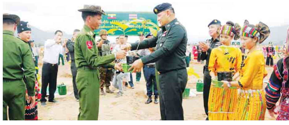
ဝေယံလင်း(မြန်/ဆက်)

အင်အား ၇၀၀ ကျော်တို့က ကျွန်းအပင် ၁၅၀၀ အား စုပေါင်းစိုက်ပျိုးခဲ့သည်။ ထို့အတူ စုပေါင်းသစ်ပင်စိုက်ပျိုးပွဲ ကို နံနက် ၈ နာရီခွဲက ထိုင်းနိုင်ငံ၊ ချင်းရှင်းခရိုင်၊ မယ်ဆိုင် မြို့နယ်၊ ဘန်ပန်းဟကျေးရွာအနီး နယ်မြေတွင် မြန်မာ- ထိုင်းနှစ်နိုင်ငံမှ တာဝန်ရှိသူများနှင့် ထိုင်းပြည်သူများ ပါဝင်ကာ ကျွန်း၊ ပိတောက်၊ စွယ်တော် အပင် ၂၀၀၀ ကျော် အား စုပေါင်းစိုက်ပျိုးခဲ့သည်။