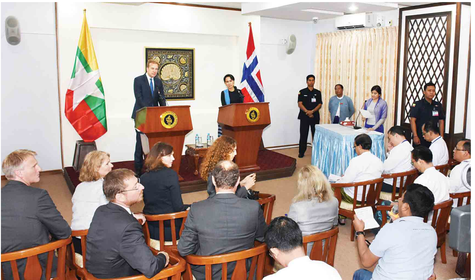
နိုင်ငံတော်၏အတိုင်ပင်ခံပုဂ္ဂိုလ် နိုင်ငံခြားရေးဝန်ကြီးဌာန ပြည်ထောင်စုဝန်ကြီး ဒေါ်အောင်ဆန်းစုကြည်နှင့် နော်ဝေနိုင်ငံ နိုင်ငံခြားရေးဝန်ကြီး H.E. Mr. Borge Brende တို့ ပြည်တွင်းပြည်ပ သတင်းမီဒီယာများ၏မေးမြန်းချက်များကို ပြန်လည်ရှင်းလင်းဖြေကြားကြစဉ်။

နေပြည်တော် ဇူလိုင် ၆ နိုင်ငံတော်၏အတိုင်ပင်ခံပုဂ္ဂိုလ် နိုင်ငံခြားရေးဝန်ကြီးဌာန ပြည်ထောင်စုဝန်ကြီး ဒေါ်အောင်ဆန်းစုကြည်သည် နော်ဝေနိုင်ငံခြားရေးဝန်ကြီး H.E. Mr.Borge Brende အား ယနေ့ နံနက် ၉ နာရီခွဲတွင် နေပြည်တော်ရှိ နိုင်ငံခြားရေးဝန်ကြီးဌာန၌ လက်ခံ တွေ့ဆုံသည်။ တွေ့ဆုံစဉ် မြန်မာနိုင်ငံ၏ ငြိမ်းချမ်းရေးလုပ်ငန်းစဉ်နှင့် ဒီမိုကရေစီအသွင်ကူးပြောင်းရေးလုပ်ငန်းစဉ် တောင့်တင်းခိုင်မာစေရေးနှင့် နှစ်နိုင်ငံဆက်ဆံရေးနှင့် ပူးပေါင်းဆောင်ရွက်မှုတိုးမြှင့်ရေးဆိုင်ရာ ကိစ္စရပ်များကို အမြင်ချင်းဖလှယ်ဆွေးနွေးခဲ့ကြသည်။ တွေ့ဆုံပွဲအပြီးတွင် မြန်မာ-နော်ဝေ နှစ်နိုင်ငံ သတင်းစာရှင်းလင်းပွဲကို ဆက်လက်ကျင်းပရာ နိုင်ငံတော်၏ အတိုင်ပင်ခံပုဂ္ဂိုလ် နိုင်ငံခြားရေးဝန်ကြီးဌာန ပြည်ထောင်စုဝန်ကြီး ဒေါ်အောင်ဆန်းစုကြည်က မြန်မာနိုင်ငံနှင့် နော်ဝေနိုင်ငံတို့သည် ဆက်ဆံရေး အလွန်ကောင်းမွန်ပါကြောင်း၊ မြန်မာနိုင်ငံသည် ဒီမိုကရေစီအသွင်ကူးပြောင်းရေးကို လုပ်ဆောင်နေဆဲဖြစ်ပါကြောင်း၊ မြန်မာနိုင်ငံ၏ စာမျက်နှာ ၃ တော်လ ၅ သို့