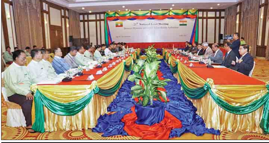
(၂၁)ကြိမ်မြောက် မြန်မာ-အိန္ဒိယနယ်စပ် နယ်ဘက်အာဏာပိုင်များ၏ နိုင်ငံတော်အဆင့်အစည်းအဝေးကျင်းပစဉ်။ (သတင်းစဉ်)

ဖြစ်သည်။ အစည်းအဝေးတွင် နှစ်နိုင်ငံကိုယ်စားလှယ်အဖွဲ့ ခေါင်းဆောင်များက အဖွင့်အမှာစကားပြောကြားကြပြီး လုံခြုံရေးဆိုင်ရာကိစ္စရပ်များ၊ မူးယစ်ဆေးဝါးတားဆီး နှိမ်နင်းရေးကိစ္စရပ်များ၊ နယ်နိမိတ်စီမံခန့်ခွဲရေးကိစ္စရပ်များ၊ အိန္ဒိယနိုင်ငံအကျဉ်းထောင်ရှိ ရေလုပ်သားများအပါအဝင် မြန်မာနိုင်ငံသားများကိစ္စနှင့် မြန်မာနိုင်ငံ အကျဉ်းထောင်ရှိ အိန္ဒိယနိုင်ငံသားများဆိုင်ရာကိစ္စရပ်များ၊ သဘာဝသားငှက်တိရစ္ဆာန် တရားမဝင်ရောင်းဝယ်မှုကိစ္စရပ်များစသည့် နှစ်နိုင်ငံအကြား ပူးပေါင်းဆောင်ရွက်မည့် အထွေထွေကိစ္စရပ်များအား နှစ်နိုင်ငံချစ်ကြည်ရင်းနှီးမှုကို ရှေးရှု၍ ဆွေးနွေးခဲ့ကြသည်။ ထို့နောက်(၂၁)ကြိမ်မြောက် မြန်မာ-အိန္ဒိယနယ်စပ် နယ်ဘက်အာဏာပိုင်များ၏ နိုင်ငံတော်အဆင့် အစည်းအဝေး သဘောတူညီမှုမှတ်တမ်းကို နှစ်နိုင်ငံကိုယ်စားလှယ်အဖွဲ့ခေါင်းဆောင်များက လက်မှတ်ရေးထိုးလဲလှယ်ခဲ့ကြကြောင်း သတင်းရရှိသည်။ (သတင်းစဉ်)