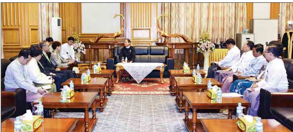
ဘဏ်က အကူအညီပေးပေးနိုင်ရေးတို့ နိုင်ငံတို့အကြား ပူးပေါင်းဆောင်ရွက်မှု ပိုမိုမြှင့်တင်နိုင်ရေးကို စွဲစွပ်စွပ်စွပ်အား ဆွေးနွေးခဲ့ကြကြောင်း သတင်းရရှိသည်။ (သတင်းစဉ်)

နေပြည်တော် ဇူလိုင် ၆ ပြည်သူ့လွှတ်တော်ဥက္ကဋ္ဌ ဦးဝင်းမြင့်သည် ကမ္ဘာ့ဘဏ်၏ မြန်မာ၊ လာအိုနှင့် ကမ္ဘောဒီးယားနိုင်ငံဆိုင်ရာ ညွှန်ကြားရေးမှူး Ms. Ellen Goldstein နှင့် အဖွဲ့အား ယနေ့ မွန်းလွဲ ၂ နာရီတွင် နေပြည်တော်ရှိ လွှတ်တော်အဆောက်အအုံ ပြည်သူ့လွှတ်တော်ဧည့်ခန်းမဆောင်၌ လက်ခံတွေ့ဆုံသည်။ တွေ့ဆုံစဉ် ကျေးလက်နေပြည်သူများ ဖွံ့ဖြိုးတိုးတက်ရေးအတွက် လမ်းပန်းဆက်သွယ်ရေး၊ လျှပ်စစ်မီးရရှိရေး၊ ပညာရေး၊ ကျန်းမာရေး၊ SME လုပ်ငန်းများဖွံ့ဖြိုးရေးတို့တွင် ကမ္ဘာ့