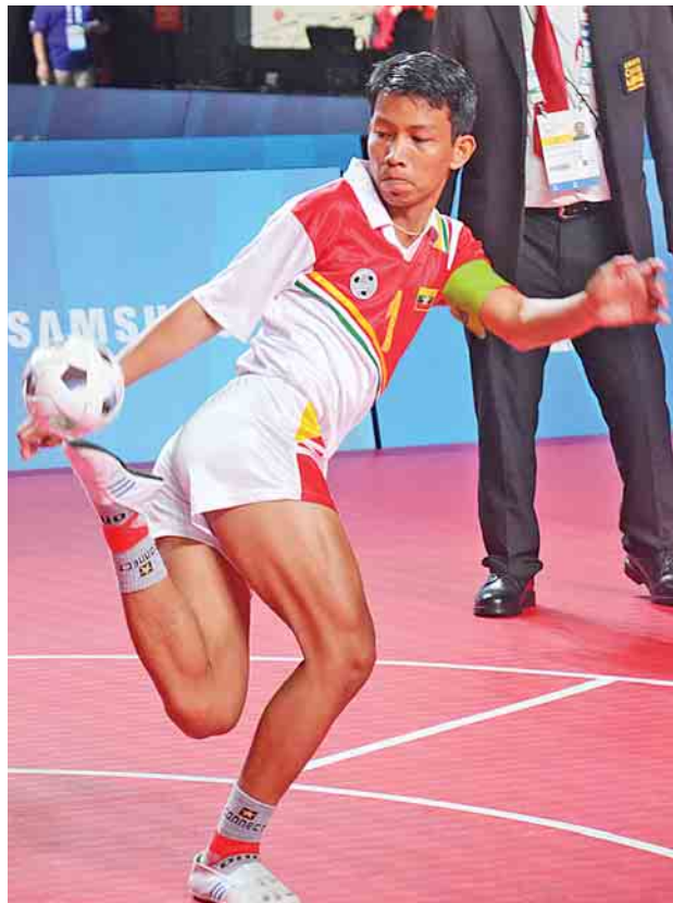
(၂၈)ကြိမ်မြောက် ဆီးဂိမ်းပြိုင်ပွဲ၌ ရွှေဆုရခဲ့သည့် ခြင်းလုံးအသင်း။