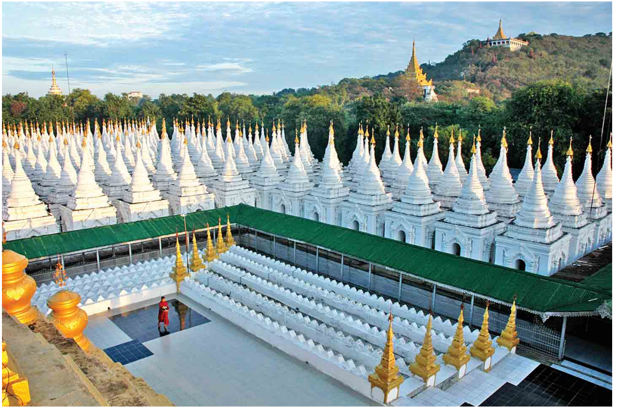
အောင်မြေသာစံမြို့နယ်အတွင်းရှိ ရှေးဟောင်းအထိမ်းအမှတ်အဆောက်အအုံ မဟာလောကမာရဇိန် ကုသိုလ်တော်ဘုရားအား တွေ့မြင်ရစဉ်။

ထို့ပြင် NCA ကို အကောင်အထည်ဖော်ရာ၌ အစိုးရ၊ တပ်မတော်နှင့် NCA-S-EAO များအကြား NCA အပေါ် နားလည်မှုနှင့် အဓိပ္ပာယ် ဖွင့်ဆိုမှု မတူညီကြောင်းကို စာမျက်နှာ ၁၄ ကော်လံ ၁ သို့ ၀