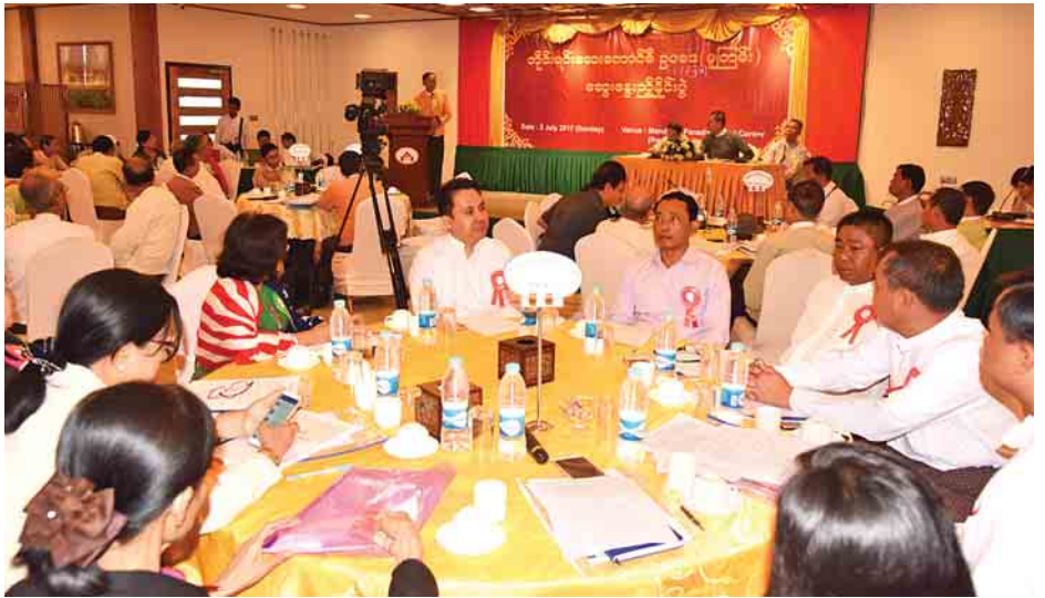
ကာလနှင့် လိုက်လျောညီထွေမှုမရှိခြင်း၊ ဗဟိုဦးစီးချုပ်ကိုင်မှုစနစ် များပြားနေခြင်းတို့ကြောင့် ပြည်သူ့ကို ဗဟိုပြုသော ဥပဒေဖြစ်စေရန် အသစ်ရေးဆွဲခဲ့ခြင်းဖြစ်ကြောင်း အဆိုပါ ဆွေးနွေးပွဲမှ သိရသည်။ အခမ်းအနားသို့ တိုင်းရင်းဆေးပညာဦးစီးဌာန၊

ယခင်တိုင်းရင်းဆေးကောင်စီဥပဒေကို ၂၀၀၀ ပြည့်နှစ်က အတည်ပြုပြဋ္ဌာန်းခဲ့ပြီး အဆိုပါဥပဒေမှာ ခေတ်