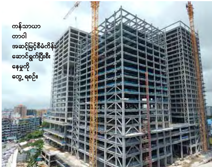
ကန်သာယာတာဝါ အဆင့်မြင့်စီမံကိန်း ဆောင်ရွက်ပြီးစီးနေမှုကို တွေ့ရစဉ်။

ရန်ကုန်တိုင်းဒေသကြီးအတွင်း၌ မြို့ပြအင်္ဂါရပ်များ ဖွံ့ဖြိုးတိုးတက်လာပြီဖြစ်ရာ ယခုအခါ ငလျင်ဒဏ်အပြည့်အဝခံနိုင်သည့် မြန်မာနိုင်ငံတွင် ပထမဦးဆုံး Steel Structure ဖြင့် ဆောက်လုပ်နေသော စင်ကာပူနိုင်ငံ၏နည်းပညာဖြင့် အမေရိကန်ဒေါ်လာသန်း ၂၀၀ အကုန်အကျခံတည်ဆောက်နေသည့် ကန်သာယာတာဝါအဆင့်မြင့်စီမံကိန်းမှာ ယခုအခါ စီမံကိန်းတစ်ခုလုံး၏ ဆောက်လုပ်ပြီးစီးမှု ၇၀ ရာခိုင်နှုန်း ဆောင်ရွက်ပြီးစီးနေပြီဖြစ်သည်။ အဆိုပါစီမံကိန်းကို ရန်ကုန်မြို့တော်စည်ပင်သာယာရေးကော်မတီနှင့် Asia Myanmar Consortium Development ကုမ္ပဏီလီမိတက်တို့မှ အကျိုးတူပူးပေါင်းဆောင်ရွက် တည်ဆောက်နေခြင်းဖြစ်ပြီး အဆိုပါ ကန်သာယာတာဝါအဆင့်မြင့်စီမံကိန်း တည်နေရာမှာ မင်္ဂလာတောင်ညွန့်မြို့နယ်ရှိ ကန်ရိပ်သာလမ်းနှင့် ဦးအောင်မြတ်လမ်းထောင့် (သိမ်ဖြူယာဉ်မောင်းသင်တန်းကျောင်းနေရာ) တွင်တည်ရှိကာ မြေဧရိယာအကျယ်အဝန်း ၃ ဒသမ ၅၂ ဧကပေါ်တွင် တည်ဆောက်လျက်ရှိကြောင်းနှင့် စီမံကိန်းဧရိယာအတွင်း အရေးပေါ်မီးသတ်စနစ်အတွက် Fire Lift များ ထည့်သွင်းဆောက်လုပ်ထားကြောင်း