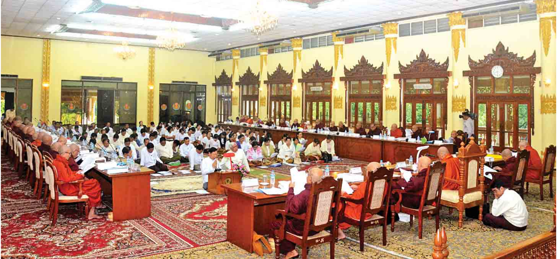
သတ္တမအကြိမ် နိုင်ငံတော်သံယမဟာနာယကအဖွဲ့ (၄၇)ပါးစုံညီ စုဒ္ဒသမအစည်းအဝေး ပထမနေ့ ကျင်းပစဉ်။