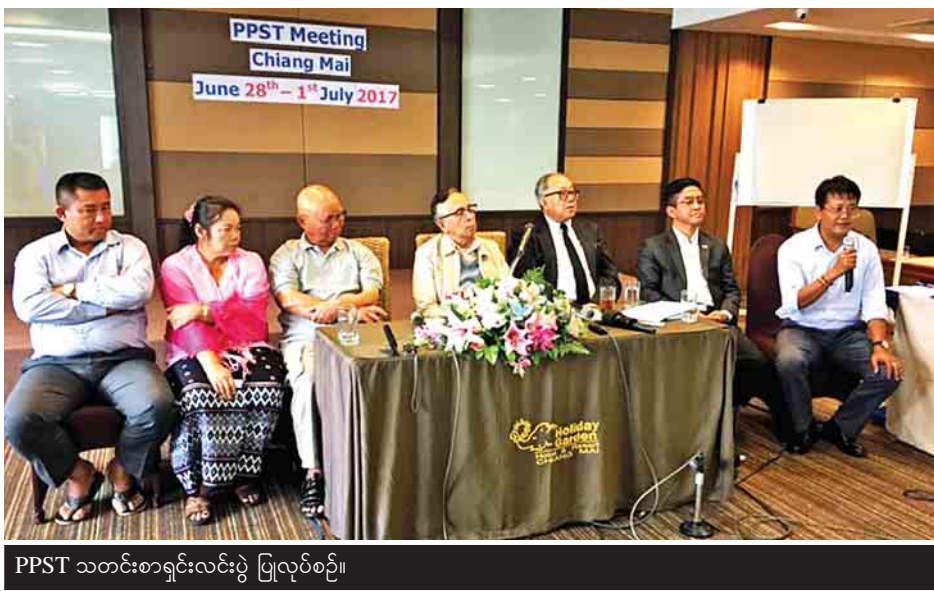
PPST သတင်းစာရှင်းလင်းပွဲ ပြုလုပ်စဉ်။