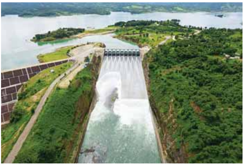
ကန်ရေပြည့်မှတ်ရောက်ရှိနေသည့် ကြီးအုံကြီးဝရေလှောင်တံကို တွေ့ရစဉ်။

ဖြစ်ပြီး တံမံအလျား ပေ ၃၂၈၀၊ အမြင့် ၁၆၄ ပေရှိပြီး ကန်ရေပြည့်ရေလှောင်ပမာဏ စကပေ ၃၁၉၇၀၀ ရှိသည်။ ပင်မရေပိုလွှဲတွင် အကျယ် ၃၂၆ ပေရှိပြီး အကူရေပိုလွှဲတွင် အကျယ် ပေ ၂၅၀ ကို ၂၀၁၆ ခုနှစ်တွင် အကျယ် ပေ ၂၀၀ တိုးချဲ့ထားသည့်အတွက် စုစုပေါင်း ပေ ၄၅၀ အကျယ်ရှိသည်။ ကြီးအုံကြီးဝရေလှောင်တံမံ လျှပ်စစ်ဓာတ်အားပေးစက်ရုံမှ ရေထုတ်လွှတ်ခြင်း၊ စိုက်ပျိုးရေးရေထုတ်ပေါက်မှ ရေထုတ်လွှတ်ခြင်းနှင့် ကန်ရေပြည့် ရေလှောင်ပမာဏထက် ကျော်လွန်လာပါက ပင်မရေပိုလွှဲနှင့် အကူရေပိုလွှဲတို့မှ ရေကျော်ကျခြင်းဟူ၍ ရေထုတ်ပေါက် လေးခုဖြင့် တံမံကြိုင်ကောင်းမွန်ရေး စီမံဆောင်ရွက်ထားရှိပြီးဖြစ်သည်။