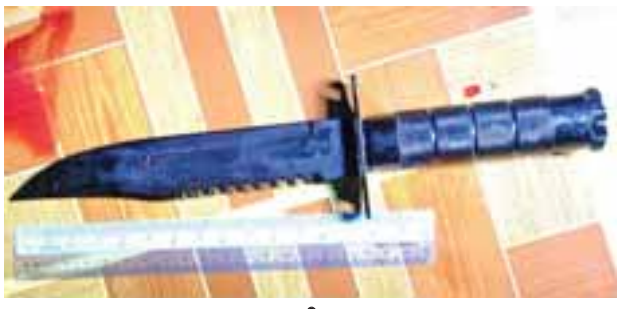
သက်သေခံစား

နေပြည်တော် ဇွန် ၂၉ မင်္ဂလာဒုံမြို့နယ် ထောက်ကြံ့နယ်မြေရဲစခန်းအပိုင်တွင် ဖြစ်ပွားခဲ့သော လေးလောင်းပြိုင်လူသတ်မှုနှင့် ပတ်သက်၍ မြန်မာနိုင်ငံရဲတပ်ဖွဲ့မှ သတင်းတစ်ရပ် ထုတ်ပြန်လိုက်သည်။