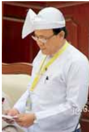
နိုင်ငံခြားရေးဝန်ကြီးဌာန ဒုတိယဝန်ကြီး ဦးကျော်တင်

နိုင်ငံတကာ အချက်အလက်ရှာဖွေဖော်ထုတ်ရေး မစ်ရှင် (Fact Finding Mission) ဖွဲ့စည်းခြင်းသည် ပြဿနာဖြေရှင်းရေးအတွက် အထောက်အကူဖြစ်မည် မဟုတ်သည့်အပြင် အသိုင်းအဝိုင်းနှစ်ရပ်အကြား တင်းမာမှုပြဿနာရပ်ကို ပိုမိုကြီးထွားလာစေမည်ဖြစ်ခြင်း၊ လက်ရှိပုဂ္ဂိုလ်အခြေအနေများနှင့် ကိုက်ညီမှုမရှိခြင်း၊ နိုင်ငံတော်အစိုးရအနေဖြင့် ရခိုင်ပြည်နယ်တွင် အေးချမ်း တည်ငြိမ်ရေးနှင့် ရေရှည်တည်တံ့သော ဖြေရှင်းချက်များ ရရှိရေးအတွက် အလေးထားကြိုးပမ်းဖြေရှင်းနေခြင်း၊ ဒုတိယသမ္မတ ဦးဆောင်သော လွတ်လပ်သောကော်မရှင် တစ်ခုဖွဲ့စည်းပြီး ကြိုးပမ်းဖြေရှင်းနေသည့်အတွက် အဆိုပါ ဆုံးဖြတ်ချက်တစ်ရပ်လုံးကို သဘောတူလက်ခံပါဝင်ခြင်း မရှိကြောင်း၊ Dissociate ပြုလုပ်ကြောင်းကို ပြတ်ပြတ် သားသားပြောကြားခဲ့ပြီးဖြစ်ပါကြောင်း၊ နိုင်ငံခြားရေး