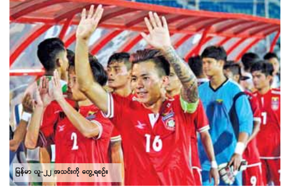
မြန်မာ ယူ-၂၂ အသင်းကို တွေ့ရစဉ်။

ထပ်မံအနိုင်ရပါက ချန်ပီယံဆုရယူနိုင်ရန် အခြေအနေ ကောင်းသွားမည်ဖြစ်သည်။ ဒုတိယနေ့ပွဲစဉ်များအဖြစ် ညနေ ၃ နာရီတွင် ဂျပန်တက္ကသိုလ်အသင်းနှင့် ကမ္ဘောဒီးယား ယူ-၂၂ အသင်း၊ ညနေ ၆ နာရီတွင် မြန်မာ ယူ-၂၂ အသင်းနှင့် ဟောင်ကောင် ယူ-၂၂ အသင်းတို့ ယှဉ်ပြိုင်ကစားမည် ဖြစ်သည်။ စာမျက်နှာ ၁၁ ကော်လံ ၁ သို့ ☺