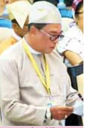
ဒုတိယဝန်ကြီး ဦးကျော်လင်း

ရမ်းပြည်နယ် မဲဆန္ဒနယ်အမှတ်(၉)မှ ဦးခွန်သိန်းဖေ၏ တောင်ကြီးမြို့နယ် ကျောက်တစ်လုံးကြီးမြို့နယ်ခွဲရှိ နောင်ကားကျေးရွာ၊ တနိုင်ဖက်ကွန်ကျေးရွာ၊ ညောင်ခမ်းကျေးရွာနှင့် ညောင်ရွှေမြို့နယ်ရှိ လွယ်ခေါ်ကျေးရွာသို့ ဆက်သွယ် လျက်ရှိသည့် အတိုဆုံးလမ်းဖြစ်သည့် မြို့နယ်ချင်းဆက် လမ်းမကြီးကို နိုင်ငံတော်မှ သတ်မှတ်ထားသည့် လမ်းဧရိယာ အကျယ်ပေးအတိုင်း မြေသား လမ်းကို လာမည့်ဘဏ္ဍာရေးနှစ်တွင် ဖောက်လုပ်ပေးရန် အစီအစဉ် ရှိ မရှိ မေးခွန်းနှင့်စပ်လျဉ်း၍ ဒုတိယဝန်ကြီး ဦးကျော်လင်းက တောင်ကြီးမြို့နယ် ကျောက်တစ်လုံးကြီးမြို့နယ်ခွဲရှိ နောင်ကား-တနိုင်ဖက်ကွန်-ညောင်ခမ်းမှ