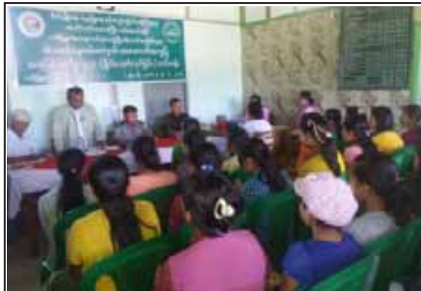
ကနီမြို့နယ် ကျေးလက်ဒေသဖွံ့ဖြိုးတိုးတက်ရေးဦးစီးဌာန အသက်မွေး ဝမ်းကျောင်းအထောက်အကူပြု အခြေခံလက်မှုပညာ(ခြင်းရက်လုပ်ခြင်း) သင်တန်းကို ဇွန် ၂၈ ရက်က ဖွင့်လှစ်ရာ မြို့နယ်ဦးစီးပွား ဦးကျော်ဆိုင် အဖွင့်အမှာစကားပြောကြားစဉ်။ (ကနီကျေးလက်)

မိန့်ကြားတော်မူပြီး သင်တန်းသား သံယာတော် ၉၉ ပါးတို့ကို သင်တန်း ဆင်းလက်မှတ်များ ဆက်ကပ်လျှူဒါန်း ကြသည်။ ထို့နောက် သင်တန်းအတွက် လိုအပ်သော အရက်ဆွမ်း၊ နေ့ဆွမ်း၊ ဖျော်ရည်နှင့် သင်တန်းသားသုံး စာရေး ကိရိယာများနှင့် အခြားလိုအပ်သည် များ လျှူဒါန်းကြသော အလှူရှင် များကို ပြည်နယ်လူမှုရေးဝန်ကြီး ဒေါက်တာထိန်လင်းက ဂုဏ်ပြု မှတ်တမ်းလွှာများ ပေးအပ်ချီးမြှင့်ပြီး အခမ်းအနားသို့ ပြည်နယ်တရား လွှတ်တော် တရားသူကြီးချုပ် ဦးခင်မောင်ကြီး၊ ပြည်နယ်ဝန်ကြီး များနှင့် တာဝန်ရှိသူများ တက်ရောက် ကြသည်။ ပြည်နယ်(ပြန်/ဆက်)