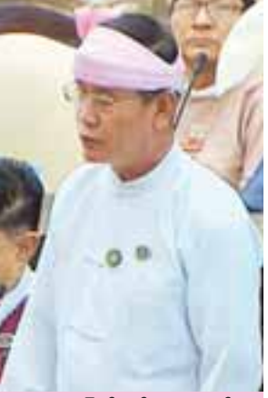
ကယားပြည်နယ် မဲဆန္ဒနယ် အမှတ်(၈)မှ ဦးကျော်သန်း

ညောင်ရွှေမြို့နယ်ရှိ လွယ်ခေါ်ကျေးရွာသို့ ဆက်သွယ်သည့်လမ်း ၇ မိုင် ၅ ဖာလုံအနက် ၅ မိုင် ၇ ဖာလုံအား မြေသားလမ်းချဲ့ထွင်ခြင်း အပါအဝင် ကျောက်ချောလမ်းအဖြစ် အဆင့်မြှင့်တင် ဆောင်ရွက်ရန်နှင့် ၎င်းလမ်းပိုင်းတွင် လိုအပ်သော ရေပြန်ကူးစင်းအား ၂၀၁၈-၂၀၁၉ ဘဏ္ဍာနှစ်တွင် ပြည်နယ် ဘတ်ဂျက်မှ လျာထားပြီး ဘဏ္ဍာငွေခွဲဝေရရှိမှုအပေါ်မူတည်၍ ဆောင်ရွက် ပေးသွားမည်ဖြစ်ပါကြောင်း ဖြေကြားသည်။ ထို့ပြင် ကယားပြည်နယ် မဲဆန္ဒနယ်အမှတ်(၈)မှ ဦးကျော်သန်းနှင့်