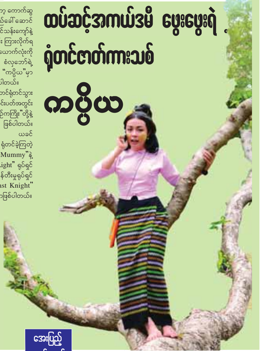
အေးပြည့် စုစည်းသည်