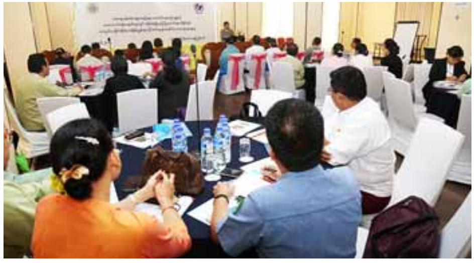
ပြည်ထောင်စုဝန်ကြီး ဒေါက်တာ ဝင်းမြတ်အေး အမှာစကား ပြောကြားစဉ်။

အောင်ဆန်းစုကြည် နိုင်ငံတော်၏အတိုင်ပင်ခံပုဂ္ဂိုလ်