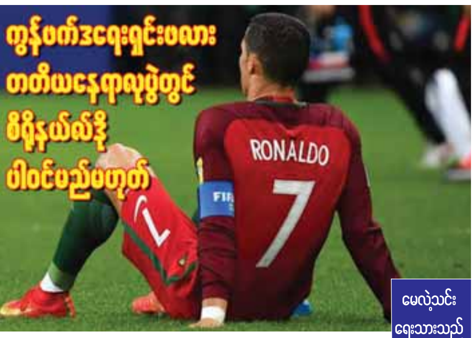
ကွန်ဖက်ဒရေရှင်းဖလား တတိယနေရာလှည့်တွင် စီရိုနယ်လ်ဒို ပါဝင်ပည့်မဟုတ်

စီရိုနယ်လ်ဒိုက ချီလီအသင်းကို ပင်နယ်တီ အဆုံးအဖြတ်ဖြင့် အရေးနိမ့်ခဲ့ခြင်းအတွက် စိတ်ပျက် မိကြောင်း ဆိုခဲ့သလို တတိယနေရာလှည့်ကို ပါဝင်တော့မည်မဟုတ်ကြောင်း အတည်ပြုခဲ့သည်။ အစော ပိုင်းက အငှားကုန်ဖြင့် အမြာသားတစ်ဦး၊ သမီးတစ်ဦး မွေးဖွားခဲ့သည်ဟု သတင်းများထွက်ပေါ်ခဲ့သော်လည်း ယခုမှ သားယောက်ျားလေးနှစ်ဦးသာ ဖြစ်နေခြင်းဖြစ်သည်။ စီရိုနယ်လ်ဒိုတွင် ခရစ္စတီယာနို ဂျူနီယာ အမည်ရ သားတစ်ဦးရှိနေပြီဖြစ်ပြီး ယခုဇွန်လအတွင်းမှာပင် အသက်ခုနှစ်နှစ်ပြည့်မြောက်ခဲ့ပြီဖြစ်သည်။ ထို့ပြင် စီရိုနယ်လ်ဒို၏ ချစ်သူ အသက်(၂၂)နှစ်အရွယ် ဂျော်ဂျီနာ ရိုဒရီဂွက်ဇ်မှာလည်း ကိုယ်ဝန်ငါးလ လွယ်ထားရပြီဖြစ်ကြောင်း သတင်းများထွက်နေရာ ယင်းကိစ္စရပ်သာ မှန်ကန်သည်ဆိုပါက စီရိုနယ်လ်ဒိုမှာ တစ်နှစ်အတွင်း ကလေးသုံးဦး ထပ်တိုးပိုင်ဆိုင်သည့် ဖခင်ဖြစ်လာမည်ဖြစ်သည်။