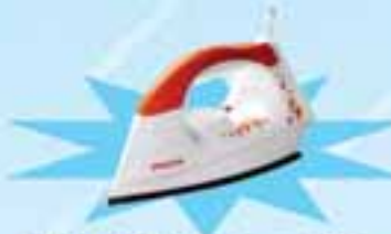
PHILIPS GC 1418/02

ဖော်ပြပါပစ္စည်းဝယ်ယူပြီး ကျပ် ၂၁,၀၀၀ တန်ဖိုးရှိ Iron ရယူလိုက်ပါ