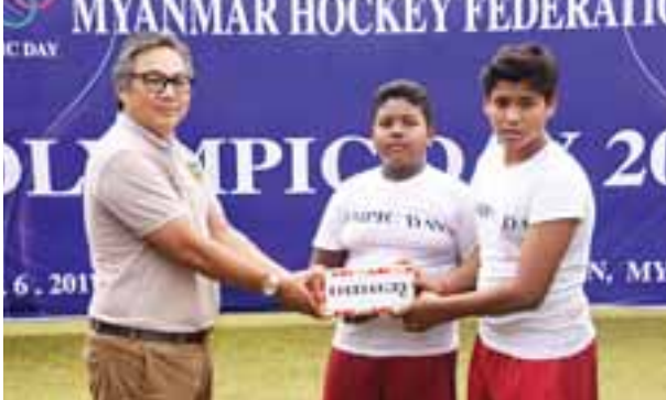
သတင်း-ရှိုင်းထက်ဇော်

အိုလံပစ်နေ့အထိမ်းအမှတ် ဟော်ကီပြိုင်ပွဲအဖြစ် လူငယ်(က)အသင်း၊ (ခ)အသင်း၊ အမျိုးသမီးလက်ရွေးစင်အသင်း၊ (၄၅)နှစ်အထက် Old Star အသင်းနှင့် Telenor Myanmar အပျော်တမ်းအသင်းတို့ ယှဉ်ပြိုင်ခဲ့ပြီး လူငယ်(က)အသင်းက ပထမ၊ လူငယ်(ခ)အသင်းက ဒုတိယရရှိခဲ့သည်။ ပြိုင်ပွဲအပြီးတွင် ဆုချီးမြှင့်ပွဲကို ဆက်လက်ကျင်းပရာ ပထမဆုရ လူငယ် (က)အသင်း၊ ဒုတိယဆုရ လူငယ်(ခ)အသင်းနှင့် ပြိုင်ပွဲယှဉ်ပြိုင်ခဲ့သည့်အသင်း များအား မြန်မာနိုင်ငံ ဟော်ကီအဖွဲ့ချုပ်ဥက္ကဋ္ဌ ဦးစောလုလုထော်နှင့် တာဝန် ရှိသူများက ပေးအပ်ချီးမြှင့်သည်။