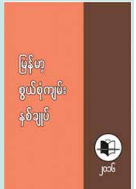
၂၀၁၆ ခုနှစ်က ထုတ်ဝေခဲ့သည့် မြန်မာ့စွယ်စုံကျမ်း မျက်နှာဖုံးအား တွေ့ရစဉ်။