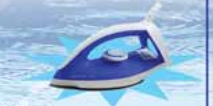
PHILIPS GC 120/20

ဖော်ပြပါပစ္စည်းဝယ်ယူပြီး ကျပ် ၁၉,၀၀၀ တန်ဖိုးရှိ Iron ရယူလိုက်ပါ