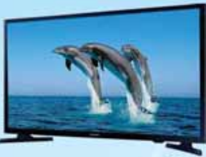
SAMSUNG 32" TV