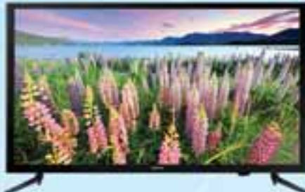
SAMSUNG 40" TV