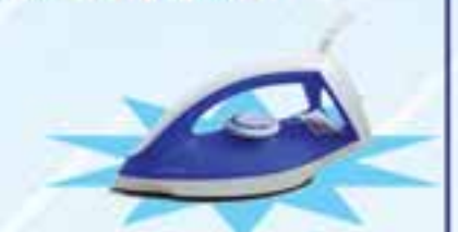
PHILIPS GC 120/20

ဖော်ပြပါပစ္စည်းဝယ်ယူပြီး ကျပ် ၁၉,၀၀၀ တန်ဖိုးရှိ Iron ရယူလိုက်ပါ