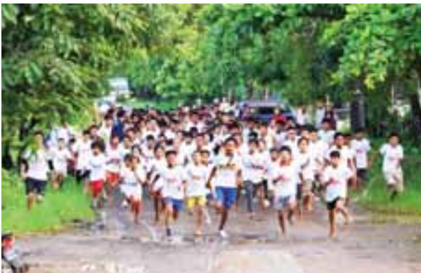
တင်မောင်(မန္တလေး)

အပြေးအားကစားသမားများသည် ဗထူးကွင်းမှ ကျင်းပတ်ယှဉ်ပြိုင်ပြီးကာ ဗထူးကွင်း၌ ပြန်လည်ပန်းဝင်ခဲ့ကြရာ ဝန်ကြီးနှင့် တာဝန်ရှိသူများက နှုတ်ဆက် အားပေးကြပြီး စေတနာရှင်အလှူရှင်များက ပန်းဝင်လာကြသောအပြေးသမား များကို ပိုကာအားဖြည့်အချိန်ရည်ဘူးများ ပေးဝေခဲ့ကြသည်။ ထို့နောက် ဆုရရှိသူများအား တာဝန်ရှိသူများက ဆုတံဆိပ်နှင့် ဆုငွေများ အသီးသီးချီး မြှင့်ခဲ့ကြသည်။