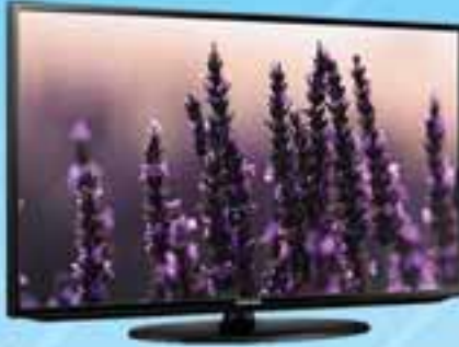
SAMSUNG 48" TV