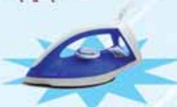
PHILIPS GC 120/21

ဖော်ပြပါပစ္စည်းဝယ်ယူပြီး ကျပ် ၁၉,၀၀၀ တန်ဖိုးရှိ Iron ရယူလိုက်ပါ