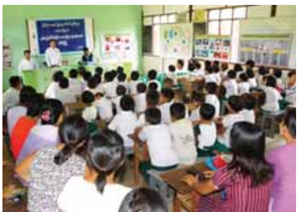
မော်လိုက်သားလေး

ဟောပြောပွဲတွင် မူးယစ်ဆေးဝါးအကြောင်းသိကောင်းစရာများ၊ မူးယစ် ဆေးဝါးသုံးစွဲခြင်းကြောင့် ခံစားရနိုင်သည့် ဆိုးကျိုးများအကြောင်းကို အသိပညာပေးဟောပြောပွဲပြီး ယင်းဟောပြောပွဲသို့ ကျောင်းအုပ်ဆရာကြီးနှင့် ဆရာ ဆရာမများ၊ ကျောင်းသားမိဘများနှင့် ကျောင်းသား ကျောင်းသူ ၅၀ ကျော်တို့တက်ရောက်ကြကာ ပြသထားသည့် မူးယစ်ဆေးဝါးအန္တရာယ် တားဆီးကာကွယ်ရေး အသိပညာပေးနံရံကပ်စာစောင်များ၊ ရောင်စုံ ဓာတ်ပုံပြပွဲများကိုကြည့်ရှုလေ့လာခဲ့ကြောင်း သိရသည်။