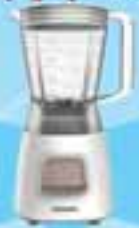
PHILIPS HR 2051

ဖော်ပြပါပစ္စည်းဝယ်ယူပြီး ကျပ် ၃၅,၀၀၀ တန်ဖိုးရှိ Blender ရယူလိုက်ပါ