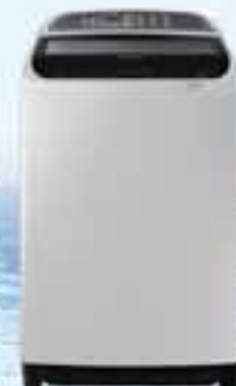
SAMSUNG WASHING MACHINE