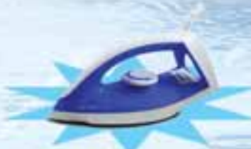
PHILIPS GC 120/19

ဖော်ပြပါပစ္စည်းဝယ်ယူပြီး ကျပ် ၁၉,၀၀၀ တန်ဖိုးရှိ Iron ရယူလိုက်ပါ