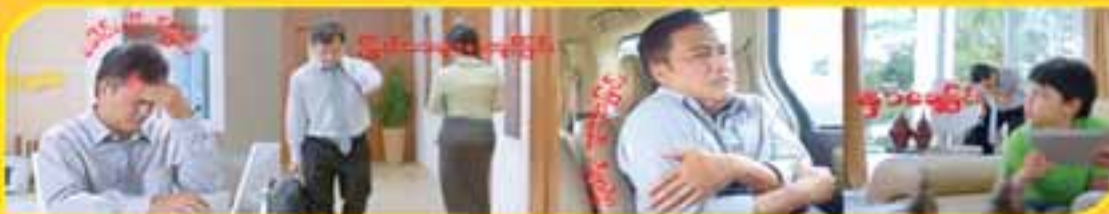
ခေါင်းကိုက်ခြင်း ကြွက်သားပူဖျားနာခြင်း ကိုယ်ပူဖျားနာခြင်း နှာစေးခြင်း