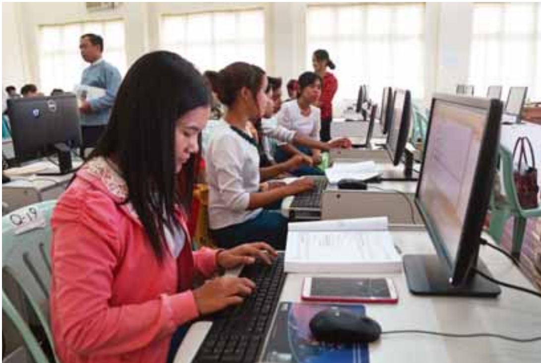
နည်းပညာတက္ကသိုလ် ကျောင်းသား ကျောင်းသူများ ပညာသင်ကြားနေမှုကို တွေ့ရစဉ်။