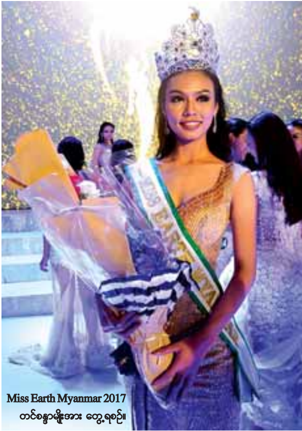
Miss Earth Myanmar 2017 တင်စန္ဒာမျိုးအား တွေ့ရစဉ်။