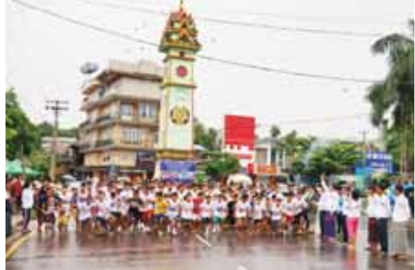
သတင်း-ခင်ဇော်၊ ဓာတ်ပုံ-အေးမင်းသူ