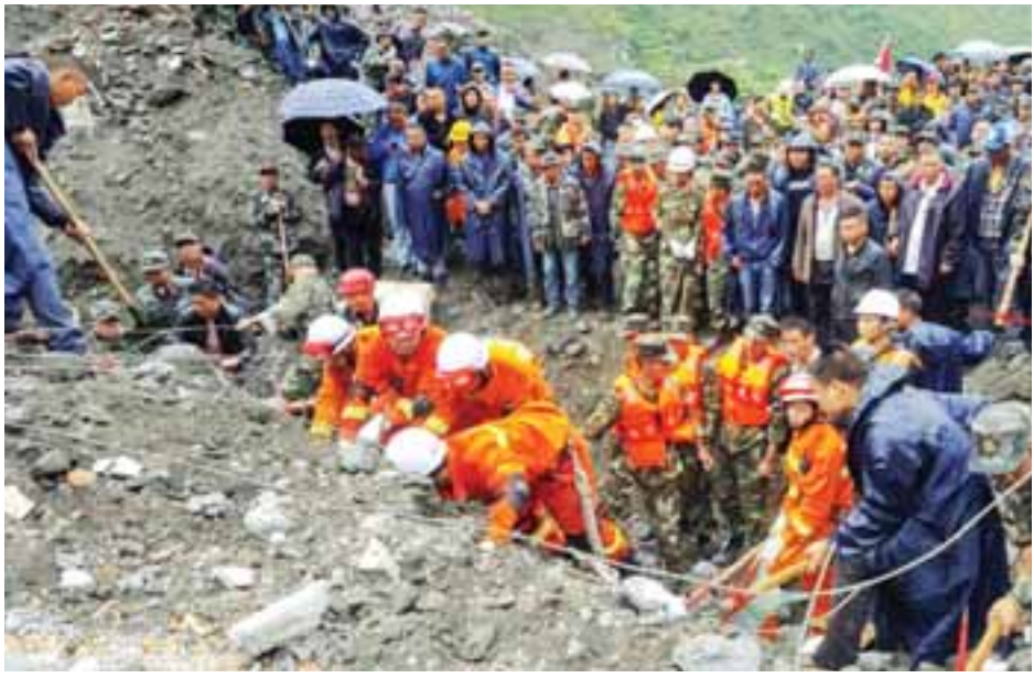
အင်န်အိတ်ချီကေ။

တောင်တန်းတစ်ခုပေါ်မှ ကျဆင်းလာပုံများကို မြင်တွေ့ရသည်။ ရဲဖန်ရံခါ မိုးရွာသွန်းမှုများကြောင့် ကယ်ဆယ်ရေးလုပ်ငန်းများကြန့်ကြာခဲ့ပြီး မြေပြိုမှုများကို ဖယ်ရှားရန် စက်ယန္တရားကြီးများ သယ်ဆောင်ရေးအတွက် ခက်ခဲမှုများ တွေ့ကြုံနေရသည်။ မောက်ရှန်းဒေသသည် စီချမ်စီရင်စုမြို့တော် ချိန်သူးမှ ကီလိုမီတာ ၂၀၀ ခန့်အကွာတွင် ရှိသည်။ ၂၀၀၈ ခုနှစ် ငလျင်လှုပ်ခတ်မှုတွင် ငလျင်ဒဏ်ကြောင့် အပျက်အစီးအများဆုံးဖြစ်ပွားခဲ့သည့် ဒေသလည်းဖြစ်သည်။ မောက်ရှန်းဒေသတွင် လွန်ခဲ့သော ရက်အနည်းငယ်က မိုးအဆက်မပြတ် ရွာသွန်းမှုများရှိခဲ့ကြောင်း ဒေသန္တရ မီဒီယာကဆိုသည်။ မြေပြိုကျမှုတွင် ပျောက်ဆုံးသွားသူများကို အစွမ်းကုန် ကြိုးစားကယ်တင်ကြရန် သမ္မတရုံးက ဖွဲ့စည်းပေးသော အာဏာပိုင်များအား တိုက်တွန်းပြောကြားထားကြောင်း သိရသည်။