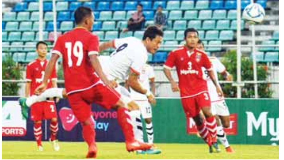
ယူ - ၂၂ အသင်းနှင့် MNL All Star အသင်း ယှဉ်ပြိုင်နေစဉ်။