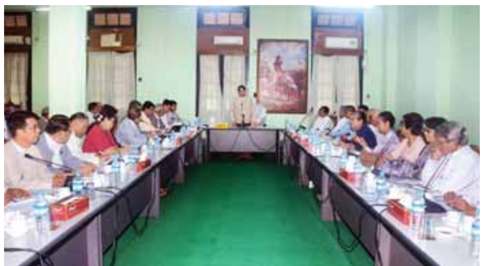
ပြန်ကြားရေးဝန်ကြီးဌာန ပြည်ထောင်စုဝန်ကြီးဒေါက်တာဖေမြင့် စာပေဆိုင်ရာအဖွဲ့အစည်း၊ အသင်းအဖွဲ့များမှ တာဝန် ရှိသူများနှင့် တွေ့ဆုံစဉ်တွင် အမှာစကားပြောကြားစဉ်။ (သတင်းစဉ်)

မွန်းလွဲပိုင်းတွင် ပြည်ထောင်စုဝန်ကြီးသည် မြန်မာ နိုင်ငံပုံနှိပ်နှင့်ထုတ်ဝေသူလုပ်ငန်းရှင်များအသင်းနှင့် မြန်မာ နိုင်ငံစာပေထုတ်ဝေသူများနှင့် ဖြန့်ချိသူများအသင်းတို့မှ တာဝန်ရှိသူများနှင့် ရန်ကုန်မြို့သိမ်ဖြူလမ်းရှိ ပုံနှိပ်ရေးနှင့်