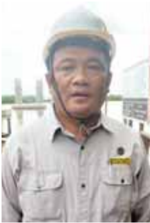
ဦးကျော်သူရ

ဒီတံတားကို ၂၀၀၉-၂၀၁၀ ဘဏ္ဍာနှစ်ကတည်းက စတင်ဆောင်ရွက်ခဲ့တာပါ။ ၂၀၀၈ ခုနှစ်မှာ ဧရာဝတီ