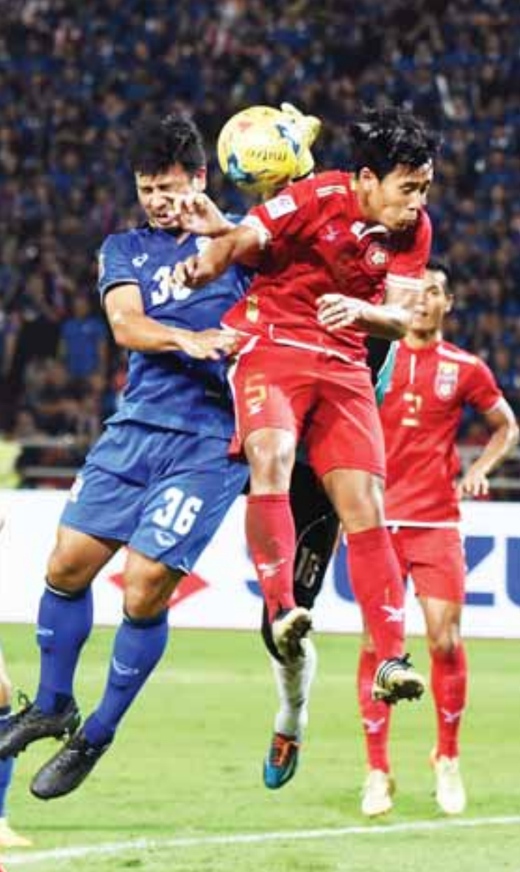
မြန်မာနှင့် ထိုင်းအသင်း ၂၀၁၆ ဆူဇူးကွန်မြင်ပွဲ ဆီမီးဖိုင်နယ်တွင် တွေ့ဆုံခဲ့စဉ်။

ယင်းသို့ နှစ်နိုင်ငံညှိနှိုင်းပူးပေါင်းဆောင်ရွက်ပေးခဲ့ မှုကြောင့် ဇွန် ၂၃ ရက် ညနေ ၆ နာရီခန့်တွင် မူဆယ် (၁၀၅)မိုင် ကုန်သွယ်ရေးဇုန် ကုန်သွယ်လုပ်ငန်းရှင်များမှ သတင်းပေးပို့ချက်အရ ယာယီပိတ်သိမ်းထားသော မြန်မာ နိုင်ငံမှ ပို့ကုန်/သွင်းကုန်လုပ်ငန်းရှင်များ၏ ဘဏ်စာရင်း များ ပြန်လည်ဖွင့်လှစ်ပေးပြီဖြစ်ကြောင်း စီးပွားရေးနှင့် ကူးသန်းရောင်းဝယ်ရေးဝန်ကြီးဌာနမှ သတင်းရရှိသည်။ (သတင်းစဉ်)