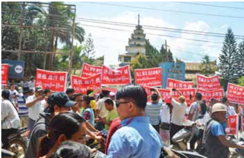
နှင့် မန်ဝိန်း မြန်မာ-တရုတ် နှစ်နိုင်ငံ ထားပြီး နန်းတော်ဝင်/ထွက်ဂိတ်ကို နာရီယံ ယာယီပိတ်ထားကြောင်း သိရ နံနက် ၁၀ နာရီမှ မွန်းတည့် ၁၂ သည်။ ဆရာမောင်(မူဆယ်)

ရှမ်းပြည်နယ်(မြောက်ပိုင်း) မူဆယ် (၁၀၅)မိုင် ကုန်သွယ်ရေးဇုန်ရှိ ပဲ၊ ပြောင်း၊ နှမ်းနှင့် လယ်ယာထွက်ကုန် ပစ္စည်း ကုန်စည်ခိုင်မှ ဦးဆောင်သော ဆန္ဒပြသူ ၂၀၀ ခန့်သည် တရုတ် နိုင်ငံဘက်များ၌ ငွေစာရင်းဖွင့် အပ်နှံထားသည့် မြန်မာနိုင်ငံသား များ၏ ဘဏ်ငွေစာရင်းများ ပိတ်ပင် ခံရခြင်းနှင့် ပတ်သက်၍ ဇွန် ၂၃ ရက် နံနက် ၁၀ နာရီက ဆန္ဒ ထုတ်ဖော်ခဲ့ကြသည်။