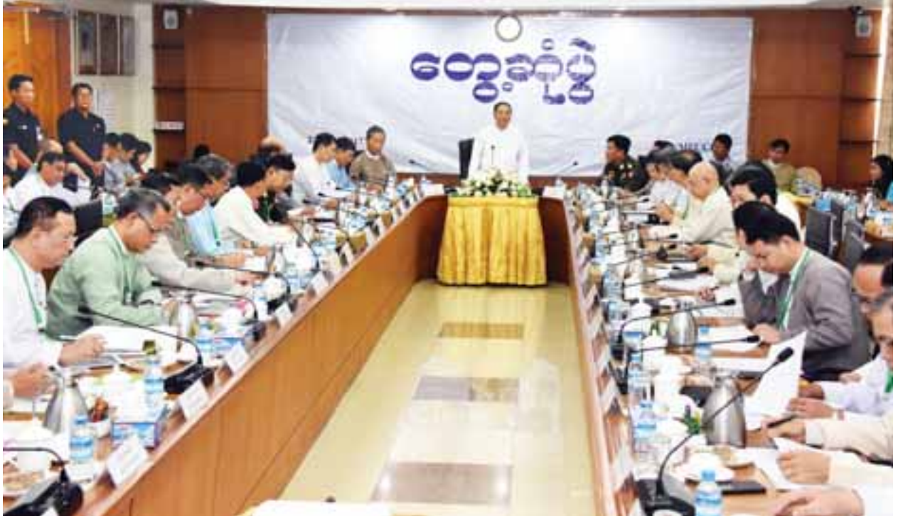
မြန်မာ့စီးပွားရေးလုပ်ငန်းရှင်များနှင့် သတ္တမအကြိမ် ပုံမှန်တွေ့ဆုံဆွေးနွေးပွဲတွင် ပုဂ္ဂလိကကဏ္ဍ ဖွံ့ဖြိုးတိုးတက်ရေးကော်မတီဥက္ကဋ္ဌ ဒုတိယသမ္မတ ဦးမြင့်ဆွေ အမှာစကားပြောကြားစဉ်။

ဒုတိယသမ္မတက အမှာစကားပြောကြားရာတွင် ယခုကဲ့သို့ အစည်းအဝေး ကျင်းပခြင်းမှာ တိုင်းပြည်၏ စီးပွားရေးတွင် အဓိကမောင်းနှင်အားဖြစ်သည့် ပုဂ္ဂလိကကဏ္ဍကို အားပေးမြှင့်တင်ပေးရာမှ တစ်တိုင်းပြည်လုံး၏ စီးပွားရေးကို တိုးတက်စေပြီး ပြည်သူများ၏ လူမှုစီးပွားဘဝကိုပါ တိုးတက်ကောင်းမွန်လာ အောင် စာမျက်နှာ ၃ ကော်လံ ၁ သို့ ○