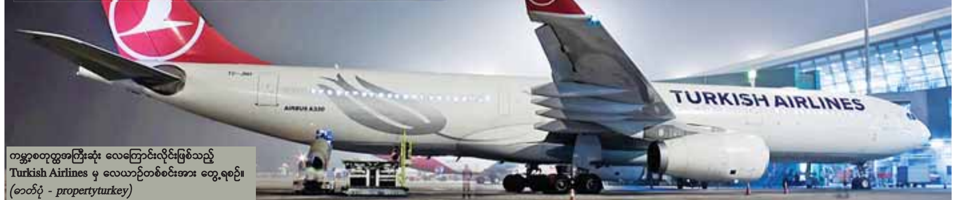
ကမ္ဘာ့စတုတ္ထအကြီးဆုံး လေကြောင်းလိုင်းဖြစ်သည့် Turkish Airlines မှ လေယာဉ်တစ်စင်းအား တွေ့ရစဉ်။