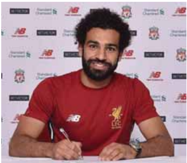
ခြေစွမ်းပြသနိုင်မှုကြောင့် ရိုးမားအသင်း၏ တစ်နှစ်တာကာလအတွင်း အကောင်းဆုံးဆုရရှိခဲ့သလို အမြဲတမ်းစာချုပ်ချုပ်ဆိုရန် ကမ်းလှမ်းခံခဲ့ရပြီး ရိုးမားကစားသမား ဖြစ်လာခဲ့သည်။ ဆာလာမှာ လာမည့်ရာသီတွင် ကျောနံပါတ်(၁၁) ဝတ်ဆင်မည်ဖြစ်ရာ လက်ရှိ ကျောနံပါတ်(၁၁)ဝတ် ဖာမီနိုကလာမည့်ရာသီ ကျောနံပါတ်(၉) ပြောင်းလဲဝတ်ဆင်မည်ဖြစ်သည်။