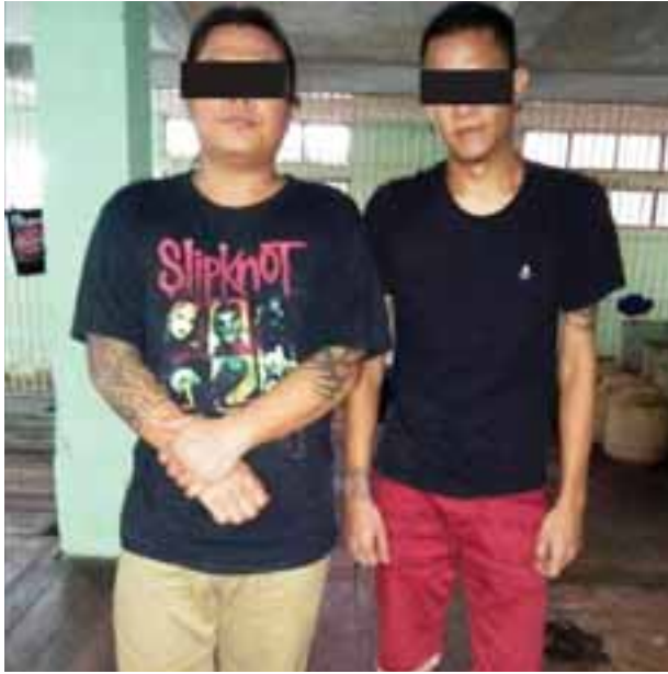
စိုးလှိုင်ရှိန်(ခ)ထူးအယ်လ်လင်းနှင့် နေလင်းသင်း(ခ)ကော်ဘရာ။