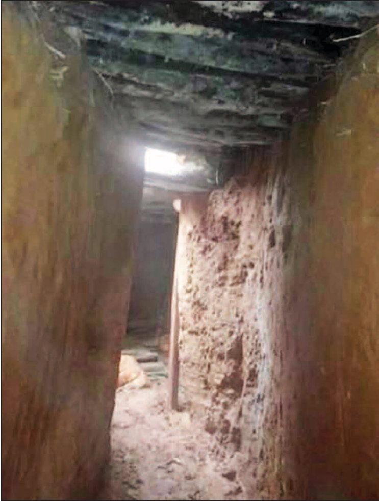
ဖောက်လုပ်ထားသော လူလုပ်လိုက်ဂူ။