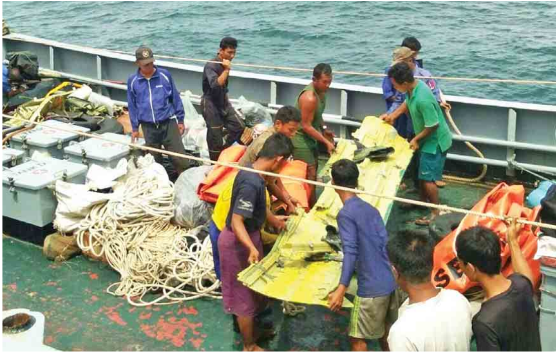
ထပ်မံဆယ်ယူရရှိသည့် လေယာဉ်ကိုယ်ထည်အစိတ်အပိုင်းများအား တွေ့ရစဉ်။

ရရှိခဲ့သည်။ ကျန်ရှိနေသည့် လေယာဉ်ကိုယ်ထည်အစိတ်အပိုင်းများ ရရှိရေး အတွက် တပ်မတော်(ရေ)မှ စစ်ရေယာဉ်များ၊ ကျွမ်းကျင်ရေငုပ် စစ်သည်များနှင့် ဒေသခံငါးဖမ်းစက်လှေများ ပူးပေါင်း၍ ရှာဖွေရေး လုပ်ငန်းများ ဆောင်ရွက်လျက်ရှိရာ ယနေ့မိုးလွဲပိုင်းတွင် ပင်လယ်ပြင် အတွင်း ရာသီဥတုအခြေအနေ ဆိုးရွားလျက်ရှိကြောင်း သတင်းရရှိ သည်။ (သတင်းစဉ်)