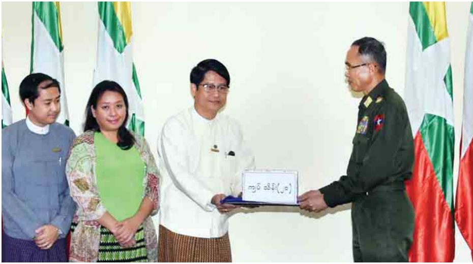
ကို မြန်မာနိုင်ငံခရီးသွားလုပ်ငန်းရှင် က လာရောက်ပေးအပ်လှူဒါန်းရာ ဗိုလ်ချုပ်ကြီးစိန်ဝင်းက လက်ခံခဲ့ကြောင်း များအသင်းဥက္ကဋ္ဌ ဦးသက်လွင်တိုး (အပေါ်) ပြည်ထောင်စုဝန်ကြီး ဒုတိယ သတင်းရရှိသည်။ (သတင်းစဉ်)

နေပြည်တော် ဇွန် ၂၁ ပျက်ကျခဲ့သော တပ်မတော် ပို့ဆောင်ရေး Y-8 လေယာဉ်တွင် ပါဝင်သွားခဲ့သည့် အရာရှိ/စစ်သည်၊ မိသားစုဝင်များနှင့် လေယာဉ် အမှုထမ်းများအတွက် ထောက်ပံ့ ငွေကျပ်သိန်း ၃၀ ကို ပြည်ထောင်စု ရာထူးဝန်အဖွဲ့ဥက္ကဋ္ဌ ဒေါက်တာ ဝင်းသိမ်းက ယနေ့မွန်းလွဲ ၃ နာရီခွဲ တွင် ကာကွယ်ရေးဝန်ကြီးဌာန ဝန်ကြီးရုံးသို့ လာရောက်ပေးအပ် လှူဒါန်းရာ ကာကွယ်ရေးဝန်ကြီးဌာန ပြည်ထောင်စုဝန်ကြီး ဒုတိယ ဗိုလ်ချုပ်ကြီးစိန်ဝင်းက လက်ခံသည်။ အလားတူ ပျက်ကျခဲ့သော လေယာဉ်တွင် ပါဝင်သွားသူများ အတွက် ထောက်ပံ့ငွေကျပ်သိန်း ၂၀