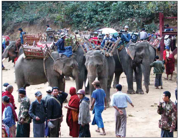
အလောင်းတော်ကသပအမျိုးသားဥယျာဉ်သဘာဝနယ်မြေကို တွေ့ရစဉ်။