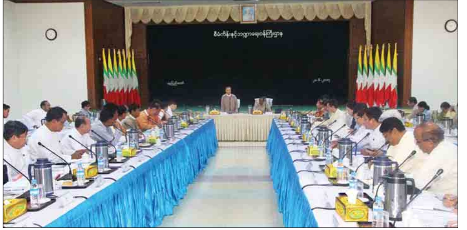
နိုင်ငံ့ဝန်ထမ်းအငှားအိမ်ရာစီမံကိန်းသည် တာဝန်ထမ်းဆောင်လျက်ရှိသည့် အရာထမ်း၊ အမှုထမ်းများအားလုံးက တာဝန်ကျရာနေရာတွင် အသက်သာဆုံးငှားရမ်းခဖြင့် ငှားရမ်းနေထိုင်ခွင့်ရရှိမည်ဖြစ်ပြီး တာဝန်အရ ပြောင်းရွှေ့ခြင်း(သို့မဟုတ်) အလုပ်နုတ်ထွက်ခြင်းများအတွက် ငှားရမ်းထားသော အခန်းကို ပြန်လည်အပ်နှံခြင်း စသည်ဖြင့် ရုံးရှင်းလွယ်ကူစွာ စီမံထားခြင်းဖြစ်ကြောင်းနှင့် နိုင်ငံ့ဝန်ထမ်းအိမ်ရာစီမံကိန်းသည် နိုင်ငံ့ဝန်ထမ်းများအနေဖြင့် ပင်စင်ယူသည့်အချိန်၌ မိမိတို့ အခြေချနေထိုင်လိုသည့် ဒေသတွင် ဝယ်ယူပိုင်ဆိုင်နေထိုင်နိုင်မည်ဖြစ်ပြီး ငွေပေးချေမှုစနစ်ကို ပုဂ္ဂလိကဘဏ်များနှင့် ပေါင်းစပ်စီမံထားသော စနစ်များအတိုင်း ဆောင်ရွက်ပေးသွားမည်ဖြစ်ပါကြောင်း သတင်းရရှိသည်။ (သတင်းစဉ်)

အခက်အခဲများနှင့် စိန်ခေါ်မှုများလည်း ကြုံတွေ့နိုင်ပါကြောင်း၊ ကောင်းမြတ်သည့် အရင်းခံစိတ်ဖြင့် စုပေါင်းကြိုးစားဖြေရှင်းပါက မလွဲမသွေ အောင်မြင်မှုရရှိမည်ဟု ယုံကြည်ကြောင်း ရှင်းလင်းပြောကြားသည်။ ထို့နောက် နိုင်ငံ့ဝန်ထမ်းအိမ်ရာတည်ဆောက်ရေးဦးစီးဌာနက ဒုတိယဥက္ကဋ္ဌ ဆောက်လုပ်ရေးဝန်ကြီးဌာန ပြည်ထောင်စုဝန်ကြီး ဦးဝင်းခိုင်က နေပြည်တော်၊ ရန်ကုန်နှင့် မန္တလေးမြို့တို့တွင် အကောင်အထည်ဖော်ဆောင်ရွက်မည့် နိုင်ငံ့ဝန်ထမ်းအိမ်ရာနှင့် နိုင်ငံ့ဝန်ထမ်း အငှားအိမ်ရာများ တည်ဆောက်မည့်မြေနေရာ ရွေးချယ်ထားရှိမှုနှင့် အဆောက်အအုံပုံစံများကို ရှင်းလင်းဆွေးနွေးသည်။ နိုင်ငံ့ဝန်ထမ်းအိမ်ရာနှင့် နိုင်ငံ့ဝန်ထမ်းအငှားအိမ်ရာ စီမံကိန်းများကို ပထမအဆင့်အနေဖြင့် နေပြည်တော်၊ ရန်ကုန်၊ မန္တလေးတို့တွင် ဇူလိုင်လအတွင်း စတင်အကောင်အထည်ဖော်ဆောင်ရွက်သွားမည်ဖြစ်ပြီး တိုင်းဒေသကြီးနှင့် ပြည်နယ်များတွင် ဆက်လက်အကောင်အထည်ဖော် တည်ဆောက်နိုင်ရေးတို့နှင့်ပတ်သက်၍ အသေးစိတ်ညှိနှိုင်းဆွေးနွေးခဲ့ကြသည်။