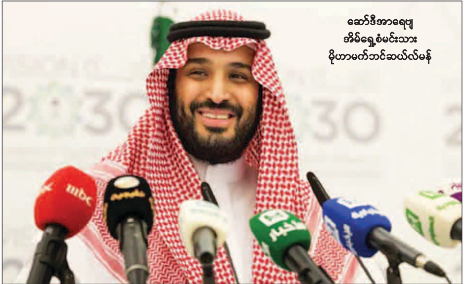
ဆော်ဒီအာရေဗျ အိမ်ရှေ့စံမင်းသား မိုဟာမက်ဘင်ဆယ်လ်မန်