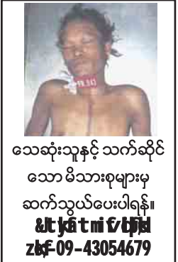
သေဆုံးသူနှင့် သက်ဆိုင်သော မိသားစုများမှ ဆက်သွယ်ပေးပါရန်။