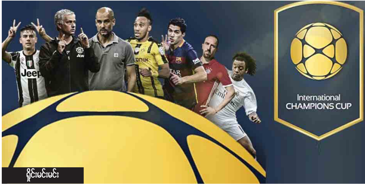
ရှိုင်းပင်းမင်း