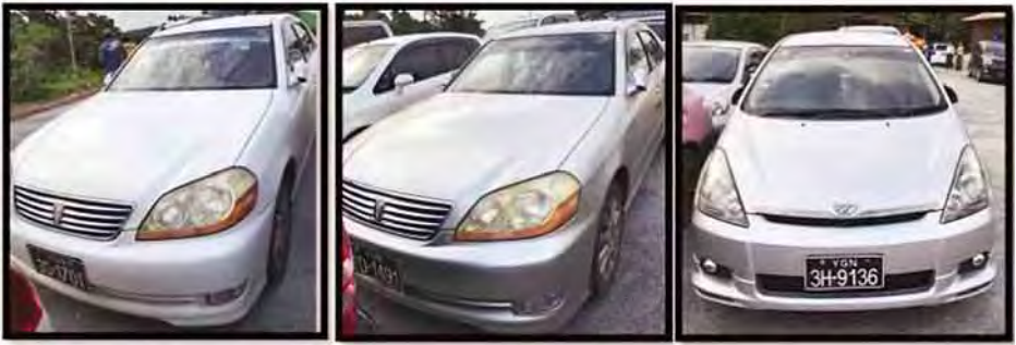
တရားဝင်စာရွက်စာတမ်းအထောက်အထားတစ်စုံတစ်ရာတင်ပြနိုင်ခြင်းမရှိသည့် Toyota Mark II နှင့် Toyota Wish ယာဉ်။