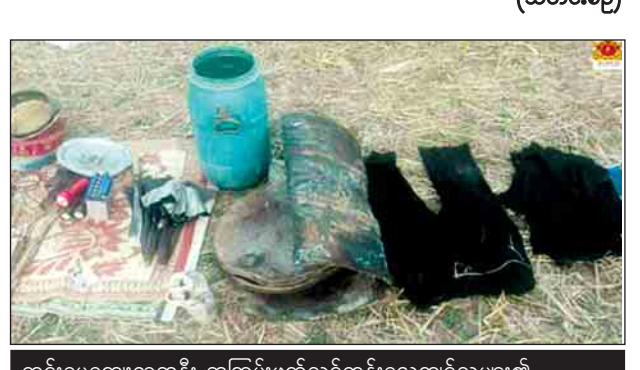
တင်းမေကျေးရွာအနီး အကြမ်းဖက်သင်တန်းလေ့ကျင့်သူများ၏ အသုံးပြုခဲ့သည့် တဲများ။ တင်းမေကျေးရွာအနီး အကြမ်းဖက်သင်တန်းလေ့ကျင့်သူများ၏ အသုံးအဆောင်ပစ္စည်းများ။