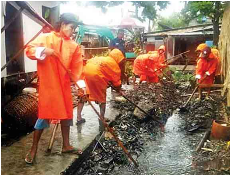
ပိတ်ဆို့အမှိုက်များကို ရှင်းလင်းဖယ်ရှားနေစဉ်။

ထို့အပြင် ချောင်းကြီး၊ မြောင်းကြီးများ ရှင်းလင်းခြင်းအနေဖြင့် တောင်ငူတ္တလာ၊ မြောက်ငူတ္တလာ၊ သယ်န်းကျွန်း၊ ဒဂုံမြို့သစ် (မြောက်ပိုင်း)၊ ဒဂုံမြို့သစ်(အရှေ့ပိုင်း)၊ ဒဂုံမြို့သစ်(တောင်ပိုင်း)၊ ဒဂုံမြို့သစ်(ဆိပ်ကမ်း)၊ အလုံ၊ ကြည့်မြင်တိုင်၊ ဗဟန်း၊ ရန်ကင်း၊ တာမွေ၊ မင်္ဂလာတောင်ညွန့်၊ ဗိုလ်တထောင်၊ သာကေတ၊ ဒေါပုံ၊ ကမာရွတ်၊ လှိုင်၊ မရမ်းကုန်း၊ အင်းစိန်၊ လှိုင်သာယာ၊ ရွှေပြည်သာမြို့နယ်များအတွင်းရှိ ချောင်းနှင့် မြောင်းများကို စက်ယန္တရား၊ လူအင်အားတို့ဖြင့် ရှင်းလင်းပေးခဲ့သည့်အပြင် လက်ရှိကာလတွင်လည်း ဆက်လက်ဆောင်ရွက်လျက်ရှိကြောင်း သိရသည်။ ။