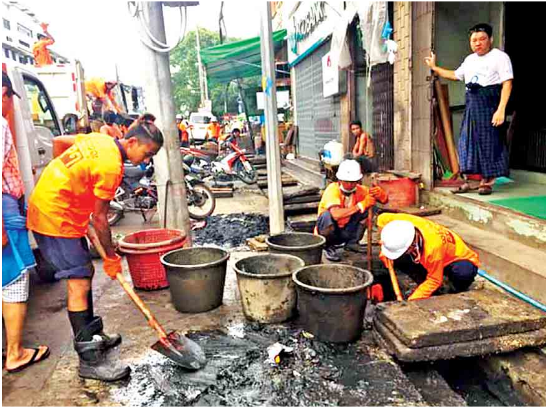
ရန်ကုန်မြို့ ရေစီးရေလာကောင်းမွန်ရေး ဆောင်ရွက်နေစဉ်။

“နိုင်ငံတကာမြို့ကြီးတော်တော်များများမှာလည်း သဘာဝပတ်ဝန်းကျင်ပြောင်းလဲမှုနဲ့ အတူ ကြုံတွေ့နေရတာပဲ ဖြစ်ပါတယ်။ ဒီအခြေအနေကို ပြုပြင်ပြောင်းလဲဖို့အတွက် ကျွန်တော်တို့ ကြိုးစားနေပါတယ်။ ကမ္ဘာ့ဘဏ်ကနေပြီး ကျွန်တော်တို့ကို သန်းပေါင်း ၁၂၅ သန်းကူညီဖို့ သဘောတူညီထားပြီးဖြစ်ပါတယ်။