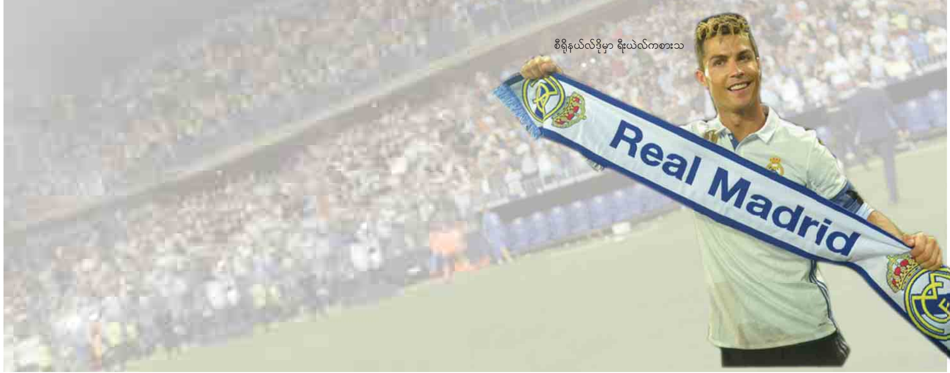
စီရိုနယ်လ်ဒိုမှာ ရိုးယဲလ်ကစားသ