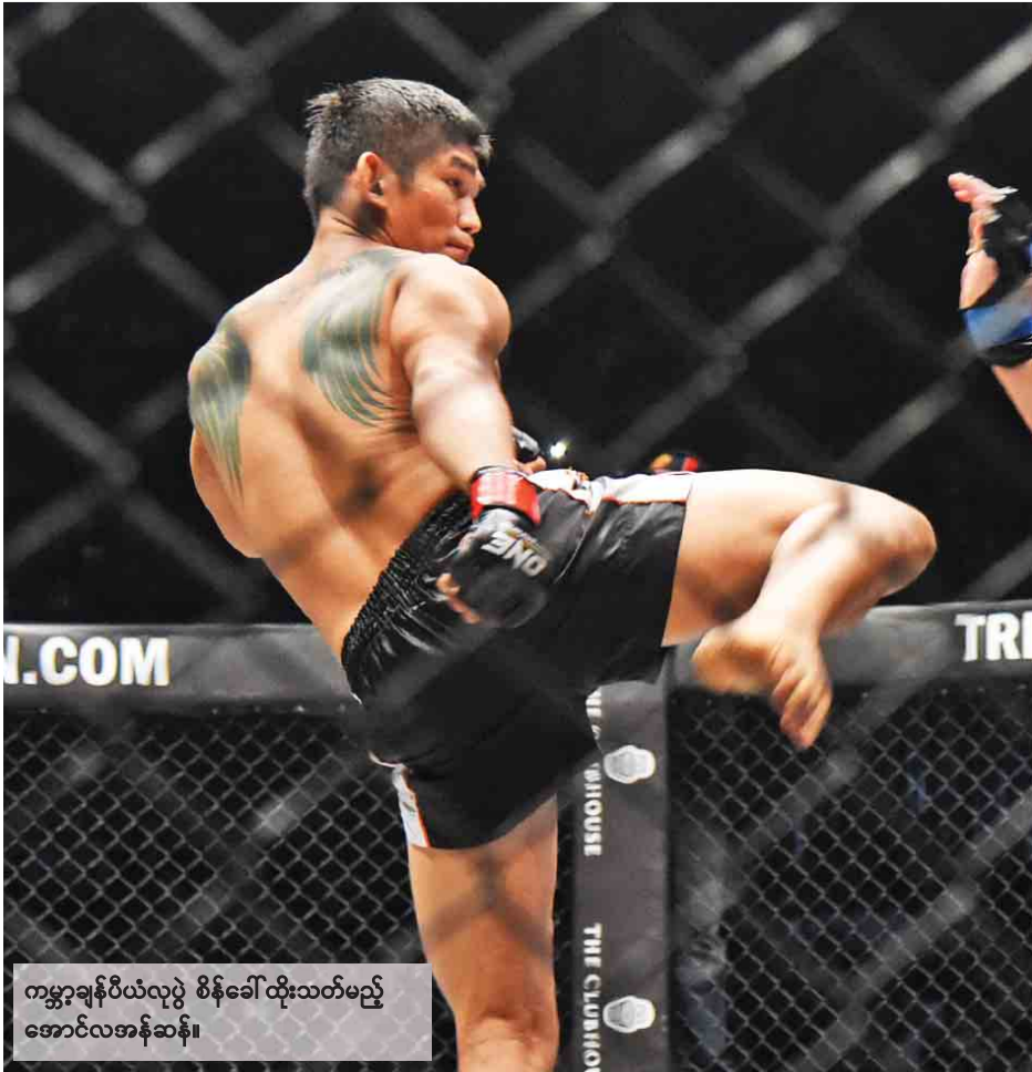
ကမ္ဘာ့ချန်ပီယံလှပွဲ စိန်ခေါ်ထိုးသတ်မည့် အောင်လအန်ဆန်။