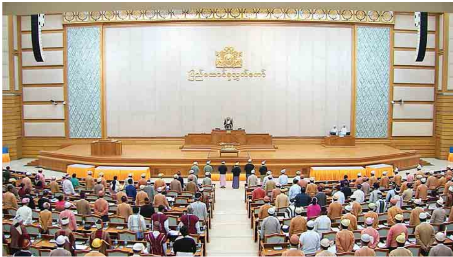
ပြည်ထောင်စုလွှတ်တော်နာယက မန်းဝင်းခိုင်သန်း၏ ရှေ့မှောက်၌ ပြည်ထောင်စုတရားလွှတ်တော်ချုပ် တရားသူကြီးများနှင့် ပြည်ထောင်စုရွေးကောက်ပွဲကော်မရှင် အဖွဲ့ဝင်များ ကတိသစ္စာပြုကြစဉ်။ (သတင်းစဉ်)

ထို့နောက် ပြည်ထောင်စုအစိုးရအဖွဲ့မှ ပေးပို့သော ၂၀၁၇ ခုနှစ် ကာလလတ် ကြွေးမြီစီမံခန့်ခွဲမှု မဟာဗျူဟာ ထုတ်ပြန်ရေးကိစ္စနှင့် စပ်လျဉ်း၍ စီမံကိန်းနှင့် ဘဏ္ဍာရေးဝန်ကြီးဌာန ဒုတိယဝန်ကြီးဦးမောင်မောင်ဝင်းက ပြည်တွင်း၊ ပြည်ပ ကြွေးမြီများနှင့်ပတ်သက်၍ ၂၀၁၆ ခုနှစ် မဟာဗျူဟာတွင် “ကျပ်ငွေနှင့် အမေရိကန်ဒေါ်လာ ၂ မျိုးလုံးဖြင့်ဖော်ပြခဲ့ပြီး” ယခုနှစ်တွင် ပြည်တွင်းကြွေးမြီများကို ကျပ်ငွေဖြင့်လည်းကောင်း၊ ပြည်ပကြွေးမြီများကို အမေရိကန်ဒေါ်လာဖြင့်လည်းကောင်း ဖော်ပြထားကြောင်း၊ အစိုးရမှ ငွေထုတ်ချေးခြင်း၊ ထပ်ဆင့်ငွေထုတ်ချေးခြင်းနှင့် ပတ်သက်၍ ၂၀၁၆ ခုနှစ် မဟာဗျူဟာတွင် “ထပ်ဆင့်ထုတ်ချေးသည့် ပြည်ပငွေချေးနှစ်ခုရှိသည်” ဟူ၍ ဖော်ပြခဲ့ပြီး ယခုနှစ်တွင် အကောင်အထည်ဖော်မည့်ဌာန၊ အဖွဲ့အစည်းအမည်၊ စီမံကိန်းအမည်နှင့် ချေးငွေပမာဏတို့အား ဖြည့်စွက်၍ ပိုမိုပြည့်စုံစွာ ဖော်ပြထားကြောင်း။