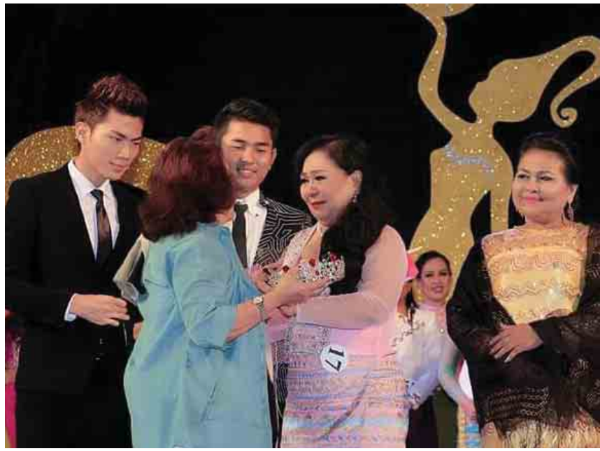
2016 ခုနှစ် Miss Golden Land Myanmar အဖွဲ့အစည်းမှ ဒီဇင်ဘာလတွင် အိကျော့ခိုင်နှင့် တွေ့ဆုံခြင်း