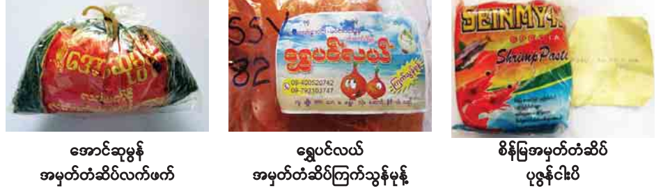
အောင်ဆုမွန် အမှတ်တံဆိပ်လက်ဖက်၊ ရွှေပင်လယ် အမှတ်တံဆိပ်ကြက်သွန်မုန့်၊ စိန်မြအမှတ်တံဆိပ် ပုဇွန်ငါးပိ