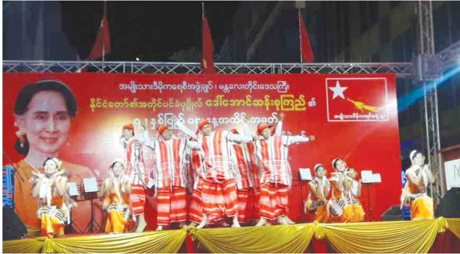
ချမ်းမြသာစည် ဇွန် ၂၀

အမျိုးသားဒီမိုကရေစီအဖွဲ့ချုပ် (မန္တလေးတိုင်းဒေသကြီး) က ဦးဆောင်ကျင်းပသည့် နိုင်ငံတော်၏အတိုင်ပင်ခံပုဂ္ဂိုလ် ဒေါ်အောင်ဆန်းစုကြည်၏ (၇၂) နှစ်ပြည့်မွေးနေ့အထိမ်းအမှတ် ကဗျာရွတ်ဆိုပွဲ၊ တိုင်းရင်းသားပဒေသာကပွဲဖျော်ဖြေ ပွဲကို ဇွန် ၁၉ ရက် ညနေ ၆ နာရီက မန္တလေးမြို့၊ ချမ်းမြသာစည်မြို့နယ် ၇၃ လမ်း၊ သင်္ဃာတိုက်အထိမ်းအမှတ် အစည်းအဝေးခန်းမတွင် ကျင်းပသည်။