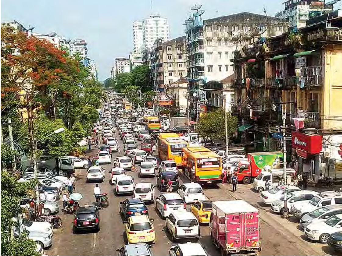
ယာဉ်များဖြင့် ပြည့်နှက်နေသည့် ရန်ကုန်မြို့ပြမြင်ကွင်း။

အဓိကမှာ စီမံကိန်းများကို အမှန်တကယ် အကောင်အထည်ဖော်နိုင်မှု ရှိ မရှိပင်ဖြစ်သည်။ ခေတ်အဆက်ဆက်တွင် ရန်ကုန်မြို့ပြစီမံကိန်းများကို ရေးဆွဲခဲ့မှုများ ရှိခဲ့ပြီး ရန်ကုန်မြို့ပြဖွံ့ဖြိုးရေး မဟာဗျူဟာ စီမံကိန်း နှစ် (၃၀) စီမံကိန်းကို တပ်မတော် အစိုးရလက်ထက်တွင် ရေးဆွဲခဲ့ဖူးသည်။ ထို့ပြင် မလေးရှားနိုင်ငံမှ မြို့ပြစီမံကိန်းအဖွဲ့ များက ရန်ကုန်မြို့တော်စည်ပင်နှင့် လာရောက် တွေ့ဆုံညှိနှိုင်းကာ မြို့ပြစီမံကိန်းကို ရေးဆွဲခဲ့