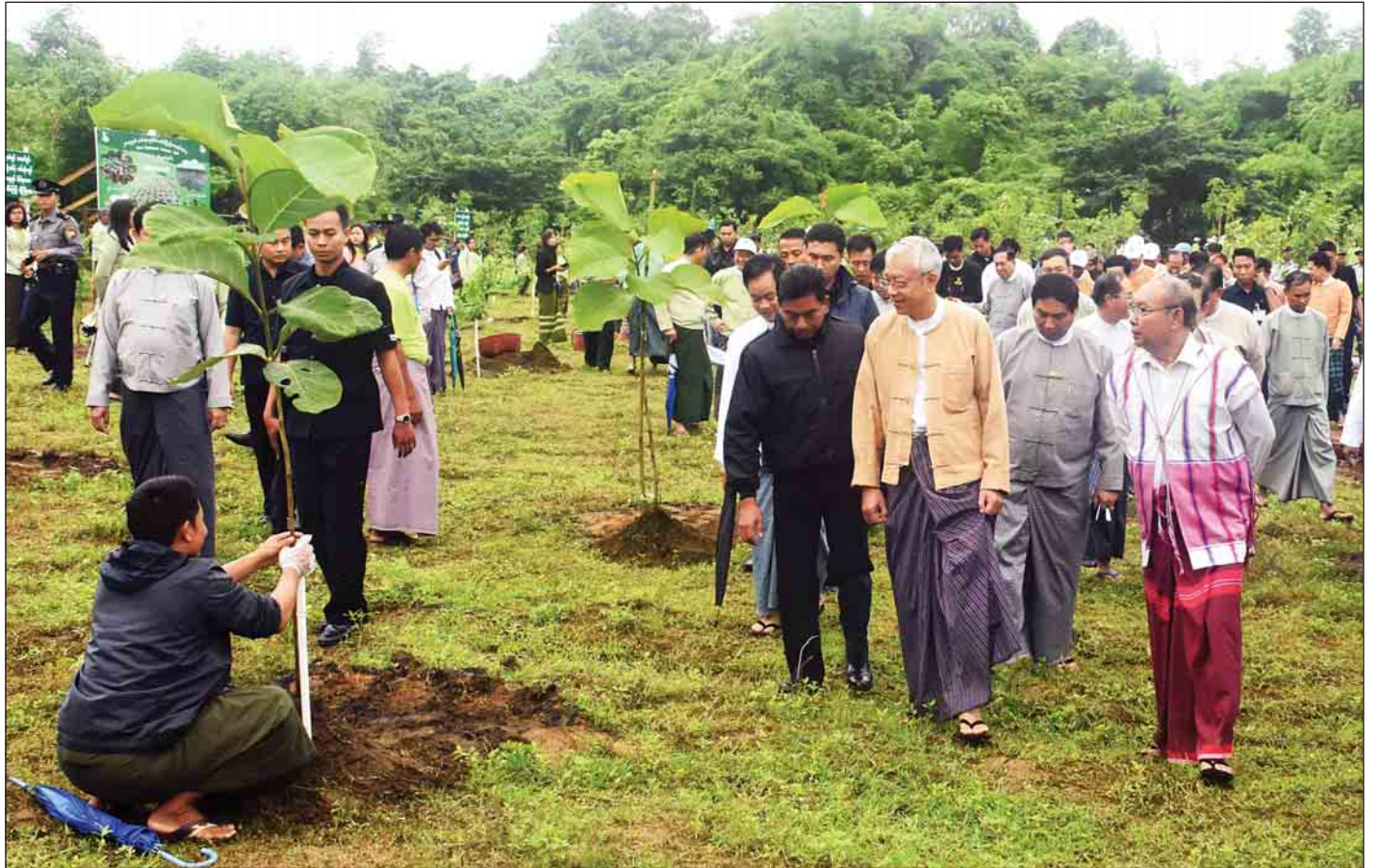
နေပြည်တော် မိုးရာသီသစ်ပင်စိုက်ပျိုးပွဲတော်၌ ပျိုးပင်များစိုက်ပျိုးနေမှုကို နိုင်ငံတော်သမ္မတ ဦးထင်ကျော် လှည့်လည်ကြည့်ရှုစဉ်။

ယင်းနောက် နိုင်ငံတော်သမ္မတသည် ပြည်ထောင်စု ဝန်ကြီးများ၊ ပြည်ထောင်စုရှေ့နေချုပ်၊ နေပြည်တော် ကောင်စီဥက္ကဋ္ဌ၊ စာမျက်နှာ ၃ ကော်လံ ၁ သို့ ☆