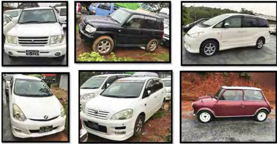
တရားဝင် စာရွက်စာတမ်းအထောက်အထားတစ်စုံတစ်ရာ တင်ပြနိုင်ခြင်းမရှိသည့် Mitsubishi Pajero, Toyota Ipsum, Toyota Estima, Toyota Wish နှင့် Mini Saloon ယာဉ်တို့ကို တွေ့ရစဉ်။