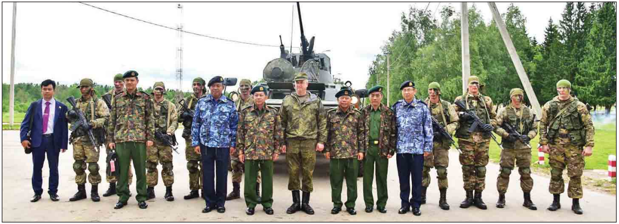
တပ်မတော်ကာကွယ်ရေးဦးစီးချုပ် ဗိုလ်ချုပ်မှူးကြီးမင်းအောင်လှိုင်နှင့် ရုရှားတပ်မတော်အရာရှိကြီးများ မှတ်တမ်းတင်ဓာတ်ပုံရိုက်စဉ်။ (သတင်းစဉ်)