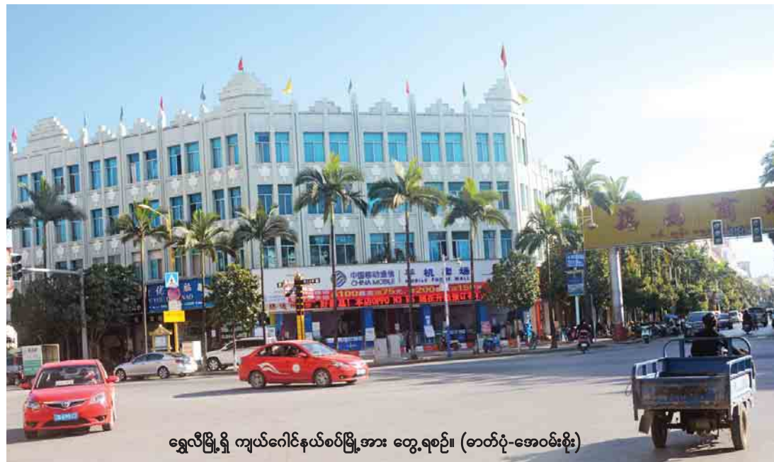
ရွှေလီမြို့ရှိ ကျယ်ဝင်နယ်စပ်မြို့အား တွေ့ရစဉ်။

မြန်မာလုပ်ငန်းရှင်များ၏ ဘဏ်စာရင်းများအား တရုတ်နိုင်ငံမှ ယာယီပိတ်သိမ်းခဲ့ခြင်းမှာ ငွေကြေးများ တရားမဝင် လွှဲပြောင်းဆောင်ရွက်နေခြင်းကြောင့်ဟုသိရ