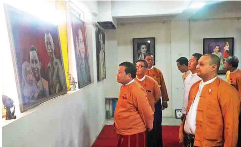
လှုပ်ရှားမှု သမိုင်းမှတ်တမ်းဓာတ်ပုံ ညီလာခံ တိုင်းရင်းသားများနှင့် မှတ်တမ်းဓာတ်ပုံနှင့် ပန်းချီပြပွဲကို ဇွန် ၁၉ ရက်မှ ၂၀ ရက် အထိ နေ့စဉ် နံနက် ၉ နာရီမှ ည ၉ နာရီအထိ ပြသသွားမည်ဖြစ်ကြောင်း သိရသည်။ သီဟကို(မန္တလေး)

မန္တလေး ဇွန် ၁၉ အမျိုးသားဒီမိုကရေစီအဖွဲ့ချုပ်(မန္တလေး တိုင်းဒေသကြီး)က ဦးဆောင်ကျင်းပ သည့် နိုင်ငံတော်၏အတိုင်ပင်ခံပုဂ္ဂိုလ် ဒေါ်အောင်ဆန်းစုကြည်၏ (၇၂)နှစ် ပြည့်မွေးနေ့အထိမ်းအမှတ် သမိုင်း မှတ်တမ်းဓာတ်ပုံနှင့် ပန်းချီပြပွဲဖွင့်ပွဲကို ယနေ့ နံနက် ၉ နာရီက မန္တလေးမြို့ ချမ်းမြသာစည်မြို့နယ် (၇၃)လမ်း၊ သင်္ဃာတန်းနှင့် ငွေ့ဝါလမ်းကြားရှိ သီရိအနုပညာပြခန်း၌ ကျင်းပသည်။ ပြပွဲကို မန္တလေးတိုင်းဒေသကြီး ဝန်ကြီးချုပ်ဒေါက်တာဇော်မြင့်မောင်၊ မန္တလေး မြို့တော်ဝန် ဒေါက်တာ ရဲလွင်နှင့် တိုင်းဒေသကြီးအစိုးရ အဖွဲ့ဝင်များ၊ အမျိုးသားဒီမိုကရေစီ အဖွဲ့ချုပ် (မန္တလေးတိုင်းဒေသကြီး) ဥက္ကဋ္ဌ ဦးတင်ထွဋ်ဦး၊ ခရိုင်နှင့်မြို့နယ် ဥက္ကဋ္ဌများ တက်ရောက်အားပေးပြီး ဖွင့်လှစ်ပေးသည်။