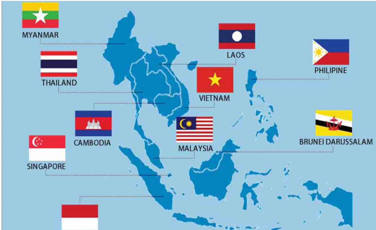
အာဆီယံအဖွဲ့ဝင်နိုင်ငံများ

ဒါဟာ ရပ်ဝန်းတစ်ခု လမ်းကြောင်းတစ်ခုစီမံချက်ကို မူလက နှစ်နိုင်ငံချင်းအလိုက် ဆွေးနွေးညှိနှိုင်း အကောင်အထည်ဖော်နေရာကနေ သက်ဆိုင်တဲ့ နိုင်ငံအားလုံး ပါဝင်တဲ့ နိုင်ငံစုံ ညှိနှိုင်းဆွေးနွေးပူးပေါင်း ဆောင်ရွက်မယ့် Multilateral cooperation mechanism တစ်ခုအဖြစ် စတင်ပြောင်းလဲလိုက်ခြင်းလို့ ပြောနိုင်ပါတယ်။