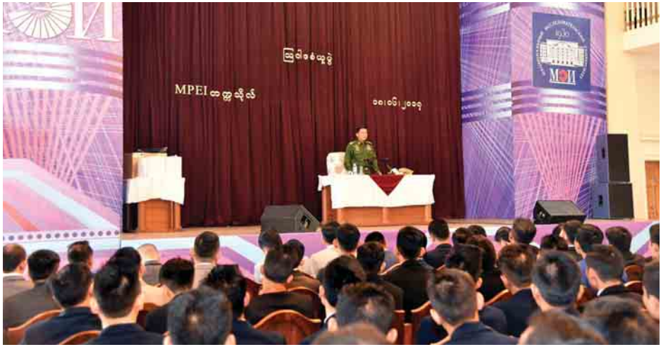
စသည်များပါဝင်ကြောင်း၊ မိမိတို့သင်ကြားလျက်ရှိသည့် တပ်မတော်ကာကွယ်ရေးဦးစီးချုပ်သည် ပညာတော်သင် ဘာသာရပ်များကို လက်တွေ့နယ်ပယ်တွင် အကျိုးရှိစွာ အသုံးပြုနိုင်ရန်အတွက် ကျွမ်းကျင်ပိုင်နိုင်အောင် လေ့လာ သင်ယူရန်လိုကြောင်း ပြောကြားသည်။ ထို့နောက် များ ပေးအပ်ခဲ့ကြောင်း သတင်းရရှိသည်။ (သတင်းစဉ်)

Smolenskaya ဘူတာမှ Ploshchad Revolyutsii ဘူတာသို့ လိုက်ပါစီးနင်းလေ့လာခဲ့ကြသည်။ တပ်မတော်ကာကွယ်ရေးဦးစီးချုပ်သည် ရုရှား ဖက်ဒရေးရှင်းနိုင်ငံရှိ တက္ကသိုလ်အသီးသီး၌တက်ရောက် ပညာသင်ကြားလျက်ရှိသည့် မြန်မာ့တပ်မတော်အရာရှိ များအား ဇွန် ၁၈ ရက်တွင် မော်စကိုမြို့ရှိ Moscow Power Engineering Institute (MPEI) တက္ကသိုလ်တွင် သွားရောက်တွေ့ဆုံပြီး ဩဝါဒစကားပြောကြား သည်။ (ယာဇုံ)