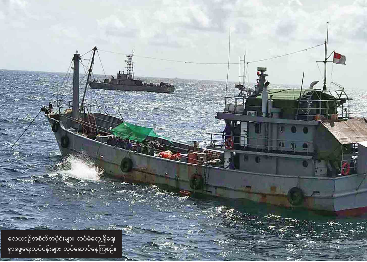
လေယာဉ်အစိတ်အပိုင်းများ ထပ်မံရှာဖွေရေး ရှာဖွေရေးလုပ်ငန်းများ လုပ်ဆောင်နေကြစဉ်။

တွေ့ရှိခဲ့သည်။ ထို့ပြင် ဆယ်ယူရရှိခဲ့သည့် Flight Data Recorder-Black Box နှင့် CVR-Cockpit Voice Recorder တို့မှ လေယာဉ်ပျက်ကျသည့် အကြောင်းအရင်းအချက်အလက်များ ဖော်ထုတ်ရရှိရေးအတွက် လေယာဉ်ပျက်ကျမှု စုံစမ်းစစ်ဆေးရေးလုပ်ငန်းစဉ်များအတိုင်း လုပ်ဆောင်လျက်ရှိကြောင်း သတင်းရရှိသည်။ (သတင်းစဉ်)