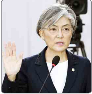
တောင်ကိုရီးယားနိုင်ငံ၏ ပထမဆုံးသော အမျိုးသမီး နိုင်ငံခြားရေးဝန်ကြီးမှာ ကျန်းကျွေဂျာ (အပေါ်ပုံ) ဖြစ်ပြီး အိမ်ပြာတော်(ခေါ်)

ဆိုးလ် ဇွန် ၁၉ တောင်ကိုရီးယားသမ္မတ မွန်းဂျေအင်းသည် ကွန်ဆာဗေးတစ်အတိုက်အခံပါတီ၏အပြင်းအထန် ကန့်ကွက်မှုရှိနေသည့်ကြားမှ အမျိုးသမီးတစ်ဦးကို နိုင်ငံခြားရေးဝန်ကြီးအဖြစ် ခန့်အပ်လိုက်ကြောင်း ဒေသဆိုင်ရာ သတင်းဌာနများက ဇွန် ၁၉ ရက်တွင် သတင်းထုတ်ပြန်သည်။