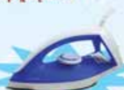
PHILIPS GC 120/20

ဖော်ပြပါပစ္စည်းဝယ်ယူပြီး ကျပ် ၁၉,၀၀၀ တန်ဖိုးရှိ Iron ရယူလိုက်ပါ