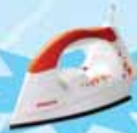
PHILIPS GC 1418/02

ဖော်ပြပါပစ္စည်းဝယ်ယူပြီး ကျပ် ၂၁,၀၀၀ တန်ဖိုးရှိ Iron ရယူလိုက်ပါ