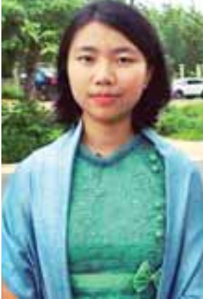
မဖြူခေတ်