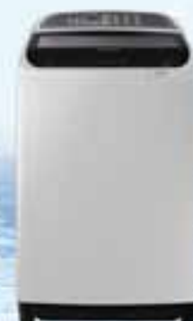
SAMSUNG WASHING MACHINE