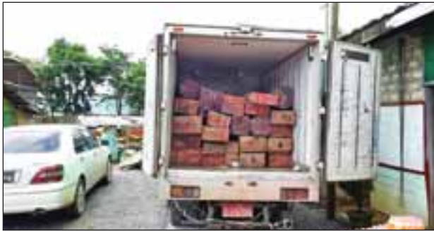
သိမ်းဆည်းရမိခဲ့ကြောင်း အကောက်ခွန်ဦးစီးဌာနမှ သိရသည်။

ယင်းသို့ တားဆီးသိမ်းဆည်းမိခဲ့ရာတွင် ရန်ကုန်ဆိပ်ကမ်းက တားဆီးမှုတစ်ခု (ခန့်မှန်းတန်ဖိုး ကျပ် ၄၅ ဒသမ ၈၈၅ သန်းခန့်)၊ မန္တလေးတိုင်းဒေသကြီး အကောက်ခွန်ဦးစီးဌာနမှ ရုံးက တားဆီးမှု တစ်ခု (ခန့်မှန်းတန်ဖိုးကျပ် ၁၅ ဒသမ ၂၂၉ သန်းခန့်)၊ ရေပူစစ်ဆေးရေးစခန်းက တားဆီးမှု ၁၄ မှု (ခန့်မှန်းတန်ဖိုးကျပ် ၁၇၇ ဒသမ ၅၉၀၄ သန်းခန့်)၊ မရမ်းခေတ်စစ်ဆေးရေးစခန်းက တားဆီးမှု ၃၇ မှု (ခန့်မှန်းတန်ဖိုးကျပ် ၁၄၈ ဒသမ ၆၃၂ သန်းခန့်)၊ မူဆယ် (OSS) စစ်ဆေးရေးစခန်းက တားဆီးမှု ၂၁ မှု (ခန့်မှန်းတန်ဖိုး ကျပ် ၁၅၈ ဒသမ ၅၀၆ သန်းခန့်)၊ ဗန်းမော်မြို့နယ် အကောက်ခွန်ဦးစီးဌာနမှ ရုံးက တားဆီးမှု ၃၈ မှု (ခန့်မှန်းတန်ဖိုးကျပ် ၅၁ ဒသမ ၄၅ သန်းခန့်) စုစုပေါင်း ၇၇ မှု (ခန့်မှန်းတန်ဖိုး ကျပ် ၅၉၇ ဒသမ ၂၉၂၄ သန်းခန့်)ရှိ အကောက်ခွန်ပွဲပစ္စည်းများ