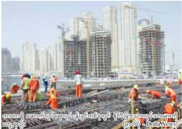
ကာတာရှိ ဆောက်လုပ်ရေးလုပ်ငန်းခွင်တစ်ခုတွင် မိုင်းခြားသားလုပ်သားများကို တွေ့ရစဉ်။

Ref : Qatar can survive ongoing diplomatic crisis.