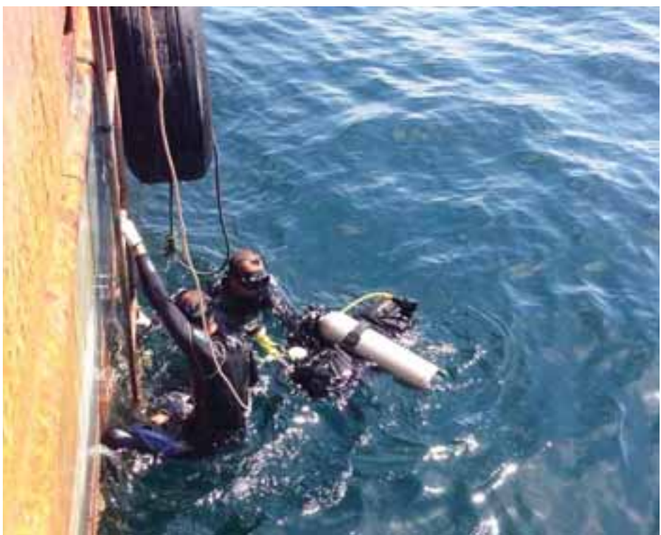
ကျွမ်းကျင်ရေငုပ်စစ်သည်များနှင့် ဒေသခံရေငုပ်ကျွမ်းကျင်သူများ ရှာဖွေရေးလုပ်ငန်းများ ဆောင်ရွက်နေစဉ်။