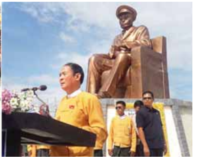
ပြည်သူ့လွှတ်တော်ဥက္ကဋ္ဌဦးဝင်းမြင့် အမျိုးသားခေါင်းဆောင်ကြီး ဗိုလ်ချုပ်အောင်ဆန်း နှစ်(၁၀၀)ပြည့်အထိမ်းအမှတ် ရုပ်တုနှင့်ရင်ပြင်ဖွင့်ပွဲ အခမ်းအနားတွင် အမှာစကားပြောကြားစဉ်။

ကြပြီးနောက် အခမ်းအနားကိုရုပ်သိမ်းလိုက်သည်။ ထို့နောက် ပြည်သူ့လွှတ်တော်ဥက္ကဋ္ဌ၊ မန္တလေးတိုင်းဒေသကြီးဝန်ကြီးချုပ်၊ မန္တလေးတိုင်းဒေသကြီး လွှတ်တော်ဥက္ကဋ္ဌနှင့်ဒုတိယဥက္ကဋ္ဌ၊ တိုင်းဒေသကြီးအစိုးရအဖွဲ့ အဖွဲ့ဝင်များနှင့် ၎င်းတို့၏ဝန်ထမ်းများ၊ လွှတ်တော်ကိုယ်စားလှယ်များ၊ တိုင်းဒေသကြီး၊ ခရိုင်/မြို့နယ်တို့မှ တာဝန်ရှိသူများ၊ ဒေသခံများ၊ ဖိတ်ကြားထားသည့် စည်သူတော်များက ပန်းချီပြခန်းအတွင်း လှည့်လည်ကြည့်ရှုကြသည်။