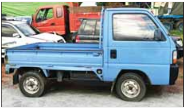
ရန်ကုန်သို့ သွားရောက်မည့် Honda Fiti Toyota Voxy၊ Toyota Pro-box၊ Honda Acty၊ Honda CRV၊ Toyota Altezza နှင့် Toyota Noah ယာဉ်တို့အား မရမ်းခေတ်အမြဲတမ်းစစ်ဆေးရေးစခန်း ပူးပေါင်းအဖွဲ့များက တားဆီးစစ်ဆေးခဲ့ရာ တရားဝင်စာရွက်စာတမ်း တစ်စုံတစ်ရာ

တရားမဝင်ကုန်စည်များ တားဆီးထိန်းချုပ်ရေး ဆောင်ရွက်လျက်ရှိရာ တွင် ဇွန် ၁၆ ရက်က မြဝတီမှရန်ကုန်သို့ သွားရောက်မည့် လိုင်စင်မဲ့ယာဉ်အစုံစီစဉ် သိမ်းဆည်းရမိခဲ့ကြောင်း အကောက်ခွန်ဦးစီးဌာနမှ သိရသည်။