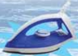
PHILIPS GC 120/20

ဖော်ပြပါပစ္စည်းဝယ်ယူပြီး ကျပ် ၁၉,၀၀၀ တန်ဖိုးရှိ Iron ရယူလိုက်ပါ