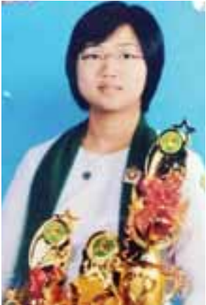
မသိမ့်အိချို