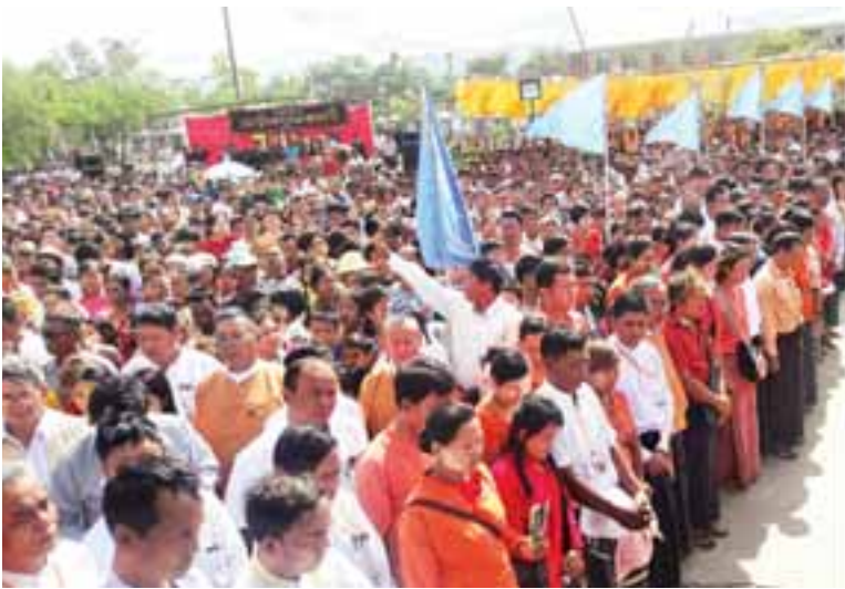
ပြည်သူ့လွှတ်တော်ဥက္ကဋ္ဌဦးဝင်းမြင့် အမျိုးသားခေါင်းဆောင်ကြီး ဗိုလ်ချုပ်အောင်ဆန်း နှစ်(၁၀၀)ပြည့်အထိမ်းအမှတ် ရုပ်တုနှင့်ရင်ပြင်ဖွင့်ပွဲ အခမ်းအနားတွင် အမှာစကားပြောကြားစဉ်။

ယင်းနောက် အမျိုးသားဒီမိုကရေစီအဖွဲ့ချုပ်မှ ဦးဝင်းထိန်၊ တိုင်းဒေသကြီးဝန်ကြီးချုပ် ဒေါက်တာဇော်မြင့်မောင်တို့က ဗိုလ်ချုပ်အောင်ဆန်း ဖြတ်သန်းခဲ့သော သမိုင်းကြောင်းနှင့်စပ်လျဉ်း၍ အမှာစကားပြောကြားကြသည်။ ဆက်လက်၍ ဗိုလ်ချုပ်အောင်ဆန်းရုပ်တုနှင့် ရင်ပြင်ဖြစ်မြောက်ရေးအဖွဲ့ဥက္ကဋ္ဌ ဒေါက်တာဝင်းမြင့်နှင့် အတွင်းရေးမှူး ဦးကျော်ကျော်စိုးတို့က ရုပ်တုနှင့်ရင်ပြင်ဖြစ်မြောက်ရေး ဆောင်ရွက်ခဲ့မှုနှင့်စပ်လျဉ်း၍ ရှင်းလင်းပြောကြားပြီး တိုင်းဒေသကြီးအစိုးရအဖွဲ့ဝင် ဦးဇော်အောင်က ကမ္ဘာ့မော်ကွန်းကို ဖွင့်လှစ်ပေးသည်။ ထို့နောက် တက်ရောက်လာကြသော ဆရာတော် သံဃာတော်များက ကဗျာတော်များကို အမွှေးနှံသရုပ်များ ဖျန်းပေး