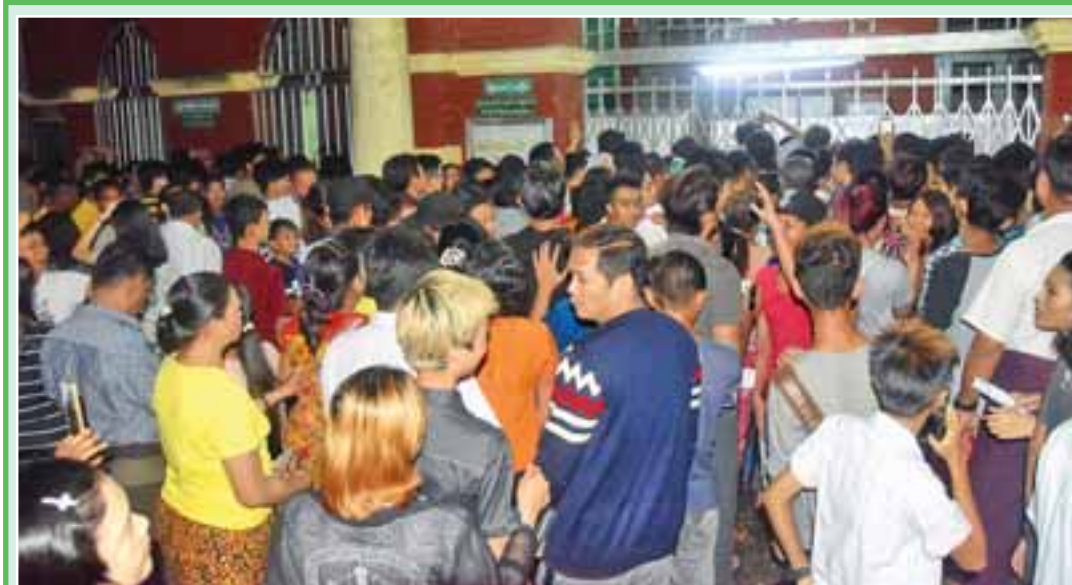
၂၀၁၇ ခုနှစ် တက္ကသိုလ်ဝင်စာမေးပွဲအောင်စာရင်းများကို ဇွန် ၁၇ ရက် နံနက်ပိုင်းက ထုတ်ပြန်ကြေညာရာ ရန်ကုန်မြို့ အထက(၄) အလုံတွင် လာရောက်ကြည့်ရှုကြသည့် ကျောင်းသား ကျောင်းသူများနှင့် မိဘအုပ်ထိန်းသူများအား တွေ့ရစဉ်။