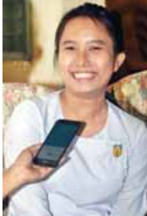
မကြယ်စင်စု