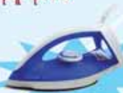
PHILIPS GC 120/21

ဖော်ပြပါပစ္စည်းဝယ်ယူပြီး ကျပ် ၁၉,၀၀၀ တန်ဖိုးရှိ Iron ရယူလိုက်ပါ