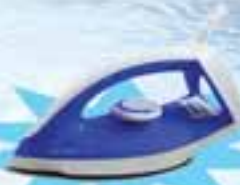
PHILIPS GC 120/19

ဖော်ပြပါပစ္စည်းဝယ်ယူပြီး ကျပ် ၁၉,၀၀၀ တန်ဖိုးရှိ Iron ရယူလိုက်ပါ