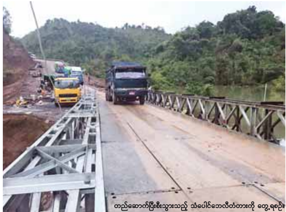
တည်ဆောက်ပြီးစီးသွားသည့် သံပေါင်ဘေလီတံတားကို တွေ့ရစဉ်။