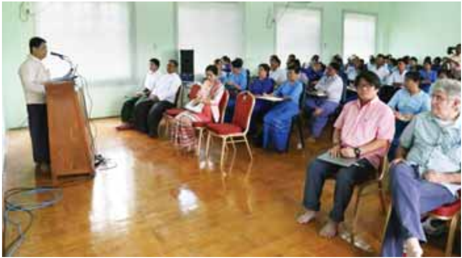
ယခုကဲ့သို့ နိုင်ငံတကာနှင့်ပူးပေါင်း၍ အလုပ်ရုံ ဆွေးနွေးပွဲနှင့် စာတမ်းဖတ်ပွဲများ ပြုလုပ်နိုင်ခဲ့ခြင်းကြောင့် တက္ကသိုလ်များရှိ ဆရာ ဆရာမများ၊ ကျောင်းသား ကျောင်းသူများ၏ သုတေသနစွမ်းရည်ပိုမိုဖွံ့ဖြိုးတိုးတက် စေရုံသာမက သဘာဝပတ်ဝန်းကျင်ထိန်းသိမ်းရေးနှင့် ရေရှည်တည်တံ့ခိုင်မြဲရေးအတွက် အသိပညာဗဟုသုတများ ရရှိကြကြောင်း သိရသည်။ (ကြေးမုံ)

ရေရှည်တည်တံ့စွာထုတ်ယူရေး၊ လေထုညစ်ညမ်းမှုမှ ကာကွယ်ရေး၊ သဘာဝဘေးအန္တရာယ်ကျရောက်ပြီး ကူးစက်ရောဂါများဖြစ်ပွားမှုကာကွယ်ရေး၊ ကျန်းမာရေး စောင့်ရှောက်မှုတွင် လက်ဆေးသန့်စင်ခြင်းလုပ်ငန်းတို့နှင့် ပတ်သက်၍ ဆွေးနွေးခြင်း၊ စာတမ်းဖတ်ကြားခြင်းများ ပြုလုပ်ခဲ့ကြသည်။