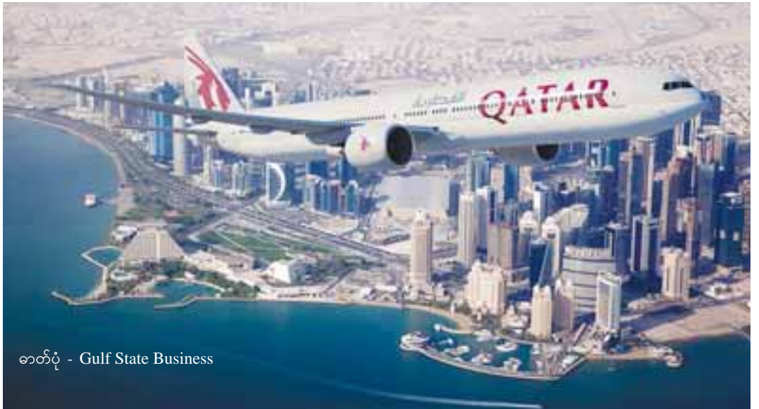
ဓာတ်ပုံ - Gulf State Business

အကြမ်းဖက်မှု အားပေးသည့်နိုင်ငံဟုဆိုကာ ကာတာနိုင်ငံကို ကြိမ်းမောင်းပြစ်တင်ခဲ့သည့် အမေရိကန်သမ္မတ ဒေါ်နယ်ထရန်သည် ယင်းနိုင်ငံအား ဒေါ်လာ ၂၁ ဘီလီယံ ဖိုး စစ်လက်နက်ပစ္စည်းများကို ဝယ်ယူခွင့် ပေးလိုက်ရာ ကမ္ဘာ့နိုင်ငံများက အံ့အားသင့်မှု ဖြစ်ကြရလေသည်။