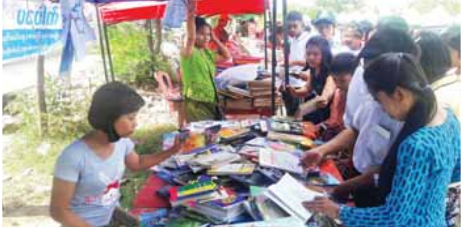
အမျိုးသားခေါင်းဆောင်ကြီး ဗိုလ်ချုပ်အောင်ဆန်း ကြေးရုပ်တုဖွင့်ပွဲအဖြစ် စာအုပ်ရေးရောင်းပွဲတော် ကျင်းပစဉ်။