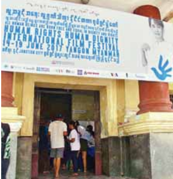
ရက်အထိ ပြသသွားမည်ဖြစ်ကာ မည်သူမဆို အခမဲ့ လာရောက်ကြည့်ရှုနိုင် ကြောင်း သိရသည်။ သတင်း-ခင်ဇော်

လူ့အခွင့်အရေး၊ လူ့ဂုဏ်သိက္ခာ နိုင်ငံတကာရုပ်ရှင်ပွဲတော် စတင် ပြသသည့် ဇွန် ၁၅ ရက်တွင် အဖွင့်ဇာတ်ကားအဖြစ် ဒါရိုက်တာ စိန်လင်းနှင့် ဘိုသက်ထွန်းတို့ ရိုက်ကူးထားသည့် The Danu Land ဇာတ်ကားကို ဝဇီရာ ရုပ်ရှင်ရုံ၌ ပြသခဲ့သည်။ ရုပ်ရှင်ဇာတ်ကားများကို တစ်နေ့လျှင် ရုပ်ရှင် ဇာတ်ကား ၁၀ ကားနှုန်းဖြင့် ပြသသွားမည်ဖြစ်ပြီး ဇွန် ၁၅ ရက်မှ ခု