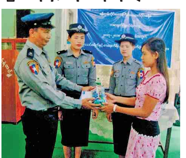
သားသမီးများ ဖြစ်ကြသော စုစုပေါင်း ၂၉ ဦးတို့အားပေးအပ်ခြင်း တက္ကသိုလ်အဆင့်၊ အထက်တန်း၊ ဖြစ်ကြောင်း သိရသည်။ အလယ်တန်းနှင့် မူလတန်းအဆင့် (ခင်မောင်သော်)