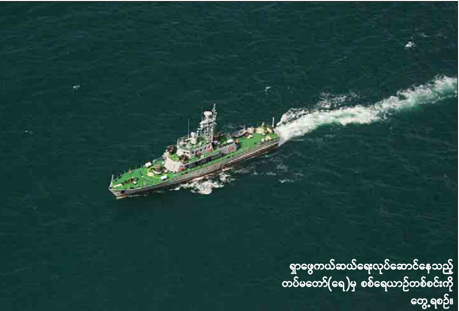
ရှာဖွေကယ်ဆယ်ရေးလုပ်ဆောင်နေသည့် တပ်မတော်(ရေ)မှ စစ်ရေယာဉ်တစ်စင်းကို တွေ့ရစဉ်။

ယနေ့အထိ ပင်လယ်ပြင်အတွင်းမှ ရှာဖွေတွေ့ရှိခဲ့သည့် စာဖျက်နှာ ၉ ကော်လံ ၁ သို့ □