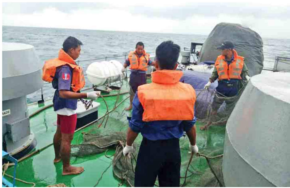
စစ်ရေယာဉ်များဖြင့် ပင်လယ်ပြင်ရှာဖွေတွေ့ရှိရသည့် ရုပ်အလောင်းများ ဆောင်ရွက်နေစဉ်။