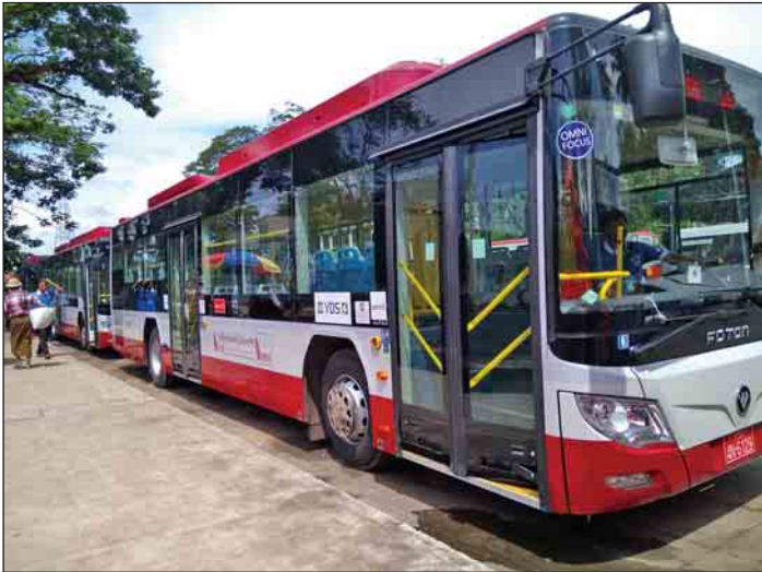
YBS (၅၆) တွင် ပြေးဆွဲလျက်ရှိသည့် Foton ဘတ်စ်ကား။

တွေ့ဆုံပွဲအပြီးတွင် နိုင်ငံတော်၏အတိုင်ပင်ခံပုဂ္ဂိုလ်အား ဆွီဒင်နိုင်ငံခြားရေးဝန်ကြီးက ဂုဏ်ပြုနေလှယ်စာ ဖြင့် တည်ခင်းဧည့်ခံသည်။ (သတင်းစဉ်)