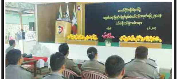
tr ppe & n& c f i h i f i e f t r ၆၀ ( 2 ^ 2 0 1 7 ) o i f i e f q i f y l u k...