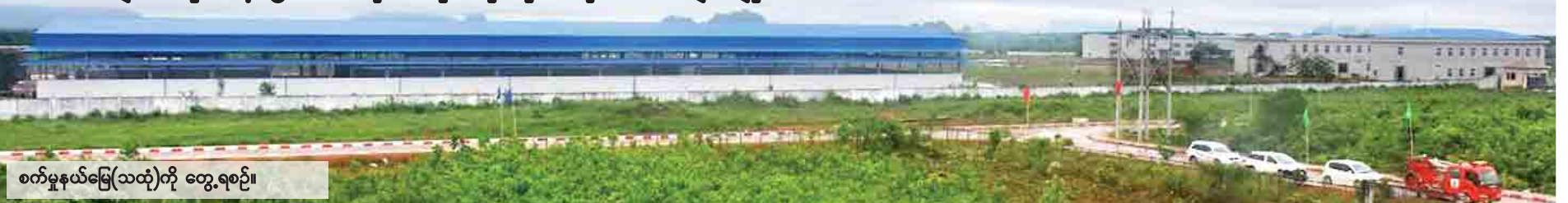
စက်မှုနယ်မြေ(သထုံ)ကို တွေ့ရစဉ်။