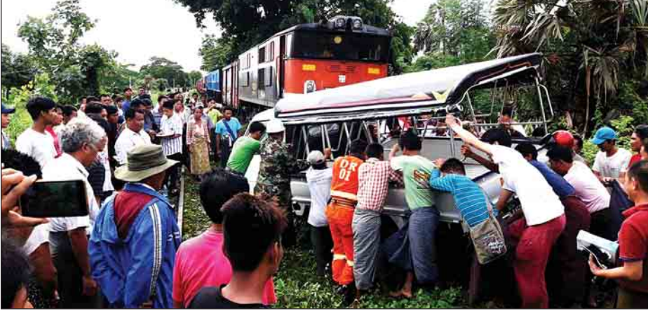
တောင်ငူမြို့နယ် ကံရိုးကျေးရွာအနီးတွင် ဇွန် ၁၁ ရက် ညနေပိုင်းက သာစည်မှ ထွက်ခွာလာသော အမှတ်(၂၁) အစုန်ရထားက ကားတစ်စီးကို ဝင်တိုက်မှုဖြစ်ပွားစဉ်။ (ကားမှာ ရထားရှေ့ခေါင်းပိုင်းတွင် သုံးဖာလုံခန့်ချိတ်ပါသွားပြီး ယာဉ်မောင်းဖြစ်သူ ထိခိုက်ဒဏ်ရာအနည်းငယ်သာရရှိသည်ဟု သိရသည်။) ပြုံးကိုလင်း(ညောင်ပိုင်)