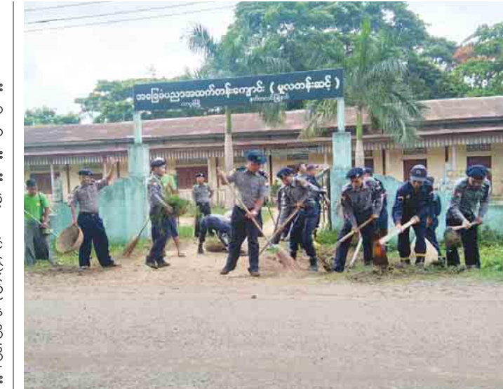
လူထုအကျိုးပြုကျောင်းသန့်ရှင်းရေးပိုင်းဝန်းဆောင်ရွက်