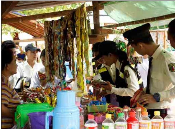
ဆက်လက်မရောင်းချရန် မှာကြားခဲ့ကြောင်း၊ တစ်ဆက်တည်းမှာပင် ခွင့်ပြုချက်မရသော ခွင့်ပြုရက်ကုန်ဆုံးသော စားသောက်ကုန်များနှင့် ဆက်စပ်ပစ္စည်းများ ရောင်းချသည့် ပင်ရင်းဆိုင်များကို ဆက်လက်စစ်ဆေးပေးခဲ့ကြောင်း၊ တာဝန်ရှိသူများက တက်ရောက်လာကြသော ဆရာ ဆရာမများ၊ ကျောင်းသားမိဘများ၊ ကျောင်းသား ကျောင်းသူများနှင့် ကျောင်းတွင်းမှန်စေ့တန်းများတွင် ဈေးရောင်းချသူများအား ကျန်းမာရေးနှင့်ညီညွတ်သည့် စားသောက်ကုန်များ ရောင်းချ၊ ဝယ်ယူနိုင်ရေး အသိပညာပေးခဲ့ကြောင်း သိရသည်။ (သန့်မောင်)

နေပြည်တော် ဇွန် ၁၁ ကျန်းမာရေးနှင့်ညီညွတ်သည့် စားသောက်ကုန်များ ရောင်းချဝယ်ယူနိုင်ရေး အသိပညာပေးဟောပြောခြင်းနှင့် အခြေခံပညာကျောင်း မှန်စေ့တန်းများ ကွင်းဆင်းစစ်ဆေးခြင်းကို ဇွန် ၈ ရက်က နေပြည်တော် မြို့နယ်ရှိ အခြေခံပညာအထက်တန်းကျောင်းများ၌ပြုလုပ်ရာ အစားအသောက်နှင့် ဆေးဝါးကွပ်ကဲရေးဦးစီးဌာနမှ (နေပြည်တော်တာဝန်ခံ) ဒုတိယညွှန်ကြားရေးမှူး ဒေါက်တာထွန်းလင်းအောင် ဦးဆောင်သောအဖွဲ့နှင့် ဌာနဆိုင်ရာ တာဝန်ရှိသူများက လက်တွေ့ကွင်းဆင်းဆောင်ရွက်ခဲ့သည်။