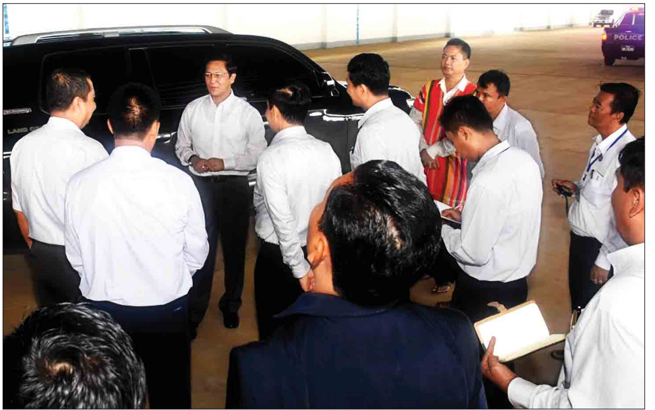
ဒုတိယသမ္မတ ဦးဟင်နရီဗန်ထီးယူ သထုံမြို့စက်မှုနယ်မြေအတွင်း တည်ဆောက်ထားသည့် အဆောက်အအုံများ၊ ဆောင်ရွက်မည့်လုပ်ငန်းများနှင့်ပတ်သက်၍ မှာကြားစဉ်။

စက်မှုနယ်မြေ(သထုံ)အဖြစ် ပြောင်းလဲဆောင်ရွက်နိုင်ရန်အတွက် စက်ရုံမြေ ၆၇၈ ဧကပေါ်တွင် ပြည်တွင်း၊ ပြည်ပမှ စိတ်ဝင်စားသည့် စက်မှုလုပ်ငန်းရှင်များ ရင်းနှီးမြှုပ်နှံနိုင်ရန် ဖိတ်ခေါ်ခဲ့ရာ ကုမ္ပဏီခုနစ်ခုမှ အဆိုပြုလွှာများ တင်သွင်းခဲ့ကြောင်း၊ ယင်းအဆိုပြုလွှာများကို စက်မှုဝန်ကြီးဌာန ကျွမ်းကျင်ပညာရှင်များပါဝင်သော အဖွဲ့များဖြင့် စိစစ်ဆောင်ရွက်လျက်ရှိပြီး