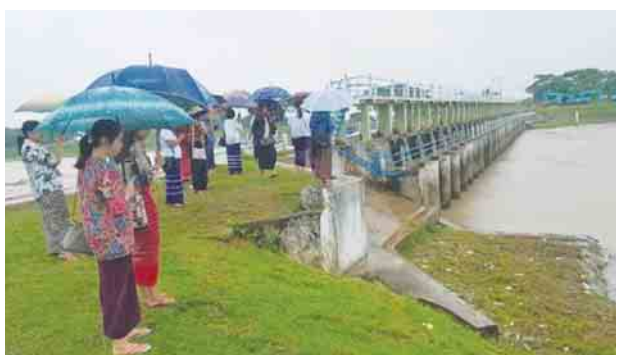
သနပ်ပင်မြို့နယ်အတွင်း ဆည်မြောင်းလုပ်ငန်းများ လေ့လာ