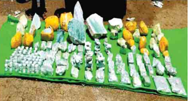
သိုဝှက်သယ်ဆောင်လာသည့် ကျောက်စိမ်းဟုယူဆရသောကျောက်တုံး၊ ကျောက်ဖြတ်စများနှင့် ကျောက်ပုတီးစများအား တွေ့ရစဉ်။

တရားမဝင်ကုန်စည်များ တားဆီးထိန်းချုပ်ရေးအတွက် ရေပူနှင့်မရမ်းချောင် အမြဲတမ်းစစ်ဆေးရေးစခန်းတို့ကို ဌာနဆိုင်ရာပူးပေါင်းအဖွဲ့များဖြင့် မတ် ၁ ရက်တွင် စတင်ဖွင့်လှစ်ဆောင်ရွက်ခဲ့ပြီး ဇွန် ၁၀ ရက်တွင် မန္တလေး-မူဆယ် ပြည်ထောင်စုလမ်းမကြီးတစ်လျှောက် ကုန်သွယ်မှုယာဉ် ပို့ကုန် ၄၄၈ စီး၊