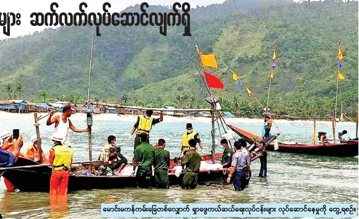
မောင်းမကန်ကမ်းခြေတစ်လျှောက် ရှာဖွေကယ်ဆယ်ရေးလုပ်ငန်းများ လုပ်ဆောင်နေမှုကို တွေ့ရစဉ်။

တပ်မတော် Y-8 လေယာဉ်ပျက်ကျခဲ့သည့် နေရာတစ်ဝိုက်၌ ယနေ့နံနက်ပိုင်း တွင် ရာသီဥတုအသင့်အတင့်ကောင်းမွန်လာသည့်အတွက် တပ်မတော်(ရေ)မှ စစ်ရေ ယာဉ်များ၊ တပ်မတော်(လေ)မှ လေယာဉ်၊ ရဟတ်ယာဉ်များ၊ ငါးဖမ်းစက်လှေများ၊ မြေပြင် တပ်များနှင့် ဒေသခံပြည်သူများပူးပေါင်း၍ ရှာဖွေကယ်ဆယ်ရေးလုပ်ငန်းများ ဆောင်ရွက် ခဲ့ရာ ရုပ်အလောင်း ၂၆ လောင်း ထပ်မံရှာဖွေတွေ့ရှိခဲ့ကြောင်း သိရသည်။ ယနေ့ညနေ ၄ နာရီအထိ မောင်းမကန်ကမ်းခြေတစ်လျှောက် ဖြန့်ခွဲထားသည့် မြေပြင်တပ်များနှင့် ဒေသခံပြည်သူများက အမျိုးသားရုပ်အလောင်း ရှစ်လောင်း၊ ကလေး ရုပ်အလောင်း တစ်လောင်းနှင့် ကျား/မ မခွဲခြားနိုင် ရုပ်အလောင်းတစ်လောင်း၊ လောင်းလုံ ဘုတ်ကျွန်းအနီး၌ ရှာဖွေကယ်ဆယ်ရေး လုပ်ဆောင်နေသည့် စစ်ရေယာဉ် နှစ်စင်းက အမျိုးသားရုပ်အလောင်း လေးလောင်းနှင့် အမျိုးသမီး ရုပ်အလောင်း နှစ်လောင်း၊ ဒေသခံ ငါးဖမ်းလှေများက စာမျက်နှာ ၉ ကော်လံ ၁ သို့ ❖