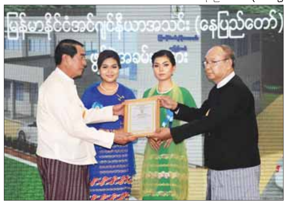
အမျိုးသားလွှတ်တော်ဥက္ကဋ္ဌ မန်းဝင်းခိုင်သန်း အလှူရှင်တစ်ဦးအား ဂုဏ်ပြုမှတ်တမ်းလွှာ ပေးအပ်စဉ်။

နိုင်ငံတော်သမ္မတနှင့် ဇနီးတို့သည် နိုင်ငံတော်ဖွဲ့စည်းပုံအခြေခံ ဥပဒေဆိုင်ရာခုံရုံး ဥက္ကဋ္ဌ၊ ပြည်ထောင်စုရွေးကောက်ပွဲ ကော်မရှင်ဥက္ကဋ္ဌ၊ ပြည်ထောင်စုဝန်ကြီးများ၊ ဒုတိယ