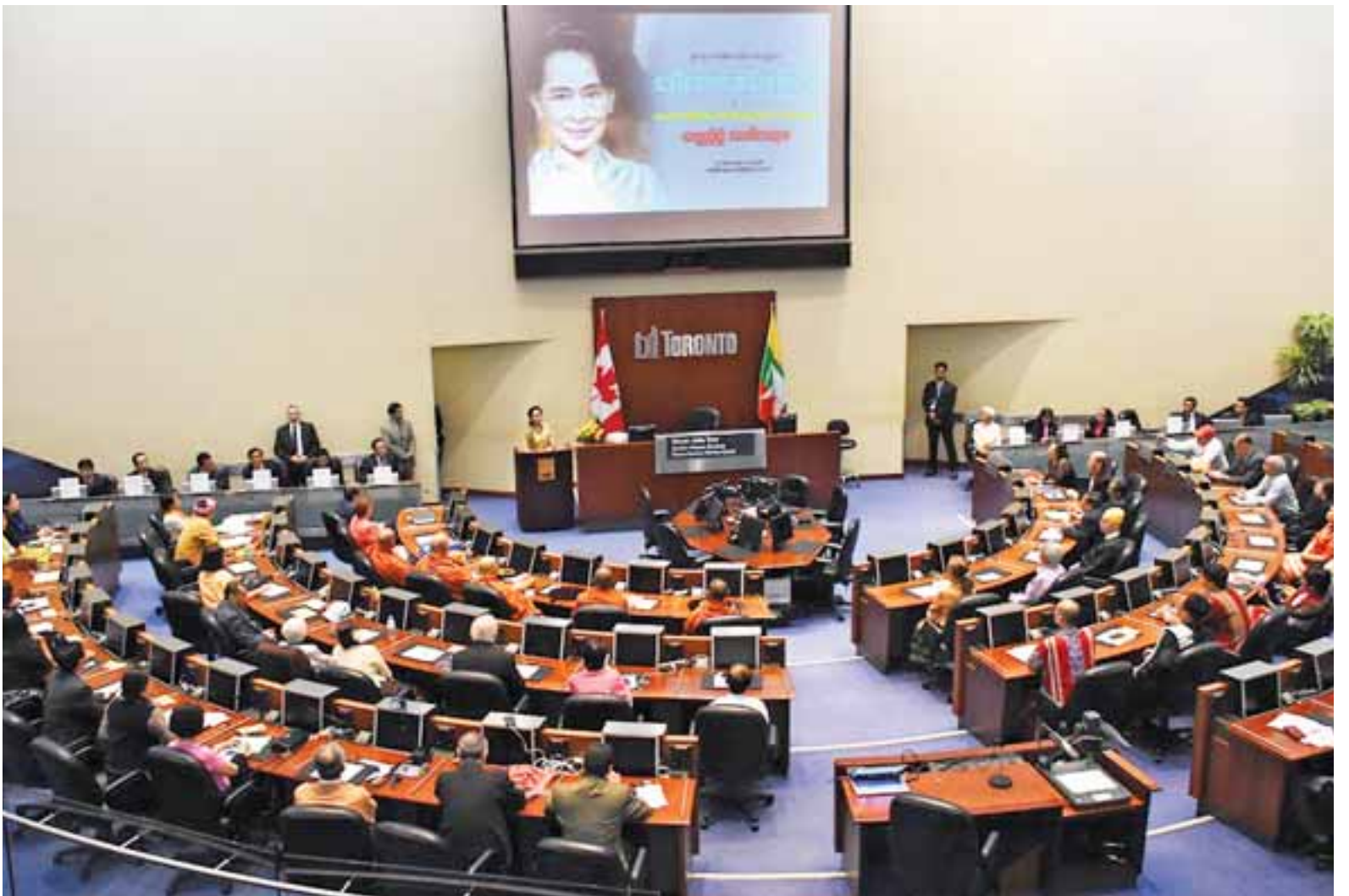
နိုင်ငံတော်၏အတိုင်ပင်ခံပုဂ္ဂိုလ် ခေါ်အောင်ဆန်းစုကြည် ကနေဒါနိုင်ငံ တိုရွန်တိုမြို့တွင် နေထိုင်ကြသည့် မြန်မာအသိုက်အဝန်းနှင့် တွေ့ဆုံပွဲတွင် အမှာစကားပြောကြားစဉ်။

“ကျွန်မဘယ်သွားသွား ကျွန်မတို့ရဲ့ ပရိသတ်ထဲက၊ ကျွန်မတို့နိုင်ငံက ရောက်လာတဲ့ ပြည်သူပြည်သားတွေ ထဲကနေ မေးခွန်းတွေကို လက်ခံဖြေကြားပါတယ်။ အဲဒီလိုဖြေတယ်ဆိုတာ ကျွန်မတို့နိုင်ငံရဲ့ အခုလက်ရှိ အခြေအနေကို တတ်နိုင်သလောက် ပြည်ပရောက်နေတဲ့ ပြည်သူပြည်သားတွေကို သိစေချင်လို့ပါ။ တချို့က နိုင်ငံနဲ့ ဝေးနေပြီဆိုတော့ တကယ် ဘာဖြစ်နေသလဲဆိုတာကို သိပ်ပြီး မသိကြတာတွေလည်း ရှိပါတယ်။ ဥပမာဆိုရင် ကျွန်မခဏခဏ အမေးခံရတဲ့ကိစ္စ။ ကျွန်မတို့ NLD အစိုးရ တာဝန်ယူပြီးတဲ့နောက်ပိုင်းမှာ မြန်မာနိုင်ငံရဲ့ နိုင်ငံခြားရေးရုံးကနေ သံရုံးတွေက ပြည်သူပြည်သားတွေအပေါ်