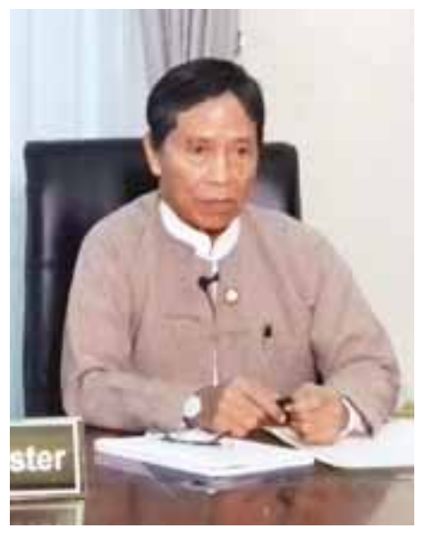
ပြည်ထောင်စုဝန်ကြီး ဦးကျော်ဝင်း

မြေကိုရင်းမယ်ဆိုရင် လယ်ယာကဏ္ဍထဲမှာ ပါဝင်ပြီး ဆောင်ရွက်လာမယ့် လယ်ယာစိုက်ပျိုးရေးလုပ်ငန်း လုပ်ဆောင်မယ့် ကုမ္ပဏီတွေနဲ့ တောင်သူလယ်သမားတွေက သူတို့ပိုင်တဲ့မြေကို လယ်ယာစိုက်ပျိုးရေးကဏ္ဍမှာ ရှယ်ယာ အဖြစ်နဲ့ ထည့်ဝင်ဆောင်ရွက်မယ်ဆိုလို့ရှိရင် တောင်သူ လယ်သမားတွေအနေနဲ့ မိမိတစ်ယောက်တည်းက ပင်ပန်း ကြီးစွာ ရုန်းကန်နေရတဲ့အခြေအနေကနေ အများကြီး သက်သာသွားမှာဖြစ်ပါတယ်။ ကုမ္ပဏီနဲ့အတူ ပူးပေါင်း ဆောင်ရွက်ခြင်းအတွက် တောင်သူလယ်သမားတွေဟာ ကုမ္ပဏီမှာ အစုရှယ်ယာပိုင်ဆိုင်တဲ့ တောင်သူလယ်သမား တွေဖြစ်လာမယ်။ နှစ်ချုပ် ချုပ်တဲ့အခါကျရင်လည်း နှစ်ချုပ် ငွေစာရင်းရှင်းတမ်းထွက်လာတဲ့အခါ ကုမ္ပဏီရဲ့အကျိုး အမြတ်အပေါ် သူတို့ရဲ့အမြတ်ဝေစုတွေကို ခံစားရလာမှာ ဖြစ်ပါတယ်။ တစ်ချိန်တည်းမှာပဲ တောင်သူလယ်သမား