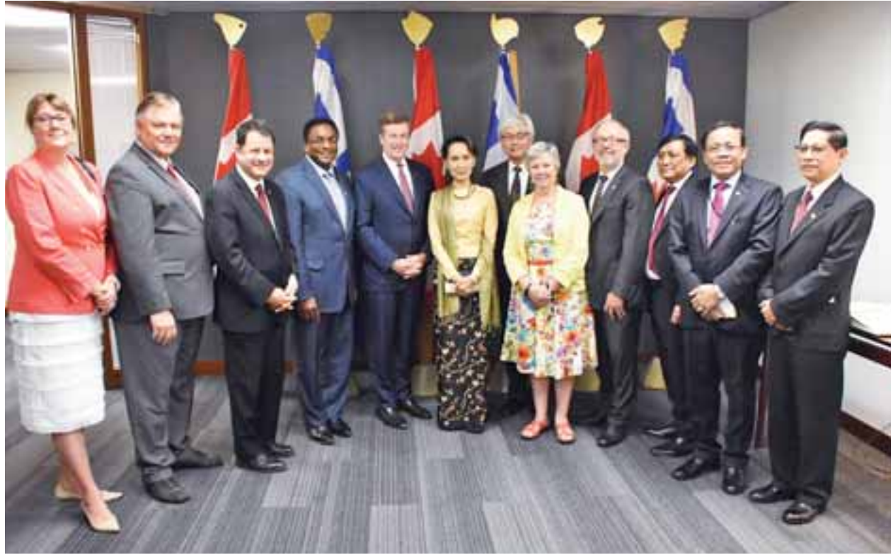
နိုင်ငံတော်၏အတိုင်ပင်ခံပုဂ္ဂိုလ် ခေါ်အောင်ဆန်းစုကြည်နှင့်အဖွဲ့နှင့် တိုရွန်တိုမြို့တော်ဝန် မစ္စတာ ဂျွန်တေလာနှင့် မြို့တော်ကောင်စီဝင်များ အမှတ်တရဓာတ်ပုံရိုက်ကြစဉ်။

“ဘယ်လိုပဲပြောပြော၊ ပြည်ထောင်စု ငြိမ်းချမ်းရေးညီလာခံ- (၂၁)ရာစု ပင်လုံအစည်းအဝေး နှစ်ကြိမ်ကျင်းပ ပြီးပါပြီ။ အားလုံးက ကျေနပ်သလား ဆိုတော့ မကျေနပ်ပါဘူး။ အစည်း အဝေးနှစ်ခုတည်းနဲ့ နှစ်(၇၀) ကြာခဲ့ တဲ့ ပြည်တွင်းစစ်ကြီးကို အားလုံး အဖြေရှာနိုင်မယ်ဆိုရင် ဒါဟာ တော်တော်ထူးဆန်းမှာပဲ ဖြစ်ပါတယ်။ အဓိက အရေးကြီးတာက စိတ်ဓာတ် ခိုင်မာဖို့ပါပဲ။ ငြိမ်းချမ်းရေးရအောင် လုပ်မယ်ဆိုတဲ့ သန္နိဋ္ဌာန်ခိုင်မာဖို့ပဲ ဖြစ်ပါတယ်။ စာမျက်နှာ ၅ သို့ >>>