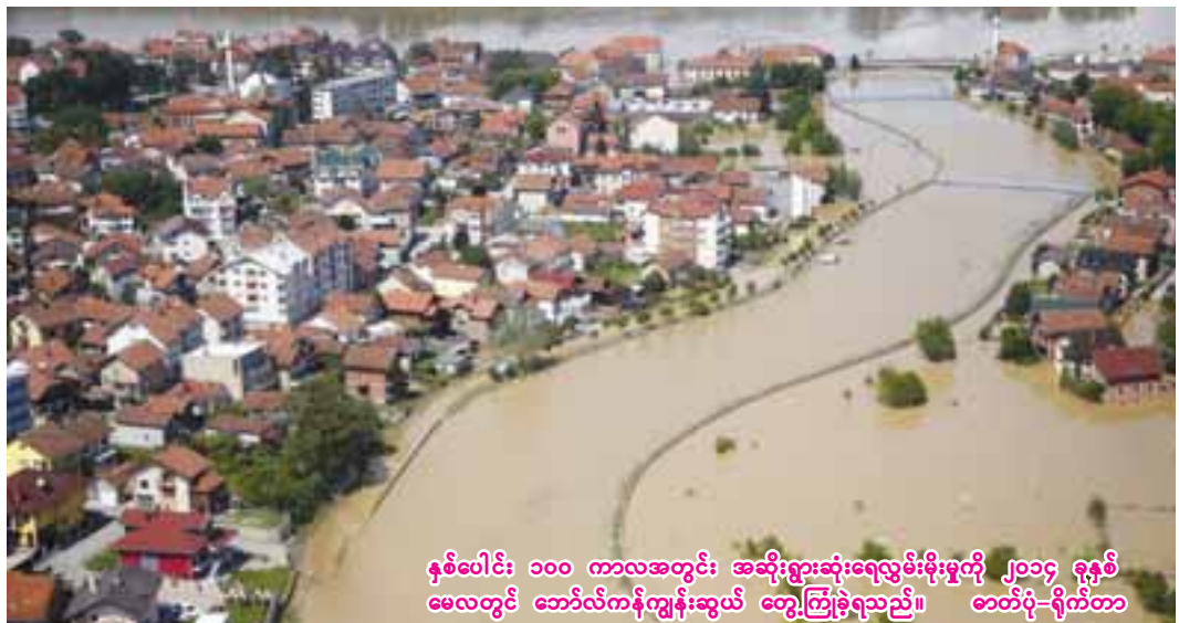
နယ်ပေါင်း ၁၀၀ ကာလအတွင်း အဆိုးရွားဆုံးရေလွှမ်းမိုးမှုကို ၂၀၁၄ ခုနှစ် မေလတွင် ဘော်လီကန်ကျွန်းဆွယ် တွေ့ကြုံခဲ့ရသည်။ ဘဝတို-ရိုက်တာ