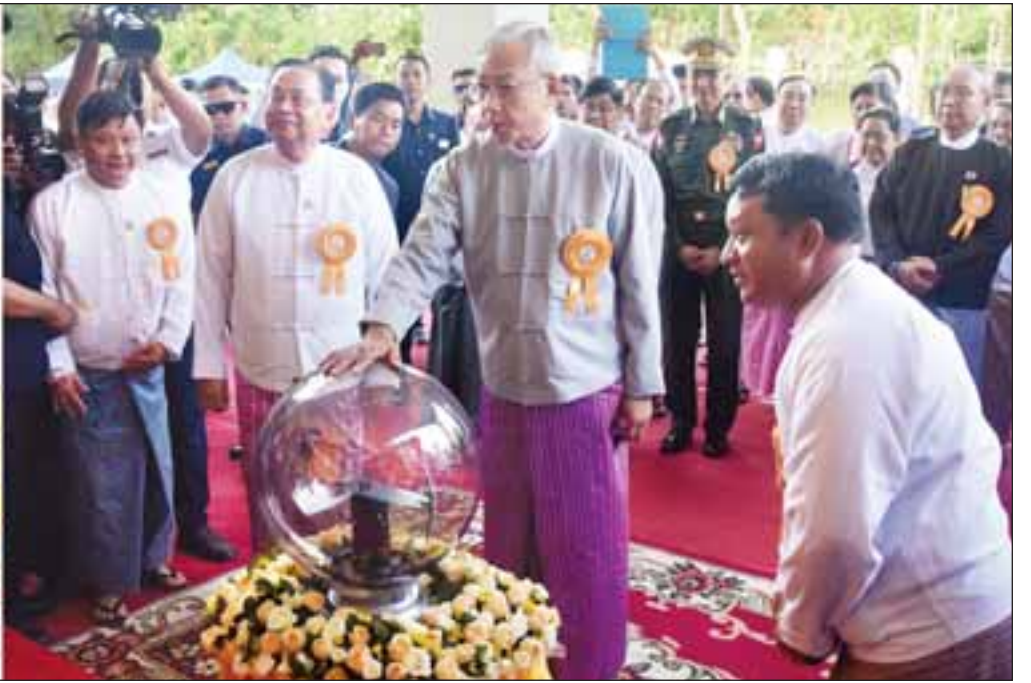
နိုင်ငံတော်သမ္မတ ဦးထင်ကျော် မြန်မာနိုင်ငံ အင်ဂျင်နီယာအသင်း(နေပြည်တော်)အဆောက်အအုံကမ္ဘာ့မော်ကွန်းကို စက်ခလုတ်နှိပ်ဖွင့်လှစ်ပေးစဉ်။

အခြေခံအားဖြင့် အင်ဂျင်နီယာကဏ္ဍ၏ တီထွင်မှုများ၊ ဆန်းသစ်မှုများမှ တစ်ဆင့် စက်မှုနိုင်ငံတော်အဖြစ် တည်ဆောက်နိုင်ခဲ့ကြသည်ကို တွေ့ရှိရမည်ဖြစ်ပါကြောင်း၊ လယ်ယာစိုက်ပျိုးရေးကို အခြေခံသည့် နိုင်ငံများလည်း ထွန်ယက်ရေး၊ ရိတ်သိမ်းခြွေလှေ့ရေးနှင့် ကုန်ချောအဖြစ် ဖွေးကွက်သိုက်ပို့ရေး၊ သယ်ယူပို့ဆောင်