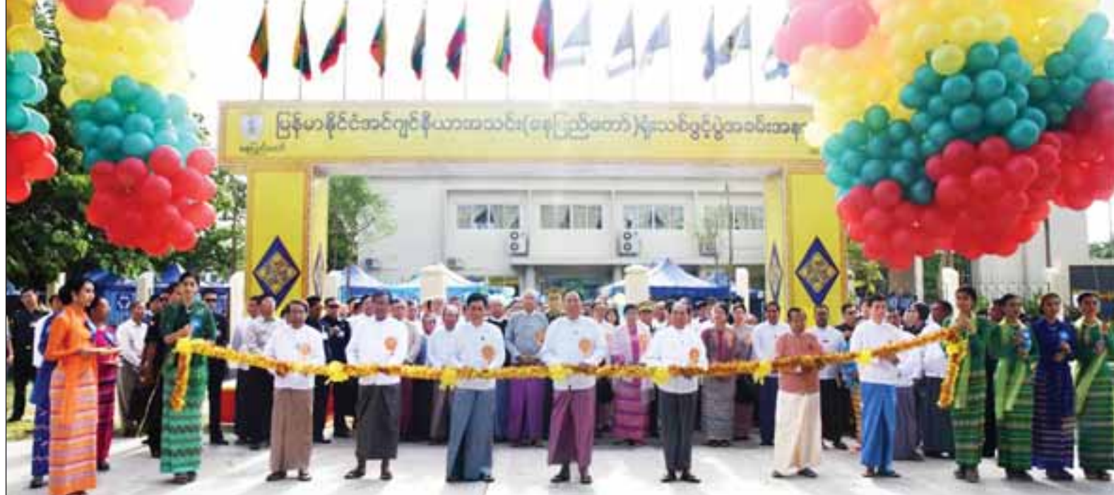
ပြည်ထောင်စုဝန်ကြီး ဦးခင်မောင်ချို၊ ဦးဝင်းခိုင်နှင့် တာဝန်ရှိသူများ မြန်မာနိုင်ငံ အင်ဂျင်နီယာအသင်း(နေပြည်တော်)ရုံးသစ်ကို ဖဲကြီးဖြတ်ဖွင့်လှစ်ပေးစဉ်။ (သတင်းစဉ်)

ကြည့်ရှုလေ့လာကြသည်။ ယနေ့ဖွင့်လှစ်လိုက်သည့် မြန်မာနိုင်ငံ အင်ဂျင်နီယာအသင်း(နေပြည်တော်)ရုံးသစ်နှင့် နည်းပညာဆိုင်ရာစာကြည့်တိုက်သည် နေပြည်တော်ဥက္ကဋ္ဌရသီရိမြို့နယ် ဇော်ဝန်သိဒ္ဓိရပ်ကွက်တွင်တည်ရှိပြီး မြေဧရိယာအကျယ်အဝန်း နှစ်ဧကပေါ်တွင် တည်ဆောက်ထားသည့် RC နှစ်ထပ်ဆောင်ဖြစ်သည်။