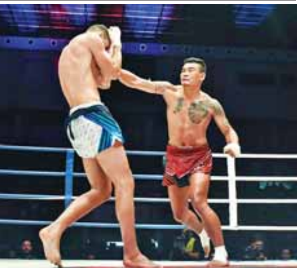
တူးတူး(နဂါးမာန်)နှင့် ဂျိမ်းစ်ဘီနယ်လ် (ပြင်သစ်)တို့ ထိုးသတ်ကြစဉ်။ (ဓာတ်ပုံ - WLC)

နေပြည်တော် ဇွန် ၁၀ - ပျက်ကျသွားခဲ့သည့် တပ်မတော်ပို့ဆောင်ရေး Y-8 လေယာဉ်အား ရှာဖွေကယ်ဆယ်ရေးလုပ်ငန်းများ ဆောင်ရွက်လျက်ရှိရာ ယနေ့အထိ ရုပ်အလောင်း ၃၃ လောင်းအား ဆယ်ယူရရှိခဲ့ပြီး ရုပ်အလောင်း ၁၉ လောင်းအား ရုပ်အမည် အတည်ပြုနိုင်ခဲ့သည်။ ယနေ့အထိ ဆယ်ယူရရှိခဲ့သည့် ရုပ်အလောင်းများအနက် အမျိုးအမည် ခွဲခြားနိုင်ပြီး သက်ဆိုင်ရာမိသားစုများရောက်ရှိလာသည့် ရုပ်အလောင်း ၁၉ လောင်းအား ကျန်ရစ်သူမိသားစုဝင်များ၊ တပ်နယ်မှအရာရှိ၊ စစ်သည်၊ မိသားစုများနှင့် ဒေသခံပြည်သူများက ကောင်းမွန်စွာ သိရှိလာပေးခဲ့သည်။ ယနေ့နံနက်ပိုင်းတွင် ပင်လယ်ပြင်ရှာဖွေရေးလုပ်ငန်းများ ဆောင်ရွက်လျက်ရှိသည့် နေရာတစ်ဝိုက်တွင် ဘင်္ဂလားပင်လယ်အော်အလယ်ပိုင်းတွင် ဖြစ်ပေါ်နေသော လေဖိအားနည်းရပ်ဝန်း၏အရှိန်ကြောင့် ရာသီဥတု ပိုမိုဆိုးရွားနေပြီး လှိုင်းအမြင့် ကိုးပေခန့်နှင့် လေတိုက်နှုန်း တစ်နာရီ ၁၅ မိုင်မှ မိုင် ၂၀ အတွင်းရှိနေ၍ ရှာဖွေရေးလုပ်ငန်းများလုပ်ဆောင်ရန် စောင့်ဆိုင်းနေ ခဲ့ရသည်။ ညနေ ၄ နာရီခန့်တွင် ရာသီဥတုအသင့်အတင့် ကောင်းမွန်လာသဖြင့် တပ်မတော်(လေ)မှ ရဟတ်ယာဉ်များ၊ တပ်မတော်(ရေ)မှ စစ်ရေယာဉ်များနှင့် ဒေသခံငါးဖမ်းစက်လှေများဖြင့် ရှာဖွေရေးလုပ်ငန်းများ ဆက်လက်လုပ်ဆောင်ခဲ့ကြောင်း တပ်မတော်ကာကွယ်ရေးဦးစီးချုပ်ရုံးမှ သိရသည်။ (သတင်းစဉ်)