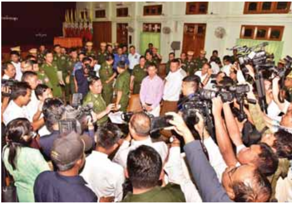
ယနေ့ကျင်းပသည့် အလှူငွေပေးအပ်လှူဒါန်းပွဲတွင် စေတနာရှင်အလှူရှင်များ၏ အလှူငွေများပေးအပ်လှူဒါန်းမှု စုစုပေါင်းမှာ ငွေကျပ် ၉၉၀၈ သိန်းကျော်ဖြစ်ကြောင်း သတင်းရရှိသည်။ (သတင်းစဉ်)

ထို့နောက် ဒုတိယဗိုလ်ချုပ်မှူးကြီးမောင်အေး(ငြိမ်း)နှင့်ဇနီး ဗိုလ်မှူးဒေါ်မြမြစန်း(ငြိမ်း)မိသားစုက ငွေကျပ်သိန်း ၃၀၀၊ တပ်မတော်အရာရှိကြီးများ မိသားစုက ငွေကျပ် ၄၃၀ သိန်း၊ ဒုတိယတပ်မတော်အရာရှိချုပ်များနှင့် မိသားစုများက ငွေကျပ် ၁၅၈ သိန်း၊ တိုင်းတပ်မများမှ အရာရှိ စစ်သည်၊ မိသားစုများ၏ လှူဒါန်းငွေကျပ် ၂၉၉၇ သိန်းကို အသီးသီးပေးအပ်လှူဒါန်းရာ တပ်မတော်ကာကွယ်ရေးဦးစီးချုပ်က လက်ခံရယူသည်။ ယင်းနောက် တပ်မတော်ကာကွယ်ရေးဦးစီးချုပ်နှင့်ဇနီး ဒေါ်ကြူကြူလှမိသားစုက ငွေကျပ် ၁၂၂ သိန်းအပါအဝင် အလှူရှင်များက အလှူငွေများ ပေးအပ်လှူဒါန်းကြသည်။