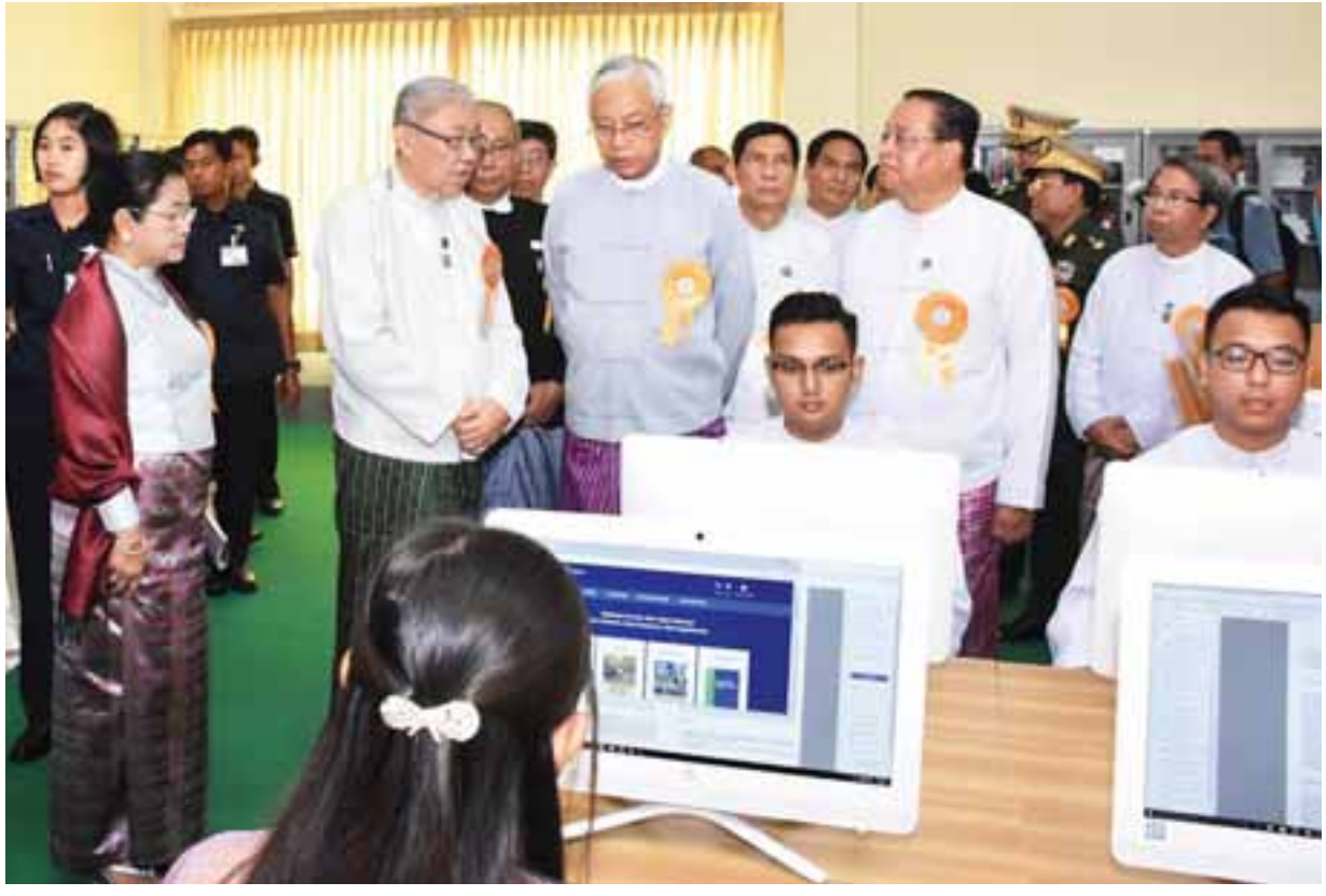
နိုင်ငံတော်သမ္မတ ဦးထင်ကျော်နှင့်ဇနီး ဒေါ်စုစုလွင် နည်းပညာဆိုင်ရာစာကြည့်တိုက်အတွင်း လှည့်လည်ကြည့်ရှုလေ့လာစဉ်။

နေပြည်တော် ၅ နံနက် ၁၀ မြန်မာနိုင်ငံ အင်ဂျင်နီယာအသင်း (နေပြည်တော်) ရုံးသစ်ဖွင့်ပွဲနှင့် နည်းပညာဆိုင်ရာ စာကြည့်တိုက် ဖွင့်ပွဲအခမ်းအနားကို ယနေ့နံနက် ၈ နာရီတွင် နေပြည်တော် ဥက္ကဋ္ဌရသီရိ မြို့နယ် ဇော်ဝန်သီရိရပ်ကွက်ရှိ အဆိုပါရုံး အဆောက်အအုံရှေ့ မျက်နှာစာ၌ကျင်းပရာ နိုင်ငံတော် သမ္မတ ဦးထင်ကျော်နှင့်ဇနီး ဒေါ်စုစုလွင် တို့ တက်ရောက်အားပေးသည်။