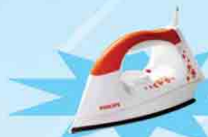
PHILIPS GC 1418/02

ဖော်ပြပါပစ္စည်းဝယ်ယူပြီး ကျပ် ၂၁,၀၀၀ တန်ဖိုးရှိ Iron ရယူလိုက်ပါ