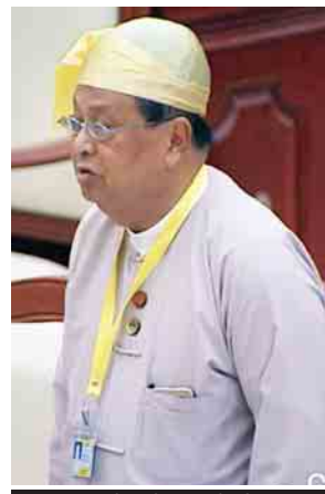
ဆောက်လုပ်ရေးဝန်ကြီးဌာန ပြည်ထောင်စုဝန်ကြီး ဦးဝင်းခိုင်