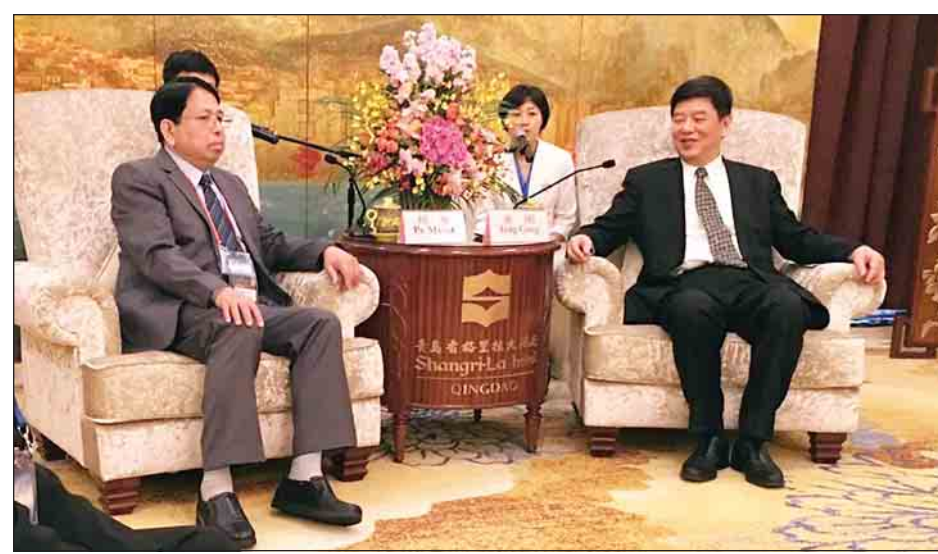
(၁၄)ကြိမ်မြောက် အာရှမီဒီယာထိပ်သီးအစည်းအဝေး ဆက်လက်ကျင်းပ