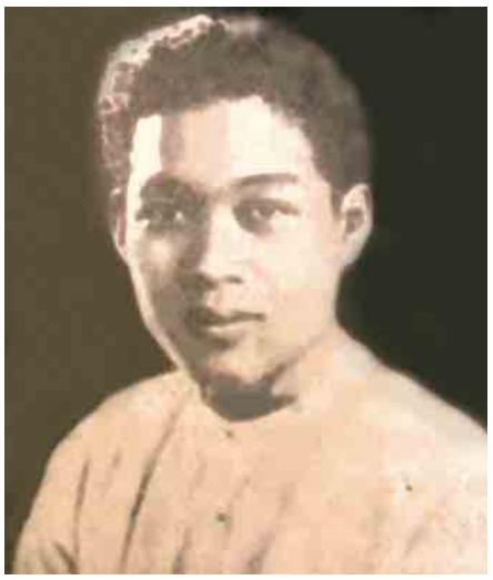
ကိုဗဟိန်း

လည်းဖြစ်တယ်။ မြန်မာ့လွတ်လပ်ရေးအတွက် ကျန်းမာရေးကိုပင် မငဲ့ကွက်ဘဲ ကျရာနေရာက စွမ်းစွမ်းတမံ ဆောင်ရွက်ခဲ့တယ်။ နောက်ဆုံး ရဲဘော် ရဲဖက်များက အလွန်ဆိုးရွားလာတဲ့ သူ့ကျန်းမာရေး ကြောင့် မန္တလေးပြန်ပြီး အနားယူဖို့ တိုက်တွန်းမှ နိုင်ငံရေးတာဝန်တွေ ပခုံးပေါ်က ချပြီး မန္တလေးမိဘများ ရင်ခွင် ခိုဝင်ပြီး ဆေးကုသမှု ခံယူတယ်။ တိုင်းပြည် လွတ်လပ်ရေးအတွက် 'ညီညွတ်ရေး'က အရေးကြီးဆုံး အချိန်၊ လွတ်လပ်ရေးတိုက်ပွဲကာလတစ်လျှောက်