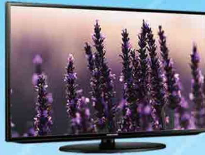
SAMSUNG 48" TV