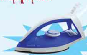
PHILIPS GC 120/21

ဖော်ပြပါပစ္စည်းဝယ်ယူပြီး ကျပ် ၁၉,၀၀၀ တန်ဖိုးရှိ Iron ရယူလိုက်ပါ