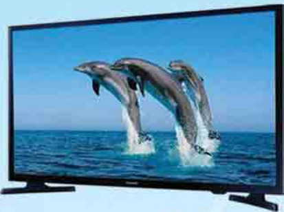
SAMSUNG 32" TV