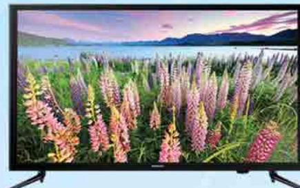
SAMSUNG 40" TV