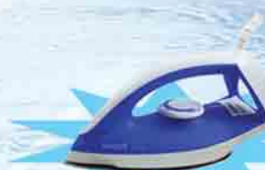
PHILIPS GC 120/19

ဖော်ပြပါပစ္စည်းဝယ်ယူပြီး ကျပ် ၁၉,၀၀၀ တန်ဖိုးရှိ Iron ရယူလိုက်ပါ