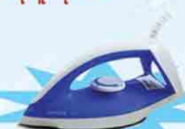
PHILIPS GC 120/20

ဖော်ပြပါပစ္စည်းဝယ်ယူပြီး ကျပ် ၁၉,၀၀၀ တန်ဖိုးရှိ Iron ရယူလိုက်ပါ