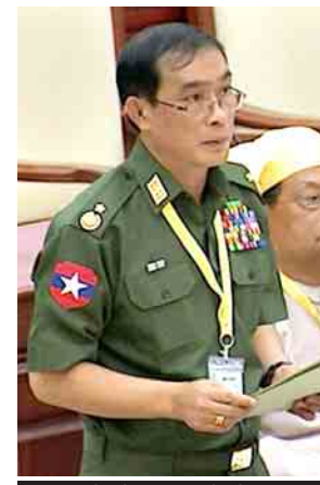
နယ်စပ်ရေးရာဝန်ကြီးဌာန ဒုတိယဝန်ကြီး ဗိုလ်ချုပ်သန်းထွဋ်

ဦးအာမိုးဆီ၏ ခေါင်လန်ဖူး-ညီတားဒီလမ်း ၅၅ မိုင်အတွင်း သဘာဝဘေးအန္တရာယ်ကြောင့် ပျက်စီးခဲ့ရသော လမ်း၊ တံတားများအား အမြန်ဆုံးပြုပြင်ပေးရန်နှင့် ညီတားဒီကျေးရွာအထိ ရာသီမရွေးသွားလာနိုင်သည့်လမ်းဖောက်လုပ်ပေးရန် အစီအစဉ် ရှိ မရှိ မေးခွန်းနှင့်စပ်လျဉ်း၍ ဒုတိယဝန်ကြီး ဗိုလ်ချုပ်သန်းထွဋ်က ခေါင်လန်ဖူး-ညီတားဒီလမ်း ၅၅ မိုင်ကို ၂၀၁၃ - ၂၀၁၄ ဘဏ္ဍာရေးနှစ်တွင် နယ်စပ်ဒေသဖွံ့ဖြိုးရေးရန်ပုံငွေ ကျပ် ၃၂၈ ဒသမ ၁၃ သန်းဖြင့် ဖောက်လုပ်ပေးခဲ့ပါကြောင်း။