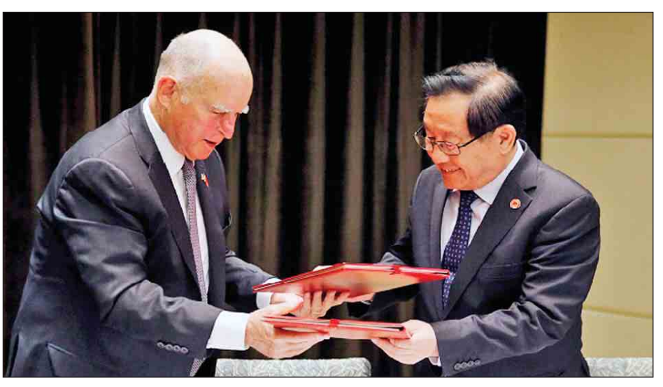
ဘရောင်းသည် တရုတ်နိုင်ငံ၌ ရှိနေစဉ်အတွင်း ကာလီဖိုးနီးယားပြည်နယ်၏ အခန်းကဏ္ဍကို မြှင့်တင်ရန် သမ္မတ ရှိကျင့်ဖျင်အား တွေ့ဆုံခဲ့သည်။ တရုတ်နှင့် အမေရိကန်အကြား ပူးပေါင်းဆောင်ရွက်မှု ပြုလုပ်ရာတွင်။

ဆန်လှသည်ဟု ကာလီဖိုးနီးယားပြည်နယ် အုပ်ချုပ်ရေးမှူး ဂျယ်ရီဘရောင်းက ဝေဖန်ခဲ့သည်။ ဘရောင်းသည် ဖိုရမ်ဆွေးနွေးပွဲ တက်ရောက်ရန် တရုတ်နိုင်ငံသို့ ရောက်ရှိနေသည်။ ပါရီသဘောတူညီချက်မှ အမေရိကန်နှုတ်ထွက်ရန် ဆုံးဖြတ်လိုက်ခြင်းကြောင့် ယင်းသဘောတူညီချက်ကို ဆက်လက်အကောင်အထည်ဖော်နိုင်ရေးအတွက် တရုတ်နိုင်ငံက နိုင်ငံရေးအရနှင့် သံတမန်ရေးအရ ဆက်လက် ဆောင်ရွက်ပါမည်ဟု ကတိကဝတ်ပြုခဲ့သည်။ ပါရီသဘောတူညီချက်ကို အမေရိကန်က ဦးဆောင်မှုမရှိတော့ခြင်းသည် ယာယီအခိုက်အတန့်မျှသာ ဖြစ်ကြောင်း ဘရောင်းက မြို့တော် ပေကျင်း၌ ဇွန် ၆ရက်က ကျင်းပသော သန့်ရှင်းသော စွမ်းအင်ဆိုင်ရာ ဖိုရမ်ဆွေးနွေးပွဲကာလအတွင်း သတင်းထောက်များနှင့် တွေ့ဆုံရာတွင် ပြောကြားသည်။ အဆိုပါ ဖိုရမ်ဆွေးနွေးပွဲသို့ တက်ရောက်လျက်ရှိသော အမေရိကန် စွမ်းအင်ဝန်ကြီး ရစ်ပယ်ရီကမူ သမ္မတ ထရမ်၏ ဆုံးဖြတ်ချက်နှင့် ပတ်သက်၍ တုံ့ပြန်ဖြေကြားခြင်း မရှိပေ။