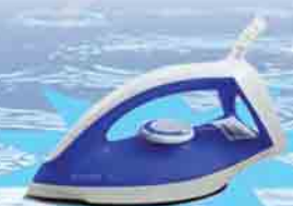
PHILIPS GC 120/20

ဖော်ပြပါပစ္စည်းဝယ်ယူပြီး ကျပ် ၁၉,၀၀၀ တန်ဖိုးရှိ Iron ရယူလိုက်ပါ