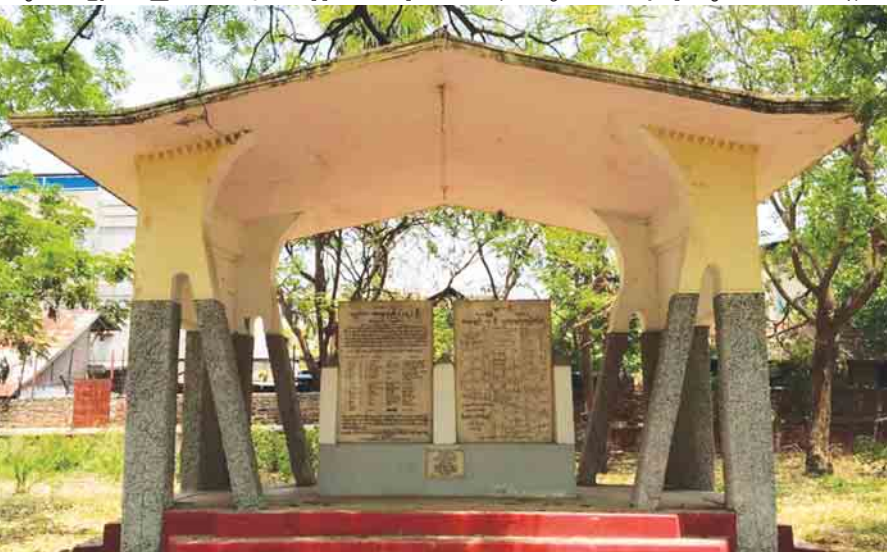
သမိုင်းမှတ်တမ်းကျောက်စာဝိမာန်

၁၉၈၈ အရေးတော်ပုံကြီးအပြီးမှာတော့ အာဏာပိုင် တွေရဲ့ အမိန့်နဲ့ မြို့လူထုပိုင် '၁၃၀၀ ပြည့် အရေး တော်ပုံ၊ မန္တလေးအာဇာနည် ၁၇ ဦးဝိမာန်'ကို သေ့ အထပ်ထပ်ခတ် ဝိတ်သိမ်းပစ်လိုက်တယ်။ တောက် လျှောက်ပဲ အစဖျောက်ပစ်တော့မယ့် သဘောလက္ခဏာ တွေ သတိပြုမိလာကြတာပါပဲ။ ၂၀၁၀ ခုနှစ်နောက်ပိုင်း