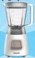
PHILIPS HR 2051

ဖော်ပြပါပစ္စည်းဝယ်ယူပြီး ကျပ် ၃၅,၀၀၀ တန်ဖိုးရှိ Blender ရယူလိုက်ပါ