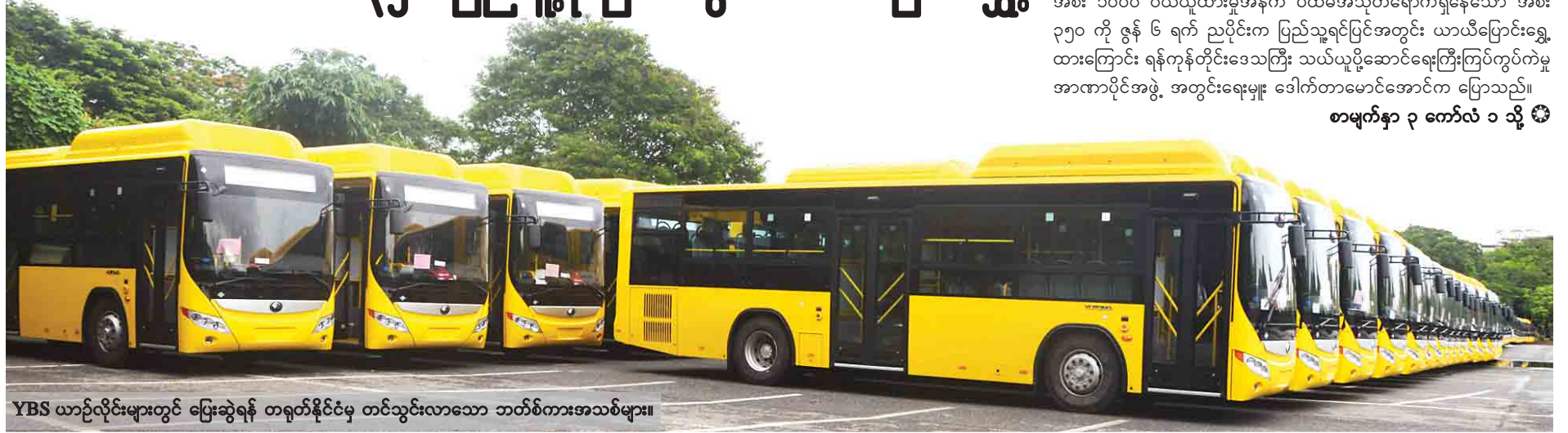
YBS ယာဉ်လှိုင်းများတွင် ပြေးဆွဲရန် တရုတ်နိုင်ငံမှ တင်သွင်းလာသော ဘတ်စ်ကားအသစ်များ။