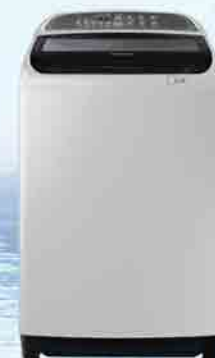
SAMSUNG WASHING MACHINE