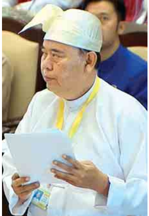
ပညာရေးဝန်ကြီးဌာန ဒုတိယဝန်ကြီး ဦးဝင်းမော်ထွန်း

ထို့နောက် ချင်းပြည်နယ် မဲဆန္ဒနယ်အမှတ်(၁၁)မှ ဦးဝေတင်းနှင့် ရခိုင်