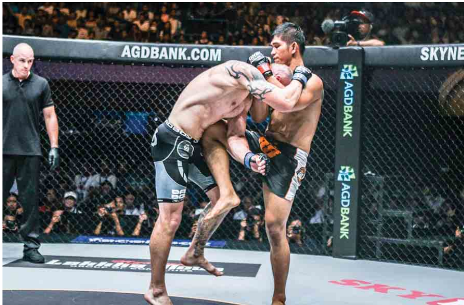
ဘစ်ဒက်ရှ်(ဝဲ)နှင့် အောင်လအန်ဆန်(ယာ)တို့ ဇန်နဝါရီလအတွင်း ထိုးသတ်ခဲ့စဉ်။

ရုရှားနိုင်ငံသားဗစ်တာလီဘစ်ဒက်ရှ်သည် ကမ္ဘာ့ချန်ပီယံဆုကို ကာကွယ်ရန်အတွက် မကျေပွဲအဖြစ် မြန်မာနိုင်ငံမှ MMA စူပါစတား အောင်လအန်ဆန်၏ ဇာတိမြေတွင် ပြန်လည်ထိုးသတ်ရမည်ဖြစ်သော်လည်း ပြိုင်ဘက်မြေပေါ်တွင် ထိုးသတ်ရမည့်အတွက် ရုရှားနိုင်ငံသားတစ်ဦး အနေဖြင့် ကြောက်ရွံ့နေမည်မဟုတ်ကြောင်း ONE Championship က ယနေ့ထုတ်ပြန်သည့် ထုတ်ပြန်ချက်အရ သိရသည်။