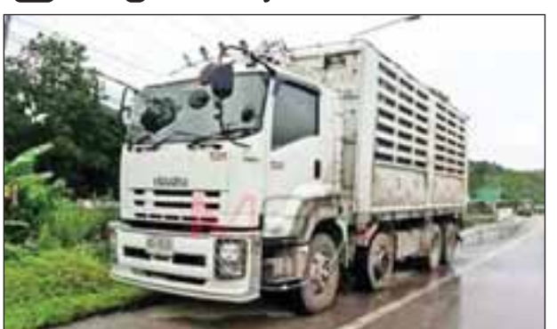
ထိုင်းမှောက်မှဖြစ်ပွားသည့် ကုန်တင်ယာဉ်ကို တွေ့ရစဉ်။

ဘန်ကောက် မေ ၅ မြန်မာအလုပ်သမား ၈၀ ကို တင်ဆောင်ကာ မဲဆောက်မှ မောင်းနှင်လာသော ကုန်တင် ယာဉ်တစ်စီး ဇွန် ၄ ရက်က တာ့ခရိုင် စစ်ဆေးရေးဂိတ်တွင် စစ်ဆေးရန် တားစဉ် မောင်းနှင်ထွက်ပြေးသဖြင့် ထိုင်းအာဏာပိုင်များနှင့် ထိုင်း စစ်တပ်မှ လိုက်လံဖမ်းဆီးရာ ယာဉ်တိုက်မိမှု ဖြစ်ပွားခဲ့ကြောင်း ထိုင်းဘာသာဖြင့် ရေးသားထားသည့် အွန်လိုင်းသတင်းတွင် ဖော်ပြထား ကြောင်း သိရသည်။ အဆိုပါ အလုပ်သမားများကို ဘန်ကောက်တွင် အလုပ်ကောင်း ကောင်းရမည်ဆိုကာ မြန်မာအလုပ် သမားတစ်ဦးလျှင် ဘတ်ငွေ တစ်သောင်းနှုန်းဖြင့် ကားပေါ်တင်လာ ခဲ့ကြောင်း၊ တာ့ခရိုင်အတွင်းရှိ စစ်ဆေးရေးဂိတ်တွင် စစ်ဆေးမခံဘဲ မောင်းနှင်ထွက်ပြေးရာ ယာဉ် တိုက်မိမှုကြောင့် ဖြစ်ကြောင်း၊