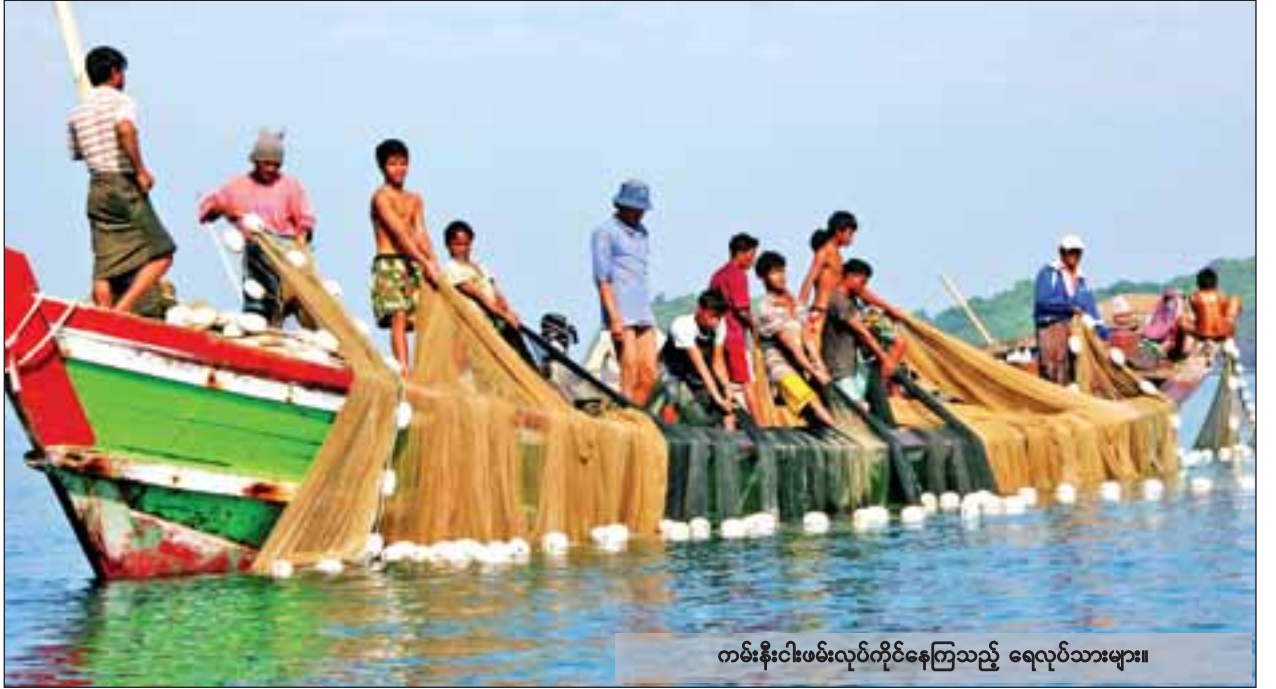
ကမ်းနီးငါးဖမ်းလုပ်ကိုင်နေကြသည့် ရေလုပ်သားများ။

ယခုအချိန်တွင် အဆိုပါဒေသလေးခု၌သာ ပိုင်းလော့ပရောဂျက်ဖြင့် ငါးသယံဇာတပြန်လည်ထိန်းသိမ်းခြင်းကို ဆောင်ရွက်နေခြင်းဖြစ်ပြီး နောက်ပိုင်းတွင် စာမျက်နှာ ၈ ကော်လံ ၁ သို့