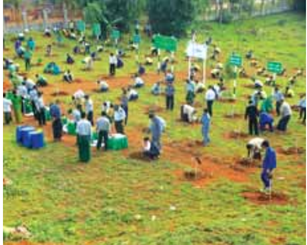
လားရှိုး၌ကမ္ဘာ့ပတ်ဝန်းကျင်ထိန်းသိမ်းရေးနေ့ အထိမ်းအမှတ်စုပေါင်းသစ်ပင်စိုက်ပျိုး

မြို့နယ်အဆင့် ဌာနဆိုင်ရာ တာဝန်ရှိသူများ မြစ်ကြီးနားပညာရေးကောလိပ်၊ သူနာပြုနှင့် သားဖွားသင်တန်းကျောင်းတို့မှ သင်တန်းသား သင်တန်းသူများ၊ သဘာဝပတ်ဝန်းကျင်ဆိုင်ရာ ထိန်းသိမ်းကာကွယ်စောင့်ရှောက်လျက်ရှိသည့် အရပ်ဘက်လူမှုရေး အသင်းအဖွဲ့ဝင်များ၊ သတင်းမီဒီယာများမှ ဖိတ်ကြားထားသူများ အင်အား ၃၀၀ ကျော် တက်ရောက်၍ အခမ်းအနားအပြီးတွင် သဘာဝပတ်ဝန်းကျင်ထိန်းသိမ်းရေး အထိမ်းအမှတ်ပြခန်းငယ်အား တက်ရောက်လာသူများက စိတ်ပါဝင်စားစွာ ကြည့်ရှုလေ့လာကြကြောင်း သိရသည်။