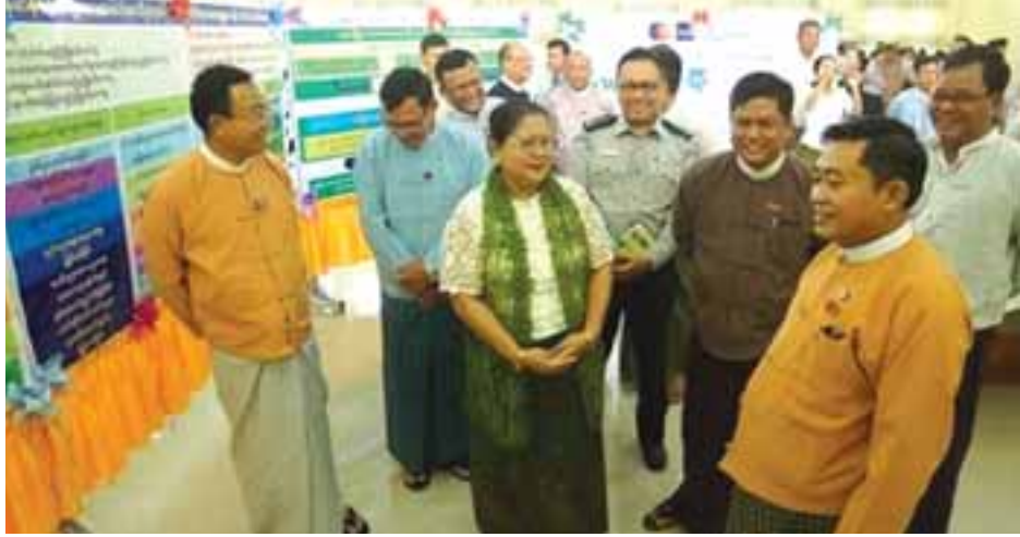
တင်နိုး(ပဲခူး)

မင်းစံက ကုလသမဂ္ဂအထွေထွေအတွင်းရေးမှူးချုပ်ထံမှ ပေးပို့သော သဝဏ်လွှာကိုဖတ်ကြားပြီး တက်ရောက်လာကြသူများအား ပတ်ဝန်းကျင်ဆိုင်ရာအသိပေးဗီဒီယိုအား ပြသခဲ့သည်။ ယင်းနောက် ပတ်ဝန်းကျင်ထိန်းသိမ်းရေးနှင့် အထိမ်းအမှတ် စာစီစာကုံးပြိုင်ပွဲတွင် ဆုရရှိသော ကျောင်းသားကျောင်းသူများအား ဝန်ကြီးချုပ်၊ လွှတ်တော်ဥက္ကဋ္ဌနှင့် တရားသူကြီးချုပ်တို့ကဆုများ အသီးသီးပေးအပ်ပြီး အထိမ်းအမှတ်ပြခန်းအား လှည့်လည်ကြည့်ရှုကြသည်။ အဆိုပါအခမ်းအနားသို့ ဝန်ကြီးချုပ် ဦးဝင်းသိန်းနှင့် ဝန်ကြီးများ၊ လွှတ်တော်ဥက္ကဋ္ဌ၊ တရားသူကြီးချုပ်၊ ဥပဒေချုပ်နှင့် ဌာနဆိုင်ရာများ၊ ဆရာ၊ဆရာမများနှင့် ကျောင်းသားကျောင်းသူများ၊ လူမှုရေးအသင်းအဖွဲ့များ တက်ရောက်ကြကြောင်း သိရသည်။