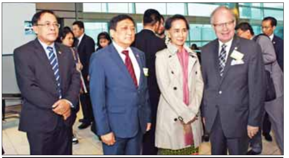
နိုင်ငံတော်၏အတိုင်ပင်ခံပုဂ္ဂိုလ် ဒေါ်အောင်ဆန်းစုကြည် ကနေဒါနိုင်ငံ လီစတာ ဘီ ပီရာဆင် အပြည်ပြည်ဆိုင်ရာ လေဆိပ်သို့ရောက်ရှိရာ ကြိုဆိုသူများနှင့်အတူ တွေ့ရစဉ်။

နိုင်ငံတော်၏အတိုင်ပင်ခံပုဂ္ဂိုလ်အား တိုရွန်တိုမြို့ လီစတာ ဘီ ပီရာဆင်(Lester B. Pearson) အပြည်ပြည်ဆိုင်ရာ လေဆိပ်၌ ကနေဒါနိုင်ငံဆိုင်ရာ မြန်မာသံအမတ်ကြီး ဦးကျော်မျိုးထွဋ်၊ စာမျက်နှာ ၃ ကော်လံ ၁ သို့ *