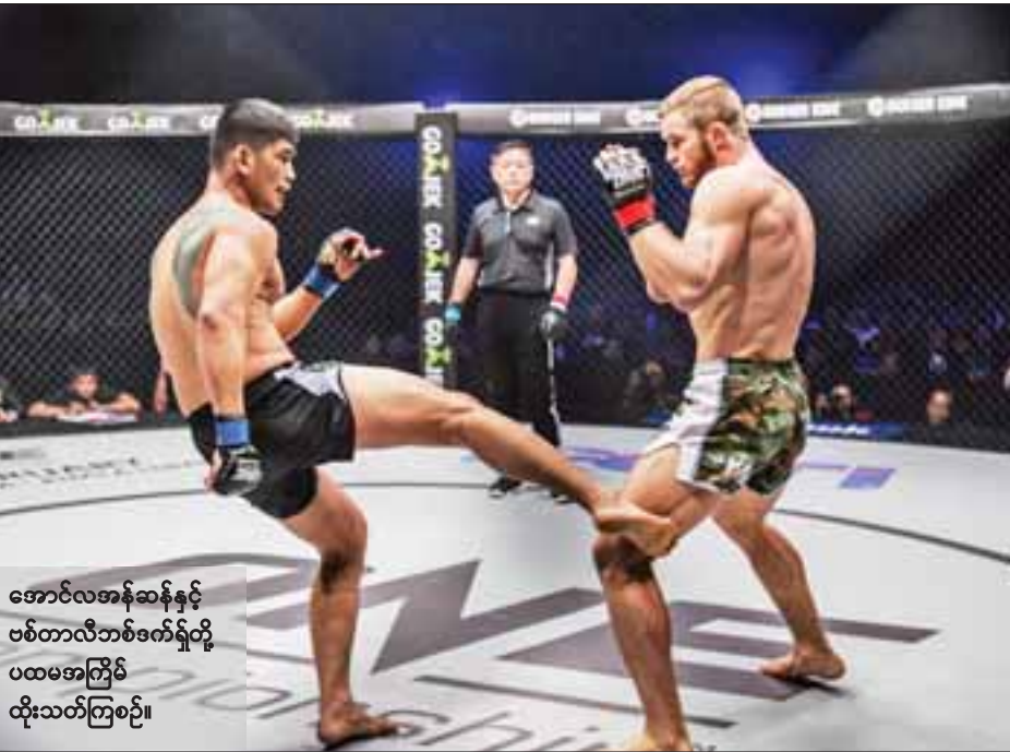
အောင်လအန်ဆန်နှင့် ဗစ်တာလီဘစ်ဒက်ရှ်တို့ ပထမအကြိမ် ထိုးသတ်ကြစဉ်။