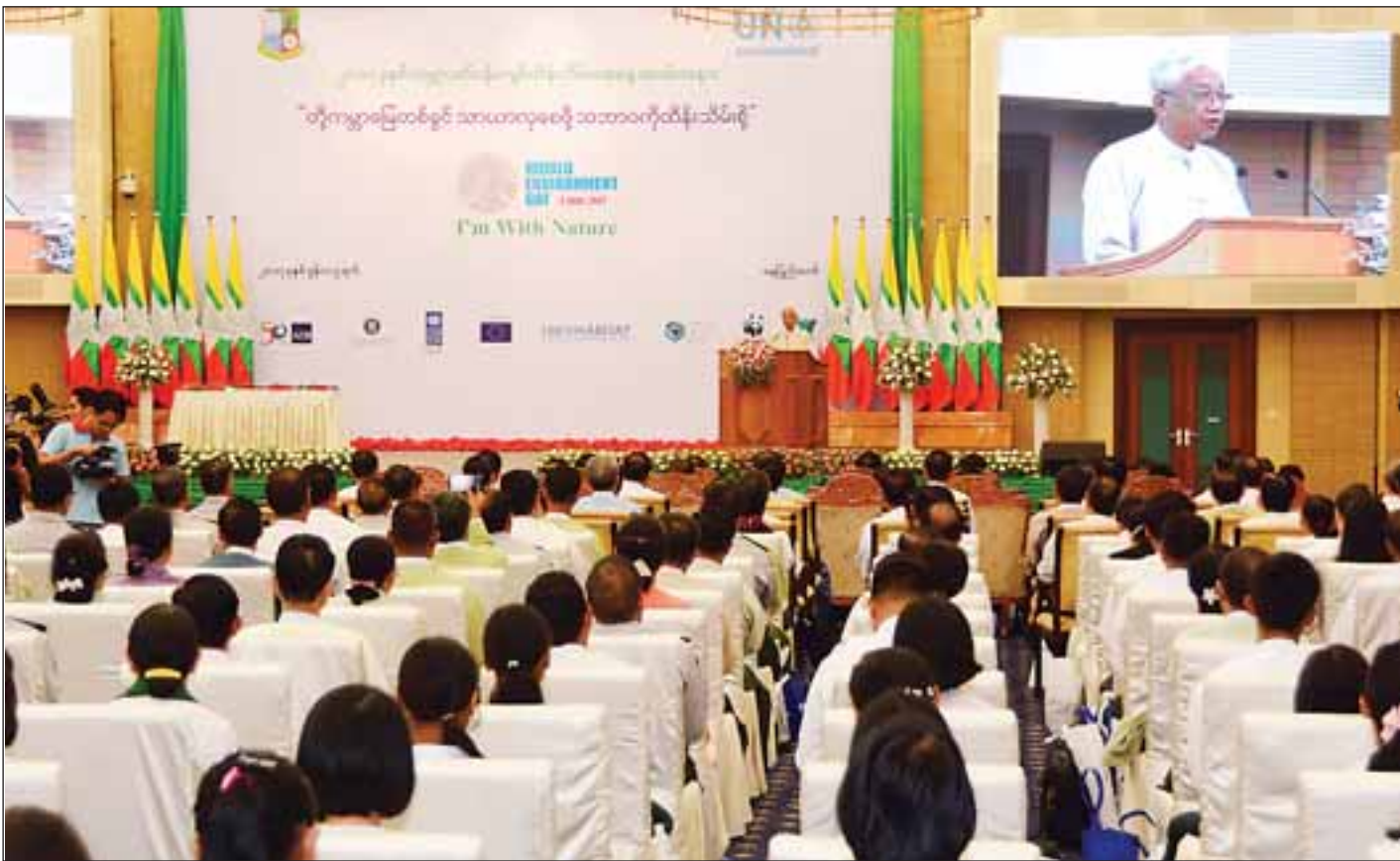
၂၀၁၇ ခုနှစ် ကမ္ဘာ့ပတ်ဝန်းကျင်ထိန်းသိမ်းရေးအခမ်းအနားတွင် နိုင်ငံတော်သမ္မတ ဦးထင်ကျော် အမှာစကားပြောကြားစဉ်။ (သတင်းစဉ်)

နေပြည်တော် ဇွန် ၅ ၂၀၁၇ ခုနှစ် ကမ္ဘာ့ပတ်ဝန်းကျင်ထိန်းသိမ်းရေးအခမ်းအနားကို ယနေ့နံနက် ၉နာရီတွင် နေပြည်တော်ရှိ မြန်မာအပြည်ပြည်ဆိုင်ရာ ကွန်ဗင်းရှင်းဗဟိုဌာန-၂ (MICC-II) ၌ ကျင်းပရာ နိုင်ငံတော်သမ္မတ ဦးထင်ကျော် တက်ရောက်အမှာစကားပြောကြားသည်။