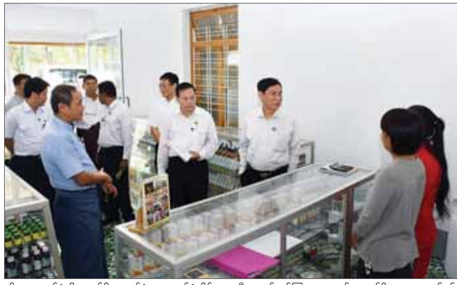
ဆိုလာအလုပ်ရုံသို့ရောက်ရှိရာ စက်ရုံမှူးက စက်ရုံဆိုင်ရာ အချက်အလက်များနှင့် ထုတ်လုပ်မှုဆိုင်ရာများနှင့်အကျိုးတူဖက်စပ်ဆောင်ရွက်မည့် ဝမ်းကုဗ္ဗဇီယု ဦးဆောင်ညွှန်ကြားရေးမှူးနှင့် တာဝန်ရှိသူများက လုပ်ငန်းဆောင်ရွက်မှုဆိုင်ရာများကို ရှင်းလင်းတင်ပြသည်။ ပြည်ထောင်စုဝန်ကြီးက LED နှင့် ဆိုလာများ

ရန်ကုန် ဇွန် ၃ စက်မှုဝန်ကြီးဌာန ပြည်ထောင်စုဝန်ကြီး ဦးခင်မောင်ချိုသည် ယနေ့ နံနက်က ရန်ကုန်တိုင်းဒေသကြီး တောင်ငူဥက္ကလာပ မြို့နယ် သုမင်္ဂလာလမ်းနှင့် သစ္စာလမ်းထောင့်ရှိ BPI ဆေးဝါးအရောင်းဆိုင်(တောင်ငူဥက္ကလာပ)သို့ရောက်ရှိပြီး ဆိုင်ပြင်ဆင်ထားရှိမှု၊ ပြည်သူများ အသုံးလိုသည့် ဆေးဝါးများ အမှန်တကယ်ဖြန့်ဖြူးရောင်းချပေးနိုင်ရန် စီစဉ်ထားရှိမှုနှင့် ပြည်သူလူထုအား ဆေးဝါးများရောင်းချနေမှုအား အားပေးကြည့်ရှုကာ(ယာဝုံ) ဝယ်ယူသူများအား BPI ဆေးဝါးများ အမှတ်တရလက်ဆောင်ပေးအပ်သည်။ BPI ဆေးဝါးများသည် GMP Guide Line နှင့်အညီ ထုတ်ကုန်နှုန်းဆတိုးမြှင့်ထုတ်လုပ်ရေး ကြိုးပမ်းဆောင်ရွက်လျက်ရှိပြီး အလားတူ BPI ဆေးဝါးအရောင်းဆိုင်များကို ယခုဆိုင်အပါအဝင် ရန်ကုန်၊ နေပြည်တော်၊ မန္တလေးတို့တွင် စုစုပေါင်း တိုးဆိုင်ဖွင့်လှစ်ထားကာ အခြားမြို့ကြီးများတွင်လည်း ကျယ်ကျယ်ပြန့်ပြန့် တိုးချဲ့ဖွင့်လှစ်၍ ပစ္စည်းမှန် ဈေးနှုန်းချိုသာစွာဖြင့် ရောင်းချပေးသွားမည်ဖြစ်ကြောင်း သိရသည်။ ယင်းနောက် ပြည်ထောင်စုဝန်ကြီးသည် စက်မှုနယ်မြေ(တောင်ဒဂုံ)ရှိ အမှတ်(၂၄) အကြီးစားစက်ရုံ(ဒဂုံ)