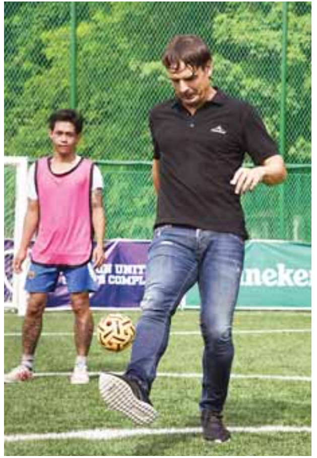
ရိုးယဲလ်နှင့် စပိန်တိုက်စစ်မှူးဟောင်း မိုရီယန်တေးစ် မြန်မာ့ရိုးရာ အားကစားနည်းဖြစ်သော ခြင်းလုံးခတ်ကစားနည်းကို သရုပ်ပြကစားနေစဉ်။