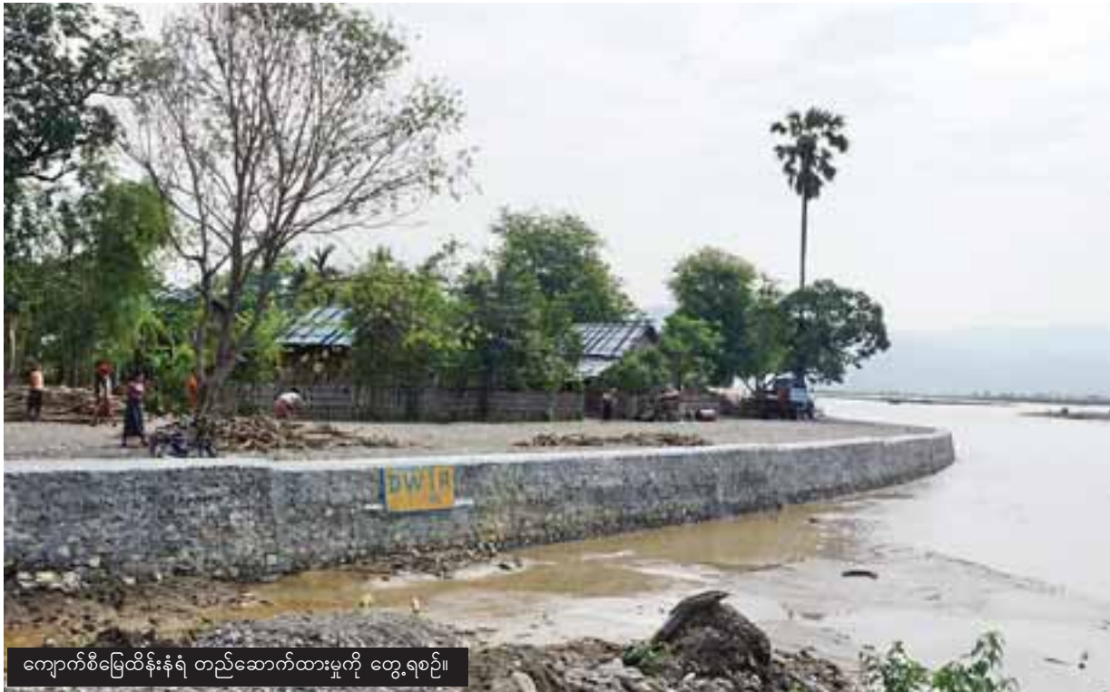
ကျောက်စိမ်းမြေထိန်းနံရံ တည်ဆောက်ထားမှုကို တွေ့ရစဉ်။

လုပ်ငန်းဆောင်ရွက်ပြီးစီးမှုများကို တာဝန်ရှိသူများက ဇွန် ၃ ရက် နံနက်ပိုင်းတွင် စာမျက်နှာ ၉ ကော်လံ ၁ သို့ ❖