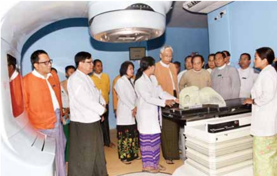
ဓာတ်ရောင်ခြည်ဆေးကုသရာတွင် ခေတ်မီစက်ပစ္စည်းများ တပ်ဆင်အသုံးပြုနေမှုကို နိုင်ငံတော်သမ္မတ ဦးထင်ကျော် ကြည့်ရှုစစ်ဆေးစဉ်။