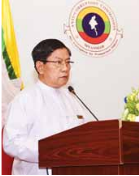
နေပြည်တော် ဇွန် ၃

မြန်မာနိုင်ငံ၏ ကုလသမဂ္ဂအဂတိလိုက်စားမှုတိုက်ဖျက်ရေး ကွန်ပင်းရှင်း ပြန်လည်သုံးသပ်ရေးတွင် ပူးပေါင်းပါဝင် ဆောင်ရွက်ကြသူများ၏ အရည်အသွေး ပိုမိုတိုးတက်လာ စေရန် ရည်ရွယ်ချက်ဖြင့် ကုလသမဂ္ဂအဂတိလိုက်စားမှု တိုက်ဖျက်ရေးကွန်ပင်းရှင်း အကောင်အထည်ဖော်ဆောင် မှု ပြန်လည်သုံးသပ်ရေးလုပ်ငန်းစဉ် ဆောင်ရွက်နိုင်ရန် အကြံအလုပ်ရုံဆွေးနွေးပွဲကို ဇွန် ၁ ရက် နံနက် ၉ နာရီက နေပြည်တော်ရှိ The Hotel Royal ACE ၌ ကျင်းပသည်။