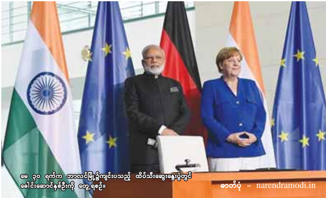
မေ ၃၀ ရက်က ဘာလင်မြို့၌ကျင်းပသည့် ထိပ်သီးဆွေးနွေးပွဲတွင် ခေါင်းဆောင်နှစ်ဦးကို တွေ့ရစဉ်။