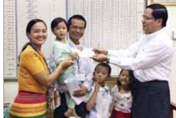
အောင်ဘာလေသိန်းဆုငွေခွဲမှ သိရသည်။