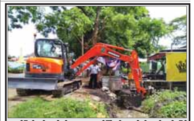
ကျပ်ပြည်နယ် စည်ပင်သာယာရေးဝန်ကြီး ဦးနော်ဝင်း၏ လမ်းညွှန်မှုဖြင့် မြို့ရေစီးရေလာကောင်းမွန်စေရန် မိုးကောင်းမြို့အတွင်း ရေနုတ်မြောင်း တူးဖော်ခြင်းများ ပြုလုပ်လျက်ရှိရာ မေ ၂ ရက် နံနက်က မြို့နယ် စည်ပင်သာယာရေးဦးစီးဌာနမှ ဦးဆောင်ကာ ပြည်ထောင်စုကားလမ်းမကြီးဘေး ရေမြောင်းအား စက်ယန္တရားများဖြင့် တူးဖော်နေစဉ်။

(၃)ကြိမ်မြောက် ကျပ် ၅၀၀ တန် ထီပွင့်ပွဲတွင် အထူးဆုကြီးစနစ်၌ ကျပ်သိန်း တစ်သောင်းဆု တစ်ဆု၊ ကျပ်သိန်း ငါးထောင် တစ်ဆု၊ ဆုတစ်ဆုချင်းစနစ်တွင် ကျပ်သိန်း တစ်ရာဆု ၃၇ ဆု၊ ကျပ်သိန်းငါးဆယ် ဆု ၃၉ ဆု၊ ကျပ်ဆယ်သိန်းဆု ၄၁ ဆု၊ ဝေဝေဆာဆာ ပဒေသာဆုမဲစနစ်တွင် ကျပ်သုံးသိန်းဆု ၁၀၀ ဆု၊ ကျပ်နှစ်သိန်းဆု ၁၀၀၀ ဆု၊ ကျပ်တစ်သိန်းဆု ၂၉၀၀၀ ဆု၊ ကျပ်ငါးသောင်းဆု ၇၀၀၀၀ ဆု စုစုပေါင်း ဆုမဲအရေအတွက် ၁၀၀၂၂၀ ဆု ချီးမြှင့်ခဲ့ကြောင်း အောင်ဘာလေသိန်းဆုငွေခွဲမှ သိရသည်။