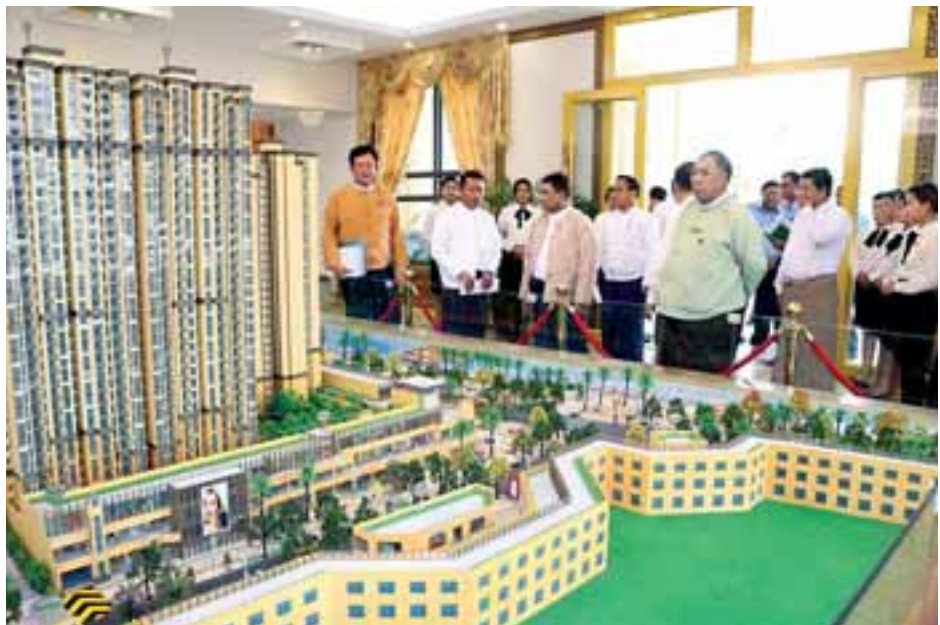
ယာဉ်ရပ်နားဝင်း တည်ဆောက်ရေးစီမံကိန်း၊ “ဖိုးလမ်း” လေ့လာခဲ့ကြောင်း သတင်းရရှိသည်။ ရော်ဘာ ကွန်ပေါင်းစက်ရုံတို့ကို သွားရောက်ကြည့်ရှု (သတင်းစဉ်)

သည် အဓိကရေထွက်ကုန်နှင့် ရော်ဘာ၊ ဆီအုန်းသီးနှံများ စိုက်ပျိုးထုတ်လုပ်နိုင်သည့် စီးပွားရေးအခြေခံကောင်းများ ရှိသည့် ဒေသဖြစ်ကြောင်း၊ နိုင်ငံတော်၏ စီမံကိန်းဖြစ်သည့် အထူးစီးပွားရေးဇုန်စီမံကိန်းနှင့်အတူ ဟန်ချက်ညီညီ ဆောင်ရွက်ပါက စီးပွားရေးဖွံ့ဖြိုးတိုးတက်မှုမြင့်မားလာမည်တိုင်းဒေသကြီးဖြစ်ကြောင်း၊ တိုင်းဒေသကြီး၏ အဓိကထွက်ကုန်သည် နိုင်ငံတော်က ဈေးကွက်ဝင်ပို့ကုန်များဖြစ်၍ ကုန်သွယ်မှုကဏ္ဍ ဖွံ့ဖြိုးတိုးတက်မှု ပြည်ပပို့ကုန်ပို့ပို့နိုင်မှု နိုင်ငံတော်ကို များစွာအထောက်အကူပြုမည်ဖြစ်ပါကြောင်း၊ မိမိတို့လာရောက်ခြင်းမှာ ပြည်ပပို့ကုန်တိုးမြှင့်တင်ပို့နိုင်ရေး အထောက်အကူပြုနိုင်ရန်နှင့် လုပ်ငန်းဆောင်ရွက်ရာတွင် တွေ့ကြုံနေရသည့် အခက်အခဲများ၊ စိန်ခေါ်မှုများကို သက်ဆိုင်ရာ ဝန်ကြီးဌာနများနှင့် ညှိနှိုင်းပူးပေါင်းဆောင်ရွက်ပေးမည်ဖြစ်ကြောင်း ရှင်းလင်းပြောကြားသည်။ ယင်းနောက် ဒေသခံကုန်သည် လုပ်ငန်းရှင်များ၏ တင်ပြချက်များကို တာဝန်ရှိသူများက ရှင်းလင်းပြောကြား ညှိနှိုင်းဆောင်ရွက်ပေးခဲ့ပြီး ပြည်ထောင်စုဝန်ကြီးက နိဂုံးချုပ် စကားပြောကြားသည်။ ထို့နောက် မြိတ်မြို့ရှိ SEA VIEW CONDO ကုမ္ပဏီ၏ အိမ်ရာတည်ဆောက်ရေးစီမံကိန်း၊ အဝေးပြေး