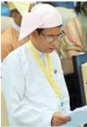
ဒေါက်တာအောင်သူ

နေပြည်တော် ဇွန် ၂ သမဝါယမကဏ္ဍအနေဖြင့် ချေးငွေ များ ထုတ်ချေးပေးနိုင်ရေးအတွက် သမဝါယမအသင်းပိုင် ငွေကြေးများ အပါအဝင် တရုတ်နိုင်ငံ EXIM Bank ထံမှ ချေးငွေ အမေရိကန် ဒေါ်လာ သန်း ၄၀၀ နှင့် လယ်ယာသုံး စက်ကိရိယာ အရစ်ကျရောင်းချနိုင်ရေး အတွက် ကိုရီးယားနိုင်ငံ Daedong Industrial Co.,Ltd. ထံမှ အမေရိကန်ဒေါ်လာ သန်း ၁၀၀ တန်ဖိုးရှိ လယ်ယာသုံးစက်ပစ္စည်းများ ကိုရယူ၍ ဆောင်ရွက်ပေးလျက်ရှိပါ ကြောင်း စိုက်ပျိုးရေး၊ မွေးမြူရေးနှင့် ဆည်မြောင်းဝန်ကြီးဌာန ပြည်ထောင်စု ဝန်ကြီး ဒေါက်တာ အောင်သူက ပြောကြားသည်။