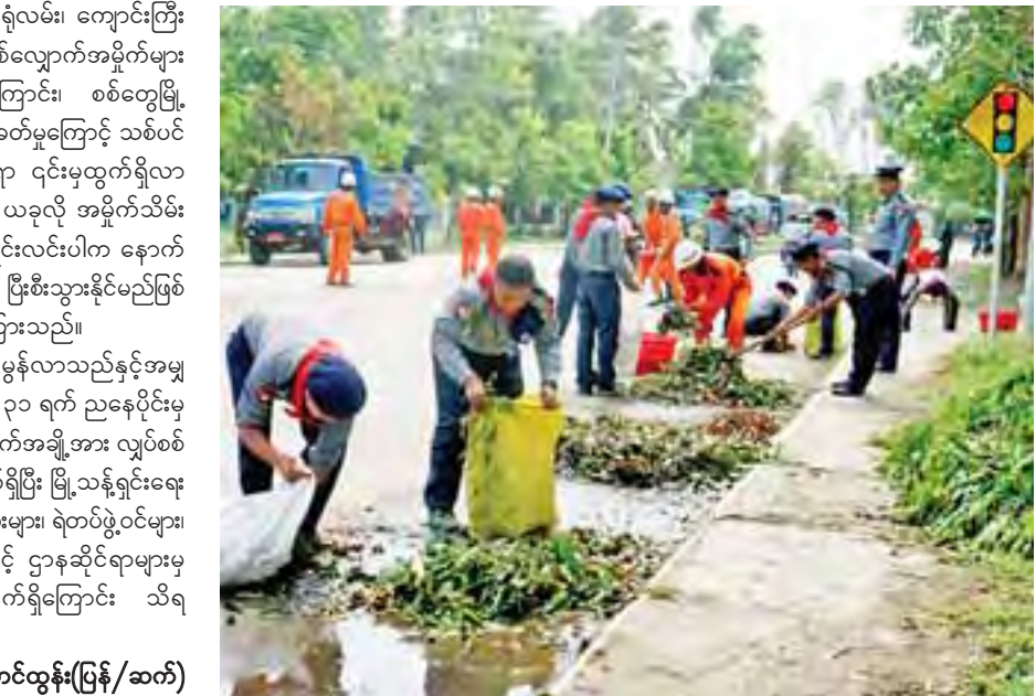
တင်ထွန်း(ပြန်/ဆက်)

စစ်တွေ ၉၆၂ စစ်တွေမြို့နယ်တွင် မေ ၂၉ ရက် ညပိုင်းမှ စတင်ကာ ဆိုင်ကလုန်းမုန်တိုင်း ဗိုရာ တိုက်ခတ်မှုကြောင့် ဌာနဆိုင်ရာ အဆောက် အအုံများနှင့် လူနေအိမ်သွပ်မိုးများလန်ထွက် ခြင်း၊ လမ်းမများပေါ်သို့ သစ်ပင်များ၊ လျှပ်စစ် ဓာတ်တိုင်များပြုလဲခြင်းများဖြစ်ခဲ့ရာ လျှပ်စစ် မီးများ ပြတ်တောက်မှုဖြစ်ပွားခဲ့သည်။ ဇွန် ၁ ရက်တွင် အဆိုပါမုန်တိုင်း တိုက်ခတ်မှုကြောင့် သစ်ပင်သစ်ကိုင်းများ ကျိုးကျနေမှုများကို တပ်မတော်၊ ရဲတပ်ဖွဲ့၊ မီးသတ်တပ်ဖွဲ့ဝင်များ၊ ဌာနဆိုင်ရာများမှ ရှင်းလင်းဆောင်ရွက်လျက်ရှိသည်။ “ကျွန်တော် တို့ မီးသတ်တပ်ဖွဲ့ဝင်တွေ၊ ရဲတပ်ဖွဲ့၊ တပ်မတော်မှ တပ်ဖွဲ့ဝင်တွေပေးပေါင်းပြီး ဒီနေ့ မနက် ၇ နာရီကစပြီး စစ်တွေမြို့ အထွေထွေ ရောဂါကုဆေးရုံကြီး၊ အထက(၄) စာသင် ကျောင်းနဲ့ ဦးဥတ္တမပန်းခြံအတွင်းရှိ သစ်ပင်