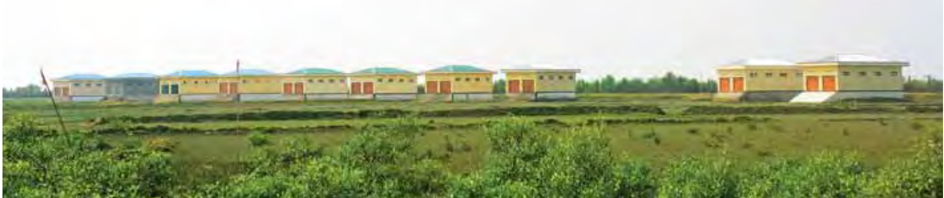
မောင်တောမြို့နယ် ကညင်ချောင်းကုန်သွယ်ရေးစခန်းရှိ ကုန်လှောင်ရုံများကို တွေ့ရစဉ်။

ရခိုင်ပြည်နယ်ကို ဘက်ပေါင်းစုံ၊ ကဏ္ဍပေါင်းစုံမှ ပံ့ပိုးဖြည့်ဆည်းဆောင်ရွက်ပေးနေသဖြင့် ပြည်နယ်အတွင်းရှိ မြို့ရွာနှင့် ကျေးလက်များမှ ဒေသခံတိုင်းရင်းသားတို့၏ လူနေမှုဘဝတိုးတက်မြှင့်တင်ပေးလာမှုများမှာ တဖြည်းဖြည်းနှင့် ထွန်းသစ်စနေခြင်းကဲ့သို့ လင်းပြာစည်ဝေလာတော့မည်ဖြစ်သည်။ ။