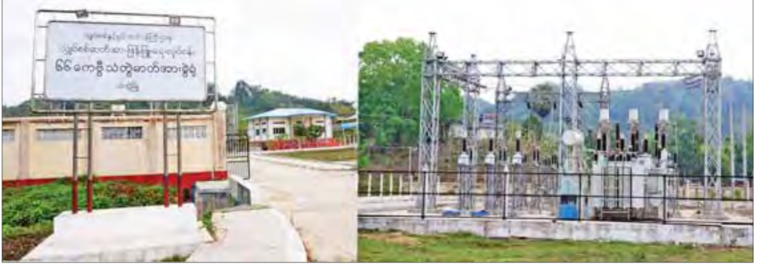
သံတွဲမြို့ရှိ ၆၆ ကေစီ သံတွဲဓာတ်အားခွဲခွဲကို တွေ့ရစဉ်။

ကျောက်ဖြူတွင် လေဆိပ်လည်းရှိရာ လေကြောင်းခရီးစဉ်ဖြင့်လည်း အလွယ်တကူ လာရောက်နိုင်သည့်မြို့ဖြစ်သည်။ လမ်းပန်း ဆက်သွယ်ရေး ကောင်းမွန်သည့်အပြင် လျှပ်စစ်ဓာတ်အားလည်း အပြည့်အဝအသုံးပြု နိုင်မှုကြောင့် ကျောက်ဖြူမြို့သည် လူမှုဘဝ တိုးတက်မြင့်မားသော မြို့ဖြစ်သည်။