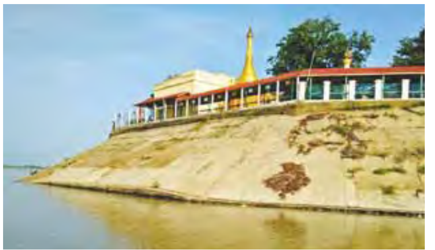
ကျောက်စိတင်လုပ်ငန်းကို ၂၀၀၇ - ၂၀၀၈ ဘဏ္ဍာနှစ် မှာ လှိုက်စားခံနေရကြောင်း ဂေါပကအဖွဲ့၏ ကဆောင်ရွက်ခဲ့ပြီး ၎င်းကျောက်စိန်ရံအခြေများ ပြောကြားချက်အရ သိရသည်။

ဖောင်တော်ဦးဘုရားအနီး မြစ်ကမ်းပြိုမှု ကာကွယ်ရေးအတွက် steel basket အခြေပြု