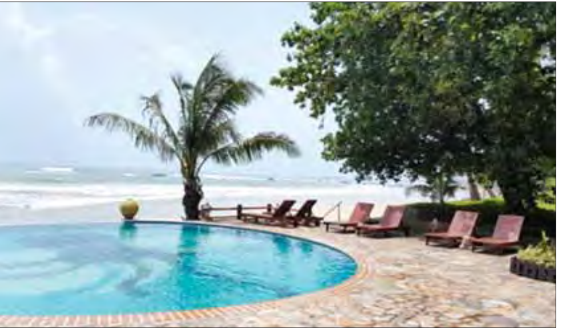
ရခိုင်ပြည်နယ်ရှိ အပန်းဖြေစရာ ကမ်းခြေများရှိခြင်းကလည်း လူမှုစီးပွားဘဝဖွံ့ဖြိုးရေးအထောက်အကူပေးလျက်ရှိသည်။

မြောက်ဦးမြို့သည် စစ်တွေ-ပုဏ္ဏားကျွန်း- ကျောက်တော်-မြောက်ဦး-မင်းပြား လမ်းပေါ် တွင် တည်ရှိသည်။ ကားလမ်းဆက်သွယ်ရေး ကောင်းမွန်ပြီး မြို့တွင်းလမ်းများ အဆင့်မြှင့် တင်ပေးနိုင်ခဲ့မှုအပြင် လျှပ်စစ်ဓာတ်အားရရှိ