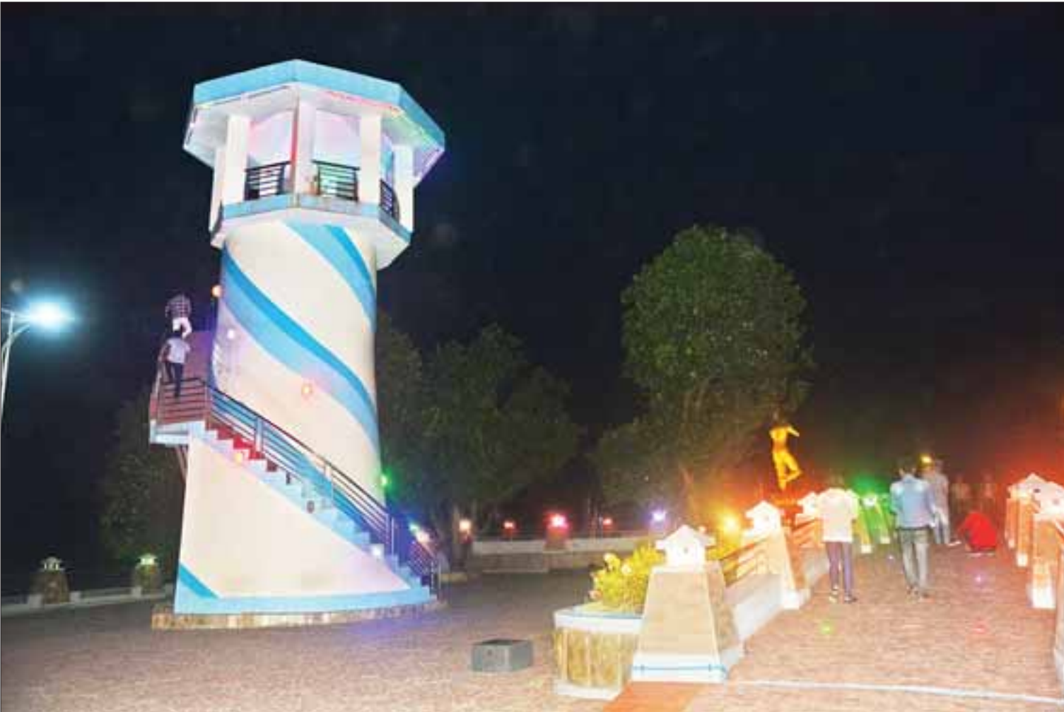
စစ်တွေ View Point ညပိုင်းမြင်တွေ့ရသည့် မြင်ကွင်း။