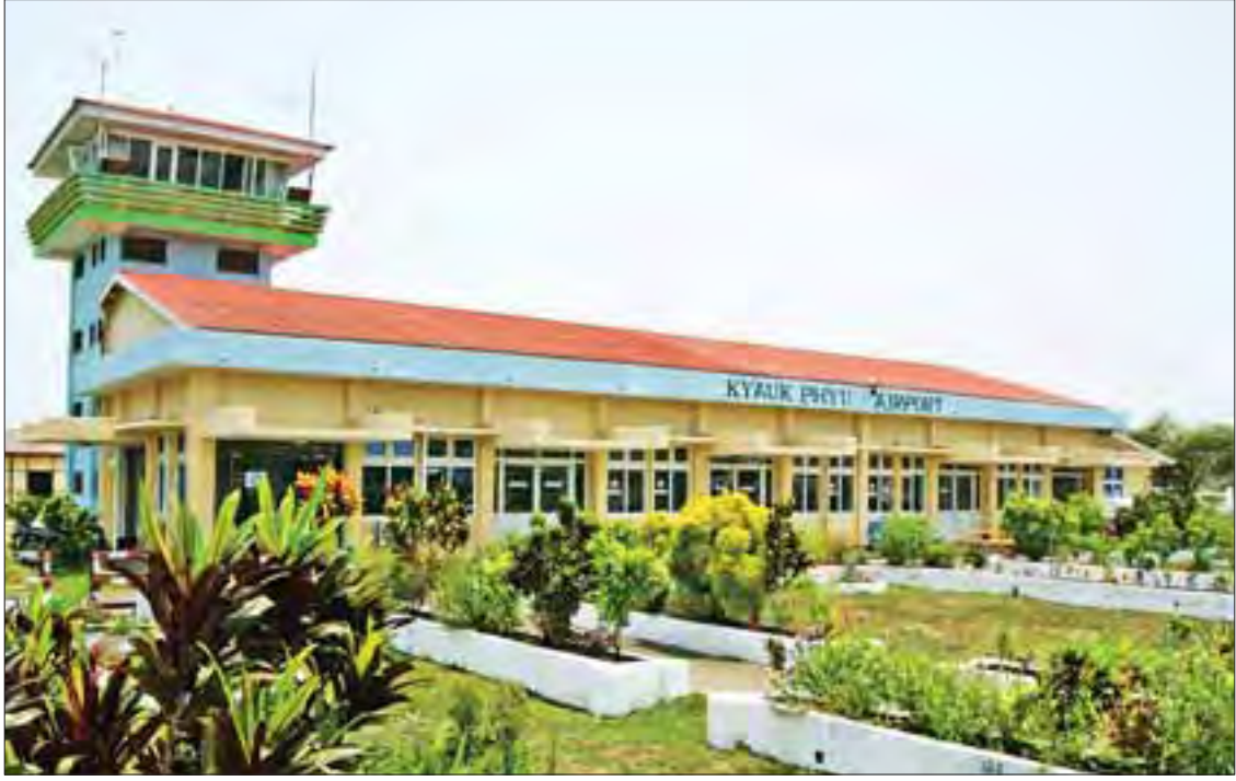
ကျောက်ဖြူလေဆိပ်အဆောက်အအုံကို တွေ့ရစဉ်။

၃၀၀ ခန့် ဖြည့်ဆည်းပေးနိုင်ခဲ့သည်။ ရခိုင်ပြည်နယ်အတွင်း လက်ရှိအစိုးရ သစ် တစ်နှစ်တာကာလအတွင်း မိုဘိုင်း တာဝါလိုင်း ၄၇၉ တိုင်အထိ တိုးချဲ့တည် ဆောက်နိုင်ခဲ့ရာ ယခင် ဘဏ္ဍာရေးနှစ်က ၂၉၇ တိုင်သာရှိခဲ့သဖြင့် မိုဘိုင်းတာဝါတိုင် ၁၈၂ တိုင်အထိ တိုးမြှင့်လာခဲ့သည်။