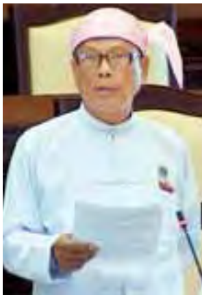
ဦးခင်မောင်လတ်

ရန်ကုန်တိုင်းဒေသကြီး မဲဆန္ဒနယ် အမှတ်(၉)မှ ဦးဖေဖျံ၏ မှော်ဘီ မြို့နယ် ချောင်းဝကျေးရွာအုပ်စု သဲအင်းဂူ-နောကုန်း-သိုက်ကုန်း ကျေးရွာချင်းဆက်လမ်းနှင့် ကျီးကျ လူနီးဖြစ်နေသော သိုက်ကုန်း သစ်သားတံတားတို့အား လာမည့် ဘဏ္ဍာရေးနှစ်များအတွင်း ဖောက်လုပ် တည်ဆောက်ပေးရန် အစီအစဉ် ရှိ မရှိ မေးခွန်းနှင့်စပ်လျဉ်း၍ စိုက်ပျိုး ရေး၊ မွေးမြူရေးနှင့် ဆည်မြောင်း ဝန်ကြီးဌာန ပြည်ထောင်စုဝန်ကြီး ဒေါက်တာအောင်သူက မှော်ဘီ မြို့နယ်အတွင်းရှိ သဲအင်းဂူ- နောကုန်း- သိုက်ကုန်းလမ်းအရှည် ၂ မိုင် ၃ ဒသမ ၇၉ ဖာလုံ ကွန်ကရစ် ခင်းခြင်းလုပ်ငန်းနှင့် သိုက်ကုန်းကျေးရွာ တံတားပြင် ဆင် ထိန်းသိမ်းခြင်း လုပ်ငန်းမှာ စိုက်ပျိုးရေး၊ မွေးမြူရေး နှင့် ဆည်မြောင်းဝန်ကြီးဌာန ကျေးလက်ဒေသဖွံ့ဖြိုးတိုးတက်ရေး