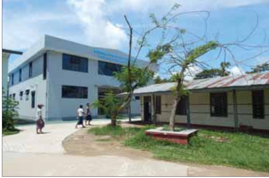
ကွမ်းခြံကုန်းမြို့ မြို့နယ်ပြည်သူ့ဆေးရုံဝင်းအတွင်းရှိ နှစ်ထပ်တိုးချဲ့ဆောင်သစ်ဆောက်လုပ်ပြီးစီးမှုကို တွေ့ ရစဉ်။

ကွမ်းခြံကုန်း ဇွန် ၂ နိုင်ငံတော်ဖွံ့ဖြိုးတိုးတက်ရေးအတွက် ပြည်သူများ၏ ကျန်းမာရေးမှာ အဓိကအခြေခံအကျဆုံးဖြစ်သောကြောင့် ကွမ်းခြံကုန်းမြို့ တော်ပုလဲပိုင်းနှင့် မင်းပိုင်းရပ်ကွက်ရှိ မြို့နယ်ပြည်သူ့ဆေးရုံဝင်းအတွင်း၌ (၂၅) ခုတင်ဆံ့ နှစ်ထပ် တိုးချဲ့ဆောင်သစ်ကို ဆောက်လုပ်လျက်ရှိရာ ယခုအခါ ဆောက်လုပ်မှု ရာနှုန်းပြည့်နီးပါး ဆောင်ရွက်ပြီးစီးနေပြီဖြစ်၍ မကြာမီပွင့်လှစ်တော့မည်ဖြစ်ကြောင်း သိရသည်။