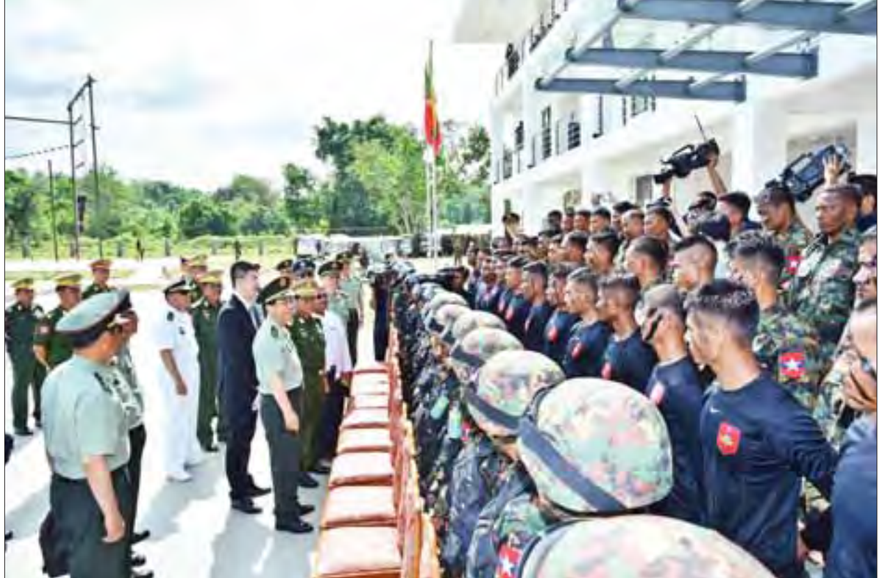
တပ်မတော်ကာကွယ်ရေးဦးစီးချုပ် ဗိုလ်ချုပ်မှူးကြီး မင်းအောင်လှိုင်နှင့် တရုတ်ပြည်သူ့လွှတ်တော်ရေးရာတပ်မတော် ဗဟိုစစ်ကော်မရှင်အဖွဲ့ဝင် ပူးတွဲစစ်ဦးစီးဌာန စစ်ဦးစီးချုပ် General Fang Fenghui တို့ အထူးတပ်ဖွဲ့ဝင် လေ့ကျင့်ရေးကွင်းသို့ သွားရောက်ကြည့်ရှုလေ့လာစဉ်။