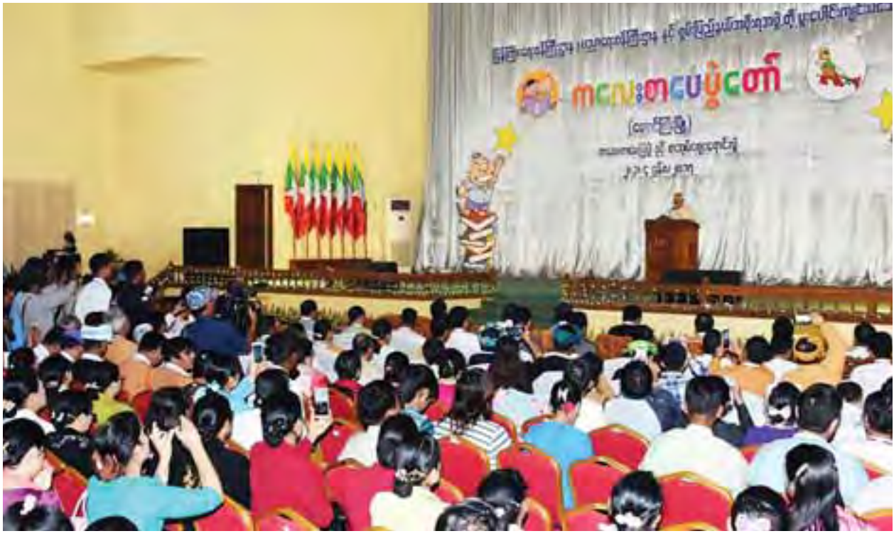
ကလေးစာပေပွဲတော်(တောင်ကြီး) ဖွင့်ပွဲအခမ်းအနားတွင် နိုင်ငံတော်သမ္မတ ဦးထင်ကျော် အမှာစကားပြောကြားစဉ်။

ထိုသို့ ကလေးစာပေပွဲတော်များကို ကျင်းပနိုင်သဖြင့် ကလေးများအတွက် ပျော်ရွှင်မှု၊ ဗဟုသုတ အတွေးအခေါ် မြင့်မားစေမှု၊ စာအုပ်စာပေကို ချစ်ခင်မြတ်နိုးတတ်မှု၊ စာဖတ်သည့်အလေ့အထများ လေ့ကျင့်ပျိုးထောင်ပေးနိုင်မှု၊ နိုင်ငံချစ်စိတ်ဖြင့် တိုင်းကျိုးပြည်ကျိုး ထမ်းဆောင်လိုစိတ်များ မြင့်မားစေမှု၊ ဘဝကို ရဲရင့်မာန်ကန်စွာ ကျော်ဖြတ်နိုင်မည့် အားမာန်သတ္တိများ ပြည့်ဝစေမှု စသည့် အကျိုးကျေးဇူးများ ရရှိနိုင်လိမ့်မည်ဟု ယုံကြည်မျှော်လင့်မိပါကြောင်း ပြောကြားသည်။