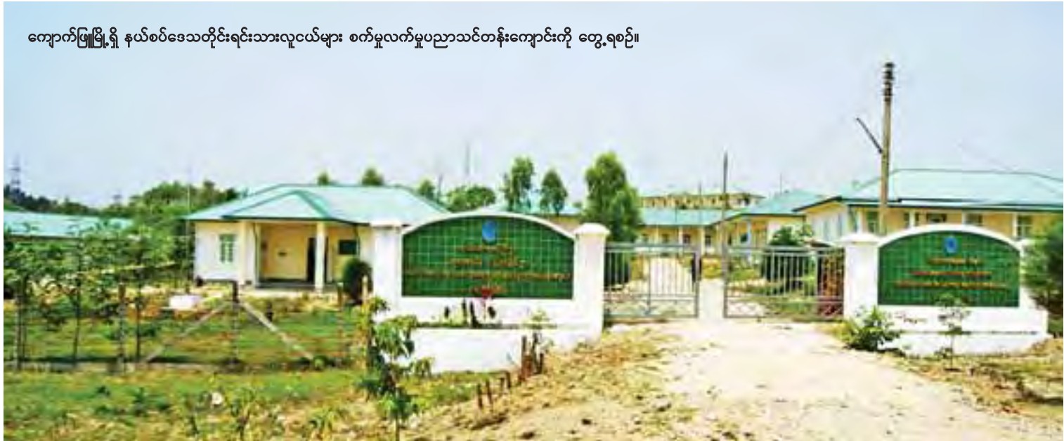
ကျောက်ဖြူမြို့ရှိ နယ်စပ်ဒေသတိုင်းရင်းသားလူငယ်များ စက်မှုလက်မှုပညာသင်တန်းကျောင်းကို တွေ့ရစဉ်။