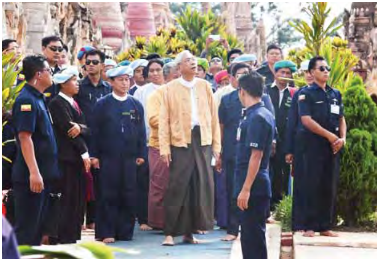
နိုင်ငံတော်သမ္မတ ဦးထင်ကျော် တောင်ကြီးမြို့ရှိ မွေတော်ကဏ္ဍတူရားများကို လှည့်လည်ကြည့်ညှိစဉ်။