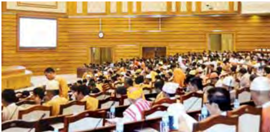
ပြည်သူ့လွှတ်တော်ကိုယ်စားလှယ်များ အစည်းအဝေးမစတင်မီ တွေ့ရစဉ်။

နေပြည်တော် ဇွန် ၂ ကံမမြို့ ဘုတ်စကားကျောင်းအမည်ပေါက် အစိုးရ အထက် ကျောင်းဟောင်းမြေနှင့် မြေပေါ်ရှိအဆောက်အအုံများအား ပညာရေးဝန်ကြီးဌာနက ပြန်လည်ရရှိရေး ညှိနှိုင်းသော်လည်း ပြေလည်မှုမရှိခြင်းကြောင့် ပညာရေးဝန်ကြီး ဌာနအနေဖြင့် ကံမမြို့နယ် သမဝါယမအသင်းစုအား သက်ဆိုင်ရာဥပဒေ များနှင့်အညီ တရားစွဲဆိုသွားမည်ဖြစ်ကြောင်း ပညာရေး ဝန်ကြီးဌာန ဒုတိယဝန်ကြီး ဦးဝင်းမော်ထွန်းက ယနေ့ ပြည်သူ့လွှတ်တော်အစည်းအဝေး တွင် ပြောကြားသည်။