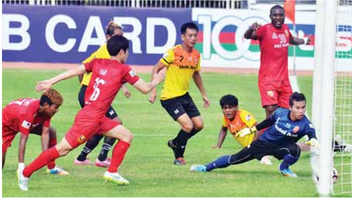
ရှမ်းယူနိုက်တက်အတွက် ပထမဦးဆုံး ခြေစွဲရသွင်းယူစဉ်။