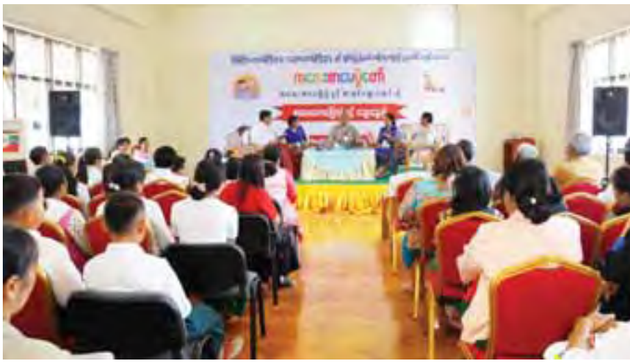
ကလေးစာပေပွဲတော်(တောင်ကြီး) မှတ်တမ်းဓာတ်ပုံများ