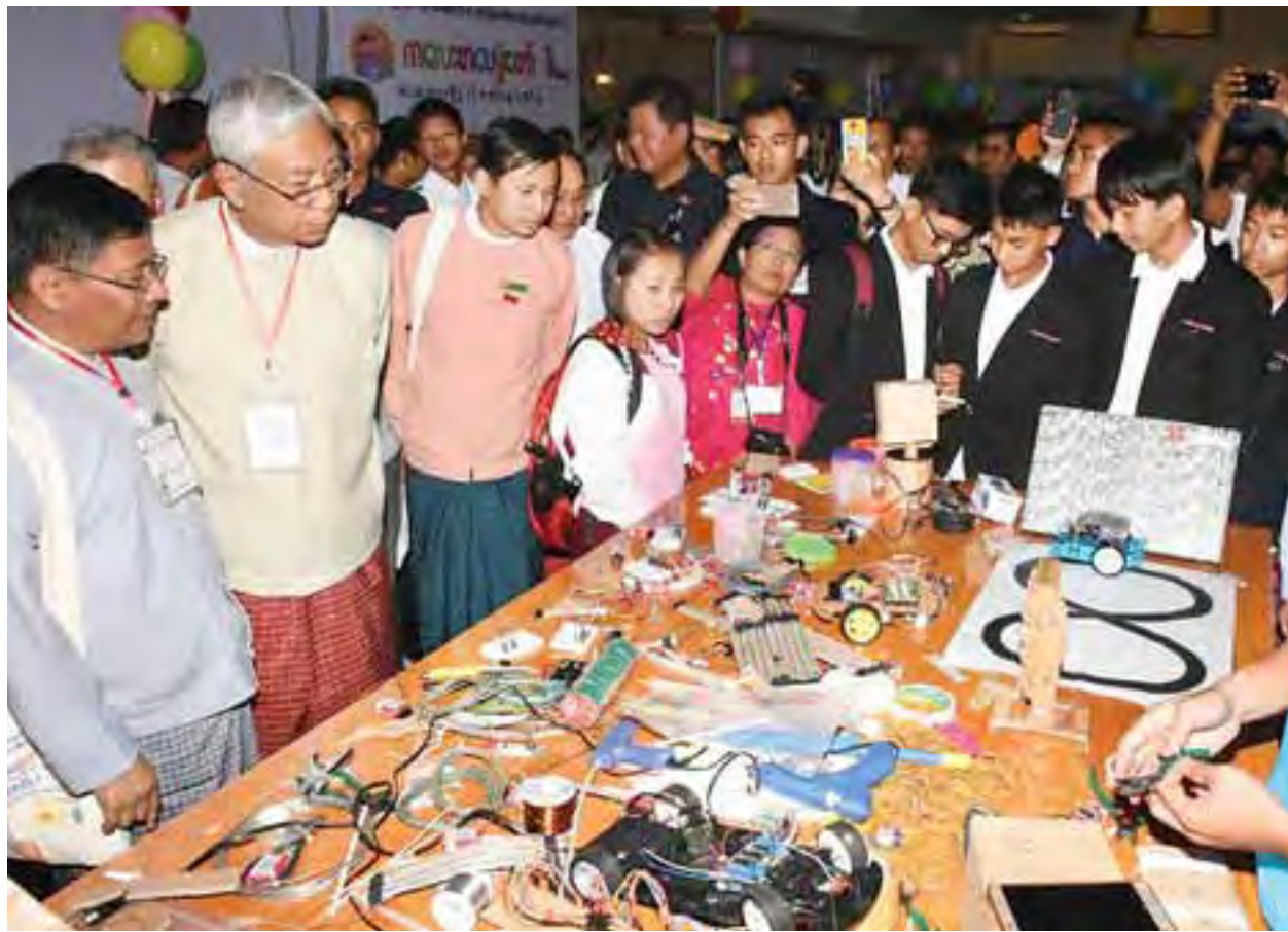
ကလေးစာပေပွဲတော်(တောင်ကြီး)တွင် ခင်းကျင်းပြသထားသော ပြခန်းများအား နိုင်ငံတော်သမ္မတ ဦးထင်ကျော် ကြည့်ရှုအားပေးစဉ်။

နိုင်ငံတော်သမ္မတက “အားလုံးသိကြတဲ့အတိုင်း စာပေထဲမှာ ကလေးစာပေဟာ အခြားစာပေတွေထက် ပိုပြီးခက်ခဲနက်နဲတယ်လို့ ခံစားမိပါတယ်။ လူကြီးစာပေဆိုတာ နယ်နိမိတ်သတ်မှတ်ချက် နည်းပါးပြီး စိတ်ရှိသလောက် လွတ်လပ်စွာ ဖန်တီးနိုင်တယ်လို့ ကျွန်တော်မြင်မိပါတယ်။ ကလေးစာပေတွေကတော့ ကလေးတွေနဲ့ ရင်းနှီးတဲ့ ပတ်ဝန်းကျင်က အကြောင်းအရာတွေကိုသာ စဉ်းစားရတယ်။ ကလေးတွေရဲ့ အတွင်းစိတ်ကိုဝင်ကြည့်ပြီး အဲဒီစိတ်ကူးစိတ်သန်းတွေနဲ့ လိုက်ဖက်ညီညွတ်အောင် ရေးသားဖန်တီးကြရတာဖြစ်ပါတယ်။ “ဒါကြောင့်မို့ ကလေးစာပေဟာ ကျွန်တော်တို့ရဲ့ကလေးငယ်တွေကို အပြစ်ကင်းအောင်၊ ပျော်ရွှင်အောင်နဲ့ ချစ်စရာအကောင်းဆုံး လူသားတွေဖြစ်အောင် ဖန်တီးရေးဖွဲ့ကြရတဲ့ စာပေဖြစ်လို့ ကျွန်တော်တို့အတွက် အလွန်တန်ဖိုးရှိတယ်လို့ပြောရမှာ ဖြစ်ပါတယ်။ ကလေးစာပေဖွံ့ဖြိုးတိုးတက်ရေးကို ကျွန်တော်တို့အားလုံး အားပေးမြှင့်တင်ပေးရမယ်လို့ တွေးမြင်ခံစားမိပါတယ်။ အဲဒါကြောင့် အခုလို ကျောင်းသား ကျောင်းသူတွေနဲ့အတူ ဒီပွဲတော်ကြီးကို အားပေးမြှင့်တင်တဲ့အနေနဲ့ တက်ရောက်ဖွင့်လှစ်ပေးရခြင်း ဖြစ်ပါတယ်။