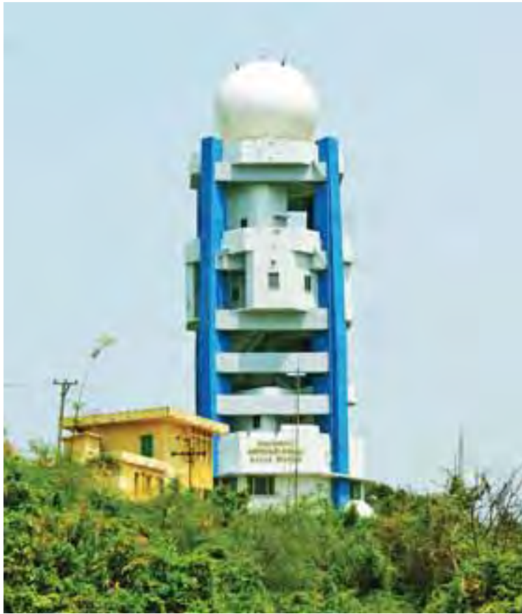
ကျောက်ဖြူမြို့ရှိ မိုးလေဝသရေဒါအဆောက်အအုံကို တွေ့ရစဉ်။