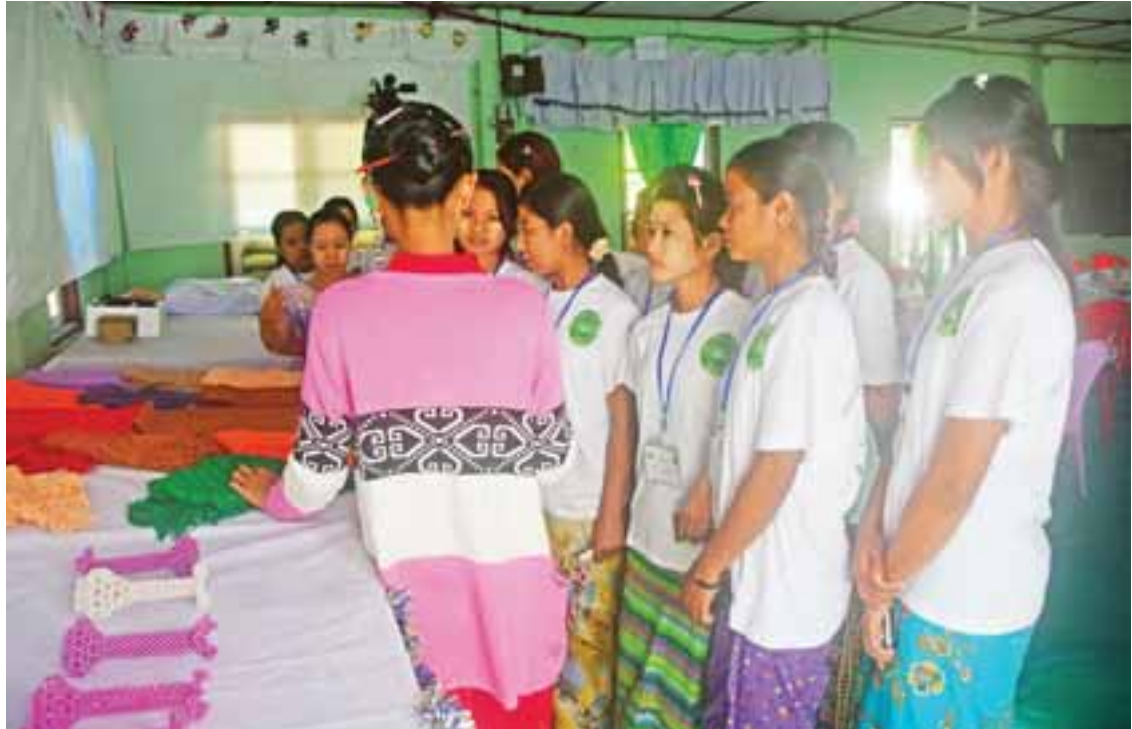
မောင်တောမြို့နယ်၌ အသက်မွေးဝမ်းကျောင်းအထောက်အကူပြု(အိတ်ထိုး၊ ဇာထိုး၊ ဖိနပ်ထိုး)သင်တန်း ဖွင့်လှစ်သင်ကြားပေးနေသည်ကို တွေ့ရစဉ်။

ရခိုင်ပြည်နယ်အတွင်း နယ်စပ်ဒေသအိမ်ရာများအား ကျေးရွာ ကိုးရွာတွင် အိမ် ၁၈၃ လုံးနှင့် ရုံးအဆောက်အအုံများ တည်ဆောက်ပေးနိုင်ခဲ့သည်။ အစိုးရသစ်တစ်နှစ်တာကာလအတွင်း