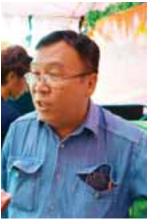
ဒေါက်တာ ဖေသန်းကျော်

မွန်းလွဲပိုင်းတွင် နိုင်ငံတော်သမ္မတသည် အဖွဲ့ဝင်များနှင့်အတူ တောင်ကြီး မြို့နယ် ကတ္တူကျေးရွာရှိ မွေတော်ကဏ္ဍတူရားအားလည်းကောင်း၊ ညနေပိုင်း တွင် တောင်ကြီးမြို့ပေါ်ရှိ ရွှေဘုန်းပွင့်ဘုရားနှင့် ဆူငှာမုနိလောကချမ်းသာ စေတီတော်တို့အားလည်းကောင်း သွားရောက်ဖူးမြော်ကြည့်ညှိကာ ဆီမီး ပန်း၊ ရေချမ်းနှင့် အလှူငွေများကို ဆက်ကပ်လှူဒါန်းခဲ့သည်။ (သတင်းစဉ်)