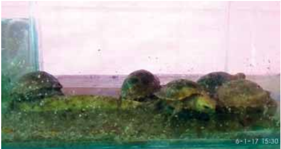
ဖယ်ခံဘက်မှ ရရှိလာသည့် ကုန်းလိပ်များကို တွေ့ရစဉ်။

နောက်တစ်ခုက တရုတ်တွေရဲ့အယူအဆအရ Tonic အားဆေးအဖြစ်နဲ့ အသုံးပြုပြီး နေထိုင်မကောင်းဖြစ်ပြီး နာလန်ထချိန်ရောက်ရင်လည်း သူ့ရဲ့အသားခြောက်ကို အမှုန့်လုပ်ပြီးဆန်ပြုတ်နဲ့ ရောစားရင် ခံတွင်းလိုက်တယ်လို့ အယူအဆရှိပေမယ့်လည်း ဆေးဘက်အသုံးအနှုန်းကို ကျယ်ကျယ်ပြန့်ပြန့် နားမလည်သေးပါဘူး။ ဆက်စပ်ပြီး လေ့လာကြည့်ချက်အရ ကမ္ဘာ့အနှံ့ အပြားကိုပိုပြီး စားကြသောက်ကြတယ်ဆိုတာ သိရပါတယ်။ Point of View အရ ကြည့်မယ်ဆိုရင် သူတို့ဟာ ကုန်းနေရေနေသတ္တဝါအုပ်စု Amphibian ဖြစ်ပါတယ်။ သူတို့ဟာ တီကောင်နဲ့ ဝိုးကောင်တွေ သားလောင်းတွေကို စားတဲ့အတွက်ကြောင့်မို့ ဖျက်ပိုးတွေရဲ့အန္တရာယ်ကို