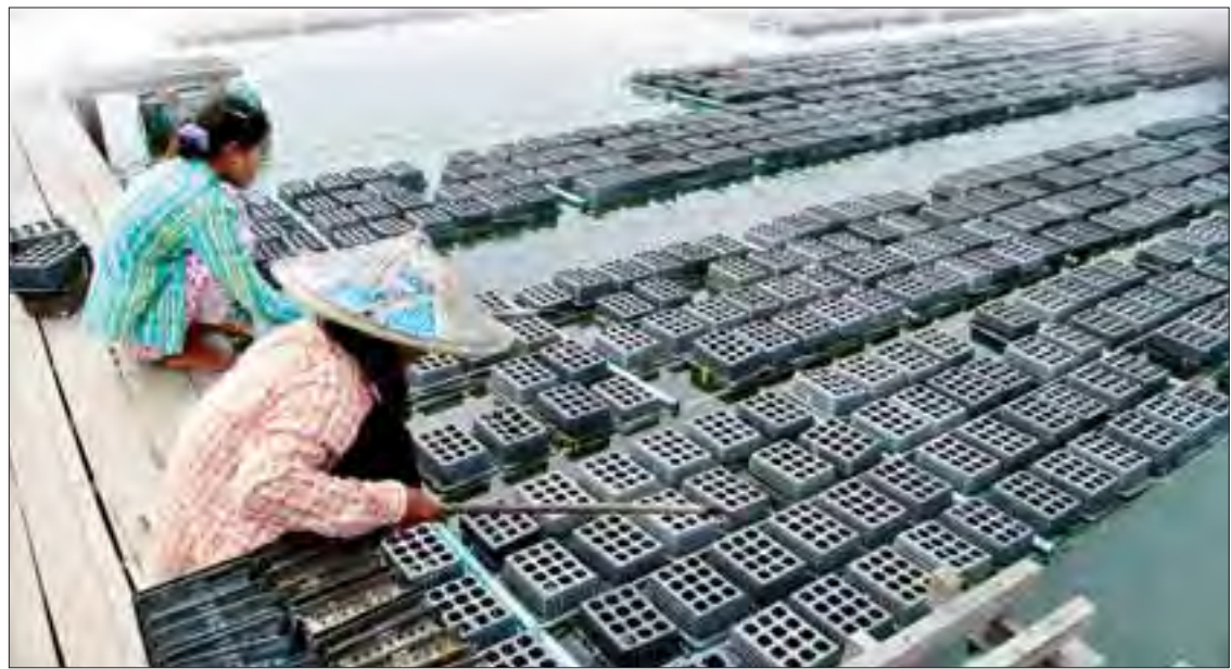
ကျောက်ဖြူမြို့နယ်ရှိ ကဏန်းပျော့မွှေးမြို့ရေလုပ်ငန်း။

ရေငန်တားတာများ တည်ဆောက်ပေး ပုဏ္ဏားကျွန်းမြို့နယ်တွင် တံဘက်လှမ်း ကျေးရွာ၊ ခမောင်းတောကျေးရွာ၊ ကျောက်ပြင် ဆိပ်ကျေးရွာနှင့် အချပ်ပို (ခ) သို့ >>>