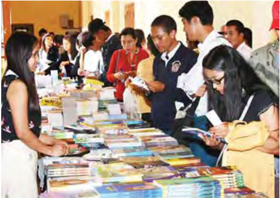
ကလေးစာပေပွဲတော် (တောင်ကြီး)တွင် ဖွင့်လှစ်ရောင်းချလျက်ရှိသည့် စာအုပ်အရောင်းဆိုင်များ၌ ဝယ်ယူနေကြသည့် စာပေချစ်ပရိသတ်များအား တွေ့ရစဉ်။

ဖွင့်ပွဲအခမ်းအနားအပြီးတွင် နိုင်ငံတော်သမ္မတနှင့်အဖွဲ့ဝင်များ၊ တာဝန်ရှိသူများသည် တောင်ကြီးတက္ကသိုလ်မြေညီထပ်၊ ပထမထပ်နှင့် တက္ကသိုလ်အဆောက်အအုံ ဘေးဘယ်ညာတွင် ခင်းကျင်းပြသထားသည့် ဖြိုင်ပွဲများ၊ စာဖတ်ခန်းများ၊ ပြခန်းများနှင့် စာအုပ်အရောင်းဆိုင်များကို လှည့်လည်ကြည့်ရှုအားပေးကြသည်။ စာမျက်နှာ ၉ သို့