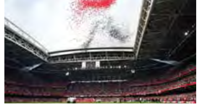
ဝေလပြည်နယ်မြို့တော် ကာဒစ်တွင် တည်ရှိသော မိလျံနီယမ်ကွင်းကြီး။

အသက်(၄၅)နှစ်အရွယ် ဇီဒနားဟာ နည်းပြအတွေ့အကြုံမရှိဘဲ လွန်ခဲ့တဲ့ တစ်နှစ်ခွဲတာကာလက ဘင်နီတက်ဇီနေရာ အစားထိုးခန့်အပ်ခံခဲ့ရသူ ဖြစ်ပါ တယ်။ ဒါပေမယ့် သူ့ရဲ့နည်းပြသက်တမ်း ခြောက်လမပြည့်ခင်မှာပဲ ချန်ပီယံလိဂ် ဖလားကို ဆွတ်ခူးခဲ့ပြီးနောက် ယူအီးအက်ဖ်အေစုပါဖလား၊ ကမ္ဘာ့ကလပ်ဖလား နဲ့ လာလီဂါဖလားတို့ကို ဆက်တိုက်ဆွတ်ခူးပြနိုင်ခဲ့ရပါတယ်။ ဒါ့အပြင် ရိုးယဲလ် အသင်းကိုလည်း လက်ရှိချန်ပီယံလိဂ်ဗိုလ်လုပွဲအထိ တက်ရောက်အောင် စွမ်းဆောင်ပေးထားနိုင်တာကြောင့် တကယ်လို့ ဂျူဗင်တပ်ကိုသာ အနိုင်ယူ နိုင်မယ့်ဆိုရင် လက်ရှိချန်ပီယံလိဂ်ကို ကာကွယ်နိုင်တဲ့ ပထမဆုံးအသင်းနည်းပြဆိုတဲ့