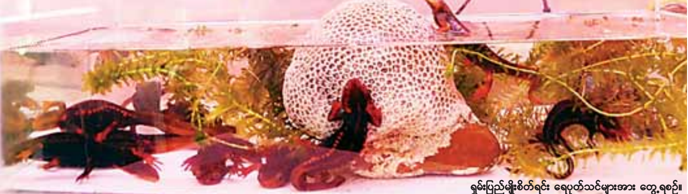
ရှမ်းပြည်မျိုးစိတ်ရင်း ရေပုတ်သင်များအား တွေ့ရစဉ်။