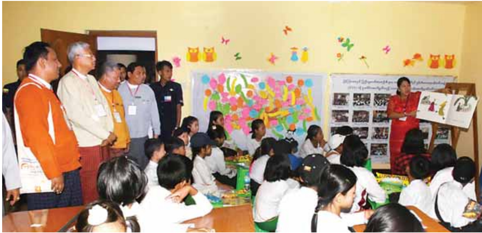
■ ကလေးစာပေပွဲတော်(တောင်ကြီး)တွင် နိုင်ငံတော်သမ္မတ ဦးထင်ကျော် လှည့်လည်ကြည့်ရှုအားပေးစဉ်။

နေပြည်တော် ဇွန် ၂ ကျွန်တော်တို့ ငယ်စဉ်က ကြားနာ ရွတ်ဆိုခဲ့ရတဲ့ အမေမေ့တေးတွေ၊ သားချောတေးတွေဟာ ကျွန်တော်တို့ ကလေးစာပေသမိုင်းရဲ့ တစ်စိတ် တစ်ပိုင်းဖြစ်ပြီး တစ်ခေတ်တစ်ခါက မြန်မာစာပေဓည့်ခန်းဆောင်ကြီးထဲ မှာ ဂုဏ်သရေရှိစွာ ပေါ်ထွက်ခဲ့ဖူး တာဟာ အလွန်ပင်တန်ဖိုးရှိတယ်လို့ ပြောကြားလိုပါတယ်ဟု နိုင်ငံတော် သမ္မတ ဦးထင်ကျော်က ပြောကြား သည်။ ပြန်ကြားရေးဝန်ကြီးဌာန၊ ပညာရေး ဝန်ကြီးဌာနနှင့် ရှမ်းပြည်နယ်အစိုးရတို့ ပူးပေါင်းကျင်းပသော ကလေးစာပေ ပွဲတော်၊ ကလေးစာပေပြပွဲနှင့် စာအုပ် ဈေးရောင်းပွဲ ဖွင့်ပွဲအခမ်းအနားကို ယနေ့နံနက် ၉ နာရီတွင် ရှမ်းပြည်နယ် တောင်ပိုင်း တောင်ကြီးမြို့ရှိ တောင်ကြီး တက္ကသိုလ်၌ကျင်းပစဉ် နိုင်ငံတော် သမ္မတ ဦးထင်ကျော်က အထက်ပါ အတိုင်း ပြောကြားလိုက်ခြင်းဖြစ်သည်။ စာမျက်နှာ ၈ ကော်လံ ၁ သို့ *