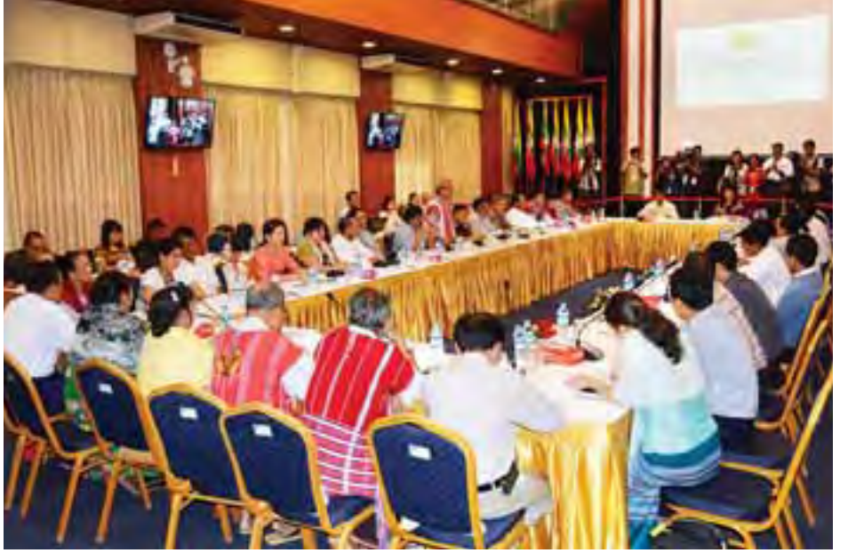
ပစ်ခတ်တိုက်ခိုက်မှုဆိုင်ရာစောင့်ကြည့်ရေးကော်မတီအစည်းအဝေး ကျင်းပစဉ်။