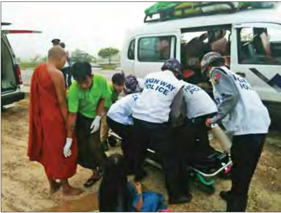
မောင်းနှင်သော Starex သက်ဆိုင်ရာကအရေးယူထားကြောင်း ညီညီသန်း(နေပြည်တော်) မော်တော်ယာဉ်မှယာဉ်မောင်းအား သိရသည်။

ရန်ကုန်-မန္တလေးအမြန်လမ်းမကြီး၏ ပဲခူးမြို့နယ် မိုင်တိုင်အမှတ် (၃၉/၂) နှင့် (၃၉/၃) အကြားနေပြည်တော်မှ ရန်ကုန်သို့ ဝင်းကို မောင်းနှင်လာသော Starex မော်တော်ယာဉ်သည် ယနေ့နံနက် ၇ နာရီခန့်က ယာဉ်မောင်းအိပ်ငိုက်ပြီး အရှိန်မထိန်းနိုင်ဘဲ ရေမု မောင်းနှင် မောင်းနှင်နေသော ရွှေတောင်ရိုး Express ဒရိုသေတင်ယာဉ်အား နောက်မှ ဝင်တိုက်ခဲ့သည်။