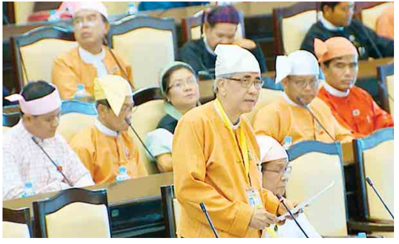
ပို့ဆောင်ရေးနှင့် ဆက်သွယ်ရေး ဝန်ကြီးဌာန ဒုတိယဝန်ကြီး ဦးကျော်မျိုး ရှင်းလင်းဖြေကြားစဉ်။

ဒုတိယအကြိမ် အမျိုးသားလွှတ်တော် ပဌမပုံမှန်အစည်းအဝေး သတ္တမနေ့ကို မေ ၃၁ ရက်တွင် ဆက်လက်ကျင်းပသွားရန် လျာထားကြောင်း သိရသည်။ (သူရဇော်၊ အေးအေးသန်း)