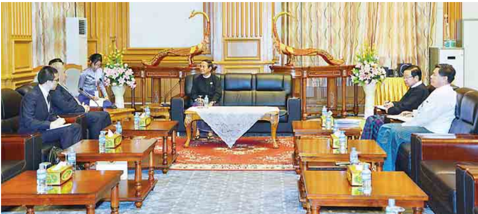
များ၊ ဒီမိုကရေစီ ပြုပြင်ပြောင်းလဲရေး ကိစ္စရပ်များနှင့်ပတ်သက်၍ ဆွေးနွေး ပြည်သူ့လွှတ်တော်ရုံးမှ တာဝန်ရှိသူ များ တက်ရောက်ခဲ့ကြောင်း သတင်းရရှိသည်။ (သတင်းစဉ်)

ပြည်သူ့လွှတ်တော်ဥက္ကဋ္ဌ ဦးဝင်းမြင့် သည် မြန်မာနိုင်ငံဆိုင်ရာ တူရကီ သမ္မတနိုင်ငံ သံအမတ်ကြီး H.E. Mr. Kerem Divanlioglu နှင့်အဖွဲ့ အား ယနေ့မုန်းလွဲ ၂ နာရီခွဲတွင် နေပြည်တော်ရှိ လွှတ်တော် အဆောက်အအုံ ပြည်သူ့လွှတ်တော် ဧည့်ခန်းမဆောင်၌ လက်ခံတွေ့ဆုံ သည်။(ယာဝုံ)