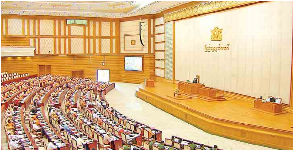
ဒုတိယအကြိမ် ပြည်သူ့လွှတ်တော် ပဌမပုံမှန်အစည်းအဝေး ဆဌမနေ့ ကျင်းပစဉ်။

သို့ရာတွင် ဆောင်ရွက်ရန်ကျန်ရှိနေသော ပြည်သူ့လူထုနှင့် တိုက်ရိုက်ဆက်သွယ် ဆောင်ရွက်သည့်အစိုးရဌာန၊ အဖွဲ့အစည်းများအနေဖြင့် မိမိဌာနအလိုက်လုပ်ငန်းသဘောသဘာဝ ကွဲပြားခြားနားမှုအခြေအနေကိုမူတည်၍ ဆောင်ရွက်ပေးရန်၊ ပြီးပြတ်အောင် ဆောင်ရွက်ပေးမည့် အချိန်ကာလနှင့် ယူဆောင်လာရမည့် အချက်များကို ပြည်သူ့လူထုသို့ရှိရန်နှင့် ဌာနဆိုင်ရာရုံးတိုင်း၏ မြင်သာသည့်နေရာများတွင် ထင်ထင်ရှားရှား ကြေညာထားရန်၊ ခိုင်လုံသောအကြောင်းမရှိဘဲ သတ်မှတ်ချက်အတိုင်း ဆောင်ရွက်ပေးခြင်းမပြုပါက ဝန်ကြီးဌာန၊ အဖွဲ့အစည်းအလိုက် တိုင်ကြားနိုင်သည့် Complaint Center များ ထုတ်ပြန်ကြေညာထားရန်၊ ပြည်သူများ၏ လုပ်ငန်းဆောင်ရွက်မှုအပေါ် တိုင်ကြားသည့် တိုင်စာကိုစစ်ဆေးရာတွင် တိုင်ကြားခံရသူသည် မိမိ၏ လုပ်ငန်းတာဝန်ကို ကျေပွန်အောင် ဆောင်ရွက်ခြင်းမပြုကြောင်း၊ ပြည်သူ့လူထုကို လုပ်ပိုင်ခွင့်ဘောင်အတွင်းမှ ပညာပြုအချိန်ဆွဲကြောင်း တွေ့ရှိပါက အဆိုပါဝန်ထမ်းအား ဝန်ထမ်းစည်းကမ်းအရ အရေးယူရေးနှင့် လာဘ်ယူကြောင်းပေါ်ပေါက်ပါက တည်ဆဲဥပဒေများနှင့်အညီ အရေးယူရေးဆောင်ရွက်ရန် လိုအပ်ပါကြောင်း။