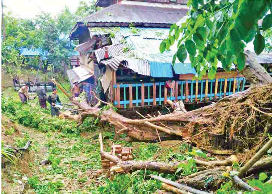
မုန်တိုင်းအရှိန်ကြောင့် သံတွဲခရိုင်အတွင်း ပြိုကျပျက်စီးမှုများအား တွေ့ရစဉ်။ ဓာတ်ပုံ-ခရိုင်(ပြန်/ဆက်)

* ကျော့ဖုံးမှ ရမ်းဗြဲမြို့နယ်၊ သံတွဲမြို့နယ်၊ တောင်ကုတ်မြို့နယ်၊ မောင်တောမြို့နယ်တို့တွင်လည်း သာသနိကအဆောက်အအုံများ၊ ဌာနဆိုင်ရာအဆောက်အအုံများ၊ နေအိမ်များ၊ စာသင်ကျောင်းများ ပျက်စီးပြိုကျမှု ဖြစ်ပွားခဲ့သည့်အပြင် သောက်သုံးရေကန်များ ကျိုးပေါက်ပျက်စီးခဲ့ကြောင်း သိရသည်။ အလားတူ ဧရာဝတီတိုင်းဒေသကြီး၌လည်း ထိခိုက်ပျက်စီးမှုများရှိခဲ့ရာ မော်လမြိုင်ကျွန်းမြို့နယ်၊ ဖျာပုံမြို့နယ်၊