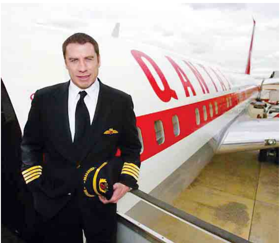
၂၀၀၄ ခုနှစ်အတွင်း ဂျွန်ထရာဗော်တာကို သူ၏ ၇၀၇ လေယာဉ်နှင့်အတူ မဲလ်ဘုန်းမြို့၌ တွေ့ရစဉ်။