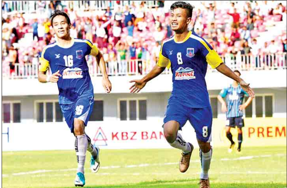
နိုင်ပွဲဆက်နေသည့် လက်ရှိချန်ပီယံ ရတနာပုံအသင်း။