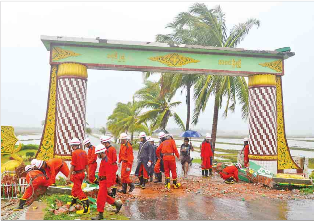
မိုရာမုန်တိုင်းကြောင့် မောင်တောမြို့ မြို့အဝင်မုခ်ဦး အပျက်အစီးများကို ကယ်ဆယ်ရေးအဖွဲ့များက ရှင်းလင်းစဉ်။