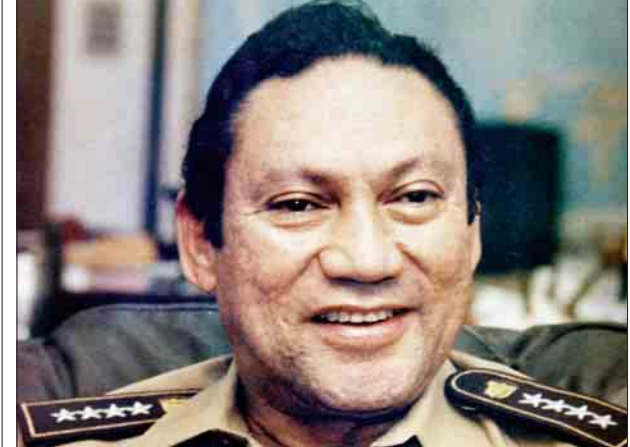
အင်န်အိုတ်ချီကေ။

လျှပ်စစ်ဓာတ်ကြိုးများ ပြတ်တောက် နေသည့်အတွက် လမ်းအတော် များများ ပိတ်ဆို့မှု ဖြစ်ပွားခဲ့သည်။ လေကြောင်းလိုင်းများ နှောင့်နှေးကြန့် ကြာခဲ့ရသကဲ့သို့ အခြားသော သယ်ယူ ပို့ဆောင်ရေးလုပ်ငန်းများသည်လည်း ရပ်ဆိုင်းသွားခဲ့ရသည်။ မော်စကိုမြို့သည် ယခုလ အစော ပိုင်းတွင် အချိန်အခါမဟုတ် ဆီးနှင်း များကျရောက်ခဲ့ပြီး အချို့ရက်များတွင် အပူချိန်သည် ၂၀ ဒီဂရီဆဲလ်စီးယပ် အထိ မြင့်တက်လေ့ရှိသည်။ ဒေသ ဆိုင်ရာ မိုးလေဝသတာဝန်ရှိသူများက တည်ငြိမ်မှုမရှိသော ဆိုးရွားသည့်ရာသီ ဥတုအခြေအနေများ ဆက်လက်ဖြစ် ပေါ်နိုင်ဖွယ်ရှိကြောင်း သတိပေးပြော ကြားထားသည်။