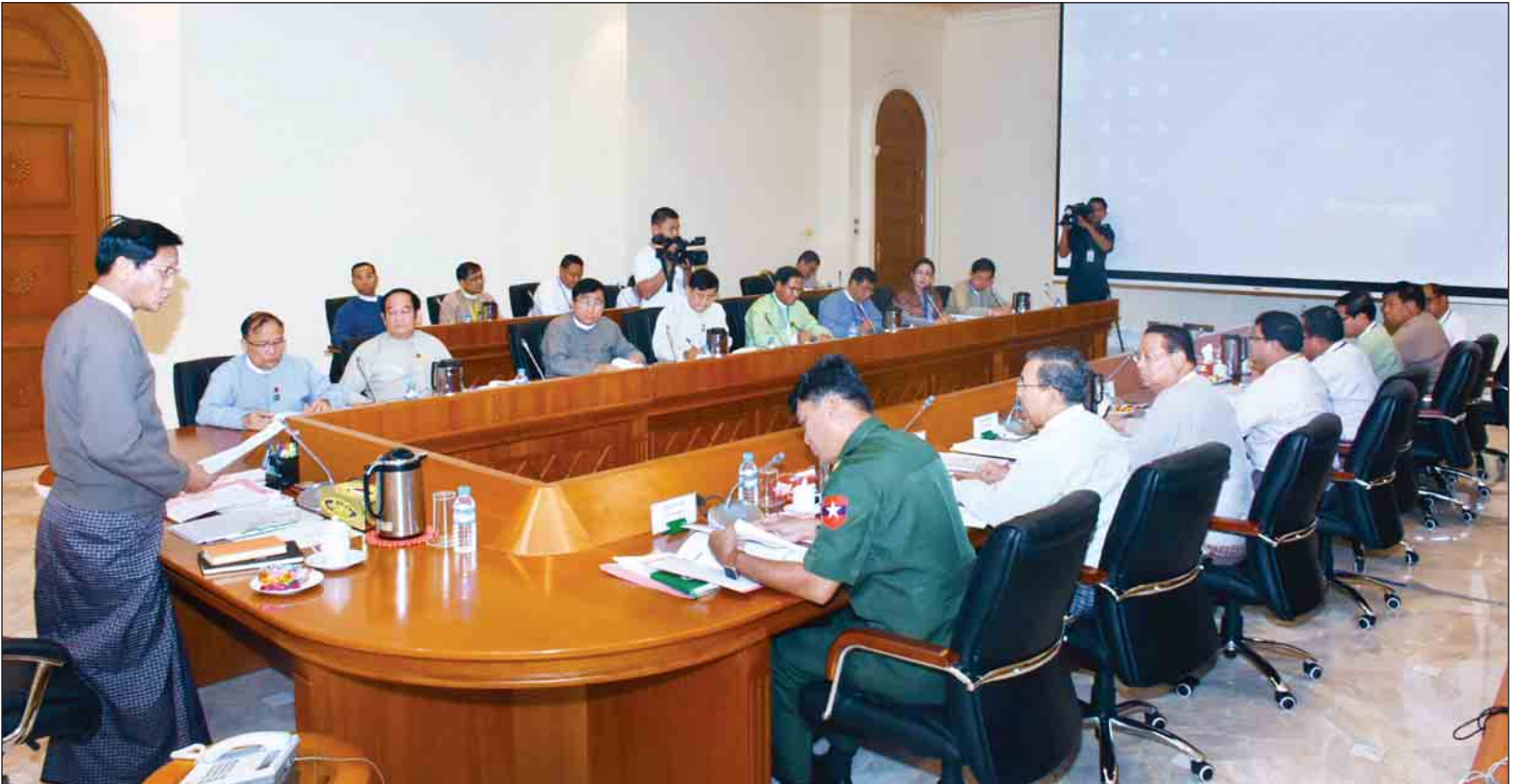
သဘာဝဘေးအန္တရာယ်ဆိုင်ရာစစ်တမ်း(၂၀၁၆) လုပ်ငန်းညှိနှိုင်းအစည်းအဝေးတွင် ဒုတိယသမ္မတ ဦးဟင်နရီဗန်ထီးယူ အမှာစကားပြောကြားစဉ်။

အစည်းအဝေးသို့ အမျိုးသားသဘာဝ ဘေးအန္တရာယ်ဆိုင်ရာစီမံခန့်ခွဲမှု ကော်မတီ ဒုတိယဥက္ကဋ္ဌများ ဖြစ်ကြ သည့် ပြည်ထောင်စုဝန်ကြီး ဒုတိယ ဗိုလ်ချုပ်ကြီးကျော်ဆွေ၊ ဒေါက်တာ ဝင်းမြတ်အေး၊ လုပ်ငန်းကော်မတီ ဥက္ကဋ္ဌများဖြစ်ကြသည့် ပြည်ထောင်စု ဝန်ကြီး ဦးသန့်စင်မောင်၊ ဦးအုန်းဝင်း၊ ဒေါက်တာမြင့်ထွေး၊ ဦးဝင်းခိုင်၊ ဒုတိယဝန်ကြီး ဦးမောင်မောင်ဝင်း၊ ဌာနဆိုင်ရာအကြီးအကဲများနှင့် တာဝန် ရှိသူများ တက်ရောက်ကြသည်။