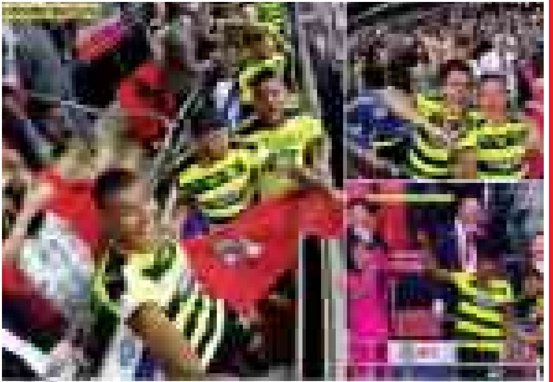
ဟက်ဒါဖီးလ်စ်အနေဖြင့် ပရိသတ်များအားသိထွက်ရန်အတွက် ယှဉ်ပြိုင်သည့်ပွဲစဉ်တွင် ရက်ဒင်းအသင်းကို အနိုင်ရရှိပြီး တန်းတက်ခွင့်ရရှိခဲ့သော်လည်း ကစားသမားများက ကွင်းအတွင်း ဆယ်လီတုတ်တံများဖြင့် ဓာတ်ပုံရိုက်အောင်ပွဲခံခဲ့ရကြောင်း ပရိသတ်များ၏ အမျက်သင့်ခံနေရကြောင်း သိရသည်။

ဆယ်လီတုတ်တံ အသုံးပြု အောင်ပွဲခံခဲ့ရသည့် ဟက်ဒါဖီးလ်စ် ကစားသမားများကို ပရိသတ်များအားသိထွက်