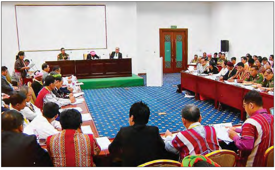
လုံခြုံရေးကဏ္ဍဆွေးနွေးပွဲ ကျင်းပစဉ်။

စာချုပ် (NCA) လက်မှတ်ရေးထိုးထားသော တိုင်းရင်းသား လက်နက်ကိုင်အဖွဲ့အစည်း ၈ ဖွဲ့မှာ KNU (ကရင်အမျိုး သားအစည်းအရုံး) ၊ KNU/KNLA(P.C) ကရင်အမျိုး သားအစည်းအရုံး/ ကရင်အမျိုးသားလွတ်မြောက်ရေး တပ်မတော်(ငြိမ်းချမ်းရေးကောင်စီ)၊ DKBA (ဒီမိုကရေစီ အကျိုးပြု ကရင်တပ်မတော်)၊ CNF (ချင်းအမျိုးသား တပ်ဦး)၊ PNLO (ပအိုဝ်းအမျိုးသား လွတ်မြောက်ရေး အဖွဲ့ချုပ်)၊ ABSDF (မြန်မာနိုင်ငံလုံးဆိုင်ရာကျောင်းသား များ ဒီမိုကရက်တစ်ဦး)၊ RCSS (ရှမ်းပြည်ပြန်လည်ထူ ထောင်ရေးကောင်စီ)၊ ALP (ရခိုင်ပြည်လွတ်မြောက်ရေး ပါတီ) တို့ဖြစ်ကြသည်။