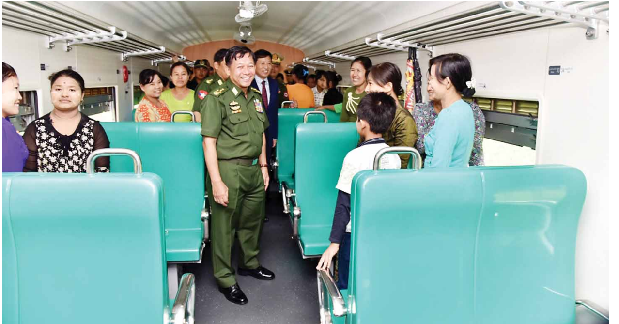
တပ်မတော်ကာကွယ်ရေးဦးစီးချုပ် ဗိုလ်ချုပ်မှူးကြီးမင်းအောင်လှိုင်နှင့် မြန်မာနိုင်ငံဆိုင်ရာ တရုတ်နိုင်ငံသံအမတ်ကြီး မစ္စတာဟုန်လျန်တို့ လိုက်ပါစီးနင်းကြသည့်ခရီးသည်များအား ရင်းရင်းနှီးနှီးနှုတ်ဆက်စဉ်။

ထိုသို့တွေ့ဆုံစဉ် နှစ်နိုင်ငံတပ်မတော်နှစ်ရပ်အကြား ဆက်ဆံရေးနှင့် ပူးပေါင်းဆောင်ရွက်မှုမြှင့်တင်ရေး၊ အပြန်အလှန်ချစ်ကြည်ရေးခရီးစဉ်များ၊ မြန်မာနိုင်ငံ၏ ငြိမ်းချမ်းရေးဖော်ဆောင်နေမှုအခြေအနေများ၊ နှစ်နိုင်ငံနယ်စပ်ဒေသ လုံခြုံရေး၊ တည်ငြိမ်အေးချမ်းရေးနှင့် ဖွံ့ဖြိုးတိုးတက်ရေးတို့အတွက် နှစ်ဖက်ညှိနှိုင်းဆွေးနွေးခြင်းဖြင့် ရလဒ်ကောင်းများရရှိရေး၊ နှစ်နိုင်ငံနယ်စပ်တိုင်းတာရေးကိစ္စရပ်များတွင် တပ်မတော်အနေဖြင့်လည်း ကူညီလုပ်ဆောင်သွား