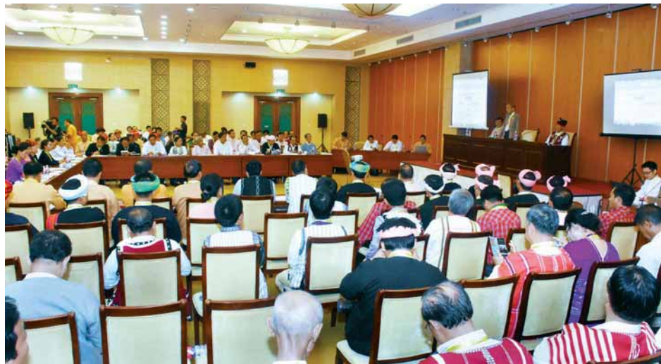
နိုင်ငံရေးပါတီအစုအဖွဲ့ကိုယ်စားလှယ်များ ဆွေးနွေးပွဲကျင်းပစဉ်။