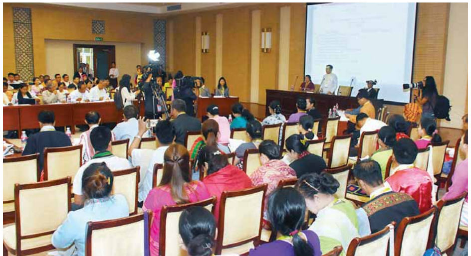
လူမှုရေးကဏ္ဍဆွေးနွေးပွဲ ကျင်းပစဉ်။