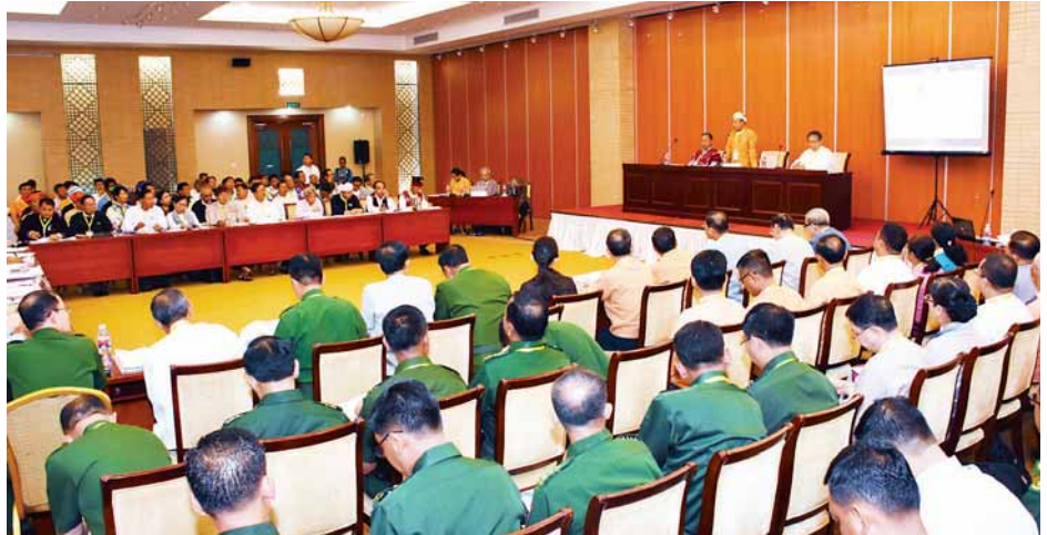
နိုင်ငံရေးကဏ္ဍဆွေးနွေးပွဲ ကျင်းပစဉ်။