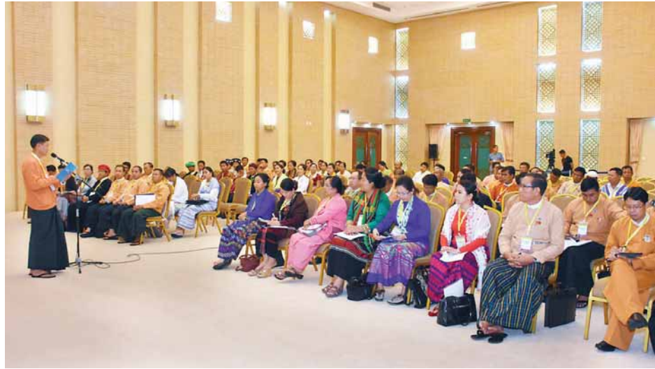
လွှတ်တော်အစုအဖွဲ့ကိုယ်စားလှယ်များ ဆွေးနွေးပွဲကျင်းပစဉ်။