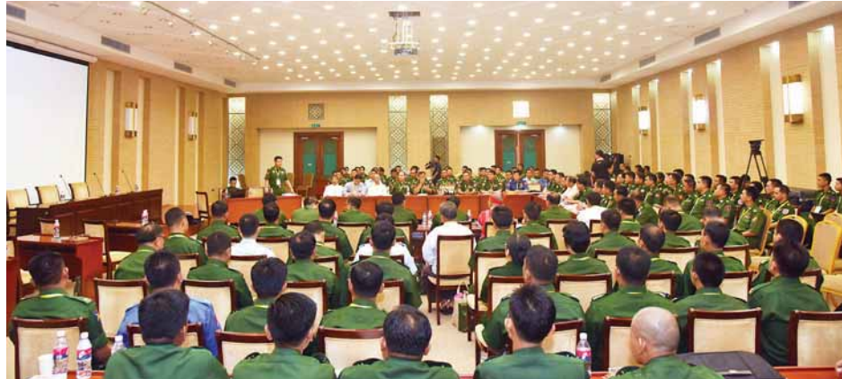
တပ်မတော်အစုအဖွဲ့ကိုယ်စားလှယ်များ ဆွေးနွေးပွဲကျင်းပစဉ်။