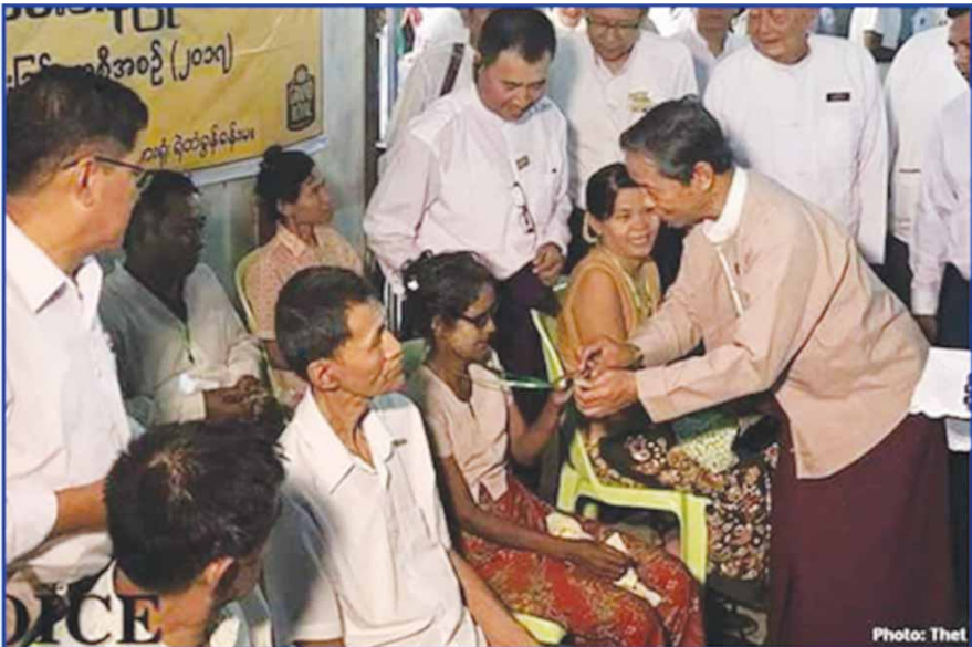
စီမံကိန်းနှင့်ဘဏ္ဍာရေးဝန်ကြီးဌာန ပြည်ထောင်စုဝန်ကြီး ဦးကျော်ဝင်း မျက်စိဝေဒနာရှင်များအားလှည့်လည်ကြည့်ရှုအားပေးစဉ်