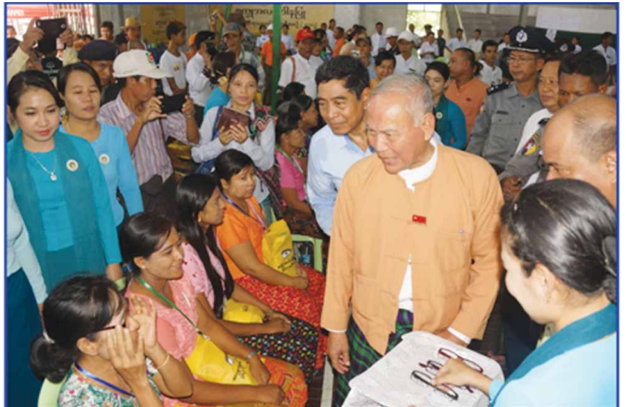
ဧရာဝတီတိုင်းဒေသကြီး ဝန်ကြီးချုပ်မန်းဂျော်နီ မျက်စိဝေဒနာရှင်များအား လှည့်လည်ကြည့်ရှုအားပေးစဉ်