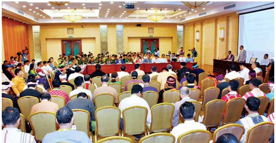
စီးပွားရေးကဏ္ဍဆွေးနွေးပွဲ ကျင်းပစဉ်။