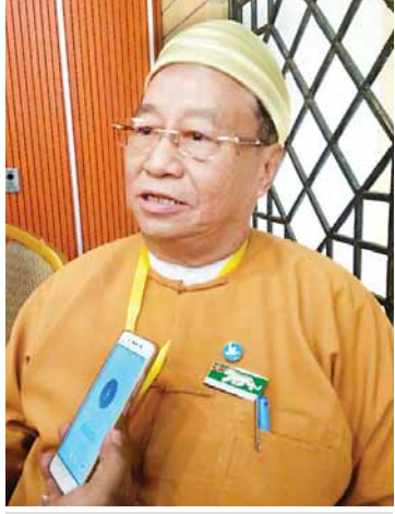
စိုင်းအိုက်ပေါင်း

ဒီမိုကရေစီဖက်ဒရယ်ပြည်ထောင်စု ပေါ်ထွန်းလာရေးအတွက် အခြေခံမူများကို အစိုးရ လွှတ်တော်၊ တပ်မတော်၊ တိုင်းရင်းသား လက်နက်ကိုင်အဖွဲ့အစည်း၊ နိုင်ငံရေးပါတီ စသည်တို့မှ ကိုယ်စားလှယ်များက ပြည်ထောင်စုငြိမ်းချမ်းရေးညီလာခံ-(၂၁)ရာစုပင်လုံ ဒုတိယအစည်းအဝေးတွင် နိုင်ငံရေး၊ စီးပွားရေး၊ လူမှုရေး၊ လုံခြုံရေးနှင့် မြေယာနှင့် သဘာဝပတ်ဝန်းကျင်ကဏ္ဍများကို ဆွေးနွေးမေးမြန်းအကြံပြုမှုများ လုပ်ဆောင်လျက်ရှိရာ ယင်းသို့ကဏ္ဍအလိုက် ဆွေးနွေးမှုများနှင့် ရရှိလာမည့်ရလဒ်များနှင့်စပ်လျဉ်း၍ တက်ရောက်လာသူတချို့ကို မေးမြန်းဖြစ်ခဲ့သည်။