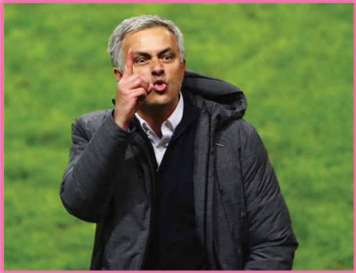
မော်ရင်ဟိုက "အက်ဂျစ်ဂါဗီမှာ ကျွန်တော့် စာရင်းရှိပြီးသားပါ"ဟု ယူရိုပီလီဂါဗီလ်လုပွဲ အပြီးတွင် ပြောကြားခဲ့သည်။ ဂရစ်ဇ်မန်းကို ခေါ်ယူလိုပါက မန်ယူအနေဖြင့် အက်သလက် နှင့် ဂရစ်ဇ်မန်းတို့ကြား ချုပ်ဆိုခဲ့သော