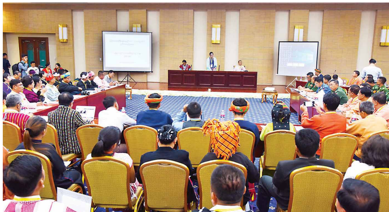
မြေယာနှင့် သဘာဝပတ်ဝန်းကျင်ကဏ္ဍ ဆွေးနွေးပွဲကျင်းပစဉ်။