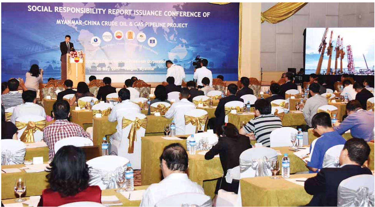
အရှေ့တောင်အာရှ ရေနံနှင့်သဘာဝဓာတ်ငွေ့ပိုက်လိုင်းကုမ္ပဏီ (SEAGP) ၏ လူမှုစီးပွားဖွံ့ဖြိုးတိုးတက်ရေးလုပ်ငန်းများ (CSR) လုပ်ငန်းအစီရင်ခံစာ ထုတ်ပြန်ရှင်းလင်းပွဲ အခမ်းအနားကျင်းပစဉ်။

ပိုက်လိုင်းစီမံကိန်းစတင်ချိန်မှ ယခုနှစ် မတ်လကုန်အထိ တရုတ်အမျိုးသား ရေနံကော်ပိုရေးရှင်းမှ မြန်မာနိုင်ငံလူမှုဝန်ကျင့် အကျိုးပြုလုပ်ငန်းများ အတွက် အမေရိကန်ဒေါ်လာ ၅၂၅၀၀၀ ကိုလည်းကောင်း၊ အကျိုးတူပူးပေါင်း ဆောင်ရွက်သည့်ကုမ္ပဏီများနှင့်အတူ ပိုက်လိုင်းဖြတ်သန်းရာဒေသများ၌ လူမှုစီးပွားလုပ်ငန်းပေါင်း ၁၂၀ အတွက် အမေရိကန်ဒေါ်လာ ၁၈၃ သိန်းကို လည်းကောင်း သုံးစွဲခဲ့ကြောင်း စာမျက်နှာ ၁၀ ကော်လံ ၁ သို့