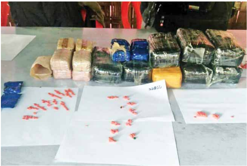
မောင်တောမြို့နယ်အတွင်း တပ်မတော်(ရေ)မှ နယ်မြေလုံခြုံရေးဆောင်ရွက်စဉ် ယမန်နေ့ နံနက် ၉ နာရီက ကညင်ချောင်းကမ်းစပ် ဒီရေတောအနီးတွင် မသင်္ကာဖွယ်တွေ့ရှိ၍ သွားရောက်စစ်ဆေးရာ နန်းမြေထဲတွင် ထက်ဝက် ခန့်မြှုပ်ထားသော ဆာလာအိတ်အတွင်းမှ WY/R စိတ်ကြွဆေးပြား ၁၇၀၀၀၀ ခန့်မှန်း ကာလ တန်ဖိုးငွေကျပ်သိန်း ၃၄၀၀ ကို ပိုင်ရှင်မဲ့ သိမ်းဆည်းရမိခဲ့ပြီး တရားခံများအား ဆက်လက် ဖမ်းဆီးရမိရေး စုံစမ်းလျက်ရှိကြောင်း သတင်း ရရှိသည်။ (သတင်းစဉ်)

မောင်တောမြို့နယ်အတွင်း တပ်မတော်(ရေ) မှ နယ်မြေလုံခြုံရေးဆောင်ရွက်စဉ် ယမန်နေ့ နံနက် ၉ နာရီက ကညင်ချောင်းကမ်းစပ် ဒီရေတောအနီးတွင် မသင်္ကာဖွယ်တွေ့ရှိ၍ သွားရောက်စစ်ဆေးရာ နန်းမြေထဲတွင် ထက်ဝက် ခန့်မြှုပ်ထားသော ဆာလာအိတ်အတွင်းမှ WY/R စိတ်ကြွဆေးပြား ၁၇၀၀၀၀ ခန့်မှန်း ကာလ တန်ဖိုးငွေကျပ်သိန်း ၃၄၀၀ ကို ပိုင်ရှင်မဲ့ သိမ်းဆည်းရမိခဲ့ပြီး တရားခံများအား ဆက်လက် ဖမ်းဆီးရမိရေး စုံစမ်းလျက်ရှိကြောင်း သတင်း ရရှိသည်။ (သတင်းစဉ်)