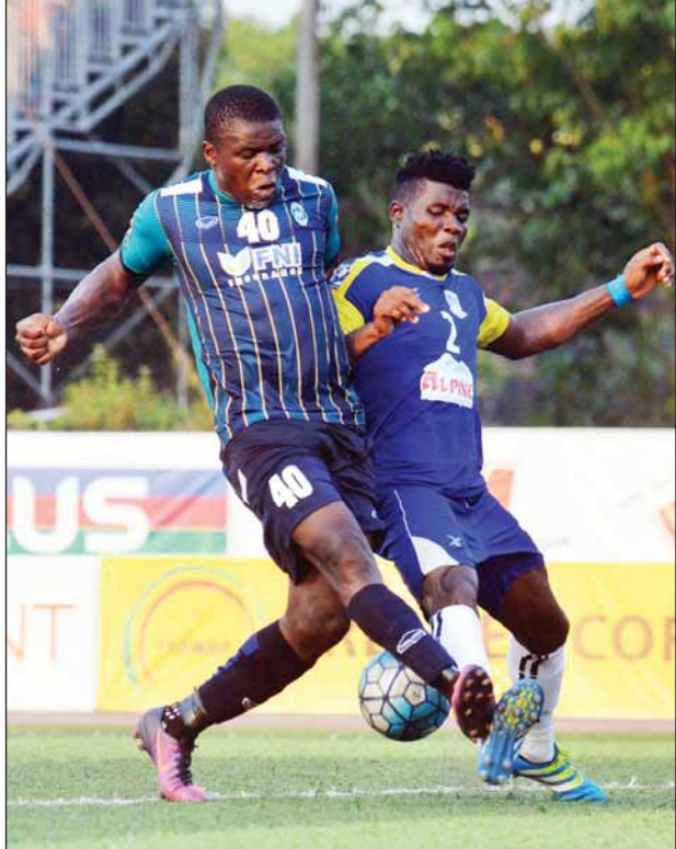
ရန်ကုန်နှင့် ရတနာပုံတို့ ပထမအကျော့က တွေ့ဆုံခဲ့စဉ်။

အရှေ့တောင်အာရှ ရေနံနှင့်သဘာဝဓာတ်ငွေ့ပိုက်လိုင်းကုမ္ပဏီ (SEAGP) သည် မြန်မာ၊ တရုတ်၊ အိန္ဒိယ၊ ကိုရီးယားနိုင်ငံ လေးနိုင်ငံရှိ ကုမ္ပဏီ ခြောက်ခုတို့က အကျိုးတူ ရင်းနှီးမြှုပ်နှံထားပြီး စီမံကိန်းကာလမှာ နှစ် ၃၀ ဖြစ်သည်။ (သတင်းစဉ်)