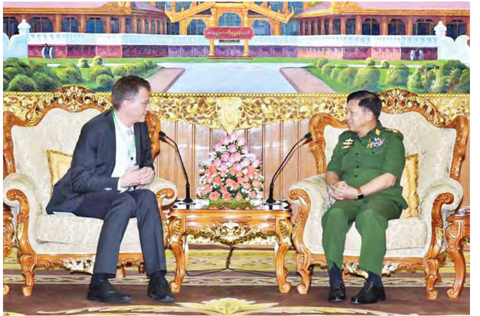
တပ်မတော်ကာကွယ်ရေးဦးစီးချုပ် ပိုလ်ချုပ်မှူးကြီးမင်းအောင်လှိုင် ဂျာမနီနိုင်ငံ ကာကွယ်ရေးဝန်ကြီးဌာန လွှတ်တော်ဆိုင်ရာ ဒုတိယဝန်ကြီးနှင့် လွှတ်တော်အမတ် Dr. Ralf Brauksiepe အား လက်ခံတွေ့ဆုံ (သတင်းစဉ်)

မည် ပူးပေါင်းဆောင်ရွက်မှုတိုးမြှင့်ရေးကိစ္စရပ်များ ဆွေးနွေးကြသည်။ ထို့အတူ တာဝန်ပြီးဆုံး၍ ပြန်လည်ထွက်ခွာမည့် မြန်မာနိုင်ငံဆိုင်ရာ ပါကစ္စတန်နိုင်ငံသံအမတ်ကြီး H.E.Mr. Ehsan Ullah Bath အား တပ်မတော်ကာကွယ်ရေးဦးစီးချုပ်သည် မွန်းလွဲ ၁ နာရီခွဲတွင် လက်ခံတွေ့ဆုံသည်။