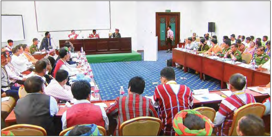
လုံခြုံရေးကဏ္ဍဆွေးနွေးပွဲ မွန်းလွဲပိုင်းအစီအစဉ် ကျင်းပစဉ်။

ထို့အတူ လူမှုရေးကဏ္ဍဆွေးနွေးပွဲတွင် ဦးဆောင်