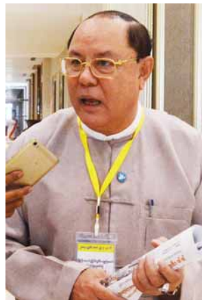
ဦးသိန်းဇော်

ခွင့်ရတယ်။ ယုံကြည်မှုတည်ဆောက် ဖို့အတွက် မျက်နှာချင်းဆိုင် စကားပြောတယ်။ ပုဂ္ဂိုလ်ရေးအရ လွတ်လွတ်လပ်လပ် တွေ့တာပါ။ တွေ့ဆုံမှုတိုးတက်မှုရှိတယ်” ဟု မီဒီယာများ၏ မေးမြန်းမှုကို ဖြေကြား