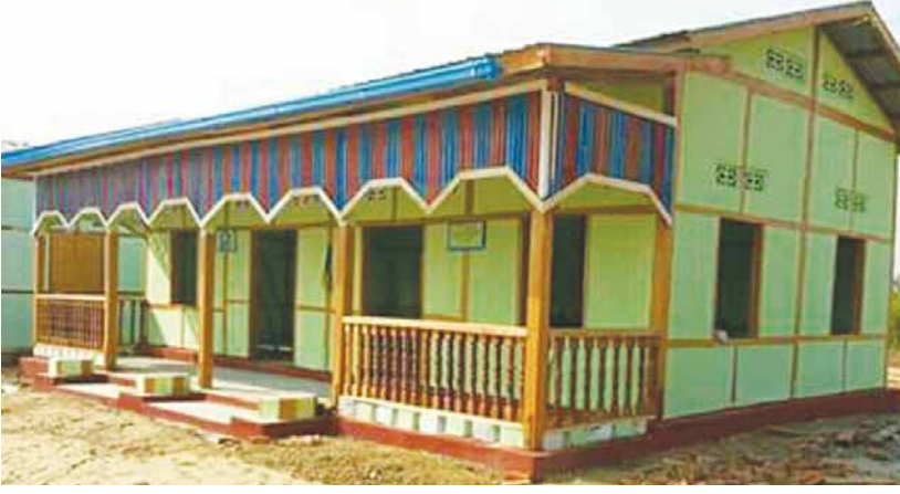
ရွာအဆင့်လုပ်ငန်းသုံးသပ်ခြင်းနှင့် လူထုစစ်ဆေးပွဲပြုလုပ်ကြောင်း သိရသည်။ ထိုကျောင်းဆောင်သစ်သည် ကျောင်းဖွင့်ရာသီပြီးစီးပြီဖြစ်၍ ဒေသခံကျောင်းသား၊ ကျောင်းသူများ ယခင်ကထက်စာသင်ကြားရေး ပိုမိုအဆင်ပြေမည် ဖြစ်ကြောင်း သိရသည်။ တင်နိုးလွင်

တပ်ကုန်း မေ ၂၅ နေပြည်တော် ဥက္ကဋ္ဌရခိုင် တပ်ကုန်းမြို့နယ် ကြီးကြားအင်းကျေးရွာအုပ်စု ဆည်ကြီးကျေးရွာ အခြေခံပညာမူလတန်းကျောင်းတွင် ကျောင်းသား၊ ကျောင်းသူများ ပိုမိုအဆင်ပြေစေရေးအတွက် မတ် ၂၆ ရက်မှစတင်၍ ကျောင်းဆောင်သစ်ဆောက်လုပ်လျက်ရှိရာ ၂၀၁၇-၂၀၁၈ ပညာသင်နှစ် ကျောင်းဖွင့်ရာသီအမီ ကျောင်းဆောင်သစ်ပြီးစီးပြီဖြစ်သည်။ အဆိုပါကျေးရွာရှိ ကျောင်းဆောင်သစ်အား ကမ္ဘာ့ဘဏ်ချေးငွေဖြင့် ကျေးလက်ဒေသဖွံ့ဖြိုးတိုးတက်ရေးဦးစီးဌာနမှ အကောင်အထည်ဖော်ဆောင်ရွက်လျက်ရှိသည့် လူထုပံ့ပိုးမှုစီမံကိန်း (တတိယနှစ်စက်ဝန်း) လုပ်ငန်းခွဲအဖြစ် အလျား ၃၆ ပေ၊ အနံ ၂၄ ပေ၊ အမြင့် ၁၂ ပေရှိ အုတ်ညှပ်၊ သွပ်မိုး တစ်ထပ် အဆောက်အအုံကို စီမံကိန်းထောက်ပံ့ငွေကျပ် ဥရောင်း၅၀ အကုန်အကျခံ ဆောက်လုပ်ခဲ့ပြီး ယင်းအဆောက်အအုံဆောက်လုပ်မှုဆိုင်ရာများ ကျေး