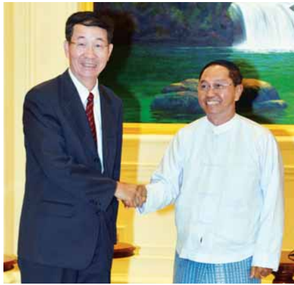
မောင်တောဒေသတည်ငြိမ်အေးချမ်းရေးနှင့် ဖွံ့ဖြိုးတိုးတက်ရေးဆိုင်ရာများ ဆွေးနွေး