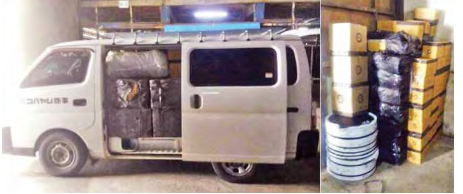
တရားဝင်စာရွက်စာတမ်း အထောက်အထားတစ်စုံတစ်ရာ တင်ပြနိုင်ခြင်းမရှိသည့် Satellite Receiver (PSI) စလောင်းထိပ်ဖူး၊ စလောင်းပန်းနှင့် စလောင်းဒေါက်များ၊ Lady Slipper များနှင့် သယ်ဆောင်သည့် ယာဉ်။

အလားတူ ထူးခြားဖမ်းဆီးမှုအနေဖြင့် မေ ၂၄ ရက် တွင် ဘုရားကြီးမြို့အဝင် တိုးဝိတ်အနီး၌ Nissan Caravan ယာဉ်အား ပဲခူးတိုင်းဒေသကြီး အကောက်ခွန် ဦးစီးဌာနမှူးရုံး စစ်ဆေးရေးအဖွဲ့မှ တားဆီးစစ်ဆေးခဲ့ရာ တရားဝင်စာရွက်စာတမ်း အထောက်အထားတစ်စုံတစ်ရာ