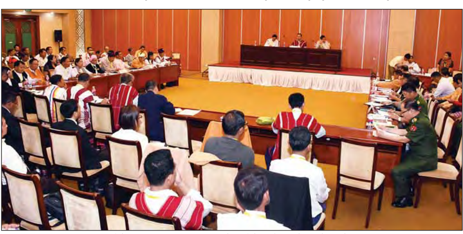
နိုင်ငံရေးကဏ္ဍဆွေးနွေးပွဲ မွန်းလွဲပိုင်းအစီအစဉ် ကျင်းပစဉ်။

သဘာပတိများက နိဂုံးချုပ်အမှာစကား ပြောကြားကြသည်။