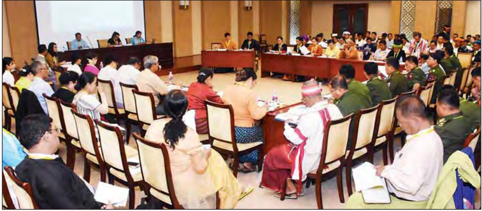
လူမှုရေးကဏ္ဍဆွေးနွေးပွဲ မွန်းလွဲပိုင်းအစီအစဉ် ကျင်းပစဉ်။

စောဒဲနီယယ်လ်၊ ဦးဇော်မင်းလတ်၊ စိုင်းယိန်ဇိုလ်မှူးချုပ်မြင့်မောင်ဦးတို့က ဆောင်ရွက်ကြသည်။