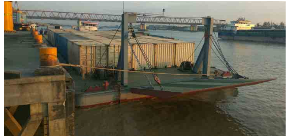
စီးဆင်းမှု မြန်ဆန်စေရန် မြန်မာနိုင်ငံ ဒေသအသီးသီးသို့ ကုန်စည်များပို့ဆောင်ရာ၌ ယခင်က လူအားဖြင့် သယ်ဆောင်နိုင်သည့် အရွယ်အစားရှိသော အထုပ်များ၊ အိတ်များအတွင်း ပစ္စည်းများထည့်သွင်း၍ ကုန်တင်၊ ချ ပြုလုပ်သည့် စနစ်အစား ယခုကဲ့သို့ ကုန်သေတ္တာများဖြင့် ထည့်သွင်း၍ ခေတ်မီစက်ယန္တရားများ အသုံးပြုကာ ကုန်တင်၊ ချ ပို့မို့ မြန်ဆန်ထိရောက်သော ကွန်တိန်နာရေယာဉ်များဖြင့် သယ်ယူပို့ဆောင်ရေးစနစ် အကောင်အထည်ဖော်ဆောင်ရွက်မှုမှာ ပို့ဆောင်ရေးနှင့် ဆက်သွယ်ရေးဝန်ကြီးဌာန ပြည်တွင်းရေးကြောင်းပို့ဆောင်ရေးအတွက် အလွန်အရေးပါသော လုပ်ငန်းဆောင်ရွက်မှုတစ်ခုဖြစ်ကြောင်း ပို့ဆောင်ရေးနှင့် ဆက်သွယ်ရေးဝန်ကြီးဌာနမှ သိရသည်။ (ဆုန်းလှ)

မြန်မာသင်္ဘောကျင်းသို့ ၂၀၁၅ ခုနှစ် မတ် ၂၅ ရက်တွင် လုပ်ငန်းအပ်နှံခဲ့ကြောင်း သိရသည်။ ယင်းမှ မြန်မာသင်္ဘောကျင်း၊ မြန်မာ-ဗီယက်နမ် သင်္ဘောကျင်းလုပ်ငန်းမှ ဂျပန်နိုင်ငံ၏ နည်းပညာအကူအညီဖြင့် အဆိုပါရေယာဉ်အား တည်ဆောက်ခဲ့ရာ ၂၀၁၅ ခုနှစ် အောက်တိုဘာ ၃၀ ရက်တွင် တည်ဆောက်ပြီးစီးခဲ့ပြီး ရေကြောင်းပို့ဆောင်ရေးညွှန်ကြားမှုဦးစီးဌာနတွင် အပြီးသတ်တိုင်းတာစစ်ဆေးမှုခံယူ၍ မြန်မာသင်္ဘောကျင်းလုပ်ငန်းမှ SA Marine ကုမ္ပဏီသို့ လွှဲပြောင်းပေးအပ်ခဲ့ကြောင်း သိရသည်။ အဆိုပါ အဆင့်မြင့်ဘက်စုံသုံးကွန်တိန်နာရေယာဉ်သစ်ကို တန်ဖိုးငွေကျပ် သိန်း ၄၀၄၀ အကုန်အကျခံတည်ဆောက်ခဲ့ခြင်း ဖြစ်သည်။ အဆိုပါ ဘက်စုံသုံး ကွန်တိန်နာရေယာဉ်အား နေရာသီ ရေပြေးစမ်းသပ်ခရီးစဉ်၊ မိုးရာသီရေပြေးစမ်းသပ်ခရီးစဉ်တို့ကို အောင်မြင်စွာ စမ်းသပ်ပြေးဆွဲနိုင်ခဲ့ကြောင်း သိရသည်။ ယင်းသို့ ရောဝတီမြစ်ကြောင်းတွင် ကုန်စည်နှင့် ခရီးသည်ပို့ဆောင်ရေး လွယ်ကူချောမွေ့စေရန်နှင့် ကုန်စည်