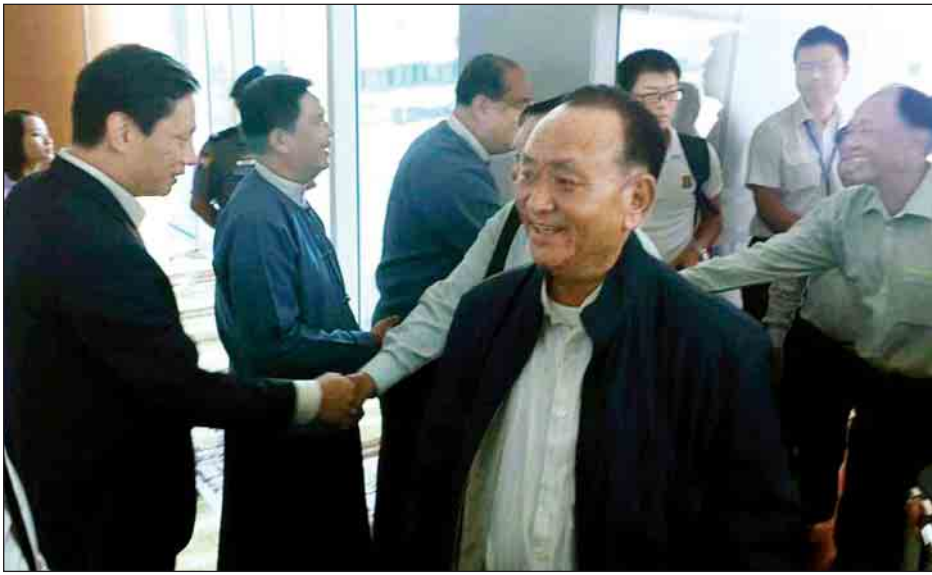
ပြည်ထောင်စုငြိမ်းချမ်းရေးညီလာခံ-(၂၁)ရာစုပင်လုံ(ဒုတိယအစည်းအဝေး)တက်ရောက်ရန် မြောက်ပိုင်းတိုင်းရင်းသား လက်နက်ကိုင်အဖွဲ့များ နေပြည်တော်သို့ ရောက်ရှိလာစဉ်။