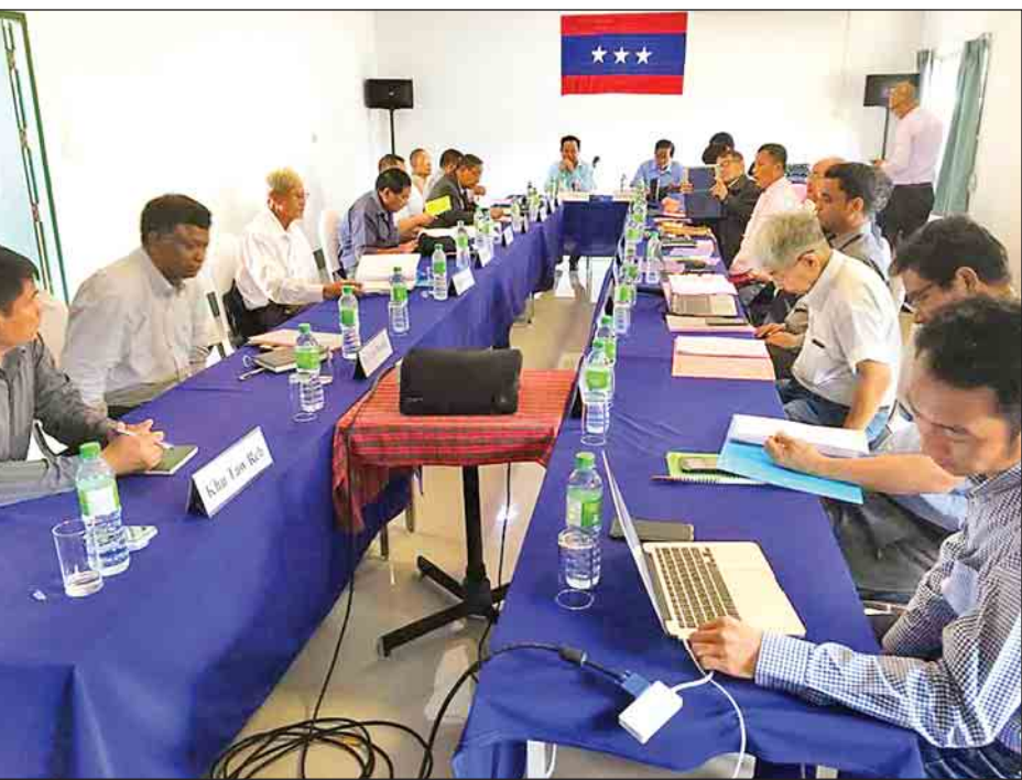
ညီညွတ်သောတိုင်းရင်းသားလူမျိုးများဖက်ဒရယ်ကောင်စီ (UNFC) ၏ ဗဟိုအလုပ်အမှုဆောင်ကော်မတီ(တိုးချဲ့) ပထမနေ့အစည်းအဝေး ကျင်းပစဉ်။

UNFC ဗဟိုအလုပ်အမှုဆောင် ကော်မတီ၏ သဘောထားထုတ်ပြန်မှု တွင် အချက်(၇)ချက်ပါဝင်ပြီး UNFC အနေဖြင့် တစ်နိုင်ငံလုံးအပစ်အခတ်