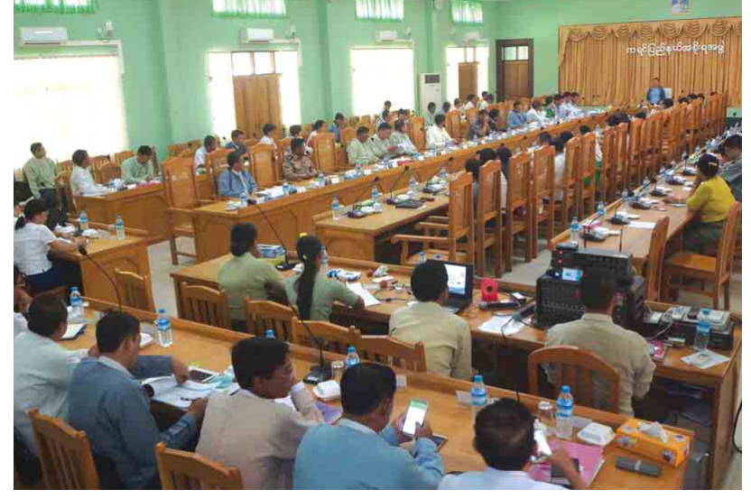
စောမျိုးစင်းသိန်း(ပြန်/ဆက်)

နှင့် ဆက်သွယ်ရေးဝန်ကြီးဌာနတို့မှ ဒုတိယ ညွှန်ကြားရေးမှူးချုပ်များက မိမိတို့ သက်ဆိုင်ရာ ဝန်ကြီးဌာနများ၏ ကဏ္ဍများနှင့် စပ်လျဉ်း၍ ရှင်းလင်းဆွေးနွေးကြကာ ကရင်ပြည်နယ် ဝန်ကြီးများ၊ ပြည်နယ်အဆင့် ဌာနဆိုင်ရာ တာဝန်ရှိသူများက သက်ဆိုင်ရာကဏ္ဍအလိုက် ပြည်ထောင်စုနှင့်ဆက်သွယ် ဆောင်ရွက်ရာတွင် ကြုံတွေ့ရသည့် အခက်အခဲများအား ရှင်းလင်းတင်ပြကြသည်။ ထို့နောက် ပြည်ထောင်စုဝန်ကြီးဌာနများမှ ဦးဆောင်ညွှန်ကြားရေးမှူး၊ ဒုတိယညွှန်ကြားရေးမှူးချုပ်များ ပါဝင်သည့် အဖွဲ့အမှတ် (၂) နှင့် ပြည်နယ်အစိုးရအဖွဲ့ဝင်ဝန်ကြီးများ၊ ဌာနဆိုင်ရာတာဝန်ရှိသူများက ကြုံတွေ့ရသည့် အခက်အခဲများအား အပြန်အလှန်မေးမြန်းဆွေးနွေးကြပြီး ပြည်နယ်စီမံကိန်း၊ ဘဏ္ဍာရေးနှင့် စည်ပင်သာယာရေးဝန်ကြီး ဦးသန်းနိုင်က နိဂုံးချုပ်အမှာစကားပြောကြားခဲ့ကြောင်း သိရသည်။