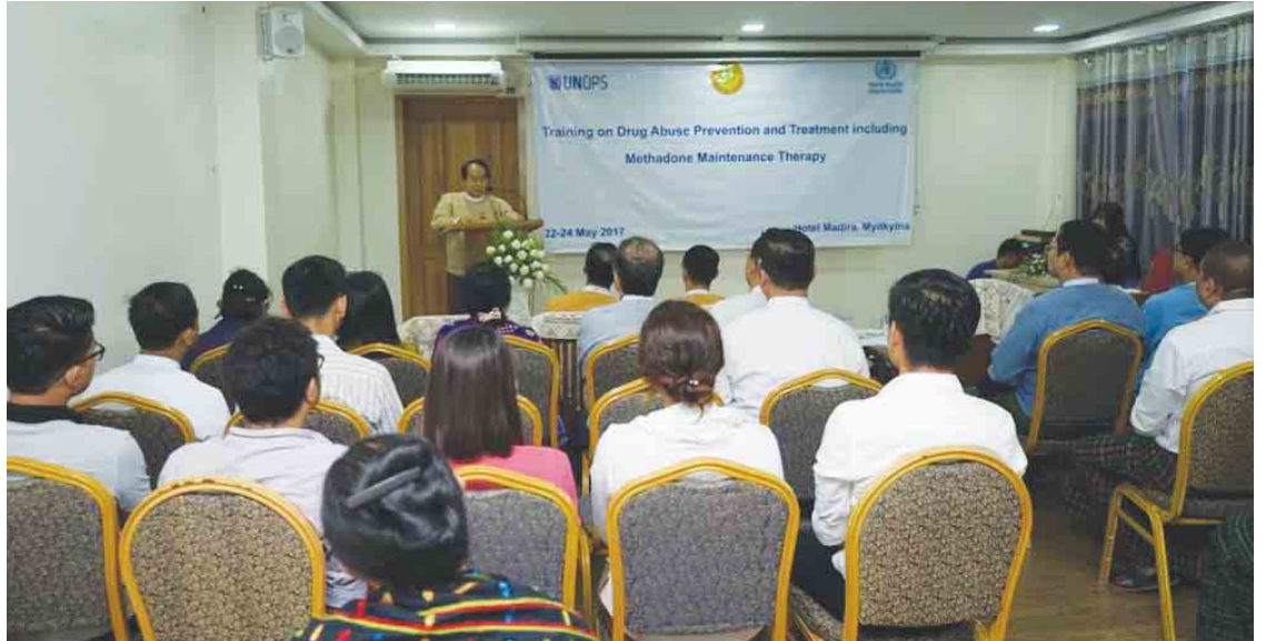
သူနာပြုဆရာမများ၊ ဆေးလူမှုဝန်ထမ်းများနှင့် NGO အဖွဲ့အစည်းများကို မေ ၂၂ ရက်မှ ၂၄ ရက်အထိလည်းကောင်း စုစုပေါင်းခြောက်

အဆိုပါသင်တန်းကို ကချင်ပြည်နယ်အတွင်းရှိ မက်သုန်းဆေးရုံဖြင့် မူးယစ်ဆေးဝါးကုသရေးဌာန ၁၅ ခုမှဆရာဝန်များကို မေ ၂၂ ရက်မှ ၂၄ ရက်အထိလည်းကောင်း၊