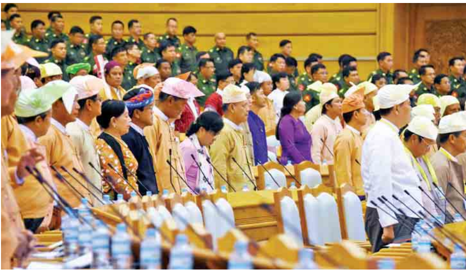
ပြည်ထောင်စုလွှတ်တော်အစည်းအဝေးသို့ တက်ရောက်ကြသည့် လွှတ်တော်ကိုယ်စားလှယ်များကို တွေ့ရစဉ်။

ယင်းကိစ္စနှင့်စပ်လျဉ်း၍ လွှတ်တော်၏ အတည်ပြု ချက်ရယူရာ သဘောတူကြောင်း ဆုံးဖြတ်သည်။