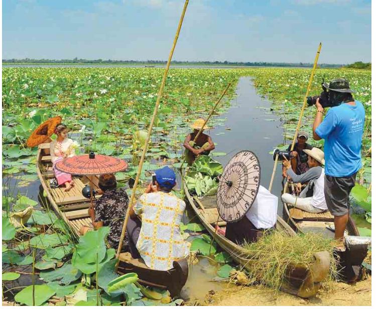
ပေါက်ရောက်သည့် ကြာတောနေရာသို့ လာရောက်လည်ပတ်သူအများစုမှာ လူငယ်လူရွယ်များဖြစ်ပြီး မှတ်တမ်းဓာတ်ပုံရိုက်ကူးသူ၊ မင်္ဂလာဆောင် အကြိုမှတ်တမ်းဓာတ်ပုံ

“မိတ္ထီလာမြို့ ပေါ်ရပ်ကွက်တွေနဲ့ တကွသိုလ်ကျောင်းသူ၊ ကျောင်းသားတွေ အများဆုံး လာရောက်ပြီး ကြာတောထဲမှာ လှေစီးရင်း ကြာခူးကြတယ်။ တချို့ကတော့ စုံတွဲတွေ လှေစီးရင်းကြာခူး၊ တချို့ကတော့ သူငယ်ချင်းတစ်သိုက် အတူတူလှေစီးပြီး ကြာပန်းခူးကြတယ်။ လှေစီးတဲ့သူတစ်ယောက်ကို ငွေကျပ် ၁၀၀၀ တောင်းတယ်။ မိသားစုအသက်မွေးဝမ်းကျောင်းအတွက် ငါးဖမ်းတဲ့လှေသမားတွေက အပိုင်ငွေလေးရအောင် လှေလှော်ပြီး ကြာတောထဲ ပို့ပေးတာပါ။ တိုးအရင်တုန်းက ကြာပန်းတွေ ဒီလောက်အများကြီး မပေါက်ဘူး။ ကန်ထဲမှာ ကြာပေါက်ပေမယ့် ဒီလောက်အများကြီး မဟုတ်တော့ လူသိနည်းခဲ့တယ်” ဟု ကြာတော၏ အနောက်ဘက်ရှိ ကုလားမကျွန်းကျေးရွာမှ ဒေသခံတစ်ဦးက ပြောသည်။ မိတ္ထီလာမြောက်ကန်အတွင်း ကြာဖြူပန်း