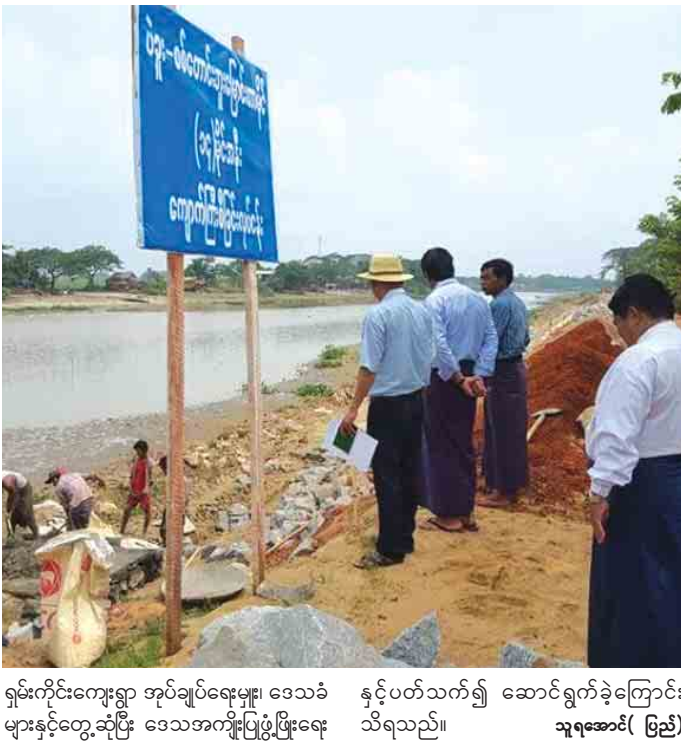
ရှမ်းကိုင်းကျေးရွာ အုပ်ချုပ်ရေးမှူး၊ ဒေသခံနှင့်ပတ်သက်၍ ဆောင်ရွက်ခဲ့ကြောင်း များနှင့်တွေ့ဆုံပြီး ဒေသအကျိုးပြုဖွံ့ဖြိုးရေး သူရအောင်( မြည်) သိရသည်။

ကြီးနစ်မြုပ်မှုမှ ကာကွယ်နိုင်မည်ဖြစ်သည့် အပြင် နေရာသီ ရေချိုထိန်းပေးပြီး မိုးရာသီတွင် ကွင်းရေထုတ်နုတ်ပေးသော အဓိကရေနုတ်မြောင်းတစ်ခု ဖြစ်ကြောင်း သိရသည်။ ညွှန်ကြားရေးမှူးနှင့် လက်ထောက်ညွှန်ကြားရေးမှူးတို့သည် သနပ်ပင်မြို့နယ်အတွင်း ပဲခူး-စစ်တောင်းတူးမြောင်းနှင့် တူးမြောင်းတာပေါင်လမ်း ရေရရှိသည် တုံ့စေရန်အတွက် ဆောင်ရွက်နေသော တူးမြောင်းနံရံကျောက်ကြီးစီခြင်းလုပ်ငန်းအား ကွင်းဆင်းကြည့်ရှုပြီး ပေါမြို့နယ် ရှမ်းကိုင်းရေထိန်းတံခါး (Outfall Channel) သဲနုန်းတူးဖော်ခြင်းနှင့် ရေလမ်းကြောင်းဖြောင့်ဆောင်ရွက်နေမှုအား ကြည့်ရှုစစ်ဆေးခဲ့သည်။ ယခုဆောင်ရွက်နေသည့် လုပ်ငန်းများသည် မိုးရာသီအတွင်း ကွင်းရေများ စစ်တောင်းမြစ်အတွင်းသို့ ထုတ်နုတ်နိုင်ရေးအတွက် ဆောင်ရွက်ရခြင်းဖြစ်ပြီး အချိန်မီပြီးစီးနိုင်ရေးအတွက် အင်တိုက်အားတိုက် နေ့၊ ည မပြတ်ဆောင်ရွက်ရန် မှာကြားခဲ့ပြီး ညွှန်ကြားရေးမှူးသည်