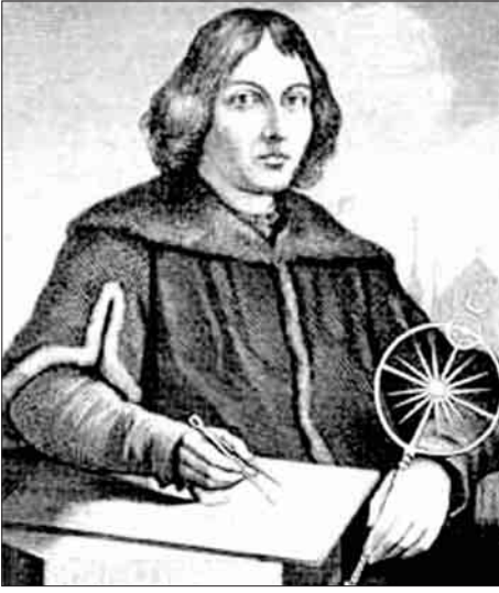
နှစ်ကိုလပ်ကောပါးနီးကပ်

အထက်မှာ ကမ္ဘာဟာ စကြဝဠာရဲ့ အလယ်ဗဟို ချက်မဖြစ်ပြီး နေနှင့်တကွ အခြားဂြိုဟ်များနှင့် ဝေးလံသော အရပ်ရပ်ကြယ်များဟာ ကမ္ဘာကို စက်ဝိုင်းပုံ နှင့် ဝန်းရံလည်ပတ် (သို့မဟုတ်) လှည့်ပတ်နေတယ် (The Earth is the centre of the Universe, the Sun, the planets and the distant stars revolve around the Earth in perfect circles) ဆိုတဲ့ ကမ္ဘာ ဗဟိုပြုဝါဒ အယူအဆ သီအိုရီ (geocentric theory) ကို နှစ်ပေါင်း ၁၂၀၀ ခန့်အတွင်းမှာ သိပ္ပံပညာရှင်