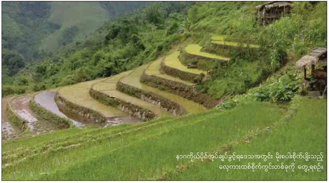
နာဂကိုယ်ပိုင်အုပ်ချုပ်ခွင့်ရဒေသအတွင်း မိုးစပါးစိုက်ပျိုးသည့် လေ့ကားထစ်စိုက်ကွင်းတစ်ခုကို တွေ့ရစဉ်။

မုံရွာ မေ ၂၂ ၂၀၁၇-၂၀၁၈ ဘဏ္ဍာနှစ် စစ်ကိုင်း တိုင်းဒေသကြီး နာဂကိုယ်ပိုင် အုပ်ချုပ်ခွင့်ရဒေသအတွင်းရှိ မြို့နယ် နှင့် မြို့နယ်ခွဲ ခုနစ်ခုတွင် မိုးစပါးကေ ၂၇၈၄၀ စိုက်ပျိုးသွားရန် လျာထား ကြောင်း တိုင်းဒေသကြီး စိုက်ပျိုးရေး ဦးစီးဌာနမှ သိရသည်။ ၂၀၁၇-၂၀၁၈ ဘဏ္ဍာနှစ် မိုးစပါး စိုက်ရာသီတွင် နာဂကိုယ်ပိုင်အုပ်ချုပ် ခွင့်ရဒေသအတွင်းရှိ လေရှီးမြို့နယ် အတွင်း ၆၂၀၇ ဧက၊ မိုပိုင်လွတ် မြို့နယ်အတွင်း ၉၀၇ ဧက၊ လဟယ် မြို့နယ်အတွင်း ၆၁၆၃ ဧက၊ ထန်ပါခွေမြို့နယ်အတွင်း ၁၅၀၂ ဧက၊ နန်းယွန်းမြို့နယ်အတွင်း ၂၇၅၈ ဧက၊ ဒုံတီးမြို့နယ်ခွဲအတွင်း ၅၂၄၁ ဧက၊ စာမျက်နှာ ၃ ကော်လံ ၅ သို့ ☉