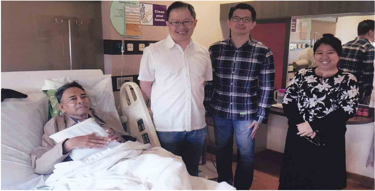
စာရေးသူ နှလုံးသွေးကြောအစားထိုးကုသပြီး လေးရက်မြောက်နေ့ နံနက် ခွဲစိတ်ကုသပေးသည့် ဆရာဝန်ကြီးနှင့်အတူ။

(National Heart Centre Singapore(NHCS) မှ နှလုံးခွဲစိတ် ကုသမှုဆိုင်ရာ ဆရာဝန်ကြီး Prof Kenny Sin နှင့် ဆေးရုံမှဝန်ထမ်းများ အား ကျေးဇူးတင်ဂုဏ်ပြုလျက်)