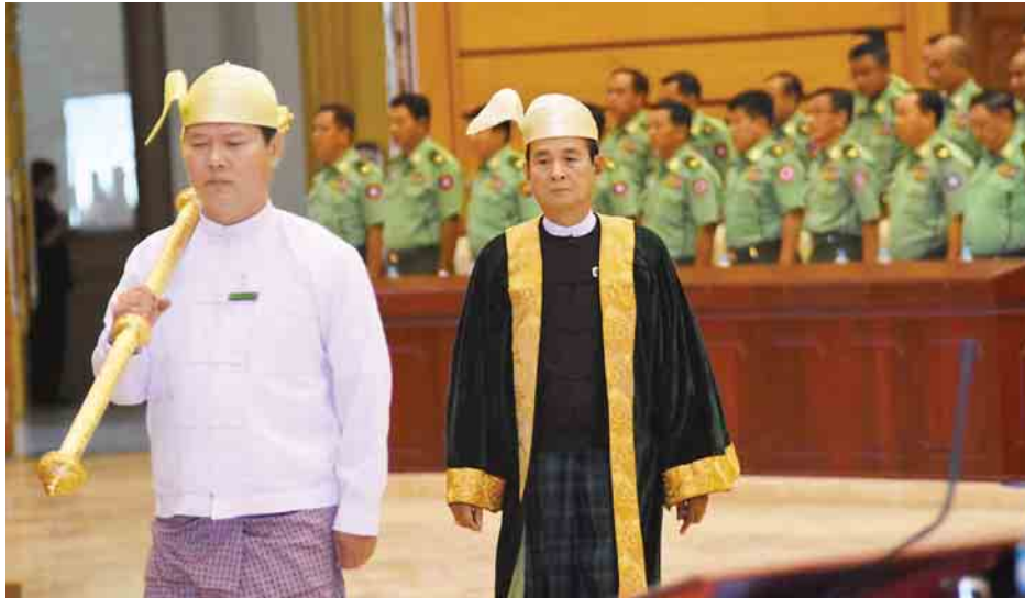
ပြည်သူ့လွှတ်တော်ဥက္ကဋ္ဌ ဦးဝင်းမြင့်(ယာ) လွှတ်တော်တက်ရောက်လာစဉ်။

ထို့ပြင် ပျော်ဘွယ်မဲဆန္ဒနယ်မှ ဦးသောင်းအေး၊