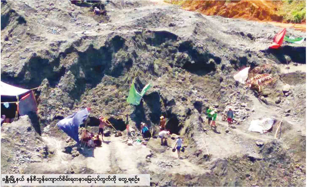
ခန္တီးမြို့နယ် နှစ်စဉ်ကွန်ကျောက်စိမ်းရတနာမြေပြင်လုပ်ကွက်ကို တွေ့ရစဉ်။

စစ်ကိုင်းတိုင်းဒေသကြီး ခန္တီးမြို့နယ် နှစ်စဉ်ကွန်ကျောက်စိမ်းရတနာမြေပြင် ဖြစ်ပွားခဲ့သော ကိစ္စနှင့်ပတ်သက်၍ စစ်ကိုင်းတိုင်းဒေသကြီး ဥပဒေချုပ် ဦးခင်မောင်လှက “ခန္တီးရတနာမြေကို ဝန်ကြီးချုပ်နဲ့အတူ တိုင်းဒေသကြီးနယ်မြေ လွှတ်တော်ကိုယ်စားလှယ်တွေ ကြည့်ရှုစစ်ဆေးခဲ့ပါတယ်။ စစ်ဆေးတဲ့အခါ ကုမ္ပဏီထဲစုစည်းထားတဲ့ မြေစာပုံတွေကို ရေမဆေးတွေနဲ့ ကုမ္ပဏီဝန်ထမ်းတွေ ရှာဖွေနေတာတွေ့ခဲ့ရပါတယ်။ အခုဖြစ်စဉ်မှာ နှစ်ဖက်ပဋိပက္ခဖြစ်ကြတာ မဟုတ်ဘဲ အခုဖြစ်တဲ့စည်းရုံးကာထားတဲ့ ကုမ္ပဏီဝင်းအတွင်းမှာစုပုံထားတဲ့ ရေမဆေးမြေစာပုံတွေကို လူစုကြီးကဝင်ရောက်သယ်ယူဖျက်ဆီးတဲ့ တစ်ဖက် သတ်အပြုအမူကို လုပ်တာဖြစ်ပါတယ်။ ဒါကြောင့်မို့ ဒီအပြုအမူဟာ ပဋိပက္ခ မဟုတ်ဘဲ ဥပဒေနဲ့ဆန့်ကျင်တဲ့ အစုအဝေးလှုံ့ဆော်မှုဖြစ်ပါတယ်”ဟု တိုင်းဒေသကြီးလွှတ်တော်တွင် ရှင်းလင်းပြောကြားသည်။