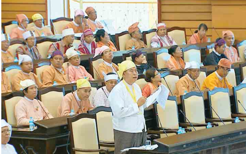
ပညာရေးဝန်ကြီးဌာန ဒုတိယဝန်ကြီး ဦးဝင်းမော်ထွန်း အမျိုးသားလွှတ်တော်တွင် ရှင်းလင်းဖြေကြားနေစဉ်။

ဆက်လက်၍ ဒုတိယဝန်ကြီးက မွန်ပြည်နယ်အတွင်းရှိ အခြေခံပညာအထက်တန်းကျောင်း ၁၁ ကျောင်း၊ အခြေခံ ပညာအထက်တန်းကျောင်း(ခွဲ) ၄ ကျောင်း၊ အခြေခံပညာ အလယ်တန်းကျောင်း ၂၂ ကျောင်း၊ အခြေခံပညာအလယ်တန်း ကျောင်း (ခွဲ) ၁၀ ကျောင်း၊ အခြေခံပညာမူလတန်းလွန် ကျောင်း ၁၂ ကျောင်း၊ အခြေခံပညာမူလတန်းကျောင်း ရှစ်ကျောင်းနှင့် အခြေခံပညာ မူလတန်းကျောင်း(ခွဲ) တစ်ကျောင်း စုစုပေါင်း ၆၉ ကျောင်းအား ကျောင်းအဆင့် တိုးမြှင့်ပေးရန်အတွက် စီစဉ်ဆောင်ရွက်လျက်ရှိပါကြောင်း၊ မွန်ပြည်နယ် မုဒုံမြို့နယ် စာစင်လမ်းမကြီးရပ် အခြေခံပညာ အလယ်တန်းကျောင်း(ခွဲ)တွင် စုစုပေါင်းလယ်ဆင့်သင် ကျောင်းသား ကျောင်းသူ ၂၆ ဦးသာရှိပြီး ပစ်ကျောင်းနှင့် ကုန်းလမ်းခရီး ခြောက်ဖာလုံခန့်သာ ကွာဝေးပါကြောင်း။