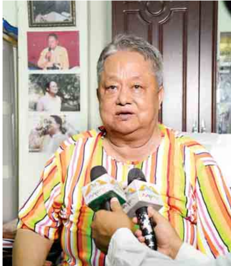
သတင်းမီဒီယာများနှင့်တွေ့ဆုံစဉ် တပ်မတော်၊ ပြည်ထောင်စုကြံ့ခိုင်ရေးနှင့် ဖွံ့ဖြိုးရေးပါတီတို့နှင့် ပတ်သက်၍ ထည့်သွင်းပြောကြားခဲ့မှုအပေါ် ပြန်လည် ရှင်းလင်းခဲ့ခြင်းဖြစ်သည်။