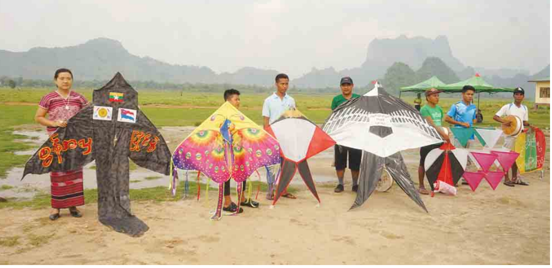
ရေးအသင်းတို့အား ပြည်နယ်လှုပ်စစ်နှင့် စက်မှုဝန်ကြီး ဦးစိုးလှိုင်၊ ပြည်နယ် ဗမာတိုင်း ရင်းသား လူမျိုးရေးရာဝန်ကြီး ဦးတေထွဋ် လှိုင်ထွေးနှင့် တာဝန်ရှိသူများက ဆက်လပ် နှင့် ငွေသားဆုများကို ချီးမြှင့်ပေးခဲ့ကြောင်း မေးမြန်းလွှင့်(မြန်/ဆက်)

နှင့် အဆိုပါပြိုင်ပွဲတွင် ဘားအံမြို့နယ်အတွင်း ဌာန ၃၆ ဌာန၊ ရပ်ကွက် ၂ ရပ်ကွက်မှ စွန် အလှပြိုင်ပွဲတွင် ၁၄ ဦး၊ စွန်ဖြတ်ပြိုင်ပွဲ တွင် ၄၂ ဦးသည် ဒိုင်အဖွဲ့၏ စည်းကမ်းချက် များအတိုင်း မေ ၂၀ ရက်မှ မေ ၂၁ ရက် ညနေပိုင်းအထိ နှစ်ရက်တိုင်တိုင် ယှဉ်ပြိုင်ကြ ကြောင်း သိရသည်။ ဗိုလ်လုပွဲအပြီးတွင် ဆုပေးပွဲကိုဆက်လက် ကျင်းပရာ မြန်မာ့ရိုးရာစွန်အလှပြိုင်ပွဲတွင် ပထမဆုရ ကွန်ပျူတာတက္ကသိုလ်အသင်းမှ Key Stone အလှပြိုင်ပွဲ၊ ဒုတိယဆုရ ဒေါနနတ် သမီးအသင်းမှ စုတ်ခွက်အလှပြိုင်ပွဲ၊ တတိယ ဆုရ အမှတ်(၄)ရပ်ကွက်အသင်းမှ သိန်းငှက် ကြီးအလှပြိုင်ပွဲ၊ စတုတ္ထဆုရ စားသုံးသူရေးရာ ဌာနအသင်းမှ ငှက်တော်အလှပြိုင်ပွဲ၊ ပဉ္စမဆုရ စိုက်သိပ္ပံအသင်းမှ မြေစွန်အလှပြိုင်ပွဲနှင့် စွန် ဖြတ်ပြိုင်ပွဲ ပထမဆုရ ဒေါနနတ်သမီးအသင်း၊ ဒုတိယဆုရ စည်ပင်သာယာရေးဌာနအသင်း၊ တတိယဆုရ တိုင်းရင်းဆေးအသင်း၊ စတုတ္ထ ဆုရ လမ်းစီးဦးဌာနအသင်း၊ ပဉ္စမဆုရ တရား