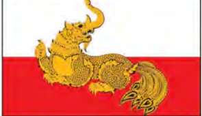
ပြည်ထောင်စုရွေးကောက်ပွဲကော်မရှင်