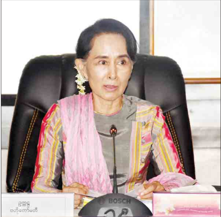
နိုင်ငံတော်၏အတိုင်ပင်ခံပုဂ္ဂိုလ် ဒေါ်အောင်ဆန်းစုကြည် အမှာစကားပြောကြားစဉ်။

ထို့နောက် အစည်းအဝေးကျင်းပရေးဆက်စပ်မတီ၊ 8 th Model ASEM ကျင်းပရေး ဆက်စပ်မတီ၊ ပြန်ကြားရေး 11 th ASEM Journalists' Seminar ကျင်းပရေးဆက်စပ်မတီ၊ နေပြည်တော်သာယာလှပရေးဆက်စပ်မတီ၊ အတွင်းရေးမှူးရုံးနှင့် ညှိနှိုင်းကွပ်ကဲရေးဌာန၊ သံတမန် ရေးရာကိစ္စရပ်များ ဆောင်ရွက်ရေးဆက်စပ်မတီ၊ ကြိုဆိုရေးမှခံဦးများ၊ အလံများနှင့် ဆိုင်းဘုတ်များ စိုက်ထူရေး၊ မီးအလှများထွန်းညှိရေးနှင့် အခြားလုပ်ငန်းများဆက်စပ်မတီ၊ သယ်ယူပို့ဆောင်ရေးနှင့် ဆက်သွယ်ရေးဆက်စပ်မတီ၊ လုံခြုံရေးဆက်စပ်မတီ၊ ကျန်းမာရေးဆက်စပ်မတီ၊ ဖျော်ဖြေရေး ဆက်စပ်မတီ၊ ဧည့်ခံကျွေးမွေးရေးနှင့် လေ့လာရေးခရီးစဉ် စီစဉ်ပေးရေးဆက်စပ်မတီ၊ ဘဏ္ဍာရေး နှင့် ဘဏ္ဍာရေးလုပ်ထုံးလုပ်နည်းများ မှန်ကန်မှုရှိစေရေးဆက်စပ်မတီနှင့် အခမ်းအနားများ ပြင်ဆင်ရေးဆက်စပ်မတီတို့မှ တာဝန်ရှိသူများက သက်ဆိုင်ရာကဏ္ဍအလိုက် ဆောင်ရွက်သွားမည့် လုပ်ငန်းအခြေအနေများကို ရှင်းလင်းတင်ပြကြသည်။ (သတင်းစဉ်)