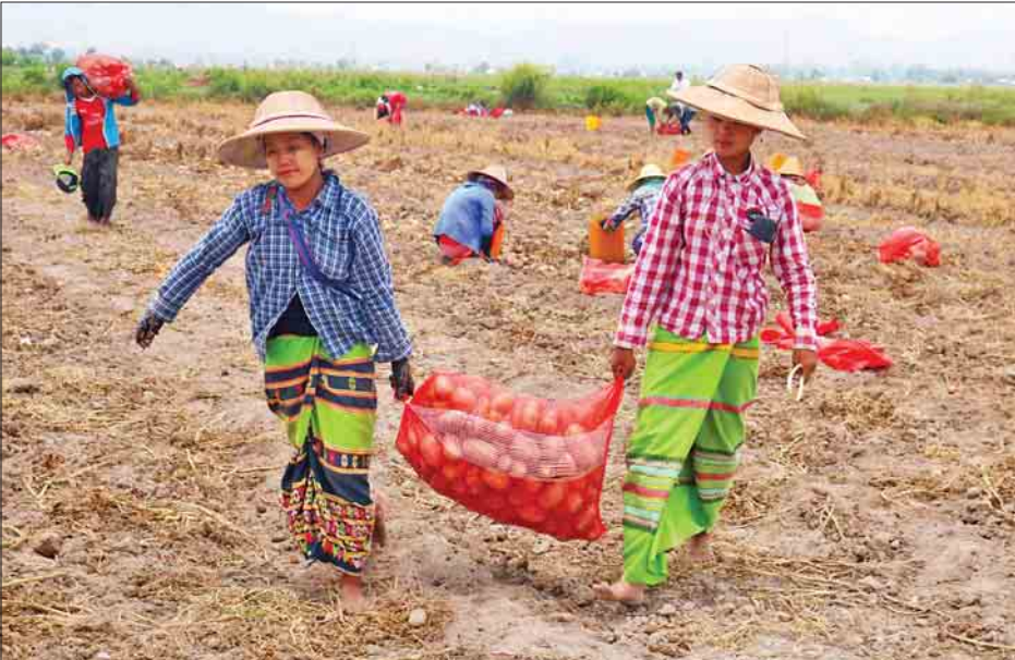
ရှမ်းပြည်နယ်(တောင်ပိုင်း) အလူးစိုက်ခင်းတစ်ခုတွင် လုပ်ငန်းခွင်ဝင်နေကြသော တောင်သူများကို တွေ့ရစဉ်။

မေလလယ်ပိုင်းက တောင်တန်းတွေဝန်းရံထားတဲ့ ရှမ်းပြည်နယ် ဟဲဟိုးမြို့ အပြင်ဘက်လယ်ကွင်းပြင်ကြီးဟာ တောင်သူတွေနဲ့ ပျားပန်းခပ် လှုပ်ရှားသက်ဝင်နေပါတယ်။ တောင်သူတွေဟာ စက်အား၊ လူအားသုံးပြီး ဒီဒေသရဲ့ အဓိကစိုက်ပျိုးရေးထွက်ကုန်ဖြစ်တဲ့အလူးကို တူးဖော်နေကြတာပါ။