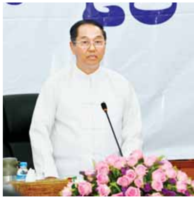
ဒုတိယသမ္မတ ဦးမြင့်ဆွေ (ပုဂ္ဂလိကဏ္ဍ ဖွံ့ဖြိုးတိုးတက်ရေးကော်မတီဥက္ကဋ္ဌ)