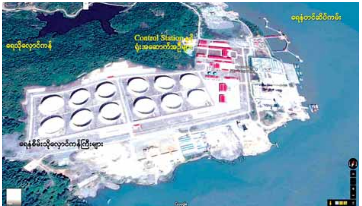
မဒေကျွန်းရေနံဆိပ်ကမ်းနှင့် ရေနံစိမ်းသိုလှောင်ကန်များကို Google Map မှ တွေ့ရစဉ်။

ရေနံစိမ်းဖြတ်သန်းခြင်းအတွက် တစ်နှစ်လျှင် ကန်ဒေါ်လာ ခြောက်သန်းကျော်ရရှိမည် နေပြည်တော် မေ ၂၀ အရှေ့တောင်အာရှ ရေနံပိုက်လိုင်းစီမံကိန်းသည် မေ ၂ ရက်မှစတင်၍ အရှည် ၇၇၁ ကီလိုမီတာနှင့် အချင်း ၃၂ လက်မရှိ ပိုက်လိုင်းဖြင့် မဒေကျွန်း ရေနံဆိပ်ကမ်းမှ တရုတ်ပြည်သူ့သမ္မတနိုင်ငံသို့ မောင်းနှင်ပို့လွှတ်ခဲ့ရာ မေ ၁၉ ရက်တွင် ပြည်ထောင်စုသမ္မတမြန်မာနိုင်ငံတော်နှင့် တရုတ်ပြည်သူ့သမ္မတ နိုင်ငံ နယ်စပ်ရှိ နမ့်ခမ်းတိုင်းတာရေးစခန်းသို့ ရေနံစိမ်းများ ဖြတ်သန်းရောက်ရှိ ကြောင်း သိရသည်။ ယင်းစီမံကိန်းသည် နှစ်စဉ် ရေနံစိမ်းတန်ချိန် ၂၂ သန်းကို တရုတ်ပြည်သူ့ သမ္မတနိုင်ငံသို့ ပို့လွှတ်နိုင်မည်ဖြစ်သည်။ စီမံကိန်းဆောင်ရွက်ခြင်းဖြင့် နိုင်ငံတော်မှ ပိုက်လိုင်းအတွင်း ရေနံစိမ်းဖြတ်သန်းခြင်းအတွက် မက်ထရစ်တန် တစ်တန်လျှင် စာမျက်နှာ ၃ ကော်လံ ၁ သို့ ❖