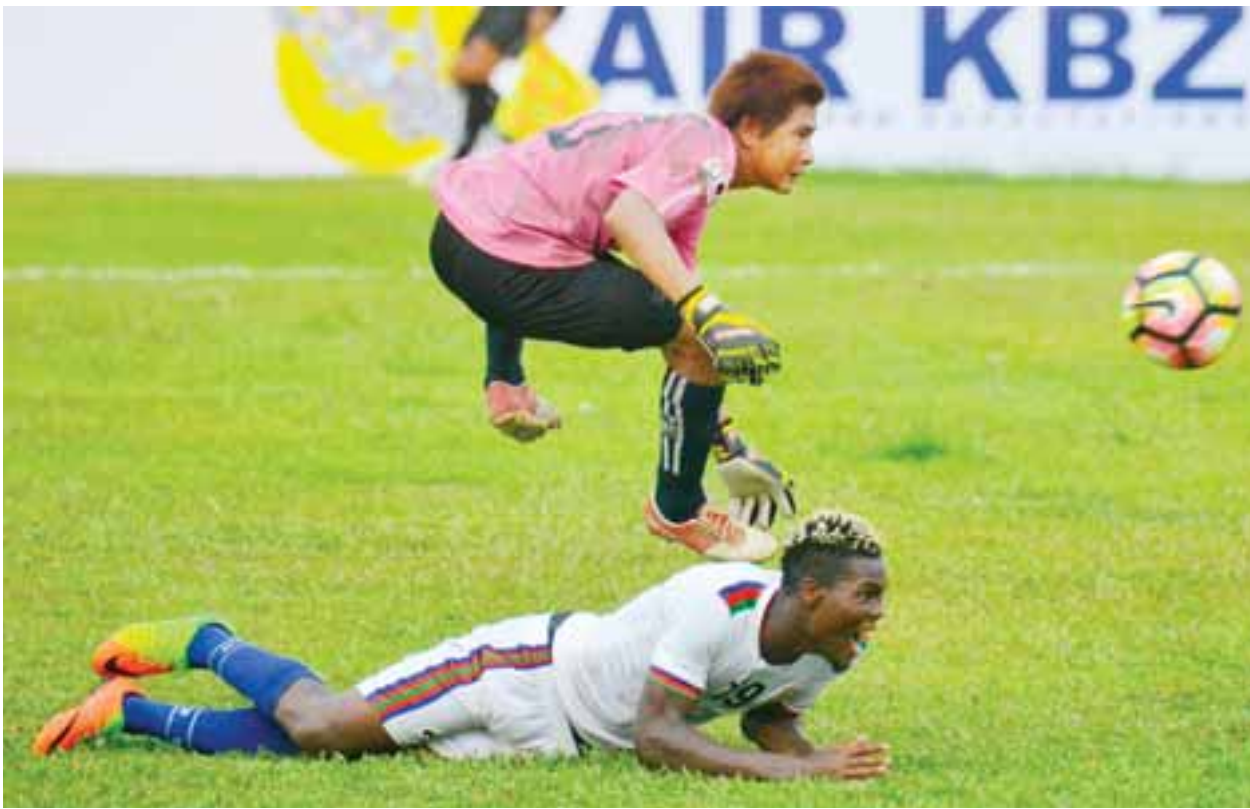
GFA နှင့် တံသာဝတီအသင်း ယှဉ်ပြိုင်နေစဉ်။