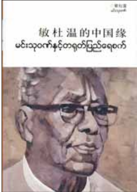
敏杜温的中国缘 မင်းသုဝဏ်နှင့်တရုတ်ပြည်ရေစက်

စုစည်းထားသောစာများတွင် တရုတ်စာဆိုကြီး လူရွှန်း၏ စာပေအာနိသင်ကိုဖော်ညွှန်းသော ဆောင်းပါးစုကို ဦးစွာတွေ့ရသည်။ လူရွှန်းသည် အဖိနှိပ်ခံတရုတ်ပြည်သူတို့နိုးကြားလာအောင် မိမိ၏ အစွမ်းထက်သော