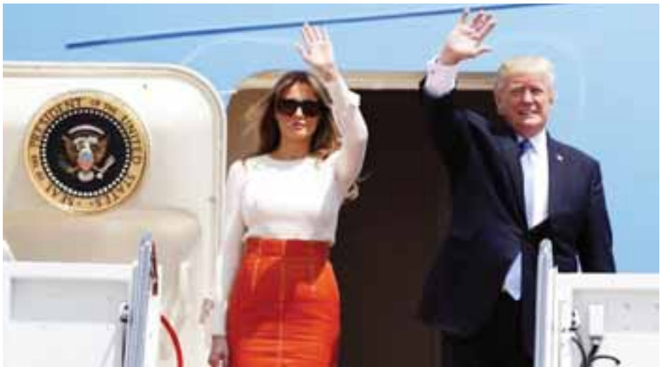
နိုင်ငံခြား စောင့်ကြည့်လေ့လာသူများက စောင့်ကြည့်လျက် ရှိသည်။ အမေရိကန်နိုင်ငံအတွင်းတွင်လည်း သမ္မတ အကျိုးစီးပွားအတွက် များစွာကူညီထောက်ပံ့မှုများ ရရှိ ရှေးကောက်ပွဲနှင့်ပတ်သက်ပြီး ရုရှားနိုင်ငံက ပါဝင် နိုင်လိမ့်မည်ဟု မျှော်လင့်ထားကြောင်း သိရသည်။

သမ္မတထရန်၏ ပထမဆုံးသော နိုင်ငံခြားခရီးစဉ်ကို