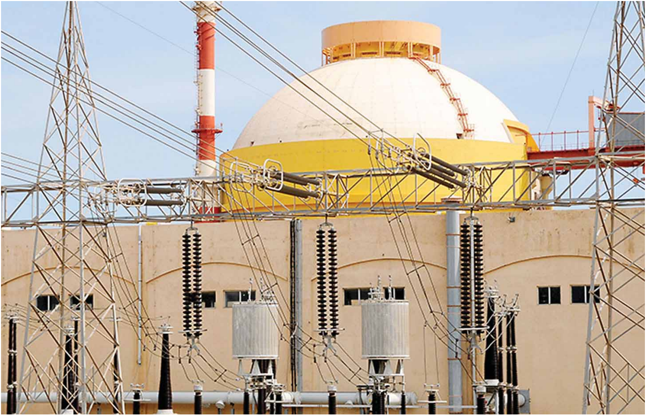
၆၇၈၀ ထုတ်လုပ်နိုင်စွမ်းရှိသည်။ 'ပြည်တွင်းဖြစ်ကို အားပေးပါ'ဟူသော ရည်မှန်းထားသည်။ အစိုးရ၏ မူဝါဒအရ ပြည်တွင်းဖြစ် ဓာတ်ပေါင်းဖိုများကို ထုတ်လုပ်သွားရန်

အသစ်တည်ဆောက်မည့် ဓာတ်ပေါင်းဖိုများကို အိန္ဒိယနိုင်ငံရှိ ရေလေးဓာတ်ပေါင်းဖို ထုတ်လုပ်ရေးကုမ္ပဏီတစ်ခုက ဒီဇိုင်းပုံစံရေးဆွဲပေးမည်ဖြစ်သည်။ အိန္ဒိယနိုင်ငံသည် ကမ္ဘာပေါ်တွင် လျှပ်စစ်ဓာတ်အားသုံးစွဲမှု အများဆုံး နိုင်ငံတစ်နိုင်ငံဖြစ်ပြီး လျှပ်စစ်ဓာတ်အားအများစုကို ကျောက်မီးသွေးမှ ထုတ်ယူသည်။ အိန္ဒိယနိုင်ငံ၌ လောလောဆယ်ကာလတွင် နျူကလီးယားဓာတ်အားပေး စက်ရုံ ၂၂ ရုံ ဖွင့်လှစ်ထားပြီး လျှပ်စစ်ဓာတ်အား မဂ္ဂါဝပ်