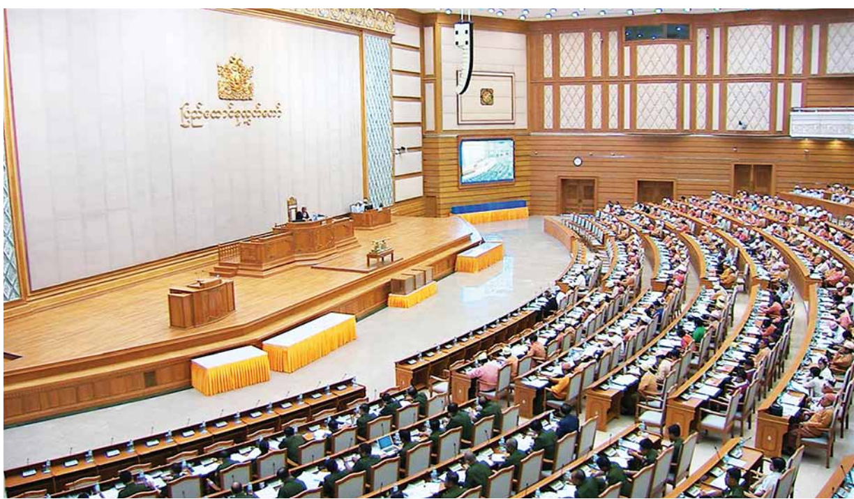
ပြည်ထောင်စုလွှတ်တော် ပဉ္စမပုံမှန်အစည်းအဝေး ကျင်းပစဉ်။

ပြည်သူများအကြား ဒီမိုကရေစီအလေ့အကျင့်များ ခိုင်မာအားကောင်းစေရန် လွှတ်တော်ကိုယ်စားလှယ်များက ပူးပေါင်းကူညီ