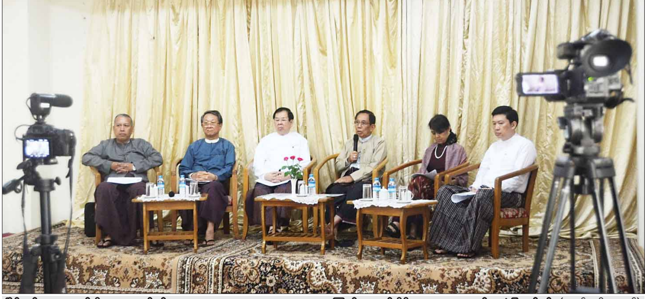
ငြိမ်းချမ်းရေးအတွက် စီးပွားရေးလုပ်ငန်းများ(Business for Peace-B4P)အကြောင်း သတင်းမီဒီယာများအား အသိပေးပွဲပြုလုပ်စဉ်။