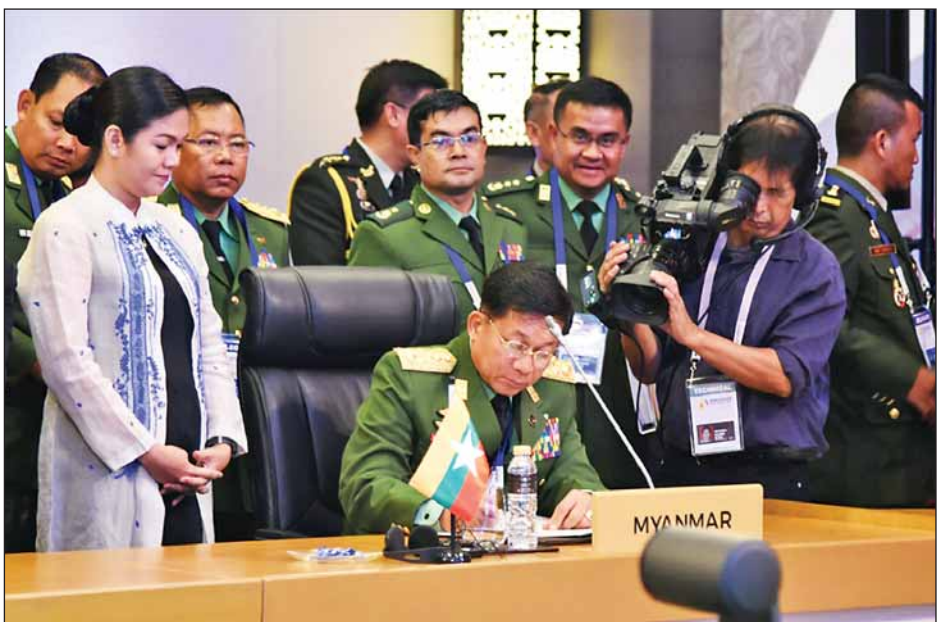
ကာကွယ်ရေးဦးစီးချုပ် Gen. Tan Sri Raja Mohamad Affandi bin နှင့် လည်းကောင်း၊ ဗီယက်နမ်ပြည်သူ့ တပ်မတော်၊ ကာကွယ်ရေးဒုတိယဝန်ကြီးနှင့် စစ်ဦးစီး အရာရှိချုပ် Lt. Gen. Phan Van Giang ဦးဆောင်သည့် ကိုယ်စားလှယ်အဖွဲ့နှင့်လည်းကောင်း၊ ကမ္ဘောဒီးယားဘုရင့် တပ်မတော်ကာကွယ်ရေးဦးစီးချုပ် Gen. Eth Sarath ဦးဆောင်သည့် ကိုယ်စားလှယ်အဖွဲ့နှင့်လည်းကောင်း သီးခြားစီတွေ့ဆုံ၍ နှစ်နိုင်ငံတပ်မတော်နှစ်ရပ်အကြား ချစ်ကြည်ရေးခရီး အပြန်အလှန်လည်ပတ်ရေး၊ သင်တန်း သားများ အပြန်အလှန်စေလွှတ်ရေး၊ လုံခြုံရေးပူးပေါင်း ဆောင်ရွက်မှုနှင့် အကြမ်းပက်မှုတိုက်ဖျက်ရေးဆိုင်ရာ ကိစ္စရပ်များကို ဆွေးနွေးခဲ့ကြသည်။ (သတင်းစဉ်)

သက်ဆိုင်ရာခေါင်းစဉ်များကို နိုင်ငံအကွာစဉ်အလိုက် ဆွေးနွေးကြသည်။ ထိုသို့ ဆွေးနွေးရာတွင် တပ်မတော်ကာကွယ်ရေး ဦးစီးချုပ်က အရှေ့တောင်အာရှဒေသအတွင်း ရေကြောင်း လုံခြုံရေးဆိုင်ရာကိစ္စရပ်များနှင့် ပူးပေါင်းဆောင်ရွက်နိုင်မှု နည်းလမ်းများနှင့်ပတ်သက်၍ ဆွေးနွေးသည်။ ယင်းနောက် အာဆီယံတပ်မတော်များ၏ ၂၀၁၇-၂၀၁၈ နှစ်နှစ်လုပ်ငန်းစီမံချက်ကို ဆွေးနွေးကြပြီး (၁၄) ကြိမ်မြောက် အာဆီယံတပ်မတော်ကာကွယ်ရေး ဦးစီးချုပ်များ အလွတ်သဘောအစည်းအဝေး (14 th ACDFIM) ပူးတွဲကြေညာချက်ကို လက်မှတ်ရေးထိုးကြ သည်။ ထို့နောက် ဖိလစ်ပိုင်တပ်မတော်ကာကွယ်ရေး ဦးစီးချုပ်က နိဂုံးချုပ်စကားပြောကြားပြီး (၁၅)ကြိမ်မြောက် အာဆီယံတပ်မတော်ကာကွယ်ရေးဦးစီးချုပ်များ အလွတ် သဘောအစည်းအဝေး (15 th ACDFIM)ကို အိမ်ရှင် အဖြစ် လက်ခံကျင်းပမည့် စင်ကာပူနိုင်ငံ တပ်မတော် ကာကွယ်ရေးဦးစီးချုပ် Lt. Gen. Perry Lim ထံသို့ တာဝန်လွှဲပြောင်းပေးအပ်သည်။ ယင်းနောက် စင်ကာပူနိုင်ငံတပ်မတော်ကာကွယ်ရေး ဦးစီးချုပ် Lt. Gen. Perry Lim က နှုတ်ခွန်းဆက်စကား ပြောကြားသည်။ တပ်မတော်ကာကွယ်ရေးဦးစီးချုပ် ဗိုလ်ချုပ်မှူးကြီး မင်းအောင်လှိုင်သည် ညနေပိုင်းတွင် မလေးရှားတပ်မတော်