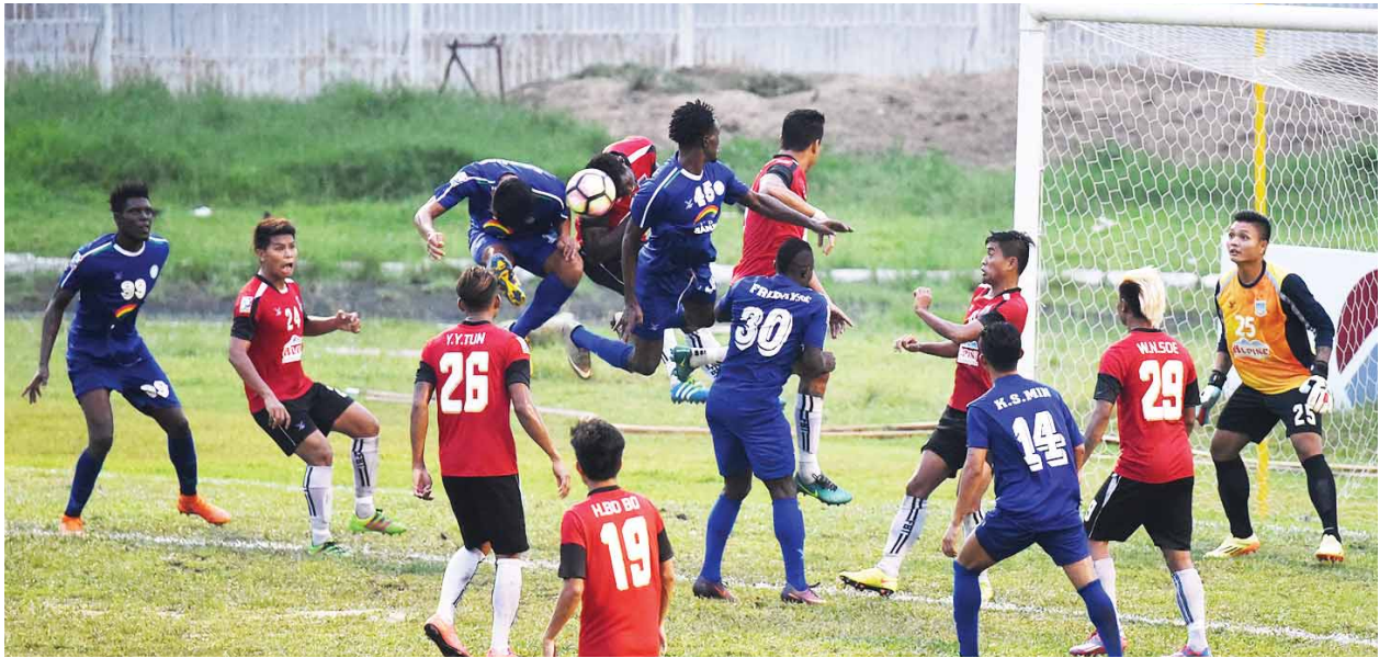
မဟာယူနိုက်တက်နှင့်ရတနာပုံအသင်း ယှဉ်ပြိုင်နေစဉ်။

“ထိဆုမဲတွေကို ပီရမစ်ပုံစံမျိုးနဲ့ အပေါ်က ဆုကြီးကနေ အောက်မှာ ဆုမဲတွေ ၆၀၀ဆာဆာပဒေသာမြှင့်ပေးအပ်ဖို့ ရည်ရွယ်ထားပါတယ်။ အကွရာ အလုံးရေတိုးတာနဲ့အမျှ ထိဆုမဲတွေကိုလည်း တိုးမြှင့်ပေးအပ်မယ်။ နောက် လာမယ့် (၄)ကြိမ်မြောက် စာမျက်နှာ ၁၁ ကော်လံ ၅ သို့ *