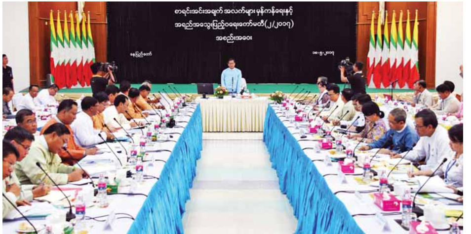
စာရင်းအင်းအချက်အလက်များ မှန်ကန်ရေးနှင့် အရည်အသွေးပြည့်ဝရေးကော်မတီအစည်းအဝေး၌ ကော်မတီနာယက ဒုတိယသမ္မတ ဦးဟင်နရီဗန်ထီးယူ အမှာစကားပြောကြားစဉ်။