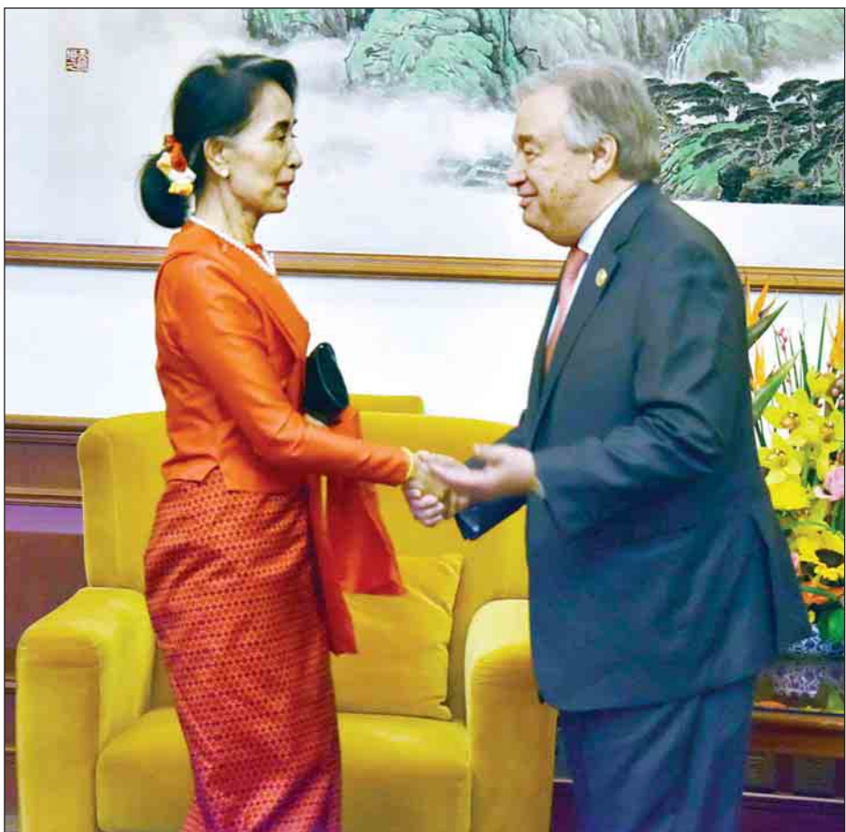
နိုင်ငံတော်၏အတိုင်ပင်ခံပုဂ္ဂိုလ် ဒေါ်အောင်ဆန်းစုကြည် ကုလသမဂ္ဂအတွင်းရေးမှူးချုပ် မစ္စတာ အန်တိုနီရီ ဂူတာရက်စ်အား တွေ့ဆုံနှုတ်ဆက်စဉ်။ (သတင်းစဉ်)

အောင်ဆန်းစုကြည် ဥက္ကဋ္ဌ အမျိုးသားပြန်လည်သင့်မြတ်ရေးနှင့် ငြိမ်းချမ်းရေးဗဟိုဌာန