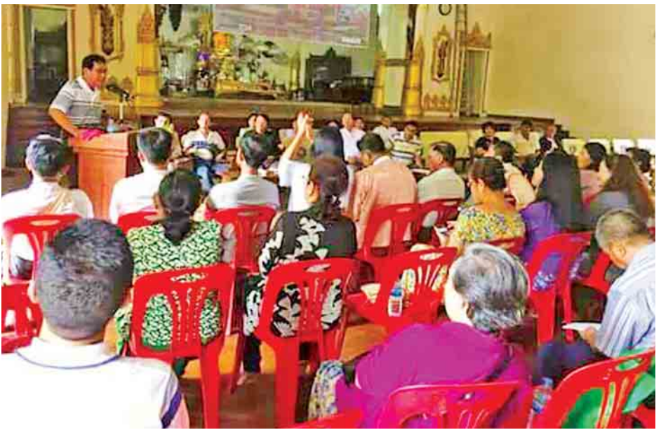
ကျောင်းသား ကျောင်းသူဟောင်းတွေ ကလေးတွေ ဒီဇင်ဘာလ နောက်ဆုံးပတ်ထဲမှာ ကျင်းပဖို့ လျာထား ကျောင်းပိတ်ရက်ဖြစ်မယ့်၊ နိုင်ငံခြားရောက် ကျောင်းသား သတ်မှတ်ထားပါတယ်” ဟု ပြောသည်။