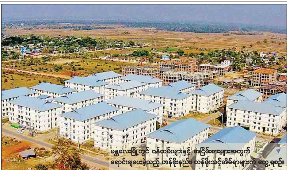
မန္တလေးမြို့တွင် ဝန်ထမ်းများနှင့် အငြိမ်းစားများအတွက် ရောင်းချပေးခဲ့သည့် တန်ဖိုးနည်း၊ တန်ဖိုးသင့်အိမ်ရာများကို တွေ့ရစဉ်။

နေပြည်တော် မေ ၁၅ နိုင်ငံတော်ဖွဲ့စည်းပုံအခြေခံဥပဒေဆိုင်ရာခုံရုံးဥက္ကဋ္ဌ ဦးမျိုးညွန့်နှင့်အဖွဲ့သည် ရုရှားသမ္မတနိုင်ငံ စိန့်ပီတာဘတ်မြို့၌ မေ ၁၅ ရက်မှ ၁၉ ရက်ထိ ကျင်းပမည့် ဖွဲ့စည်းပုံအခြေခံဥပဒေ၏တရားမျှတမှု၊ တရားစီရင်မှုဆိုင်ရာ မူသဘောနှင့် လက်တွေ့ကျင့်သုံးဆောင်ရွက်မှု အပြည့်ပြည့်ဆိုင်ရာညီလာခံသို့ တက်ရောက်ရန်အတွက် ယနေ့ နံနက် ၁ နာရီ မိနစ် ၅၀ တွင် လေကြောင်းခရီးဖြင့် ထွက်ခွာရာ နိုင်ငံတော်ဖွဲ့စည်းပုံအခြေခံဥပဒေဆိုင်ရာခုံရုံးမှ တာဝန်ရှိသူများက ရန်ကုန်အပြည်ပြည်ဆိုင်ရာလေဆိပ်သို့ လိုက်ပါပို့ဆောင်ကြသည်။ နိုင်ငံတော်ဖွဲ့စည်းပုံအခြေခံဥပဒေဆိုင်ရာခုံရုံးဥက္ကဋ္ဌ ဦးမျိုးညွန့်နှင့်အဖွဲ့ အဖွဲ့ဝင်အဖြစ် ခုံရုံးအဖွဲ့ဝင် ဦးမြင့်ဝင်းလိုက်ပါသွားကြောင်း သတင်းရရှိသည်။ (သတင်းစဉ်)