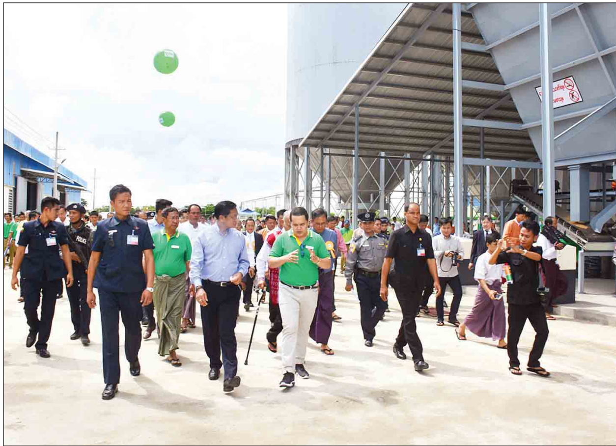
MAPCO Golden Lace ခေတ်မီဆန်စက်နှင့် စပါးခွံမှ လျှပ်စစ်ဓာတ်အားထုတ်လုပ်ရေးစက်ရုံအတွင်း ဒုတိယသမ္မတ ဦးဟင်နရီဗန်ထီးယူ လှည့်လည်ကြည့်ရှုစဉ်။ (သတင်းစဉ်)