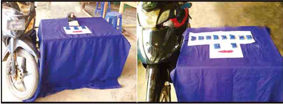
ဘိန်းဖြူဟု ယူဆရသည့် အဖြူရောင်အမှုန့် (12) ဂရမ်၊ 88 နှင့် 1 စာတန်းတစ်ဖက်စီပါ ပန်းရောင်စိတ်ကြွေးသွပ်ဆေးပြားများနှင့် သယ်ဆောင်သည့် မော်တော်ဆိုင်ကယ်များအား တွေ့ရစဉ်။

နေပြည်တော် မေ ၁၅ တရားမဝင်ကုန်စည်များ တားဆီး ထိန်းချုပ်ရေးအတွက် ရေပူနှင့် မရမ်းချောင့် အမြဲတမ်းစစ်ဆေးရေးစခန်းတို့ကို ဌာနဆိုင်ရာ ပူးပေါင်းအဖွဲ့များဖြင့် မတ် ၁ ရက်တွင် စတင်ဖွင့်လှစ် ဆောင်ရွက်ခဲ့ပြီး မေ ၁၄ ရက်တွင် မန္တလေး-မူဆယ် ပြည်ထောင်စု လမ်းမကြီးတစ်လျှောက် ကုန်သွယ်မှု ယာဉ် ပို့ကုန် ၆၆၉ စီး၊ သွင်းကုန် ၄၇၅ စီး၊ ရန်ကုန်-မြဝတီလမ်းမကြီး တစ်လျှောက် ကုန်သွယ်မှုယာဉ် ပို့ကုန် ၅၆ စီး၊ သွင်းကုန် ၁၈၅ စီး ကုန်စည်များ သယ်ယူပို့ဆောင်လျက်ရှိသည်။ အဆိုပါ စစ်ဆေးရေးစခန်းများက တင်သွင်း၊ တင်ပို့သော ကုန်ပစ္စည်းများအား စစ်ဆေးမှုပြုလုပ်ဆောင်ရွက် လျက်ရှိရာ မေ ၁၄ ရက်တွင် ရေပူ အမြဲတမ်း စစ်ဆေးရေးစခန်းက တားဆီးမှုခြောက်မှု (ခန့်မှန်းတန်ဖိုး