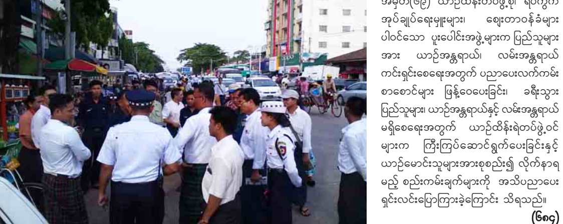
စေရေး၊ လမ်းသွားလမ်းလာ ပြည်သူများ အနှောင့်အယှက်မဖြစ်စေရေးအတွက် လမ်းသား ပေါ်တွင် လည်းကောင်း၊ လူသွားစင်ကြို ပလက်ဖောင်းများပေါ်တွင် လည်းကောင်း ဈေးရောင်းချခြင်းမပြုရန် ယာဉ်ကြော ရှင်းလင်းရေးနှင့် စည်းကမ်းထိန်းသိမ်းရေး ကော်မတီတွင် အင်းစိန်မြို့နယ် လွှတ်တော် ကိုယ်စားလှယ်၊ မြို့နယ်အထွေထွေအုပ်ချုပ် ရေးဦးစီးဌာန၊ မြို့နယ်ရဲတပ်ဖွဲ့မှူး၊ မြို့နယ် အမှတ်(၆၉) ယာဉ်ထိန်းတပ်ဖွဲ့မှူး၊ ရပ်ကွက် အုပ်ချုပ်ရေးမှူးများ၊ ဈေးတာဝန်ခံများ ပါဝင်သော ပူးပေါင်းအဖွဲ့များက ပြည်သူများ အား ယာဉ်အန္တရာယ်၊ လမ်းအန္တရာယ် ကင်းရှင်းစေရေးအတွက် ပညာပေးလက်ကမ်း စာစောင်များ ဖြန့်ဝေပေးခြင်း၊ ခရီးသွား ပြည်သူများ ယာဉ်အန္တရာယ်နှင့် လမ်းအန္တရာယ် မရှိစေရေးအတွက် ယာဉ်ထိန်းရဲတပ်ဖွဲ့ဝင် များက ကြီးကြပ်ဆောင်ရွက်ပေးခြင်းနှင့် ယာဉ်မောင်းသူများအားစုစည်း၍ လိုက်နာရ မည့် စည်းကမ်းချက်များကို အသိပညာပေး ရှင်းလင်းပြောကြားခဲ့ကြောင်း သိရသည်။ (ဇော်)

ကာလဖြစ်သည့် မေ ၈ ရက်မှ ၁၄ ရက်အထိ သတ်မှတ်ထားပြီး ပညာပေးကာလကျော်လွန် သော မေ ၁၅ ရက်မှ စတင်၍ အရေးယူ မှုများ ဆောင်ရွက်သွားမည်ဖြစ်ကြောင်း ၎င်း ကော်မတီထံမှ သိရသည်။ အင်းစိန်မြို့မဈေးကြီးရှေ့ လှိုင်မြစ်လမ်း သည် အများပြည်သူဆိုင်ရာလမ်းဖြစ်သော ကြောင့် ဈေးရောင်းချခွင့်မရှိသော နေရာ ဖြစ်ပြီး လှိုင်မြစ်လမ်းအတွင်း ယာဉ်ကြော ပိတ်ဆို့မှုမရှိစေရေး၊ ယာဉ်အန္တရာယ်မဖြစ်