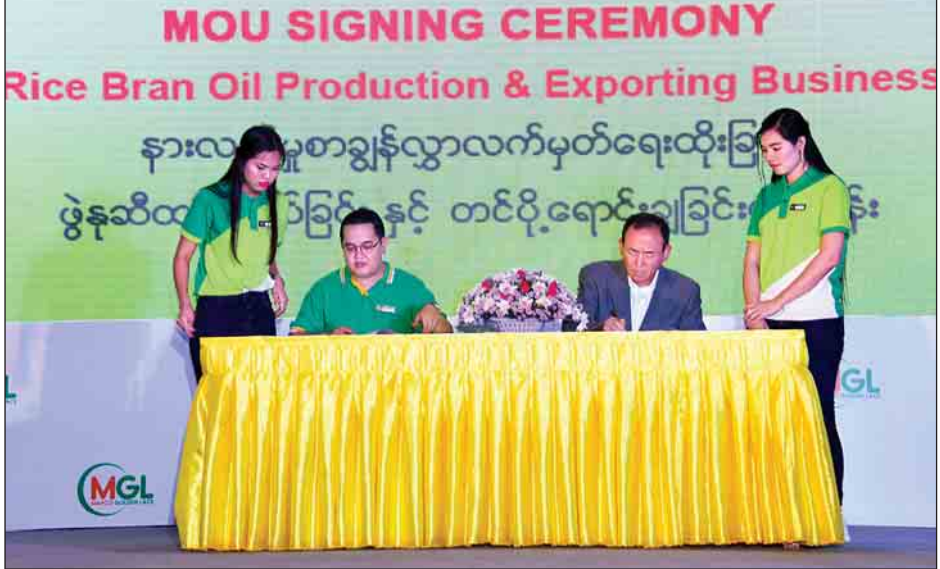
ဖွဲ့စည်းစက်ထုတ်လုပ်ခြင်းနှင့် တင်ပို့ရေးဆောင်ရွက်ခြင်းအတွက် အကျိုးတူပူးပေါင်းရန် လက်မှတ်ရေးထိုးကြစဉ်။ (သတင်းစဉ်)

◆ ကျေးဇူးမှ ဒါကြောင့် ကျွန်တော်တို့လည်း အင်မတန်အရေးကြီးတဲ့ စီမံကိန်းဖြစ်တဲ့အတွက် ကြိုးစားဆောင်ရွက်နေပါတယ်” ဟု ၎င်းက ရှင်းလင်းပြောကြားသည်။