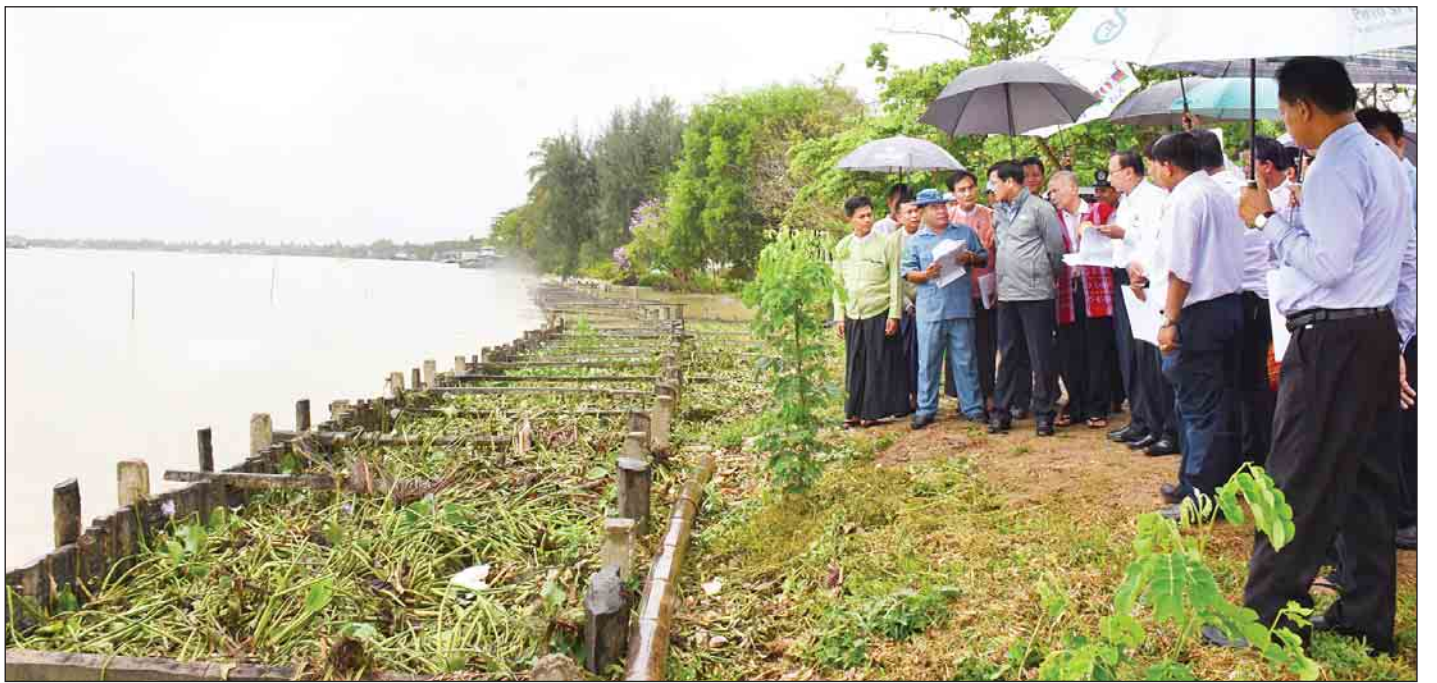
ဒုတိယသမ္မတ ဦးဟင်နရီပန်ထီးယူ ဖျာပုံမြို့ အေးမြသာယာပန်းဥယျာဉ်နေရာမှ ရေတိုက်စားမှုအခြေအနေကို ကြည့်ရှုစစ်ဆေးစဉ်။ (သတင်းစဉ်)

လယ်ယာကဏ္ဍကို မှီတည်လုပ်ကိုင်နေကြသည့် တောင်သူလယ်သမားများ၊ လယ်ယာထွက်ကုန်နှင့် ဆက်စပ်သည့် ကုန်သည်ပွဲစားလုပ်ငန်းရှင်များ၊ လယ်ယာကဏ္ဍဖွံ့ဖြိုးရေးကြိုးပမ်းနေသည့် ပုဂ္ဂလိကအသင်းအဖွဲ့များအားလုံးအနေဖြင့် ဈေးကွက်ဝင်အရည်အသွေးမြင့်လယ်ယာထွက်ကုန်များ ပိုမိုထွက်ရှိအောင်၊ ပြည်ပပို့ကုန်