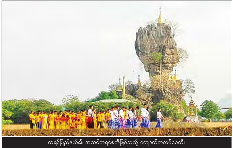
ကရင်ပြည်နယ်၏ အထင်ကရစေတီဖြစ်သည့် ကျောက်ကလပ်စေတီ။

ကျောက်ပြားကြီးတစ်ချပ်ပေါ်တွင် ဆင်မင်း၏ အခွေများပုံ သဏ္ဍာန်၊ စပါးစေ့နှင့်တူလှသော ဂဝံကျောက်များတွေ့ရပြီး စပါးကျီတောင်ဟုခေါ်သည်။ ဘုရားဖူးများက ဆန်စပါးပေါများရန်နှင့် လာဘ်လာဘတိုးရန်အတွက် အဆောင်အဖြစ်ယူဆောင်သွားကြသည်။