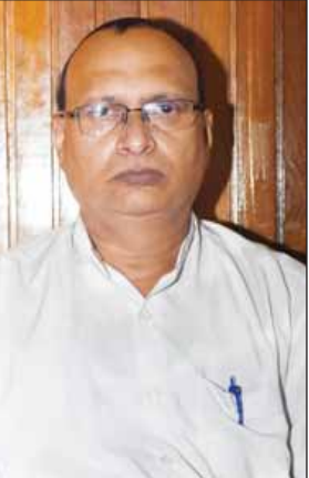
ဒေါက်တာသာဉာဏ်