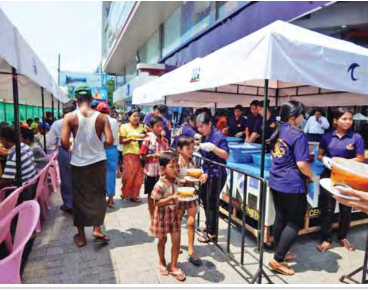
တောင်ဝင်မိသားစုကုမ္ပဏီမှ မေ ၁၀ ရက် နံနက်ပိုင်းတွင် တောင်ဝင်စင်တာ၌ ကြာဆံချက် နှင့် အအေးကုသိုလ်ယူ ကျွေးမွေးလှူဒါန်းစဉ်။