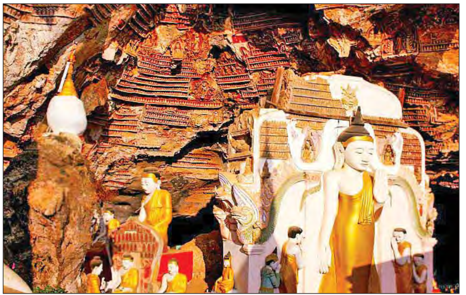
ကျော့ဂွန်းဂူအတွင်း ဘုရားရုပ်ပွားတော်များနှင့် ယဉ်ကျေးမှုအနုလက်ရာများ။

ဂူအတွင်းပိုင်းသို့ တဖြည်းဖြည်းဝင်ရောက်သွားသည့် နှင့် စိတ်ဝင်စားဖွယ် ဘုရားလောင်းဆန္ဒနီဆင်မင်း ဘဝကဖြစ်စဉ်အဆင့်ဆင့်ကို သဘာဝအတိုင်း အံ့ဩဖွယ်ရာများကို တွေ့နိုင်သည်။ ရောဂါပျောက်ကင်းစေသော ကျောက်သွေးကန်၊ လိုဏ်ဂူအမိုးမျက်နှာကြက်တို့တွင် အရောင်အဆင်းမျိုးစုံရှိသော ကျောက်စက်ပန်းဆွဲများနှင့် ကျောက်စက်မိုးမျှော်များ၊ စွယ်တော်ဖြတ်သော လှူကြီးနှင့်တူသည့် ကျောက်လှူကြီး၊ မုဆိုးလွန်နှင့်ဖောက်သည့် မိုးတည်ပေါက်ခေါ်သော ဂူအတွင်းပိုင်းသို့ အလင်းရောင်နှင့်လေကောင်းလေသန့်ကောင်းစွာရရှိသည့် ပထမမြားပေါက်၊ ဆန္ဒနီဆင်မင်း၏ သမီးတော်စံမြန်းရာ ဂူနေရာသဏ္ဍာန်၊