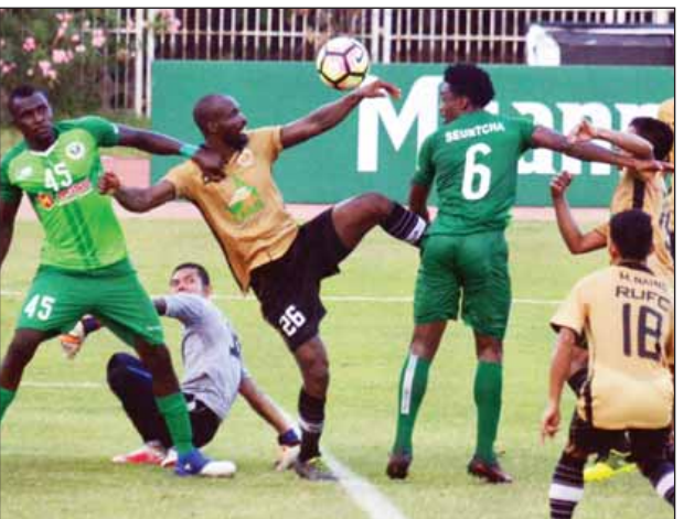
ရခိုင်အသင်းနှင့် ချင်းယူနိုက်တက်အသင်းတို့ ယှဉ်ပြိုင်နေစဉ်။

၂၀၁၇ ရာသီ ဝိုလ်ချုပ်အောင်ဆန်းခိုင်း ရွှေ/ထွက်ပြိုင်ပွဲ ဒုတိယအဆင့် (ဒုတိယနေ့)ကို ယနေ့ ညနေပိုင်းက စာမျက်နှာ ၁၁ ကော်လံ ၁ သို့