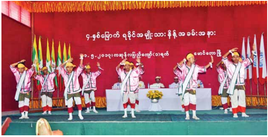
မောင်တောမြို့ သီရိမင်္ဂလာခန်းမ၌ (၄)နှစ်မြောက် ရခိုင်အမျိုးသားနေ့ ကျင်းပစဉ်။