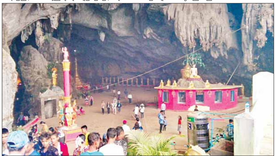
ကရင်ပြည်နယ်၏ အရှည်ဆုံးလိုဏ်ဂူဖြစ်သည့် ဆန္ဒနီဂူပေါက်ဝမြင်ကွင်း။

တူသော ကျောက်များ၊ ကွမ်းဆေးလက်ဖက်ထည့်သည့် ကျောက်ခွက်၊ ကျောက်ပျဉ်နှင့် ကျောက်စိမ့်ရေပေါက်များ၊ ထိုမှတစ်ဆင့်ဆက်သွားလျှင် အလင်းရောင်ကောင်းစွာရရှိသော မုဆိုး၏ ဒုတိယမြားပေါက်နေရာနှင့် အမြင့်ပေ ၃၀၊ အချင်းပေ ၅၀ ခန့်ရှိ ကျောက်စက်မိုးမျှော်တိုင်ကြီးကို ဆင်တိုင်ဟု ခေါ်ဝေါ်ကြသည်။ အဆိုပါဆင်တိုင်၏ထိပ်တွင် ဉာဏ်တော်သုံးတောင်ရှိ စေတီတည်ထားပြီး ဆုတောင်းပြည့်စေတီဟု ခေါ်ဝေါ်ကြသည်။ ဆက်၍ ကိုက် ၅၀ ခန့်ဆက်သွားလျှင် ထွက်ပေါက်ဂူရောက်ရှိပြီး မြေပြင်သို့ရောက်ရန်အတွက် အမြင့်ပေ ၁၀၀ ခန့် ဆင်းရပေသည်။ မြေပြင်တွင်လွမ်းစေတီနှင့် ဇရပ်တစ်ဆောင်တည်ထားပြီး အလောင်းတော်နှင့် အခြွေအရံများ ရေချိုးရေကစားသည်ဟုဆိုသည့် ကြီးမားသောဆန္ဒနီရေအိုင်ကြီးတစ်အိုင်ကို တွေ့နိုင်သည်။ ရေအိုင်ကြီး၏ မြောက်ဘက်တွင် ရေအိုင်နှင့် ထိစပ်နေသော အမြင့်ပေ ၂၀၀ ခန့်ရှိတောင်စွယ်ကြီးတစ်တောင်ရှိသည်။ ထိုတောင်အောက်တွင် အရှည် ပေ ၁၀၀ ခန့်၊ ဂူအမိုးအမြင့် ငါးပေခန့်ရှိတစ်ဖက်ဂူပေါက်ဝသို့ ရေဖြတ်ကျော်သွားသော ဂူပေါက်ကြီးရှိသဖြင့် တောင်အောက်လိုဏ်ခေါင်း ရေကျော်ဂူပေါက်ကြီးတစ်လျှောက် အငှားပို့သော လှေများဖြင့် ထူးဆန်းအံ့ဩပြီး ရင်ထိတ်စွာ သွားလာရသဖြင့် လာရောက်လည်ပတ်သော ဧည့်သည်များအတွက် စိတ်ဝင်စားဖွယ်ကောင်းလှသည်။