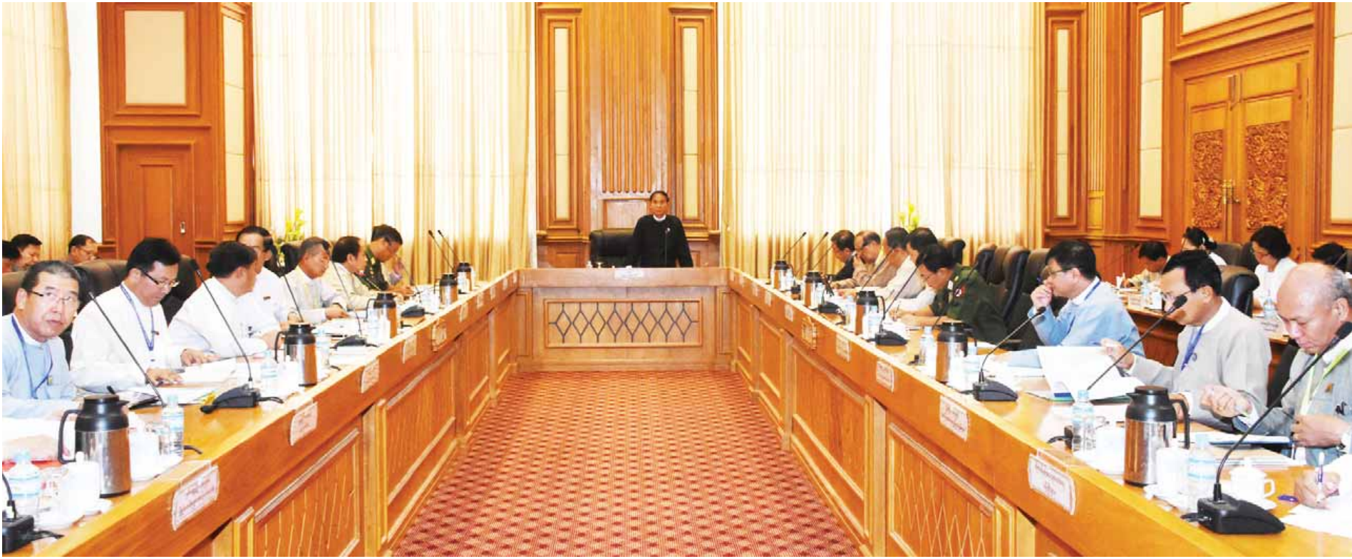
နေပြည်တော် မေ ၁၁

ဒုတိယအကြိမ် လွှတ်တော်အသီးသီး၏ ပဉ္စမပုံမှန်အစည်းအဝေးများ အောင်မြင်စွာကျင်းပနိုင်ရေးအတွက် ဗဟိုကော်မတီနှင့် လုပ်ငန်းကော်မတီများ၏ လုပ်ငန်းညှိနှိုင်းအစည်းအဝေးကို ယနေ့နံနက် ၁၀ နာရီတွင် နေပြည်တော်ရှိလွှတ်တော်အဆောက်အအုံ ဇေယျသီရိဆောင်အစည်းအဝေးခန်းမ၌ ကျင်းပသည်။