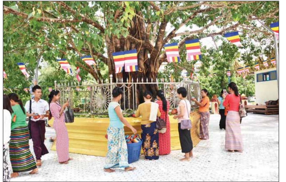
သီရိမင်္ဂလာကမ္ဘာအေးစေတီတော် မဟာဗောဓိကဆုန်ညောင်ရေသွန်းလောင်းပူဇော်ပွဲတွင် ဘုရားဖူးလာပြည်သူများ မဟာဗောဓိညောင်ပင်၌ ညောင်ရေသွန်းလောင်းပူဇော်ကြစဉ်။

ဆံတော်ရှင် ဆူးလေစေတီတော်၏ ကဆုန်ညောင်ရေသွန်းလောင်းပူဇော်ပွဲကို နံနက်အရုဏ်တက်ချိန်မှစ၍ ကျင်းပရာ ဆရာတော်၊ သံယာတော်များအား အရုဏ်ဆွမ်းဆက်ကပ်ခြင်း၊ ဆရာတော်၊ သံယာတော်များထံမှ ကိုးပါး