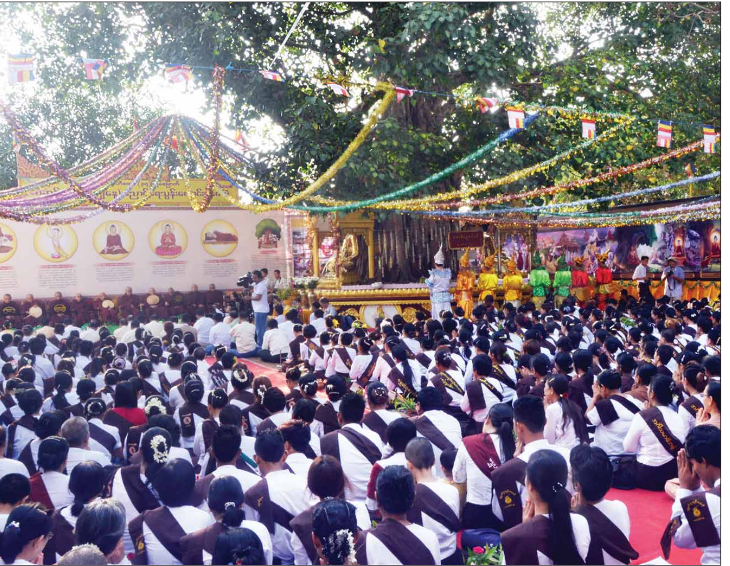
စာမျက်နှာ ၅ ကော်လံ ၁ သို့ ❁ ရွှေတိဂုံစေတီတော်မြတ်ကြီး၏ (၃၄) ကြိမ်မြောက် ကဆုန်လပြည့် (ပုဒွနေ့) ညောင်ရေသွန်းပွဲတော်ကို ရင်ပြင်တော်ပေါ်၌ စည်ကားစွာ ကျင်းပစဉ်။

မြန်မာ့ရိုးရာ ဆယ့်နှစ်လရာသီ ပွဲတော်များတွင် ကဆုန်လ ညောင်ရေသွန်းပွဲကို ရိုးရာပွဲတော်အဖြစ် သတ်မှတ်ခဲ့ကြသည်။ အထက်ပါအကြောင်းအရာများကို နှလုံးသွင်း၍ ပုဒွဘာသာဝင် သူတော်စင်များအနေဖြင့် နှစ်စဉ် ကဆုန်လပြည့်နေ့ရောက်တိုင်း ပုဒွရုပ်ပွား ဥဒ္ဒိဿစေတီတော်များကို ဗုဒ္ဓါဘိသေကအနေကဇာတင် မင်္ဂလာသဘင်များ