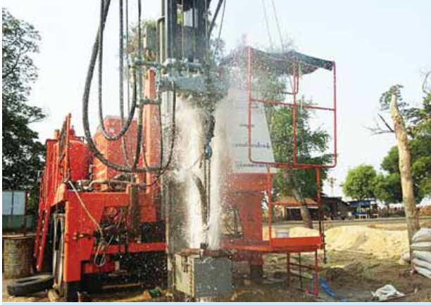
မကွေးတိုင်းဒေသကြီး မကွေးမြို့နယ်တွင် ဒုတိယမြောက်တွင်းအဖြစ် အစစမ်းကျေးရွာ၌ အင်္ဂလန်နိုင်ငံထုတ် DANDO အမျိုးအစား ရေတွင်းတူးစက်ကြီးဖြင့် ၁၅၄ တွင်းမြောက် စက်ရေတွင်း ရေအောင်စဉ်။

မကွေး မေ ၁၀ ကမ္ဘာ့အာနာဂတ်အလင်းတန်းမြန်မာဖောင်ဒေးရှင်းသည် မြန်မာပြည်အနှံ့ သောက်သုံးရေရှားပါးသောဒေသများတွင် စက်ရေတွင်းများကို တူးဖော်လှူဒါန်းပေးလျက်ရှိရာ ယခုအခါ မြန်မာပြည်အလယ်ပိုင်း ဖန်ခါးမြေ ဟုခေါ်တွင်သည့် မြေလတ်ဒေသဖြစ်သော မကွေးတိုင်းဒေသကြီး မကွေးမြို့နယ်တွင် ဒုတိယမြောက်တွင်းအဖြစ် အစစမ်းကျေးရွာ၌ အင်္ဂလန်နိုင်ငံထုတ် DANDO အမျိုးအစား ရေတွင်းတူးစက်ကြီးဖြင့် ၁၅၄ တွင်းမြောက် စက်ရေတွင်းကို အနက်ပေ ၅၂၀ အရောက်တွင် တစ်နာရီရေဂါလန် ၃၆၀၀ ဖြင့် ရေအောင်ခဲ့ပြီဖြစ်သည်။