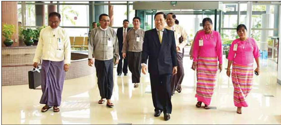
သာသနာတော် ထွန်းကားပြန့်ပွားရေး ယဉ်ကျေးမှုဝန်ကြီးဌာန ကျွမ်းကျင် ဦးသောင်းဝင်းတို့ လိုက်ပါသွားကြ ပြည်ထောင်စုဝန်ကြီးနှင့် အဖွဲ့ဝင်များ ဦးစီးဌာန ဒုတိယညွှန်ကြားရေးမှူးချုပ် ဦးဘတိန်၊ သာသနာရေးနှင့် ဝန်ကြီးရုံး ညွှန်ကြားရေးမှူး (သတင်းစဉ်)

သာသနာရေးနှင့် ယဉ်ကျေးမှုဝန်ကြီးဌာန ပြည်ထောင်စုဝန်ကြီး သူရဦးအောင်ကိုနှင့်အဖွဲ့သည် သိရိလင်ကာနိုင်ငံ ကိုလိုဘိုမြို့နှင့် ကနီမြို့တို့သို့ ကျင်းပမည့် အပြည်ပြည်ဆိုင်ရာ ဗဟိုအဖွဲ့အစည်းအဖွဲ့အစည်း တက်ရောက်ရန် ယနေ့ ညနေပိုင်းတွင် လေကြောင်းခရီးဖြင့် ထွက်ခွာရာ မြန်မာနိုင်ငံဆိုင်ရာ သိရိလင်ကာနိုင်ငံ သံအမတ်ကြီးနှင့် သာသနာရေးနှင့် ယဉ်ကျေးမှုဝန်ကြီးဌာနမှ တာဝန်ရှိပုဂ္ဂိုလ်များက ရန်ကုန်အပြည်ပြည်ဆိုင်ရာလေဆိပ်သို့ ပို့ဆောင်ပေးခဲ့ကြပါသည်။