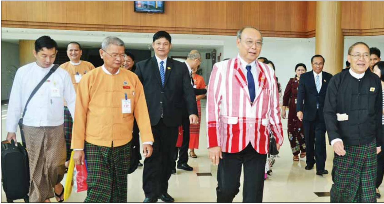
ဗီယက်နမ်နိုင်ငံ ဟိုချီမင်းမြို့သို့ ဆွေးနွေးပွဲတက်ရောက်ရန်နှင့် ချစ်ကြည်ရေးခရီးသွားရောက်ရန် ထွက်ခွာသွားသည့် အမျိုးသားလွှတ်တော်ဥက္ကဋ္ဌ မန်းဝင်းခိုင်သန်းအား တာဝန်ရှိသူများက ရန်ကုန်အပြည်ပြည်ဆိုင်ရာလေဆိပ်၌ ပို့ဆောင်နှုတ်ဆက်ကြစဉ်။ (သတင်းစဉ်)