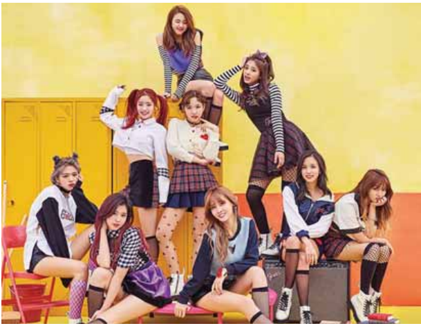
မှာတော့ အဖွဲ့ဝင်တွေဟာ တစ်ခုခုကို ရှာဖွေနေဟန်၊ ချောင်းကြည့်နေဟန်တွေကို ထည့်သွင်းရိုက်ကူးထားကြောင်းလည်း သိရပါတယ်။

"Signal" ရဲ့ ပထမဆုံးသော အစမ်းတေးဗီဒီယိုမှာတော့ အဖွဲ့ဝင်အားလုံးဟာ သစ်တောတစ်ခုအတွင်း ရောက်ရှိနေကြပြီး ကင်မရာကိုသာ စူးစိုက်ကြည့်နေတဲ့ဟန်တွေကိုတွေ့ မြင်ခဲ့ရကြောင်းလည်း သိရပါတယ်။ ဒါပေမယ့် ပထမဆုံးသောအစမ်းဗီဒီယိုနဲ့မတူဘဲ ဒုတိယမြောက် ထုတ်လွှင့်ခဲ့တဲ့ ဗီဒီယို