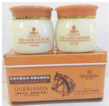
GUERISSON Horse Oil Miracle Horse Oil Whitening Spot (Day Cream + Night Cream)

ဆောင်ရွက်သွားမည်ဖြစ်ကြောင်း အသိပေးအပ်ပါသည်။ ကျန်းမာရေးနှင့် အားကစားဝန်ကြီးဌာန