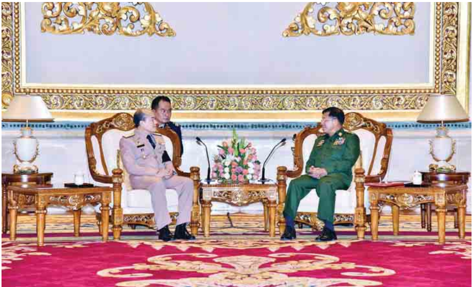
ကာကွယ်တိုက်ဖျက်ရေး၊ Boat ပူးပေါင်းဆောင်ရွက်ရေး၊ ရေတပ် ချစ်ကြည်ရေးအားကစားပွဲများ လုပ် Peopleနှင့် အကြမ်းဖက်မှုတားဆီး ဆိုင်ရာ ဆေးပညာသင်တန်းများ၊ ဆောင်ရွက်ရေးဆိုင်ရာ ကိစ္စရပ်များကို ကာကွယ်ရေး ကိစ္စရပ်များတွင် ဘာသာစကား သင်တန်းများနှင့် ဆွေးနွေးကြသည်။ (သတင်းစဉ်)

နေပြည်တော် မေ ၉ တပ်မတော်ကာကွယ်ရေးဦးစီးချုပ် ဗိုလ်ချုပ်မှူးကြီး မင်းအောင်လှိုင်သည် ထိုင်းဘုရင်တပ်မတော် ရေတပ်ဦးစီးချုပ် Admiral Na Arreenich အား ယနေ့ညနေ ၄ နာရီခွဲတွင် နေပြည်တော်ရှိ ဝေယျာသီရိဗိမာန် ဧည့်ခန်းမဆောင်၌ လက်ခံတွေ့ဆုံ သည်။(ယာပုံ) ထိုသို့တွေ့ဆုံစဉ် နှစ်နိုင်ငံ ဆက်စပ်နေသည့် ရေပိုင်နက်အတွင်း လုံခြုံရေးဆိုင်ရာ ပူးပေါင်းလုပ်ဆောင် ရေးနှင့် HADR လုပ်ငန်းများတွင် အတွေ့အကြုံဖလှယ်ဆောင်ရွက်ရေး၊ နှစ်နိုင်ငံရေပိုင်နက်ကို အသုံးချ၍ တရားမဝင်စီးပွားရေးလုပ်ကိုင်မှုများ ကို တားဆီးကာကွယ်ပြီး တရားဝင် စီးပွားရေးလုပ်ငန်းများအား ကူညီ ဆောင်ရွက်ရေး၊ ရေကြောင်းမှ မူးယစ် ဆေးဝါးသယ်ဆောင်မှုများကို ပူးပေါင်း