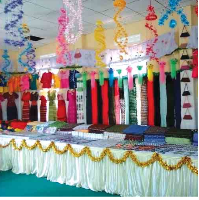
မြိတ်မြို့ (မြိတ်)

ဘားအံ မေ ၉ ကရင်ပြည်နယ် ဘားအံမြို့ အမျိုးသမီးအိမ်တွင်းမှု ထုတ်ကုန်ပေးလုပ်ငန်းသင်တန်းကျောင်းတွင် အမျိုးသမီးငယ်များအတွက် အိမ်တွင်းမှုထုတ်ကုန်ပညာသုံးမျိုး သင်တန်း ဖြစ်သည့် အခြေခံအိမ်တွင်းမှုထုတ်ကုန်အမှတ်စဉ်(၄၄)၊ အဆင့်မြင့် စက်ချုပ်သင်တန်း အမှတ်စဉ်(၄၅)နှင့် ရိုးရာဂျပ်ခတ်သင်တန်းအမှတ်စဉ်(၁၁) သင်တန်းဖွင့်ပွဲကို မေ ၈ ရက် မွန်းလွဲ ၂ နာရီက အဆိုပါ အမျိုးသမီး အိမ်တွင်းမှုထုတ်ကုန်ပေးလုပ်ငန်း သင်တန်းကျောင်း၌ လုပ်ခဲ့သည်။ သင်တန်းဖွင့်ပွဲတွင် ကရင်ပြည်နယ်လွှတ်တော် ဥက္ကဋ္ဌ ဦးစောချစ်ခင်က အဖွင့်အမှာစကားပြောကြားပြီး ဘားအံမြို့ အမျိုးသမီးအိမ်တွင်းမှုထုတ်ကုန်ပေးလုပ်ငန်း သင်တန်းကျောင်း ကျောင်းအုပ်ဆရာမက သင်တန်းနှင့် ပတ်သက်သည့်အကြောင်း အရာများကိုရှင်းလင်းပြောကြားသည်။ ထို့နောက် ပြည်နယ်အစိုးရအဖွဲ့မှ ထောက်ပံ့သော သင်တန်းအတွက် အခြေခံစားကုန်များအား ပြည်နယ်လွှတ်တော်ဥက္ကဋ္ဌကပေးအပ်ရာ ကျောင်းအုပ်ဆရာမက လက်ခံရယူသည်။ အဆိုပါသင်တန်း သုံးမျိုးကို နယ်စပ်ရေးရာဝန်ကြီးဌာန ပညာရေးနှင့်လေ့ကျင့်ရေးဦးစီးဌာန တိုင်းရင်းသူ အမျိုးသမီးငယ်လေးများ၏ လူစွမ်းအားအရင်းအမြစ် ဖွံ့ဖြိုးပြီး အသက်မွေးဝမ်းကျောင်းပညာရပ်များ တတ်မြောက်စေရန်ရည်ရွယ်ကာ အခြေခံအိမ်တွင်းမှုထုတ်ကုန်အမှတ်စဉ် (၄၄) တွင် အမျိုးသမီးငယ် ၅၉ ဦး၊ အဆင့်မြင့် စက်ချုပ်သင်တန်း အမှတ်စဉ် (၄၅) တွင် အမျိုးသမီးငယ် ၁၂ ဦးနှင့် ရိုးရာဂျပ်ခတ်သင်တန်း အမှတ်စဉ် (၁၁) တွင် အမျိုးသမီးငယ် ၄၆ ဦး စုစုပေါင်း ၇၆ ဦးကို ရက်သတ္တပတ် ၁၄ ပတ်ကြာ အခြေခံစက်ချုပ်ပညာ သုံးမွေးထိုးပန်းထိုးနည်း၊ မြန်မာ့မုန့်လုပ်နည်း၊ အဆင့်မြင့်စက်ချုပ်သင်တန်းတွင် မော်တာအပ်ချုပ်စက်ဖြင့် ဝတ်စုံအမျိုးမျိုးချုပ်လုပ်နည်း၊ အသုံးအဆောင်အမျိုးမျိုး ရိုးရာဂျပ်ခတ်နည်းများကို သင်ကြားပေးသွားမည်ဖြစ်ကြောင်းသိရသည်။ နေမျိုးလွင်(ဘားအံ)