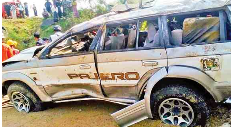
ယာဉ်တိမ်းမှောက်မှု ဖြစ်ပွားခြင်းကြောင့် လျက် စီးသွားသော ပါဂျဲရိုးယာဉ်အား တွေ့ ရစဉ်။

ကပ်တုံးတိုက်ကာ လမ်းပေါ်သို့ တိမ်းမှောက်ခဲ့သည်။ မော်တော်ယာဉ်ဖြင့် တံတားဦးဆေးရုံသို့ ပို့ဆောင်ပေးခဲ့ရ သည်။ သို့ပါ၍ ပါဂျဲရိုးယာဉ်နှင့် လိုက်ထရပ်ယာဉ်တို့မှ ယာဉ်မောင်းများအား သက်ဆိုင်ရာက အရေးယူထား ကြောင်း သိရသည်။ ညီညီသန့်(နေပြည်တော်)