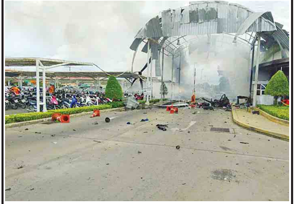
Big C ဈေးဝယ်စင်တာ၏ ကားပါကင်နေရာတွင် ဗုံးပေါက်ကွဲပြီးနောက် အပျက်အစီးများကို တွေ့ရစဉ်။