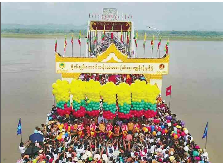
ဗိုလ်ချုပ်အောင်ဆန်းတံတား ဖွင့်ပွဲအခမ်းအနား ကျင်းပစဉ်။ (သတင်းစဉ်)

ဗိုလ်ချုပ်အောင်ဆန်း၏ အမည်နာမကို တွေ့မြင် ကြားသိခြင်းအားဖြင့် ပြည်ထောင်စုစိတ်ဓာတ်ကို နိုးကြား စေပါကြောင်း၊ စည်းလုံးညီညွတ်မှုကို ဖြစ်စေပါကြောင်း၊ တိုင်းချစ်ပြည်ချစ်စိတ်များ ပေါ်ပေါက်စေပါကြောင်း၊ ရိုးသားတည်ကြည်ဖြောင့်မတ်မှုများကို အတုယူလိုစိတ် ဖြစ်စေပါကြောင်း၊ ကိုယ်ကျိုးစွန့် အနစ်နာခံမှုများ စံနမူနာ ရစေပါကြောင်း၊ လက်ရုံးရည် နှလုံးရည်ဖြင့် ပြည့်စုံသည့် နိုင်ငံ့သားကောင်းများ ပေါ်ပေါက်စေပါကြောင်း၊ တိုင်းပြည် ကို လက်ဝါးကြီးအုပ် အမြတ်ထုတ် ကိုယ်ကျိုးရှာခြင်း မရှိဘဲ၊ တိုင်းပြည်ပေါ်တွင် မည်သည့်အကျိုးစီးပွားမျှ မခံစားဘဲ တိုင်းပြည်နှင့် လူထုအတွက် ကိုယ်ကျိုးစွန့်အနစ် နာခံပြီး ပြည်ထောင်စုသမ္မတမြန်မာနိုင်ငံတော်ကြီးအဖြစ် ပေါ်ထွန်းလာအောင် လွတ်လပ်ရေးကို အသက်ပေးပြီး ရယူပေးခဲ့သည့် ကျေးဇူးရှင်ကြီးလည်းဖြစ်ပါကြောင်း၊ ထိုအရာကို သတိတရရှိပြီး နိုင်ငံတော်၏ အနာဂတ်အရေး ကို မြှော်တွေးကာ အဆိုတင်ခြင်း၊ ထောက်ခံခြင်း၊ ဆွေးနွေး ခြင်း၊ ဆုံးဖြတ်ခြင်းများ ပြုလုပ်ခဲ့ကြသည့် လွတ်တော်