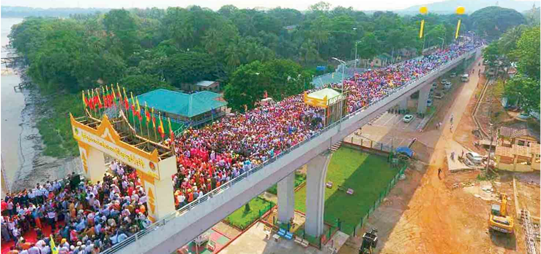
မော်လမြိုင်မြို့နှင့် ချောင်းဆုံမြို့ကို ဆက်သွယ်တည်ဆောက်ထားသော ဗိုလ်ချုပ်အောင်ဆန်းတံတား(ဘီလူးကျွန်း)နှင့် တံတားပြတိုက်ဖွင့်ပွဲအခမ်းအနား ကျင်းပစဉ်။

မြန်မာနိုင်ငံ၏ ပင်လယ်အစိတ်အပိုင်းတစ်ခုဖြစ်သည့် သံလွင်မြစ်ကိုဖြတ်သန်းပြီး မော်လမြိုင်မြို့နှင့် အဓိကကျွန်းကြီးတစ်ကျွန်းဖြစ်သည့် ဘီလူးကျွန်းဒေသ ချောင်းဆုံမြို့ကို ဆက်သွယ်တည်ဆောက်ထားသော ဗိုလ်ချုပ်အောင်ဆန်းတံတား (ဘီလူးကျွန်း)နှင့် တံတားပြတိုက် ဖွင့်ပွဲအခမ်းအနားကို ယနေ့နံနက်ပိုင်းတွင် တံတားတည်ဆောက်ရေးစီမံကိန်း မော်လမြိုင်ဘက်ကမ်းရှိမဏ္ဍပ်၌ ကျင်းပရာ ပြည်သူ့လွှတ်တော်ဥက္ကဋ္ဌ ဦးဝင်းမြင့် တက်ရောက်အမှာစကားပြောကြားသည်။ စာမျက်နှာ ၈ တော်လ ၁ သို့