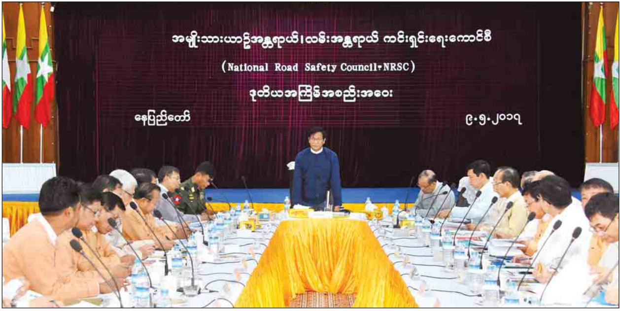
ဒုတိယသမ္မတ ဦးဟင်နရီဗန်ထီးယူ အမျိုးသားယာဉ်အန္တရာယ်၊ လမ်းအန္တရာယ်ကင်းရှင်းရေးကောင်စီ (National Road Safety Council-NRSC)၏ ဒုတိယအကြိမ် အစည်းအဝေးတွင် အမှာစကားပြောကြားစဉ်။ (သတင်းစဉ်)