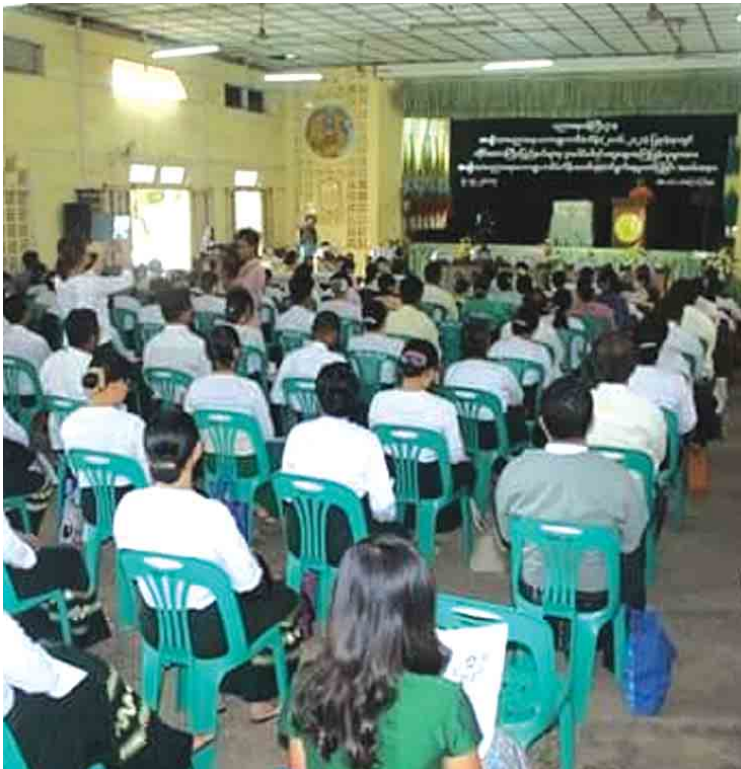
တင်ဖိုး(ပဲခူး)

အဆိုပါအခမ်းအနားကို ပဲခူးတိုင်းဒေသကြီးတွင် ပဲခူးမြို့အမှတ် (၁) အခြေခံပညာအထက်တန်းကျောင်း သီရိပညာခန်းမနှင့် ပြည်မြို့အမှတ်(၁)အခြေခံပညာအထက်တန်းကျောင်း သီရိရတနာခန်းမတို့တွင်ကျင်းပပြီး အစိုးရအဖွဲ့တာဝန်ရှိသူများနှင့်လွှတ်တော်ကိုယ်စားလှယ်များ၊ ဌာနဆိုင်ရာများ၊ ပညာရေးဌာနဝန်ထမ်းများ၊ တိုင်းရင်းသားစာပေနှင့်ယဉ်ကျေးမှုကိုယ်စားလှယ်များ၊ စီးပွားရေးလုပ်ငန်းရှင်များနှင့်ပညာရှင်များ၊ ကွန်ပျူတာပညာရှင်များ၊တိုင်းရင်းသား ကိုယ်စားလှယ်များ၊ ဘုန်းတော်ကြီးသင် ကျောင်းကိုယ်စားလှယ်များ၊ ပညာရေးကဆောင်ရွက်နေသော NGOs ကိုယ်စားလှယ်များနှင့် စက်မှုဇုန်ကိုယ်စားလှယ်များ တက်ရောက်ကြကြောင်း သိရသည်။