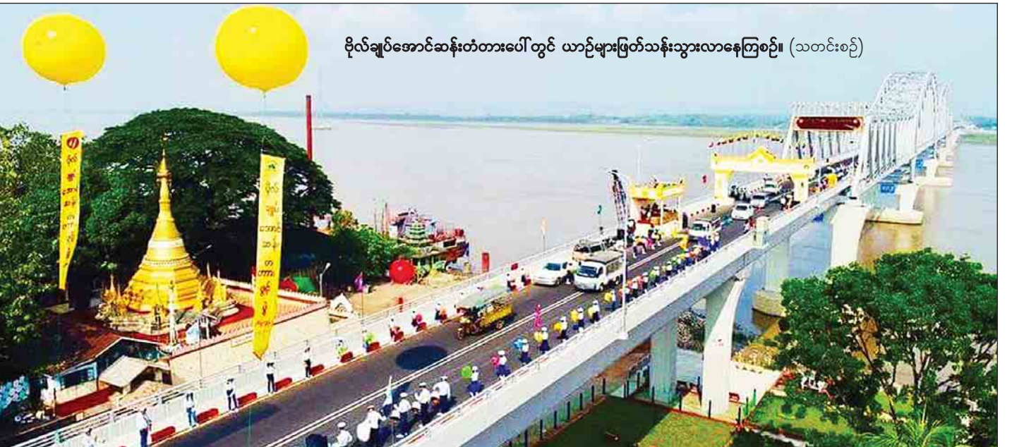
ဗိုလ်ချုပ်အောင်ဆန်းတံတားပေါ်တွင် ယာဉ်များဖြတ်သန်းသွားလာနေကြစဉ်။ (သတင်းစဉ်)