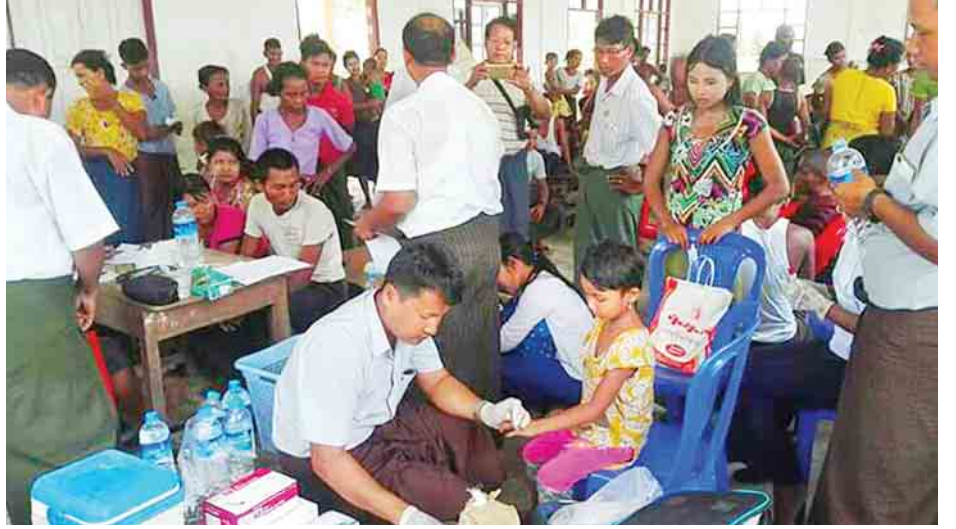
ဖုံး၊ သွန်း၊ လဲ၊ စစ် ခြင်လောက်လမ်း နှိမ်နင်းရေးလုပ်ငန်းများ၊ များတွင် ရောဂါစောင့်ကြပ်ကြည့်ရှုခြင်းနှင့် ရောဂါကာ ခြင်ဆေးမှုတ်ခြင်းလုပ်ငန်းများ၊ Abate ဆေးခတ်ခြင်း ကွယ်နှိမ်နင်းခြင်းလုပ်ငန်းများ ဆက်လက်ဆောင်ရွက် လုပ်ငန်းများနှင့် ကျန်းမာရေးပညာပေးခြင်းလုပ်ငန်းများ လျက်ရှိကြောင်း သတင်းရရှိသည်။ (သတင်းစဉ်)

ကွင်းဆင်းအဖွဲ့သည် အဆိုပါကျေးရွာ၌ ဆေးခန်း ဖွင့်လှစ်၍ ဆေးကုသပေးခဲ့ရာ ကျေးရွာရှိ အိမ်ခြေ ၁၅၆ အိမ်၊ လူဦးရေ ၈၇၅ ဦးရှိသည့်အနက် ဆေးခန်းပြုလုနာ ၆၄ ဦးရှိပြီး ၎င်းတို့အနက် လူနာ ၃၅ ဦးတွင် ဖျားခြင်း၊ အနီစက်ထွက်ခြင်းနှင့် အဆစ်အမြစ်များ ကိုက်ခဲခြင်းရောဂါ လက္ခဏာများ တွေ့ရှိရသဖြင့် လူနာများအား သွေးလွန် တုပ်ကွေးရောဂါ ရှိ မရှိ Test Kit များဖြင့် စမ်းသပ်စစ်ဆေး ရာ လူနာ ၁၄ ဦးတွင် သွေးလွန်တုပ်ကွေးရောဂါဖြစ်ပွား လျက်ရှိကြောင်း တွေ့ရှိရသည်။ ဆေးရုံသို့ လွှဲပြောင်းပေး ပို့ရသော လူနာနှင့်သေဆုံးသူမရှိကြောင်း ရောဂါဖြစ်စဉ် အား အတည်ပြုဓာတ်ခွဲစစ်ဆေးနိုင်ရန် လူနာ ၄ ဦးထံမှ သွေးရည်ကြည်(Serum) နမူနာများရယူ၍ အမျိုးသား ကျန်းမာရေးဓာတ်ခွဲခွဲဆိုင်ရာဌာန ရန်ကုန်မြို့သို့ ပေးပို့ စစ်ဆေးထားကြောင်း သိရသည်။ ကွင်းဆင်းအဖွဲ့အနေဖြင့် အဆိုပါကျေးရွာတွင်