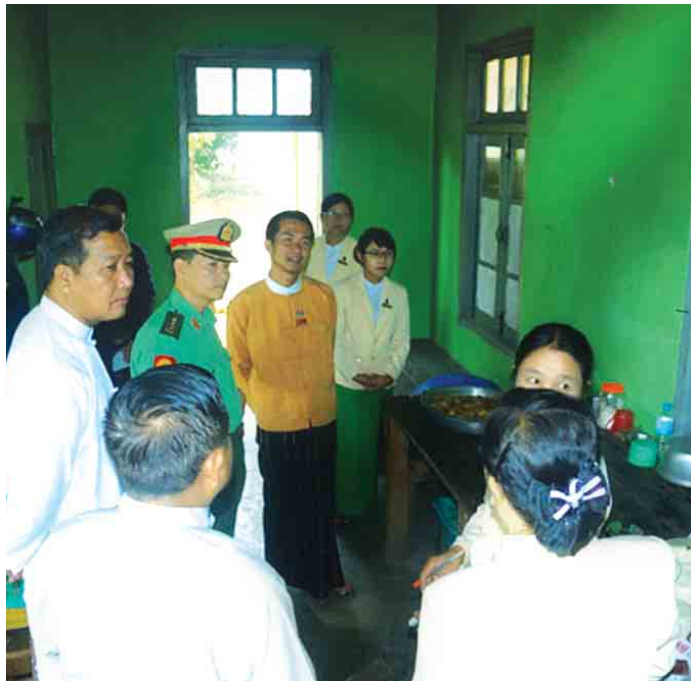
ပြည်နယ်မြန်/ဆက်

အမျိုးသမီးအိမ်တွင်းမှု သက်မွေးလုပ်ငန်းပညာသင်တန်းကျောင်း တွင် ဖွင့်လှစ်သင်ကြားမည့် သင်တန်းများအား ၁၄ ပတ်ကြာ သင်ကြား ပို့ချပေးမည်ဖြစ်ပြီး သင်တန်းသူစုစုပေါင်း ၈၀ တက်ရောက်သင်ကြား ကြောင်း သိရသည်။