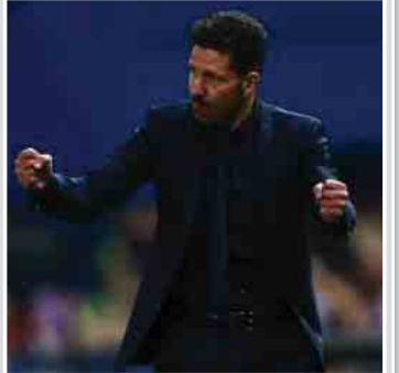
တိုက်စစ်မှူး စီရိုနယ်လ်ဒို၏ သွင်းဂိုး သုံးဂိုး ကို ခွင့်ပြုပေးခဲ့ရသောကြောင့် အကြိုဗိုလ်လုပွဲ အဆင့်ဖြင့်ပင် ကျေနပ်ရနိုင်ဖွယ်ရှိနေသော် လည်း ဒုတိယအကျော့တွင်မဖြစ်နိုင်သည်ကို ဖြစ်အောင်လုပ်ပြနိုင်မည်ဟု ဆီမြွန်နီက ယုံကြည်နေခြင်း ဖြစ်သည်။

အက်သလက်တီကို နည်းပြ ဒီယေဂိုဆီမြွန်နီက ရီးယဲလ်မက်ဒရစ်ကို ချန်ပီယံလိဂ်ပြိုင်ပွဲ ပထမအကျော့တွင် သုံးဂိုးပြတ်ဖြင့်အရေးနိမ့် ခဲ့သော်လည်း အက်သလက်တီကိုအတွက် မဖြစ်နိုင်ဘူးဆိုတာ ဘာမှမရှိသောကြောင့် ရီးယဲလ်ကို ဒုတိယအကျော့ ရင်ဆိုင်ရန် အသင့်ရှိနေပြီဟု ပြောကြားခဲ့သည်။ ဆီမြွန်နီ က ရီးယဲလ်မှာ ပြိုင်ဘက်ကောင်းဖြစ်သော် လည်း အက်သလက်တီကိုမှာလည်း အခြား အသင်းနှင့်မတူသည့် စိတ်ဓာတ်ရှိသဖြင့် ဘာမဆိုဖြစ်နိုင်ဆဲအနေအထားဟု ရီးယဲလ် နှင့် ပွဲမတိုင်မီ စိန်ခေါ်စကားဆိုခဲ့သည်။ အက်သလက်တီကိုမှာ ယခုနှစ်တွင် လာလီဂါ ချန်ပီယံဖြစ်နိုင်တော့သော်လည်း ချန်ပီယံလိဂ်အကြိုဗိုလ်လုပွဲအဆင့်အထိ ရောက်ရှိနေသည်။ ပထမအကျော့တွင် ရီးယဲလ်