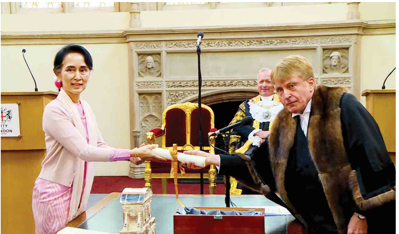
လန်ဒန်မြို့တော်မှချီးမြှင့်သည့် Honorary Freedom of The City of London ဆုအား နိုင်ငံတော်၏အတိုင်ပင်ခံပုဂ္ဂိုလ် ဒေါ်အောင်ဆန်းစုကြည် လက်ခံရယူစဉ်။

အတွင်းပွင့်ရှိလီးယားဒေသ၌ အပြန်ရထားခရီးစဉ် စမ်းသပ်ခုတ်မောင်း