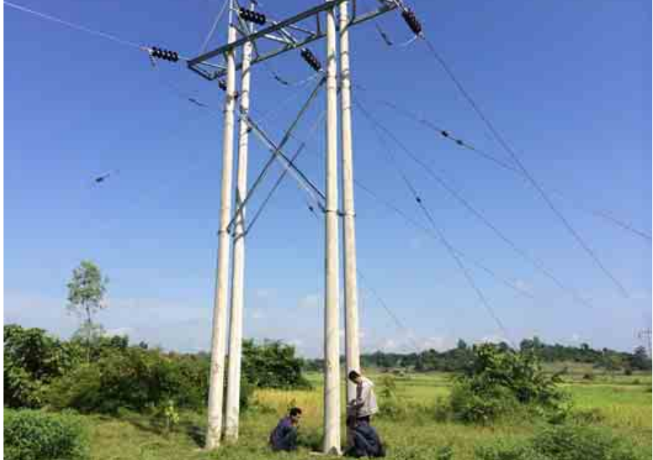
ရွှေတောင်မြို့နယ် ၆၆ ကေပီ ရွှေတောင်-ကွင်းယားကြီးဓာတ်အားလိုင်း တည်ဆောက်ထားရှိမှုကို တွေ့ရစဉ်။

နှစ်မိုင်အတွင်း ၆၆ ရွာနှင့် ငါးမိုင်အတွင်း ၁၀၃ ရွာအား နှစ်အလိုက် ၁၁ ကေပီ ဓာတ်အားလိုင်းနှင့် ၁၁/၀ ဒဿမ ၄ ကေပီ ဓာတ်အားခွဲရုံများ တည်ဆောက်ပေးမည်ဖြစ်ရာ အဆိုပါလုပ်ငန်းများပြီးစီးပါက ကွင်းယားကြီး ၆၆/၁၁ ကေပီ ဓာတ်အားခွဲရုံမှ ကျေးရွာအုပ်စု ၁၇ စုမှ ရွာပေါင်း ၉၁ ရွာအား ဓာတ်အားပေးနိုင်မည် ဖြစ်ပါသည်။