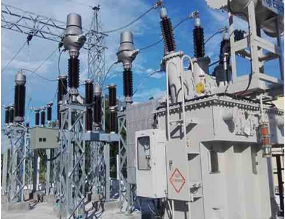
ရွှေတောင်မြို့နယ် ၆၆/၁၁-ကေပီ (၅)အမိဗီအေ ကွင်းယားကြီးဓာတ်အားခွဲရုံတည်ဆောက်ပြီးစီးမှုကိုတွေ့ရစဉ်။

ရွှေတောင်မြို့နယ်တွင် အမျိုးသားလျှပ်စစ်ဓာတ်အား ရရှိရေးစီမံချက်အနေဖြင့်လည်း ဓာတ်အားလိုင်းနှင့်