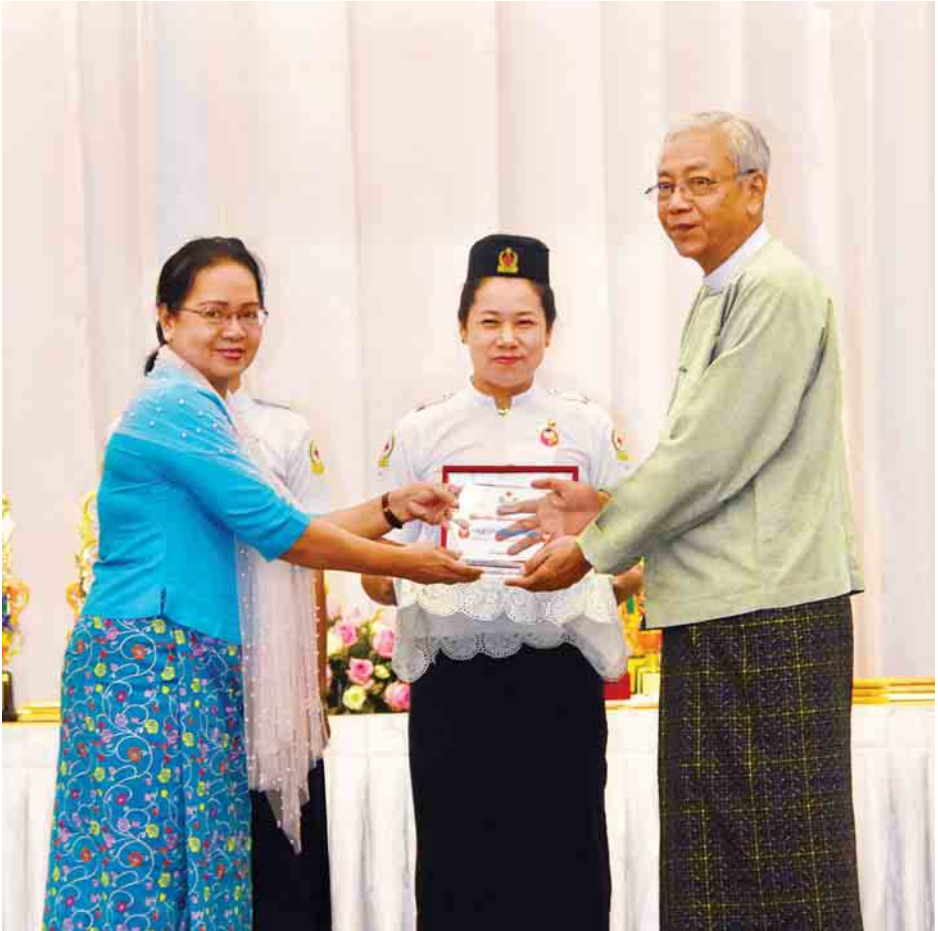
နိုင်ငံတော်သမ္မတ ဦးထင်ကျော်ထံ မြန်မာနိုင်ငံကြက်ခြေနီအသင်းဥက္ကဋ္ဌ ပါမောက္ခ ဒေါက်တာဒေါ်မြသူ ၂၀၁၇ ခုနှစ် ကမ္ဘာ့ကြက်ခြေနီနေ့အထိမ်းအမှတ်လက်ဆောင် ပေးအပ်စဉ်။

အသင်းအနေဖြင့် ကောင်းမွန်သည့် ဆောင်ရွက်ချက်များနှင့် စွမ်းဆောင်ရည်များ၊ အောင်မြင်မှုများကို ထိန်းသိမ်းဆောင်ရွက်ကြရန်၊ ယခုထက်ပိုမိုတိုးတက်ကောင်းမွန်အောင် နည်းလမ်းရှာကြံကြိုးပမ်းကြရန်၊ အသင်းအနေဖြင့် ပြည်သူလူထု အခြေပြုအဖွဲ့အစည်းအဖြစ် လူမှုကရုဏာလုပ်ငန်းများကို လိုအပ်ချက်နှင့်အညီ နေရာ