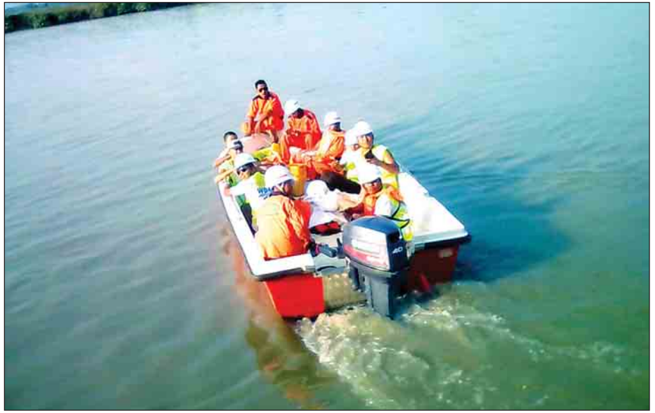
ချောင်းထဲသို့ ပြုတ်ကျသူအား အမြန်ရေယာဉ်ဖြင့် ရှာဖွေနေစဉ်။