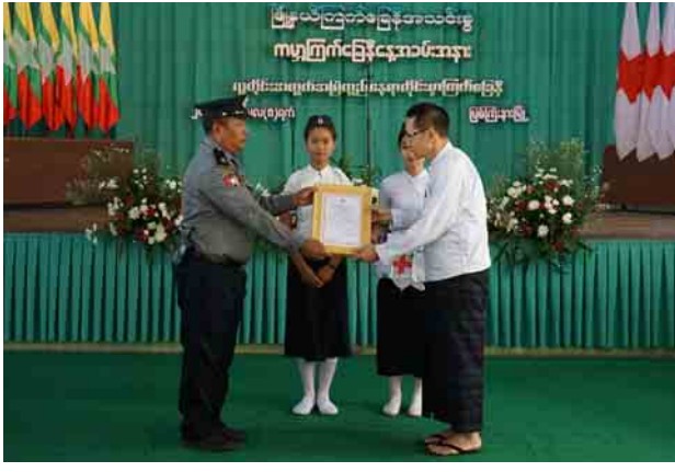
ပေးပို့သည့်သဝဏ်လွှာကို ဖတ်ကြား ကြက်ခြေနီ တပ်ဖွဲ့ဝင်များက “အသင့် ခဲ့သည်။ ယင်းနောက် အလှူရှင်များက ဖျော်ဖြေခဲ့ကြောင်း သိရသည်။ ခရိုင်(ပြန်/ဆက်)