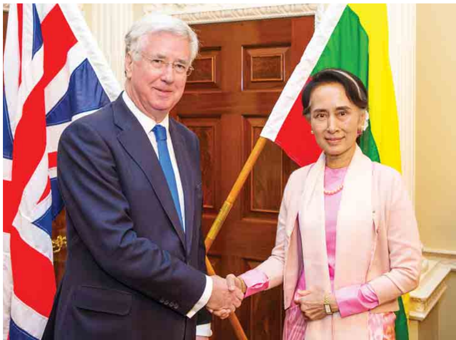
နိုင်ငံတော်၏အတိုင်ပင်ခံပုဂ္ဂိုလ် ဒေါ်အောင်ဆန်းစုကြည်နှင့် ဗြိတိန်ကာကွယ်ရေးဝန်ကြီး Sir Michael Fallon တို့ ရင်းရင်းနှီးနှီးနှုတ်ဆက်စဉ်။