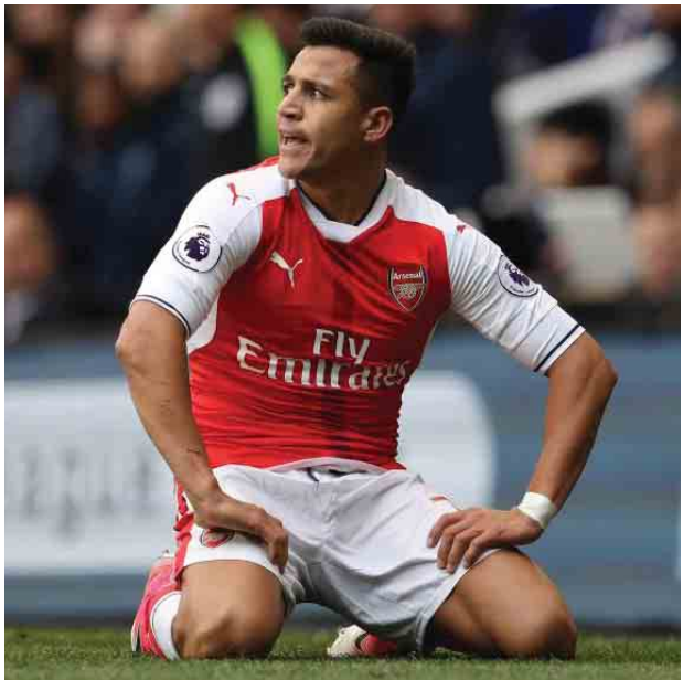
အပေါ် စိတ်ပျက်နေသည်မှာ ပေါ်လွင် သည်။ ဆန်းချက်င်ကို ပရီမီယာလိဂ်ပြိုင် ဘက်ကလပ်များဖြစ်သည့် မန်စီးစီး နှင့် ချယ်လ်ဆီး၊ စီးရီးအေအင်အားကြီး ဂျူဗင်တပ်၊ ဂျာမန်ထီပဲသီး ဘိုင်ယန်မြူးနစ်နှင့် ပြင်သစ်ကလပ် ပီအက်စ်ဂျီတို့မှ အလိုရှိနေကြသည်။

အာဆင်နယ် အသင်းဘက်ကမူ ဆန်းချက်င်အား ဆက်ထိန်းနိုင်ရန် ကြိုးပမ်းသွားမည်ဖြစ်သော်လည်း စာချုပ်သစ်ကမ်းလှမ်း၍ မရပါက အလွတ်ပြောင်းရွှေ့ကြေးဖြင့် ထွက်ခွာ ခွင့်မပေးလိုဘဲ လာမည့်နေ့ဈေးကွက် အတွင်းမှာပင် ပရီမီယာလိဂ်ကလပ်