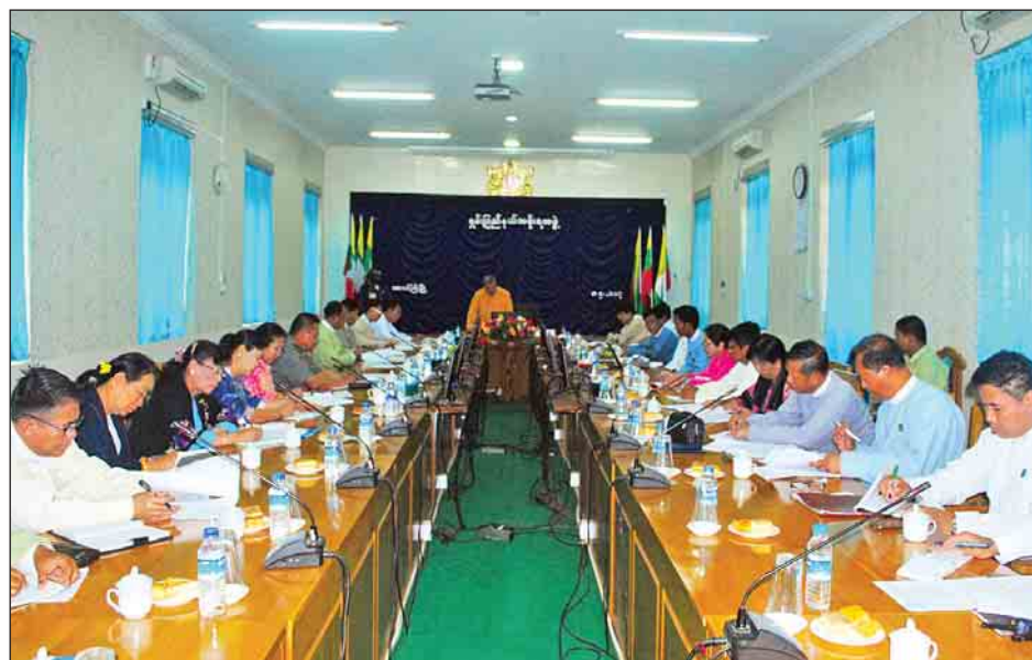
စာအုပ်ဈေးရောင်းပွဲတော်ကို အသီးသီးဘက်စုံထောင့်စုံမှ ကော်မတီဝင်များ အကောင်အထည်ဖော်ဆောင်ရွက်ရာတွင် ကော်မတီဖွဲ့စည်းထားပြီးဖြစ်ကြောင်း၊ ကလေးစာပေပွဲတော်နှင့် စာအုပ်ဈေးရောင်းပွဲတော်ကျင်းပရေးအတွက် ကော်မတီအသီးသီးက ပိုင်းဝန်းဆောင်ရွက်ပေးကြရန် ပြောကြားသွားသည်။

ပြန်ကြားရေးဝန်ကြီးဌာန၊ ပညာရေးဝန်ကြီးဌာနနှင့် ရှမ်းပြည်နယ်အစိုးရအဖွဲ့တို့ ပူးပေါင်း၍ ကလေးစာပေပွဲတော်နှင့် စာအုပ်ဈေးရောင်းပွဲတော်(တောင်ကြီး) အောင်မြင်စွာကျင်းပနိုင်ရေးအတွက် ညှိနှိုင်းအစည်းအဝေးကို မေ ၈ ရက် နံနက် ၁၁ နာရီက ရှမ်းပြည်နယ်အစိုးရအဖွဲ့ရုံးအစည်းအဝေးခန်းမ၌ ကျင်းပသည်။ (ယာဝုံ)