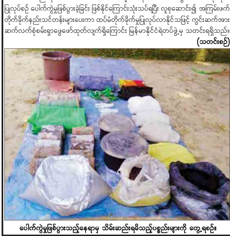
ပေါက်ကွဲမှုဖြစ်ပွားသည့်နေရာမှ သိမ်းဆည်းရမိသည့်ပစ္စည်းများကို တွေ့ရစဉ်။

နေပြည်တော် မေ ၈ ဘူးသီးတောင်မြို့နယ် သဲနီကျေးရွာအနောက်ဘက် တောစပ်အနီး၌ မေ ၄ ရက် ညနေ ၅ နာရီ မိနစ် ၅၀ ခန့်တွင် ပေါက်ကွဲမှုဖြစ်ပွားခဲ့ကြောင်းနှင့် ဆာကိုင်ကျေးရွာနေ နီအာလောင် အပါအဝင် နှစ်ဦးသေဆုံးခဲ့ပြီး တင်းမေကျေးရွာနေ ရှောင်ရှားအာလောင်အပါအဝင် သုံးဦးတို့ ဒဏ်ရာရရှိခဲ့ကြောင်း သိရသည်။ ယင်းသတင်းအရ လုံခြုံရေးတပ်ဖွဲ့ဝင်များက မေ ၅ ရက်မှစတင်၍ စစ်ဆေးရှင်းလင်းမှုများ ဆောင်ရွက်ခဲ့ရာ မေ ၇ ရက် မွန်းလွဲပိုင်းတွင် သဲနီကျေးရွာအနောက်ဘက် တောစပ်အတွင်း၌ ပေါက်ကွဲမှုဖြစ်ပွားခဲ့သောနေရာအားတွေ့ရှိရပြီး တောစပ်ပတ်ဝန်းကျင်မှ ပလတ်စတစ်ပြင်ထည့်ထားသည့် ယမ်း၊ ကန့်၊ မီးသွေးမှုန့် အသင့်ရောစပ်ထားသော ငါးပြည်ခန့်ရှိ အထုပ် တစ်ထုပ်၊ လက်လုပ်မိုင်းပြုလုပ်ရာတွင် အသုံးပြုမည့် မီးသွေး၊ ယမ်းမှုန့် နှစ်ထုပ်၊ ကားပစ္စည်းခွဲ ၁၀ ခု၊ မိုးကာမြေယာခင်း ငါးချပ်၊ မီးလောင်ထားသည့် ရုပ်အင်္ကျီ တစ်ထည်နှင့် မိုးကာစ တစ်ချပ်၊ ခြင်ထောင် လေးလုံး၊ စောင်နှစ်ထည်တို့အား သိမ်းဆည်းရမိခဲ့ပြီး ယာယီတံဆောက်လုပ်နေထိုင်ခဲ့သည်ဟု ယူဆရသော ရှင်းလင်းထားသည့်မြေနေရာ နှစ်နေရာကိုလည်း တွေ့ရှိခဲ့ကြောင်း သိရသည်။ သိမ်းဆည်းရမိသော အထောက်အထားများအရ တောစပ်အတွင်း လက်လုပ်မိုင်းပြုလုပ်စဉ် ပေါက်ကွဲမှုဖြစ်ပွားခဲ့ခြင်း ဖြစ်နိုင်ကြောင်းသုံးသပ်ရပြီး လူစုဆောင်း၍ အကြမ်းဖက်တိုက်ခိုက်နည်းသင်တန်းများပေးကာ ထပ်မံတိုက်ခိုက်မှုပြုလုပ်လာနိုင်သဖြင့် ကွင်းဆက်အား ဆက်လက်စုံစမ်းရှာဖွေဖော်ထုတ်လျက်ရှိကြောင်း မြန်မာနိုင်ငံရဲတပ်ဖွဲ့မှ သတင်းရရှိသည်။ (သတင်းစဉ်)