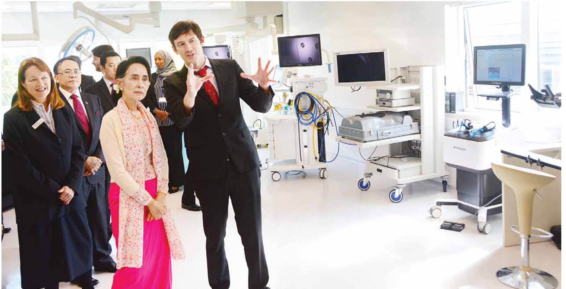
နိုင်ငံတော်၏အတိုင်ပင်ခံပုဂ္ဂိုလ် ဒေါ်အောင်ဆန်းစုကြည် လန်ဒန်မြို့ရှိ စိန့်မေရီဆေးရုံ၌ ကြည့်ရှုလေ့လာရာ တာဝန်ရှိသူတစ်ဦးက ရှင်းလင်းပြသနေစဉ်။