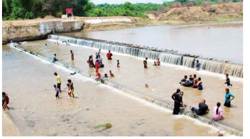
ကိုလွင်(ဆွာ)

ရောင်းချလာကြပြီး သစ်ပင်ရိပ်များ တွင်အပန်းဖြေအနားယူနေကြသူများ ရေချိုးနေကြသူများကိုလည်း တွေ့ရှိခဲ့ ရသည်။ အချို့လာရောက်လည်ပတ် သူများမှာ ဆိတ်ဖူးတောင်ရေလွှဲဆည် သို့လည်ပတ်ပြီးသည်နှင့် တောင်ငူ မြို့မှ (၁၃)မိုင်အကွာရှိ ပသီချောင်း သို့ ဆက်လက်သွားရောက်ကြပြီး ရေတာရှည်မြို့အရှေ့ဘက် ခုနစ်မိုင် ခန့်အကွာ ရေလွှဲကျေးရွာအနီးရှိ ကရင်ချောင်းရေတံခွန်သို့ လိပ်သို့ ကားလမ်းအတိုင်းတက်၍ ထုံးဘိုကြီး ကျေးရွာမှတစ်ဆင့် ခရိုင်ချင်းဆက် လမ်းအတိုင်း သွားရောက်နိုင်သေး သည်။ “ပူလွန်းတော့ အေးရာရှာကြတဲ့ သဘောပါပဲ။ ဒီနေ့ ရိုးပိတ်ရက်ဆို တော့ အားလုံးမိသားစုတွေစုပြီး ထွက်လာခဲ့ကြတာ။ ဆိတ်ဖူးတောင် ရေလွှဲဆည်ကို အရင်ဝင်တာ၊ ပြီးရင် ပသီချောင်းဘက် ဆက်သွားမှာ” ဟု လာရောက် လည်ပတ်သူတစ်ဦးက ပြောသည်။