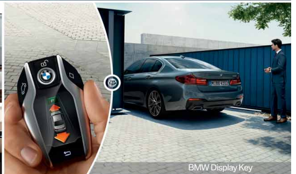
BMW Display Key