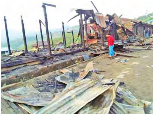
လျန်းတန်း(ဘ)ဦးခုပ်ခန့်ပေါင် (၂၃) အရေးယူဆောင်ရွက်လျက်ရှိကြောင်း နှစ်အား တီးတိန်မြို့ မြို့မရဲစခန်းက သိရသည်။ (ဇွဲဟောဆာ)

ခြေလျင်တပ်ရင်းမှ တပ်မတော်သား များသည် မီးငြိမ်းသတ်ယာဉ် သုံးစီး၊ အရန်မီးသတ် တပ်ဖွဲ့ဝင် ၂၀၊ ရပ်ကွက် အုပ်ချုပ်ရေးမှူးများနှင့် ဒေသခံပြည်သူများ အပါအဝင် စုစုပေါင်းအင်အား ၅၀၀ ခန့်တို့ ပိုင်းဝန်းမီးငြိမ်းသတ်မှုကြောင့် ည ၉ နာရီ ၁၅ မိနစ်တွင် မီးငြိမ်းသွားခဲ့ သည်။ အဆိုပါ မီးလောင်ကျွမ်းမှုကြောင့် အလျား ၁၂ ပေ၊ အနံ ၁၀ ပေ၊ အမြင့် ၁၀ပေရှိ သွပ်မိုး၊ ပျဉ်ခင်း၊ ပျဉ်ကာ ဆိုင်ခန်း ၁၃ ခန်းမီးလောင်ဆုံးရှုံးခဲ့ သည်။ မီးပေါ်ဆသုံးစွဲခဲ့သူ ဦးရှန်း