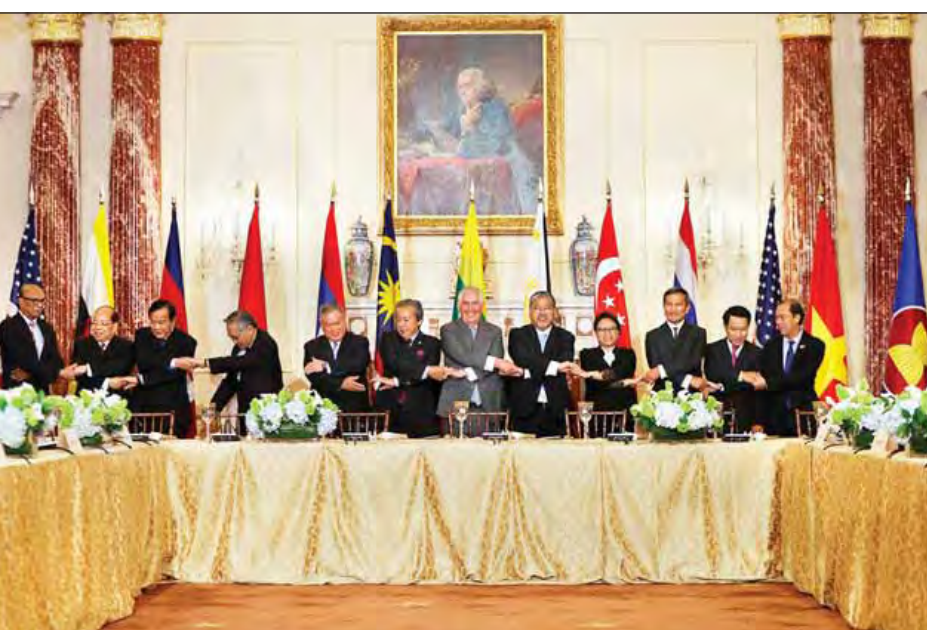
တောင်းဆိုမှုပြုလုပ်ခဲ့သည်ဟု ယူဆရသည်။

အာဆီယံအဖွဲ့ဝင်နိုင်ငံများအားလုံးသည် မြောက်ကိုရီးယားနိုင်ငံနှင့် သံတမန်အဆက်အသွယ်ရှိကြသည်။ တီလာဆန်က အာဆီယံနိုင်ငံများအနေဖြင့် မြောက်ကိုရီးယားနိုင်ငံနှင့် ဆက်ဆံရေးကို ပြန်လည်သုံးသပ်ရန်