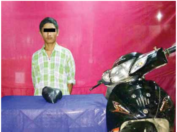
ခေါင်လွမ်းအား သိမ်းဆည်းရမိဘိန်းစိမ်းများနှင့်အတူ တွေ့ရစဉ်။