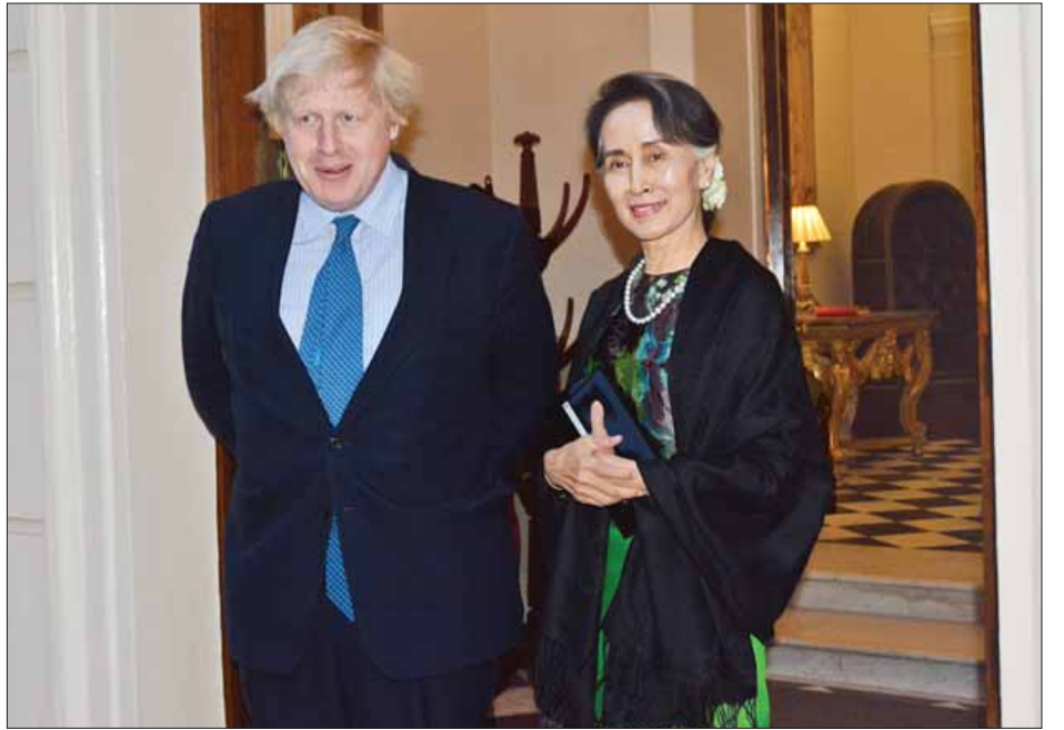
နိုင်ငံတော်၏ အတိုင်ပင်ခံပုဂ္ဂိုလ် ဒေါ်အောင်ဆန်းစုကြည်နှင့် ဗြိတိန်နိုင်ငံခြားရေးဝန်ကြီး Rt. Hon Boris Johnson တို့ တွေ့ဆုံစဉ်။ (သတင်းစဉ်)

ညစာစားပွဲတွင် မြန်မာ-ဗြိတိန် နှစ်နိုင်ငံဆက်ဆံရေးနှင့် ပူးပေါင်း ဆောင်ရွက်မှုတိုးမြှင့်ရေး၊ မြန်မာ နိုင်ငံရဲတပ်ဖွဲ့၏ စွမ်းရည်မြှင့်တင်နိုင် ရေး၊ ကျန်းမာရေးနှင့်ပညာရေးကဏ္ဍ များ ပူးပေါင်းဆောင်ရွက်မှု မြှင့်တင် ရေး၊ မြန်မာနိုင်ငံ၏ ငြိမ်းချမ်းရေးနှင့် အမျိုးသား ပြန်လည်သင့်မြတ်ရေး လုပ်ငန်းစဉ်များတိုးတက်မှု အခြေ အနေနှင့် အဆိုပါလုပ်ငန်းစဉ်များကို ဗြိတိန်နိုင်ငံမှ ဆက်လက်ကူညီ ဆောင်ရွက်သွားရေး ကိစ္စရပ်များကို အမြင်ချင်းဖလှယ်ဆွေးနွေးကြသည်။ (သတင်းစဉ်)