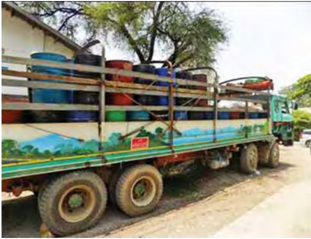
များကို စစ်ဆေးမှုပြုလုပ်ဆောင်ရွက် လျက်ရှိရာ မေ ၅ ရက်တွင် မရမ်းချောင်း အမြဲတမ်း စစ်ဆေးရေးစခန်းက တားဆီးမှု ရှစ်မှု (စုစုပေါင်းခန့်မှန်း တန်ဖိုး ကျပ် ၃၁ ဒသမ ၄၆၉၄ သန်း ခန့်)ကို သိမ်းဆည်းရမိကြောင်း သိရ

နေပြည်တော် မေ ၆ တရားမဝင်ကုန်စည်များ တားဆီး ထိန်းချုပ်ရေးအတွက် ရေပူနှင့် မရမ်းချောင်း အမြဲတမ်းစစ်ဆေးရေး စခန်းတို့ကို ဌာနဆိုင်ရာပူးပေါင်းအဖွဲ့ များဖြင့် မတ် ၁ရက်တွင် စတင်ဖွင့်လှစ် ဆောင်ရွက်ခဲ့ပြီး မေ ၅ ရက်တွင် မန္တလေး-မူဆယ် ပြည်ထောင်စု လမ်းမကြီးတစ်လျှောက် ကုန်သွယ်မှု ယာဉ်ပို့ကုန် ၈၁၅ စီး၊ သွင်းကုန် ၅၃၇ စီး၊ ရန်ကုန်-မြဝတီလမ်းမကြီး တစ်လျှောက် ကုန်သွယ်မှုယာဉ် ပို့ကုန် ၃၂ စီး၊ သွင်းကုန် ၁၇၇ စီး ကုန်စည်များ သယ်ယူပို့ဆောင် လျက်ရှိသည်။