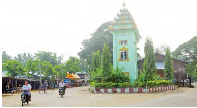
ဘူးသီးတောင်မြို့လယ်ကောင် ဖွံ့ဖြိုးတိုးတက်မှုမြင်ကွင်း။

ကုန်ကျငွေ လျာထားသော်လည်း အမှန် တကယ်သုံးစွဲမည့်ငွေပမာဏမှာ ငွေကျပ်သိန်း ပေါင်း ၂၃၀၀ ကျော်သာသုံးစွဲသွားမည်ဖြစ် သည်။ ပြည်နယ်အစိုးရအဖွဲ့အနေဖြင့် ယခု နှစ်တွင် လုပ်ငန်းပေါင်းဘယ်လောက်ချထား ပေးမည်၊ ငွေကျပ်ဘယ်လောက်သုံးစွဲခွင့်ပြု မည်ကို မသိရှိသေးကြောင်း ဘူးသီးတောင် မြို့စည်ပင်သာယာရေးအဖွဲ့မှ သိရသည်။ ဘူးသီးတောင်မြို့ စည်ပင်သာယာရေး အဖွဲ့သည် ၂၀၁၇-၂၀၁၈ ဘတ်ဂျက်တွင် မြို့သာယာဖွံ့ဖြိုးရေးအတွက် ငွေလုံးငွေရင်း လျာထားမှုများကို ပထမသုံးလပတ်၊ ဒုတိယ သုံးလပတ်၊ တတိယသုံးလပတ်နှင့် စတုတ္ထ သုံးလပတ်ဟူ၍ အပိုင်းလိုက် ခွဲခြားလုပ် ဆောင်သွားမည်ဖြစ်ပြီး ပထမသုံးလပတ်တွင် မြို့ပတ်လမ်းကျောက်ချောခင်းခြင်း၊ မင်း ဖလောင်းလမ်းတံတားအမှတ်(၂) တည်ဆောက် ခြင်း၊ ကမ်းနားလမ်းသစ် RC တံတားအမှတ် (၁)တည်ဆောက်ခြင်းစသည့် လုပ်ငန်းငါးခု၊ ဒုတိယသုံးလပတ်တွင် ဦးမြလမ်း RC တံတားတည်ဆောက်ခြင်း၊ ဗန္ဓုလ RC တံတား အမှတ်(၁)နှင့် (၂) တည်ဆောက်ခြင်း၊ မေယ ဝတီလမ်း တံတားအမှတ်(၃) တည်ဆောက်