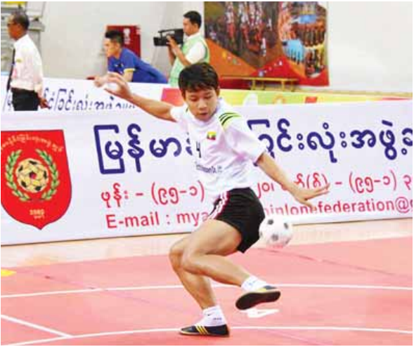
ရွှေတံဆိပ်ရရှိခဲ့သည့် မြန်မာ(က) အသင်း ယှဉ်ပြိုင်နေစဉ်။

ကျန်းမာရေးနှင့် အားကစားဝန်ကြီး ဌာန အားကစားနှင့် ကာယပညာဦးစီး ဌာန၊ အာရှခြင်းလုံးအဖွဲ့ချုပ်နှင့် မြန်မာ နိုင်ငံခြင်းလုံးအဖွဲ့ချုပ်တို့ ပူးပေါင်း၍ Hitachi Soe Electric & Machinery Co., Ltd ခံပိုးကူညီမှုဖြင့် ကျင်းပ သည့် ၂၀၁၇ အာရှဖိတ်ခေါ်ခြင်းလုံး ပြိုင်ပွဲ ခုတိယနေ့ကို ယနေ့ နံနက်ပိုင်းမှစ၍ နေပြည်တော်ရှိ စာမျက်နှာ ၉ ကော်လံ ၅ သို့ *