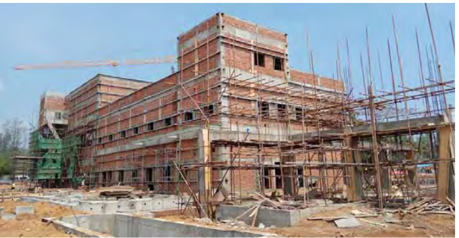
တင်စိုး(ပဲခူး)

သုံးဆယ်ရေလျှောင့်တစ် တည် ဆောက် အကောင်အထည်ဖော် ဆောင်ရွက်ခြင်းအားဖြင့် ဒေသ အတွင်း လယ်မြေဧရိယာ ၄၂၀၀၃ ဧက ခန့်အား စိုက်ပျိုးရေးပေးဝေနိုင်မည် ဖြစ်သည့်အပြင် ကျေးလက်ဒေသ၏ လယ်ယာကုန်ထုတ်လုပ်မှုများ တိုး တက်လာမည်ဖြစ်သည်။ စိုက်ပျိုး ထုတ်လုပ်မှု တိုးတက်မြှင့်တင်မှုများ လာ သည့်အခါ ဆက်လက်လျှောင့်သော အလုပ်အကိုင် အခွင့်အလမ်းများရရှိ ခံစားနိုင်ခြင်း၊ သဘာဝပတ်ဝန်းကျင် စီမံကိန်းစီမံပြုလုပ်မှုကြောင့် ကျန်း မာရေးနှင့် လူမှုရေးနယ်လမ်းများတွင် ဖွံ့ဖြိုးတိုးတက်လာစေရန် အထောက် အကူပြုလာမည်ဖြစ်ကြောင်း သိရ သည်။