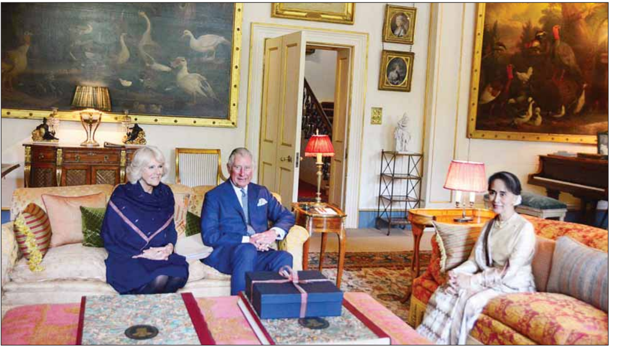
နိုင်ငံတော်၏အတိုင်ပင်ခံပုဂ္ဂိုလ် ဒေါ်အောင်ဆန်းစုကြည်နှင့် ဗြိတိန်နိုင်ငံ တော်ဝင်အိမ်ရှေ့စံ ဝေလမင်းသား ချားစ်နှင့် ကြင်ယာတော်မင်းသမီး ကမ်မီလာတို့ ရင်းနှီးခင်မင်စွာတွေ့ဆုံစဉ်။ (သတင်းစဉ်)

ဒုတိယသမ္မတက ပုဂံယဉ်ကျေးမှုနယ်မြေသည် မြန်မာတို့၏ နှလုံးသား၊ မြန်မာနိုင်ငံ၏ အထင်ကရနယ်မြေဖြစ်သည့်အပြင် နိုင်ငံတကာက အထူးစိတ်ဝင်စားသည့် နေရာတစ်ခုဖြစ်ပါကြောင်း၊ ဩဂုတ် ၂၄ ရက်က ရစ်ချ်စတာစကေး ၆ ဒသမ ၈ အဆင့်ရှိ မြေငလျင်လှုပ်ခတ်မှုကြောင့် ပျက်စီးခဲ့သည့် ရှေးဟောင်း