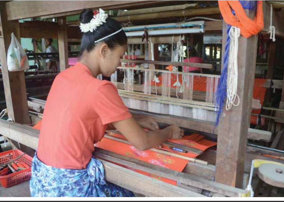
ရွှေကျားရခိုင်ရက်ကန်းလုပ်ငန်းခွင်တွင် ရက်ကန်းရက်လုပ်နေစဉ်။

ရက်ကန်းစင်သုံးစင်နှင့် မိသားစုတစ်ပိုင်တစ်နိုင်