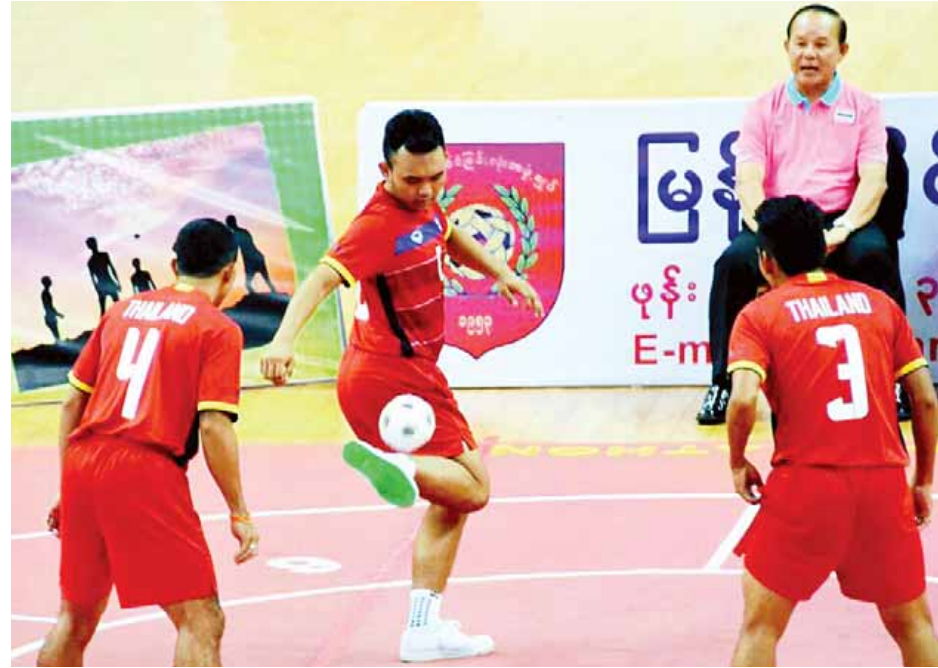
ရွှေတံဆိပ်ရရှိခဲ့သည့် ထိုင်းအသင်း ယှဉ်ပြိုင်နေစဉ်။