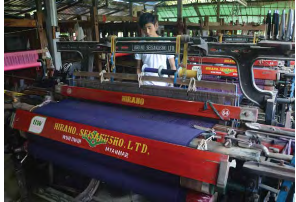
ရခိုင်ရက်ကန်းလုပ်ငန်းခွင်ကို တွေ့ရစဉ်။

ရွှေကျားရခိုင် ရက်ကန်းထည်လုပ်ငန်းသည် အလတ်စားလုပ်ငန်း ရက်ကန်းစက်ရုံအဖြစ် မေ ၇ ရက် တွင် ဖွင့်လှစ်ကာ စတင်လည်ပတ်လုပ်ကိုင်နိုင်တော့မည် ဖြစ်သည်။ ဒေသခံပြည်သူများအား အလုပ်အကိုင်အခွင့် အလမ်း ၁၀၀ ကျော် အလုပ်ပေးနိုင်မည်ဖြစ်ပြီး စတင် အလုပ်ဝင်စတွင် သင်တန်းသား သင်တန်းသူများအား နေထိုင်မှုအစ စရိတ်ငြိမ်း စီစဉ်ပေးသွားမည်ဖြစ်ပြီး တတ်ကျွမ်းအဆင့်ဖြစ်လာပါက အခကြေးငွေ၊ လစာဖြင့် ဒေသခံများအား အလုပ်အကိုင်အခွင့်အလမ်းများ ဖန်တီး ပေးနိုင်မည်ဖြစ်သည်။ ရခိုင်ပြည်နယ်တွင် ဒေသခံပြည်သူ များအတွက် အလုပ်အကိုင်အခွင့်အလမ်းများဖန်တီးပေး မည့် ပထမဆုံး ရက်ကန်းစက်ရုံကြီး ပေါ်ထွက်လာတော့မည်။ အလုပ်အကိုင်အခွင့်အလမ်းနှင့်အတူ လက်ခတ်သံများ မြိုင်ဆိုင်စွာ ထွက်ပေါ်လာတော့မည်ဖြစ်သည်။ သို့ဖြစ်၍ တစ်ခေတ် တစ်ခါက ပျောက်ကွယ်လုနီးပါးဖြစ်နေသော ရခိုင်ရိုးရာ လက်ရက်ကန်းနေရာတွင် အထက်အညာမြေ ဆီမှ ရက်ကန်းစင် လက်ခတ်သံများ မြန်မာနိုင်ငံ အနှောက် ဖျားဆီသို့ အမှန်တကယ်စီးဆင်းလာတော့မည် ဖြစ်ပါ ကြောင်း . . . . . ။