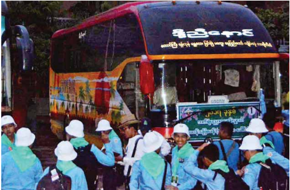
နဝမတန်း ဘက်စုံပညာထူးချွန် လူငယ်မောင်မယ်များ နေရပ်ဒေသအသီးသီးသို့ ပြန်လည်ထွက်ခွာစဉ်။ (ဇော်ဘိ)

စခန်းသိမ်းပွဲကျင်းပခဲ့သည်။ ယနေ့တွင် သက်ဆိုင်ရာ နေရပ်ဒေသအသီးသီးသို့ မော်တော်ယာဉ်များဖြင့် ပြန်လည်ထွက်ခွာသွားကြခြင်းဖြစ်သည်။ ဟိန်းထက်ဇော်(မြန်မာ့အလင်း)