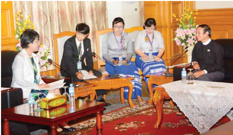
ဆွေးနွေးကြသည်။ လွှတ်တော်ဘဏ်များနှင့် ငွေကြေး လွှတ်တော်ရုံးမှ တာဝန်ရှိသူများ ဆိုင်ရာ ဖွံ့ဖြိုးတိုးတက်ရေးကော်မတီ တက်ရောက်ခဲ့ကြကြောင်း သတင်းရရှိ သည်။ (သတင်းစဉ်)

နေပြည်တော် မေ ၅ ပြည်သူ့လွှတ်တော်ဥက္ကဋ္ဌ ဦးဝင်းမြင့် သည် ဂျပန်နိုင်ငံ အောက်လွှတ်တော် အမတ် Hon. Ms. Yoko KAMIKAWA၊ Hon. Mr. Akira SATO နှင့် Hon. Mr. Teru FUKUI တို့အား ယနေ့မုန်းလွဲ ၂ နာရီတွင် နေပြည်တော်ရှိ လွှတ်တော်အဆောက်အအုံ ပြည်သူ့ လွှတ်တော်ညွှန်ကြားမှုဌာန၌ လက်ခံ တွေ့ဆုံသည်။(ယာဉ်) တွေ့ဆုံစဉ် တရားဥပဒေစိုးမိုးရေး နှင့် ပြည်တွင်းငြိမ်းချမ်းရေးကဏ္ဍများ တွင် ဂျပန်နိုင်ငံက ကူညီဆောင်ရွက် ပေးနေမှုများ၊ ရင်းနှီးမြှုပ်နှံမှုနှင့် စီးပွားရေးပူးပေါင်း ဆောင်ရွက်မှုများ တိုးမြှင့်ဆောင်ရွက်ရေးကိစ္စရပ်များ၊ ဂျပန်-မြန်မာ နှစ်နိုင်ငံလွှတ်တော်များ အကြား ချစ်ကြည်ရင်းနှီးမှုနှင့် ပူးပေါင်း ဆောင်ရွက်ရေးဆိုင်ရာကိစ္စရပ်များကို