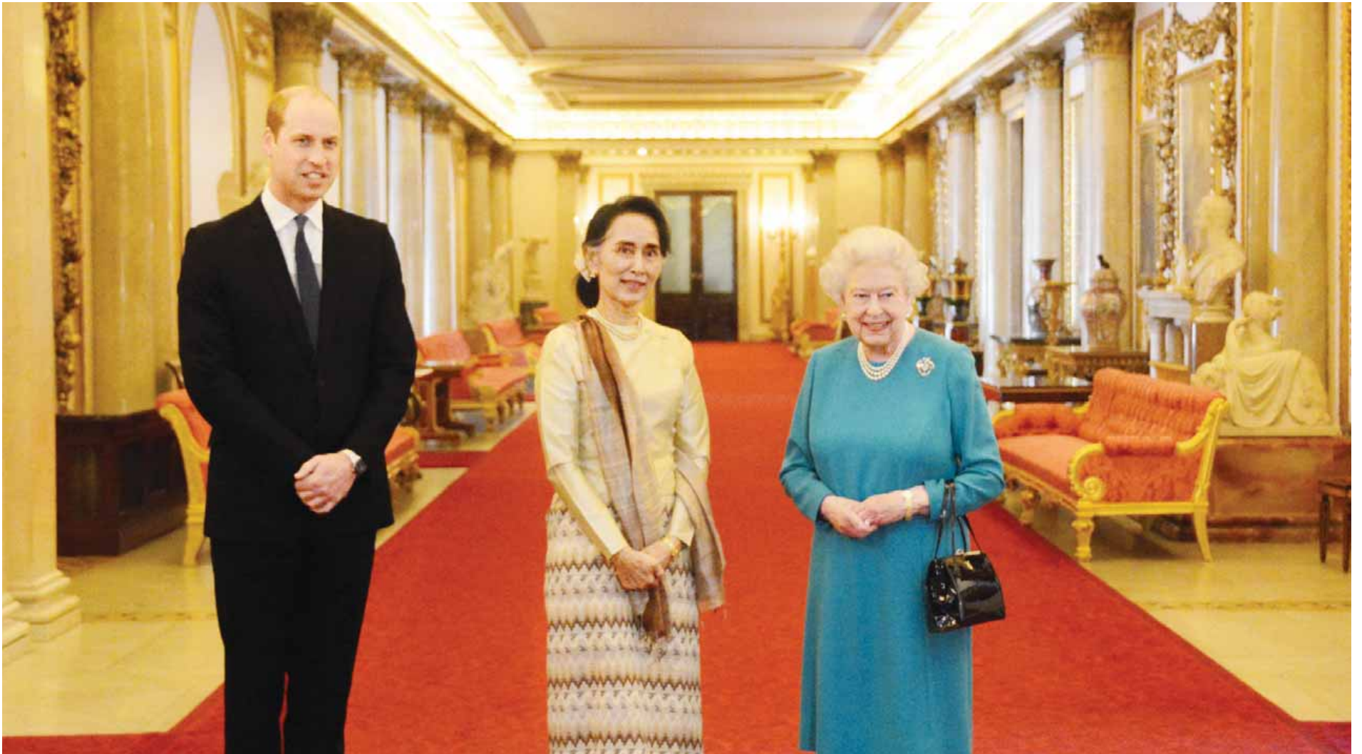
မြိတ်နီနိုင်ငံ ဘုရင်မကြီး အဲလိဇဘတ်၊ မင်းသား ဝီလျံနှင့် နိုင်ငံတော်၏အတိုင်ပင်ခံပုဂ္ဂိုလ် ဒေါ်အောင်ဆန်းစုကြည်တို့ မှတ်တမ်းတင်ဓာတ်ပုံရိုက်ကြခြင်း။