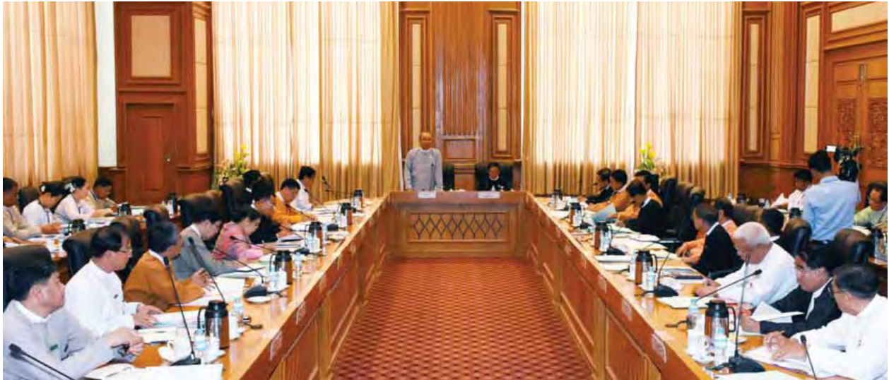
မြန်မာနိုင်ငံလွှတ်တော်ဆိုင်ရာအဖွဲ့ (Myanmar Parliamentary Union- MPU)အစည်းအဝေး ကျင်းပစဉ်။ (သတင်းစဉ်)

ဆက်လက်ပြီး မြန်မာနိုင်ငံလွှတ်တော်ဆိုင်ရာအဖွဲ့ ဒုတိယဥက္ကဋ္ဌ ပြည်သူ့လွှတ်တော်ဥက္ကဋ္ဌ ဦးဝင်းမြင့်က လွှတ်တော်သည် ဒီမိုကရေစီနိုင်ငံ၏ အခြေခံအုတ်မြစ်ဖြစ်ကြောင်း၊ လွှတ်တော်ဆိုင်ရာလုပ်ငန်းများဆောင်ရွက်ရာတွင် လွှတ်တော်ဆိုင်ရာ ဥပဒေ၊ နည်းဥပဒေများနှင့်အညီ သိရှိဆောင်ရွက်ကြရန် လိုကြောင်း၊ နိုင်ငံရေးတည်ငြိမ်ပျက်ပြားမှုများကိုဖြစ်စေမည့် ကောလာဟလသတင်းပြန့်ပွားမှုများရှိနေပါကြောင်း၊ ဒီမိုကရေစီနိုင်ငံများတွင် လွှတ်တော်၏ အခန်းကဏ္ဍသည် များစွာအရေးကြီးပါကြောင်း၊ လွှတ်တော်ကိုယ်စားလှယ်များ၏ တာဝန်နှင့် အခွင့်အရေးများကို ဥပဒေနှင့်အညီဖြစ်စေရန် လွှတ်တော်ဥက္ကဋ္ဌ ဒုတိယဥက္ကဋ္ဌများက နည်းလမ်းတကျတည့်မတ်ပေးစေလိုကြောင်း၊ ဥပဒေပြုလွှတ်တော်နှင့် အုပ်ချုပ်ရေးအဖွဲ့အစည်းတို့ကြား တစ်နိုင်သမျှ ပိုင်းခြားဆောင်ရွက်ခြင်းနှင့် အပြန်အလှန်ထိန်းကျောင်းခြင်းလုပ်ငန်းစဉ်များကို မှန်မှန်ကန်ကန် ထိထိရောက်ရောက်ဖြစ်အောင် ဆောင်ရွက်စေလိုကြောင်း၊ တင်ဒါခေါ်ယူခြင်း