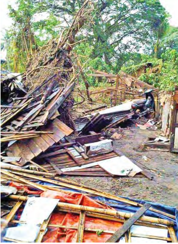
ကျေးရွာအုပ်စု ထန်းပင်ကုန်းကျေးရွာ မူလတန်းလွန်ကျောင်း အခန်းရှစ်ခန်း သွပ်မိုးများ လန်ခြင်းနှင့် ဒိုင်း၊ မြား၊ တန်းများပျက်စီးခဲ့ပြီး လေပြင်းတိုက်ခတ်မှုကြောင့် ပျက်စီးခဲ့ရသော ဒေသများတွင် သက်ဆိုင်ရာတာဝန်ရှိသူများက ဝိုင်းဝန်းကူညီဆောင်ရွက်ပေးလျက်ရှိကြောင်း သိရသည်။

တောင်ငူ မေ ၅ ပဲခူးတိုင်းဒေသကြီး တောင်ငူခရိုင်အတွင်းရှိ အုတ်တွင်း၊ ဖြူ၊ ကျောက်ကြီးမြို့နယ် တို့၌ မေ ၄ ရက်နှင့် ၅ ရက် နံနက်ပိုင်းတို့တွင် မိုးသက်လေပြင်းများတိုက်ခတ်ခဲ့၍ လူနေအိမ်များ၊ စာသင်ကျောင်းအချို့၊ သွပ်မိုးများလန်ခြင်း၊ နေအိမ်အချို့ ပြိုလဲခြင်း၊ ရန်ကုန်-မန္တလေးကားလမ်းဘေးရှိသစ်ပင်ကြီးများ လဲကျခြင်းတို့ ဖြစ်ပွားခဲ့ရာ သက်ဆိုင်ရာတာဝန်ရှိသူများက ဝိုင်းဝန်းကူညီဆောင်ရွက်ပေးလျက် ရှိကြောင်း သိရသည်။