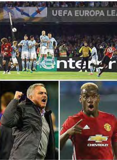
ဂိုးသမားတွေ လက်စွမ်းပြနေခဲ့လို့သာ ဂိုးသွင်းများတဲ့ ပွဲကို ပရိသတ်တွေ ကြည့်ရှုခွင့်မရခဲ့ကြတာ ဖြစ်ပါတယ်။ ဆယ်လ်တာဗီဂိုဟာ လက်ရှိလာလီဂါမှာ အဆင့်(၁၁)

နေရာအထိ ရောက်ရှိနေတဲ့ အသင်းဖြစ်ပေမယ့် ယူရိုပါလိဂ် ပြိုင်ပွဲမှာတော့ အကောင်းဆုံးခြေစွမ်းတစ်ရပ်ကို ပြသနိုင်ဆဲအသင်းဖြစ်တာကြောင့် မန်ယူအသင်း ခက်ခက်ခဲခဲ ရင်ဆိုင်ခဲ့ရတာဖြစ်ပါတယ်။ ဒါပေမယ့် ယခုတော့ ရက်ရှိဖို့ဒ်ရဲ့ သွင်းဂိုးကြောင့် ယူရိုပါလိဂ်မှာ စပိန်အသင်းတွေ နှစ်အတော်များများ လွှမ်းမိုးလာတာကို ရပ်တန့်ရဖို့ ရှိနေပါပြီ။ အဝေးကွင်းမှာ နိုင်ပွဲရယူနိုင်ခဲ့တဲ့ မန်ယူအသင်း ဗိုလ်လုပွဲ တက်ရောက်နိုင်ခြေ များသွားပြီဖြစ်ပေမယ့် တစ်ဂိုး-ဂိုးမရှိ ဆိုတဲ့ရလဒ်ဟာ ဘာမဆိုဖြစ်နိုင်ဆဲ ဖြစ်တာကြောင့် လာမယ့်ကြာသပတေးနေ့ (မေ ၁၁ ရက်)မှာ ယှဉ်ပြိုင်မယ့်ပွဲစဉ်မှာ ဘာတွေဆက်ဖြစ်လာမလဲစောင့်ကြည့်ရဖို့ ရှိနေပါတယ်။