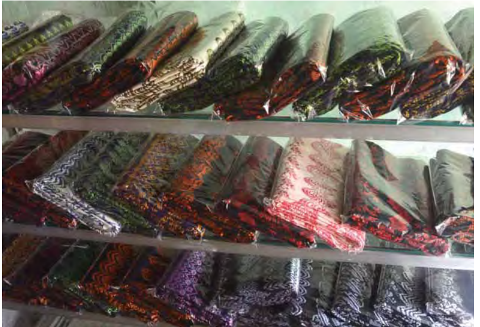
ရွှေကျားရခိုင်ရက်ကန်းလုပ်ငန်းမှ ထွက်ရှိသော ရခိုင်ရက်ကန်းထည်များ။