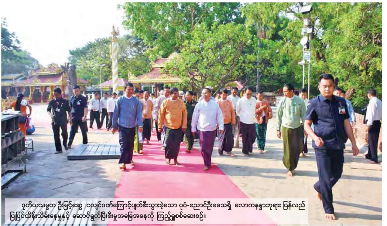
ဒုတိယသမ္မတ ဦးမြင့်ဆွေ ငလျင်ဒဏ်ကြောင့်ပျက်စီးသွားခဲ့သော ပုဂံ-ညောင်ဦးဒေသရှိ လောကနန္ဒာဘုရား ပြန်လည် ပြုပြင်ထိန်းသိမ်းရေးနှင့် ဆောင်ရွက်ပြီးစီးမှုအခြေအနေကို ကြည့်ရှုစစ်ဆေးစဉ်။

ထို့နောက် ဒုတိယသမ္မတသည် ပုဂံရှေးဟောင်းယဉ်ကျေးမှုပြုကံ၌ ကျင်းပသည့် ပုဂံဒေသငလျင်ဒဏ်သင့် စေတီ၊ ပုထိုးများ ပြန်လည်ပြုပြင်ထိန်းသိမ်း ရန်အတွက် အလှူငွေပေးအပ်လှူဒါန်းခြင်း အခမ်းအနားသို့ တက်ရောက် သည်။ စာမျက်နှာ ၈ ကော်လံ ၁ သို့ □