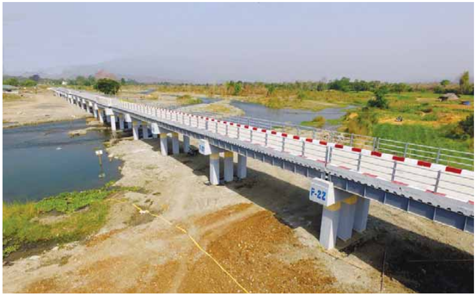
တည်ဆောက်ခြင်းဖြင့် ငမဲမြို့ ရပ်ကွက်(၂)ရပ်ကွက် ကျေးရွာ အရပ်ရပ်မှ ဘုရားဖူးပြည်သူများ စိတ်ချမ်းမြေ့စွာ ရာသီမရွေး ဖြတ်သန်းသွားလာနိုင်တော့မည်ဖြစ်ကြောင်း သိရသည်။