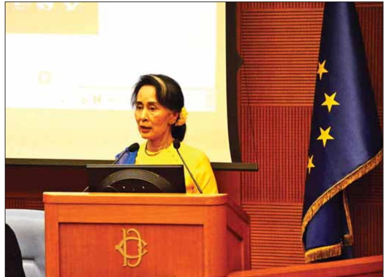
အီတလီလွှတ်တော်၌ ကျင်းပသည့် နိုင်ငံတကာလွှတ်တော်အမတ်များညီလာခံသို့ နိုင်ငံတော်၏အတိုင်ပင်ခံပုဂ္ဂိုလ် ဒေါ်အောင်ဆန်းစုကြည် တက်ရောက်မိန့်ခွန်းပြောကြားစဉ်။