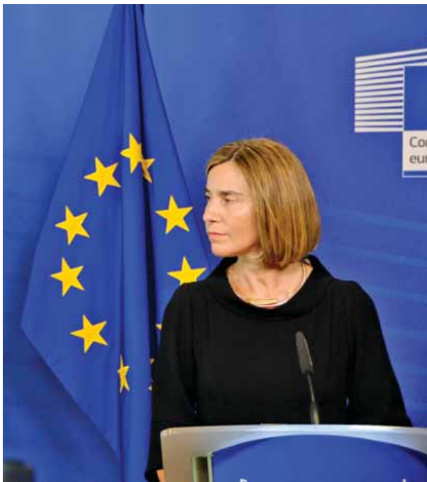
ဥရောပသမဂ္ဂ နိုင်ငံခြားရေးနှင့် လုံခြုံရေးမူဝါဒဆိုင်ရာ အဆင့်မြင့်ကိုယ်စားလှယ် နှင့် ဥရောပကော်မရှင် ဒုတိယဥက္ကဋ္ဌ Mrs. Federica Mogherini

လူသားချင်းစာနာထောက်ထားမှု အကူအညီပေးရေးကိစ္စရပ်များကိုလည်း ဆွေးနွေးခဲ့ကြပါတယ်။ လာမည့်ရက်သတ္တပတ်အတွင်း မြန်မာနိုင်ငံသို့ သွားရောက်မယ့်ကော်မရှင်နာ Stylianides ကလည်း မိမိတို့ရဲ့တွေ့ဆုံ ဆွေးနွေးမှုကို တက်ရောက်ခဲ့တဲ့အတွက် ၎င်းရဲ့ခရီးစဉ် ကြိုတင်ပြင်ဆင်ရန် အခွင့်အလမ်းလည်း ရခဲ့ပါတယ်။ မြန်မာနိုင်ငံရဲ့ ဖွဲ့စည်းပုံအခြေခံဥပဒေ ပြင်ဆင်နိုင်မယ့် သဘောထားအမြင်များနဲ့ နိုင်ငံရေးလုပ်ငန်းစဉ်များကိုလည်း ဆွေးနွေးခဲ့ပါတယ်။ မိမိတို့အနေနဲ့ စိုးရိမ်မကင်းဖြစ်ရတဲ့ကိစ္စဖြစ်ပြီး လူမှုအသိုင်း အဝိုင်းအားလုံးအတွက် အဓိက လူသားချင်းစာနာထောက်ထားမှု အကူ အညီများ ပေးအပ်လျက်ရှိတဲ့ ရခိုင်ပြည်နယ်အခြေအနေများကိုလည်း ဆွေးနွေး ခဲ့ပါတယ်။ ဒီအချက်တွေဟာ ရှေ့ရက်သတ္တပတ်အတွင်း မြန်မာနိုင်ငံသို့ သွားရောက်မယ့် ကော်မရှင်နာ Stylianides ရဲ့ လုပ်ငန်းစဉ်များရဲ့ တစ်စိတ်