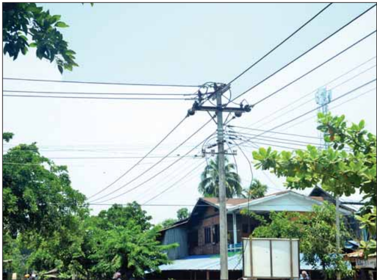
ဓာတ်အားခွဲရုံတည်ဆောက်ပြီးပါက အဆင်သင့်ပို့လွှတ်ပေးနိုင်သော ၁၁ ကေပီဇီ ဓာတ်အား ကြီးများကို တွေ့ရစဉ်။

ဘူးသီးတောင်မြို့ပေါ်မှ ဒေသခံဖြစ်သူ ဦးကျော်သာမောင်က ပြောသည်။ ယခုအခါ ဘူးသီးတောင်မြို့တွင် ထရန်စဖော်မာ သုံးလုံးဖြင့် မိတာအလုံး ပေါင်းတစ်ထောင်ကျော်ကို စီးစက်ကြီးများဖြင့် မီးပေးလျက်ရှိပြီး မကြာမီကာလတွင် System ဓာတ်အားလိုင်းမှ ဓာတ်အားများပိုလွှတ်နိုင်ပြီး ၆၆ ကေပီဇီဓာတ်အားခွဲရုံများ တည်ဆောက် ပြီးစီးပါက ရသေ့တောင်၊ ဘူးသီးတောင်နှင့် မောင်တောမြို့ပေါ်နေ ပြည်သူများ လျှပ်စစ်မီး ယခုထက်အပြည့်အဝ သုံးစွဲနိုင်မည်ဖြစ် ကြောင်း သိရသည်။ သတင်း- မောင်စိန်လွင်လှကျော်(ဘူးသီးတောင်)