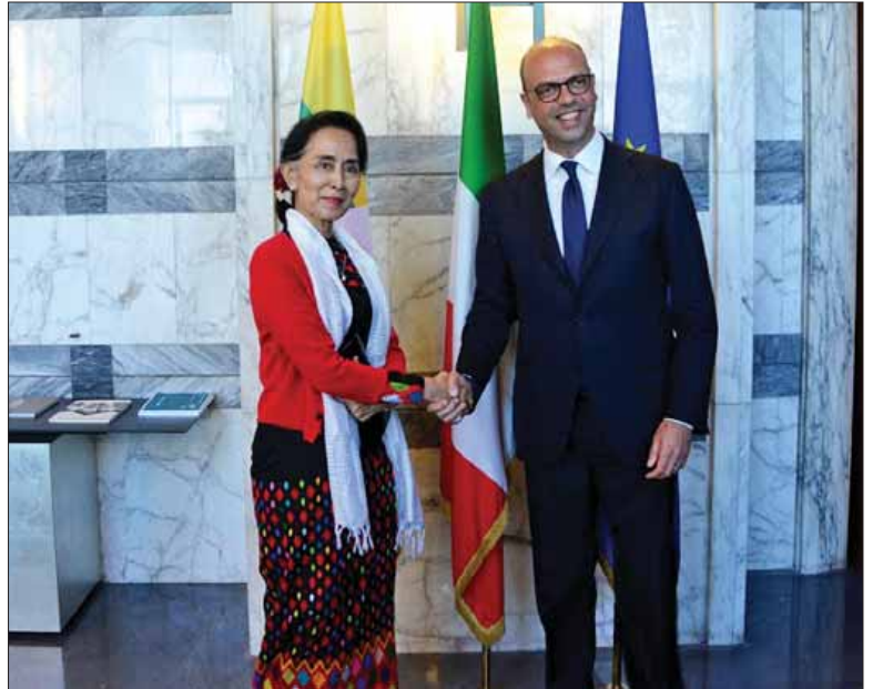
နိုင်ငံတော်၏အတိုင်ပင်ခံပုဂ္ဂိုလ် ဒေါ်အောင်ဆန်းစုကြည်နှင့် အီတလီနိုင်ငံခြားရေးဝန်ကြီး Mr. Angelino Alfano တို့ တွေ့ဆုံစဉ်။ (သတင်းစဉ်)

ရှေ့ဖို့မှ နိုင်ငံတော်၏အတိုင်ပင်ခံပုဂ္ဂိုလ်သည် မွန်းလွဲ ၂ နာရီတွင် အီတလီ လွှတ်တော်၌ Migration and Gender Equality ခေါင်းစဉ်ဖြင့်ကျင်းပသည့် နိုင်ငံတကာလွှတ်တော်အမတ်များညီလာခံသို့ အထူးပိတ်ကြားထားသူအဖြစ် တက်ရောက်၍ အဖွင့်မိန့်ခွန်း ပြောကြားသည်။ နိုင်ငံတော်၏အတိုင်ပင်ခံပုဂ္ဂိုလ်သည် မြန်မာ-အီတလီ ပူးပေါင်း ဆောင်ရွက်ရေးအသင်းဥက္ကဋ္ဌ ပါမောက္ခ Vincenzo Scotti နှင့်အဖွဲ့အား မေ ၃ ရက် ဒေသစံတော်ချိန် ညနေ ၄ နာရီခွဲတွင် ရောမမြို့ရှိ ခေတ္တတည်းခို သည့် Boscolo Hotel ၌ တွေ့ဆုံခဲ့သည်။