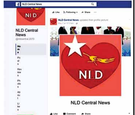
သတင်းမှားများ ဖြန့်ချိလျက်ရှိသော NLD Central News (ယခင် NLD သတင်းသီးသန့်)အမည်ရှိ Facebook Page အား တွေ့ရစဉ်။