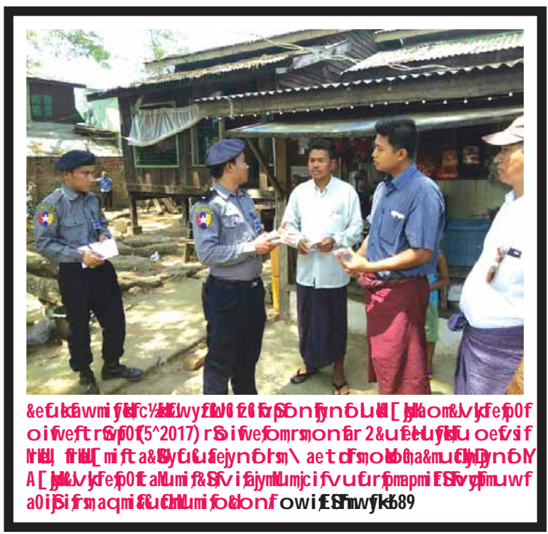
ပဲခူးတိုင်းဒေသကြီးပြန်ကြားရေးနှင့် ပြည်သူ့ဆက်ဆံရေးဦးစီးဌာနမှ စံ (၅) ချက်ညီ စာကြည့်တိုက်များအဖြစ် ကျေးရွာစာကြည့်တိုက် ၄၈၀၊ ရပ်ကွက်စာကြည့်တိုက် ၃၁ ခု စုစုပေါင်း ၅၁၁ ခု ဖွင့်လှစ်ပေးပြီးဖြစ်သည်။

ဆောက်လုပ်ဖွင့်လှစ်ထားရှိမှု အခြေအနေ၊ ပြည်သူများစာပေကိုအလွယ်တကူ လက်လှမ်းမီ ဖတ်ရှုနိုင်ရေးအတွက် စေတနာ့ဝန်ထမ်းများနှင့်ပူးပေါင်း၍ Mobile Library များထားရှိမှုအခြေအနေ၊ အစိုးရသစ်လက်ထက်တွင်နိုင်ငံတော်အစိုးရ၏ တိုင်းကျိုးပြည်ပြုဆောင်ရွက်မှုများနှင့် ဒေသတွင်းအစိုးရ၏ ဆောင်ရွက်ချက်မှတ်တမ်းစာတမ်းပုံများ၊ မြေစိုက်ရန်ကပ်ပြဘတ်များ၊ အသိပေးကြော်ငြာချက်များဆောင်ရွက်မှုအခြေအနေ၊ တိုင်းဒေသကြီးနှင့် ခရိုင်အဆင့်တို့တွင် ကလေးစာပေပွဲတော် ဆောင်ရွက်ခဲ့မှုအခြေအနေ၊ တိုင်းရင်းသားရေးရာဝန်ကြီးဌာနနှင့် ပူးပေါင်း၍ တိုင်းရင်းသားလူမျိုးစုများနှင့်ပတ်သက်သည့် စာပေ၊ ဘာသာစကား၊ ယဉ်ကျေးမှု ဆောင်ရွက်မှုအခြေအနေများကို ရှင်းလင်းပြောကြားသည်။ ပဲခူးတိုင်းဒေသကြီးအတွင်း ပြန်ကြားရေးနှင့်ပြည်သူ့ဆက်ဆံရေးဦးစီးဌာနမှ စံ (၅) ချက်ညီ စာကြည့်တိုက်များအဖြစ် ကျေးရွာစာကြည့်တိုက် ၄၈၀၊ ရပ်ကွက်စာကြည့်တိုက် ၃၁ ခု စုစုပေါင်း ၅၁၁ ခု ဖွင့်လှစ်ပေးပြီးဖြစ်သည်။ အဆိုပါ လုပ်ငန်းညှိနှိုင်းအစည်းအဝေးသို့ စည်ပင်သာယာရေးနှင့် လူမှုရေးဝန်ကြီး၊ ကရင်တိုင်းရင်းသားလူမျိုးရေးရာဝန်ကြီး၊ တိုင်းဒေသကြီး၊ ခရိုင်၊ မြို့နယ်ပြန်ကြားရေးနှင့် ပြည်သူ့ဆက်ဆံရေးဦးစီးဌာန တာဝန်ခံဦးစီးမှူးများ တက်ရောက်ကြကြောင်း သိရသည်။ တင်စိုး(ပဲခူး)