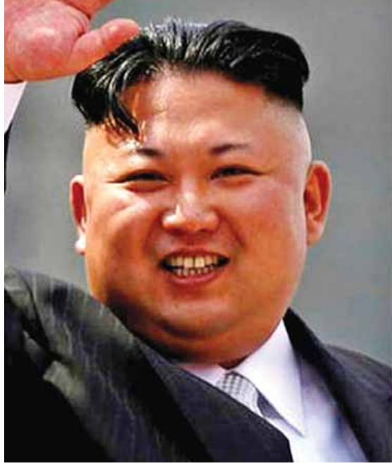
နှစ်နိုင်ငံဆက်ဆံရေးကို ဝေဖန်ရှုတ်ချမှုများပြုလုပ်ခြင်းသည် ယင်းသို့ ဝေဖန်ရှုတ်ချမှုများပြုလုပ်ခြင်းသည် နိုင်ငံ၏ တရားဝင်အခွင့်အရေးများကို