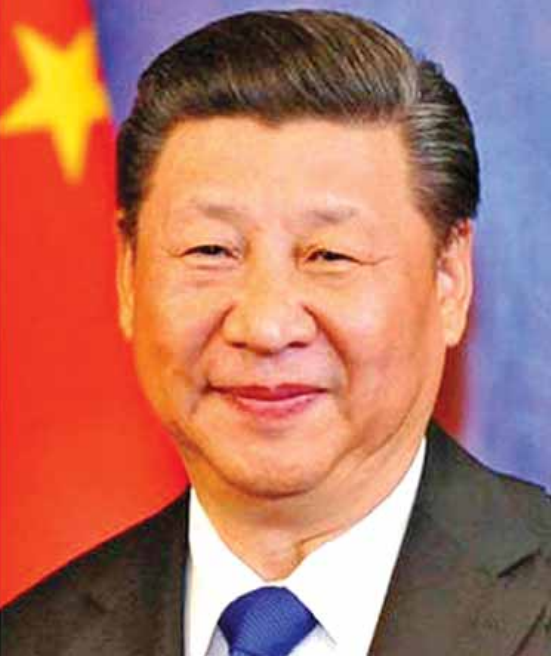
မြောက်ကိုရီးယား တမင်တကာ ချိုးဖောက်ခြင်းဖြစ်သည့်အပြင် အိမ်နီးချင်းနိုင်ငံတစ်နိုင်ငံကို သိသာထင်ရှားစွာ

ခြိမ်းခြောက်မှုပြုလုပ်ခဲ့ခြင်း ဖြစ်သည်ဟု မှတ်တမ်းစာစုတွင် ပါရှိသည်။