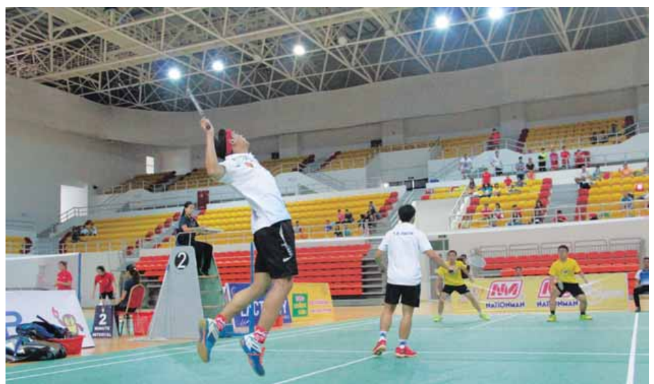
ရန်ကုန်တိုင်းဒေသကြီးအသင်းနှင့် မန္တလေးတိုင်းဒေသကြီးအသင်းတို့သည် လည်းကောင်း၊ အမျိုးသမီးဗိုလ်လုပွဲ ပွဲစဉ်အဖြစ် ရန်ကုန်တိုင်း ဒေသကြီးအသင်းနှင့် ရှမ်းပြည်နယ်အသင်းတို့သည် မေ ၅ ရက်တွင် ဝဏ္ဏသိဒ္ဓိအားကစားပြိုင်ပွဲရုံ (C)၌ ယှဉ်ပြိုင်ကစား သွားကြမည်ဖြစ်သည်။ ဗိုလ်လုပွဲများအပြီး ဆုပေးပွဲအခမ်းအနားကို ဆက်လက် ကျင်းပသွားမည်ဖြစ်ကြောင်း သိရသည်။ (မောင်မောင်ဇော်)

နေပြည်တော် မေ ၄ - နိုင်ငံ့ဂုဏ်ဆောင် မျိုးဆက်သစ်အားကစားသမားများ စဉ်ဆက်မပြတ် ထွက်ပေါ်လာစေရန်ရည်ရွယ်၍ တိုင်းဒေသကြီးနှင့်ပြည်နယ် ကြက်တောင် အားကစားပြိုင်ပွဲ ဆီမီးပိုင်နယ်ပွဲစဉ်များကို ယနေ့နံနက် ၉နာရီမှ စတင်၍ ဝဏ္ဏသိဒ္ဓိအားကစားပြိုင်ပွဲရုံ (C) ၌ ကျင်းပရာ ဆီမီးပိုင်နယ်အမျိုးသားပွဲစဉ်များအဖြစ် မန္တလေးတိုင်းဒေသကြီးအသင်းနှင့် တနင်္သာရီတိုင်း ဒေသကြီးအသင်းတို့ ယှဉ်ပြိုင်ကစားကြရာ မန္တလေးတိုင်းဒေသကြီးအသင်းက လည်းကောင်း၊ ရှမ်းပြည်နယ်အသင်းနှင့် ရန်ကုန်တိုင်းဒေသကြီးအသင်းတို့ ယှဉ်ပြိုင်ကစားကြရာ ရှမ်းပြည်နယ်အသင်းကလည်းကောင်း အသီးသီးအနိုင်ရရှိခဲ့သည်။