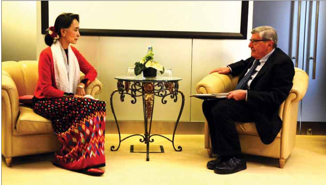
နိုင်ငံတော်၏အတိုင်ပင်ခံပုဂ္ဂိုလ် ဒေါ်အောင်ဆန်းစုကြည်နှင့် မြန်မာ-အီတလီ ပူးပေါင်းဆောင်ရွက်ရေးအသင်းဥက္ကဋ္ဌ ပါမောက္ခ Vincenzo Scotti တို့ တွေ့ဆုံဆွေးနွေးစဉ်။ (သတင်းစဉ်)