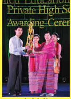
ဖောင်လွင်ပင်သိန်း၊ ဆက်ရ - ၀၄၄၂ (ဘာသာစုံဂုဏ်ထူးရှင်)

United Education Centre ကိုယ်ပိုင်အထက်တန်းကျောင်း KG - Grade 10