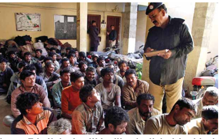
နိုင်ငံတကာရေကြောင်း ပိုင်နက်အတွင်း နယ်နိမိတ် နှစ်နိုင်ငံစလုံး၏ ရေပိုင်နက်များသို့ ချိုးဖောက်ဝင်ရောက်မှု သတ်မှတ်ချက်များကို သိရှိနိုင်စွမ်းနည်းပါးပြီး များ ဖြစ်ပွားရခြင်းဖြစ်သည်။ ဆင်ယူ။

အိန္ဒိယနှင့်ပါကစ္စတန်တို့မှ အများစုဖြစ်သော ငါးဖမ်းရေယာဉ်များသည် ၎င်းတို့ရေယာဉ် တည်ရှိရာနေရာ အတိအကျကို သိရှိနိုင်သည့် နည်းပညာချို့တဲ့မှုများကြောင့်