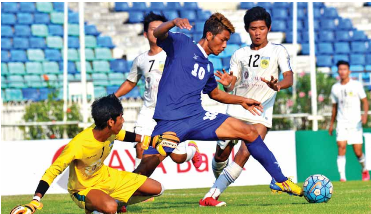
မဟာယူနိုက်တက်နှင့်တက္ကသိုလ်အသင်းတို့ ယှဉ်ပြိုင်နေစဉ်။