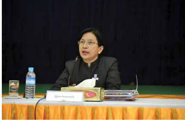
အမြဲတမ်းအတွင်းဝန် ဒေါ်နုနုယဉ်။

အမြဲတမ်းအတွင်းဝန်က ပြောကြားသည်။ တရားဥပဒေစိုးမိုးရေး၊ တရားမျှတမှုနှင့် ပွင်းလင်းမြင်သာမှု တိုးတက် မြင့်မားလာစေရန်အတွက် ပြည်ထောင်စုရွှေ့နေချုပ်ရုံးသည် ၂၀၁၅ - ၂၀၁၉ မဟာဗျူဟာစီမံကိန်းကို ရေးဆွဲခြင်း၊ ပြည်ပနည်းပညာများ ရယူရန်အတွက် JICA၊ KOICA၊ IDLO၊ MLAW Singapore တို့နှင့် နားလည်မှုစာချွန်လွှာ များ လက်မှတ်ရေးထိုးပြီး UNDP USAID တို့ ပါဝင်ပူးပေါင်းဆောင်ရွက် ခြင်း၊ အစိုးရသစ်လက်ထက်တွင် ဒီမိုကရေစီသံရုံးနှင့် နားလည်မှုစာချွန်လွှာ ရေးထိုး၍ လူ့အခွင့်အရေးနှင့် တရားဥပဒေစိုးမိုးရေးလုပ်ငန်းများ ဆောင်ရွက် လျက်ရှိပါကြောင်း ပြောကြားသည်။ စွမ်းဆောင်ရည်မြင့်မားသော ဥပဒေအရာရှိများဖြစ်စေရန် လိုအပ်သော ဖြည့်ဆည်းဆောင်ရွက်မှုပေးရမည့် အချက်များသိရှိစေရန်အတွက် ဆက်စပ် အဖွဲ့အစည်းများဖြစ်သော တရားစီရင်ရေးဆိုင်ရာအဖွဲ့များနှင့် တွေ့ဆုံ၍ စစ်တမ်းကောက်ယူပြီး သုတေသနပြု၍ သင်တန်းများပေးခြင်း၊ ဥပဒေအရာရှိ များ၏ ပညာရပ်ပိုင်းဆိုင်ရာ စီမံခန့်ခွဲမှုဆိုင်ရာစွမ်းရည်များ ဖွံ့ဖြိုးစေရန်နှင့် အမှုများကြန့်ကြာမှုမရှိစေရေးအတွက် တစ်စုတည်းပေါင်းစပ်ထားသော အမှုစီမံ ခန့်ခွဲမှုနှင့် စာရင်းဇယား ကိန်းဂဏန်းအချက်အလက် အစီရင်ခံစာများကို နည်းပညာအသုံးပြုပြီး ဆောင်ရွက်သော (Case Management) စနစ်ကို USAID နှင့်ပူးပေါင်း၍ Pilot Law Office များ ထူထောင်နိုင်ရေးအတွက် စီမံဆောင်ရွက်လျက်ရှိခြင်း၊ ပြည်ထောင်စုရွှေ့နေချုပ်ရုံး၏ မဟာဗျူဟာစီမံကိန်း (၂၀၁၅-၂၀၁၉)၏ ပထမဦးစားပေးလုပ်ငန်းအစီအစဉ်များ အကောင်အထည် ဖော် ဆောင်ရွက်ပြီးစီးမှုအစီရင်ခံစာ ရေးသားပြုစုပြီးဖြစ်ပါ၍ ထုတ်ဝေဖြန့်ချိရန် စီစဉ်ဆောင်ရွက်လျက်ရှိခြင်း ဖြစ်ပါကြောင်း အမြဲတမ်းအတွင်းဝန်က ပြောကြား