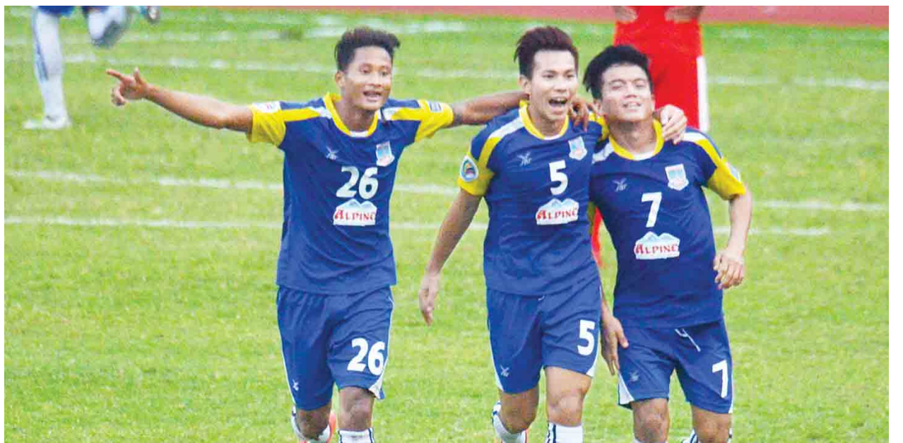
AFC Cup ပြိုင်ပွဲ အုပ်စုနောက်ဆုံးပွဲကစားရမည့် ရတနာပုံအသင်း။