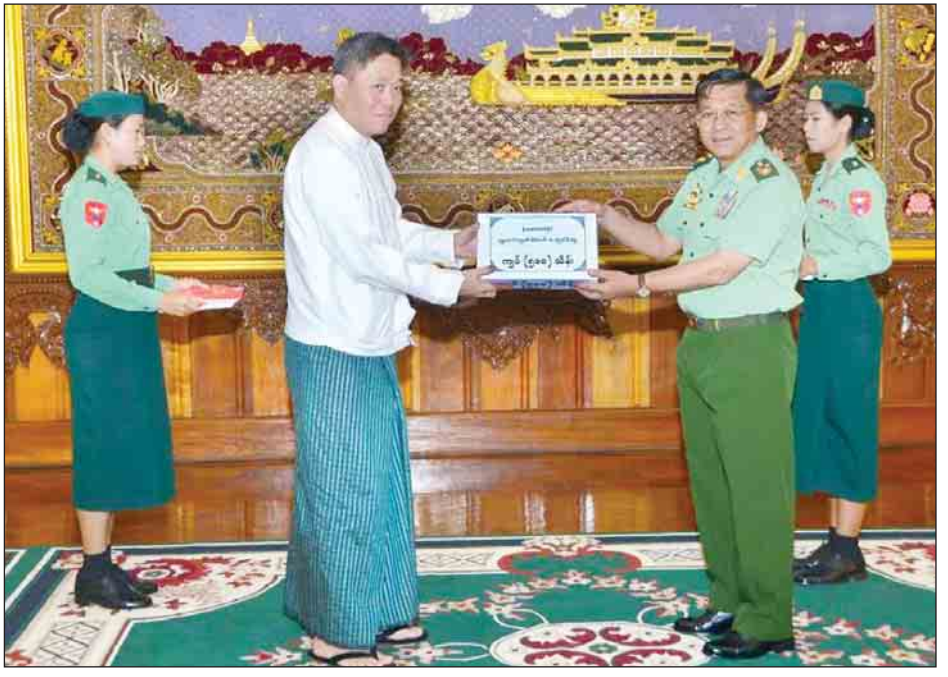
အဆိုပါ သီရိမင်္ဂလာမဟာသာသနာ့ဗိမာန်တော်ကြီးအတွက် ယနေ့ကျင်းပသည့် ဒုတိယအကြိမ် အလှူငွေ ပေးအပ်ပွဲတွင် အလှူရှင်များ၏ လှူဒါန်းငွေ စုစုပေါင်းမှာ ငွေကျပ်သိန်း ၇၃၉၀ ကျော်ဖြစ်ပြီး ပထမအကြိမ်အပါအဝင် လှူဒါန်းငွေ စုစုပေါင်းမှာ ငွေကျပ်သိန်း ၉၂၉၀ ကျော်ဖြစ်ကြောင်း သိရှိရသည်။ ယခုဆောက်လုပ်နေသည့် သာသနာ့ဗိမာန်တော်ကြီးသည် အလှူပေး ၁၈၆ ပေ၊ အနံ ၇၂ ပေရှိ နှစ်ထပ်အဆောက်အအုံဖြစ်ပြီး အင်းစိန်မြို့နယ် မင်းဓမ္မကုန်းမြေရှိ

အခမ်းအနားအပြီးတွင် တပ်မတော်ကာကွယ်ရေး ဦးစီးချုပ်နှင့်အဖွဲ့ဝင်များက အခမ်းအနားတက်ရောက်လာကြသည့် အလှူရှင်များအား ရင်းရင်းနှီးနှီးလိုက်လံ နှုတ်ဆက်ပြီး ခင်းကျင်းပြသထားသည့် သာသနာ့ဗိမာန်တော်ကြီး တည်ဆောက်ရန် လျာထားဆောင်ရွက်နေမှု မှတ်တမ်းဓာတ်ပုံများကို ကြည့်ရှုကြသည်။