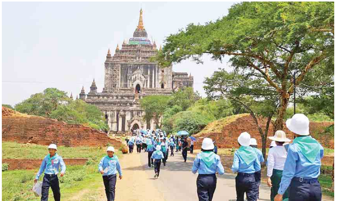
အဋ္ဌမတန်း ဘက်စုံပညာထူးချွန်ကျောင်းသား ကျောင်းသူများ ပုဂံဒေသရှိ သဗ္ဗညုဘုရားအား ဖူးမြော်လေ့လာကြစဉ်။