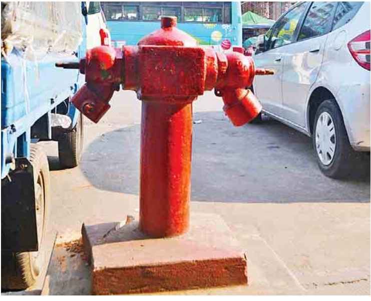
ပုဇွန်တောင်မြို့နယ် မဟာဗန္ဓုလလမ်းမကြီးပေါ်ရှိ လမ်း (၅၀) နှင့် (၅၁) လမ်းကြားတွင် မီးသတ်ရေပိုက်ငုတ် တပ်ဆင်ထားသည်ကို တွေ့ရစဉ်။