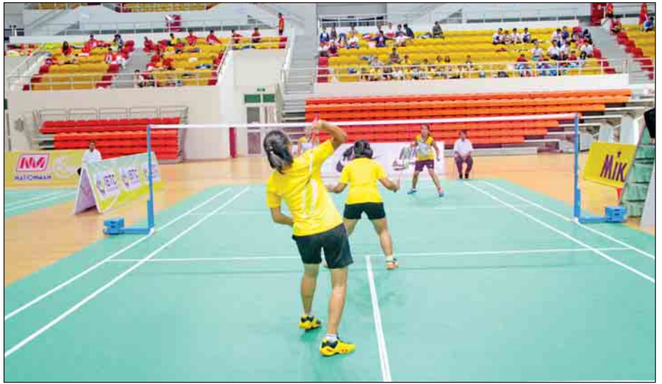
ဝင်ရောက်ယှဉ်ပြိုင်၍ စုစုပေါင်း အားကစားသမား ၁၇၅ ဦး ဝင်ရောက်ယှဉ်ပြိုင်ကြပြီး မေ ၁ ရက်မှ ၅ ရက်အထိ နေ့စဉ်နံနက် ၉ နာရီမှစတင်ကာ ဝဏ္ဏသိဒ္ဓိအားကစားပြိုင်ပွဲရုံ (C) တွင် ယှဉ်ပြိုင်ကစားသွားကြမည်ဖြစ်သဖြင့်

အဆိုပါ ၂၀၁၇ ခုနှစ် တိုင်းဒေသကြီးနှင့် ပြည်နယ် ကြက်တောင်အားကစားပြိုင်ပွဲကို တိုင်းဒေသကြီးနှင့် ပြည်နယ်မှ အမျိုးသား ၁၅ သင်း၊ အမျိုးသမီး ၁၁ သင်း