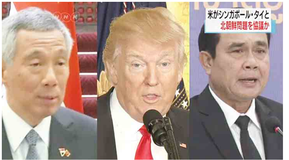
အိမ်ဖြူတော်အရာရှိက ၎င်း၏ယူဆချက်ကိုဖော်ပြသည်။ ကြောင်း ၎င်းက ထပ်မံပြောကြားခဲ့သည်။ ထို့ကြောင့် အမေရိကန်နှင့် အရှေ့တောင်အာရှ ဒေသတွင်း နိုင်ငံများအကြား ပူးပေါင်းဆောင်ရွက်မှုများ လိုအပ် အင်နိုအိတ်ချ်ကေ။

ပြုလမ်း၏ နျူကလီးယားလက်နက် ဖွံ့ဖြိုးလာမှုသည် ကမ္ဘာလုံးဆိုင်ရာ ခြိမ်းခြောက်မှုကို ဖြစ်စေသည်ဟု