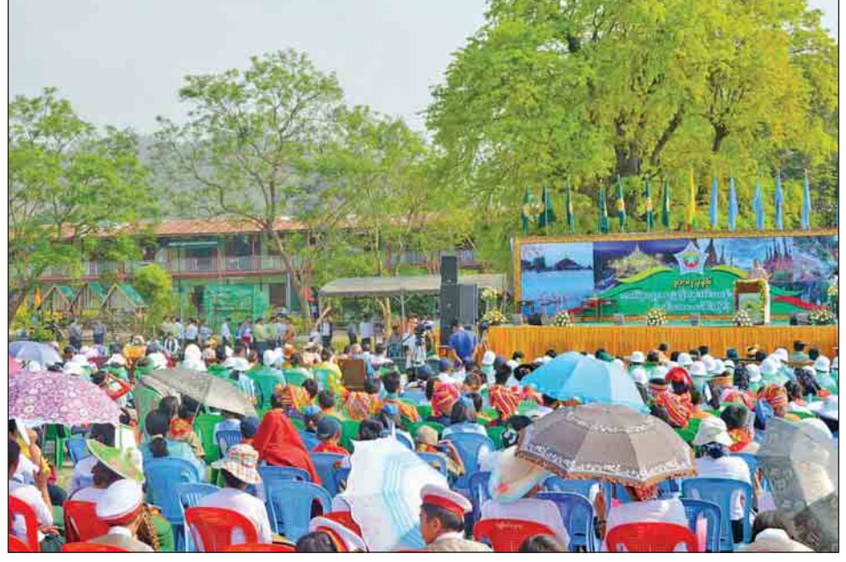
များမှ ပညာရည်ထူးချွန်ထက်မြက်ပြီး ကျန်းမာသန်စွမ်း၍ စာရိတ္တကောင်းမွန်သူများကို ဘက်စုံပညာထူးချွန်လူငယ်များအဖြစ် သတ်မှတ်ရွေးချယ်၍ ဂုဏ်ပြုချီးမြှင့်ခြင်းအစီအစဉ်ကို ၂၀၁၂-၂၀၁၃ ပညာသင်နှစ်မှစ၍ ဆောင်ရွက်ခဲ့သည်မှာ ယခုအခါ ငါးနှစ်တိုင်ခွဲပြုဖြစ်ပါကြောင်း။

ထို့ကြောင့် နိုင်ငံတော်၏ လူ့စွမ်းအားအရင်းအမြစ်များဖြစ်သည့် ကျောင်းသား ကျောင်းသူများ ပညာရည်မြင့်မားရေးနှင့် နိုင်ငံ့သားကောင်းများအဖြစ် ပေါ်ထွန်းလာစေရေးအတွက် အခြေခံပညာကျောင်းသား ကျောင်းသူ