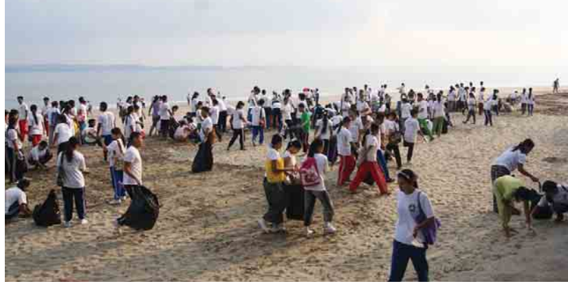
စုပေါင်းသန့်ရှင်းရေးပြုလုပ်ရခြင်းသည် (နဒီသောင် ယံ) ပင်လယ်ကမ်းခြေသန့်ရှင်းသာယာလှပစေရန် နှင့် ကမ်းခြေတစ်လျှောက် ပြည်သူများ ဖျော်ရွှင်စွာ သွားလာနိုင်စေရန် ရည်ရွယ်၍ ပြုလုပ်ရခြင်းဖြစ် ကြောင်း သိရသည်။ မြို့မဝလင်း(ခရိုင်ပြန်/ဆက်)

ကျောက်ဖြူ မေ ၁ ကျောက်ဖြူခရိုင် စီမံခန့်ခွဲရေးကော်မတီ ဥက္ကဋ္ဌနှင့် ဝန်ထမ်းများ၊ မြို့နယ်စီမံခန့်ခွဲရေးကော်မတီဥက္ကဋ္ဌ နှင့် ဝန်ထမ်းများ၊ မြို့နယ်ရဲတပ်ဖွဲ့နှင့် တပ်ရင်း တပ်ဖွဲ့ဝင်များ၊ ခရိုင်/မြို့နယ်ဌာနဆိုင်ရာများနှင့် ဝန်ထမ်းများ၊ ပညာရေးကောလိပ်မှ ကျောင်းအုပ် ကြီးနှင့် ဆရာ ဆရာမများ၊ လူမှုရေးအသင်းအဖွဲ့ များနှင့် မြို့မိမြို့ဖများ စုစုပေါင်းအင်အား ၁၅၀၀ ခန့်သည် ဧပြီ ၂၉ ရက် နံနက် ၇ နာရီက ကျောက် ဖြူမြို့ ပြိုင်ကမ်းခြေ၊ ဦးဥက္ကဋ္ဌမပန်းခြံ၊ နဒီသောင်ယံ ကမ်းခြေတစ်လျှောက်၌ စုပေါင်းသန့်ရှင်းရေး ပြုလုပ်ခဲ့ကြသည်။ မိဘပြည်သူများ နံနက်ပိုင်း၊ ညနေပိုင်းတွင် ကိုယ် လက်လှုပ်ရှားမှုများနှင့် လမ်းလျှောက်အပန်းဖြေ သည့် နေရာတစ်ခုလည်းဖြစ်သည်။ သင်္ကြန်ကာလ တွင်စည်းကမ်းမဲ့စွာစွန့်ပစ်သောအမှိုက်များ၊ ပင် လယ်ပြင်မှ မျောပါလာသောအမှိုက်သရိုက်များကို