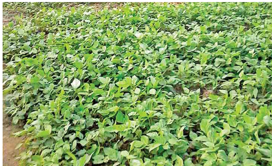
ရခိုင်ပြည်နယ်အတွင်းရှိ မတ်ပဲစိုက်ခင်းများကို တွေ့ရစဉ်။