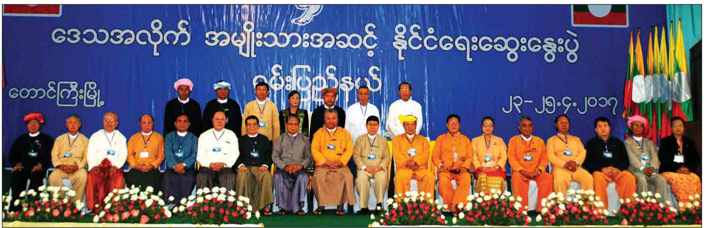
ရှမ်းပြည်နယ်ဒေသအလိုက် အမျိုးသားအဆင့်နိုင်ငံရေးဆွေးနွေးပွဲသို့ တက်ရောက်လာကြသူများ စုပေါင်းမှတ်တမ်းတင်ဓာတ်ပုံရိုက်ကြစဉ်။

ပြည်နယ်ဝန်ကြီးချုပ်က ယနေ့ကျင်းပသည့် ဒေသအလိုက်အမျိုးသားအဆင့် နိုင်ငံရေးဆွေးနွေးပွဲမှတစ်ဆင့် ပဋိပက္ခများ ချုပ်ငြိမ်းရေး၊ နိုင်ငံရေးပြဿနာများကို နိုင်ငံရေးနည်းလမ်းဖြင့် ငြိမ်းချမ်းစွာအဖြေရှာနိုင်ရေး၊ နောင်အနာဂတ် မျိုးဆက်သစ်လူငယ်များ စိတ်ရောကိုယ်ပါ ငြိမ်းချမ်းလုံခြုံစွာ ရှင်သန်ကြီးပြင်းလာနိုင်စေရေး၊ စစ်မှန်သော ငြိမ်းချမ်းရေးဖြစ်စဉ်ကို အမြန်ဆုံးအကောင်အထည်ဖော်နိုင်ရေးတို့အတွက် အားလုံးယုံကြည်မှုရှိရှိဖြင့် ဆွေးနွေးညှိနှိုင်းပြီး အားလုံးမျှော်လင့်တောင့်တနေသော ဒီမိုကရေစီဖက်ဒရယ်ပြည်ထောင်စုနိုင်ငံတော်အဖြစ်သို့ လျင်မြန်စွာ ရောက်ရှိနိုင်မည်ဖြစ်ကြောင်း ပြောကြားသည်။