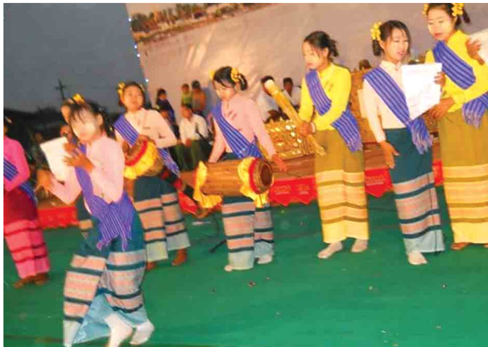
ကိုမင်း(အင်းတော်)

ယခုနှစ်မိုးဦးတွင် တပ်ကုန်းမြို့နယ်အတွင်းရှိ ကျေးရွာများ၌ အစိုဓာတ်ရရှိသော လယ်ယာမြေများတွင် သီးနှံစိုက်ပျိုးရန် ထွန်ယက်နေကြပြီဖြစ်ကာ မြေအစိုဓာတ်ရရှိမှုအနေအထားအပေါ် မူတည်ပြီး နှမ်း၊ ပဲတီစိမ်းကိုသာ အများဆုံးစိုက်ပျိုးကြမည်ဖြစ်၍ ပဲတီစိမ်းမျိုး တစ်ပြည်က ကျပ် ၃၅၀၀၊ နှမ်းမျိုးက ကိုယ်ပိုင်နှမ်းမျိုးအသုံးများကြသည်ဟု သိရပြီး၊ တချို့တောင်သူများမှာ နောက်ပိုင်းတွင် ရာသီဥတုအနေအထားကြည့်၍ ပြောင်းသီးနှံစိုက်ပျိုးကြမည်ဟု သိရသည်။