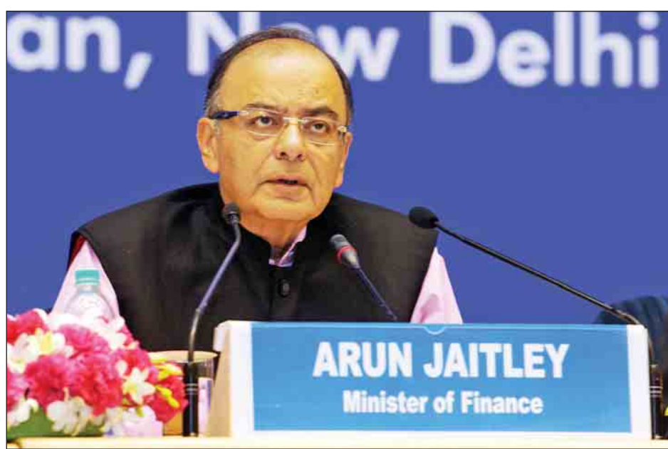
ကမ္ဘာ့ဘဏ်တို့၏ နွေဦးပေါက်ရာသီ အစည်းအဝေးများ တက်ရောက်ရန် ဝါရှင်တန်သို့ ဧပြီ ၂၀ ရက်တွင် ရောက်ရှိလာခဲ့သည်။ ဂျိတ်လီသည် အဆိုပါအစည်းအဝေးများအပြင် ဂျီ-၂၀ ဘဏ္ဍာရေးဝန်ကြီးများ၏ အစည်းအဝေးအပါအဝင် နိုင်ငံပေါင်းစုံ တက်ရောက်မည့်အစည်းအဝေးများသို့ လည်း တက်ရောက်ရန် စီစဉ်ထားသည်။

ဝါရှင်တန် ဧပြီ ၂၃ ကမ္ဘာတစ်ဝန်းမှ ကာကွယ်ရေးနည်းပညာ ကုမ္ပဏီများအနေဖြင့် အိန္ဒိယကုမ္ပဏီများနှင့်ပူးပေါင်းကာ ထုတ်လုပ်ရေးလုပ်ငန်းများ ထူထောင်နိုင်ရေးအတွက် မြှင့်တင်အားပေးမည်ဟူသော မူဝါဒကို မိမိတို့ ချမှတ်ထားကြောင်း အိန္ဒိယဘဏ္ဍာရေးဝန်ကြီး အေရှန်ဂျိတ်လီက ပြောကြားလိုက်သည်။ မူဝါဒရေးရာ ပြင်ဆင်ပြောင်းလဲမှုအဖြစ် အိန္ဒိယနိုင်ငံသည် ကာကွယ်ရေးနည်းပညာဆိုင်ရာ ထုတ်ကုန်များကို ကမ္ဘာတစ်လွှားမှ ဝယ်ယူမည်သာမက နိုင်ငံတကာရှိ ကာကွယ်ရေးနည်းပညာ ကုမ္ပဏီများက ဒေသခံကုမ္ပဏီများနှင့် ပူးပေါင်းကာ အိန္ဒိယနိုင်ငံအတွင်း ထုတ်လုပ်ရေးစက်ရုံများ ထူထောင်ခြင်းကိုပါ အားပေးသွားမည်ဖြစ်ကြောင်း အမေရိကန်ဆိုင်ရာ အိန္ဒိယသံအမတ်ကြီး နေဗာတေးဆာနားက ကမကထပြုသော ဧည့်ခံပွဲအခမ်းအနားတွင် ပြောကြားသည်။ အိန္ဒိယဗဟိုအစိုးရအဖွဲ့၏ မူဝါဒရေးရာ ပြင်ဆင်ပြောင်းလဲမှုနှင့်အညီ ကာကွယ်ရေးပစ္စည်းထုတ်လုပ်ရေးမူဝါဒကို ပြောင်းလဲကျင့်သုံးသွားမည်ဖြစ်ကြောင်း ဘဏ္ဍာရေးဝန်ကြီး ဂျိတ်လီက ပြောကြားသည်။ ဂျိတ်လီသည် အိန္ဒိယကိုယ်စားလှယ်အဖွဲ့တစ်ဖွဲ့ကို ဦးဆောင်လျက် နိုင်ငံတကာငွေကြေးရန်ပုံငွေအဖွဲ့နှင့်