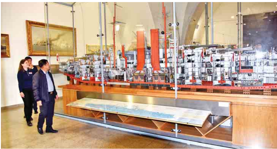
တပ်မတော်ကာကွယ်ရေးဦးစီးချုပ် ပိုလ်ချုပ်မှူးကြီး မင်းအောင်လှိုင် ပီယင်နာမြို့ရှိ တပ်မတော်စစ်သမိုင်းပြတိုက်အတွင်း လှည့်လည်ကြည့်ရှုစဉ်။ (သတင်းစဉ်)

တပ်မတော်ကာကွယ်ရေးဦးစီးချုပ် ပိုလ်ချုပ်မှူးကြီး မင်းအောင်လှိုင်နှင့် အဖွဲ့သည် ဧပြီ ၂၂ ရက် ဒေသစံတော်ချိန် ညနေ ၆ နာရီ ၄၅ မိနစ်တွင် ဩစတြီးယားနိုင်ငံ ပီယင်နာမြို့သို့ ရောက်ရှိရာ ပီယင်နာအပြည်ပြည်ဆိုင်ရာ လေဆိပ်၌ ဩစတြီးယားနိုင်ငံဆိုင်ရာ မြန်မာနိုင်ငံသံအမတ်ကြီး ဦးစံလွင်နှင့်အနီး သံရုံးမိသားစုများနှင့် တာဝန်ရှိသူများက ကြိုဆိုခဲ့ကြသည်။