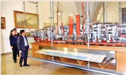
စာမျက်နှာ >> ၃

တပ်မတော်ကာကွယ်ရေးဦးစီးချုပ် ဗိုလ်ချုပ်မှူးကြီး မင်းအောင်လှိုင် ဝီယင်နာမြို့ရှိ တပ်မတော် စစ်သမိုင်းပြတိုက်အား ကြည့်ရှုလေ့လာ