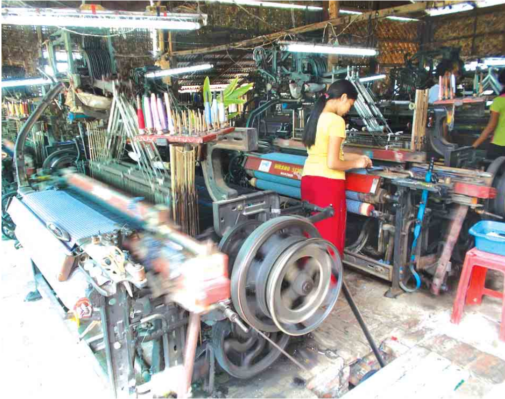
အမရပူရ ဧပြီ ၂၃

ကျွန်းလှတွင်ရေစီးရေလာ ကောင်းမွန်ရေးဆောင်ရွက်