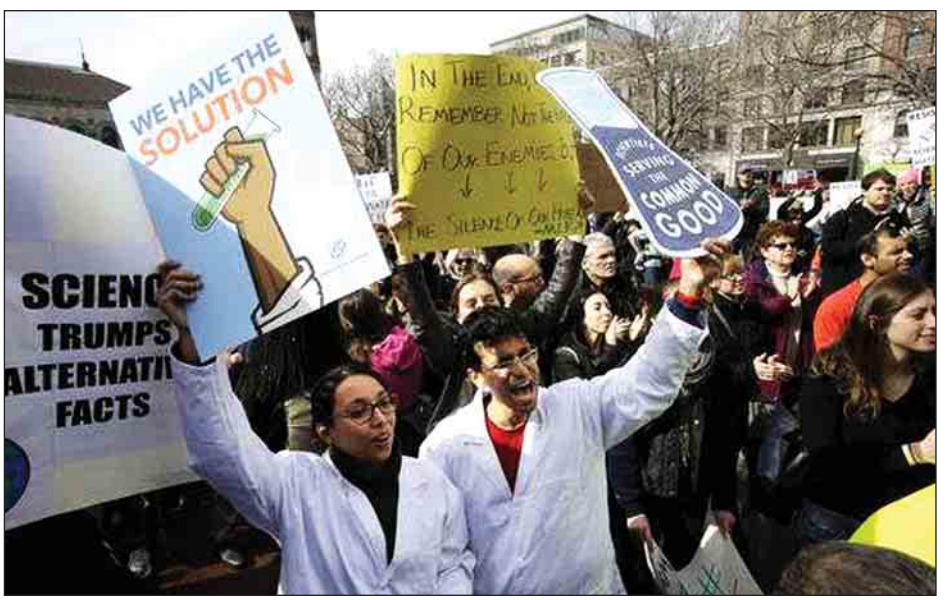
သမ္မတဒေါ်နယ်လ်ထရန်၏ ရာသီဥတုပြောင်းလဲခြင်းဆိုင်ရာ မူဝါဒနှင့်ပတ်သက်ပြီး ဆန္ဒထုတ်ဖော်မှုကို သမ္မတဒေါ်နယ်လ်ထရန် ရာထူးတာဝန်များထမ်းရွက်မှု ရက် ၁၀၀ ပြည့်သည့်နေ့တွင် ပြုလုပ်မည်ဖြစ်ကြောင်း သိရသည်။

'သိပ္ပံပညာလေး' ဟု လူသိများသည့် ရုပ်မြင်သံကြားကြေညာသူ ဘေလ်ညီက ဆန္ဒထုတ်ဖော်သူများအား ယခု ဆန္ဒထုတ်ဖော်မှုသည် သိပ္ပံပညာရပ်တိုးတက်ပြောင်းလဲလာရေးအတွက် အလွန်ပင်အရေးကြီးကြောင်းနှင့် သိပ္ပံပညာရပ်ဆိုင်ရာ သုတေသနပြုမှုအစီအစဉ်များအတွက် သုံးစွဲငွေပမာဏကို ပြန်လည်တိုးမြှင့်ပေးရန် လွှတ်တော်အမတ်များအား ဆွယ်တရားဟောပြောကြရန် တိုက်တွန်းစကားပြောကြားခဲ့သည်။ သိပ္ပံပညာရပ်ဆိုင်ရာ သုတေသနပြုမှုအတွက် သုံးစွဲငွေပမာဏလျှော့ချခြင်းနှင့် သိပ္ပံပညာရှင်များ အငှားလိုက်မှုကို အစိုးရကပိတ်ပင်ထားခြင်းတို့သည် ကြီးမားသော ပြဿနာများပင်ဖြစ်သည်ဟု သိပ္ပံကျောင်းသူတစ်ဦးက ဆိုသည်။ ထို့ပြင် သိပ္ပံနှင့်ဆက်စပ်သည့် နယ်ပယ်များတွင် ကျောင်းသား ကျောင်းသူများအနေဖြင့် အလုပ်ရှာရန် ခက်ခဲမှုများရှိနိုင်ကြောင်း ၎င်းက ဆက်လက်ပြောကြားခဲ့သည်။ သမ္မတ ဒေါ်နယ်လ်ထရန်က သမ္မတ အိုဘားမား ချမှတ်ခဲ့သည့် သဘာဝပတ်ဝန်းကျင်ဆိုင်ရာ မူဝါဒများနှင့် ပတ်သက်ပြီး အလုံးစုံပြောင်းလဲပစ်ရန် ကြိုးပမ်းလျက်ရှိကြောင်း သိရသည်။