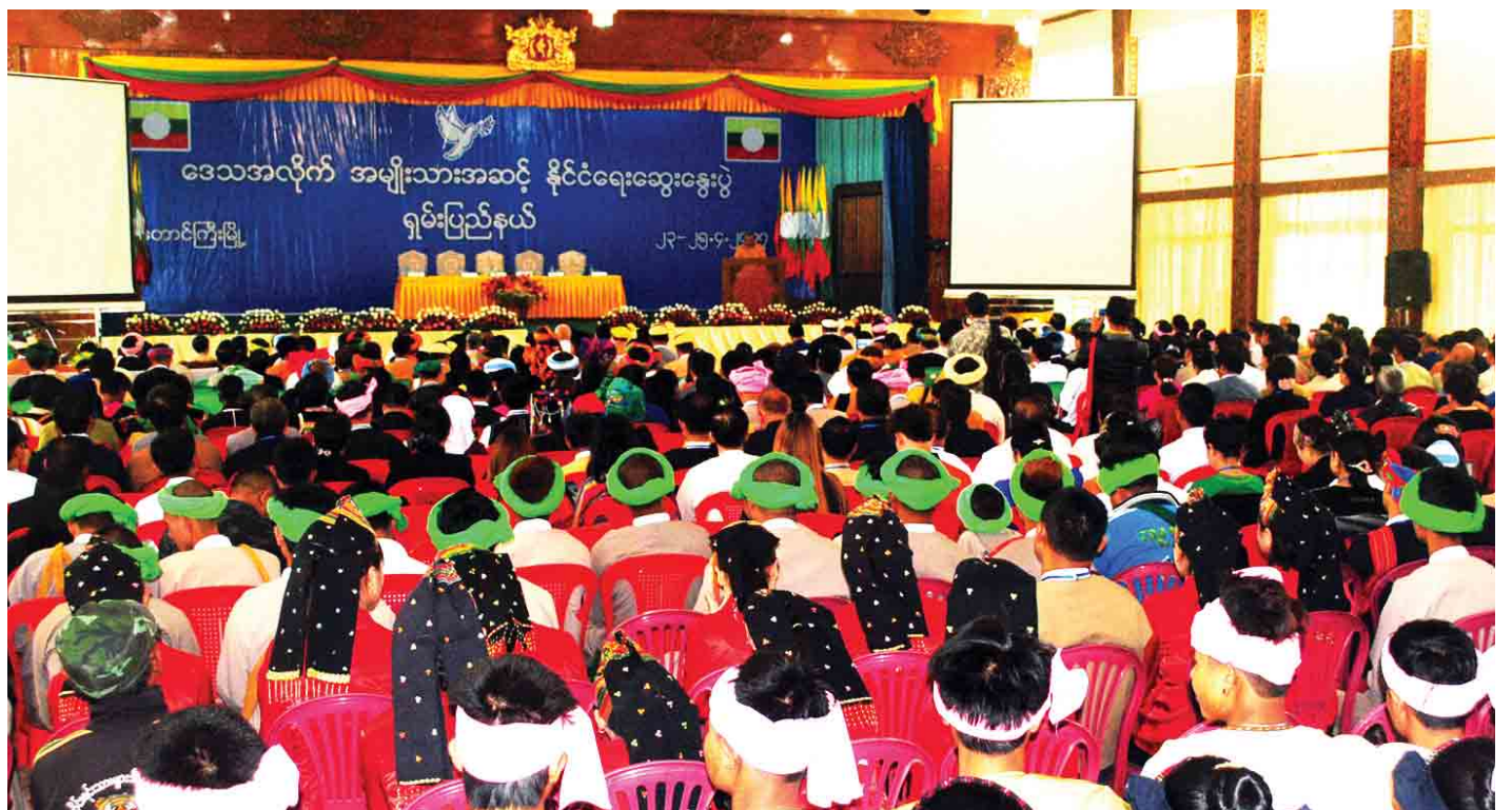
ရှမ်းပြည်နယ်ဒေသအလိုက် အမျိုးသားအဆင့်နိုင်ငံရေးဆွေးနွေးပွဲ ကျင်းပစဉ်။ (သတင်းစဉ်)

တောင်ကြီး ၈ မြို့ ၂၃ ရှမ်းပြည်နယ်ဒေသအလိုက် အမျိုးသားအဆင့်နိုင်ငံရေး ဆွေးနွေးပွဲ ဖွင့်ပွဲအခမ်းအနားကို တောင်ကြီးမြို့ မြို့တော် ခန်းမရှေ့၌ ယနေ့နံနက် ၉ နာရီတွင် စတင်ကျင်းပသည်။ ရှေးဦးစွာ နိုင်ငံတော်အတိုင်ပင်ခံရုံးဝန်ကြီးဌာန ပြည်ထောင်စုဝန်ကြီး ဦးကျော်တင့်ဆွေ၊ ငြိမ်းချမ်းရေး ကော်မရှင်ဥက္ကဋ္ဌ ဒေါက်တာတင်မျိုးဝင်း၊ ရှမ်းပြည်နယ် ဝန်ကြီးချုပ် ဒေါက်တာလင်းထွဋ်၊ ပလောင်ကိုယ်ပိုင် အုပ်ချုပ်ခွင့်ရဒေသ ဦးစီးအဖွဲ့ဥက္ကဋ္ဌ ဦးဝင်းကျော် (ခ) ဦးအိုက်မိန်း၊ ပြည်သူ့လွှတ်တော်ကိုယ်စားလှယ် ဒေါက်တာ ဒေါ်သန်းငွေတို့က ရှမ်းပြည်နယ်ဒေသအလိုက် အမျိုးသား အဆင့် နိုင်ငံရေးဆွေးနွေးပွဲကို ဖဲကြီးဖြတ်ဖွင့်လှစ်ပေးကြပြီး တိုင်းရင်းသားကလေးငယ်များက ငြိမ်းချမ်းရေးအထိမ်း အမှတ် ချီးမြှင့်ကမ်းလှမ်းပေးကြသည်။ ထို့နောက် အခမ်းအနားအစီအစဉ် ဒုတိယပိုင်းကျင်းပ မည့် မြို့တော်ခန်းမအတွင်း နေရာယူကြပြီး ပြည်ထောင်စု ဝန်ကြီး၊ ငြိမ်းချမ်းရေးကော်မရှင်ဥက္ကဋ္ဌ၊ ပြည်နယ်ဝန်ကြီးချုပ် နှင့် တက်ရောက်လာကြသူများက ပြည်ထောင်စုသမ္မတ မြန်မာနိုင်ငံတော်အလံကို အလေးပြုကြသည်။