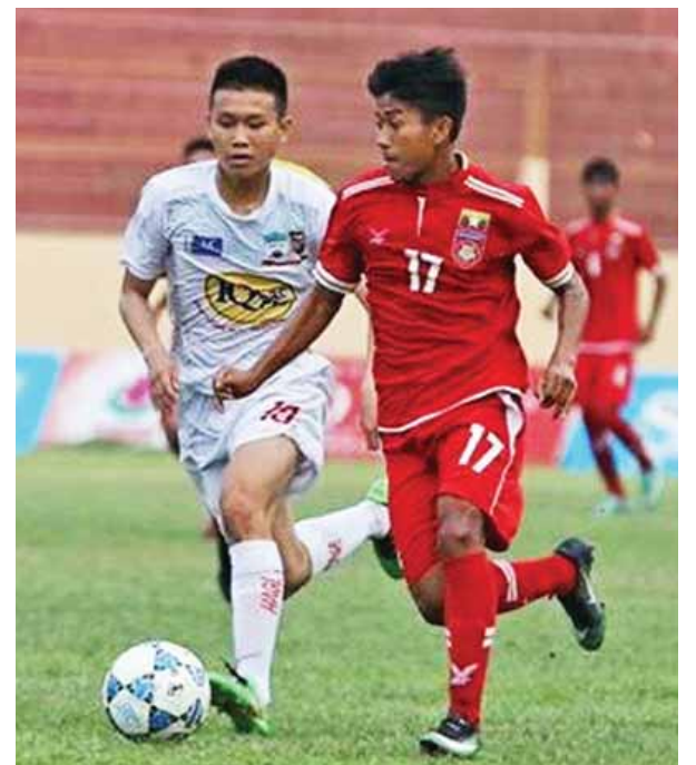
မြန်မာ ယူ-၁၈ အသင်းနှင့် ဗီယက်နမ်ကလပ် ဟောင်အန်ဂယ်လိုင် ယူ-၁၉ အသင်းတို့ ယှဉ်ပြိုင်ကစားစဉ်။