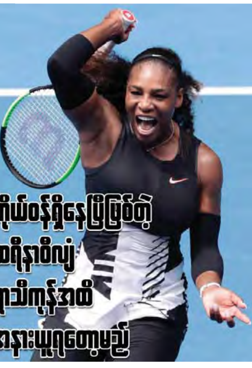
ကိုယ်ဝန်ရှိနေပြီဖြစ်တဲ့ ဆရီနာဝီလျံ ရာသီကုန်အထိ အနားယူရတော့မည်

အမေရိကန်နာမည်ကြီးတင်းနစ်မယ် ဆရီနာဝီလျံမှာ ကိုယ်ဝန်လွယ်ထားရပြီဖြစ်ပြီး လာမယ့်ဆောင်းဦးပေါက်တွင် ရင်သွေးလေးကို မွေးဖွားတော့မှာ ဖြစ်တာကြောင့် ရာသီကုန်အထိ အနားယူရတော့မည်ဖြစ်ကြောင်း ဆရီနာရဲ့ ကိုယ်စားလှယ်ဖြစ်သူက အတည်ပြုကြေညာလိုက်ပြီဖြစ်သည်။ အသက် (၃၅)နှစ်အရွယ်ရှိလျှင် မှန်ရှေ့တွင် ဖုန်းကိုင်ပြီး “ရက်သတ္တပတ် ၂၀” ဟု ရေးသားတဲ့ ဓာတ်ပုံကို သူ့ရဲ့အင်စတာဂရမ်စာမျက်နှာထက် တင်ခဲ့ပြီး သူ့ရဲ့ ရင်သွေးလွယ်ထားရတဲ့သတင်းကို အသိပေးသွားခြင်းဖြစ်သည်။ အဆိုပါပုံစံကို တင်ပြီး သိပ်မကြာခင် ပြန်လည်ဖျက်သွားခဲ့သော်လည်း ဆရီနာ ကိုယ်ဝန်လွယ်ထားရပြီကို ကိုယ်စားလှယ်ဖြစ်သူက အတည်ပြုပေးခဲ့ခြင်းဖြစ်သည်။ ဆရီနာမှာ ပြီးခဲ့တဲ့ ဇန်နဝါရီလက ကျင်းပပြီးစီးခဲ့တဲ့ ဩစတြေးလျအိုးပင်းတွင် ချန်ပီယံအဖြစ် အောင်ပွဲခံနိုင်ခဲ့ပြီးနောက် ၈ရင်းစလင်း ၂၃ ကြိမ်အထိရရှိတဲ့ တင်းနစ်မယ်အဖြစ် မှတ်တမ်းဝင်ထားသူဖြစ်သည်။ သို့သော် ယခုအခါ ကိုယ်ဝန်ရှိနေပြီဖြစ်တဲ့အတွက် ယခုနှစ်ရာသီအတွင်း ယှဉ်ပြိုင်ရန် ကျန်ရှိ နေသေးတဲ့ ပြိုင်ဘက်အိုးပင်း၊ ဝင်ဘယ်လ်ဒန်အိုးပင်းနှင့် အမေရိကန်အိုးပင်းတို့ကို လွဲချော်တော့မည်ဖြစ်သည်။ သို့သော်ဆရီနာဝီလျံမှာ ကလေးမွေးဖွားပြီး ၁၂ လအတွင်း တင်းနစ်ကစားရန် အဆင်သင့်ဖြစ်နေမည်ဆိုပါက ဒဗလျူတီအေ၏ အထူးသတ်မှတ်ချက်စည်းမျဉ်းအရ ကမ္ဘာ့အဆင့်(၁)နေရာကို ပြန်လည်ရယူနိုင်မည်ဖြစ်သည်။ အမေရိကန်တင်းနစ်အဖွဲ့ချုပ်ကမူ ဝီလျံရဲ့ ရင်သွေးမွေးဖွားတော့မယ့်ကိစ္စရပ်ကို ဂုဏ်ပြုပါကြောင်း ကြေညာချက်တစ်စောင် ထုတ်ပြန်ရန်ပြုခဲ့သည်။