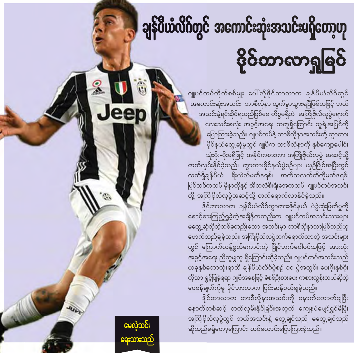
မေလဲ့သင်း ရေးသားသည်

အမေရိကန်နာမည်ကြီးတင်းနစ်မယ် ဆရီနာဝီလျံမှာ ကိုယ်ဝန်လွယ်ထားရပြီဖြစ်ပြီး လာမယ့်ဆောင်းဦးပေါက်တွင် ရင်သွေးလေးကို မွေးဖွားတော့မှာ ဖြစ်တာကြောင့် ရာသီကုန်အထိ အနားယူရတော့မည်ဖြစ်ကြောင်း ဆရီနာရဲ့ ကိုယ်စားလှယ်ဖြစ်သူက အတည်ပြုကြေညာလိုက်ပြီဖြစ်သည်။ အသက် (၃၅)နှစ်အရွယ်ရှိလျှင် မှန်ရှေ့တွင် ဖုန်းကိုင်ပြီး “ရက်သတ္တပတ် ၂၀” ဟု ရေးသားတဲ့ ဓာတ်ပုံကို သူ့ရဲ့အင်စတာဂရမ်စာမျက်နှာထက် တင်ခဲ့ပြီး သူ့ရဲ့ ရင်သွေးလွယ်ထားရတဲ့သတင်းကို အသိပေးသွားခြင်းဖြစ်သည်။ အဆိုပါပုံစံကို တင်ပြီး သိပ်မကြာခင် ပြန်လည်ဖျက်သွားခဲ့သော်လည်း ဆရီနာ ကိုယ်ဝန်လွယ်ထားရပြီကို ကိုယ်စားလှယ်ဖြစ်သူက အတည်ပြုပေးခဲ့ခြင်းဖြစ်သည်။ ဆရီနာမှာ ပြီးခဲ့တဲ့ ဇန်နဝါရီလက ကျင်းပပြီးစီးခဲ့တဲ့ ဩစတြေးလျအိုးပင်းတွင် ချန်ပီယံအဖြစ် အောင်ပွဲခံနိုင်ခဲ့ပြီးနောက် ၈ရင်းစလင်း ၂၃ ကြိမ်အထိရရှိတဲ့ တင်းနစ်မယ်အဖြစ် မှတ်တမ်းဝင်ထားသူဖြစ်သည်။ သို့သော် ယခုအခါ ကိုယ်ဝန်ရှိနေပြီဖြစ်တဲ့အတွက် ယခုနှစ်ရာသီအတွင်း ယှဉ်ပြိုင်ရန် ကျန်ရှိ နေသေးတဲ့ ပြိုင်ဘက်အိုးပင်း၊ ဝင်ဘယ်လ်ဒန်အိုးပင်းနှင့် အမေရိကန်အိုးပင်းတို့ကို လွဲချော်တော့မည်ဖြစ်သည်။ သို့သော်ဆရီနာဝီလျံမှာ ကလေးမွေးဖွားပြီး ၁၂ လအတွင်း တင်းနစ်ကစားရန် အဆင်သင့်ဖြစ်နေမည်ဆိုပါက ဒဗလျူတီအေ၏ အထူးသတ်မှတ်ချက်စည်းမျဉ်းအရ ကမ္ဘာ့အဆင့်(၁)နေရာကို ပြန်လည်ရယူနိုင်မည်ဖြစ်သည်။ အမေရိကန်တင်းနစ်အဖွဲ့ချုပ်ကမူ ဝီလျံရဲ့ ရင်သွေးမွေးဖွားတော့မယ့်ကိစ္စရပ်ကို ဂုဏ်ပြုပါကြောင်း ကြေညာချက်တစ်စောင် ထုတ်ပြန်ရန်ပြုခဲ့သည်။