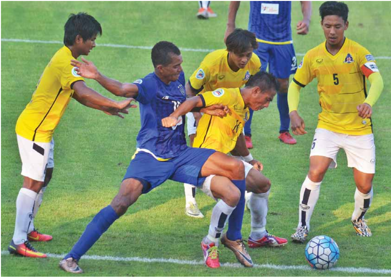
ဧပြီ ၁၉ ရက်က သုဝဏ္ဏတွင်း၌ မကွေးအသင်းနှင့် ဂလိုဘယ်အသင်းတို့ ယှဉ်ပြိုင်ကစားကြစဉ်။

နင်းမိုင်းတစ်လုံး နင်းမိပေါက်ကွဲ၍ ဒဏ်ရာရရှိသူနှစ်ဦး ပန်းမော်ပြည်သူ့ဆေးရုံကြီး၌ ဆေးကုသခံယူလျက်ရှိ စာမျက်နှာ - ၉