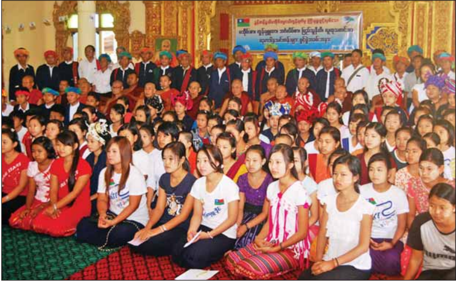
ပညာနှင့် လူငယ်နှင့်ခေါင်းဆောင်မှုဆိုင်ရာသင်တန်းများ ဖွင့်လှစ်သင်ကြားပို့ချပေးသွားမည်ဖြစ်ကြောင်း သိရ ကို ဧပြီ ၂၀ ရက်မှ စတင်ကာ တစ်လကြာ အခမဲ့ သည်။