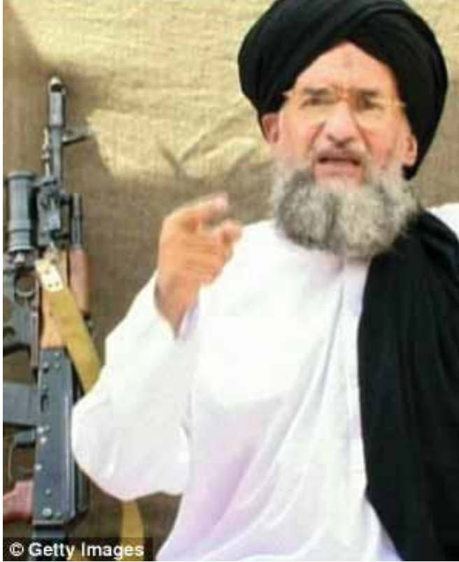
အယ်လ်ခိုင်ဒါ ခေါင်းဆောင် အမန်အယ်လ်ဇဟာဟီရီ