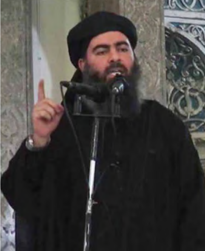
အိုင်အက်စ်ခေါင်းဆောင် အဘူဘက်ကာ အယ်လ်ဘက်ဒါဒါ

အယ်လ်ခိုင်ဒါ ခေါင်းဆောင် အမန် အယ်လ် ဇဟာဟီရီကပင် ဆီရီးယားနှင့် အီရတ်တွင် အိုင်အက်စ်တို့၏ လုပ်ရပ်များနှင့် ပတ်သက်၍ သူတာဝန်မယူကြောင်းပြောခဲ့သလို ၂၀၀၅ ခုနှစ်ကလည်း ဒီလိုရက်စက် ကြမ်းကြုတ်မှုများကြောင့် အစ္စလာမစ်ဘာသာဝင်များ၏ လေးစားချစ်ခင်မှုကို ဆုံးရှုံးရနိုင်ကြောင်း အိုင်အက်စ်အဖွဲ့ကို လူသိ