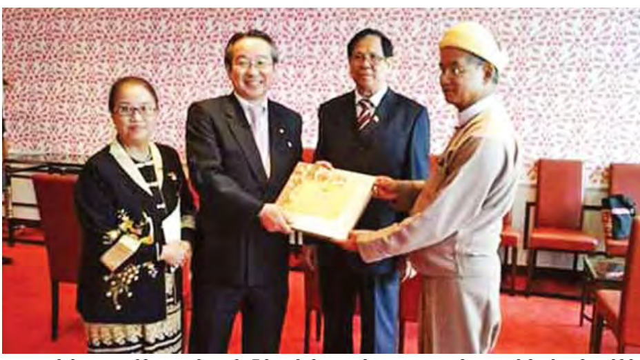
(L.D.P)ပါတီမှ တာဝန်ရှိသူများနှင့် တွေ့ဆုံဆွေးနွေးခဲ့ကြသည်။ ဧပြီ ၁၂ ရက် ဒေသစံတော်ချိန် မွန်းတည့် ၁၂ နာရီကလည်း အမျိုးသားလွှတ်တော် ဒုတိယဥက္ကဋ္ဌ နှင့် မြန်မာကိုယ်စားလှယ်အဖွဲ့အား ဂျပန်နိုင်ငံ တိုကျိုမြို့ရှိ Liberal Democratic Party (L.D.P) ၏ အထွေထွေအတွင်းရေးမှူးချုပ် Mr. Toshihiro Nikai က နေ့လယ်စာဖြင့် ဧည့်ခံရာ အဆိုပါဧည့်ခံပွဲသို့ ဂျပန်နိုင်ငံ အစိုးရအဖွဲ့မှ တာဝန်ရှိသူများ၊ ဂျပန် နိုင်ငံဆိုင်ရာ မြန်မာသံအမတ်ကြီးနှင့် ဇနီးတို့ တက်ရောက်ခဲ့ကြကြောင်း သတင်းရရှိသည်။ (သတင်းစဉ်)

နေပြည်တော် ဧပြီ ၂၀ အမျိုးသားလွှတ်တော် ဒုတိယဥက္ကဋ္ဌ ဦးအေးသာအောင်နှင့် အဖွဲ့အား ဧပြီ ၁၀ ရက် ဒေသစံတော်ချိန် နံနက် ၈ နာရီခွဲက ဂျပန်နိုင်ငံ Okura Hotel ၌ Okura Hotel အကြီးအမှူး Mr. Toshihiro၊ ဒုတိယအကြီးအမှူးနှင့် ဂျပန်နိုင်ငံ နိုင်ငံတကာ ဟိုတယ် လုပ်ငန်းရှင်များအုပ်စုတို့က နံနက်စာ ဖြင့် တည်ခင်းစဉ်ခံခဲ့ရသည်။ ဧပြီ ၁၁ ရက် ဒေသစံတော်ချိန် မွန်းလွဲ ၂ နာရီကလည်း အမျိုးသား လွှတ်တော် ဒုတိယဥက္ကဋ္ဌနှင့် ဟိုတယ် နှင့် ခရီးသွားလာရေးဝန်ကြီး ဌာန ပြည်ထောင်စုဝန်ကြီး ဦးအုန်းမောင်တို့သည် ဂျပန်နိုင်ငံ တိုကျိုမြို့ရှိ Liberal Democratic Party (L.D.P) ပါတီဌာနချုပ်၌ ပါတီ အထွေထွေအတွင်းရေးမှူးချုပ်၊ ဂျပန် နိုင်ငံ အောက်လွှတ်တော်အမတ်နှင့်