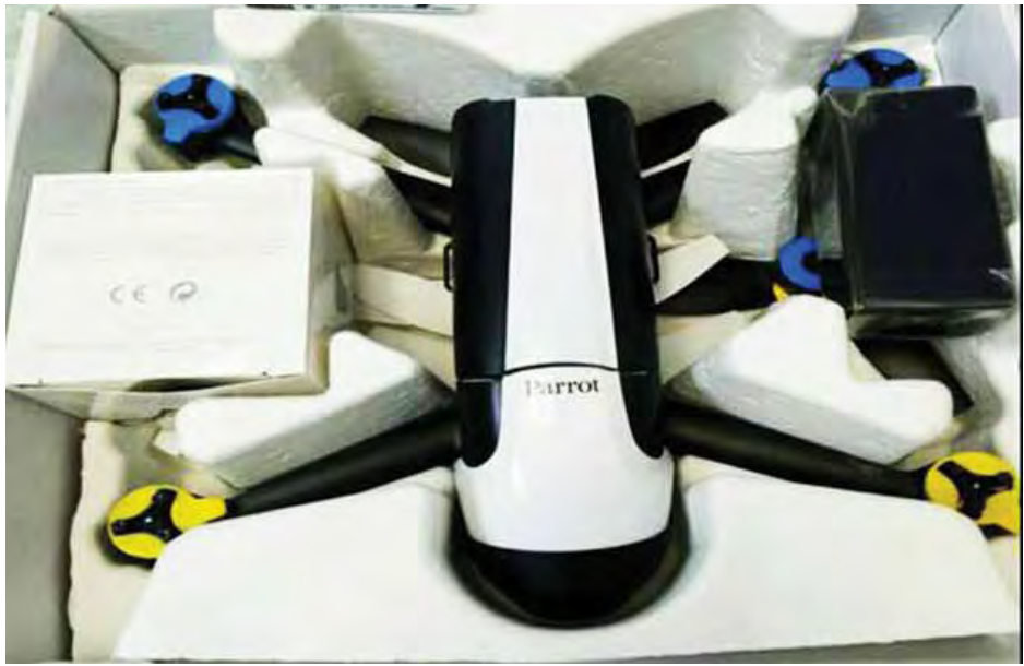
တရားဝင် စာရွက်စာတမ်း အထောက်အထားတစ်စုံတစ်ရာတင်ပြနိုင်ခြင်း မရှိသည့် "Parrot" Bebop 2 Drone (1) Set