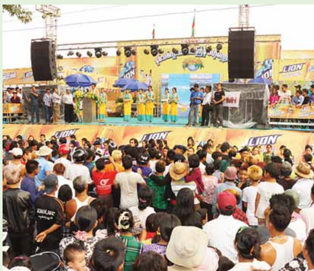
စစ်ကိုင်းမြို့ အတာသင်္ကြန်ဗဟိုမဏ္ဍပ် ဖွင့်ပွဲကျင်းပစဉ်။ ခရိုင်(ပြန်/ဆက်)

၁၃၇၈ ခုနှစ် မြန်မာ့ရိုးရာ မဟာသင်္ကြန်ပွဲ နိုင်ငံတစ်ဝန်း ပျော်ရွှင်စွာဆင်နွှဲ