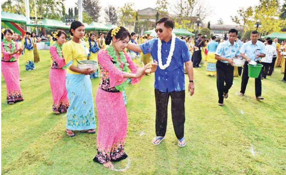
တပ်မတော်ကာကွယ်ရေးဦးစီးချုပ် ဗိုလ်ချုပ်မှူးကြီးမင်းအောင်လှိုင် ယိမ်းအဖွဲ့များအား သပြေခက်ဖြင့် အတာရေ ပတ်ဖျန်းပေးစဉ်။ (သတင်းစဉ်)