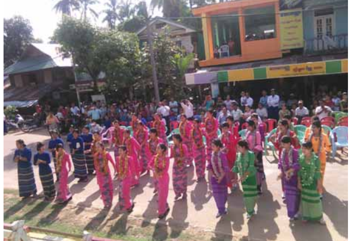
မြို့နယ်(ပြန်/ဆက်)

ရေဖြူမြို့နယ် မြန်မာ့ရိုးရာမဟာသင်္ကြန်ပွဲတော်ဖွင့်ပွဲအခမ်းအနားကို ဧပြီ ၁၃ ရက် (သင်္ကြန်အကြံဉာဏ်) နံနက် ၈ နာရီတွင် ရေဖြူမြို့နယ် မြန်မာ့ရိုးရာသင်္ကြန်ပွဲတော် ဗဟိုမဏ္ဍပ်၌ ကျင်းပခဲ့သည်။ ရှေးဦးစွာ မြန်မာ့ရိုးရာယဉ်ကျေးမှု မဟာသင်္ကြန်ပွဲတော် ဗဟိုမဏ္ဍပ် ကို တနင်္သာရီတိုင်းဒေသကြီး လွှတ်တော်ဥက္ကဋ္ဌ ဦးကြည်စိုး၊ တိုင်း ဒေသကြီးလွှတ်တော်ကိုယ်စားလှယ် ဦးလှထွေး၊ မြို့နယ်အုပ်ချုပ်ရေး မှူး ဦးလှဝင်းအောင်နှင့် ဇနီးဒေါ်မိုးမိုးလှိုင်နှင့် တာဝန်ရှိသူများက ဖဲကြိုးဖြတ်ဖွင့်လှစ်ပေးခဲ့သည်။ မန်းတောင်ရိပ်ခိုတေးသီချင်းဖြင့် သီဆိုပြီး အကအလှများဖြင့် ကပြ ဖျော်ဖြေလျက်ရှိသည့် ယိမ်းအဖွဲ့များအား နံ့သာရည်များဖြင့် ပတ်ဖျန်း ပေးခဲ့ကြပြီး မြန်မာ့ရိုးရာသင်္ကြန်တေးသီချင်းများ၊ ယိမ်းအဖွဲ့များ၏ အကအလှများ၊ ခေတ်ပေါ်တေးသီချင်းများဖြင့် ကပြဖျော်ဖြေမှုများ ကို ကြည့်ရှုအားပေးခဲ့ကြကြောင်း သိရသည်။