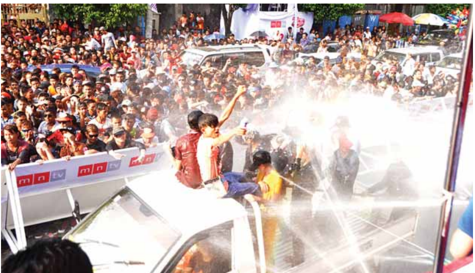
ရန်ကုန်မြို့ လသာမြို့နယ် (၁၉)လမ်းနှင့် အနော်ရထာလမ်းပေါ်ရှိ Sky Net ရေကစားမဏ္ဍပ်၌ ဧပြီ ၁၃ ရက် (သင်္ကြန်အကြိုနေ့) ညနေပိုင်းတွင် နိုင်ငံကျော်တေးသံရှင်များ၏ ဖျော်ဖြေမှုများ၊ ပျော်ရွှင်စွာ ရေကစားကြသူများနှင့် စည်ကားလျက်ရှိသည်ကို တွေ့ရစဉ်။ (ငွေ့အောင်)