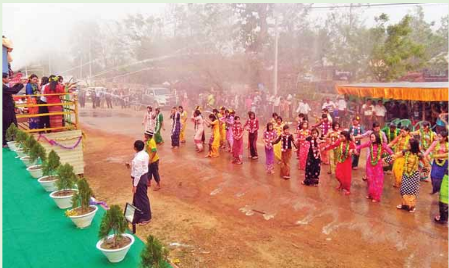
မာဘိမ်းမြို့ အတာသင်္ကြန်ဗဟိုမဏ္ဍပ်ဖွင့်ပွဲ၌ ယိမ်းအကများဖြင့် ဖျော်ဖြေကြစဉ်။