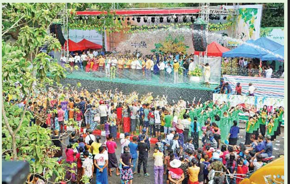
ရန်ကုန်တောင်ပိုင်းခရိုင် ဗဟိုမဏ္ဍပ် ဖွင့်ပွဲကျင်းပစဉ်။ သက်ခိုင်(သန်လျင်)

၁၃၇၈ ခုနှစ် မြန်မာ့ရိုးရာ မဟာသင်္ကြန်ပွဲ နိုင်ငံတစ်ဝန်း ပျော်ရွှင်စွာဆင်နွှဲ