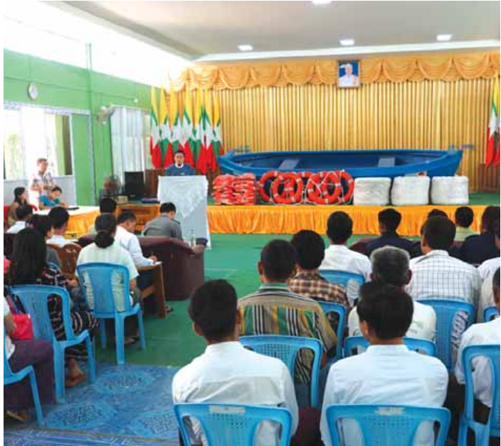
အမ်း ဧပြီ ၁၃ ရခိုင်ပြည်နယ် ကျောက်ဖြူခရိုင် အမ်းမြို့၌ ကယ်ဆယ်ရေးနှင့်ပြန်လည်နေရာချထားရေးဦးစီးဌာနက သဘာဝဘေးအန္တရာယ်

ဆိုင်ရာ အထောက်အကူပြု ကယ်ဆယ်ရေးပစ္စည်းများ ထောက်ပံ့ပေးခြင်းကို ဧပြီ ၁၂ ရက် နံနက် ၉ နာရီက မြို့နယ်အထွေထွေအုပ်ချုပ်ရေး