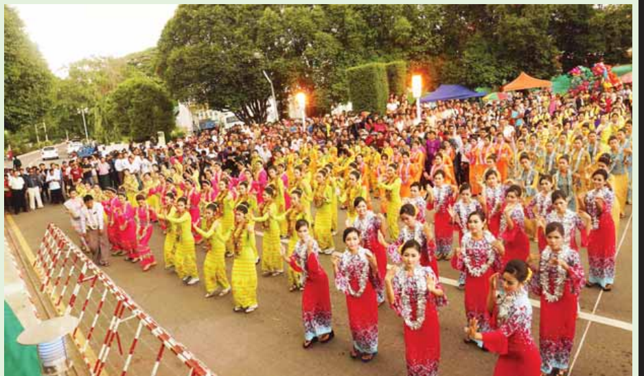
ထားဝယ်မြို့ မဟာသင်္ကြန်ဗဟိုမဏ္ဍပ်ဖွင့်ပွဲ၌ ယိမ်းအဖွဲ့များ ဖျော်ဖြေကြစဉ်။ တိုင်းဒေသကြီး(ပြန်/ဆက်)