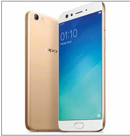
OPPO က အသစ်ထုတ်လုပ်လိုက်သော Dual Selfie Camera နည်းပညာသုံး F3 Plus

စမတ်ဖုန်းတစ်လုံးနှင့်ပတ်သက်၍ သုံးစွဲသူများပိုမို