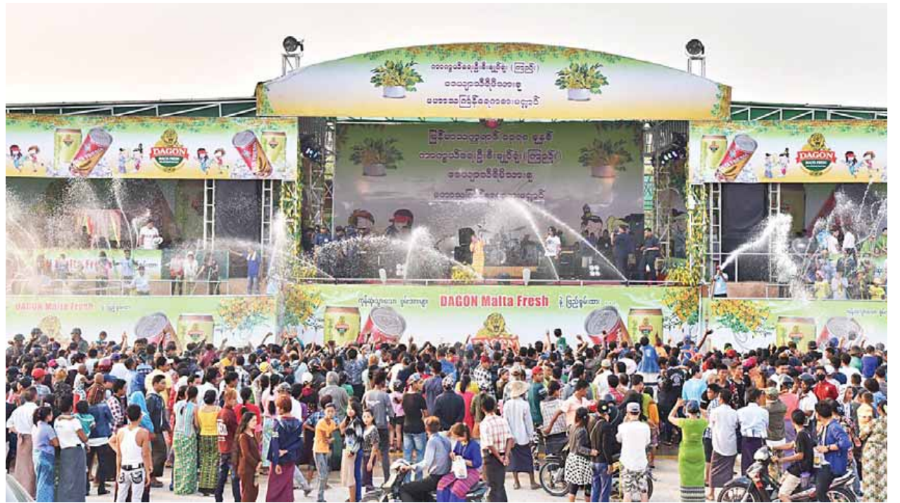
မြန်မာ့ရိုးရာမဟာသကြီးပွဲတော် ကာကွယ်ရေးဦးစီးချုပ်ရုံး(ကြည်း၊ ရေ၊ လေ)မိသားစု ရေကစားမဏ္ဍပ်ကို တွေ့ရစဉ်။

အဆိုပါရေကစားမဏ္ဍပ်များတွင် မဟာသကြီးအတတ်နေအထိ စည်ကား သိုက်မြိုက်စွာ သင်္ကြန်ယိမ်းအကအဖွဲ့များ၊ အနုပညာရှင်များနှင့် တေးသံရှင်များ က သီဆိုကပြဖျော်ဖြေသွားမည်ဖြစ်ကြောင်း သတင်းရရှိသည်။ (သတင်းစဉ်)