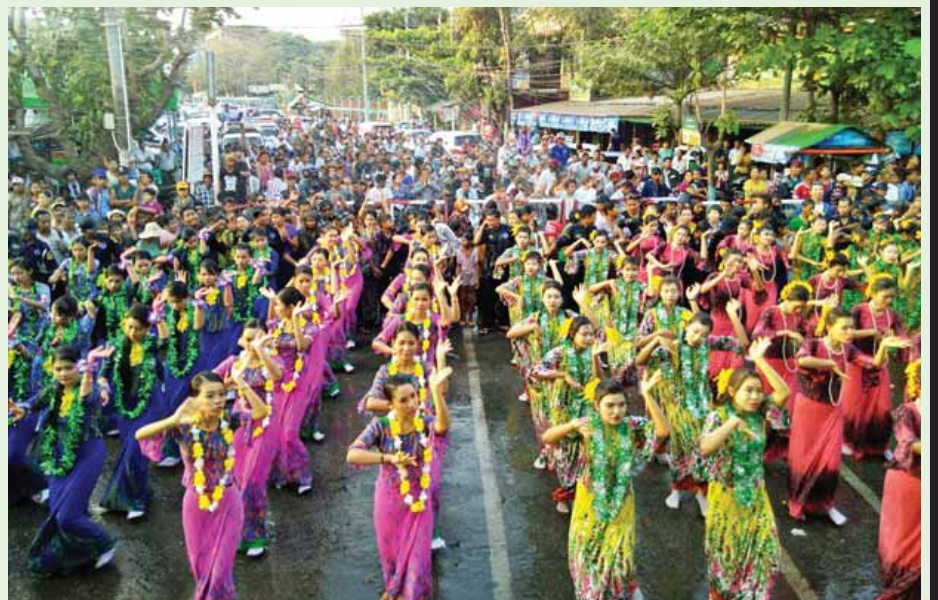
ပဲခူးမြို့ ဗဟိုရေကစားမဏ္ဍပ်ဖွင့်ပွဲ၌ ယိမ်းအဖွဲ့များ ဖျော်ဖြေကြစဉ်။