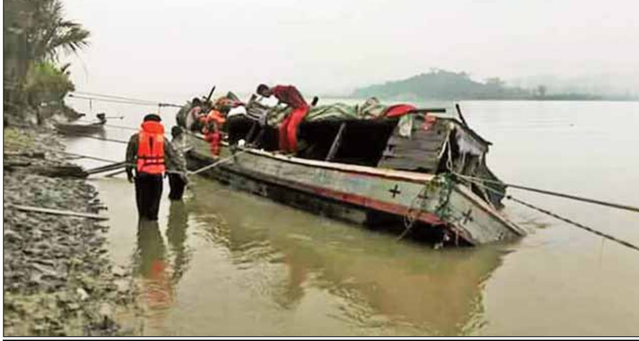
မင်းပြားမြို့နယ် မေလွန်းကျေးရွာအုပ်စု တောင်ပုတ်ကေကျေးရွာအနီး မင်းကြောင်းမြစ်အတွင်း နစ်မြုပ်သွားသော စက်လှေအား ဆယ်ယူပြီးတွေ့ရစဉ်။