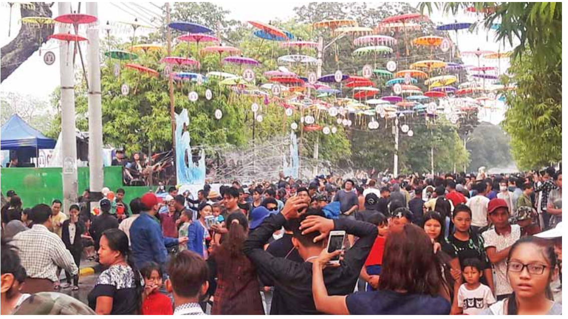
မန္တလေးမြို့၏ ထူးကဲလှသည့် လမ်းလျှောက်သင်္ကြန်၌ ကြိတ်ကြိတ်တိုးစည်ကားလှက်ရှိစဉ်။