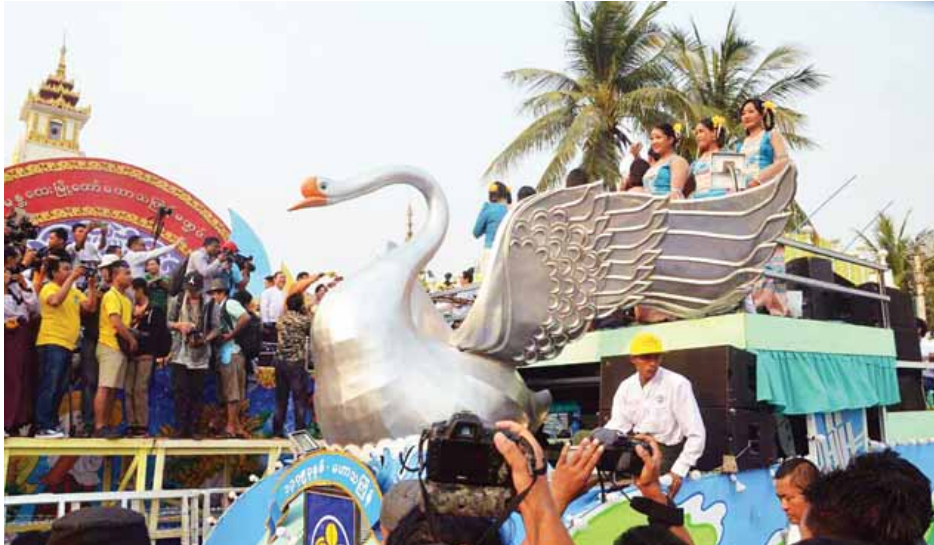
မန္တလေးမြို့တော် မဟာသကြီးပွဲတွင် ငွေငန်းယာဉ်ဖြင့် အလှပြဖျော်ဖြေစဉ်။

မောင်တောမြို့၏ ရခိုင်ရိုးရာသင်္ကြန်ပွဲတော် ဗဟိုမဏ္ဍပ်နှင့် ရိုးရာရေကစားမဏ္ဍပ်တို့ကို ဧပြီ ၁၇ ရက် တွင် စတင်ဖွင့်လှစ်မည်ဖြစ်ပြီး ရခိုင်နာမည်ကြီး တေးသံရှင် များ၊ ယိမ်းအကများဖြင့် ဖျော်ဖြေတင်ဆက်သွားမည် ဖြစ်ကြောင်း သင်္ကြန်ပွဲတော်ကျင်းပရေးဦးစီးကော်မတီမှ သိရသည်။