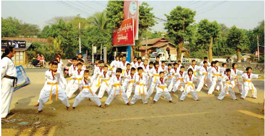
နိုင်လင်းထက်(ပြန်/ဆက်)