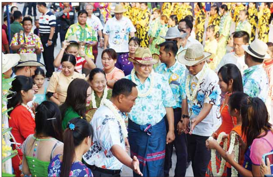
အမျိုးသားလွှတ်တော်ဥက္ကဋ္ဌ မန်းဝင်းခိုင်သန်း၊ မြဝတီမြို့ မြန်မာ့ရိုးရာမဟာသကြိမ်ပဟိုမဏ္ဍပ် ဖွင့်ပွဲအခမ်းအနားသို့ တက်ရောက်စဉ်။