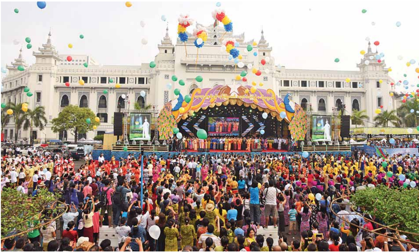
ရန်ကုန်မြို့တော် မဟာသကြီးပွဲတော် ဖွင့်ပွဲအခမ်းအနားကျင်းပစဉ်။