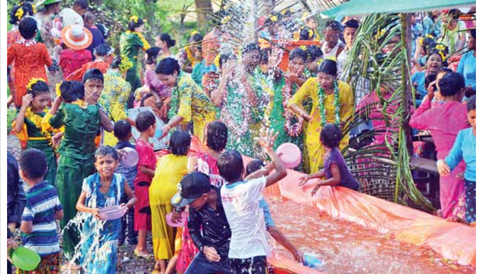
ရခိုင်ပြည်နယ် မောင်တောမြို့တွင် ပျော်ရွှင်စွာရေကစားနေကြသည်ကို တွေ့ရစဉ်။

✽ မန္တလေးမြို့မှ ယင်းကဲ့သို့ ပြောကြားရာတွင် ပူပြင်းသော နွေဦးအခါသမယမှာ တစ်ဦးကိုတစ်ဦး အေးချမ်းပါစေ ရည်ရွယ်ချက်ဖြင့် ရေစင်ဖြင့် ပတ်ဖျန်းခြင်းသည် မြန်မာနိုင်ငံ၏ ယဉ်ကျေးမှုဖြစ်ကြောင်း၊ အခြားနိုင်ငံမှ ယဉ်ကျေးမှုများ ဝင်ရောက်လာသည့်အတွက် မေတ္တာတရားများ ယုံယွင်းလာသည်ကို တွေ့ရပြီး သရုပ်ပျက်ယဉ်ကျေးမှုများ ဝါးမျိုလာခြင်းကိုခံခဲ့ရကြောင်း၊ မြန်မာ့ရိုးရာ အတာသင်္ကြန်၏ အနှစ်သာရဖြစ်သော တစ်ဦးကိုတစ်ဦးမေတ္တာဖြင့် ရေစင် ပတ်ဖျန်းကြဖို့ တိုက်တွန်းလိုကြောင်း၊ အတာရေသဘင်ပွဲတော်မှရရှိသည့် မေတ္တာတရားကို အခြေခံပြီး တစ်ဦးနှင့်တစ်ဦး လုံခြုံစိတ်ချစွာနေနိုင်ရေးနှင့် နိုင်ငံတော်ဖွံ့ဖြိုးတိုးတက်ရေးအတွက် တတ်အားသရွေ့ ပါဝင်ဆောင်ရွက်ပေးရန်