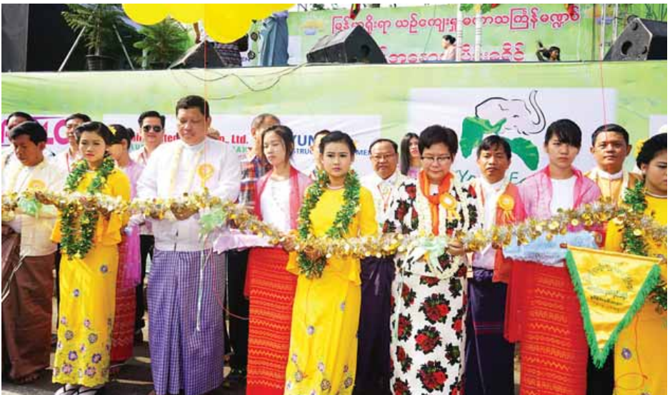
ရန်ကုန်မြို့ မရမ်းကုန်းမြို့နယ် ပါရမီလမ်း ရန်ကုန်တက္ကသိုလ် လှိုင်ဂိတ်ပေါက်အနီးရှိ အနောက်ပိုင်းခရိုင် ရေကစားမဏ္ဍပ်ကို ဧပြီ ၁၃ ရက်(သင်္ကြန်အကြိုနေ့) နံနက်ပိုင်းတွင် ဖွင့်လှစ်စဉ်။ (ခင်မောင်ဝင်း)