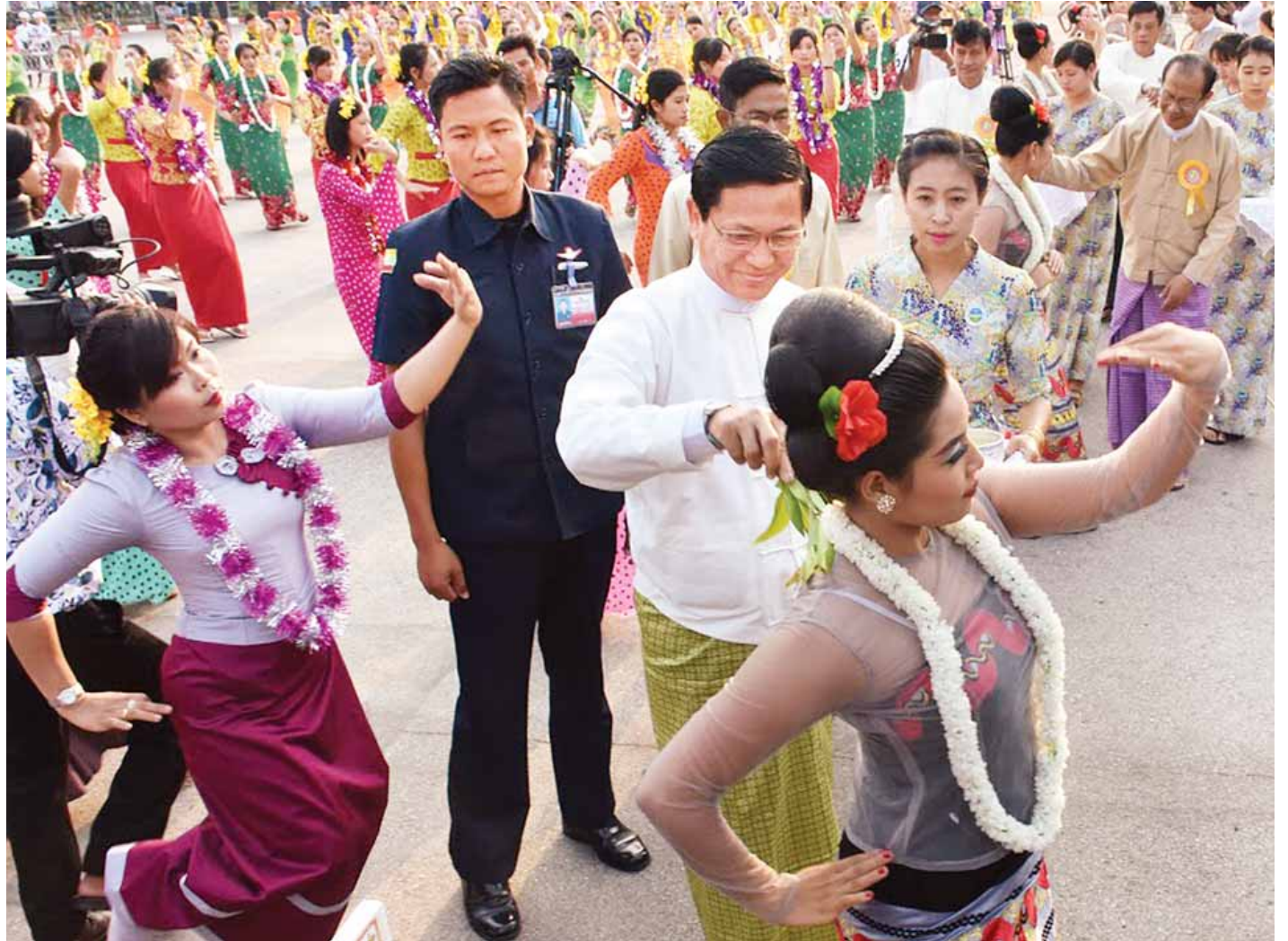
နေပြည်တော် ဧပြီ ၁၃

ယခုအချိန်အခါသည် မြန်မာသက္ကရာဇ် ၁၃၇၈ ခုနှစ်မှ ၁၃၇၉ ခုနှစ်သို့ ကူးပြောင်းတော့မည့် မြန်မာတို့၏ နှစ်သစ်ကူးအချိန်အခါသမယဖြစ်သည်။ မြန်မာတို့၏ ထုံးတမ်းအစဉ်အလာအရ နှစ်ဟောင်းမှနှစ်သစ်သို့ ကူးပြောင်းချိန်တွင် နှစ်ဟောင်းမှ အညစ်အကြေးများ ကင်းစင်စေရန် ရေပက်ဖျန်းကစားကြသည့် နှစ်သစ်ကူးပွဲတော် မဟာသင်္ကြန်ကာလသို့ ရောက်ရှိလာပြီဖြစ်သည်။