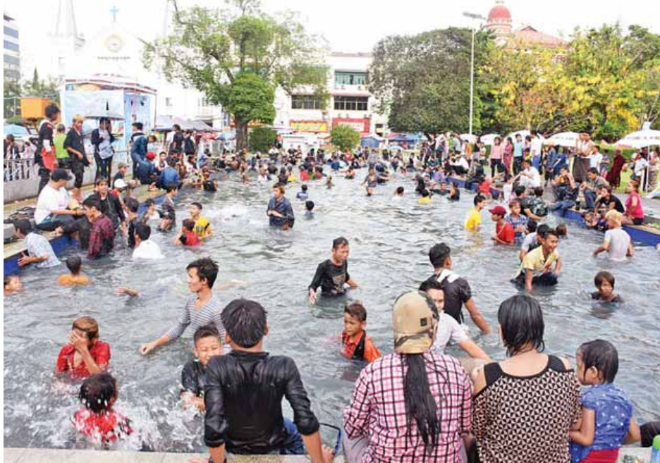
မဟာသင်္ကြန်အကြိုနေ့တွင် မဟာပန္နုလပန်းခြံအတွင်း ရေကန်၌ ကလေးငယ်များ ပျော်ရွှင်စွာ ရေကစားနေကြ စဉ်။ (ဇော်မင်းလတ်)