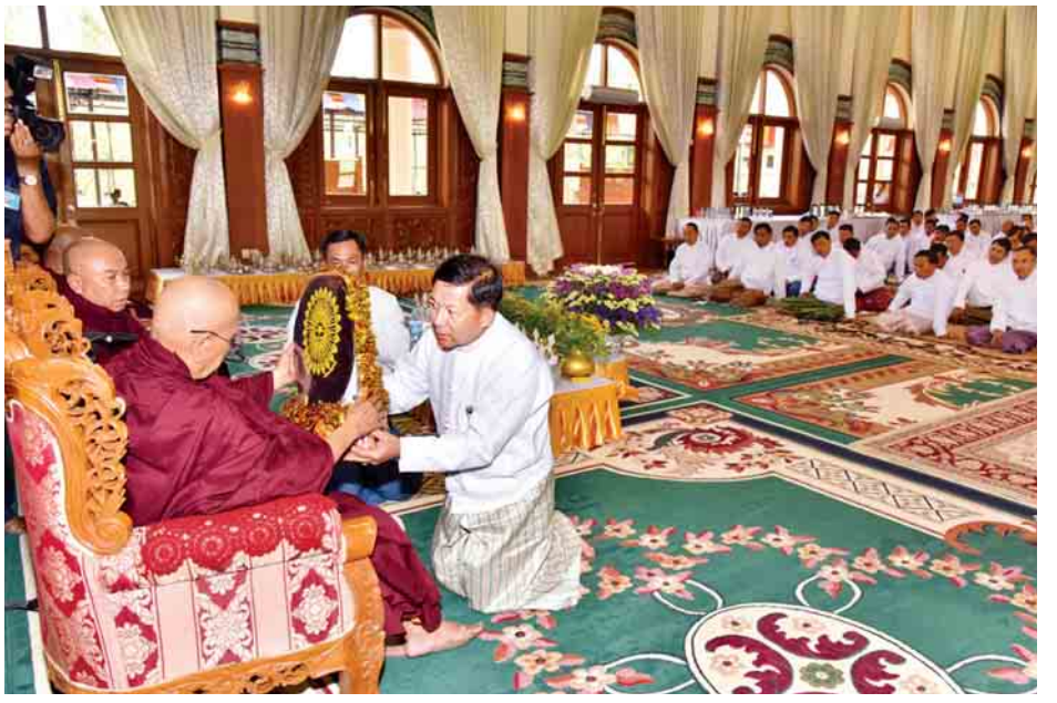
ယင်းနောက် မင်္ဂလာဇေယျပိဋိတက္ကသိုလ် ကျောင်း နာယူကြပြီး လှူဒါန်းမှုအစုအတွက် ရေစက်သွန်းချအမျှ တိုက်ဆရာတော်ထံမှ တပ်မတော်ကာကွယ်ရေးဦးစီးချုပ် ပေးဝေကာ အခမ်းအနားကို အောင်မြင်စွာ ရုပ်သိမ်းလိုက် အမျိုးပြုသော ဧည့်ပရိသတ်များက အနုမောဒနာတရား သည်။ (သတင်းစဉ်)

ထို့နောက် တက်ရောက်လာကြသူများက သံဃာ တော်များထံ လှူဖွယ်ပစ္စည်းများ ဆက်ကပ်လှူဒါန်း ကြသည်။