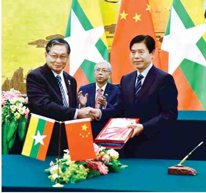
နိုင်ငံတော် သမ္မတ ဦးထင်ကျော်နှင့် ဇနီး ဒေါ်စုစုလှိုင်၊ တရုတ်ပြည်သူ့ သမ္မတနိုင်ငံ သမ္မတ မစ္စတာရှီကျင့်ဖျင်နှင့် ဇနီး မစ္စဖန်းလီလွမ်းတို့ မှတ်တမ်း တင်ဓာတ်ပုံရိုက်ကြစဉ်။ (ယာဝုံ) စီးပွားရေးနှင့် အတတ်ပညာ ပူးပေါင်းဆောင်ရွက်ရေး ဆိုင်ရာ သဘောတူညီချက် စာချုပ်ကို ပြည်ထောင်စု ဝန်ကြီး ဦးကျော်တင်ဆွေ နှင့် တရုတ်ကုန်သွယ်ရေး ဝန်ကြီး H.E. Mr. Zhong Shan တို့ လက်မှတ်ရေးထိုး လဲလှယ်ကြစဉ်။ (ဝဲဝဲ)