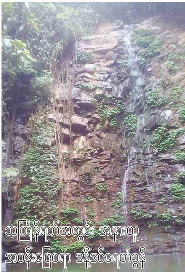
သင်္ကြန်ရက်အတွင်း အနားယူ အပန်းဖြေစရာ ဒီဒီဒီဂေတံခွန်