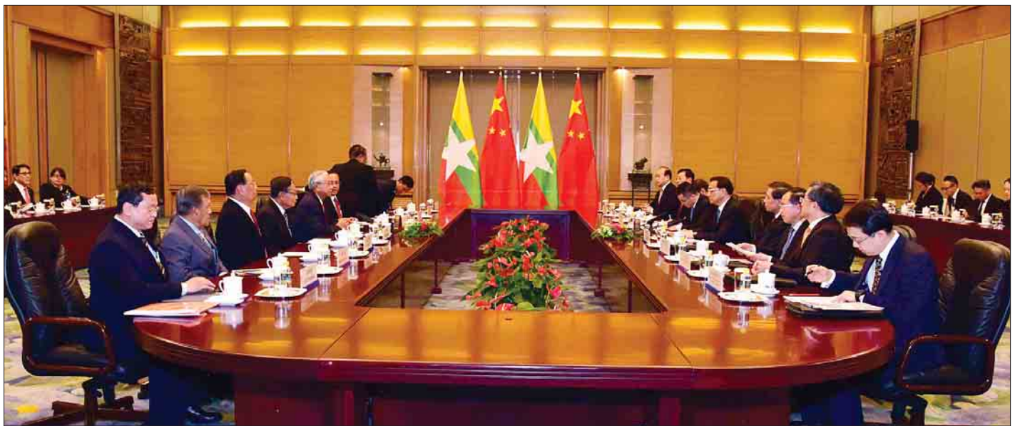
ပေကျင်းမြို့ ပြည်သူ့ခန်းမဆောင်ကြီး၌ နိုင်ငံတော်သမ္မတ ဦးထင်ကျော်နှင့် တရုတ်နိုင်ငံတော်ကောင်စီဝန်ကြီးချုပ် မစ္စတာလီခချန်းတို့ တွေ့ဆုံဆွေးနွေးစဉ်။