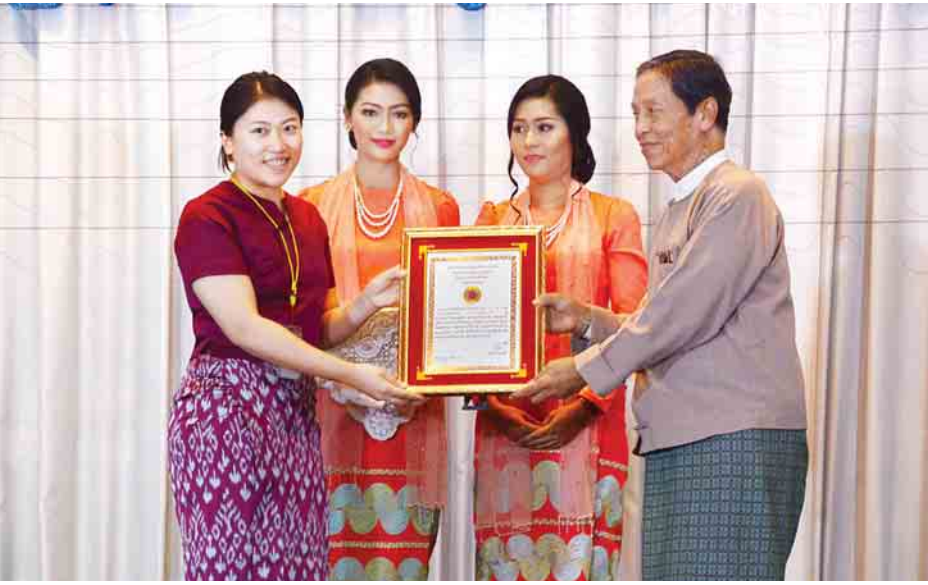
စည်းကြပ်နှစ်အတွင်း ဝင်ငွေခွန်ထမ်းဆောင်ခဲ့သည့် လုပ်ငန်းရှင်တစ်ဦးအား ဆုချီးမြှင့်စဉ်။

အခမ်းအနားတွင် ပြည်ထောင်စုဝန်ကြီး ဦးကျော်ဝင်း၊ ရန်ကုန်တိုင်းဒေသကြီးအစိုးရအဖွဲ့ ဝန်ကြီးချုပ် ဦးဖိုးမင်းသိန်း၊ စီမံကိန်းနှင့်ဘဏ္ဍာရေးဝန်ကြီးဌာန ဒုတိယဝန်ကြီး ဦးမောင်မောင်ဝင်း၊ ရန်ကုန်တိုင်းဒေသကြီး လွှတ်တော် ဒုတိယဥက္ကဋ္ဌ၊ ရန်ကုန်တိုင်းဒေသကြီး လုံခြုံရေးနှင့် နယ်စပ်ရေးရာဝန်ကြီး၊ ရန်ကုန်တိုင်း