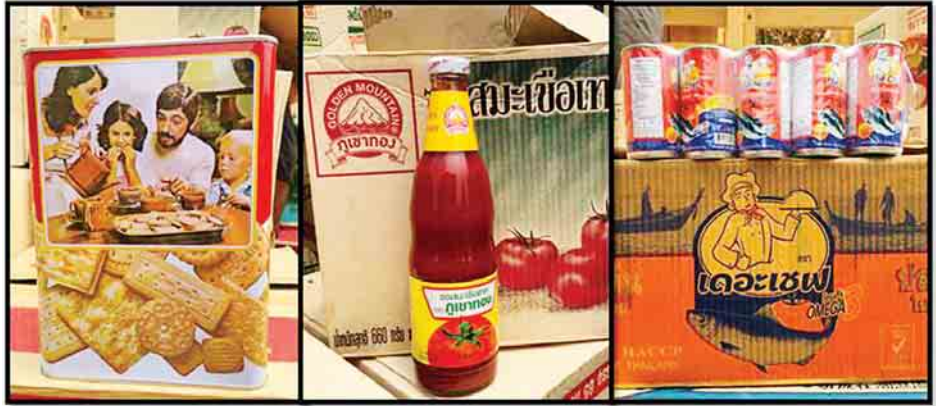
သွင်းကုန်ကြေညာလွှာတွင် ကြေညာထားသည်ထက် ပိုမိုပါရှိလာသည့် Canned fish, Tomato Ketchup, Biscuit များအား တွေ့ရစဉ်။