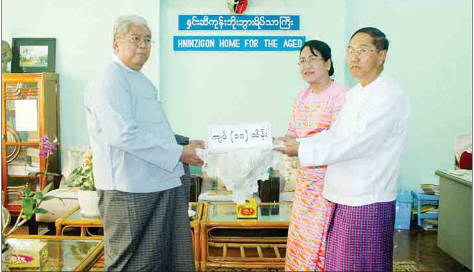
ဒုတိယသမ္မတ ဦးမြင့်ဆွေနှင့်ဇနီး ဒေါ်ခင်သက်ဌေး နှင်းဆီကုန်းဘိုးဘွားရိပ်သာကြီးသို့ ထာဝရဆွမ်းပဒေသာပင် ငွေကျပ် ၁၀ သိန်း လှူဒါန်းရာ ရိပ်သာကြီး၏အမှုဆောင်ဥက္ကဋ္ဌ ဒုတိယဗိုလ်မှူးကြီးကျော်ရှိန်(ငြိမ်း)လက်ခံစဉ်။

ရန်ကုန် ဧပြီ ၁၀ ဒုတိယသမ္မတ ဦးမြင့်ဆွေနှင့် ဇနီး ဒေါ်ခင်သက်ဌေးတို့သည် ယနေ့ နံနက်ပိုင်းတွင် ရန်ကုန်မြို့၊ ဗဟန်းမြို့နယ် အမှတ်(၂၁) ကမ္ဘာအေး ဘုရားလမ်းရှိ နှင်းဆီကုန်းဘိုးဘွားရိပ်သာကြီး၌ ဘိုးဘွားများအား အမွှေးနံ့သာများ ဆွတ်ဖျန်းခြင်း၊ ခေါင်းလျှော်ပေးခြင်းနှင့် လက်သည်၊ ခြေသည်းညှပ်ပေးခြင်းတို့ဖြင့် ကုသိုလ်ယူကြသည်။ ကိုယ်တိုင်ကိုယ်ကျ လှူဒါန်း ထို့နောက် နှင်းဆီကုန်းဘိုးဘွားရိပ်သာကြီးအတွက် ထာဝရဆွမ်းပဒေသာပင် ငွေကျပ် ၁၀ သိန်း စိုက်ထူကာ ဘိုးဘွားများအား လိမ်းဆေးများ ကိုယ်တိုင်ကိုယ်ကျ လှူဒါန်းခဲ့သည်။ (သတင်းစဉ်)