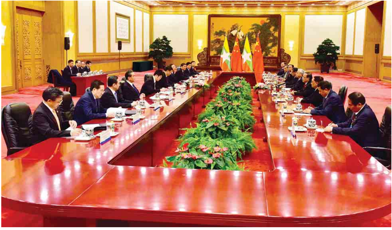
ပေကျင်းမြို့၊ ပြည်သူ့ခန်းမဆောင်ကြီးရှိ Hei Bei Hall ၌ နိုင်ငံတော်သမ္မတ ဦးထင်ကျော်နှင့် တရုတ်ပြည်သူ့သမ္မတနိုင်ငံသမ္မတ မစ္စတာရှီကျင့်ဖျင်တို့ တွေ့ဆုံဆွေးနွေးစဉ်။