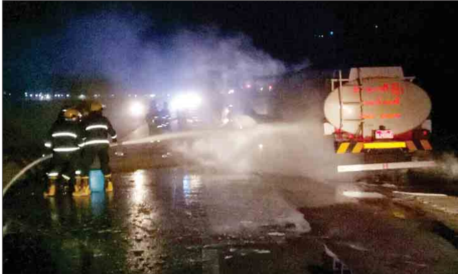
ဆေးရုံအနီးတွင် ရန်ကုန်တက်မှ 6J/--- လီးနိုး ၁၂ ဘီးအဖြူရောင် လောင်ကျွမ်းခဲ့ရာ နောက်ဘီးတာယာ လေးလုံး ပျက်စီးဆုံးရှုံးခဲ့ကြောင်း သိရသည်။

ညောင်လေးပင် ဧပြီ ၁၀ ပဲခူးတိုင်းဒေသကြီး ညောင်လေးပင် မြို့နယ် ပြန်တန်ဆာမြို့ မျက်စိဆေးရုံ အနီး ဧပြီ ၁၀ ရက် နံနက် ၀၀:၄၅ နာရီခန့်က ဆီဘောက်ဆာ ယာဉ်တစ်စီး မီးလောင်ကြောင်း သိရ သည်။