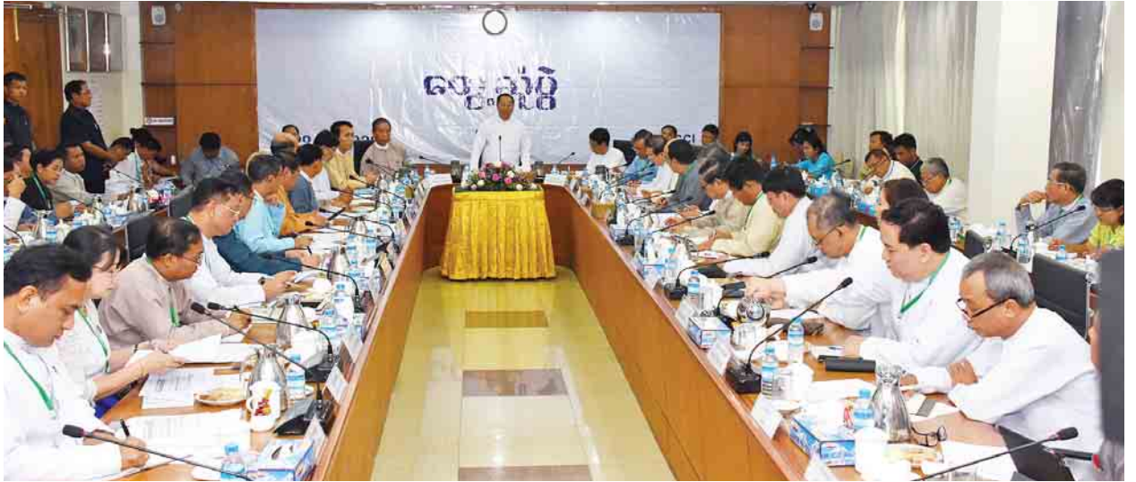
မြန်မာ့စီးပွားရေးလုပ်ငန်းရှင်များနှင့် ပဉ္စမအကြိမ် ပုံမှန်တွေ့ဆုံပွဲ၌ ပုဂ္ဂလိကကဏ္ဍ ဖွံ့ဖြိုးတိုးတက်ရေးကော်မတီဥက္ကဋ္ဌ ဒုတိယသမ္မတ ဦးမြင့်ဆွေ အမှာစကားပြောကြားစဉ်။

တွေ့ဆုံဆွေးနွေးပွဲတွင် ဒုတိယသမ္မတ ဦးမြင့်ဆွေက ပုဂ္ဂလိကကဏ္ဍ ဖွံ့ဖြိုးတိုးတက်ရေးအတွက် စီးပွားရေးလုပ်ငန်းရှင်များနှင့် တွေ့ဆုံဆွေးနွေးခဲ့ သည်မှာ ယခုဆိုလျှင် ပဉ္စမအကြိမ် ရှိပြီဖြစ်ပါကြောင်း၊ ထိုသို့တွေ့ဆုံဆွေးနွေး ရာတွင် ပထမအကြိမ် ချိတ်ဆက်ချက် ၂၇ ချက်၊ ဒုတိယအကြိမ် ချိတ်ဆက်ချက် ၁၁ ချက်၊ တတိယအကြိမ် ချိတ်ဆက်ချက် ၁၆ ချက်နှင့် စတုတ္ထအကြိမ် ချိတ်ဆက်ချက် ၁၁ ချက် စုစုပေါင်း ၆၅ ချက်ကို ချမှတ်ခဲ့ပါကြောင်း၊ အဆိုပါ ချိတ်ဆက်ချက် ၆၅ ချက်အနက် ၅၄ ချက်ကို သက်ဆိုင်ရာဝန်ကြီးဌာနများ၊ တိုင်းဒေသကြီး/ပြည်နယ်ဝန်ကြီးချုပ်များနှင့် လုပ်ငန်းကော်မတီများက ဆက်လက် ပေါင်းစပ်ညှိနှိုင်း စာမျက်နှာ ၅ ကော်လံ ၁ သို့ *