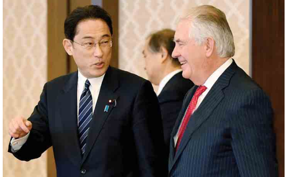
အင်န်အိတ်ချ်ကော။

ဒီရိုဒါကို အတိုချုပ်ပြောပြသည်။ မြောက်ကိုရီးယားအရေးနှင့်ပတ်သက်၍ တရုတ်နိုင်ငံ၏အရေးပါမှုကို နှစ်ဦးစလုံးက အပြန်အလှန်အမြင်ချင်းဖလှယ်ဆွေးနွေးခဲ့ကြပြီး တရုတ်နိုင်ငံပိုမိုပါဝင်ဆောင်ရွက်လာစေရေး တိုက်တွန်းကြရန်လည်း သဘောတူညီခဲ့ကြသည်။