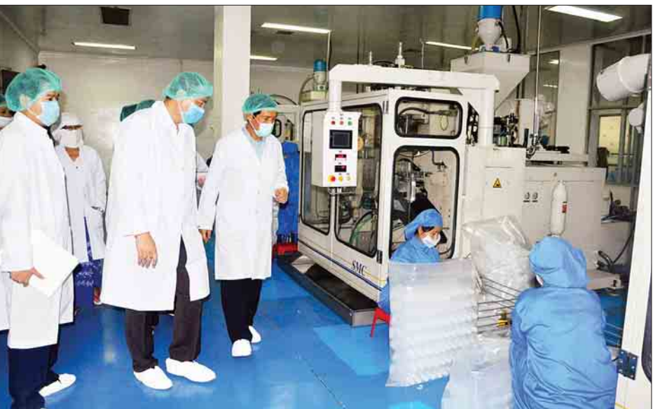
ပုံနှိပ်နေသည့် BPI ဆေးဝါးအတုများကိုလည်း တားဆီးကာကွယ်နိုင်ခဲ့ပြီး စက်ရုံထုတ် BPI ဆေးဝါးများကို ပြည်သူလူထုအလွယ်တကူ ဝယ်ယူနိုင်ရန် BPI ဆေးဝါးအရောင်းဆိုင်များကိုလည်း တိုးချဲ့ဖွင့်လှစ်သွားမည်ဖြစ်ကြောင်း သိရသည်။ မွန်းလွဲပိုင်းတွင် ပြည်ထောင်စုဝန်ကြီးသည် ရန်ကင်း မြို့နယ်ရှိ ရန်ကုန်တိုင်းစက်မှုကြီးကြပ်ရေးနှင့် စစ်ဆေးရေးဦးစီးဌာနသို့ရောက်ရှိပြီး လုပ်ငန်းဆောင်ရွက်နေမှုများအား ကြည့်ရှုစစ်ဆေးပြီး အစိုးရသစ် ဒုတိယနှစ်ကာလတွင် ပြည်သူလူထုအကျိုးပြုလုပ်ငန်းများကို ပြည်သူနှင့်အတူ လက်တွေ့ကျကျ အောင်မြင်အောင် အကောင်အထည်ဖော်ဆောင်ရွက်ကြရန် မှာကြားသည်။ (သတင်းစဉ်)

မြန်မာ့ဆေးဝါးလုပ်ငန်းအနေဖြင့် ဈေးကွက်အတွင်း