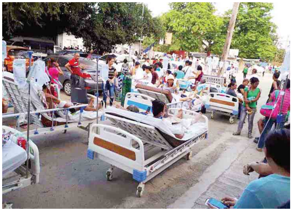
ငလျင်လှုပ်ခတ်ပြီးနောက် ဘာတန်ဂတ်စ်ဆေးကုသရေးစင်တာမှ လူနာများကို လမ်းမများပေါ်သို့ ရွှေ့ပြောင်းထားသည်ကို တွေ့ရစဉ်။