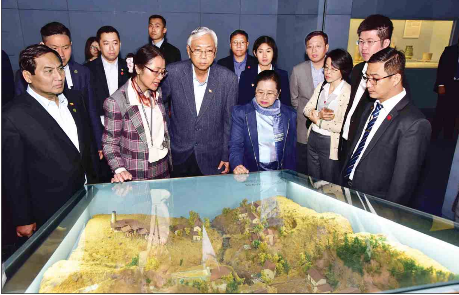
နိုင်ငံတော်သမ္မတ ဦးထင်ကျော်နှင့် ဇနီး ဒေါ်စုစုလွင်တို့ ရှန်ဟိုင်းမြို့ရှိ အမျိုးသားပြတိုက်၌ ကြည့်ရှုလေ့လာကြစဉ်။ (သတင်းစဉ်)

ထို့နောက် နိုင်ငံတော်သမ္မတနှင့် ဇနီးအဖွဲ့သည် ဟန်ကျိုးမြို့ရှိ အနောက်ဘက်ရေကန်(West Lake) သို့ သွားရောက်လေ့လာကြသည်။ ဟန်ကျိုးမြို့ရှိ အနောက်ဘက် ရေကန် (West Lake)သည် တရုတ် ပြည်သူ့သမ္မတနိုင်ငံ အရှေ့ဘက်ပိုင်း ကျွန်းပြည်နယ်၏မြို့တော် ဟန်ကျိုး မြို့တွင် တည်ရှိသည်။ အနောက်ဘက် ရေကန်ကို လျှောက်လမ်း သုံးခုဖြင့် အပိုင်း ငါးပိုင်း ခွဲခြားထားပြီး ကန်အနီး ဘုရားကျောင်းများ၊ ဘုရားများ၊ ဥယျာဉ်များနှင့် ကန်အတွင်း လူများ ပြုလုပ်ထားသည့် ကျွန်းငယ်များစွာ ရှိသည်။ ဟန်ကျိုးမြို့တွင် တည်ရှိသော အထင်ရှားဆုံး နေရာတစ်ခုဖြစ်ပြီး ပြည်တွင်း ပြည်ပ ခရီးသည်များ လာရောက်လည်ပတ်မှု အများဆုံး နေရာဖြစ်ကြောင်း သိရသည်။