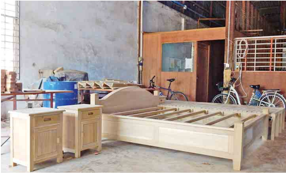
သင်တန်းသားများထုတ်လုပ်ထားသော သစ်အခြေခံပရိဘောဂပစ္စည်းများအား တွေ့ရစဉ်။

လူ့စွမ်းအားအရင်းအမြစ် ပွံ့ဖြိုး တိုးတက်စေရန်အတွက် သစ်အခြေခံ ပရိဘောဂ လုပ်ငန်းရှင်များအသင်းမှ ဦးစီးပြုလုပ်သော သစ်အခြေခံ ပရိဘောဂသင်တန်း အမှတ်စဉ် (၁/ ၂၀၁၇) ပို့ချပြီးစီးပြီဖြစ်၍ သင်တန်း ဆင်းပွဲကို မြောက်ဒဂုံမြို့နယ် ပင်လုံ လမ်းမကြီးပေါ်ရှိ သစ်အခြေခံစက်မှု နည်းပညာသင်တန်းဌာန၌ ဧပြီ ၆ ရက် နံနက် ၉ နာရီမှ မွန်းတည့် ၁၂ နာရီထိ ကျင်းပခဲ့သည်။