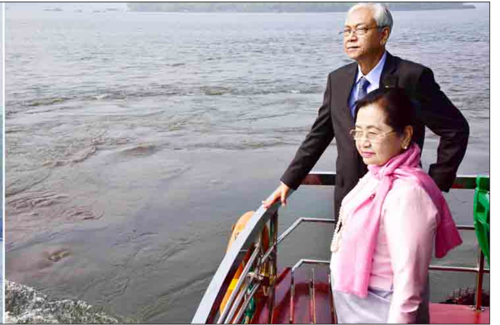
နိုင်ငံတော်သမ္မတ ဦးထင်ကျော်နှင့် ဇနီး ဒေါ်စုစုလွင်တို့ ဟန်ကျိုးမြို့ရှိ အနောက်ဘက်ရေကန်သို့ သွားရောက်လေ့လာကြစဉ်။ (သတင်းစဉ်)

ရွှေဖုံးမှ ၁၀ ခုကျော် ဝန်ဆောင်မှုပေး စီမံ ထုတ်လွှင့်ပေးနေကြောင်း သိရသည်။ ထို့နောက် နိုင်ငံတော်သမ္မတနှင့် ဇနီးအဖွဲ့သည် ရှန်ဟိုင်းအမျိုးသား ပြတိုက်သို့ရောက်ရှိကြပြီး ရှေးဟောင်း တရုတ်လူမျိုးတို့၏ ခိုးရာ၊ ယဉ်ကျေးမှု