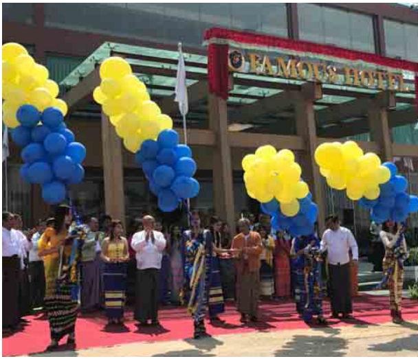
ဟိုတယ်နှင့် တည်းခိုခန်းဝန်ဆောင်မှုများသည်လည်း အရေးပါသော လုပ်ငန်းများ စည်ပင်ဖွံ့ဖြိုးမှုနှင့်အတူ ခရီးသွားများ တည်းခိုခန်းဝန်ဆောင်မှု

ယနေ့အချိန်အခါတွင် ပြည်နယ်နှင့် တိုင်းဒေသကြီးအသီးသီးတို့၌ ပြည်တွင်း၊ ပြည်ပ ခရီးသွားလုပ်ငန်းမှာ ဖွံ့ဖြိုးတိုးတက်လျက်ရှိပြီး ကမ္ဘာလှည့် ခရီးသွားများ စိတ်ဝင်စားလည်ပတ်ကြည့်ရှုစရာဒေသများလည်း များစွာပေါ်ထွက်လာလျက်ရှိသည်။ ထိုအထဲတွင် ကယားပြည်နယ်၏ မြို့တော်ဖြစ်သော လွိုင်ကော်မြို့၏ အနီးဝန်းကျင်ဒေသများသည်လည်း ကမ္ဘာလှည့်ခရီးသွားများရော ပြည်တွင်းခရီးသွားများပါ စိတ်ဝင်စားမှုဖြင့်တက်လျက်ရှိကာ ခရီးသွားလုပ်ငန်းဖွံ့ဖြိုးမှုအရှိန်ရလာသည့် ရပ်ဝန်းတစ်ခုပင်ဖြစ်သည်။