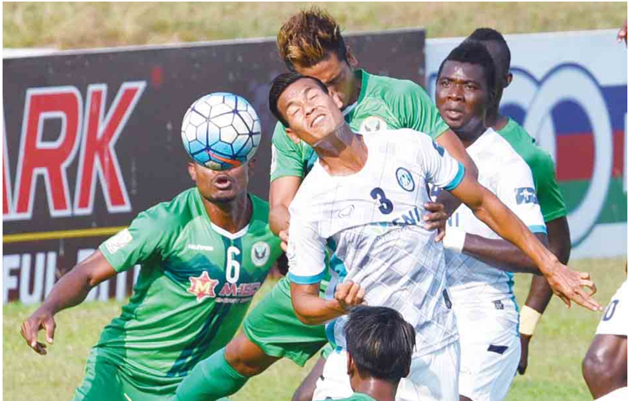
ရန်ကုန်နှင့် ချင်းယူနိုက်တက်တို့ ယှဉ်ပြိုင်နေစဉ်။