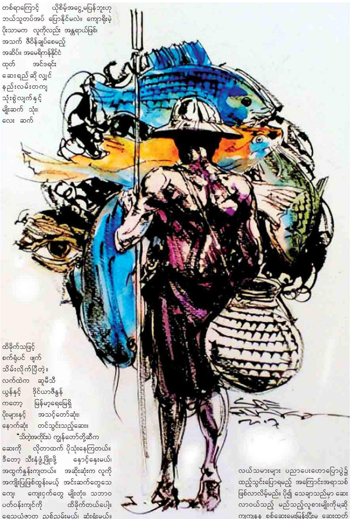
လယ်သမားများ ပညာပေးဟောပြောပွဲ၌ ထည့်သွင်းပြောရမည့် အကြောင်းအရာသစ် ဖြစ်လာလိမ့်မည်။ ပို၍ သေချာသည်မှာ ဆေး လာဝယ်သည့် မည်သည့်လူစားမျိုးကိုမဆို ကျကျနန စစ်ဆေးမေးမြန်းပြီးမှ ဆေးထုတ် ပေးသော အလေ့တစ်ခု အဖေ၌ ကျန်ရစ်ခဲ့ သည်။

“စပါးဖျက်ပိုးအတွက် သုံးမှာ မဟုတ်ဘူး ကောင်လေး၊ ငါက ငါးဖမ်းဖို့ ဆေးဝယ်သူ၏ စကားအဆုံး၊ အဖေနှုတ်မှ ဟာဗျာ ဟူသော အာမေဓိတ်။ ခံပြင်းသံနှင့်အတူ ထိုလူကြီး အား အဆိပ်ပြင်းသည့် သတ္တဝါကဲ့သို့ ကြည့်၏။ ထို့နောက် “ကဲပြောစမ်းပါဦး၊ ဘယ်လို ငါးဖမ်းမှာလဲ”ဟု မေးပစ်လိုက်သည်။ ထိုအခါ “ဒီလိုဗျာ ခပ်သေးသေး အင်းတွေ၊