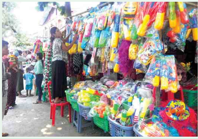
ရခိုင်ပြည်နယ် မောင်တောမြို့တွင် မဟာသင်္ကြန် ကာလ၌ ရေပတ်ကစား နိုင်ရန် ရေကစားစရာ အရုပ်၊ ရေပြွတ် ပစ္စည်းများ အရောင်းဆိုင်ကို ဧပြီ ၈ ရက်က တွေ့ရစဉ်။