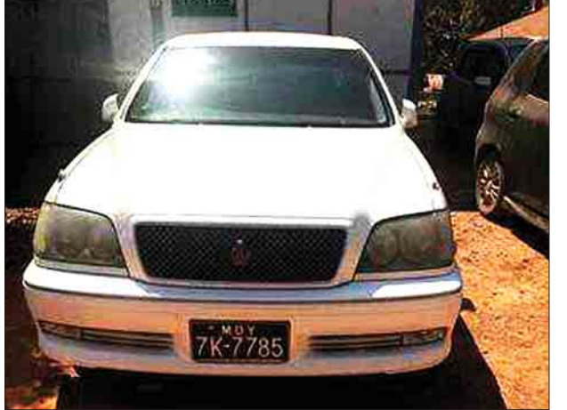
အထောက်အထား တစ်စုံတစ်ရာ တင်ပြနိုင်ခြင်းမရှိသည့် Crown အမျိုးအစား မော်တော်ယာဉ် တစ်စီး ခန့်မှန်းတန်ဖိုးငွေကျပ် လေးသန်းခန့်အား သိမ်းဆည်းခဲ့ ကြောင်း သိရသည်။ (ကြေးမုံ)

နေပြည်တော် ဧပြီ ၆ တရားမဝင်ကုန်စည်များ တားဆီးထိန်းချုပ်ရေးအတွက် ရေပူနှင့်မရမ်းချောင် အမြဲတမ်းစစ်ဆေးရေးစခန်းတို့အား ဌာနဆိုင်ရာပူးပေါင်းအဖွဲ့များဖြင့် မတ် ၁ ရက်တွင် စတင်ဖွင့်လှစ်ဆောင်ရွက်ခဲ့ပြီး ဧပြီ ၅ ရက်တွင် မန္တလေး-မူဆယ် ပြည်ထောင်စုလမ်းမကြီးတစ်လျှောက် ကုန်သွယ်မှုယာဉ် ပို့ကုန် ၄၂၆ စီး၊ သွင်းကုန် ၅၅၇ စီး၊ ရန်ကုန်-မြဝတီလမ်းမကြီးတစ်လျှောက် ကုန်သွယ်မှုယာဉ် ပို့ကုန် ၃၈ စီး၊ သွင်းကုန် အစီး ၁၇၀ ကုန်စည်များ သယ်ယူပို့ဆောင်လျက်ရှိသည်။ အဆိုပါ စစ်ဆေးရေးစခန်းများက တင်သွင်း/တင်ပို့သော ကုန်ပစ္စည်းများ အား စစ်ဆေးမှုပြုလုပ်ဆောင်ရွက်လျက်ရှိရာ ဧပြီ ၅ ရက်တွင် ရေပူအမြဲတမ်း စစ်ဆေးရေးစခန်းက တားဆီးမှု ခြောက်မှု(ခန့်)၊ တန်ဖိုးကျပ် ၄၁ ဒသမ ၅၀ သန်းခန့်)နှင့် မရမ်းချောင်အမြဲတမ်းစစ်ဆေးရေးစခန်းက တားဆီးမှု ခြောက်မှု (ခန့်)၊ တန်ဖိုးကျပ် ၅၇ ဒသမ ၄၄ သန်းခန့်) စုစုပေါင်း ၁၂၅ (ခန့်)၊ တန်ဖိုးကျပ် ၉၈ ဒသမ ၉၄ သန်း) သိမ်းဆည်းရမိကြောင်း သတင်းရရှိသည်။ ထူးခြားဖမ်းဆီးမှုအနေဖြင့် ဧပြီ ၅ ရက်တွင် မူဆယ်မြို့မှ မန္တလေးမြို့သို့ သွားရောက်မည့် Crown အမျိုးအစား မော်တော်ယာဉ်အား ရေပူအမြဲတမ်း စစ်ဆေးရေးစခန်း ပူးပေါင်းစစ်ဆေးရေးအဖွဲ့က စစ်ဆေးခဲ့ရာ မော်တော်ယာဉ် ကြမ်းခင်းအတွင်း အံ့ဝှက်များပြုလုပ်ထားပြီး တရားမဝင်စာရွက်စာတမ်း