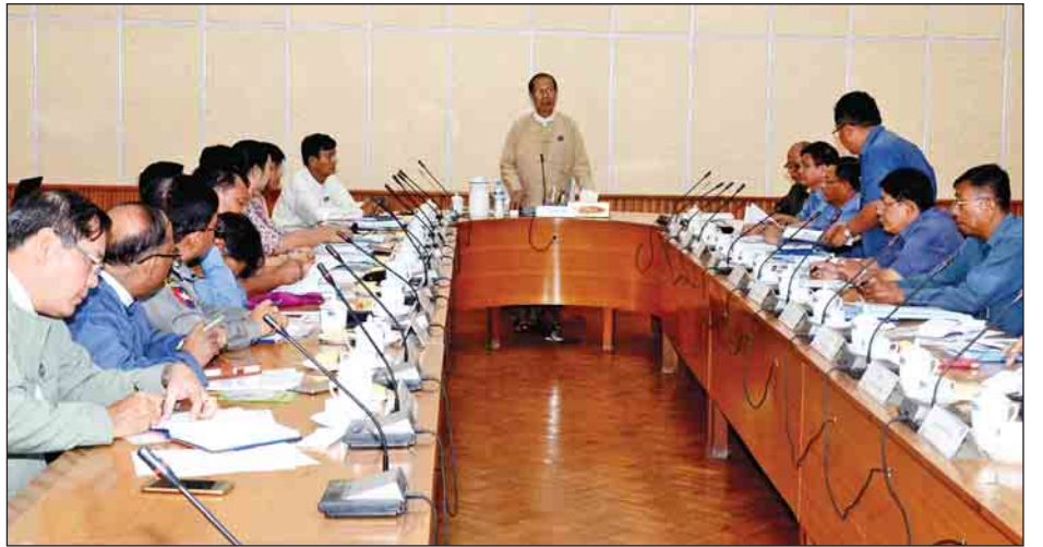
ရှင်များစွာဖြင့် စည်ကားသိုက်မြိုက်စွာ ကျင်းပသွားမည် ဖြစ်ကြောင်း၊ မဟာသင်္ကြန်ကာလအတွင်း မလိုလားအပ်သော ပြဿနာများ မဖြစ်ပွားစေရေးတို့အတွက် လုံခြုံရေး အစီအမံများကိုလည်း စနစ်တကျ ကြပ်မတ်ဆောင်ရွက် သွားမည်ဖြစ်ကြောင်း သိရသည်။ ဇော်မင်းအောင်(၁၀၇)

ယနေ့အစည်းအဝေးတွင် ၁၃၇၈ ခုနှစ် နေပြည်တော်မဟာသင်္ကြန်ကို ဖွင့်ပွဲ၊ ပိတ်ပွဲနှင့် ဖျော်ဖြေပွဲများကို ယိမ်းအကများ၊ မြန်မာ့အသံနှင့်ရုပ်မြင်သံကြား၊ သာသနာရေးနှင့် ယဉ်ကျေးမှုဝန်ကြီးဌာနတို့မှ ခေတ်ပေါ်တေးသံရှင်များအပြင် ထင်ရှားကျော်ကြားသည့် ခေတ်ပေါ် အနုပညာ