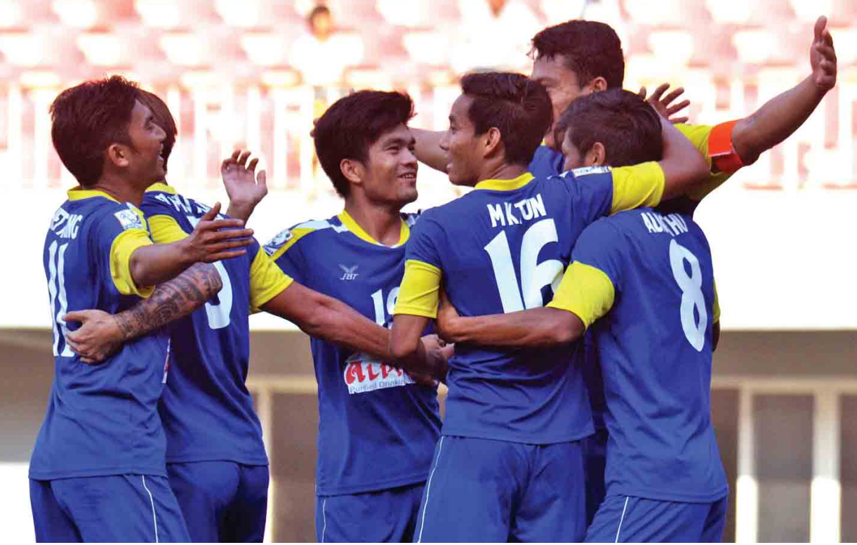
အဝေးကွင်း ပွဲကျပ်ကစားရမည့် ရတနာပုံအသင်း။