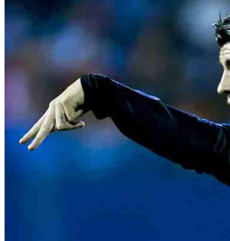
မေလဲသင်း - စုစည်းသည်။

ဧပြီ ၈ ရက်တွင် အက်သလက်တီကိုကို အိမ်ကွင်းတွင် ဧည့်ခံကစားရမည်ဖြစ်ပြီး ချန်ပီယံလိဂ်ပွဲစဉ်အဖြစ် ဧပြီ ၁၃ နှင့် ၁၉ ရက်တို့တွင် ဘိုင်ယန်မြူးနစ်အသင်း၊ ၁၅ ရက်တွင် ဝီဂျွန်၊ ၂၄ ရက်တွင် ဘာစီလိုနာတို့ကို ရင်ဆိုင်ရမည် ဖြစ်သည်။