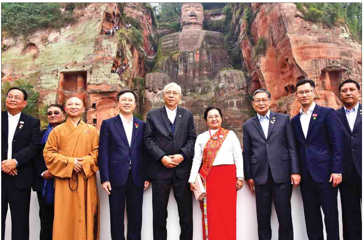
နိုင်ငံတော်သမ္မတ ဦးထင်ကျော်၊ ဇနီး ဒေါ်စုစုလှနှင့် အဖွဲ့ဝင်များ တရုတ် ပြည်သူ့သမ္မတနိုင်ငံ လေရှန်မြို့ရှိ Giant Buddha ကျောက်ထွင်းဗုဒ္ဓ ရုပ်ပွားတော်ကြီးအား ဖူးမြော်ကြည့်လိုပြီး အမှတ်တရဓာတ်ပုံ ရိုက်ကြစဉ်။