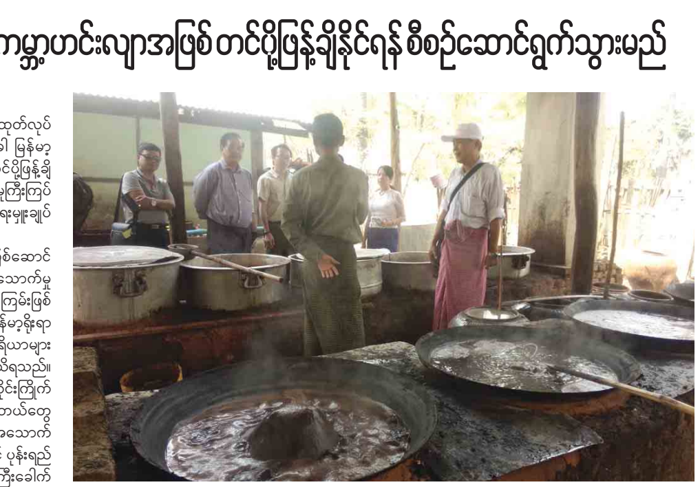
တင်စိုး (ပဲခူး)

သည့်အပြင် ငါးသရောက်၊ မြင်းခြံနှင့် ချောက်မြို့နယ်တို့မှ ထွက်ရှိသောလည်း လူသိနည်းပါးကြောင်း သိရသည်။ ပုန်းရည်ကြီးတွင် အဓိကလိုအပ်သော ကုန်ကြမ်းဖြစ်သည့် ပဲပိစပ်ကို နေပြည်တော်၊ ပျဉ်းမနားနှင့် သာဝတ္ထိတို့မှ အဓိကထွက်ရှိပြီး ပခုက္ကူ၊ ညောင်ဦးနှင့် မြင်းခြံတို့မှ အနည်းငယ်သာထွက်ရှိကြောင်း သိရသည်။