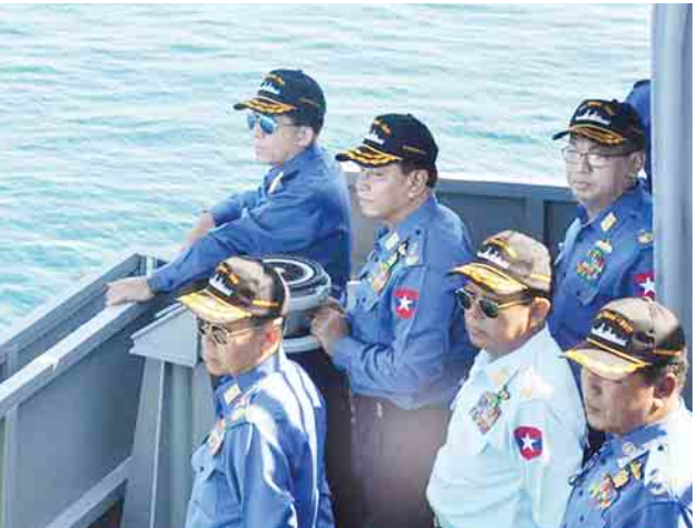
ပင်လယ်ပြင်စစ်ဆင်မှုလေ့ကျင့်ခန်း (Combined Fleet Exercise -Sea Shield 2017) သည် (၄)ကြိမ်မြောက် လုပ်ဆောင်ခြင်းဖြစ်ပြီး စစ်ရေယာဉ်မျိုးစုံ ၂၈ စင်းနှင့် ရဟတ်ယာဉ်များ၊ အရာရှိ၊ စစ်သည်အင်အား ၁၄၀၀ ကျော် ပါဝင်လေ့ကျင့်ခဲ့ကြကြောင်း သတင်းရရှိသည်။ (သတင်းစဉ်)