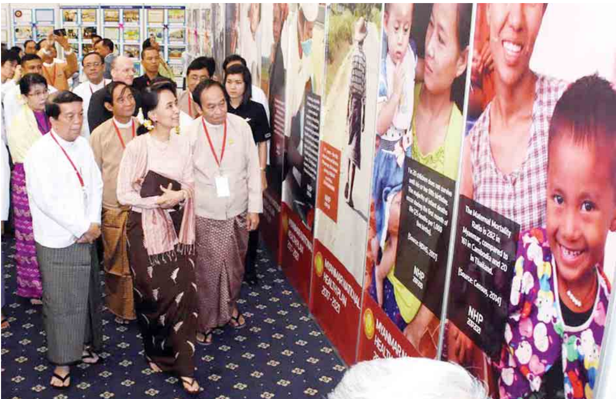
မှတ်တမ်း ဓာတ်ပုံ နိုင်ငံတော်၏ အတိုင်ပင်ခံပုဂ္ဂိုလ် ဒေါ်အောင်ဆန်းစုကြည်၊ ပြည်ထောင်စု လွှတ်တော်ဥက္ကဋ္ဌ ဦးဝင်းမြင့်တို့ ပြည်သူ့အခြေပြု ကျန်းမာရေး စောင့်ရှောက်မှု မှတ်တမ်းဓာတ်ပုံ များကို လှည့်လည် ကြည့်ရှုစဉ်။ (သတင်းစဉ်)

သူနာပြုဆရာမတစ်ဦးဖြစ်ခဲ့သည့် မိခင်ဖြစ်သူက အမြဲ ပြောလေ့ရှိပါကြောင်း၊ ကျန်းမာမှုဖြစ်မယ်၊ မကျန်းမာလျှင် ဘာမှလုပ်လို့မရဘူးဟု ပြောပါကြောင်း၊ ဉာဏ်ပညာ၊ အလုပ်အကိုင်၊ နေအင်အားများစွာရှိသည့် ပုဂ္ဂိုလ်များသည် ကျန်းမာရေးပျက်စီးယိုယွင်းသွားသည့်အခါ မည်သည့်စွမ်း ရည်မှမရှိတော့သည်ကို သူနာပြုဆရာမတစ်ဦးအနေဖြင့် ၎င်းကိုယ်တိုင်မြင်ခဲ့၍ ဖြစ်ပါကြောင်း၊ ကျန်းမာရေးကို အလွန်အလေးထားခဲ့ပါကြောင်း၊ ပြည်သူပြည်သားများ၏ ကျန်းမာရေးသည် မိမိတို့နိုင်ငံ၏ အဖိုးမဖြတ်နိုင်သည့် သယံဇာတတစ်ခုဖြစ်သည်ဟု ပြောလိုပါကြောင်း၊ ထို့ကြောင့် စနစ်တကျ ကျန်းမာရေးစောင့်ရှောက်မှုအတွက် အားလုံး ဝိုင်းပြီးကြိုးစားရမှာဖြစ်ပါကြောင်း၊ ယခုမိမိတို့၏ အမျိုး သားကျန်းမာရေးစီမံကိန်းသည် ပြည်သူ့အခြေပြုသည့် စီမံကိန်းမျိုးဖြစ်ပါကြောင်း၊ ပြည်သူ့ကို အခြေပြုသည့် စီမံကိန်းဖြစ်၍ ကျန်းမာရေးသည် အိမ်တွင်းမှစသည်ဟူသည့် အမြင်ဖြင့် မိမိတို့ဆက်သွားရန်လိုပါကြောင်း။