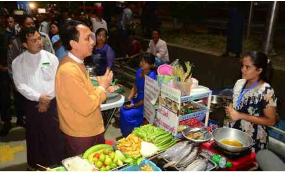
ရန်ကုန်တိုင်းဒေသကြီးဝန်ကြီးချုပ် ဦးဖြိုးမင်းသိန်း လမ်းဘေးဈေးသည်များနှင့် တွေ့ဆုံစဉ်။

ရှေးဟောင်းအဆောက်အအုံတွေကို အပြာရောင်တံဆိပ်ပြားကပ်ပြီးတော့ ဒီအဆောက်အအုံတွေကို ရှေးဟောင်းအမွေအနှစ်များအဖြစ် ထိန်းသိမ်းဖို့ ကြိုးပမ်းနေပါတယ်။ ကျေးလက်ဒေသကို အခြေပြုတဲ့ လူထုအခြေပြု ဒီဇိုင်းသွားလုပ်ငန်းကိုလည်း တုံ့တေးဘက်မှာ စတင်ဆောင်ရွက်နေပြီ ဖြစ်ပါတယ်။ လယ်ယာကဏ္ဍဖွံ့ဖြိုး တိုးတက်ရေး Master Plan တစ်ခုကို ရန်ကုန်တိုင်းဒေသကြီးအတွင်းမှာ ဘယ်လိုရှေ့ဆက် ဆောင်ရွက်မယ်ဆိုတာ ကျွန်တော်တို့ ရေးဆွဲပြီးဖြစ်ပါတယ်။ ညောင်နှစ်ပင်မှာ စိုက်ပျိုးရေး၊ မွေးမြူရေးအတွက် အဓိက Center ကြီးတစ်ခု ကြိုးပမ်းဖို့အတွက် Pilot Project တွေကိုလည်း စတင်နေပြီဆိုတာကို ပြောကြားလိုပါတယ်။ အနာဂတ်မှာ ပြည်သူလူထုတစ်ရပ်လုံးအတွက် ကျွန်တော်တို့ ရန်ကုန်တိုင်းဒေသကြီး အစိုးရ