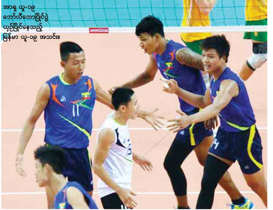
အာရှ ယူ-၁၉ ဘော်လီဘောပြိုင်ပွဲ ယှဉ်ပြိုင်နေသည့် မြန်မာ ယူ-၁၉ အသင်း။

ကြားဖြတ်ရွေးကောက်ပွဲရလဒ်များ အချိန်နှင့်တစ်ပြေးညီထုတ်လွှင့်မည် နေပြည်တော် မတ် ၃၁ ပြည်ထောင်စုရွေးကောက်ပွဲကော်မရှင်သည် ၂၀၁၇ခုနှစ် ဧပြီ ၁ ရက် (စနေနေ့)တွင် လွှတ်တော်ကိုယ်စားလှယ် နေရာလစ်လပ်နေသည့် မဲဆန္ဒနယ် ၁၉ နယ်အတွက် ကြားဖြတ်ရွေးကောက်ပွဲများ ကျင်းပသွားမည်ဖြစ်သည်။ အဆိုပါ ကြားဖြတ်ရွေးကောက်ပွဲရလဒ်များအား နေပြည်တော်ရှိ ပြည်ထောင်စုရွေးကော်မရှင်ရုံး Result Centerတွင် ယင်းနေ့ညနေပိုင်းမှစတင်၍ ထုတ်ပြန်ကြေညာပေးသွားမည်ဖြစ်ရာ တစ်နိုင်လုံးရှိ ပြည်သူ လူထုအား အချိန်နှင့်တစ်ပြေးညီ သိရှိနိုင်ရေးအတွက် မြန်မာ့ရုပ်မြင်သံကြားနှင့် မြန်မာ့အသံရေဒီယိုတို့မှ တိုက်ရိုက် ထုတ်လွှင့်ပေးသွားမည်ဖြစ်ကြောင်း သတင်းရရှိသည်။ (သတင်းစဉ်)