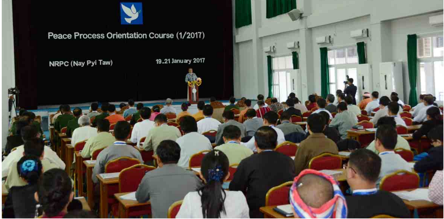
နိုင်ငံတော်အတိုင်ပင်ခံရုံးဝန်ကြီးဌာန ပြည်ထောင်စုဝန်ကြီး ဦးကျော်တင့်ဆွေ ၂၀၁၇ ခုနှစ် ဇန်နဝါရီ ၁၉ ရက်က နေပြည်တော်တွင် ကျင်းပသည့် ငြိမ်းချမ်းရေးလုပ်ငန်းစဉ်များဆိုင်ရာ ဆွေးနွေးပွဲချမှတ်တန်းတွင် အမှာစကားပြောကြားစဉ်။

ထိုသို့ငြိမ်းချမ်းရေးဖြစ်စဉ်တွင် ပါဝင် ဆောင်ရွက်နေသူ အသီးသီးနှင့်တွေ့ဆုံခြင်း၊ အပြန်အလှန်ဆွေးနွေးခြင်း၊ အကြံပြုချက်များ ရယူခြင်း စသည်တို့ကို ဆောင်ရွက်ပြီးနောက် ပန်းတိုင် (၃)ရပ်လုံးအတွက် အင်စတီကျူးရှင်း အထူးကဏ္ဍ (၁) သို့ >>>