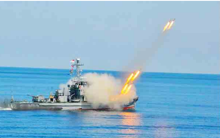
စစ်နည်းဗျူဟာအရ ရေပြင်ရန်ကာကွယ်ရေးစစ်ဆင်မှု လေ့ကျင့်ခန်းကို ဆက်လက်ဆောင်ရွက်သည်။ ယနေ့ပြုလုပ်ခဲ့သည့် စစ်ရေယာဉ်တပ်ပေါင်းစု

နေပြည်တော် မတ် ၃၁ တပ်မတော်ကာကွယ်ရေးဦးစီးချုပ် ဗိုလ်ချုပ်မှူးကြီး မင်းအောင်လှိုင်သည် တပ်မတော်(ရေ) ဝတ်စုံအား ဂုဏ်ပြုဝတ်ဆင်၍ ယနေ့နံနက်ပိုင်းတွင် မြန်မာ့ရေပိုင်နက် (ကိုကိုးကျွန်းဒေသ)၌ ပြုလုပ်သည့် စစ်ရေယာဉ်တပ်ပေါင်းစု ပင်လယ်ပြင်စစ်ဆင်မှု လေ့ကျင့်ခန်း(Combined Fleet Exercise -Sea Shield 2017)ကို တာဝန်ရှိသူများနှင့်အတူ အကဲကြည့်စစ်ရေယာဉ် အောင်ဇေယျပေါ်မှ လိုက်ပါ ကြည့်ရှုအားပေးကြသည်။ တပ်မတော် (ရေ) အထူးစစ်ဆင်ရေးတပ်ဖွဲ့(NAVY SEALs) တပ်ဖွဲ့ဝင်များက ရန်သူများစီးနင်းထားသည့် ခရီးသည်တင်ကုန်သွယ်ရေးယာဉ်တစ်စင်းအား အမြန်သွားကင်းလှည့် တိုက်ခိုက်ရေး ရေယာဉ်လေးစီး၊ ရဟတ်ယာဉ် သုံးစင်းဖြင့် ဝင်ရောက်စီးနင်း၍ ဖမ်းဆီးခံ ဓားစာခံများအား ကယ်ဆယ်ခြင်းလေ့ကျင့်ခန်းကို ဆောင်ရွက်သည်။ ထို့နောက် စစ်ရေယာဉ် အောင်ဇေယျပေါ်၌ ရဟတ်ယာဉ် တက်၊ ဆင်းခြင်း လေ့ကျင့်ခန်းကို ပြုလုပ်ပြီး ရေတပ်