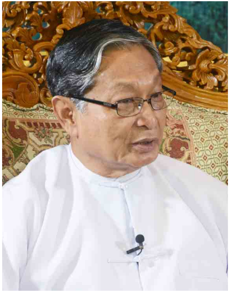
နိုင်ငံတော်အတိုင်ပင်ခံရုံးဝန်ကြီးဌာန ပြည်ထောင်စုဝန်ကြီး ဦးကျော်တင့်ဆွေ။

နိုင်ငံတော်အတိုင်ပင်ခံရုံးအနေဖြင့် ငြိမ်းချမ်းရေးနှင့် စပ်လျဉ်းသည့် လုပ်ငန်းစဉ်များအတွက် လိုအပ်သော ရန်ပုံငွေများအား