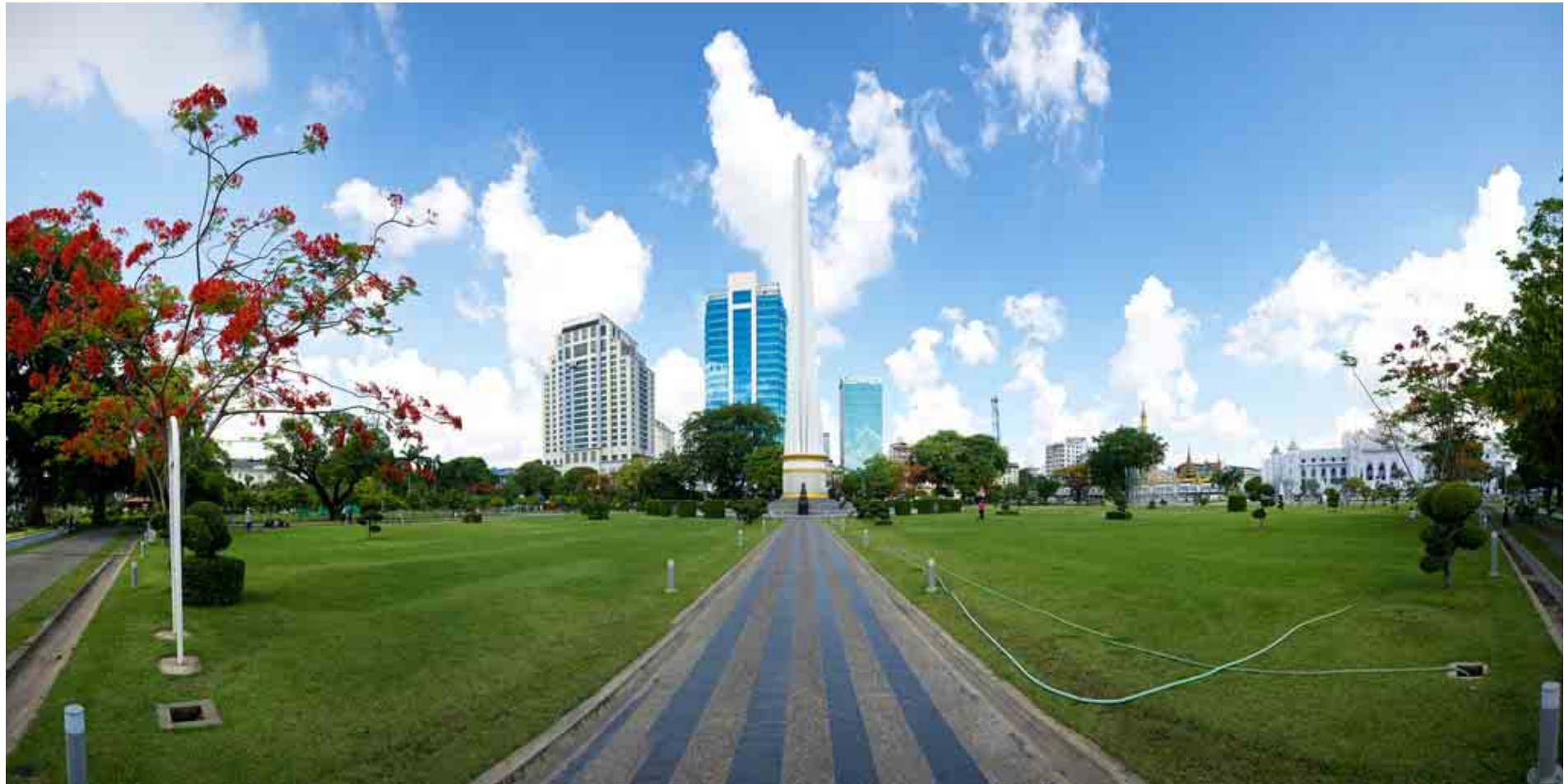
မြို့ပြအင်္ဂါရပ်နှင့်အညီ သပ်ရပ်သန့်ရှင်းနေသော မဟာဗန္ဓုလပန်းခြံမြင်ကွင်း။