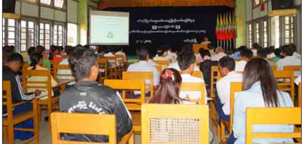
တပ်ကုန်းမြို့နယ်တွင် တတိယနှစ်စက်ဝန်းအတွင်း လုပ်ငန်းခွဲပေါင်း ၁၅၃ ခု စတင်အကောင်အထည်ဖော်ဆောင်ရွက်

တပ်ကုန်းမြို့နယ်တွင် ၂၀၁၇ ခုနှစ် လူထုပတ်ဝန်းကျင်စီမံကိန်းတတိယနှစ်စက်ဝန်း အတွင်း ပထမအကြိမ် လုပ်ငန်းခွဲ ၃၇ ခု၊ ဒုတိယအကြိမ် လုပ်ငန်းခွဲ ၅၀၊ တတိယအကြိမ်လုပ်ငန်းခွဲ ၆၆ ခု စုစုပေါင်းလုပ်ငန်းခွဲ ၁၅၃ ခု အတည်ပြု၍ လုပ်ငန်းအကောင်အထည်ဖော်ဆောင်ရွက်မည်ဖြစ်ကြောင်း မြို့နယ်ကျေးလက် ဒေသဖွံ့ဖြိုးတိုးတက်ရေးဦးစီးဌာနမှ သိရသည်။