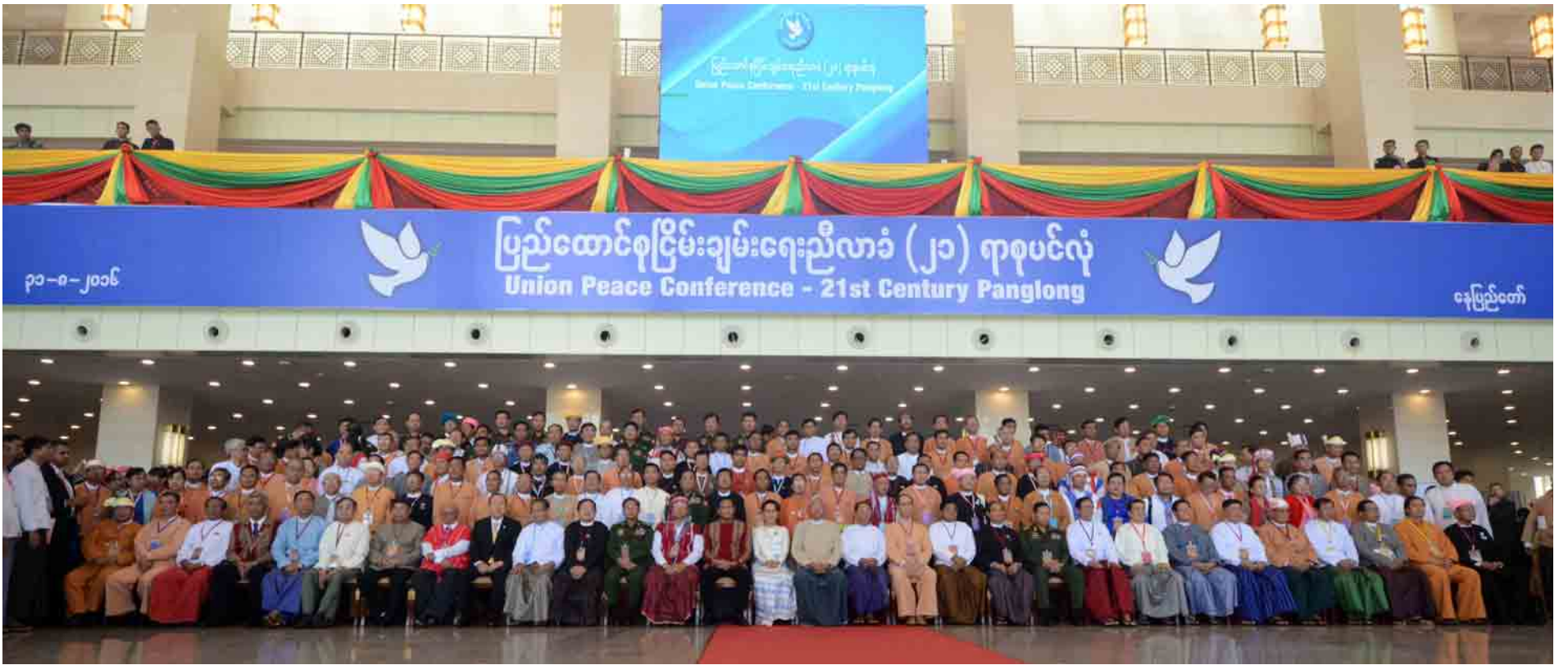
၂၀၁၆ ခုနှစ် ဩဂုတ် ၃၁ ရက်က ကျင်းပသော ပြည်ထောင်စုငြိမ်းချမ်းရေးညီလာခံ-(၂၁) ရာစုပင်လုံ ဖွင့်ပွဲအခမ်းအနားသို့ တက်ရောက်လာကြသူများ စုပေါင်းမှတ်တမ်းတင်ဓာတ်ပုံရိုက်ကြစဉ်။