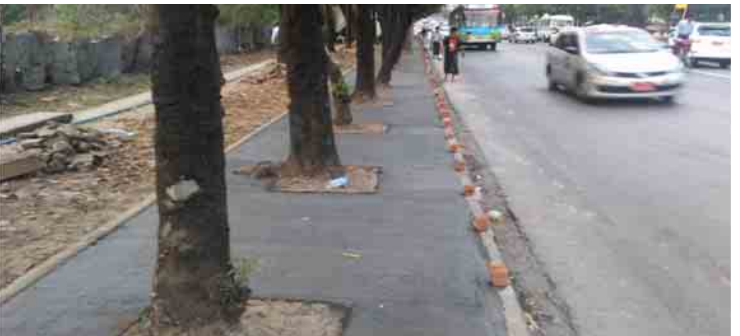
ရန်ကုန်တိုင်းဒေသကြီးအတွင်း လျှပ်စစ်မီးရရှိရေး၊ ပလတ်ဖောင်းများနှင့် နောက်ဖေးလမ်းကြား သန့်ရှင်းသပ်ရပ်ရေးဆောင်ရွက်ထားမှုကို တွေ့ရစဉ်။

ရှေ့အနာဂတ်ရက်များတွင်လည်း ပြည်သူတို့ဘဝ လှပသည်ထက် လှပ၊ အောင်မြင်သည်ထက် အောင်မြင်ရန် ကြိုးပမ်းစွမ်းဆောင်လျက် ရန်ကုန်တိုင်းဒေသကြီး အစိုးရအဖွဲ့အနေဖြင့် ကောင်းမွန်သော စီမံချက်များဖြင့် ဆောင်ရွက်မည်ဟု ယုံကြည်ပါကြောင်း။ ။