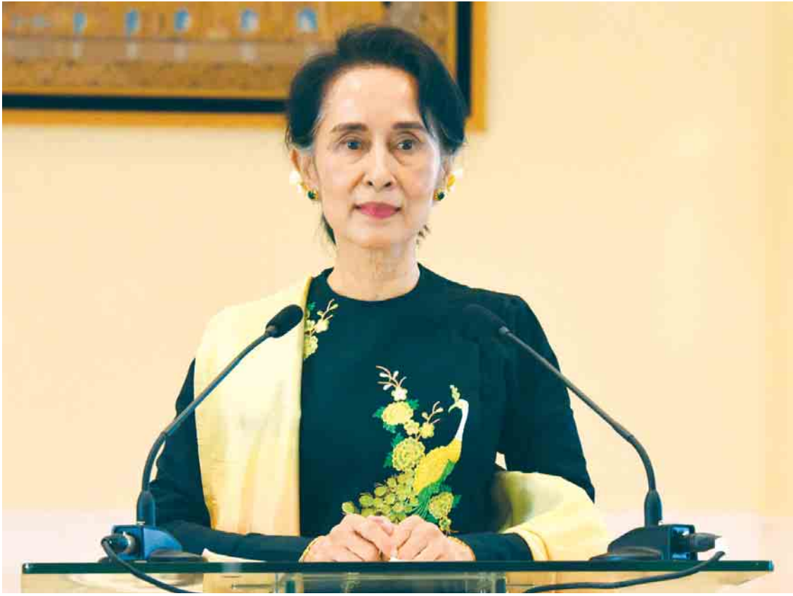
နိုင်ငံတော်၏ အတိုင်ပင်ခံပုဂ္ဂိုလ် ဒေါ်အောင်ဆန်းစုကြည်။

“နိုင်ငံတော်အတိုင်ပင်ခံရုံးဝန်ကြီးဌာန ဟာ စင်စစ်အားဖြင့် နိုင်ငံတော်၏အတိုင်ပင်ခံ ပုဂ္ဂိုလ်ကို လိုအပ်တာတွေ ပံ့ပိုးကူညီဆောင်ရွက် ပေးနေတဲ့၊ နိုင်ငံတော်၏အတိုင်ပင်ခံပုဂ္ဂိုလ် ချမှတ်ပေးတဲ့မူဝါဒတွေကို အကောင်အထည် ဖော်ရာမှာ ပေါင်းစပ်ညှိနှိုင်းပေးနေတဲ့ အထောက်အကူပြုဝန်ကြီးဌာနတစ်ခု ဖြစ်ပါ တယ်။ ဒါကြောင့် နိုင်ငံတော်အတိုင်ပင်ခံရုံး ဝန်ကြီးဌာနရဲ့ ဆောင်ရွက်ချက်တွေဟာ နိုင်ငံတော်၏အတိုင်ပင်ခံပုဂ္ဂိုလ်ရဲ့ ဆောင် ရွက်ချက်တွေနဲ့ ဆက်သွယ်နေတယ်လို့ ဆိုနိုင် ပါတယ်။ အစိုးရသစ်ရဲ့ တစ်နှစ်တာကာလ အတွင်းမှာ နိုင်ငံတော်အတိုင်ပင်ခံရုံးဝန်ကြီး ဌာနအနေနဲ့ အမျိုးသားပြန်လည်သင့်မြတ် ရေးနဲ့ ငြိမ်းချမ်းရေးလုပ်ငန်းစဉ်များ၊ ရခိုင် ပြည်နယ် တည်ငြိမ်အေးချမ်းရေးနဲ့ ဖွံ့ဖြိုး တိုးတက်မှု အကောင်အထည်ဖော်ရေး လုပ်ငန်းစဉ်များကို အဓိကထားဆောင်ရွက် ခဲ့ပါတယ်။ ဒါ့အပြင်နိုင်ငံရေးနဲ့ဆက်သွယ်ပြီး ထိန်းသိမ်းခံရသူတွေ လွတ်မြောက်ရေး၊ အင်္ဂတီလိုက်စားမှု တိုက်ဖျက်ရေးအပါအဝင် နိုင်ငံတော်အတွက် အရေးကြီးတဲ့ကဏ္ဍတွေကို နိုင်ငံတော်၏အတိုင်ပင်ခံပုဂ္ဂိုလ် ချမှတ်ပေးတဲ့ မူဝါဒ၊ လမ်းညွှန်ချက်နဲ့အညီ အကောင်အထည် ဖော် ဆောင်ရွက်ခဲ့ပါတယ်”ဟု နိုင်ငံတော် အတိုင်ပင်ခံရုံးဝန်ကြီးဌာန ပြည်ထောင်စု ဝန်ကြီး ဦးကျော်တင့်ဆွေက ပြောကြားသည်။