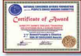
GMP Certificate ISO 9001:2008 Global Excellence Award People Choice Award

(၃) ရွှေပြည်နန်းစက်ရုံတွင် အသုံးပြုသောရေမှာ သာမန်ရေထက် အဆ ၃၀၀၀ ပိုမိုသန့်စင်။ ရေကို သန့်စင်ရာတွင် ခရမ်းလွန်ရောင်ခြည် (UV) နှင့် ဖြတ်ခြင်း၊ Reverse Osmosis (RO)၊ အိုဇုန်း (Ozone) နှင့် ဖြတ်ခြင်း အစရှိတဲ့ နည်းအမျိုးမျိုးရှိပါတယ်။ ရွှေပြည်နန်းမှာ အသုံးပြုတဲ့ရေကို အဆိုပါ နည်း ၃ မျိုးလုံးနှင့် သန့်စင်ထားပါတယ်။ Ozone နှင့် အရင်ဖြတ်၍ ထွက်လာသောရေကို RO စနစ်ဖြင့်သန့်စင်ပါတယ်။ နောက်ဆုံးမှာတော့ UV ဖြင့် တဆင့်ထပ်ပြီး ကျန်ရှိနိုင်တဲ့ ပိုးမွှားတွေကို သန့်စင်ပါတယ်။ ဤသို့ ရရှိလာတဲ့ရေဟာ သာမန်ရေထက် အဆ ၃၀၀၀ ပိုမိုသန့်စင်ပါတယ်။ အလှူကုန်တရားပြုလုပ်ရာတွင် အသုံးပြုထားသောရေမှာ အလွန်တရားမဲ့ အရေးကြီးပါတယ်။ ကိုရီးယားနိုင်ငံမှာဆိုရင် လွန်စွာသန့်စင်ထားသောရေဖြင့်ပြုလုပ်ထားသည့် အလှူကုန်တွေဆိုရင် ငွေကျပ်သောင်းနှင့်ချီ၍ ရောင်းချပါတယ်။ မြန်မာ့သဘာဝသနပ်ခါးကို နိုင်ငံတကာအဆင့်မှီသန့်စင်ထားသောရေဖြင့် ပေါင်းစပ်ထားတဲ့ ရွှေပြည်နန်းသနပ်ခါးပါ ခင်ဗျား။