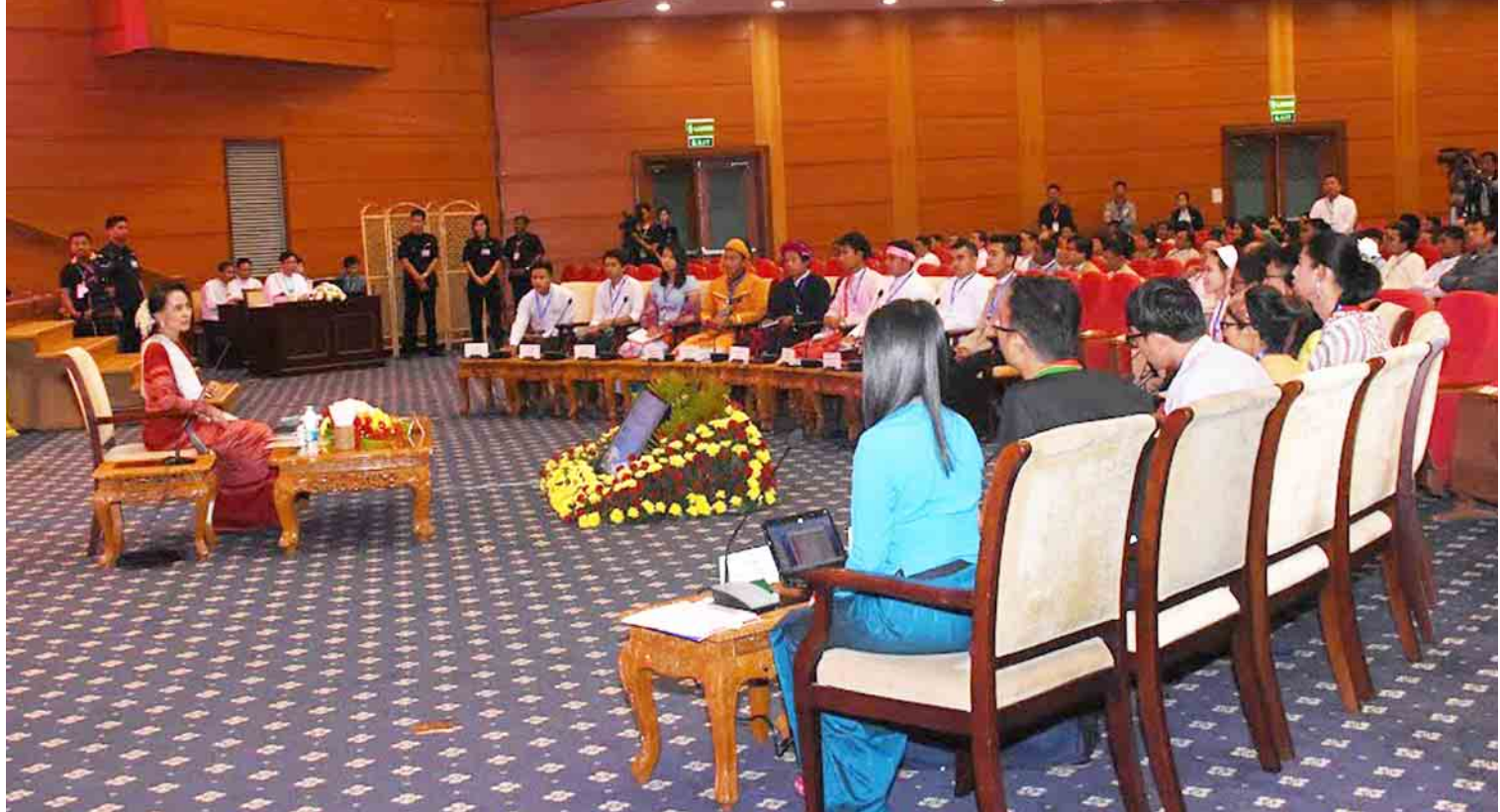
၂၀၁၇ ခုနှစ် ဇန်နဝါရီလက နိုင်ငံတော်၏အတိုင်ပင်ခံပုဂ္ဂိုလ် ဒေါ်အောင်ဆန်းစုကြည်နှင့် လူငယ်များ ငြိမ်းချမ်းရေးစကားဝိုင်း ပြုလုပ်နေစဉ်။

လက်ရှိ ငြိမ်းချမ်းရေးဖြစ်စဉ်သည် NCA ကို အခြေခံ၍ တိုးတက်ဖြစ်ပေါ်လာသော လုပ်ငန်းစဉ် တစ်ရပ်ဖြစ်သည်။ နိုင်ငံရေးဆွေးနွေးပွဲများ ဖြစ်ထွန်းပေါ်ပေါက်လာစေသည့် NCA သည် ပစ်ခတ်တိုက်ခိုက်မှုရပ်စဲရေးသဘာမက ပစ်ခတ်တိုက်ခိုက်မှု ရပ်စဲရေးအပေါ် စောင့်ကြည့်၍ ညှိနှိုင်းဖြေရှင်းသည့် လုပ်ငန်းစဉ်များကို သဘောတူညီခြင်းဖြစ်