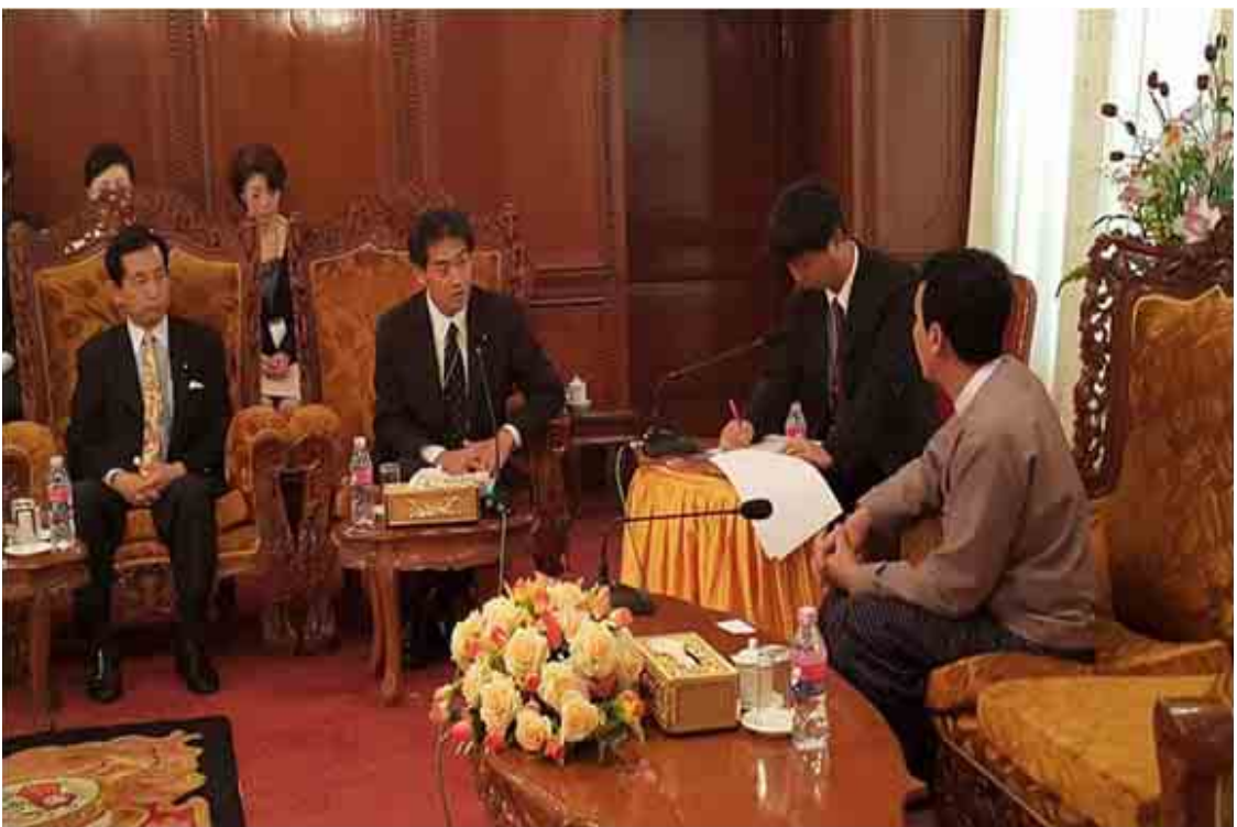
ရန်ကုန်တိုင်းဒေသကြီးဝန်ကြီးချုပ် ဦးပြီးမင်းသိန်း နိုင်ငံခြားဧည့်အဖွဲ့အား လက်ခံတွေ့ဆုံစဉ် (အပေါ်ပုံ)၊ တိုင်းဒေသကြီးလွှတ်တော် တက်ရောက်နေစဉ် (အောက်ပုံ) နှင့် ဒဂုံဆိပ်ကမ်းအိမ်ရာပုံစံငယ်အား ကြည့်ရှုနေစဉ်။ (အောက်ဆုံးပုံ)

“နိုင်ငံခြားရင်းနှီးမြုပ်နှံမှုတွေကို ဖိတ်ခေါ် အထူးကဏ္ဍ (ခ) သို့ >>>