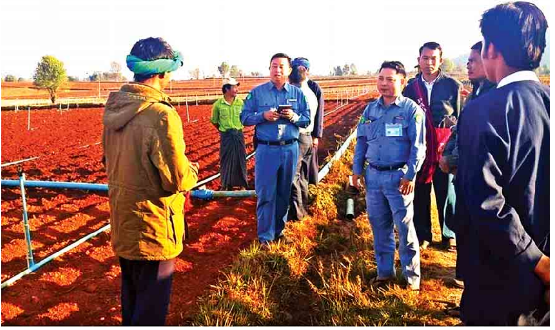
ဘိန်းစိုက်ပျိုးမှုပျောက်ရေးအတွက် အစားထိုးသီးနှံစိုက်ပျိုးနိုင်ရေး နောင်တရား၌ စီမံကိန်းအဖွဲ့ဝင်များက ကွင်းဆင်းဆောင်ရွက်နေစဉ်။

ဤသည်တို့ကို အလေးအနက်ခံယူလျက် နယ်စပ်ရေးရာဝန်ကြီးဌာနသည် ချမှတ်ထား သော မူဝါဒ၊ ရည်မှန်းချက်များနှင့်အညီ နယ်စပ်ဒေသနှင့် တိုင်းရင်းသားလူမျိုးများ ဖွံ့ဖြိုးတိုးတက်ရေး၊ လူစွမ်းအားအရင်းအမြစ် ဖွံ့ဖြိုးတိုးတက်ရေးလုပ်ငန်းများကို တိုင်းရင်း သား သွေးချင်းများနှင့် အတူတကွ လက်တွဲ ပူးပေါင်း၍ အားသွန်ခွန်စိုက် ကြိုးပမ်းဆောင် ရွက်လျက်ရှိကြောင်း ရေးသားတင်ပြလိုက် ပါသည်။ ။