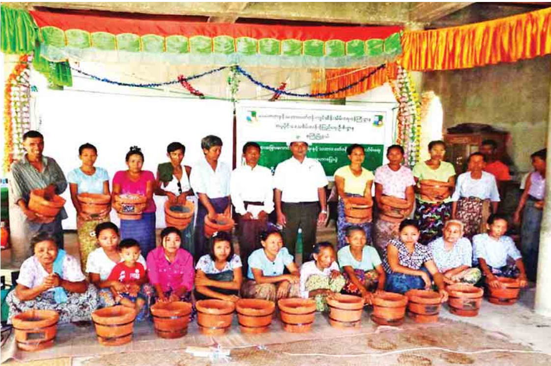
ရေကြိုမြို့နယ် ထန်းတိုင်ပြကျေးရွာတွင် ဟောပြောပွဲကျင်းပပြီးနောက် စွမ်းအားမြှင့်တင်ရေးအဖွဲ့ဝင်များနှင့်အတူ စုပေါင်းမှတ်တမ်းတင်ဓာတ်ပုံရိုက်စဉ်။