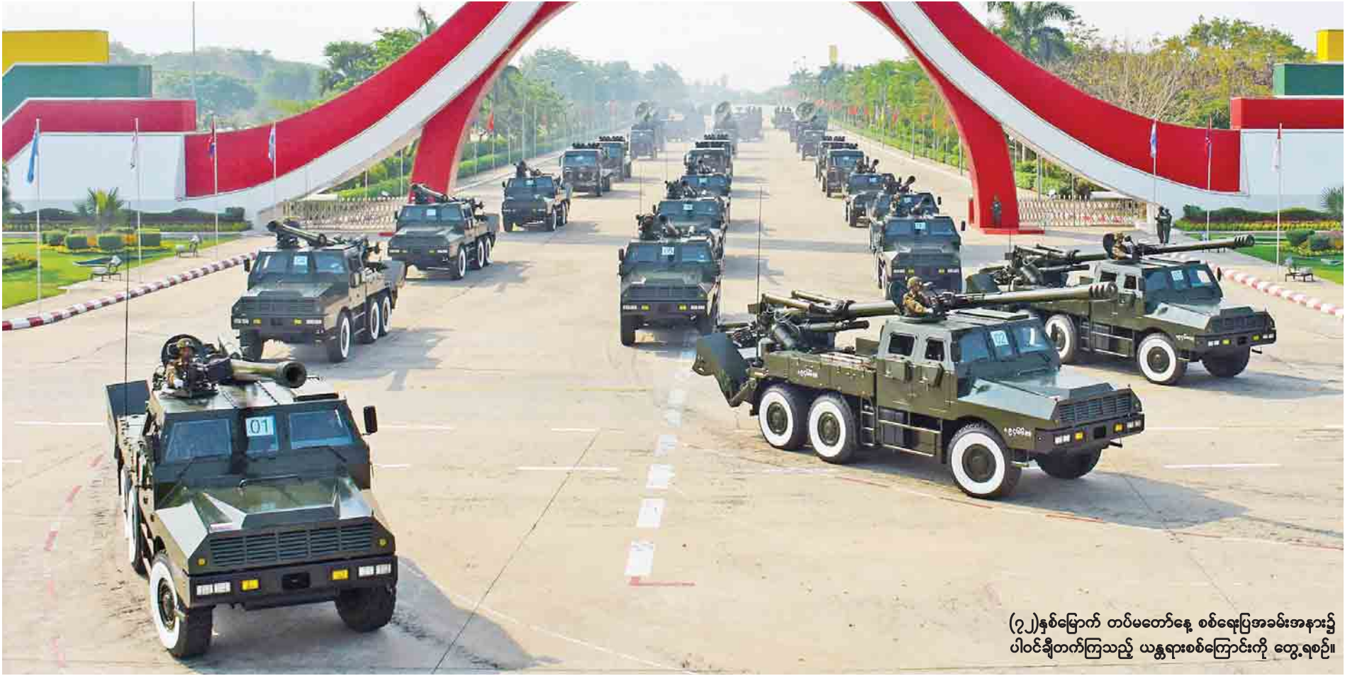
(၇၂)နှစ်မြောက် တပ်မတော်နေ့ စစ်ရေးပြအခမ်းအနား၌ ပါဝင်ချီတက်ကြသည့် ယန္တရားစစ်ကြောင်းကို တွေ့ရစဉ်။