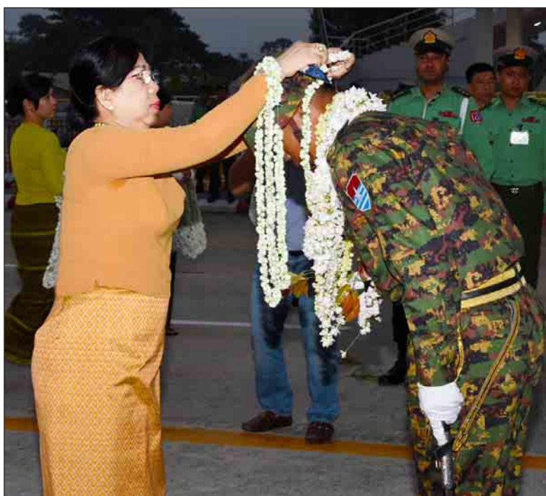
တပ်မတော်ကာကွယ်ရေးဦးစီးချုပ် ဗိုလ်ချုပ်မှူးကြီး မဟာသရေစည်သူ မင်းအောင်လှိုင်၏ဇနီး ဒေါ်ကြာကြာလှ ဂုဏ်ပြုပန်းကုံးစွပ်၍ ကြိုဆိုစဉ်။ (သတင်းစဉ်)