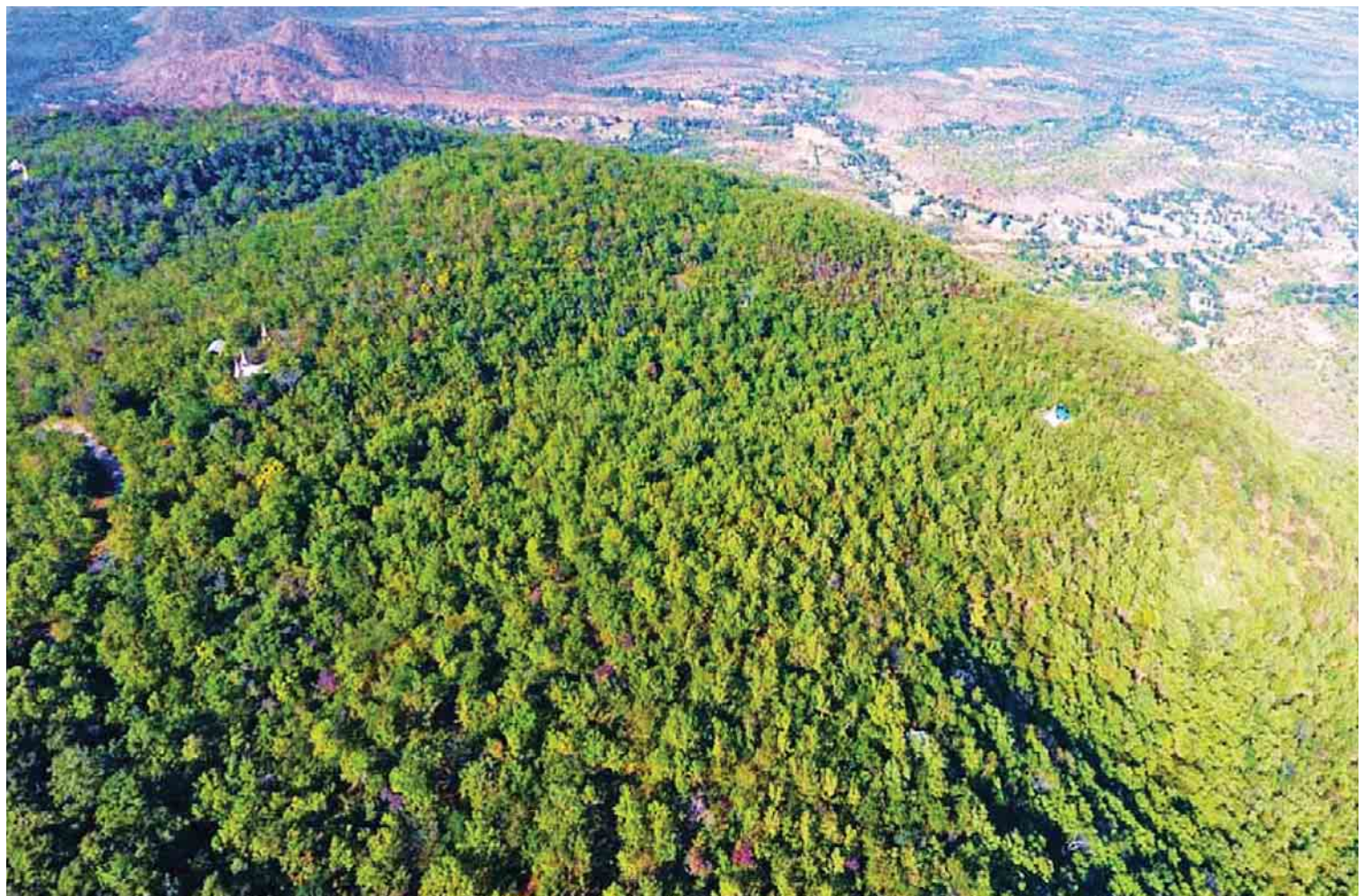
ရေစိုမြို့နယ်တွင် ၂၀၁၆-၂၀၁၇ ဘဏ္ဍာနှစ် သဘာဝတောကျန်များ ထိန်းသိမ်းကာကွယ်ခြင်းလုပ်ငန်း ဆောင်ရွက်ခဲ့သည့် ရှင်မတောင်၏ သဘာဝရှုခင်းကို ဝေဟင်မှမြင်တွေ့ရစဉ်။