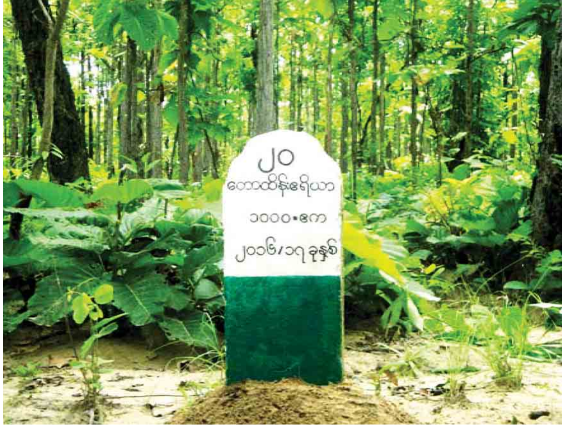
ရေဦးမြို့နယ်ရှိ သဘာဝတောကျန်များထိန်းသိမ်းကာကွယ်ရေး နယ်နိမိတ်မှတ်တိုင်ကို တွေ့ရစဉ်။

စစ်ကိုင်းတိုင်းဒေသကြီး၊ မကွေးတိုင်း ဒေသကြီးနဲ့ မန္တလေးတိုင်းဒေသကြီးတို့မှာ ကျောက်မီးသွေးနဲ့ပတ်သက်ပြီး ဧကပေါင်း ၁၁၆၀၀၀ ကျော် ချန်ထားပါတယ်။ ထို့အတူ ဂရက်ဖိုက်ကိုလည်း မန္တလေးတိုင်းဒေသကြီးမှာ ဧကပေါင်း ၁၁၀၀၀ ကျော် ချန်ထားပါတယ်။ သံသတ္တုသိုက်ကိုလည်း ကချင်ပြည်နယ် ဖားကန့်မြို့နယ် ကသိုဏ်းဘုရားတောင်ဒေသ မှာ ဧကပေါင်း ၁၁၈၇၀၀ ကျော် အရန်သတ္တု သိုက်တွေအဖြစ် ချန်ထားခဲ့မှာဖြစ်ပါတယ်။ သတ္တုတွေတူးဖော်တဲ့နေရာမှာ ၂၀၁၆-