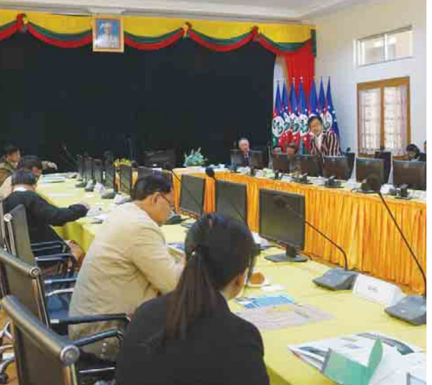
ပြည်နယ်(ပြန်/ဆက်)

ယင်းနောက် တက်ရောက်လာကြသူများက မိမိတို့သိရှိလိုသည်များကို မေးမြန်းကြရာ တာဝန်ရှိသူများက ပြန်လည်ရှင်းလင်းဖြေကြားခဲ့ကြောင်း သိရသည်။