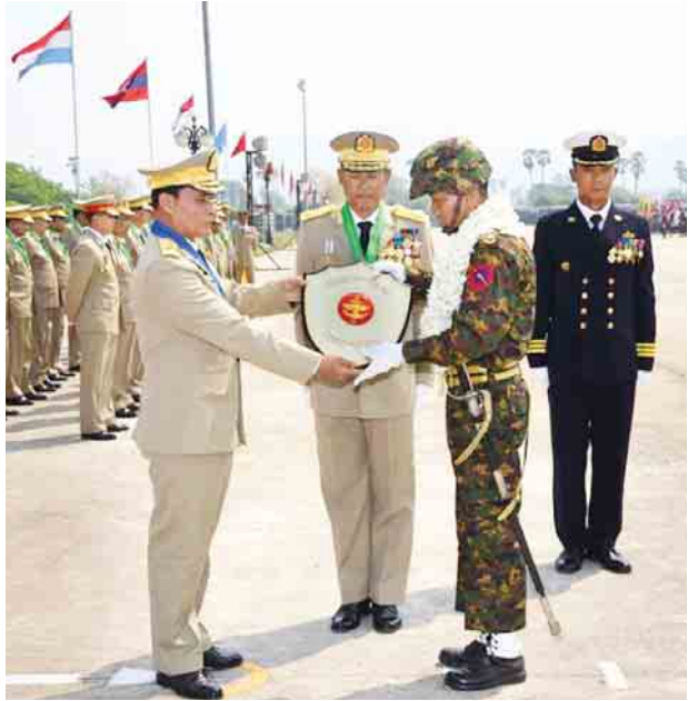
(၇၂)နှစ်မြောက် တပ်မတော်နေ့ စစ်ရေးပြအခမ်းအနားတွင်ဆုရရှိကြသော စစ်ရေးပြတပ်ခွဲများအား တာဝန်ရှိသူများက ဆုများပေးအပ်ချီးမြှင့်စဉ်။ (သတင်းစဉ်)