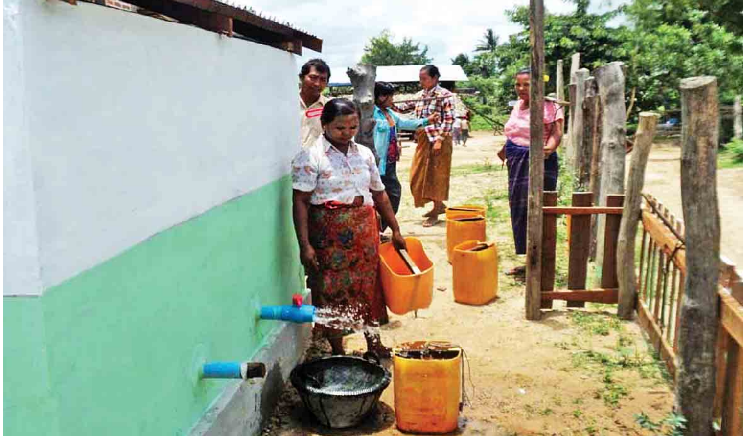
အပူပိုင်းဒေသစိမ်းလန်းစိုပြည်ရေးဦးစီးဌာနက တူးဖော်ပေးခဲ့သော မြေအောက်ရေ(အဝီစိတွင်း)မှ ရေအရည်အသွေး pH 6.9 ရှိသည့် သောက်သုံးရေရန်နေကြစဉ်။