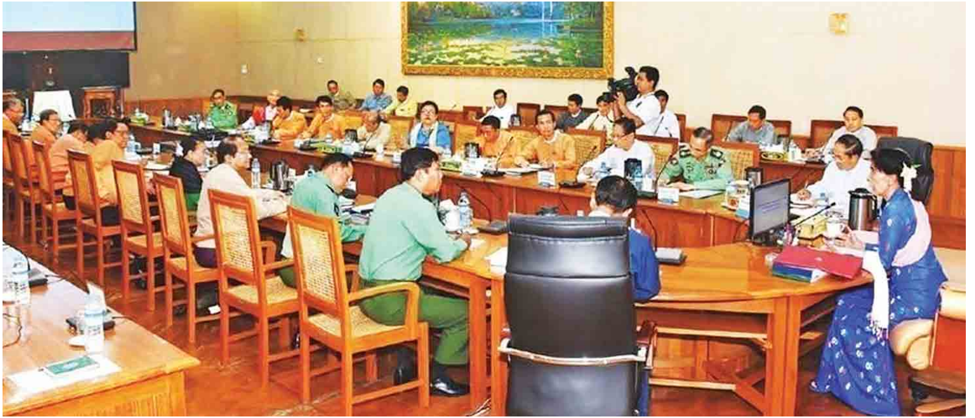
နိုင်ငံတော်၏အတိုင်ပင်ခံပုဂ္ဂိုလ် ဒေါ်အောင်ဆန်းစုကြည် နယ်စပ်ဒေသနှင့် တိုင်းရင်းသားလူမျိုးများ၏ ဖွံ့ဖြိုးတိုးတက်မှုအကောင်အထည်ဖော်ရေးပဟိုက်ကော်မတီ လုပ်ငန်းညှိနှိုင်းအစည်းအဝေး၌ အမှာစကားပြောကြားစဉ်။