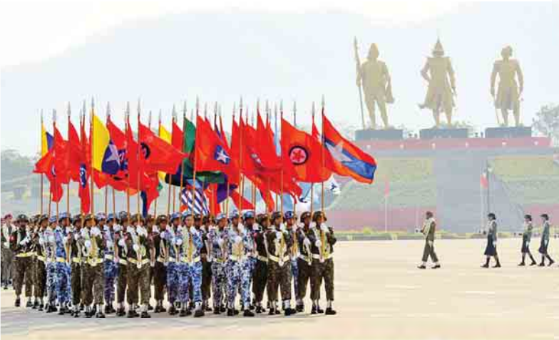
(၇၂)နှစ်မြောက် တပ်မတော်နေ့ စစ်ရေးပြအခမ်းအနား၌ စစ်ရေးပြစစ်ကြောင်းကြီးများ၊ အထူးတာဝန်တပ်ဖွဲ့ (အမျိုးသမီး)ကိုယ်စားပြု စစ်ရေးပြတပ်စု၊ ယန္တရားတပ်ဖွဲ့များ၊ တပ်မတော် (ကြည်း၊ ရေ၊ လေ)စစ်သည်များ ပါဝင်ချီတက်ကြစဉ်။