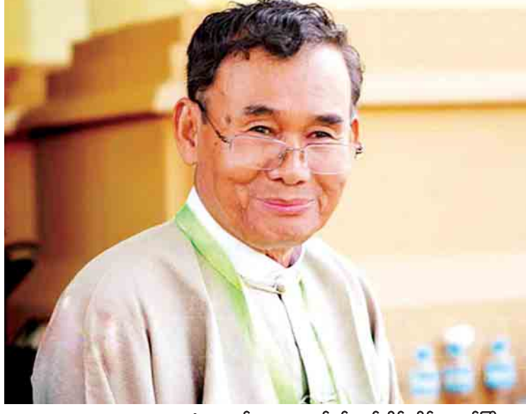
သယံဇာတနှင့် သဘာဝပတ်ဝန်းကျင်ထိန်းသိမ်းရေးဝန်ကြီးဌာန ပြည်ထောင်စုဝန်ကြီး ဦးအုန်းဝင်း။

ရာသီဥတုပြောင်းလဲမှု လျော့ပါးစေရေး၊ သဲကန္တာရဖြစ်ထွန်းမှု တိုက်ဖျက်ရေး၊ ဇီဝမျိုးစုံမျိုးကွဲထိန်းသိမ်းရေး စသည့် သစ်တောထိန်းသိမ်းလုပ်ငန်းများကို သယံဇာတနှင့် သဘာဝပတ်ဝန်းကျင်ထိန်းသိမ်းရေးဝန်ကြီးဌာနက အလေးထားဆောင်ရွက်လျက်ရှိပါသည်။ ထိုသို့ သဘာဝပတ်ဝန်းကျင်ထိန်းသိမ်းရေးနှင့် သစ်တောသယံဇာတများပျက်စီး ဆုံးရှုံးမှု လျော့နည်းစေရေး အဘက်ဘက်မှ ကြိုးပမ်းဆောင်ရွက်လျက်ရှိသည့် သယံဇာတနှင့် သဘာဝပတ်ဝန်းကျင်ထိန်းသိမ်းရေးဝန်ကြီးဌာနမှ ပြည်ထောင်စုဝန်ကြီးနှင့် သက်ဆိုင်ရာကဏ္ဍအလိုက် တာဝန်ယူဆောင်ရွက်လျက်ရှိသည့် ဌာနဆိုင်ရာအကြီးအကဲများအား တွေ့ဆုံမေးမြန်းထားပါသည်။