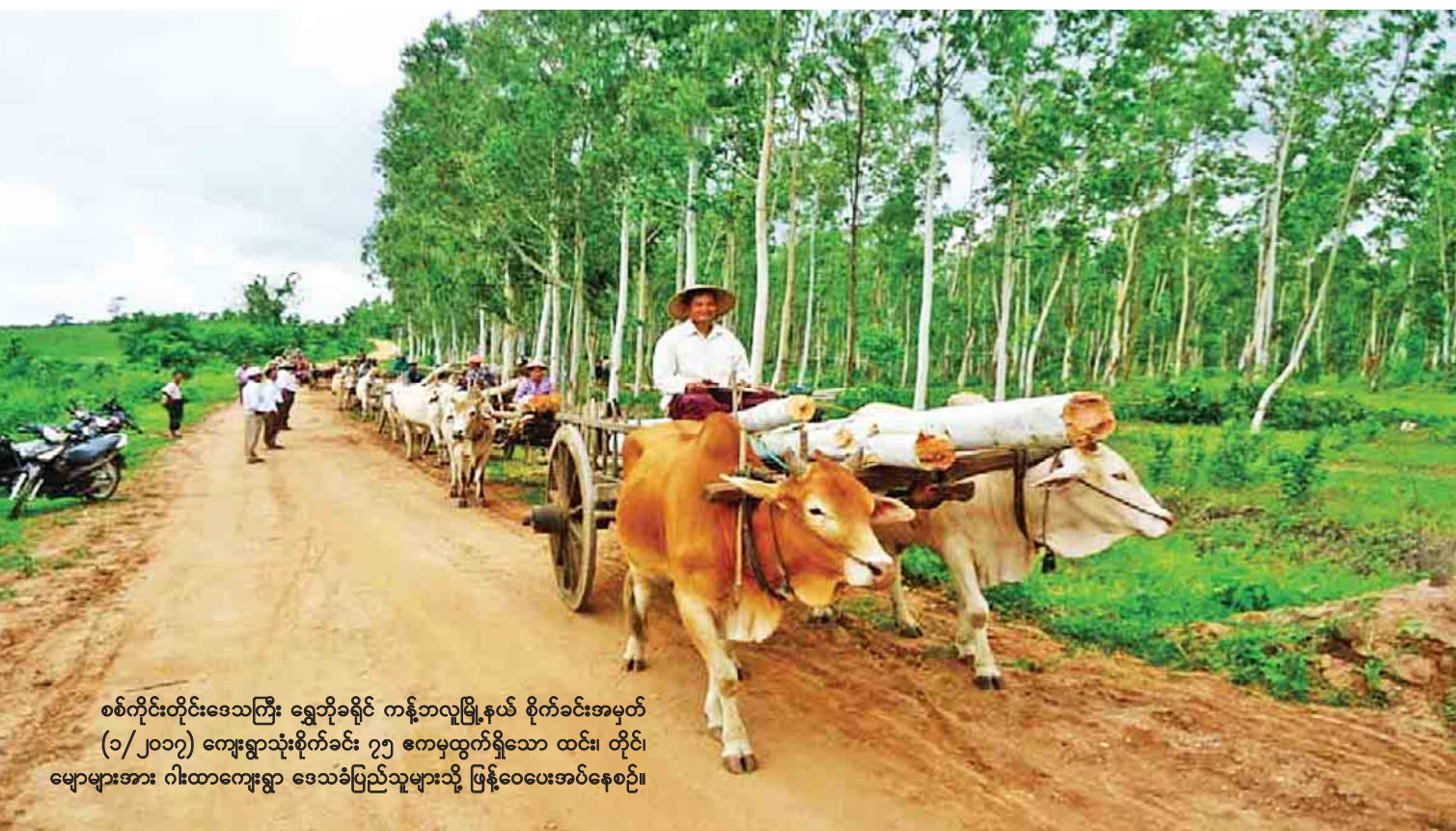
စစ်ကိုင်းတိုင်းဒေသကြီး ရွှေဘိုခရိုင် ကန့်ဘလူမြို့နယ် စိုက်ခင်းအမှတ် (၁/၂၀၁၇) ကေးရွာသုံးစိုက်ခင်း ၇၅ ဧကမှထွက်ရှိသော ထင်း၊ တိုင်၊ မျောများအား ဂါးတာကျေးရွာ ဒေသခံပြည်သူများသို့ ပြန်ဝေပေးအပ်နေစဉ်။

မေး။ ။ ဓာတ်သတ္တုနဲ့ ကျောက်မျက်ရတနာ တူးဖော်မှုလုပ်ငန်းတွေကြောင့် သဘာဝပတ်ဝန်းကျင်ထိခိုက်မှု လျော့ချနိုင်စေရေးဆောင်ရွက်ထားရှိမှုတွေကို သိပါရစေ။ ဖြေ။ ။ သတ္တုတူးဖော်နေတဲ့ လုပ်ကွက်တွေကို သဘာဝပတ်ဝန်းကျင်စီမံခန့်ခွဲမှုအစီအစဉ် (Environmental Management Plan-EMP) ရေးဆွဲစေပြီး EMP အတိုင်း လိုက်နာဆောင်ရွက်စေလျက်ရှိပါတယ်။ ပြန်လည်အပ်နှံတဲ့ လုပ်ကွက်တွေမှာလည်း တူးဖော်ပြီး အထူးကဏ္ဍ (၉) သို့ >>>