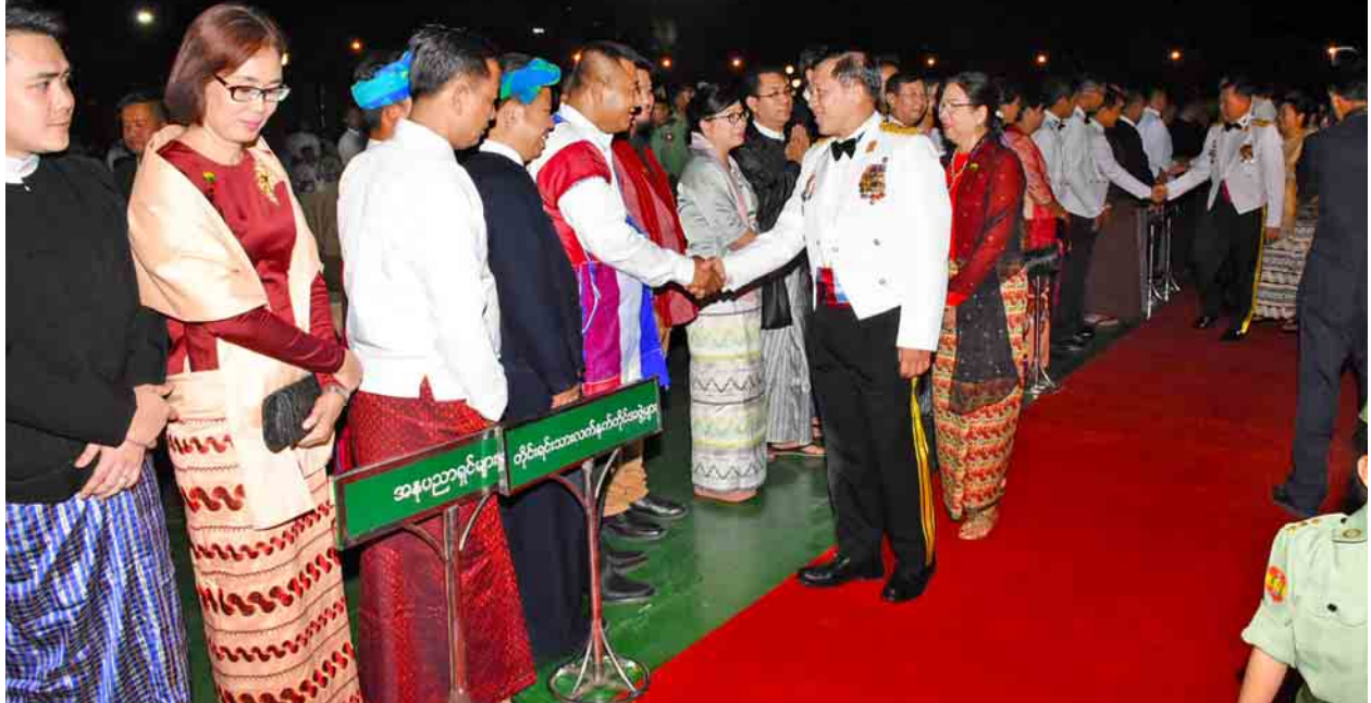
တပ်မတော်ကာကွယ်ရေးဦးစီးချုပ် ဗိုလ်ချုပ်မှူးကြီး မဟာသရေစည်သူ မင်းအောင်လှိုင် (၇၂)နှစ်မြောက် တပ်မတော်နေ့အထိမ်းအမှတ် ဂုဏ်ပြုညစားပွဲသို့ တက်ရောက်လာသူများအား ရင်းရင်းနှီးနှီးနှုတ်ဆက်စဉ်။ (သတင်းစဉ်)

ညပိုင်းတွင် (၇၂)နှစ်မြောက် တပ်မတော်နေ့ အခမ်းအနားသို့ တက်ရောက်လာကြသည့် ဧည့်သည်တော်များအား တပ်မတော်ကာကွယ်ရေး ဦးစီးချုပ် ဗိုလ်ချုပ်မှူးကြီး မဟာသရေစည်သူ မင်းအောင်လှိုင်နှင့် ဇနီး ဒေါ်ကြူကြူလှတို့က နေပြည်တော်ရှိ ဇေယျာသီရိဗိမာန် ဥပစာရင်ပြင်၌ ဂုဏ်ပြုညစားပွဲဖြင့် တည့်ခင်းဧည့်ခံသည်။ (သတင်းစဉ်)