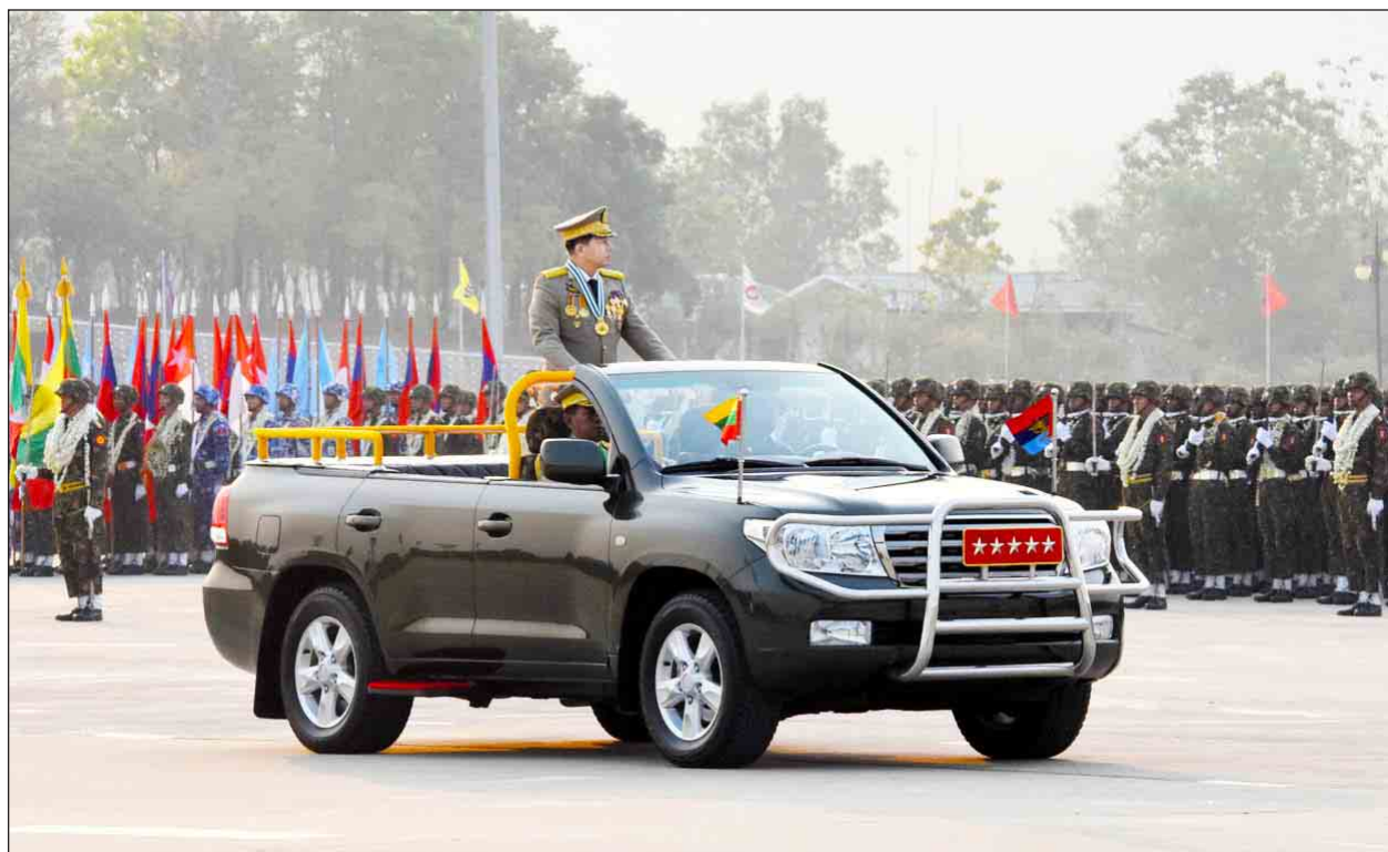
တပ်မတော်ကာကွယ်ရေးဦးစီးချုပ် ဗိုလ်ချုပ်မှူးကြီး မဟာသရေစည်သူ မင်းအောင်လှိုင် စစ်ကြောင်းကြီးများကို စစ်ဆေးနေစဉ်။ (သတင်းစဉ်)