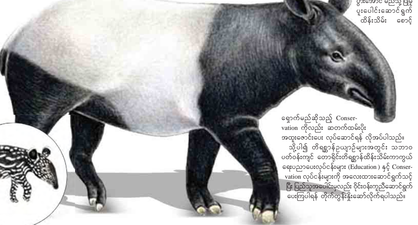
ရောက်မည်ဆိုသည့် Conservation ကိုလည်း ဆက်လက်ထိန်းသိမ်းပိုး အထူးစောင့်ပေး လုပ်ဆောင်ရန် လိုအပ်ပါသည်။ သို့ပါ၍ တိရစ္ဆာန်ဥယျာဉ်များအတွင်း သဘာဝ ပတ်ဝန်းကျင် တောရိုင်းတိရစ္ဆာန်ထိန်းသိမ်းကာကွယ် ရေးပညာပေးလုပ်ငန်းများ (Education) နှင့် Conservation လုပ်ငန်းများကို အလေးထားဆောင်ရွက်သင့် ပြီး ပြည်သူအပေါင်းမှလည်း ပိုင်းဝန်းကျင်ဆောင်ရွက် ပေးကြပါရန် တိုက်တွန်းနှိုးဆော်လိုက်ရပါသည်။