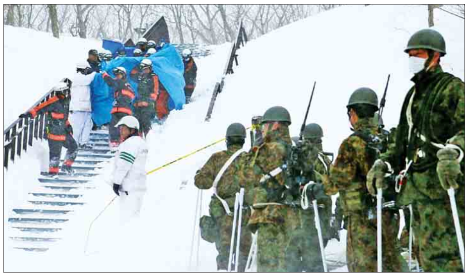
တစ်နေရာတွင် အထက်တန်းကျောင်းပေါင်း ခုနစ်ကျောင်းမှ ဖြစ်ပွားခဲ့သည်ဟု ယူဆရသည်။

ဂျပန်နိုင်ငံမြို့တော် တိုကျိုမြို့၏ မြောက်ဘက် ကိုလိုမီတာ ၁၂၀ အကွာရှိ တိုချိုဂီရင်စုမှ တောင်စောင်း