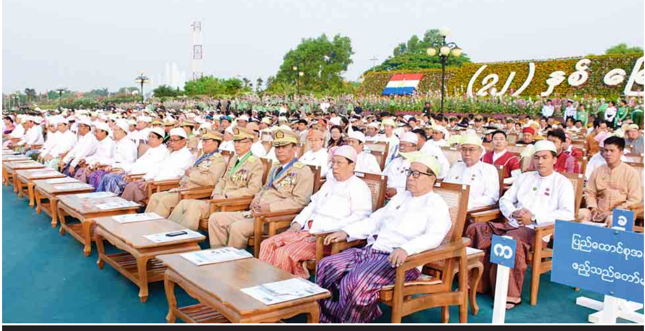
(၇၂)နှစ်မြောက် တပ်မတော်နေ့စစ်ရေးပြအခမ်းအနားသို့ တက်ရောက်လာကြသူများကို တွေ့ရစဉ်။