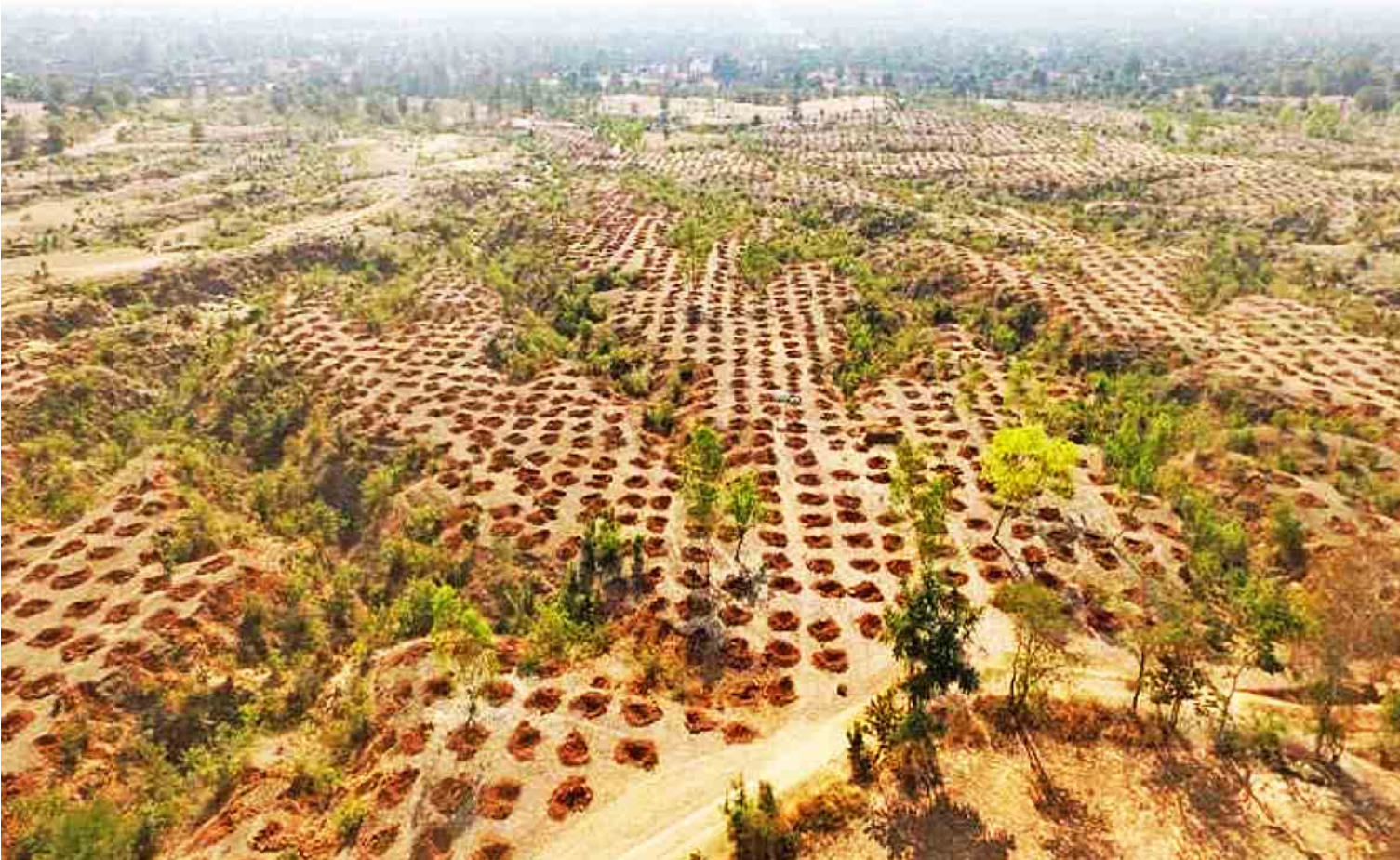
ကျောက်ပန်းတောင်းမြို့နယ် စိုက်ခင်းအမှတ် (၁/၂၀၁၇) ကျေးရွာသုံးစိုက်ခင်း ဧက ၇၀ ၏ ကျင်းတူးခြင်းလုပ်ငန်းဆောင်ရွက်ထားရှိမှုကို တွေ့ရစဉ်။

၂၀၁၇ အစိုးရသစ်လက်ထက်ကစပြီးတော့ EMP လို့ခေါ်တဲ့ Enviromental Management Plan ကို ရေးဆွဲထားပါတယ်။ ရေးဆွဲပြီး အတည်ပြုပြီးကမှ ဆက်လက် သတ္တုတူးဖော် ခွင့်ပေးတာဖြစ်ပါတယ်။ အဲဒီလိုမဟုတ်ရင် တူးဖော်ခွင့်ကို ရပ်ထားပါတယ်။ တူးဖော်တာ ကိုလည်း အကန့်အသတ်နဲ့ ခိုင်းနေပါတယ်။ ၂၀၁၆ ခုနှစ် မတ် ၁ ရက်ကစပြီး အကန့် အသတ်နဲ့ တူးဖော်ဖို့ဆုံးဖြတ်ပြီးတော့ ၂၀၁၆ ခုနှစ် ဧပြီ ၁ ရက်ကစပြီးတော့ လုံးဝနောက်ထပ် သတ္တုထွက်အသစ်ပေးခြင်းမလုပ်ဖို့ တားမြစ် ထားပါတယ်။ ဒါဟာလည်း အနာဂတ်မှာရှိ မယ့် ပြည်သူ့ပြည်သားများအတွက် ဖြစ်ပါ တယ်။