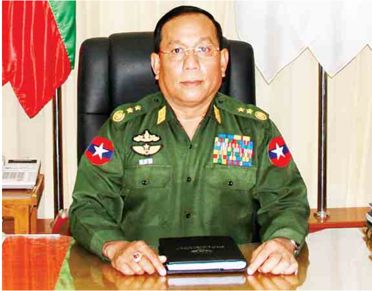
နယ်စပ်ရေးရာဝန်ကြီးဌာန ပြည်ထောင်စုဝန်ကြီး ဒုတိယဗိုလ်ချုပ်ကြီးရဲအောင်။

ထိုအတူ နယ်စပ်ဒေသဖွံ့ဖြိုးရေးလုပ်ငန်းများ ပိုမိုထိရောက်စွာ အကောင်အထည်ဖော်နိုင်ရေးအတွက် နယ်စပ်ဒေသနှင့် တိုင်းရင်း