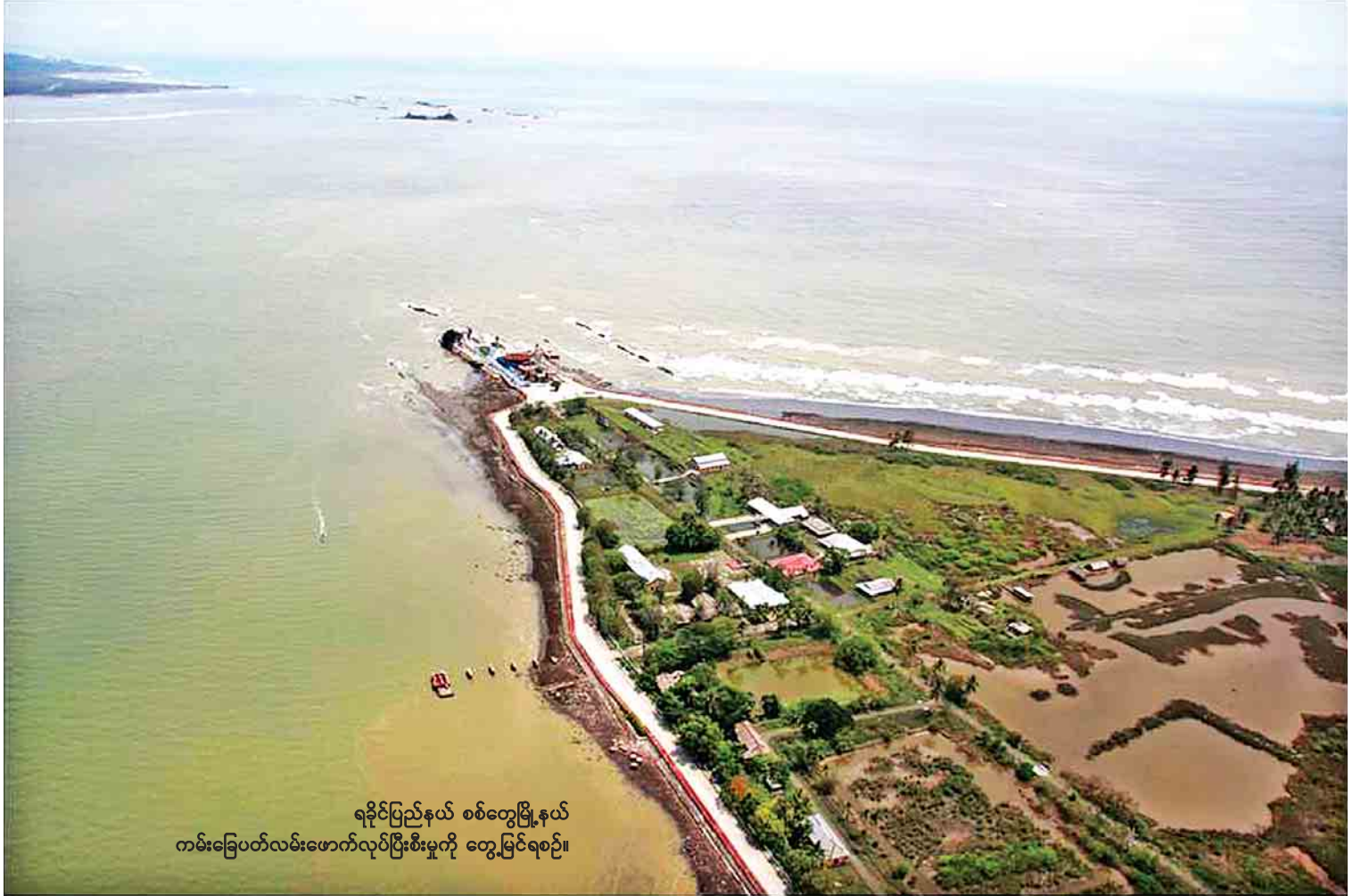
ရခိုင်ပြည်နယ် စစ်တွေမြို့နယ် ကမ်းခြေပတ်လမ်းဖောက်လုပ်ပြီးစီးမှုကို တွေ့မြင်ရစဉ်။