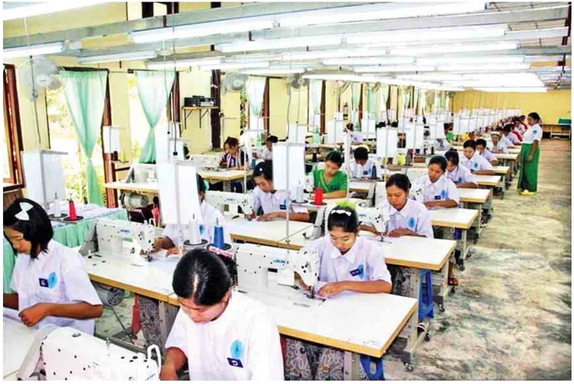
နယ်စပ်ဒေသရှိ တိုင်းရင်းသားများအတွက် အလုပ်အကိုင်အခွင့်အလမ်းရရှိစေရန် ခေတ်မီမော်တာစက်ချုပ်သင်တန်းကို ဖွင့်လှစ်သင်ကြားပေးနေစဉ်။

ဝေးလံခေါင်ဖျားသော နယ်စပ်ဒေသရှိ ဆင်းရဲနွမ်းပါးသော တိုင်းရင်းသားများ၊ တိုင်းရင်းသားလက်နက်ကိုင် အဖွဲ့အစည်းများ နှင့် IDPs များအတွက် လူသားချင်းစာနာသော