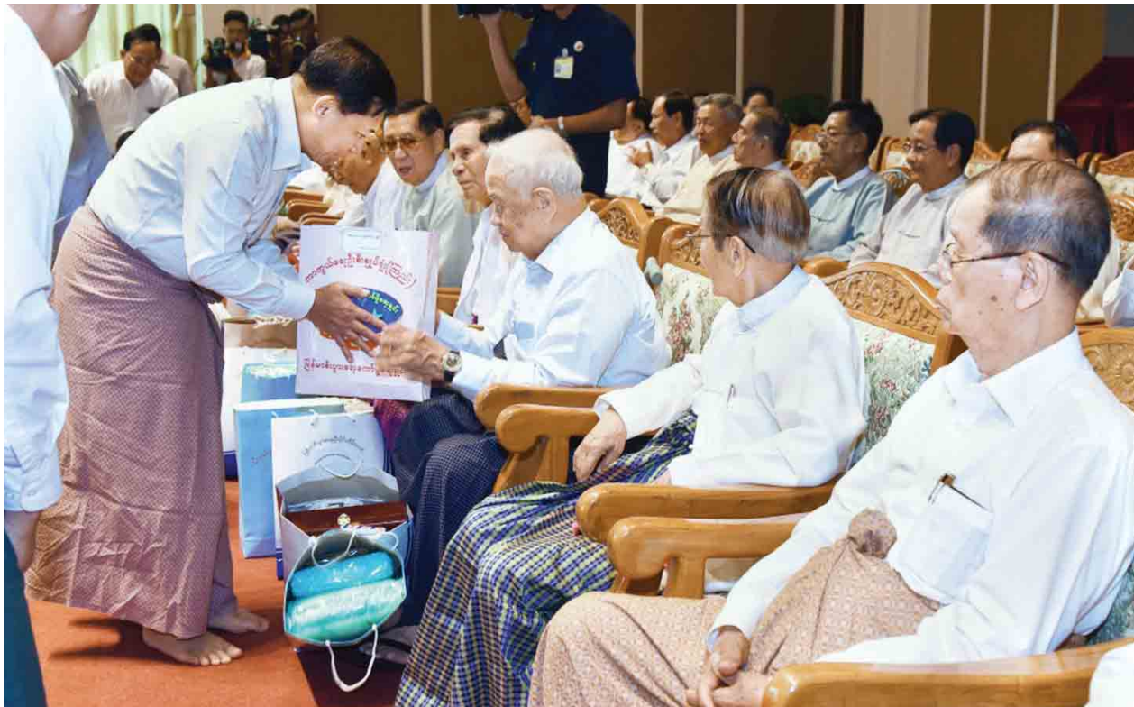
(၇၂)နှစ်မြောက် တပ်မတော်နေ့အခမ်းအနားသို့တက်ရောက်လာကြသည့် အငြိမ်းစားတပ်မတော်အရာရှိကြီးများအား တပ်မတော်ကာကွယ်ရေးဦးစီးချုပ် ဗိုလ်ချုပ်မှူးကြီး မဟာသရေစည်သူ မင်းအောင်လှိုင် လက်ဆောင်ပစ္စည်းများပေးအပ်စဉ်။ (သတင်းစဉ်)

စစ်ရေးပြအခမ်းအနားတွင် စစ်ရေးပြစစ်ကြောင်းကြီးများကို တပ်မတော် ကာကွယ်ရေးဦးစီးချုပ်က မော်တော်ယာဉ်ဖြင့်စစ်ဆေးခြင်း၊ မိန့်ခွန်းနာခံပြီး နောက် တပ်မတော်ကာကွယ်ရေးဦးစီးချုပ်အား စစ်ရေးပြမှုကြီး ဦးဆောင် သည့် စစ်ရေးပြစစ်ကြောင်းကြီးများနှင့် ယန္တရားစစ်ကြောင်းများက အစီအစဉ်အတိုင်း စစ်ကြောင်းပုံဖြင့် ချီတက်အလေးပြုခြင်း၊ တစ်ချိန်တည်းတွင်