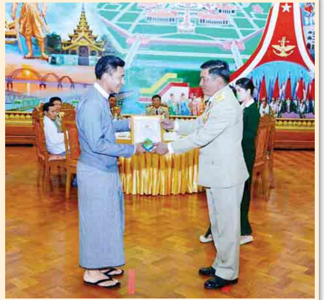
(၇၂)နှစ်မြောက် တစ်မတော်နေ့ ဂုဏ်ပြုဖော်လမ်းဖြစ်သည့် ပြည်ထောင်စုသမ္မတမြန်မာနိုင်ငံတော်တွင် ပါဝင်သရုပ်ဆောင်ခဲ့ကြသည့် အနုပညာရှင်များနှင့် စစ်ချီတေး၊ စစ်သည်တေးသီချင်း၊ ကဗျာနှင့် ဝတ္ထုစာမူဆုရရှိသူ စာပေပညာရှင်များအား တာဝန်ရှိသူများက ဂုဏ်ပြုဆုနှင့် ဂုဏ်ပြုမှတ်တမ်းလွှာများ ပေးအပ်ကြစဉ်။ (သတင်းစဉ်)