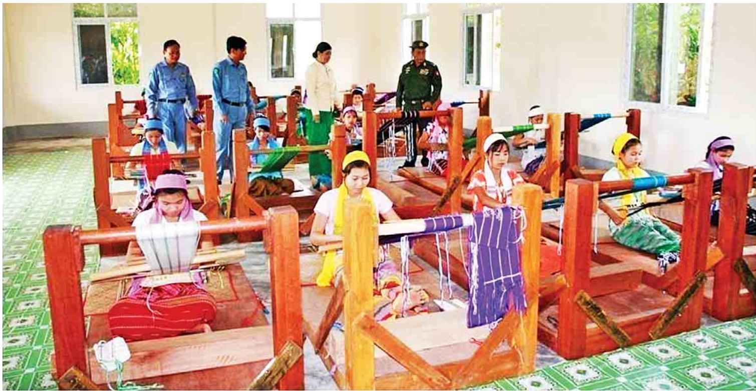
နယ်စပ်ရေးရာဝန်ကြီးဌာန ပြည်ထောင်စုဝန်ကြီး ဒုတိယဗိုလ်ချုပ်ကြီးရဲအောင် နယ်စပ်ဒေသရှိ တိုင်းရင်းသူလေးများအား အိမ်တွင်းမှု(လုပ်ခွက်)အတတ်ပညာရပ်များ လေ့ကျင့်သင်ကြားပေးနေမှုကို ကြည့်ရှုအားပေးစဉ်။