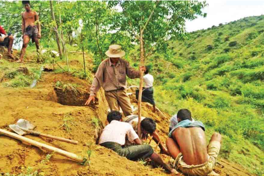
ချောက်မြို့နယ်တွင် ၂၀၁၆ ခုနှစ် မိုးရာသီက ကွက်လပ်ဖြည့်တမာပျိုးပင်ကြီး ၆၀၀ စိုက်ပျိုးနေမှုကို တွေ့ရစဉ်။

ဖြေ။ ။ တစ်နိုင်လုံးမှာရှိတဲ့ သစ်တောတွေရဲ့ အခြေအနေကို ပြန်လည်ဆန်းစစ်ခြင်းနဲ့ စာရင်းကောက်ယူခြင်းလုပ်ငန်းဆောင်ရွက်ဖို့အတွက် ဖင်လန်နိုင်ငံအစိုးရရဲ့ ငွေကြေးထောက်ပံ့မှု၊ FAOရဲ့ နည်းပညာအကူအညီနဲ့ စီမံကိန်းတစ်ရပ်ရေးဆွဲ အကောင်အထည်ဖော်ဆောင်ရွက်နေပါတယ်။ အဲဒါကတော့ ရှေးပြေးစီမံကိန်းတစ်ရပ်အနေနဲ့ တိုင်းဒေသကြီးနဲ့ ပြည်နယ်ရှစ်ခုမှာရှိတဲ့ Pilot Sites ရှစ်နေရာ ရွေးချယ်ပြီးတော့ သစ်တောသယံဇာတစာရင်းကောက်ခြင်းကို ဆောင်ရွက်ခဲ့ပါတယ်။ နောက်တစ်ခုကတော့ တစ်နိုင်လုံးမှာ တရားမဝင်သစ်ခိုးထုတ်မှုတွေ လတ်တလောမှာ နေရာအနှံ့အပြားဖြစ်နေတဲ့အတွက် နိုင်ငံ