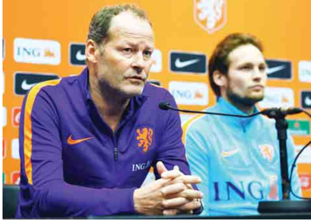
ထုတ်ပယ်ခံလိုက်ရသည့် နယ်သာလန်နည်းပြ ဒန်နီဘလိုင်း(ဝဲ) သားဖြစ်သူ ဒါလော့ဘလိုင်း(ယာ)တို့အား သတင်းစာရှင်းလင်းပွဲတွင် အတူတကွ တွေ့ရစဉ်။

နည်းပြ ဒန်နီဘလိုင်းသည် နယ်သာလန်လက်ရွေးစင်အသင်းကို နှစ်နှစ်တာ ကိုင်တွယ်ပြီးနောက် ဘူလ်ဂေးရီးယားအသင်းနှင့် ပွဲစဉ်အပြီးတွင် လက်ရှိ ရာထူးမှ ထုတ်ပယ်ခံလိုက်ရပြီဖြစ်သည်။ နယ်သာလန်အသင်းသည် လေးပွဲ ကစားပြီးချိန်အထိအုပ်စု(A)တွင် ဒုတိယနေရာ၌ ရပ်တည်ခဲ့သော်လည်း ဘူလ်ဂေးရီးယားအသင်းကို နှစ်ဂိုးပြတ်ဖြင့် အရေးနိမ့်ပြီးနောက် ဦးဆောင်သူ ပြင်သစ်အသင်းအောက်ခြောက်မှတ်၊ ဒုတိယနေရာရှိ ဆွီဒင်အသင်းအောက် သုံးမှတ်အကွာ စတုတ္ထနေရာအထိ ရောက်ရှိသွားခဲ့သည်။ အသက်(၅၅)နှစ်အရွယ် ဒန်နီဘလိုင်းသည် နည်းပြ ဂူဟစ်ဒင့်လက်မှ ၂၀၁၅ ခုနှစ်တွင် လက်ရွေးစင်အသင်းကို ပြောင်းလဲတာန်ယူခဲ့ပြီးနောက် ယူရို ၂၀၁၆ ပြိုင်ပွဲကိုလည်း ခြေစစ်ပွဲအောင်မြင်အောင် စွမ်းဆောင်ပေးနိုင်ခြင်း မရှိခဲ့ပေ။ နယ်သာလန်ဘောလုံးအဖွဲ့ချုပ်က ၂၀၁၈ ကမ္ဘာ့ဖလားခြေစစ်ပွဲ အောင်ရန် ခက်ခဲသွားသည့်အခြေအနေကြောင့် ဘလိုင်းကို ထုတ်ပယ်ရန် ဆုံးဖြတ်လိုက်ခြင်းဖြစ်ကြောင်း ကြေညာခဲ့သည်။ မတ် ၂၈ ရက်(ယနေ့)တွင် ယှဉ်ပြိုင်မည့် အီတလီအသင်းနှင့် ပွဲစဉ်ကို ဖရက်ဂရင်းက ယာယီနည်းပြအဖြစ် တာဝန်ယူကိုင်တွယ်သွားမည်ဖြစ်သည်။