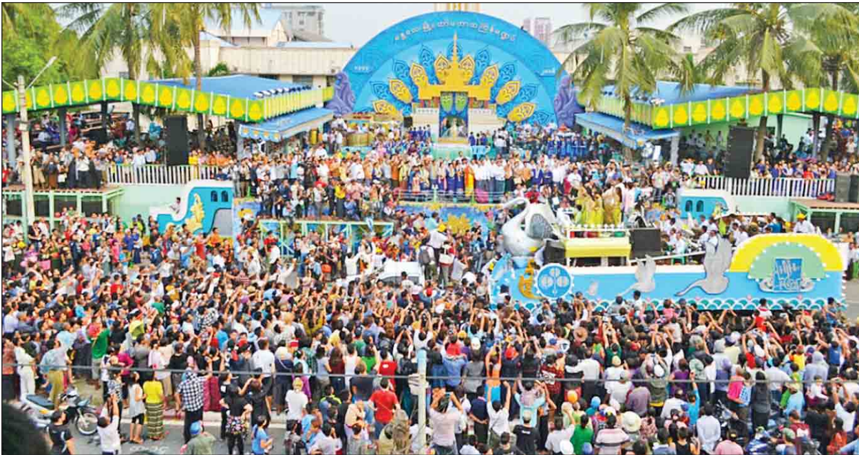
ယခင်နှစ်က မန္တလေးမြို့တော် မဟာသင်္ကြန်မဏ္ဍပ်နှင့် မြို့မအလှပြယာဉ်တို့အား တွဲဖက်ကာ တွေ့ရစဉ်။