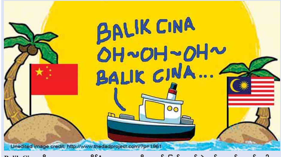
Balik Cina ဆိုတာက မလေးရှားနိုင်ငံရေးသမားတွေကို လှောင်ပြောင်သရော်တဲ့ အင်တာနက်စာမျက်နှာပါ။