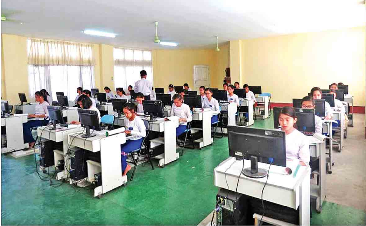
တိုင်းရင်းသားလူငယ်များ စွမ်းရည်ဖွံ့ဖြိုးရေးဒီဂရီကောလိပ်(စစ်ကိုင်း)၌ ယခုနှစ်မှစတင်၍ တိုင်းရင်းသူ ၅၃ ဦးကို ကွန်ပျူတာဘာသာရပ် စတင်သင်ကြားလေ့ကျင့်ပေးနေပြီဖြစ်သည်။

နယ်စပ်ဒေသကျေးလက်များအား သက် ဆိုင်ရာ နယ်စပ်ဒေသအသီးသီးမှ တိုင်းရင်း သားများကို တိုင်းရင်းသားအချင်းချင်း အထူးကဏ္ဍ (ဃ) သို့ >>>