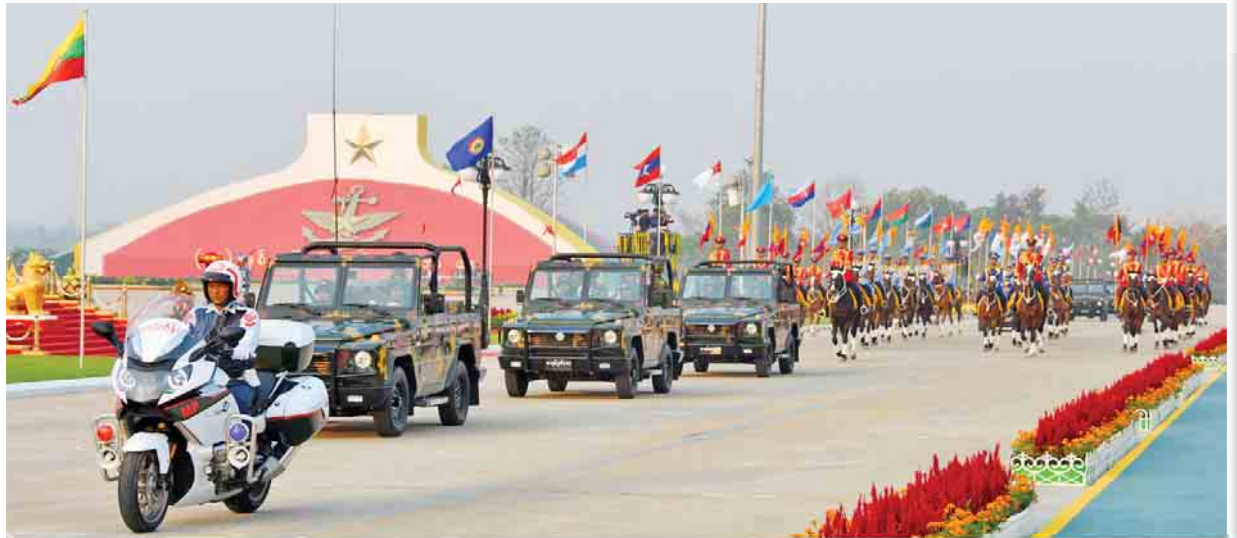
(၇၂)နှစ်မြောက် တပ်မတော်နေ့ စစ်ရေးပြအခမ်းအနားသို့ တပ်မတော်ကာကွယ်ရေးဦးစီးချုပ် ဗိုလ်ချုပ်မှူးကြီး မဟာသရေစည်သူ မင်းအောင်လှိုင် မြင်းစီးတပ်ဖွဲ့ ဖြစ်ပေါ်လာစဉ်။