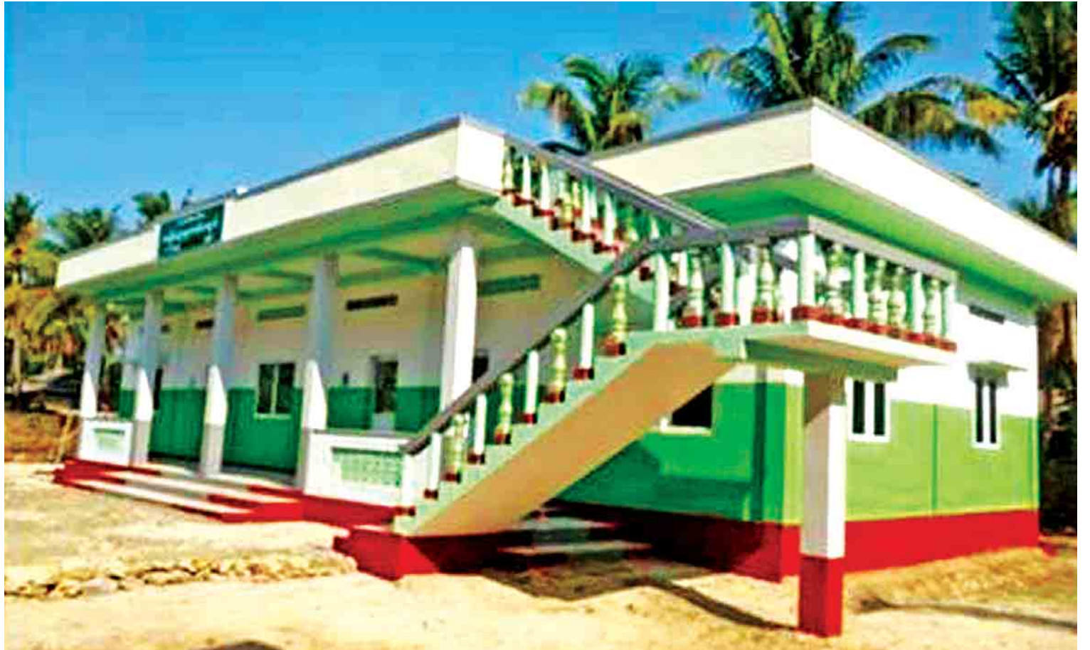
နိုင်ငံတော်အထောက်အပံ့ဖြင့် တည်ဆောက်ထားသည့် စာသင်ကျောင်း။

ရှိသည့် သင်တန်းသား ၁၂၀၀၀ ကျော်အတွက် စားသောက်နေထိုင်ရေးနှင့် သင်တန်းဆိုင်ရာ လိုအပ်ချက်များ၊ သင်တန်းအဆောက်အအုံနှင့် သင်ထောက်ကူပစ္စည်းများအတွက် ခွင့်ပြုရန်ပုံငွေကျပ် ၁၆ ဒသမ ၄၉၄ ဘီလီယံ ကျခံသုံးစွဲဆောင်ရွက်နိုင်ခဲ့ပါသည်။ သို့ဖြစ်ပါ၍ တစ်နှစ်တာကာလအတွင်းမှာ ဝန်ကြီးဌာနအနေဖြင့် စုစုပေါင်းခွင့်ပြုရန်ပုံငွေကျပ် ၈၄ ဒသမ ၇၅၆ ဘီလီယံသုံးစွဲပြီး အကောင်အထည်ဖော်ဆောင်ရွက်နိုင်ခဲ့ပါသည်။ မြန်မာပြည်(မြောက်ပိုင်း) ဝေးလံခေါင်ဖျားသော ပူတာအို-ခေါင်လန်ဖူးလမ်း ဖောက်လုပ်ခြင်း နယ်စပ်ဒေသ လမ်း တံတားလုပ်ငန်းများနှင့်ပတ်သက်၍ နယ်စပ်ရေးရာဝန်ကြီးဌာန၏ မျှော်မှန်းချက်မှာ ကျေးရွာတစ်ရွာနှင့်တစ်ရွာ၊ အထူးကဏ္ဍ (ဂ) သို့ >>>